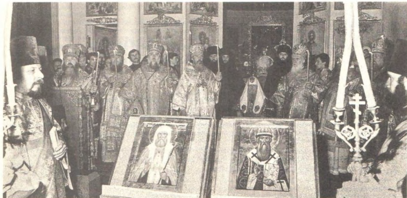
Чин прославления святителей Иова и Тихона, Патриархов Всероссийских, в Троицком соборе Свято-Данилова монастыря