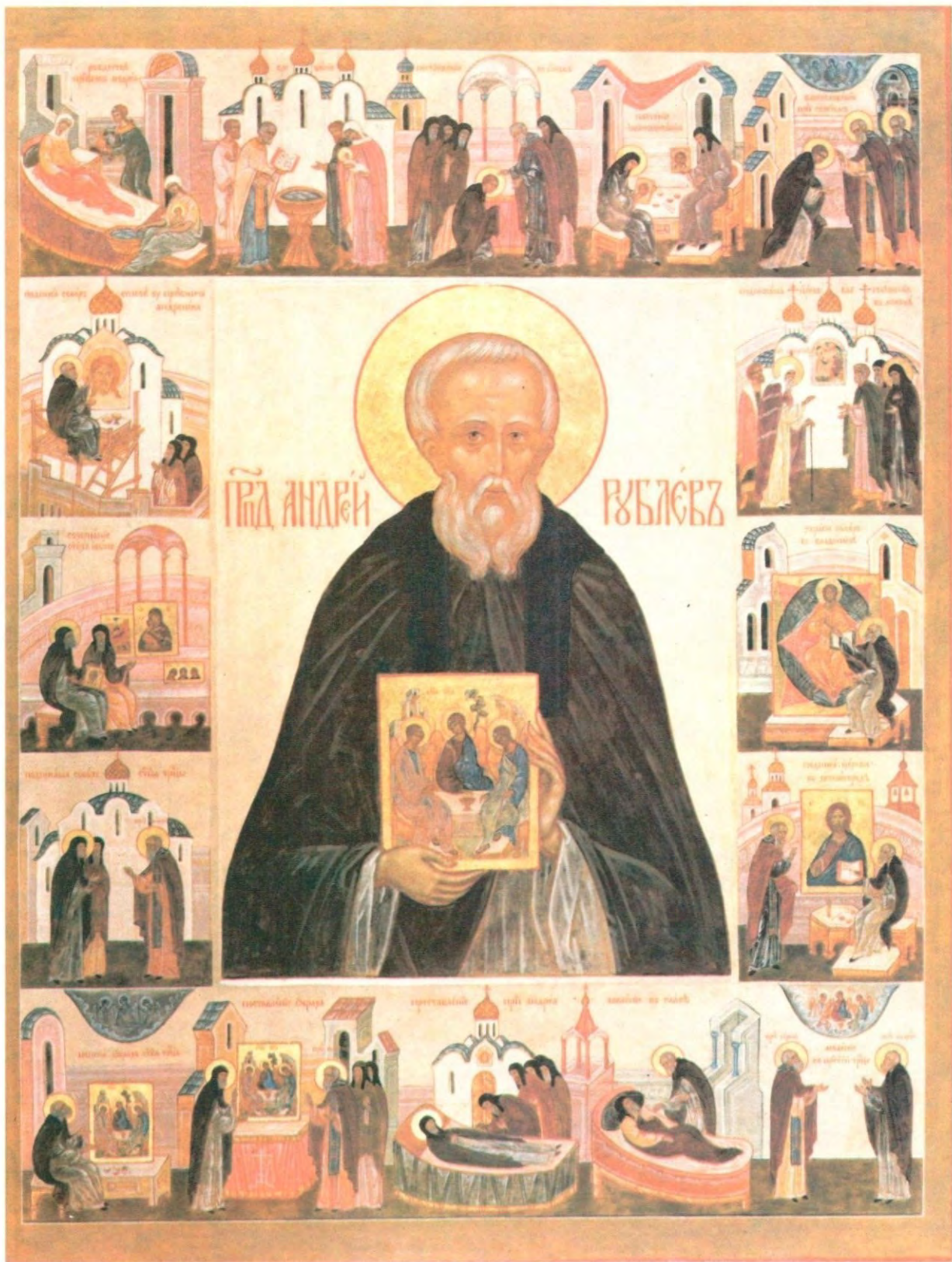
ПРЕПОДОБНЫЙ АНДРЕЙ РУБЛЕВ С ЖИТИЕМ