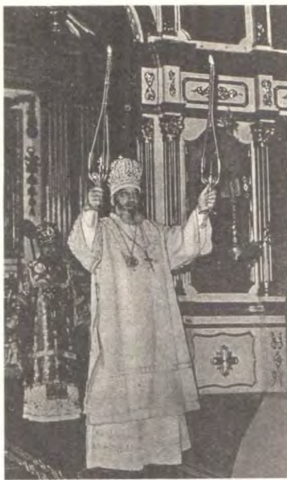
Служение архиепископа Варлаама в кафедральном соборе г. Луцка в день 60-летия со дня рождения 11 мая 1989 года

Юбилей архипастыря. 13 мая 1989 года исполнилось 60 лет со дня рождения архиепископа Вольнского и Ровенского Варлаама.