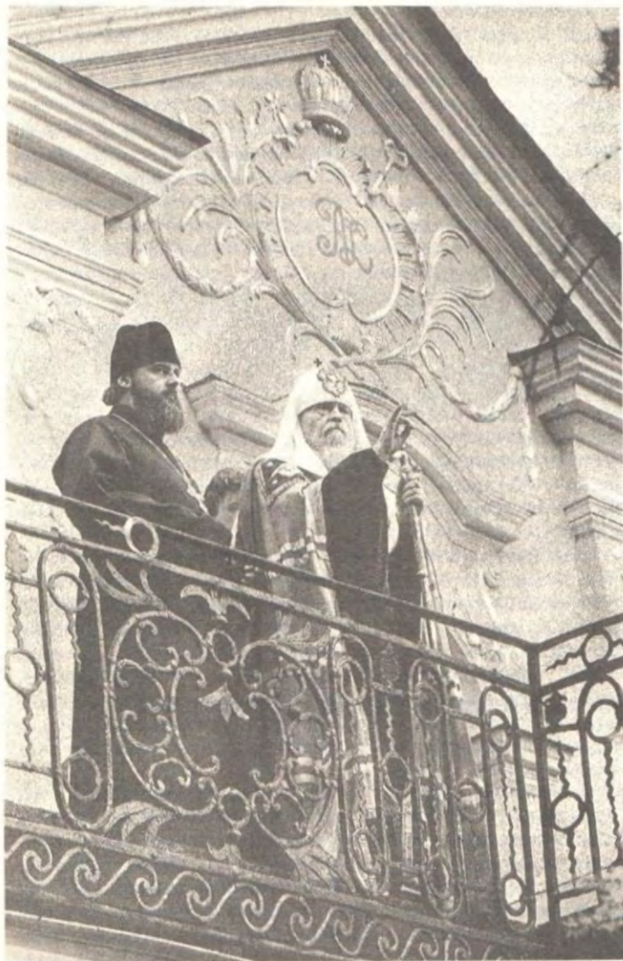
Святейший Патриарх Пимен благословляет паломников в день памяти Преподобного Сергия Радонежского. Троице-Сергиева Лавра, 8 октября 1989 года