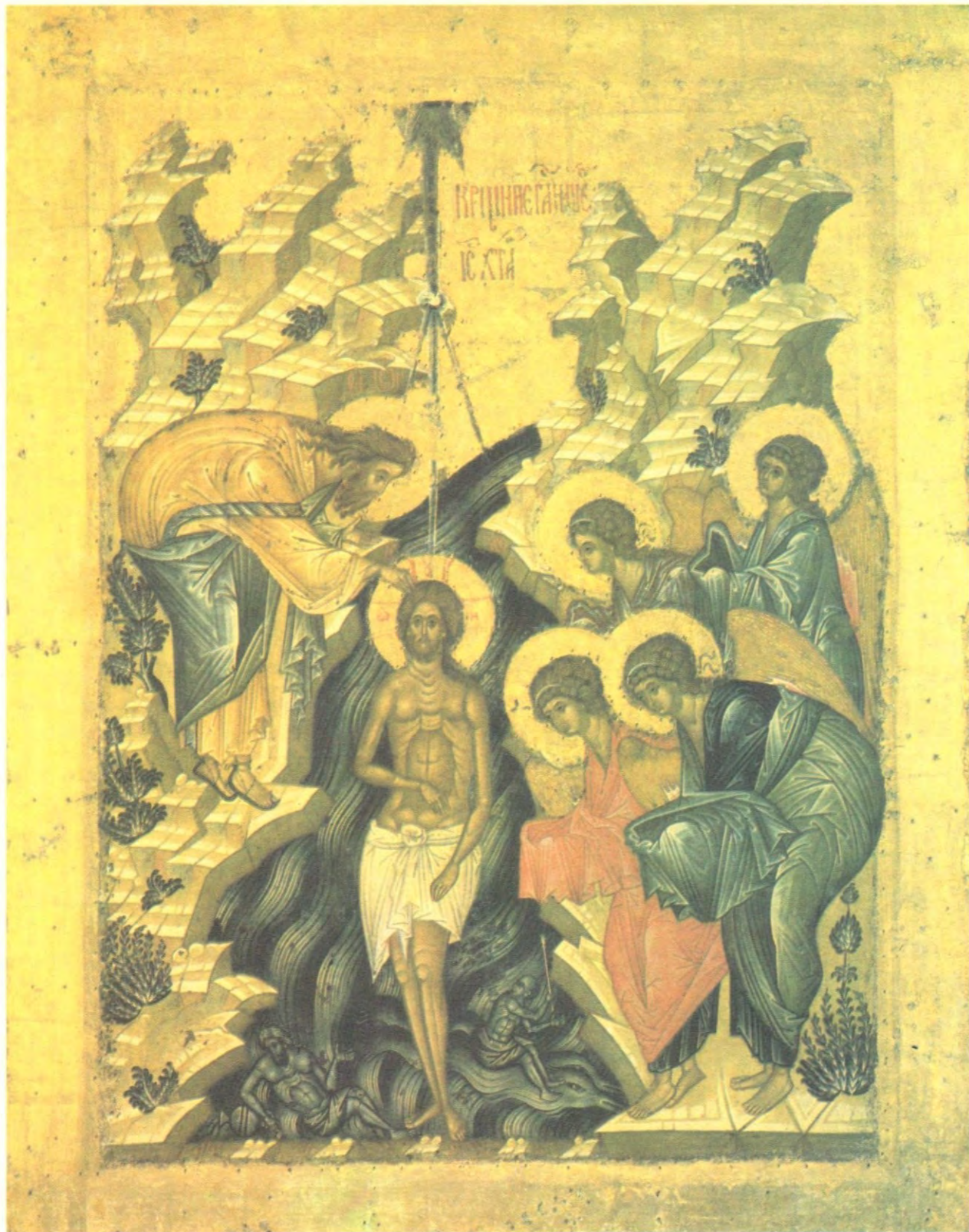
СВЯТОЕ БОГОЯВЛЕНИЕ. КРЕЩЕНИЕ ГОСПОДА БОГА И СПАСА НАШЕГО ИИСУСА ХРИСТА

Икона XV века из Кирилло-Белозерского монастыря