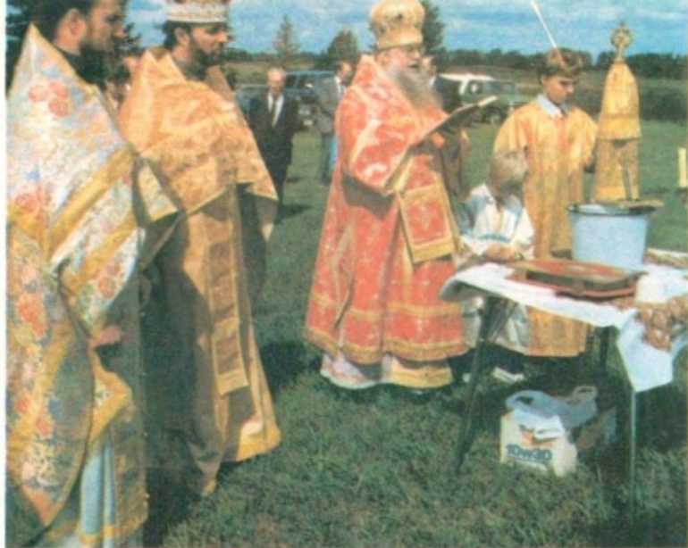
2 августа 1989 года, день памяти пророка Илии. Водосвятный молебен в приходе Пакан по случаю престольного праздника