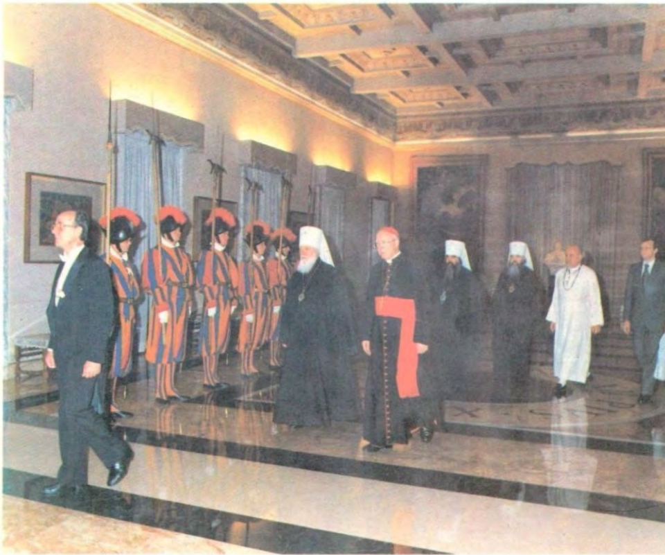
Торжественная встреча делегации Русской Православной Церкви в папской летней резиденции в Кастель Гандольфо