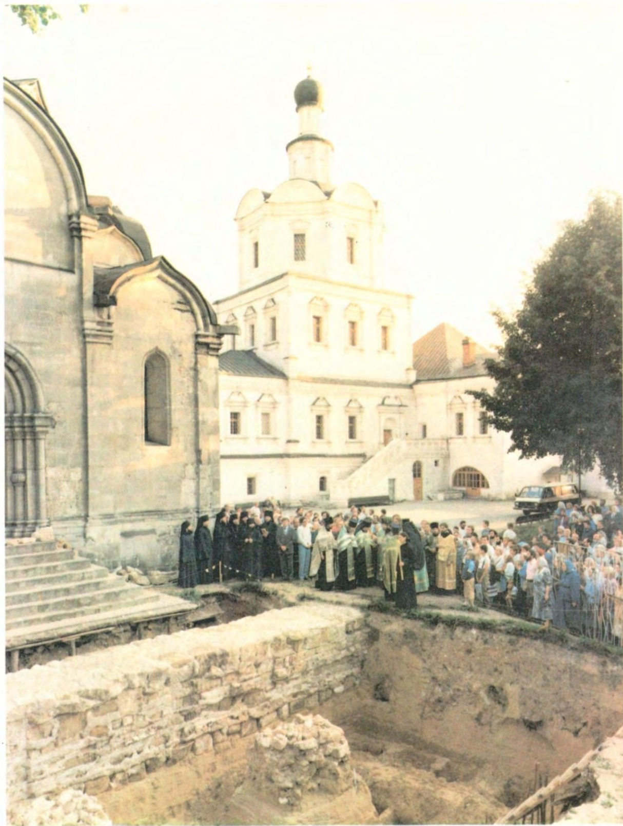
В Спасо-Андрониковом монастыре. Церковь Михаила Архангела. Раскоп братского некрополя монастыря