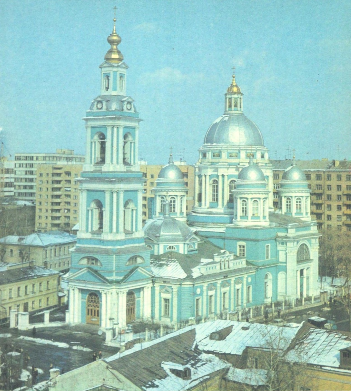
БОГОЯВЛЕНСКИЙ ПАТРИАРШИЙ СОБОР В МОСКВЕ