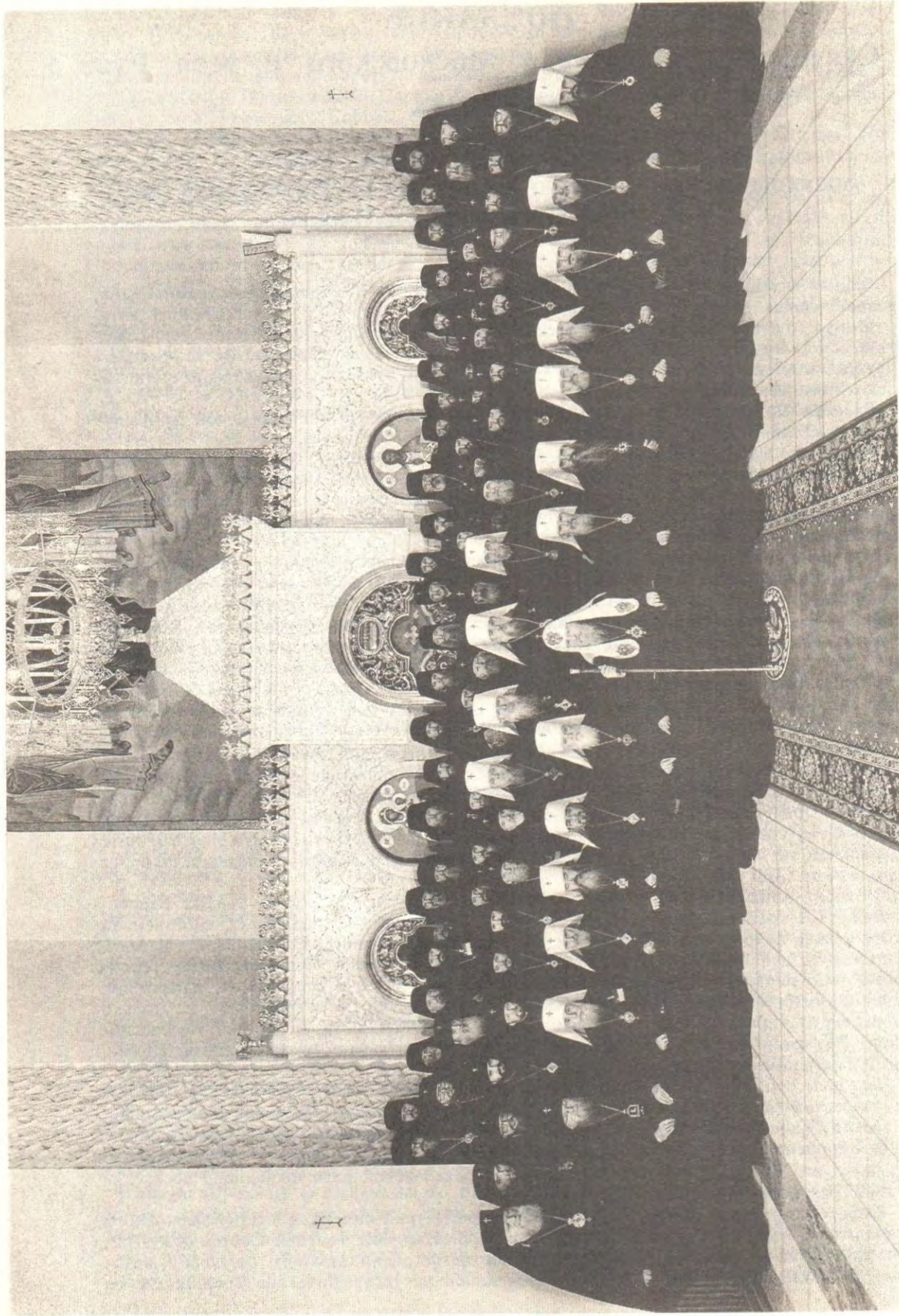
Члены Архиерейского Собора со Святейшим Патриархом Пименом; Крестовый храм во имя Всех святых, в земле Российской просиявших, в Патриаршей и Синодальной резиденции, Свято-Данилов монастырь