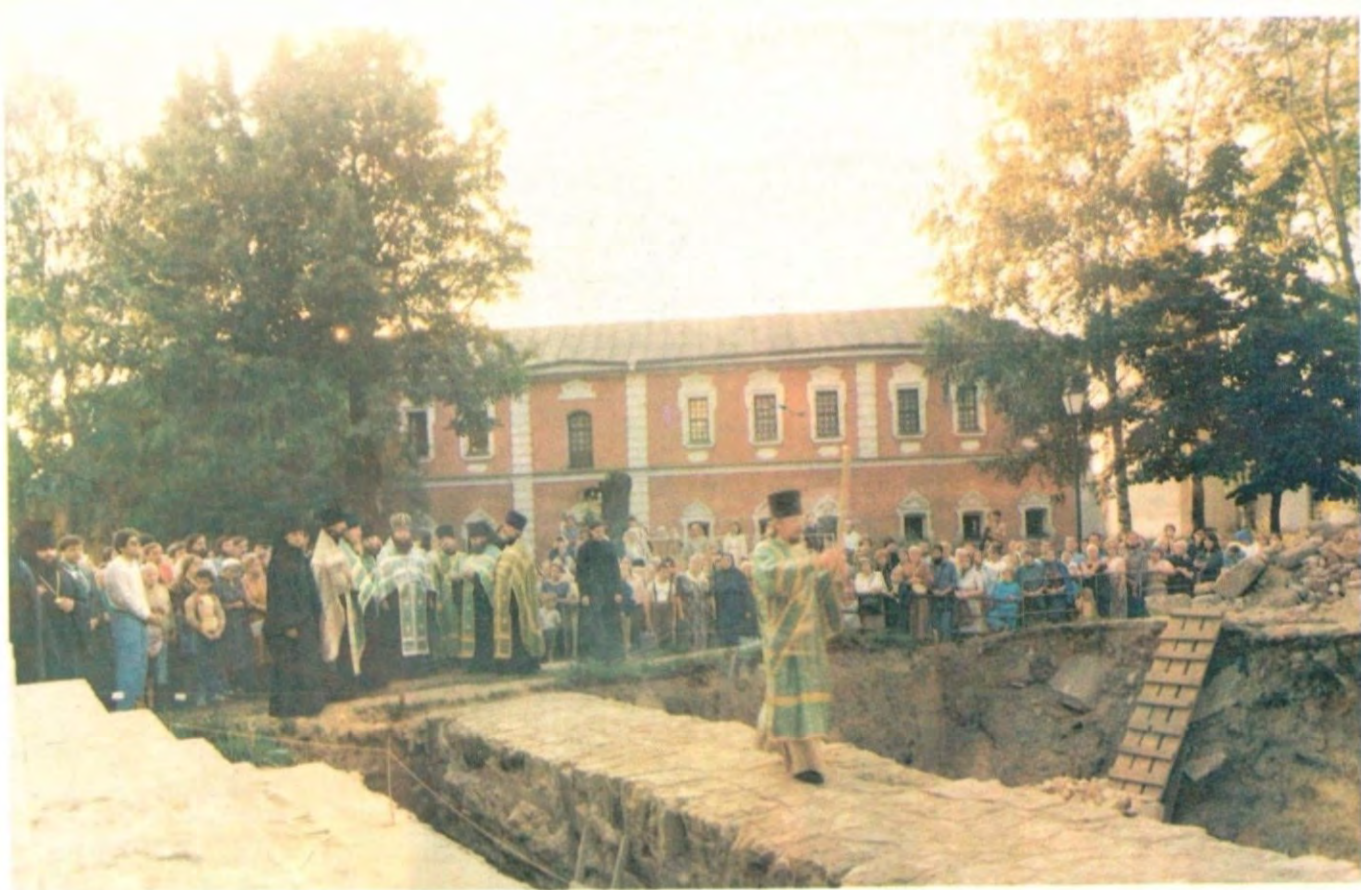
Молебен близ места погребения преподобного Андрея