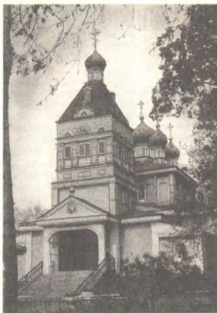
Никольский кафедральный собор в Алма-Ате

5 мая после Божественной литургии в Никольском храме в г. Талгаре епископ Евсевий в сослужении духовенства и при стечении множества молящихся совер-