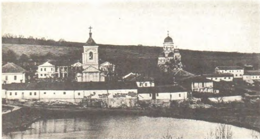
Каприянский монастырь в Молдавии