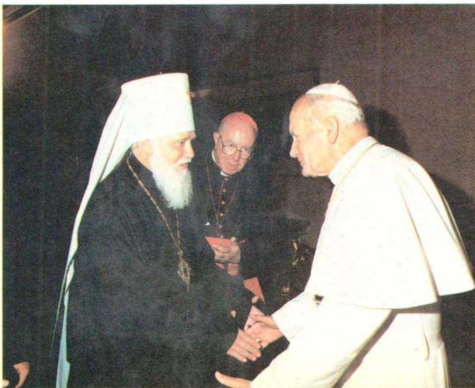
Взаимные приветствия. Глава делегации митрополит Киевский и Галицкий Филарет и Папа Иоанн Павел II. В центре — кардинал