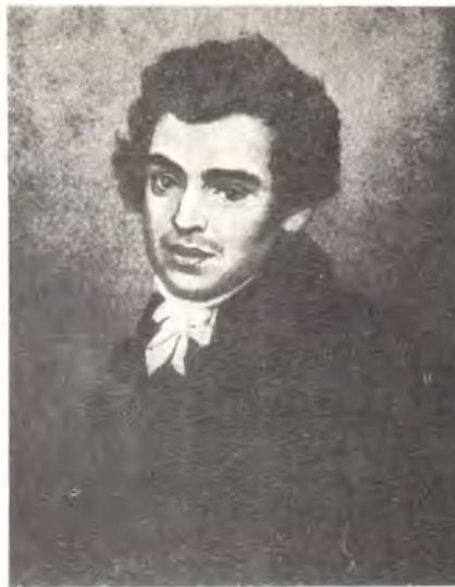
Архитектор К. А. Тон

Господь сил с нами, заступник наш — Бог,