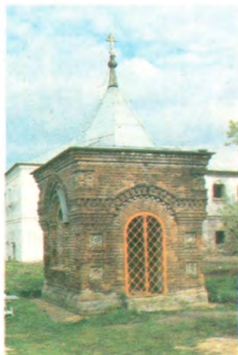
Часовня (1893), сооруженная над братской могилой иноков, погибших при осаде монастыря в 1609 году во время польско-литовской интервенции