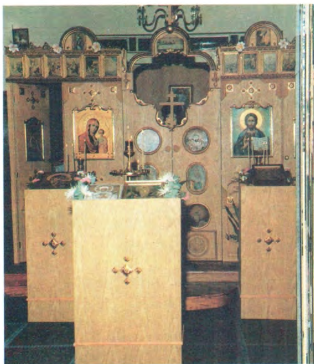
Внутренний вид новоустроенного домового храма в честь Воскресения Христова в г. Сан-Паулу — первого в Бразилии храма Русской Православной Церкви