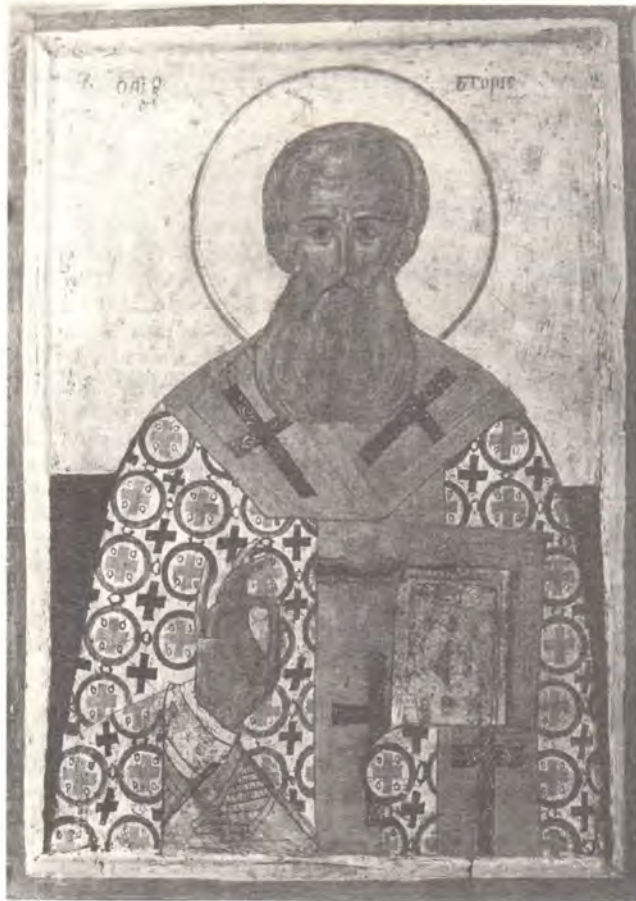
Святитель Григорий Богослов. Икона XV века из ЦАК МДА

земля!» Он предвидел, что должно было случиться впоследствии.