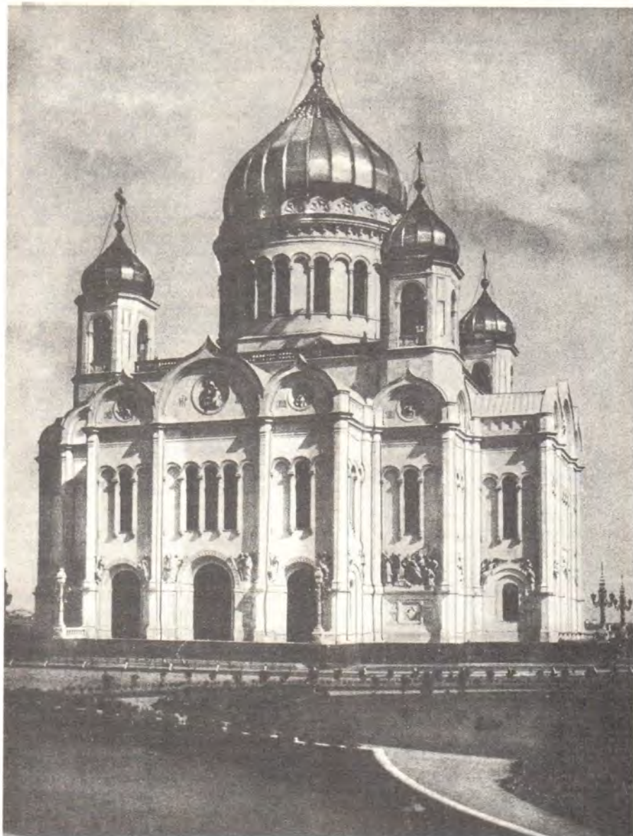
Храм Христа Спасителя

Церковь всегда помогала бедным. Следует вспомнить, что при большинстве московских церковных приходов существовали приюты для