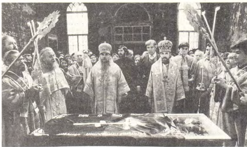
Молебен у раки с честными мощами праведного Симеона Верхотурского 25 мая 1989 года

тора миллионного города. Он был передан в ведение Русской Православной Церкви в год 1000-летия Крещения Руси.