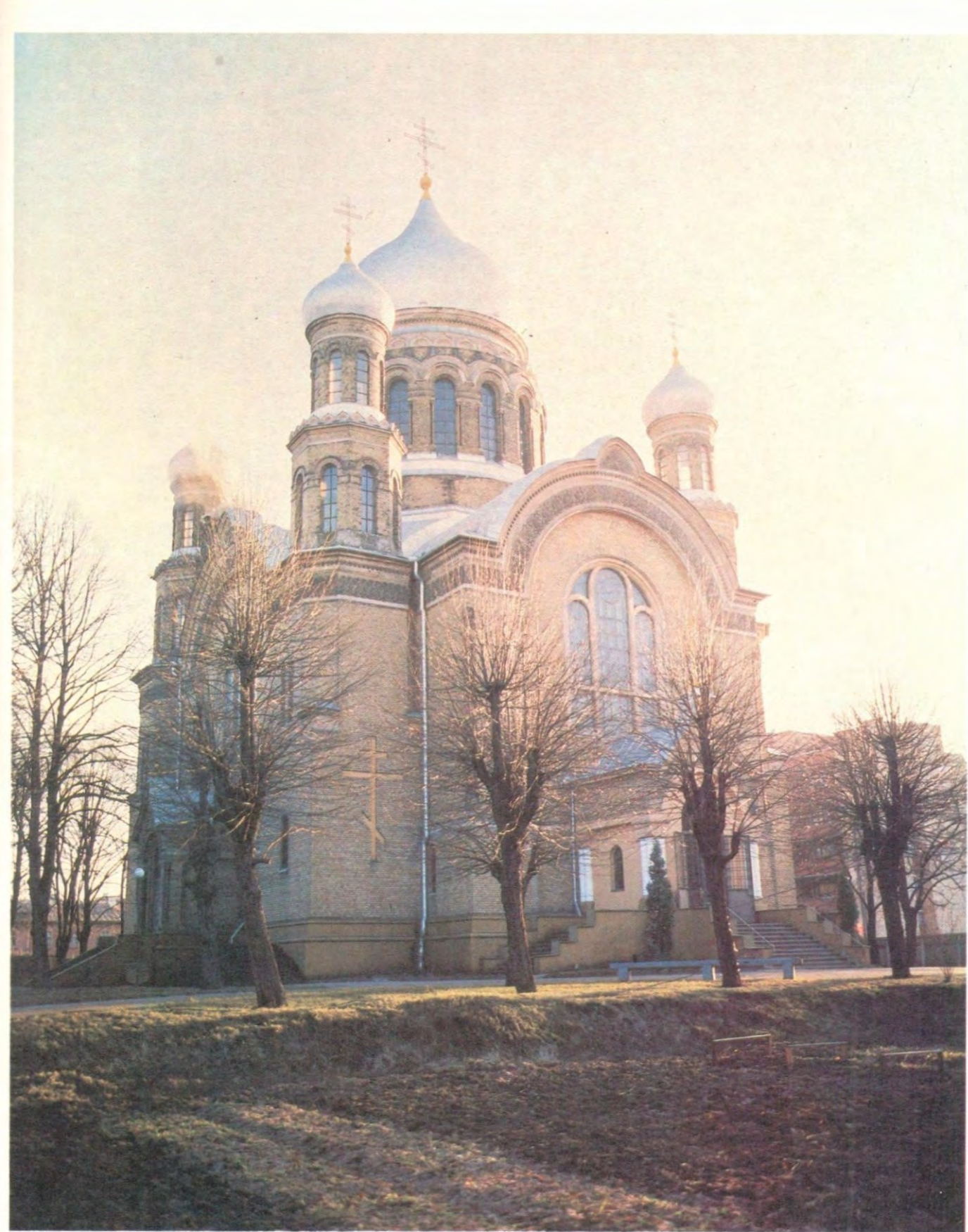
СВЯТО-ТРОИЦКИЙ СОБОР РИЖСКОГО ТРОИЦЕ-СЕРГИЕВА ЖЕНСКОГО МОНАСТЫРЯ