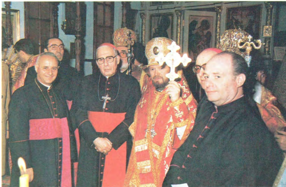
Главы представительств христианских Церквей в Аргентине после Божественной литургии в русском Благовещенском кафедральном соборе Буэнос-Айреса в день пятидесятилетия архиепископа Лазаря

Торжественное открытие памятника: ленту разрезают архиепископ Лазарь, архиепископ Буэнос-Айреса кардинал Хуан Карлос Арамбуру и представители светских властей