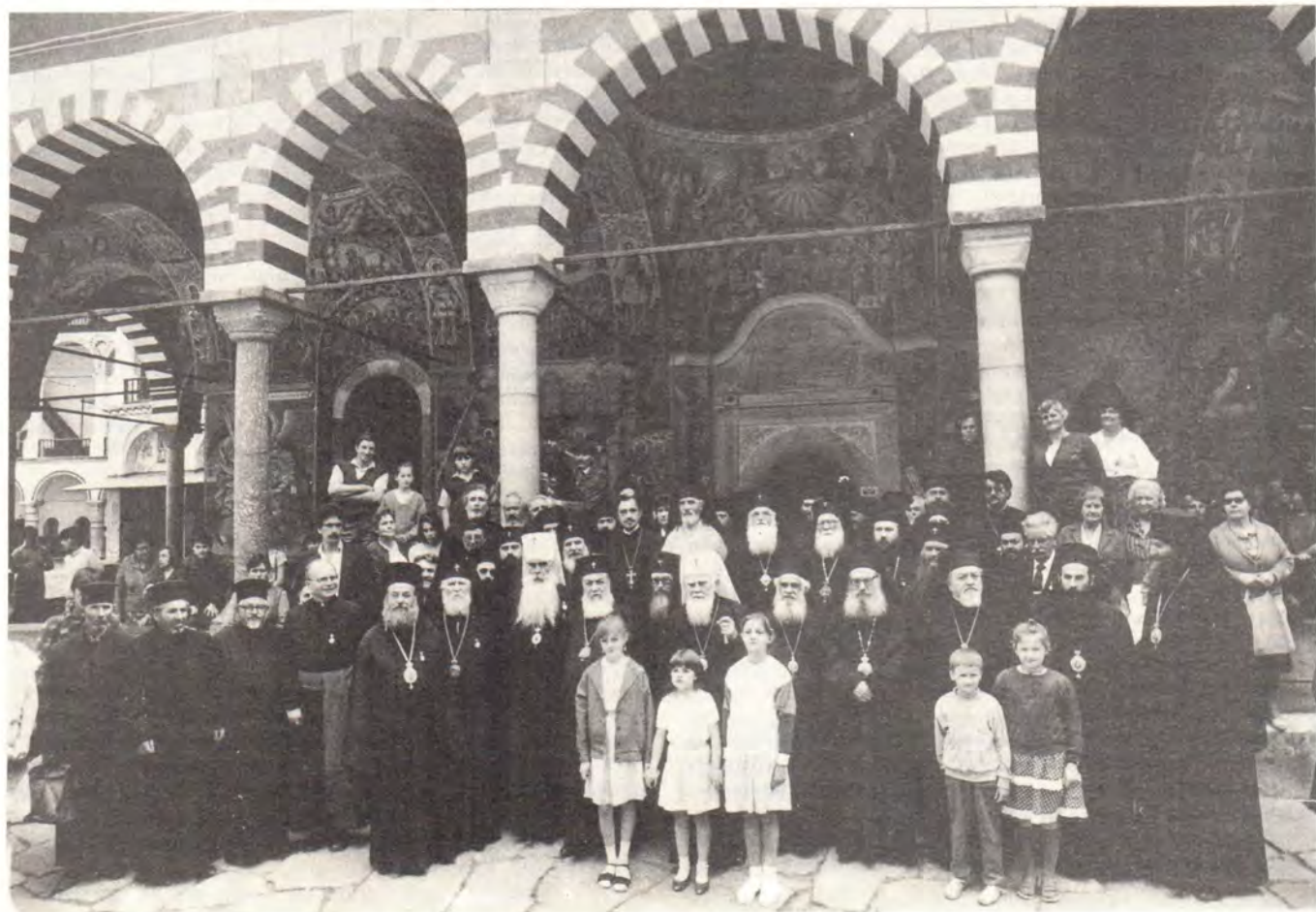
Участники торжественного празднования дня интронизации Святейшего Патриарха Болгарского Максима (в центре) после Божественной литургии в Успенском храме Рильского монастыря 4 июля 1989 года

Вечером для участников торжеств в Драматическом театре состоялся духовный концерт, на котором прозвучали церковные песнопения в исполнении объединенного хора Врачанской митрополии под управлением Димитра Димитрова. Во