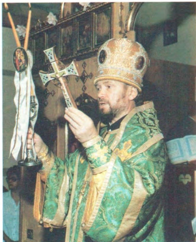
Первую Божественную литургию в Воскресенском храме совершает архиепископ Аргентинский и Южноамериканский Лазарь