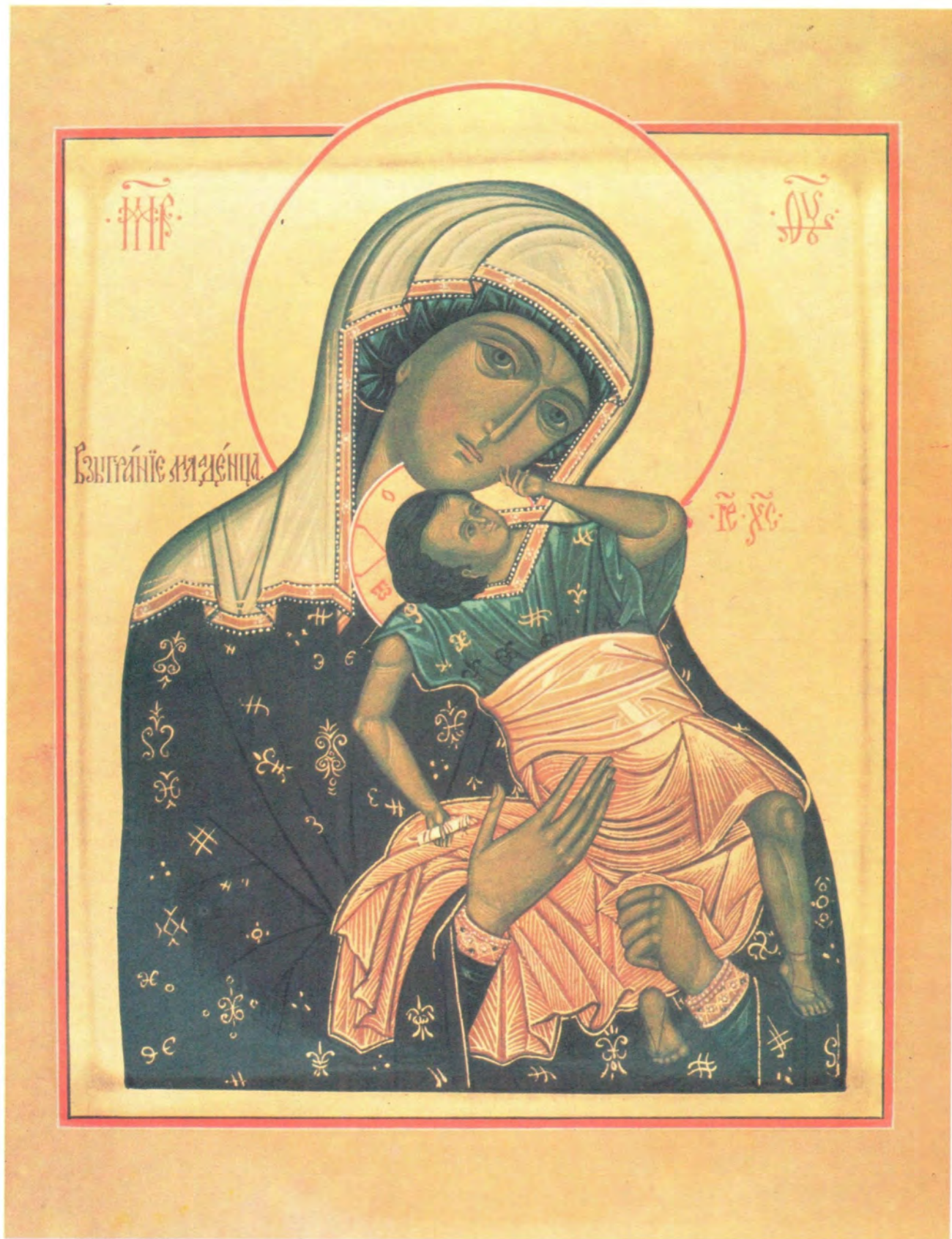
ИКОНА БОЖИЕЙ МАТЕРИ «ВЗЫГРАНИЕ»

Написана в 1980-х годах Празднование иконе совершается 7/20 ноября