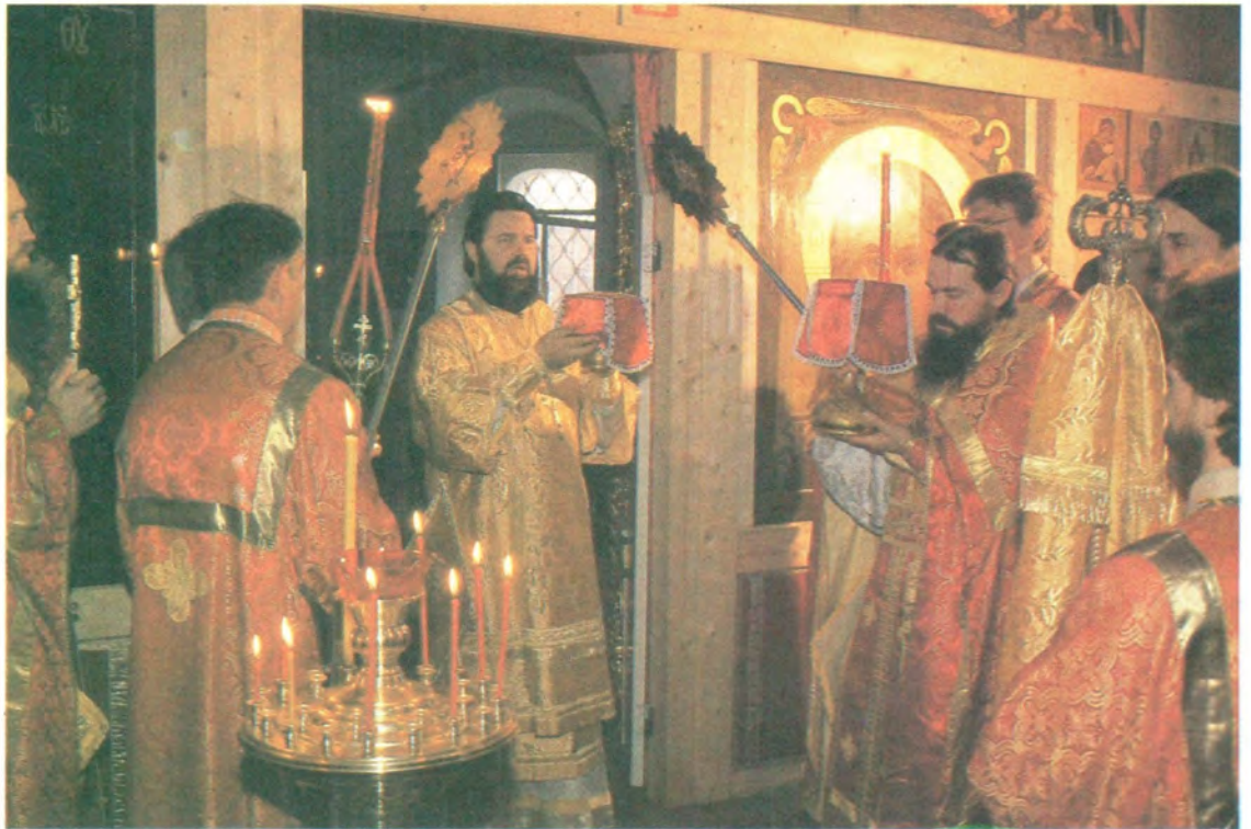
Великий вход. Божественную литургию совершает архиепископ Ярославский и Ростовский Платон