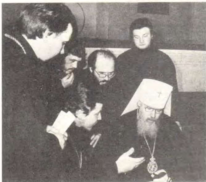
Митрополит Ленинградский и Новгородский Алексий среди выпускников Ленинградской Духовной Академии

Затем преподаватели, выпускники и гости собрались в актовом зале. Выпускной акт начался речью митрополита Алексия, который призвал будущих пастырей полагать все силы для духовного воспитания людей, особенно сейчас, когда общество переживает время переосмысления и очищения и когда необходимо быть для всех примером любви и смиренномудрия. Были зачитаны поздравительные телеграммы от Святейшего Патриарха Пимена, от председателя Учебного комитета архиепископа Дмитровского Александра, ректоров и преподавателей Московских и Одесской Духовных школ, от архиереев — выпускников нашей alma mater. Вручая выпускникам дипломы и памятные подарки, Высокопреосвященный Алексий каждого напутствовал теплыми словами. За обедом к выпускникам обратился