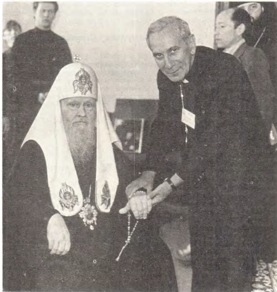
Святейший Патриарх Пимен принимает поздравления генерального секретаря ВСЦ пастора д-ра Эмилио Кастро

Святейший Патриарх Пимен произнес ответное слово.