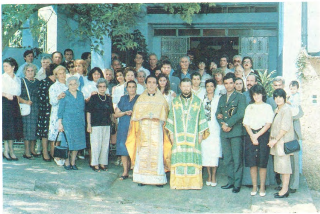
Русская православная община Сан-Паулу