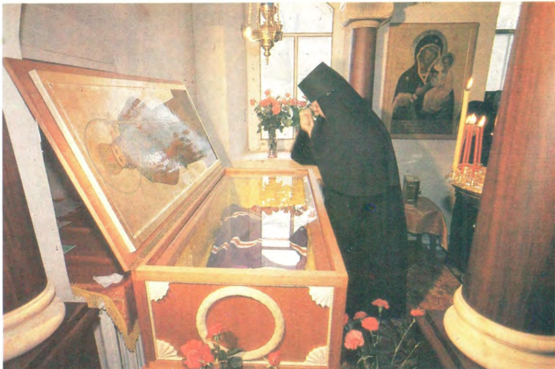
У раки с мощами новопрославленного свяителя Игнатия (Брянчанинова)