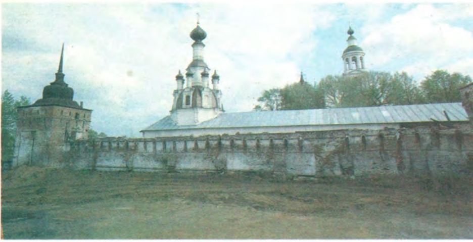
Общий вид обители