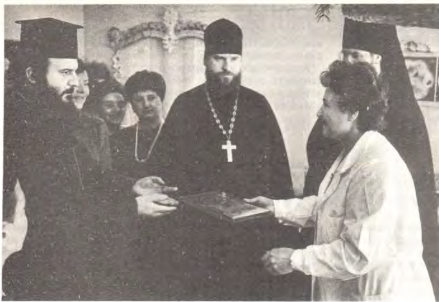
Греческие иноки передают в Дом ребенка дар — икону святого апостола Иоанна Богослова

лишившимся родителей, добровольно помогают прихожане православных храмов; часто они завещают сиротам все свое состояние.