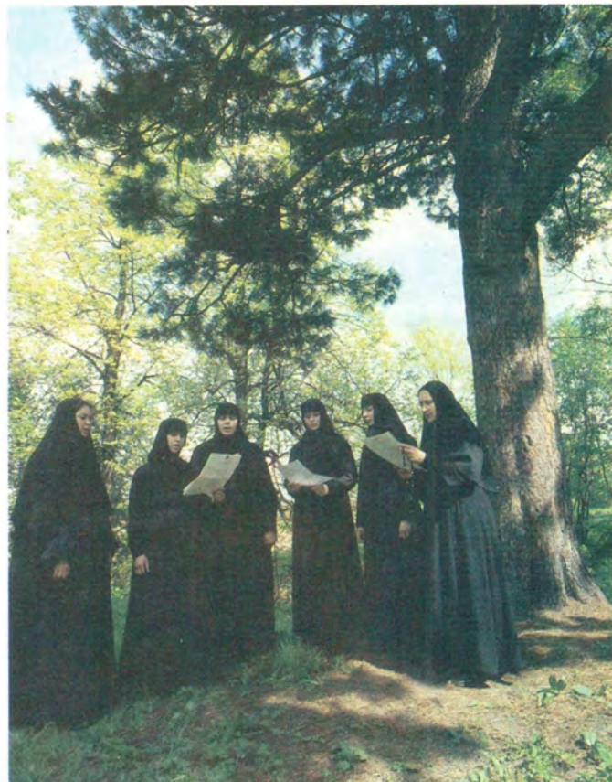
Спевка монашеского хора