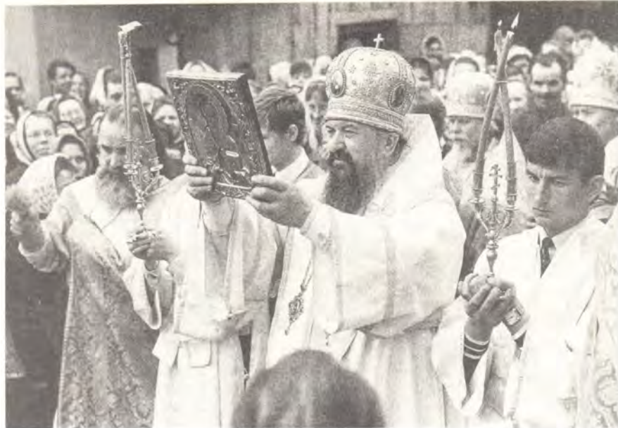
Крестный ход вокруг кафедрального собора 9 мая 1989 года. Епископ Пермский и Соликамский Афанасий осеняет богомольцев иконой святителя Стефана Великопермского

В апреле — июне 1989 года епископ Пермский и Соликамский Афанасий совершал богослужения в Свято-Троицком кафедральном соборе в г. Перми, в пермских храмах: Всехсвятском — 1 мая и Никольском — 2 мая, а также в Никольском храме в г. Чусовом — 4 мая,