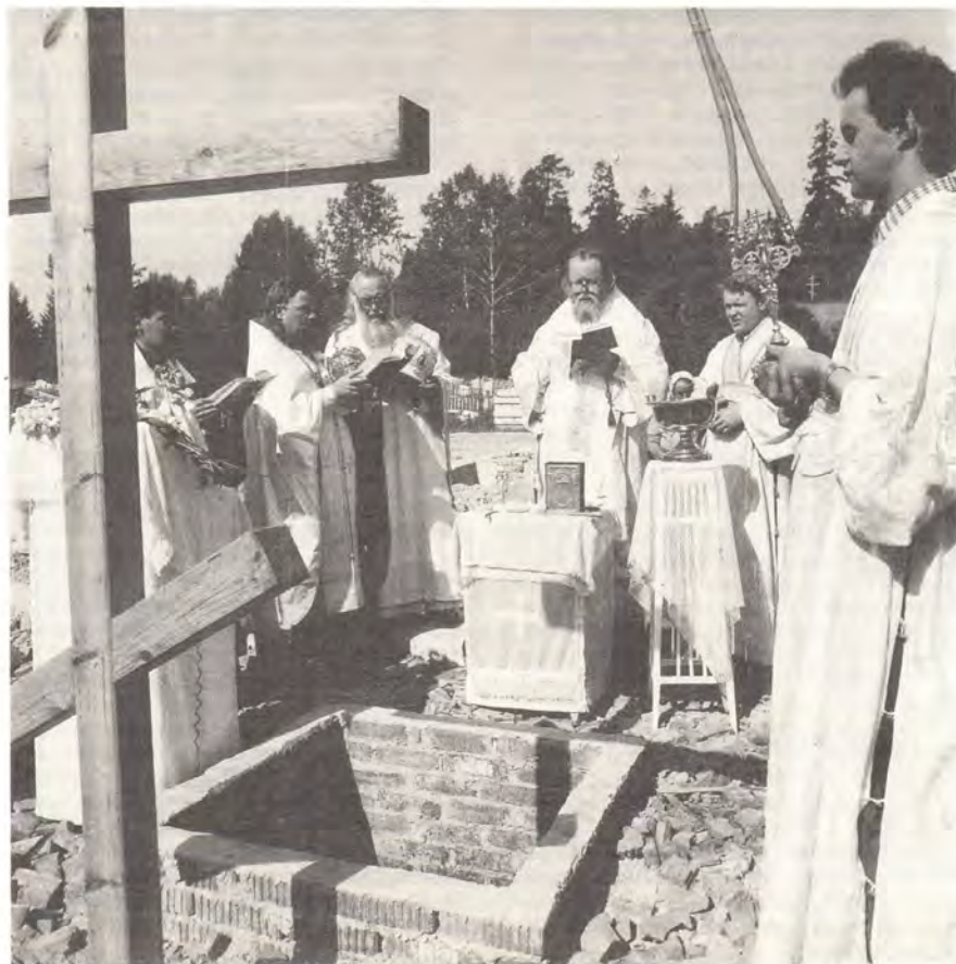
Епископ Орловский и Брянский Паисий совершает чин на основание церкви в г. Дятькове

По окончании благодарственного молебна состоялся прием, устроенный Экзархатом в честь 50-летия архиепископа Лазаря, а также в связи с его окончательным отъездом на родину. На протяжении 14 лет (из них 9 лет в качестве правящего архиерея) Высокопреосвященный Лазарь ревностно исполнял возложенные на него Священноначалием нелегкие обязанности по управлению отдаленными приходами Русской Православной Церкви. Выступавшие на приеме отмечали большой вклад архипастыря в дело благоустройства Экзархата: была упорядочена приходская жизнь, построены и освящены новые храмы, в том числе в Бразилии, где до последнего времени не было ни одного храма Русской Православной Церкви. Благодаря деятельности