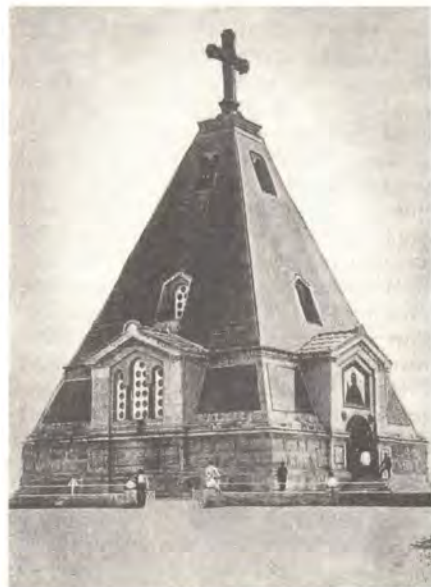
Никольский храм на Братском кладбище Северной стороны г. Севастополя

гоухающей субтропической зелени возвышается этот храм-воин, пострадавший в 1941—1942 годах, во время последней осады Севастополя. Он осеняет легендарный город 17-тонным мраморным крестом. С его высокой колокольни по праздничным и воскресным дням раздается мелодичный звон, созывающий прихожан на молитву, на возношение Бескровной Жертвы о тех, кто положил свои жизни ради ближних, и о тех, кто сегодня идет путями наших незабвенных героев и подвижников, страстотерпцев Христовых и защитников Родины.