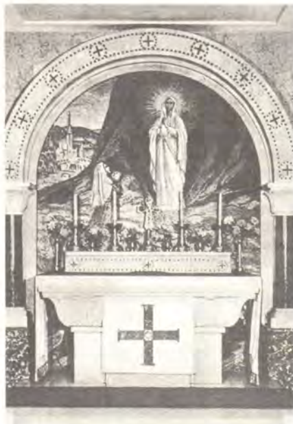
Мозаичное изображение явления Девы Марии в Лурде в крипте католического храма в честь святого Дона Боско. Бомбей, Индия