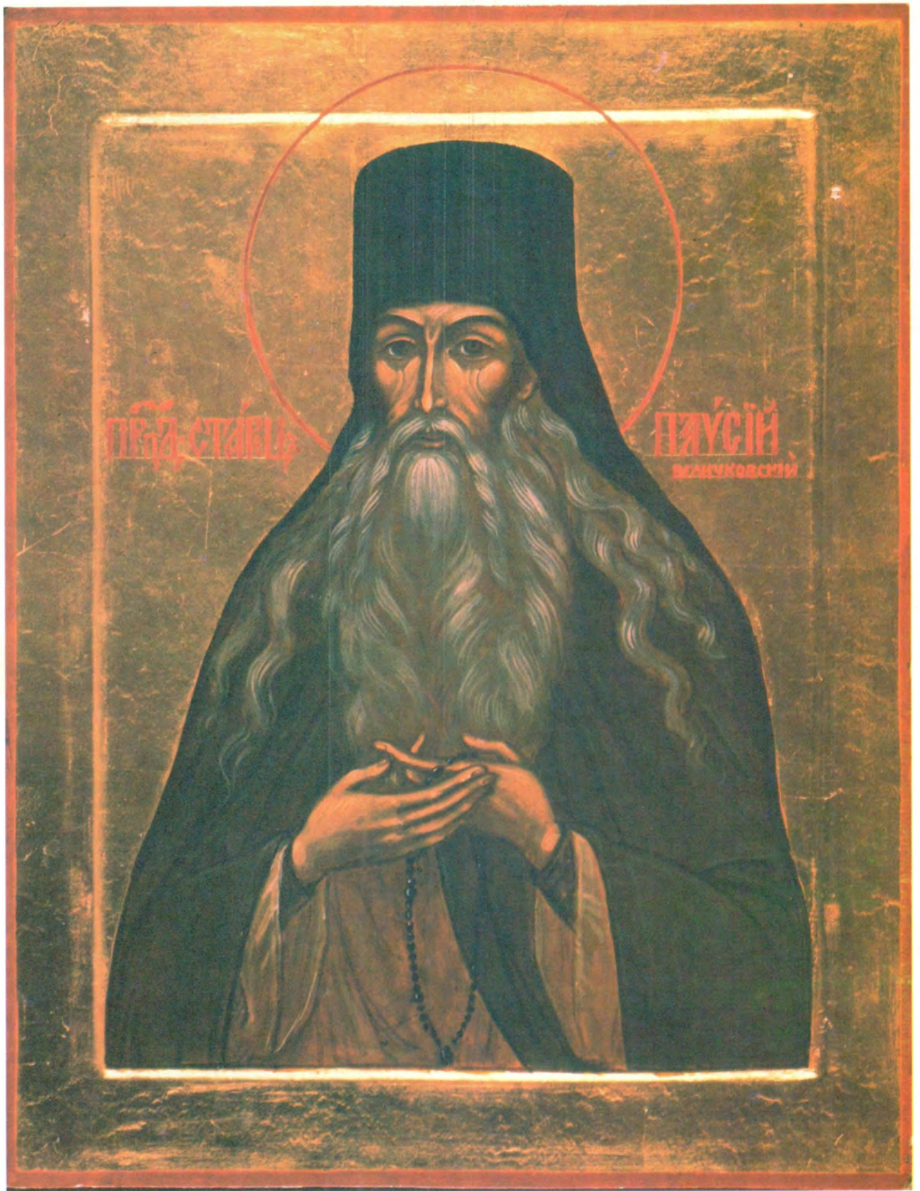
СВЯТОЙ ПРЕПОДОБНЫЙ ПАИСИЙ ВЕЛИЧКОВСКИЙ