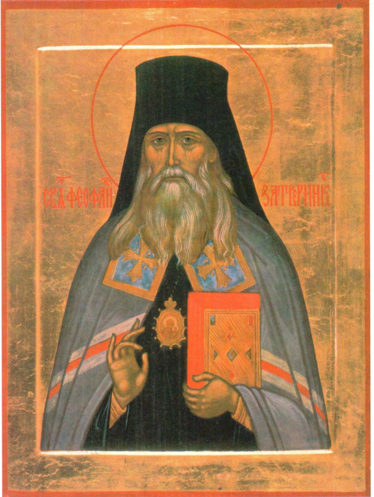
СВЯТИТЕЛЬ. ФЕОФАН ЗАТВОРНИК