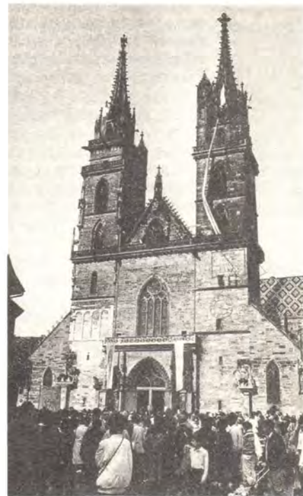
Работа ассамблеи началась экуменическим богослужением в базельском соборе

С 15 по 21 мая 1989 года в Базеле (Швейцария) проходила Европейская экуменическая ассамблея «Мир и справедливость», организованная Конференцией Европейских Церквей и Советом Епископских Конференций Европы Римско-Католической Церкви. В эти дни более 700 делегатов и тысячи верующих из всех Церквей Европы собрались для совместной молитвы, обмена мнениями и осмысления своих христианских задач. Девизом ассамблеи стали слова Библии «правда и мир облобызаются» (Пс. 84, 11). Результаты работы ассамблеи и ее рекомендации изложены в подробном документе, принятом 20 мая. Участники ассамблеи обратились также с посланием к христианам Европы.