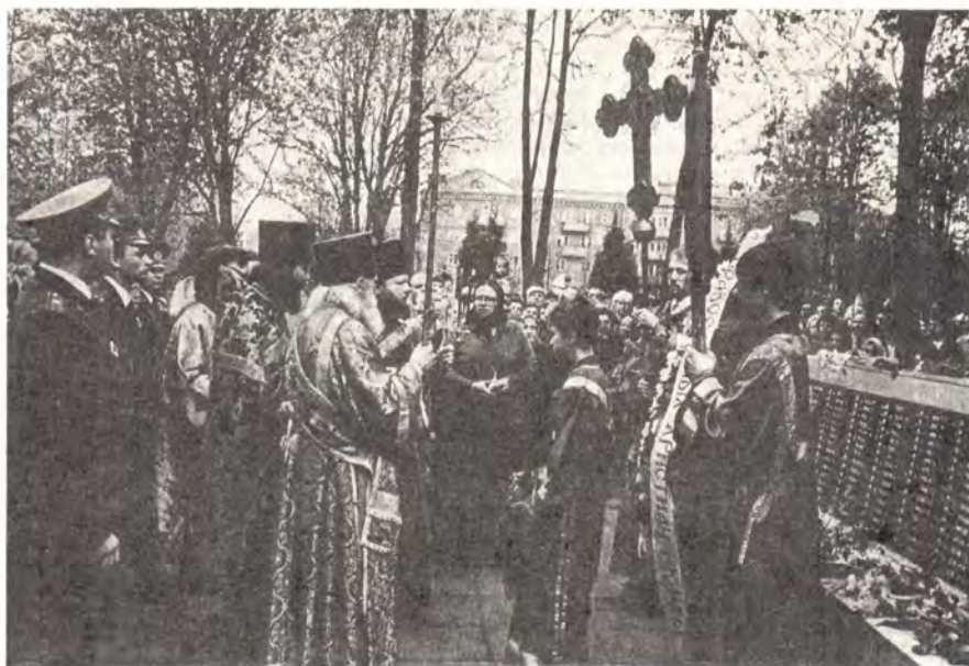
9 мая 1989 года. Панихида у братского захоронения воинов-освободителей г. Клина