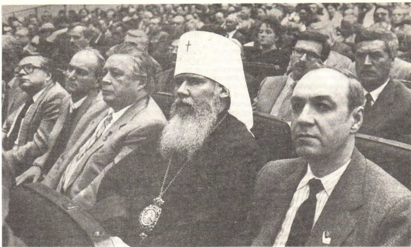
Народный депутат СССР митрополит Ленинградский и Новгородский Алексей на пленарном заседании Съезда народных депутатов СССР в Кремлевском Дворце съездов