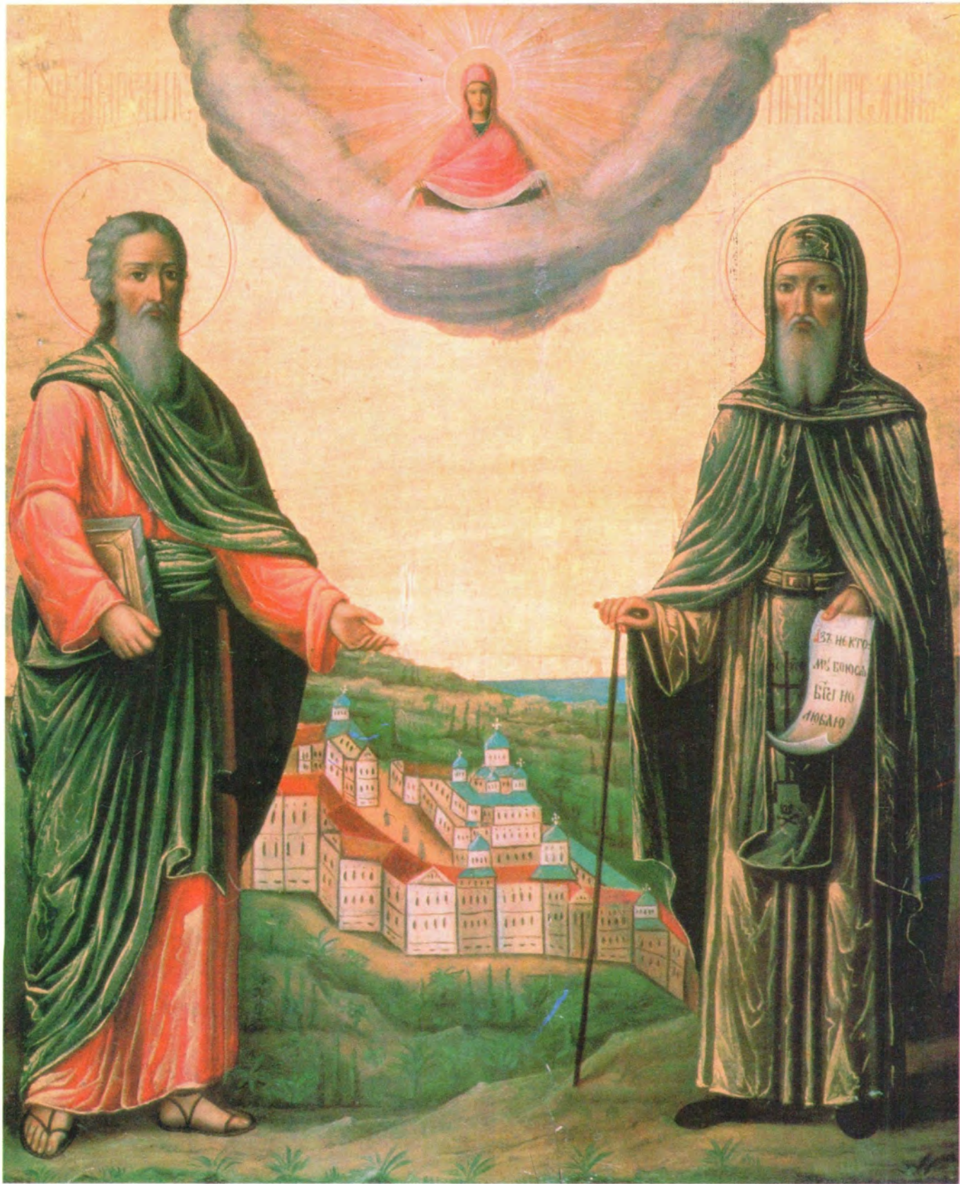
СВЯТЫЕ АПОСТОЛ АНДРЕЙ ПЕРВОЗВАННЫЙ И ПРЕПОДОБНЫЙ АНТОНИЙ ПЕЧЕРСКИЙ