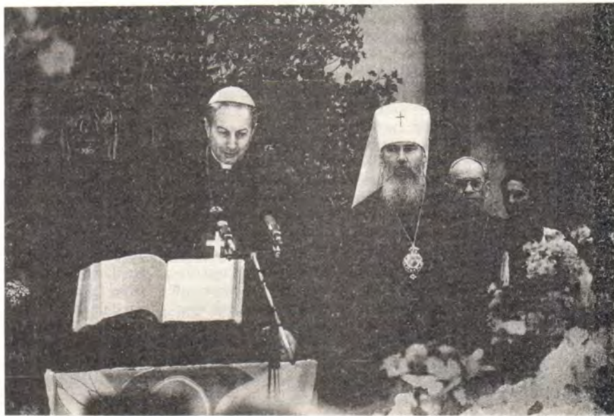
Со-председатели ассамблеи архиепископ Миланский Карло Мария кардинал Мартини и митрополит Ленинградский и Новгородский Алексей во время заключительного экуменического богослужения