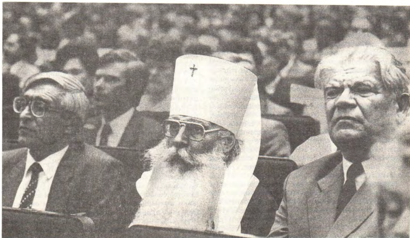
Народный депутат СССР митрополит Волоколамский и Юрьевский Питирим среди участников Съезда во время заседания