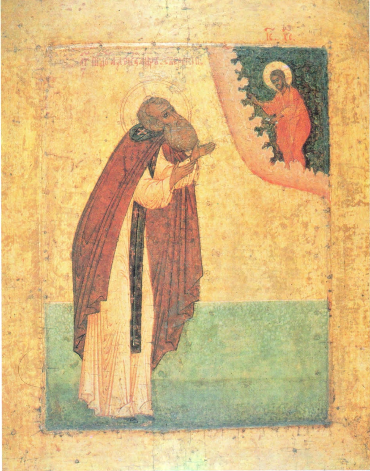
ПРЕПОДОБНЫЙ АЛЕКСАНДР СВИРСКИЙ