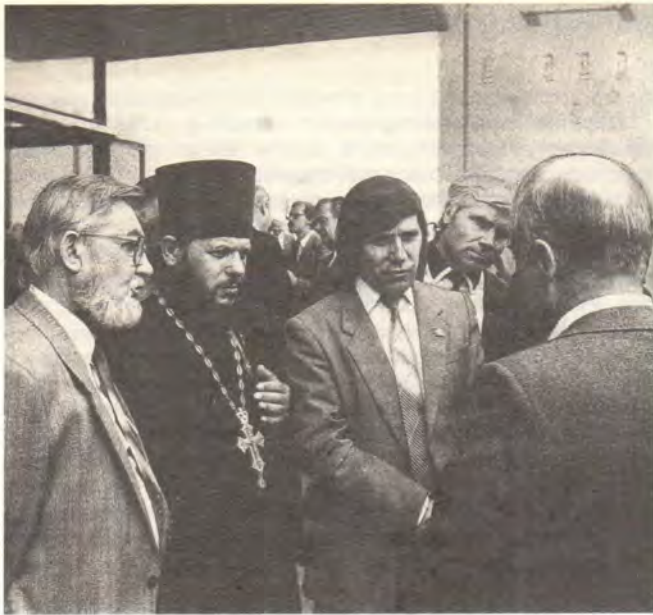
Народный депутат СССР протоиерей Петр Бубуруз среди участников Съезда во время перерыва

сти самым большим богатством и национальным достоянием любого народа.