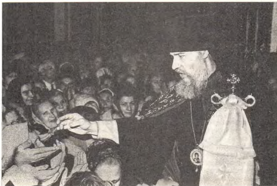
Новохиротонисанный епископ Георгий благословляет молящихся

Преосвященный Владыко, до сих пор ты нес свое послушание в стенах великой Лавры под покровом Преподобного Сергия Радонежского, в Московских Духовных шко-