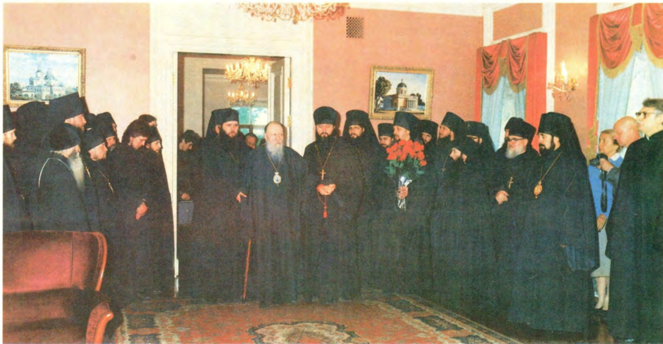
Встреча Святейшего Патриарха Пимена в Даниловом монастыре в пасхальные дни 1989 года