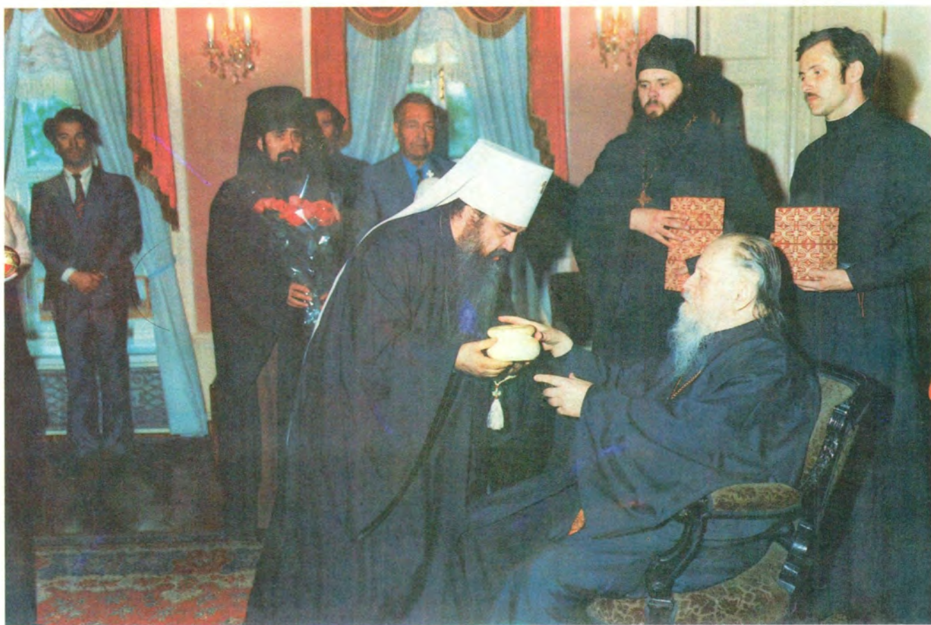
Митрополит Минский и Белорусский. Филарет преподносит Его Святейшеству святую просфору