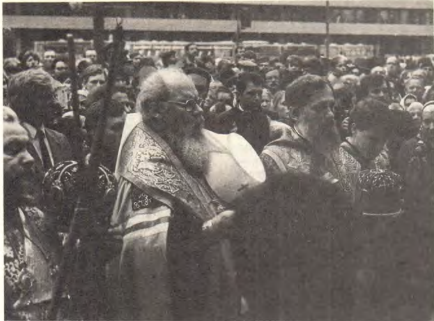
Молебен пред мощами святого благоверного князя Александра Невского

30 августа (ст. ст.): Се глаголет Господь: якоже кого мати его утешает, такоже и Аз утешу вы (Ис. 66, 12, 13). Ныне мы можем воскликнуть вместе с пророком: