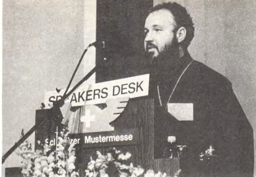
С докладом на ассамблее выступил архиепископ Смоленский и Калининградский Кирилл

Христос предал Себя за жизнь мира. Церковь Христова непрестанно молится о Вселенной, о стихиях, о властях и о всех людях, населяющих Землю. Кризис означает «суд». Церковь может и должна не судить мир, но судить о состоянии мира в свете открытой ей истины. Опыт современности показал, что мудрость тех, кто слепо верил в прогресс цивилизации, понимаемый как процесс неограниченного экономического роста, как ненасытное