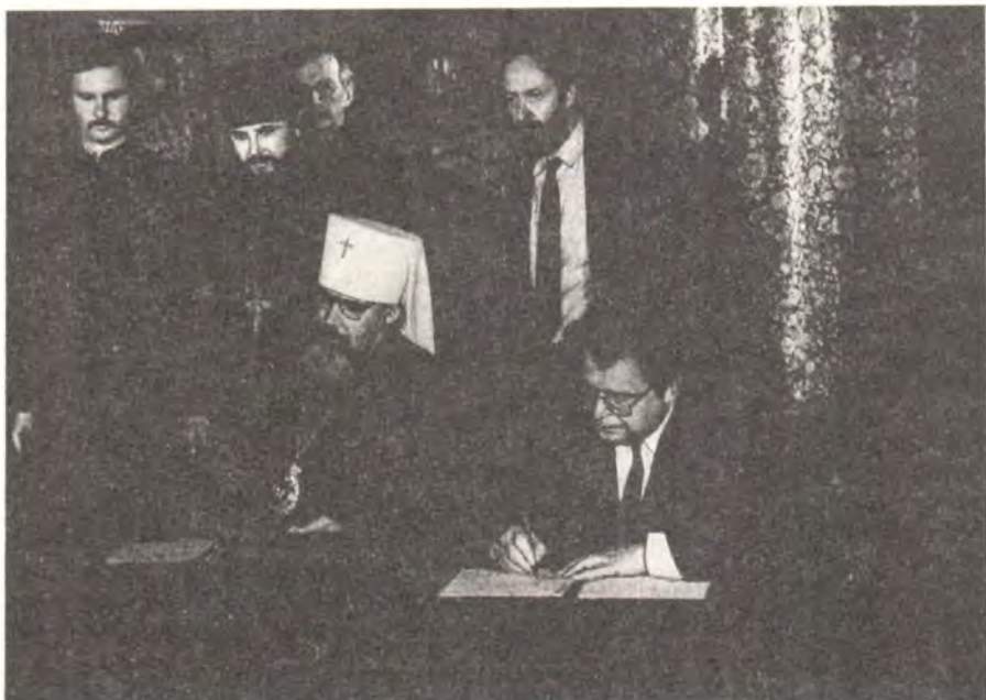
Митрополит Ленинградский и Новгородский Алексей и министр культуры РСФСР Ю. С. Мелентьев подписывают акт о передаче мощей

Приняв ларец со святыми мощами, митрополит Алексей поместил его в окропленный святой водою