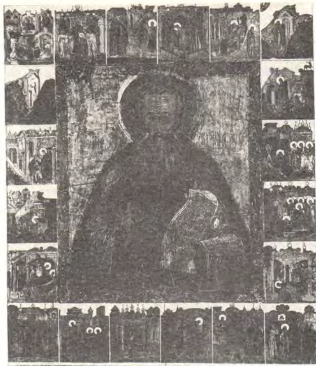
Преподобный Александр Свирский с клеймами жития. Икона конца XVI — начала XVII века

Обитель росла и укреплялась, появились каменный храм, мельница и другие постройки. Сам же преподобный ради уединения поселился в «отходную пустынь» при монастырском кладбище. Наставляя иноков на пути спасения, он строго следил за исполнением правил монашеской жизни. Ночами обходил келлии, «и егда бо слышаше кого молитву творяща, ту же став прславляше о нем Бога, и егда же ли паки слышаше кого беседующа, два или трие сошедшихся вкупе, тожде ту ударяше во двери, и тако отхожаше, назнаменав тем свой приход, и во утре иже день призывая и не ту абие обличаше их, но яко издалеча притчами глаголаше к ним, хотя уведати к Богу тщание их» [2, л. 43 об.—44]. Даже царь Иоанн Грозный указывал на Свирскую обитель как на образец подвижнической жизни.