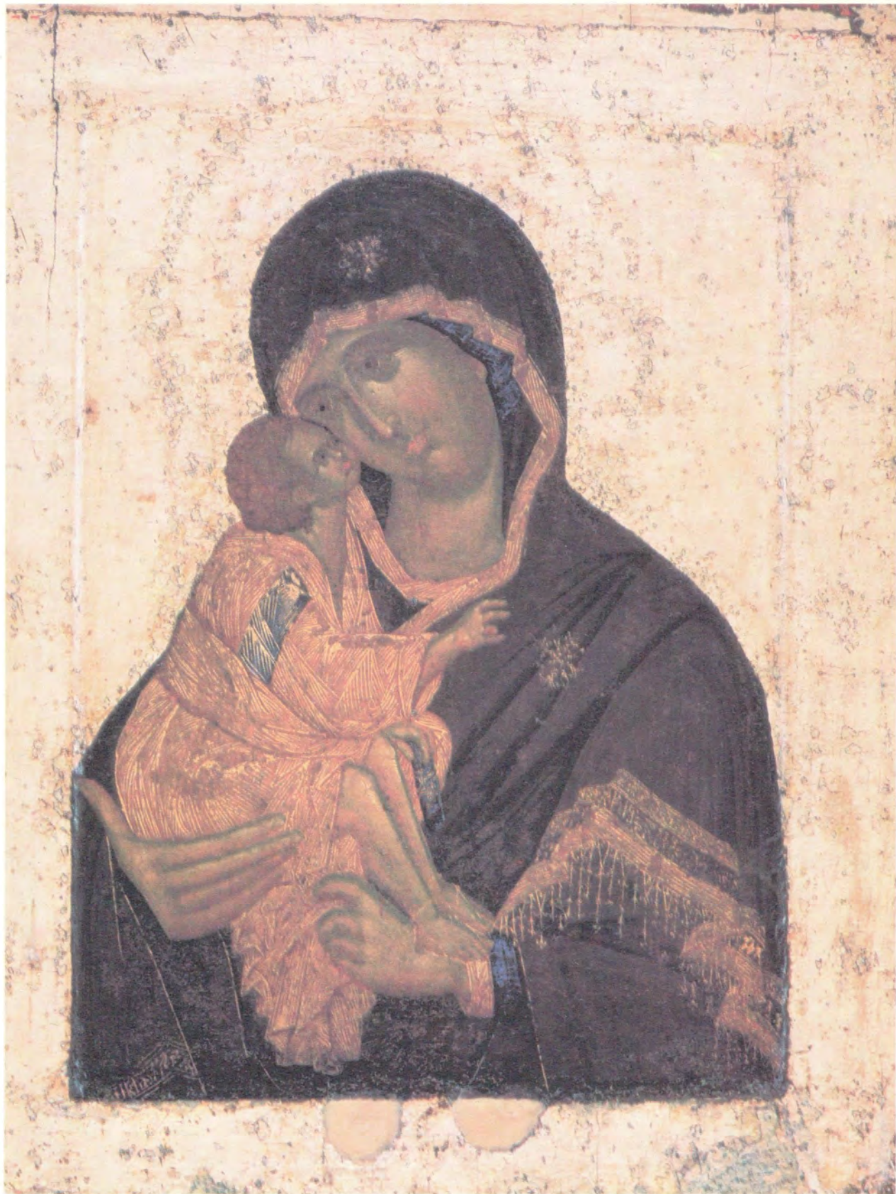
ДОНСКАЯ ИКОНА БОЖИЕЙ МАТЕРИ