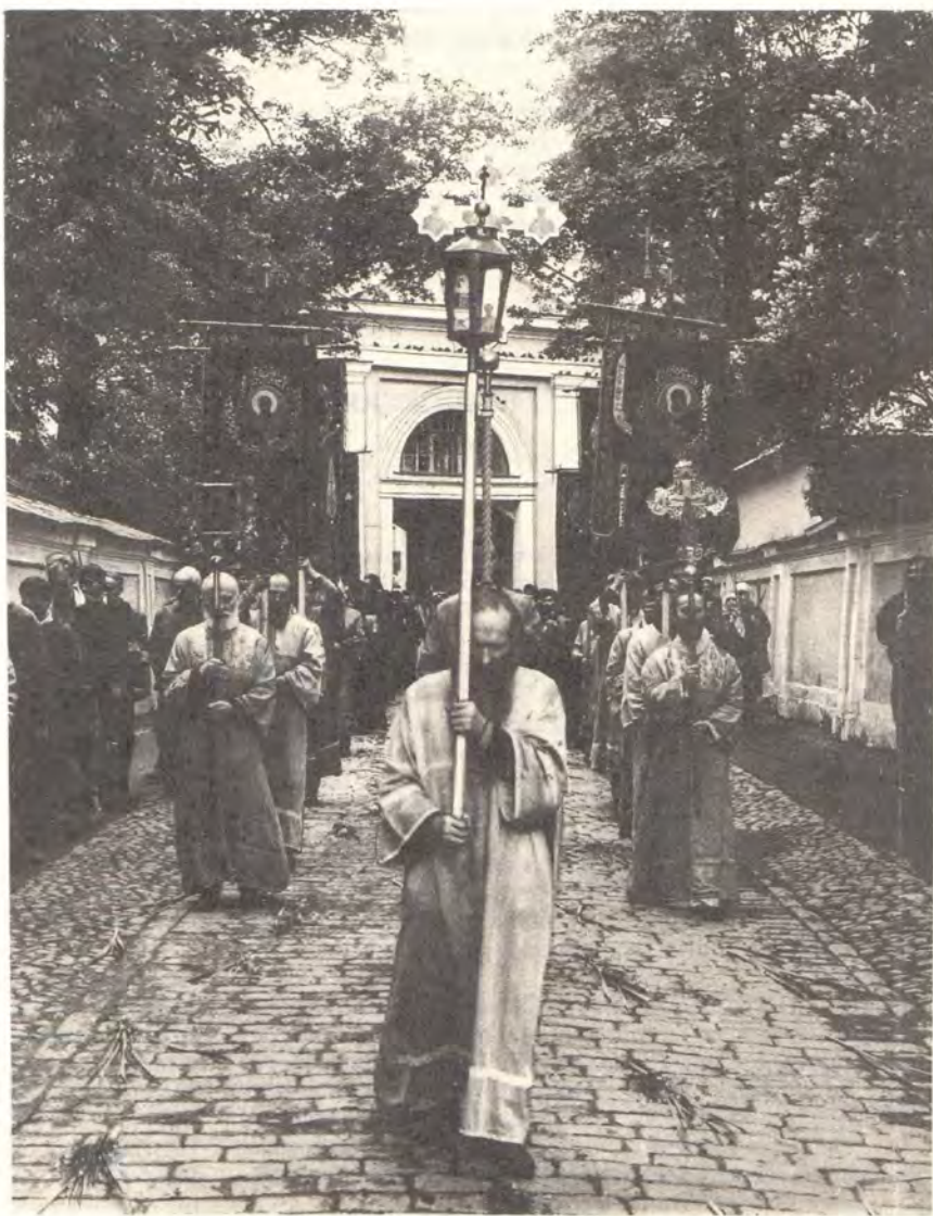
Торжественным крестным ходом святые мощи вносятся в Александроневскую Лавру

Тяжело переживали русские православные отъятие у них в начале 1920-х годов дорогой им святыни. Но недаром говорится в пророчестве Исаином, читаемом в день воспоминания первого перенесения мощей святого князя Александра,