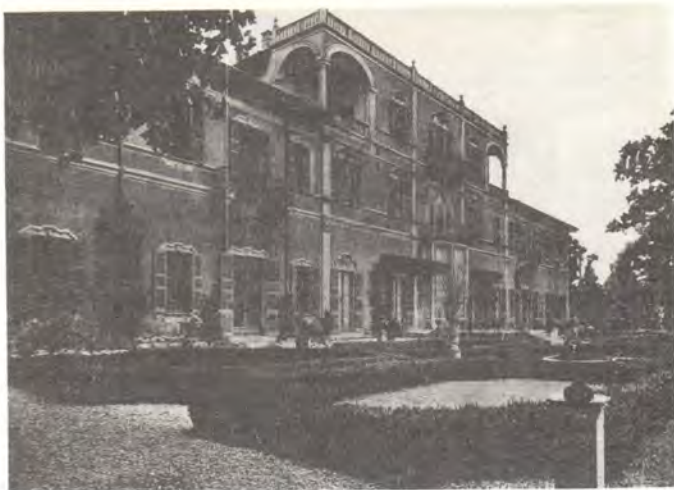
Вилла «Ганьола» близ Милана — место встречи членов Объединенного комитета КЕЦ—СЕКЕ «Ислам в Европе»

В настоящее время в Советском Союзе увеличивается число действующих мечетей. Так, в 1977—1987 годах открыто более 70 мечетей. И если в 1983 году в ведении мусульман европейской части страны и Сибири было 182 мечети, то в 1988 году их насчитывалось уже 211. Мечети, находящиеся в ведении Духовного управления мусульман европейской части Советского Союза и Сибири, имеются не только в таких исторически исламских