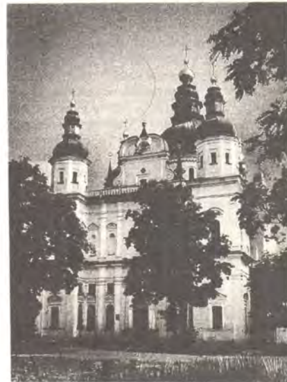
Свято-Троицкий кафедральный собор в г. Чернигове, переданный Русской Православной Церкви 5 декабря 1988 года