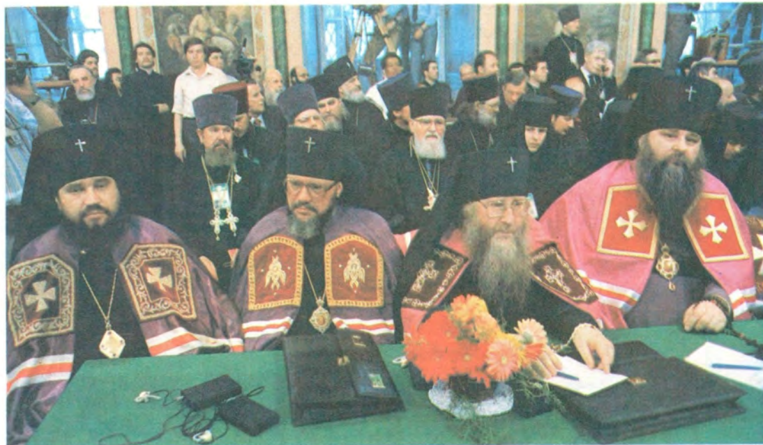
Слева направо: архиепископы Ставропольский и Бакинский Антоний, Зарайский Иов, Рязанский и Касимовский Симон, Тульский и Белевский Максим