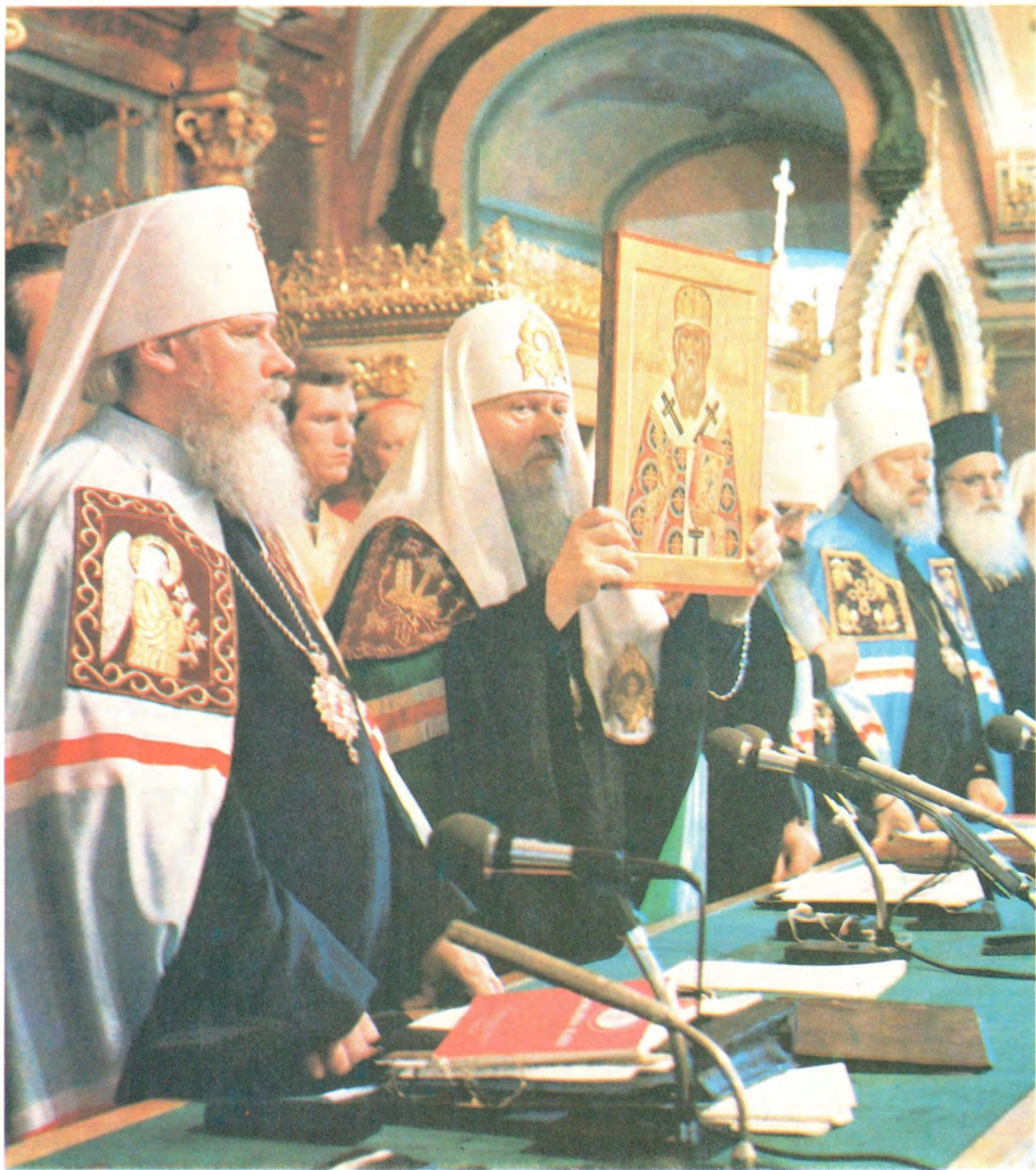
Святейший Патриарх Московский и всея Руси Пимен благословляет участников Собора иконой святителя Макария