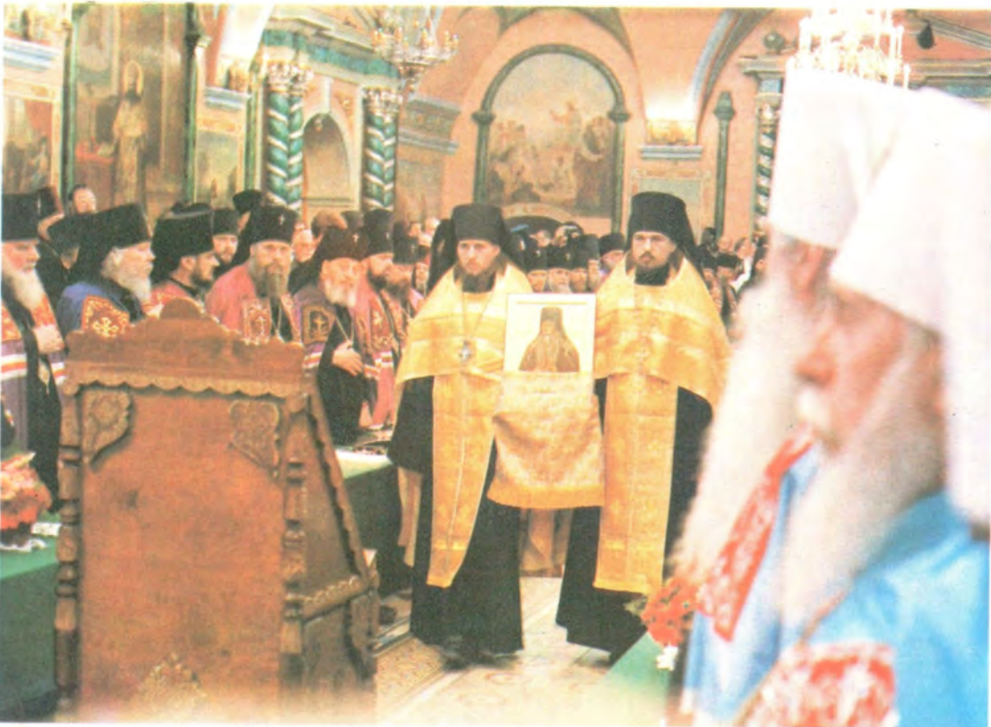
Митрополит Крутицкий и Коломенский Ювеналий выступает с докладом о канонизации святых в Русской Православной Церкви