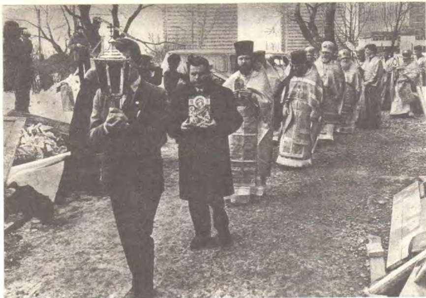
Крестный ход вокруг храма

заключение архипастырь, учит нас тому, что каждый из нас есть храм, храм живущего в нем духа. И по примеру открытия, обновления и освящения храма пусть обновляется, открывается и освящается храм наш личный, наше тело и наша душа. По призыву, с которым обращается к нам Господь: Будьте совершенны, как совершен Отец ваш Небесный (Мф. 5, 48).