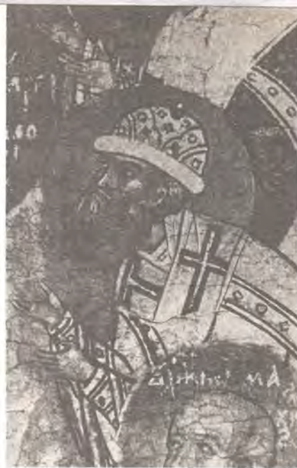
Святитель Макарий, Митрополит Московский. Фрагмент иконы-складня XVI века

Сей блаженный, глаголю, во святых отец наш Макарий чудный Митрополит царствующаго града Москвы родом, христоролюбивых родителей родис[я] от священноиерея Леонтия и от юности Бога возлюбил.