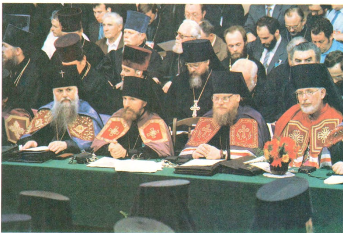
Выступает митрополит Волоколамский и Юрьевский Питирим, председатель Издательского отдела Московского Патриархата