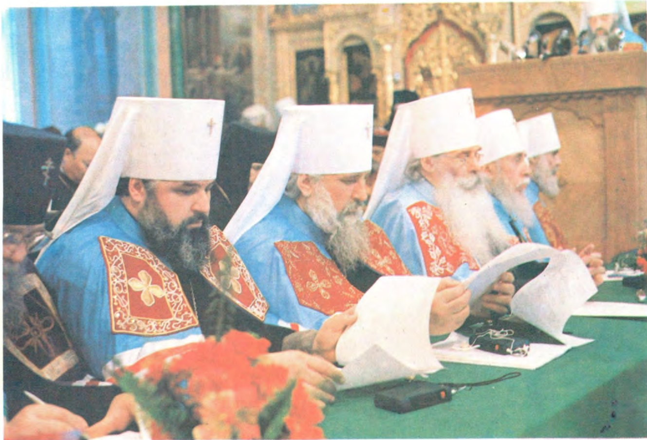
В первом ряду справа налево: митрополиты Сурожский Антоний, Одесский и Херсонский Сергей, Волоколамский и Юрьевский Питирим, Новосибирский и Барнаульский Гедеон, Воронежский и Липецкий Мифодий