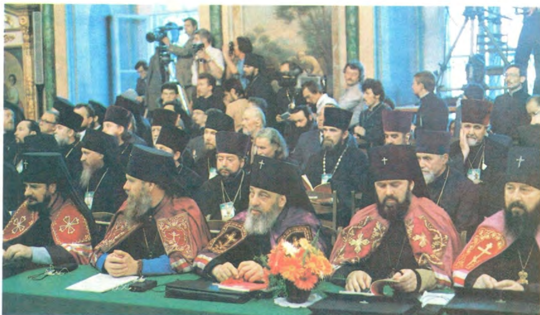
Почетные гости Поместного Собора — Предстоятели Поместных Православных Церквей, представители инославных Церквей