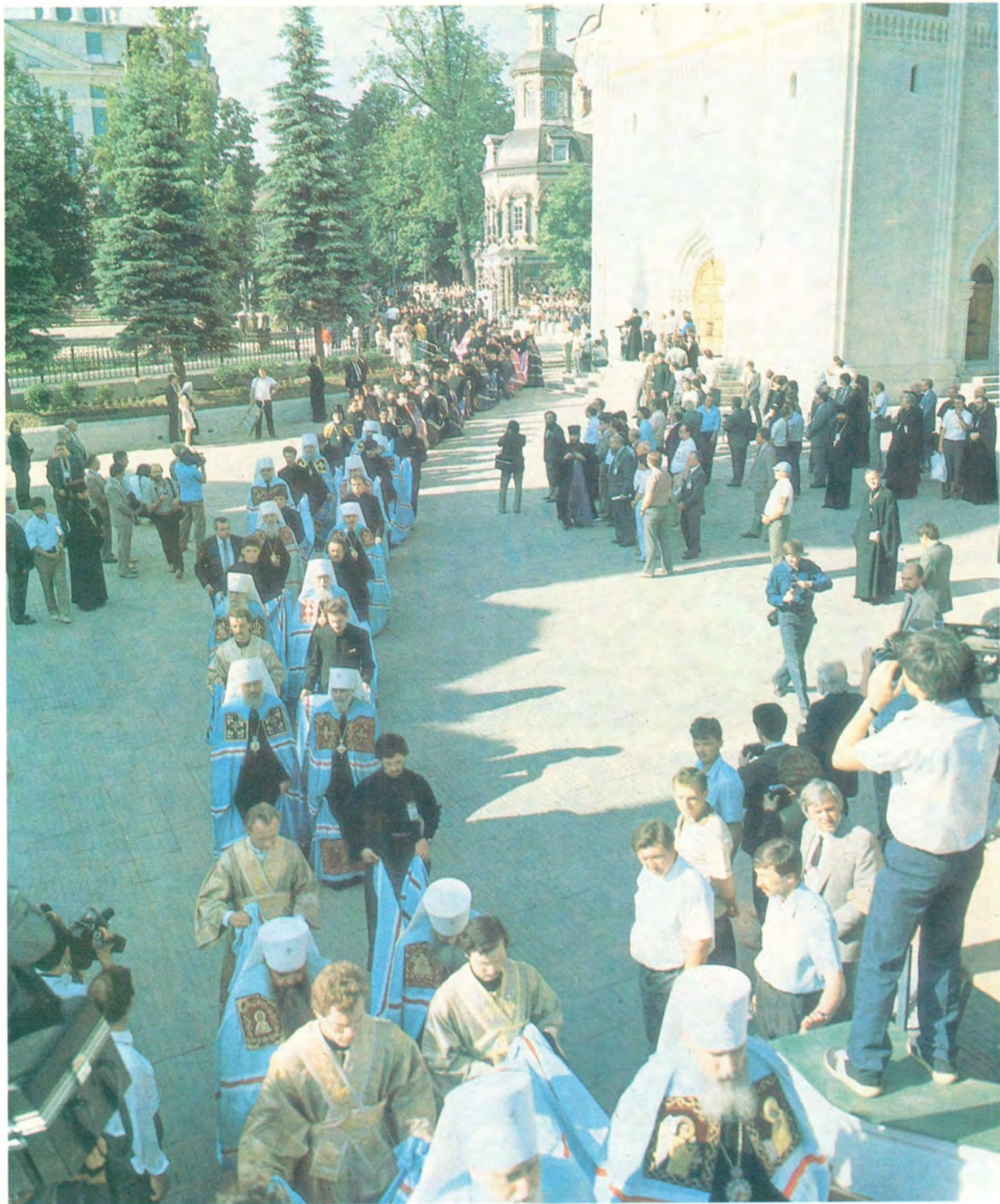
Шествие архиереев в Сергиевский трапезный храм на заседание Поместного Собора