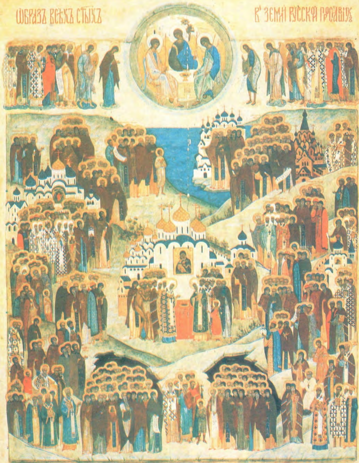
ВСЕ СВЯТЫЕ, В ЗЕМЛЕ РОССИЙСКОЙ ПРОСЯВШИЕ