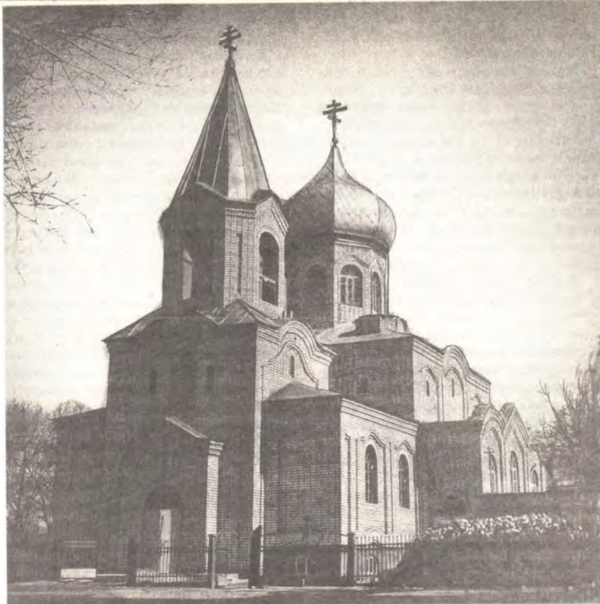
Никольский храм в г. Михайловка Волгоградской области

Третья модель, центральная. В 1983 году Русская Православная Церковь начала реставрацию Московского Данилова монастыря, для чего было создано Управление по реставрации и строительству. В ходе работ в монастыре это Управление стало оказывать услуги также и некоторым приходам: например, провело реставрацию церкви в городе Ржеве и таким образом выступило