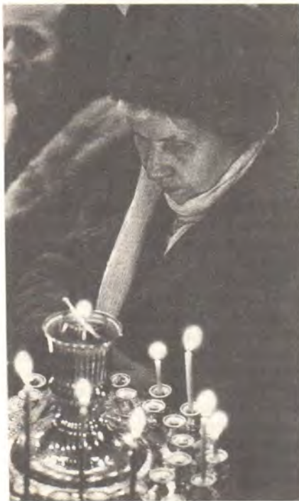
Пятьдесят лет не теплился здесь огонек свечи...