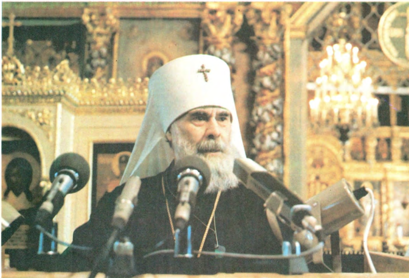
Выступает митрополит Суражский Антоний, председатель Мандатной комиссии