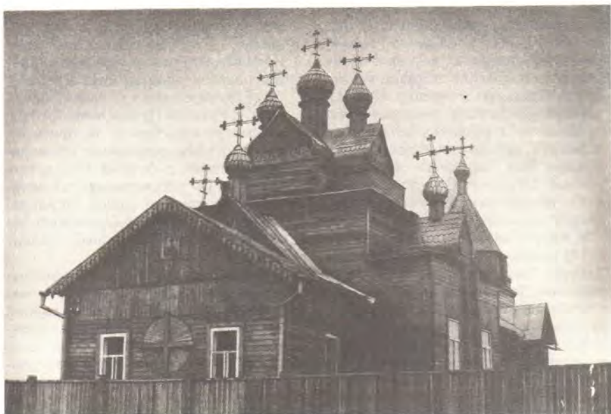
Никольский храм в Якутске

Характерный пример — Курская епархия. С 1985 года денежные поступления в епархиальное управление увеличились примерно в три раза. На эти централизованные средства только в 1988 году в десяти храмах провели капитальный ремонт или построили новые церкви взамен молитвенных домов. Это те приходы, которые по своей бедности