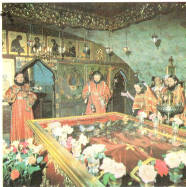
Праздничное богослужение у раки с мощами Виленских мучеников в подземном храме монастыря