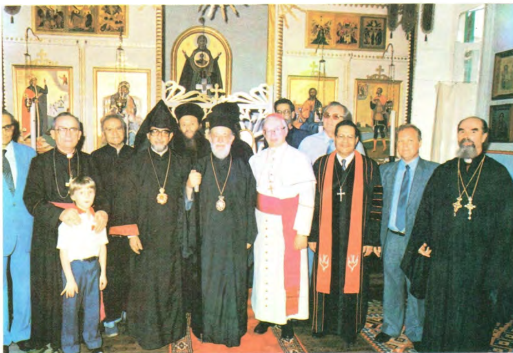
Участники празднования в Александро-Невском храме