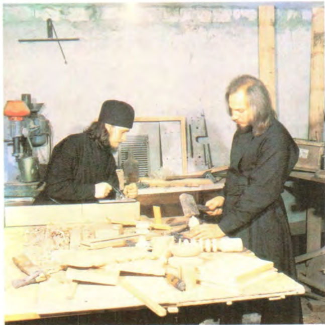
За монастырским послушанием