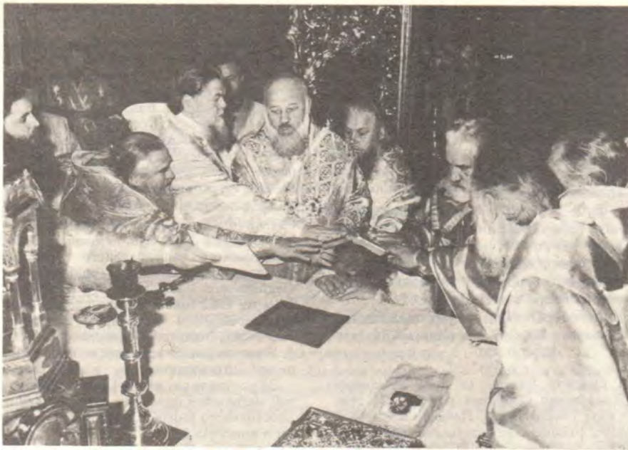
Во время хиротонии архимандрита Виктора во епископа в Богоявленском патриаршем соборе 4 декабря 1988 года

потребным... годным на всякое доброе дело (2 Тим. 2, 21), да совершит меня тщанием не ленива, духом же горяща (Рим. 12, 11). Верю, что вы, богомудрые архипастыри, будете научать меня, как подобает в дому Божии жити, яже есть Церковь Бога жива, столп и утверждение истины (1 Тим. 3, 15).