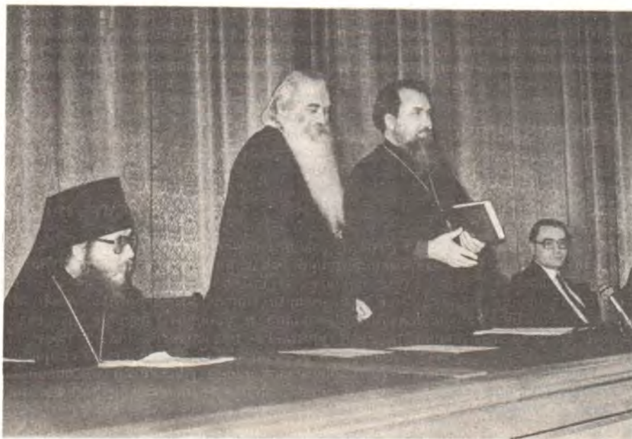
Ректор архиепископ Александр благодарит митрополита Питирима за выступление и переданный дар — Святое Евангелие, изданное в Греции

В области литургического богословия митрополит Филарет выступал против схоластического подхо-