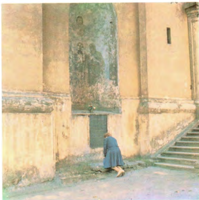
На месте мученической кончины святых Антония, Иоанна и Евстафия в Вильнюсе