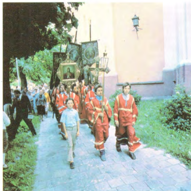
Крестный ход в обители