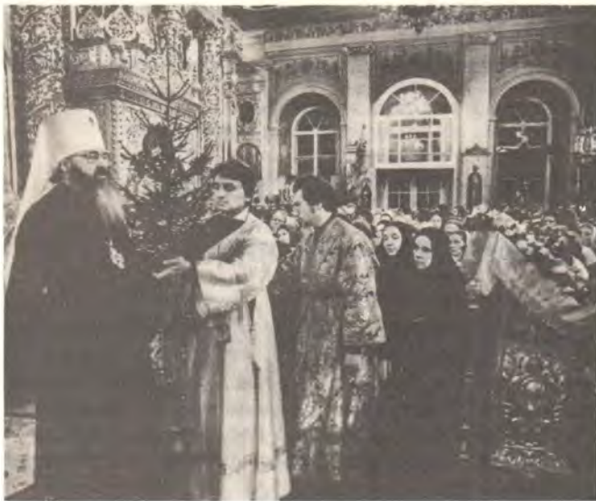
Митрополит Крутицкий и Коломенский Ювеналий оглашает Рождественское послание Святейшего Патриарха Пимена