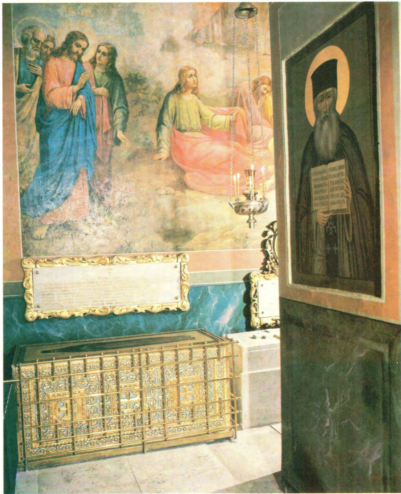
РАКА (ГРОБНИЦА) ПРЕПОДОБНОГО МАКСИМА ГРЕКА В СВЯТО-ДУХОВСКОМ ХРАМЕ ТРОИЦЕ-СЕРГИЕВОЙ ЛАВРЫ