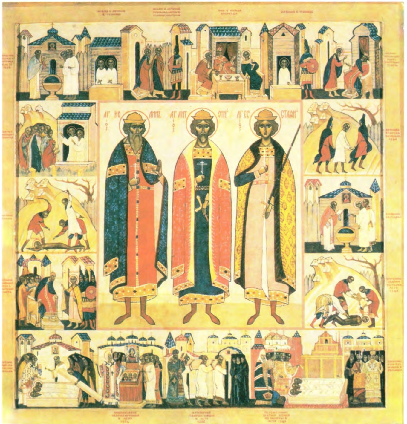
СВЯТЫЕ МУЧЕНИКИ АНТОНИЙ, ИОАНН И ЕВСТАФИЙ, В ВИЛЬНЕ ПОСТРАДАВШИЕ

Икона из подземного храма Виленского Свято-Духова монастыря