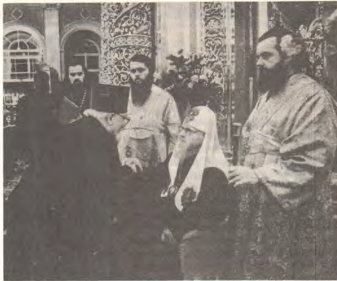
Святейший Патриарх Пимен преподает первосвятительское благословение представителям московского духовенства

В первый день праздника Рождества Христова Святейший Патриарх Пимен принял архиепископа Алексея, который рассказал Его Святейшеству о праздничных богослужениях в соборе и передал ему поздравления и пожелания здоровья от клириков и прихожан собора. Затем Святейшего Патриарха Пимена тепло поздравили с Рождеством Христовым дети московского