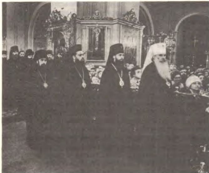
Преосвященные архиереи и клирики во время рождественского поздравления Святейшего Патриарха Пимена

Благодать Господа нашего Иисуса Христа, и любовь Бога Отца, и общение Святого Духа со всеми вами. Аминь (2 Кор. 13, 13).