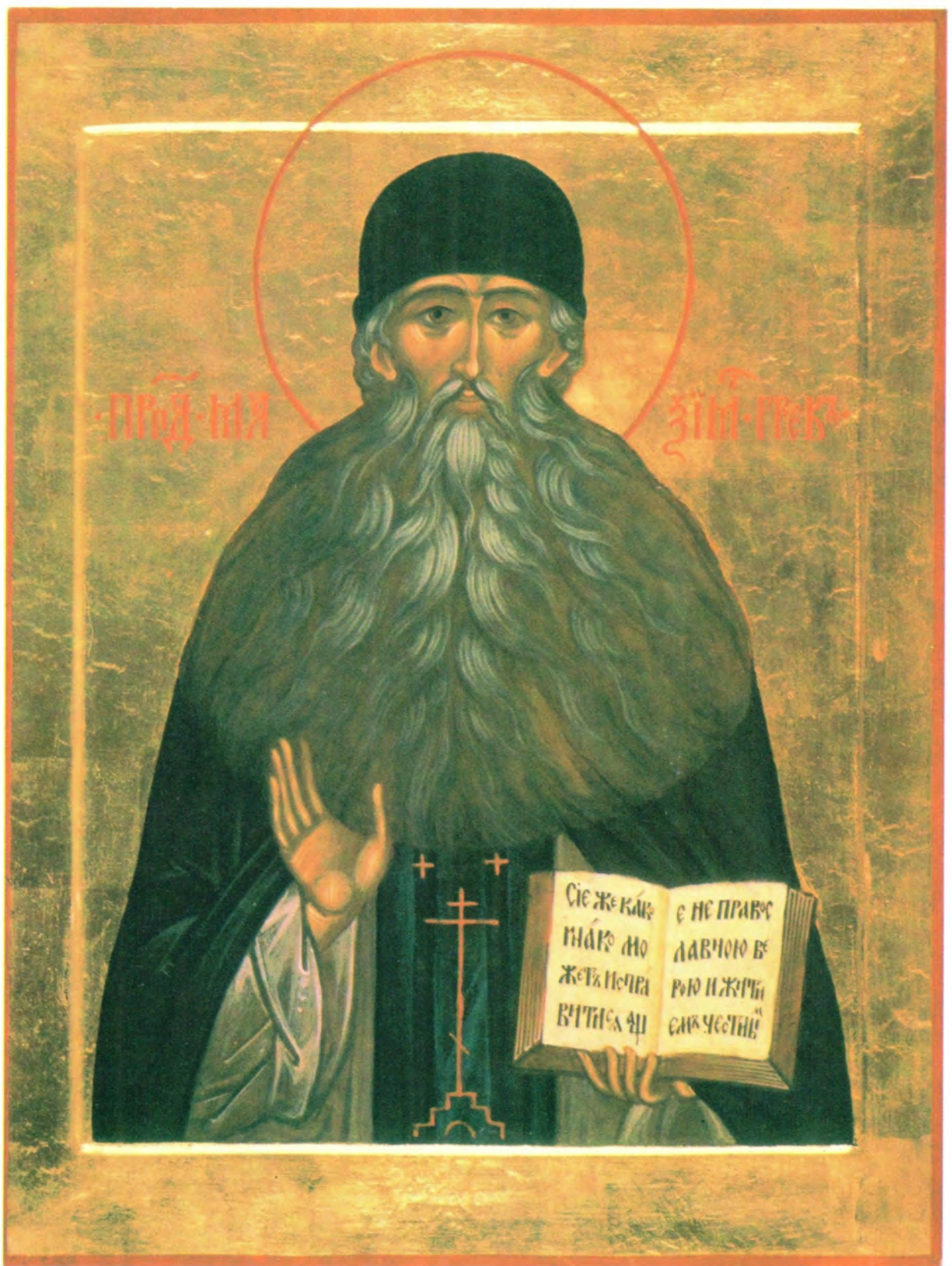
ПРЕПОДОБНЫЙ МАКСИМ ГРЕК

День памяти святого празднуется 21 января/3 февраля