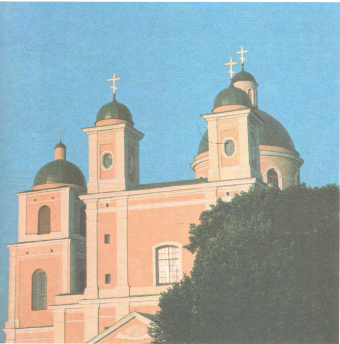
СОБОР СВЯТОГО ДУХА ВИЛЕНСКОГО МОНАСТЫРЯ