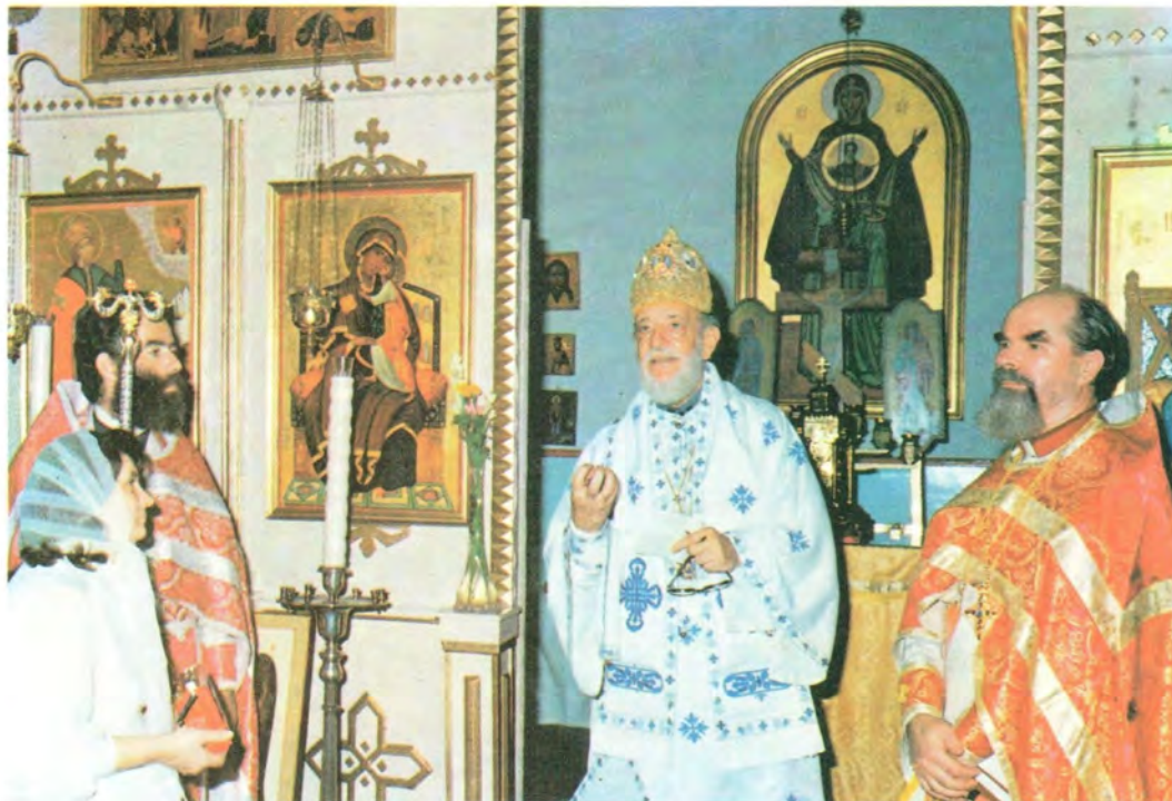
Блаженнейший Папа и Патриарх Александрийский и всей Африки Парфений III на праздновании 1000-летия Крещения Руси в Александро-Невском храме-подворье Русской Православной Церкви в Александрии