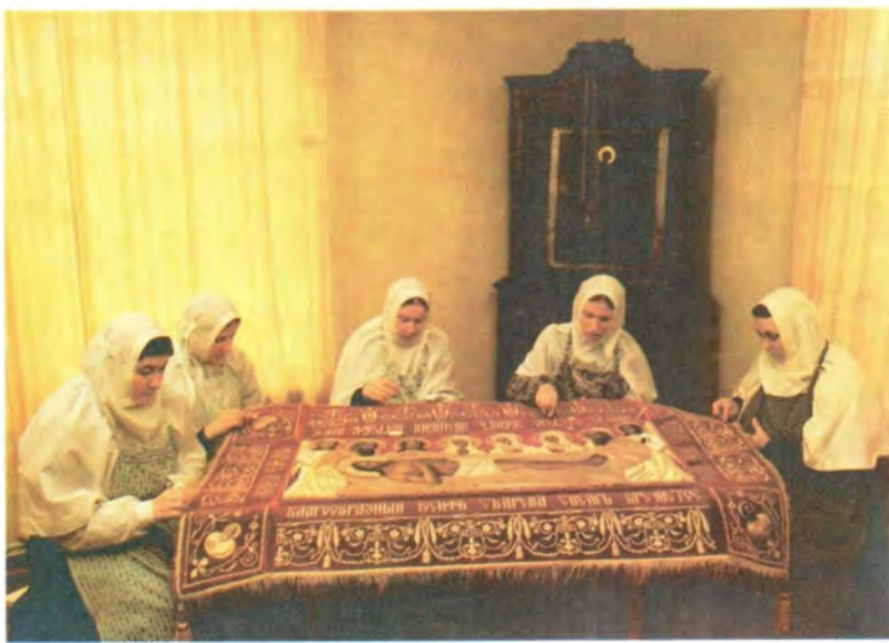
Вышивание Плашаницы в Пюхтицком женском монастыре

В ВЕЛИКИЙ ПЯТОК СТРАСТНОЙ СЕДМИЦЫ СВЯТАЯ ЦЕРКОВЬ МОЛИТВЕННО ВСПОМИНАЕТ РАСПЯТИЕ И ПОГРЕБЕНИЕ ХРИСТОВО. ИЗ АЛТАРЯ НА СРЕДИНУ ХРАМА ИЗНОСИТСЯ СВЯТАЯ ПЛАШАНИЦА — ПОГРЕБАЛЬНЫЕ ПЕЛЕНА ГОСПОДА НАШЕГО ИИСУСА ХРИСТА С ИЗОБРАЖЕНИЕМ СНЯТОГО СО КРЕСТА ПРЕЧИСТОГО ЕГО ТЕЛА. НАЧИНАЕТСЯ ПОКЛОНЕНИЕ И ЦЕЛОВАНИЕ СВЯТЫНИ