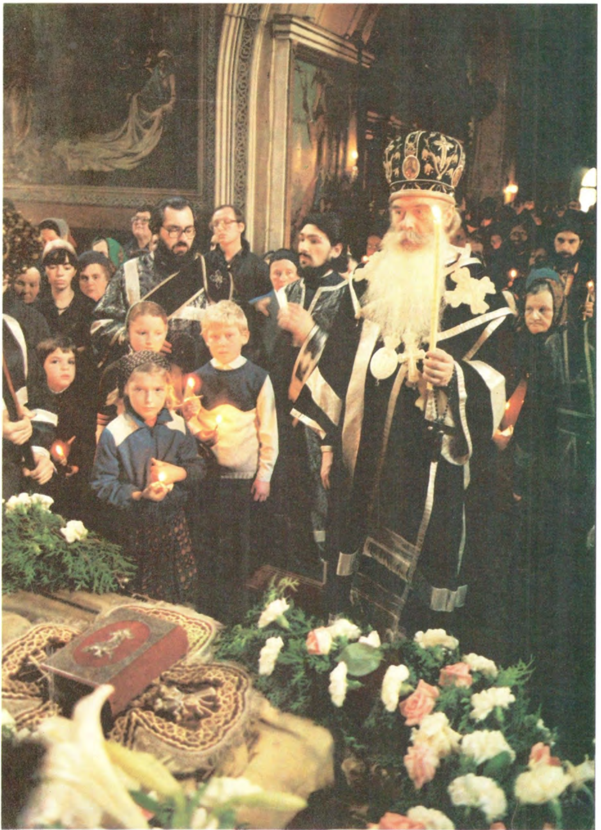
Митрополит Волоколамский и Юрьевский Пителирм перед Плащаницей во время пения умилительного канона «о распятии Господни и на плач Пресвятыя Богородицы» (творение Симеона Логофета)