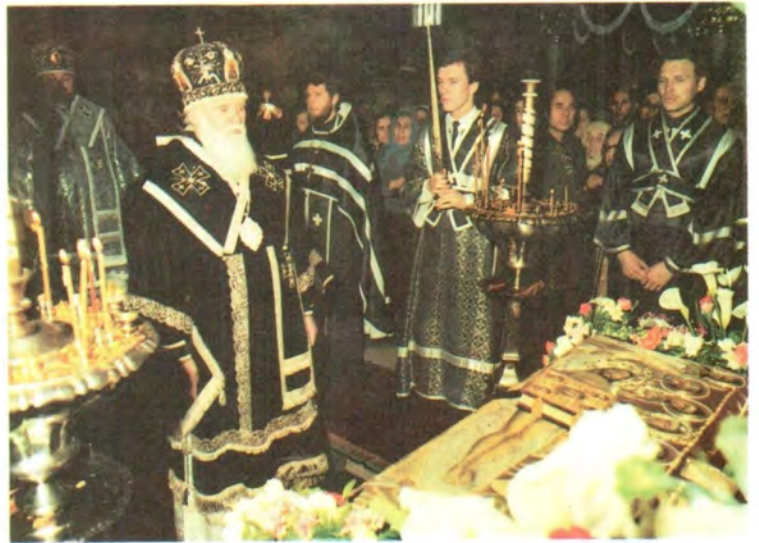
Плашанице предстоит митрополит Киевский и Галицкий Филарет, Патриарший Экзарх Украины

В ВЕЛИКИЙ ПЯТОК СТРАСТНОЙ СЕДМИЦЫ СВЯТАЯ ЦЕРКОВЬ МОЛИТВЕННО ВСПОМИНАЕТ РАСПЯТИЕ И ПОГРЕБЕНИЕ ХРИСТОВО. ИЗ АЛТАРЯ НА СРЕДИНУ ХРАМА ИЗНОСИТСЯ СВЯТАЯ ПЛАШАНИЦА — ПОГРЕБАЛЬНЫЕ ПЕЛЕНА ГОСПОДА НАШЕГО ИИСУСА ХРИСТА С ИЗОБРАЖЕНИЕМ СНЯТОГО СО КРЕСТА ПРЕЧИСТОГО ЕГО ТЕЛА. НАЧИНАЕТСЯ ПОКЛОНЕНИЕ И ЦЕЛОВАНИЕ СВЯТЫНИ