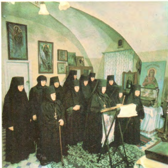
Сестры Виленского Маринского монастыря на молитве в домовом храме