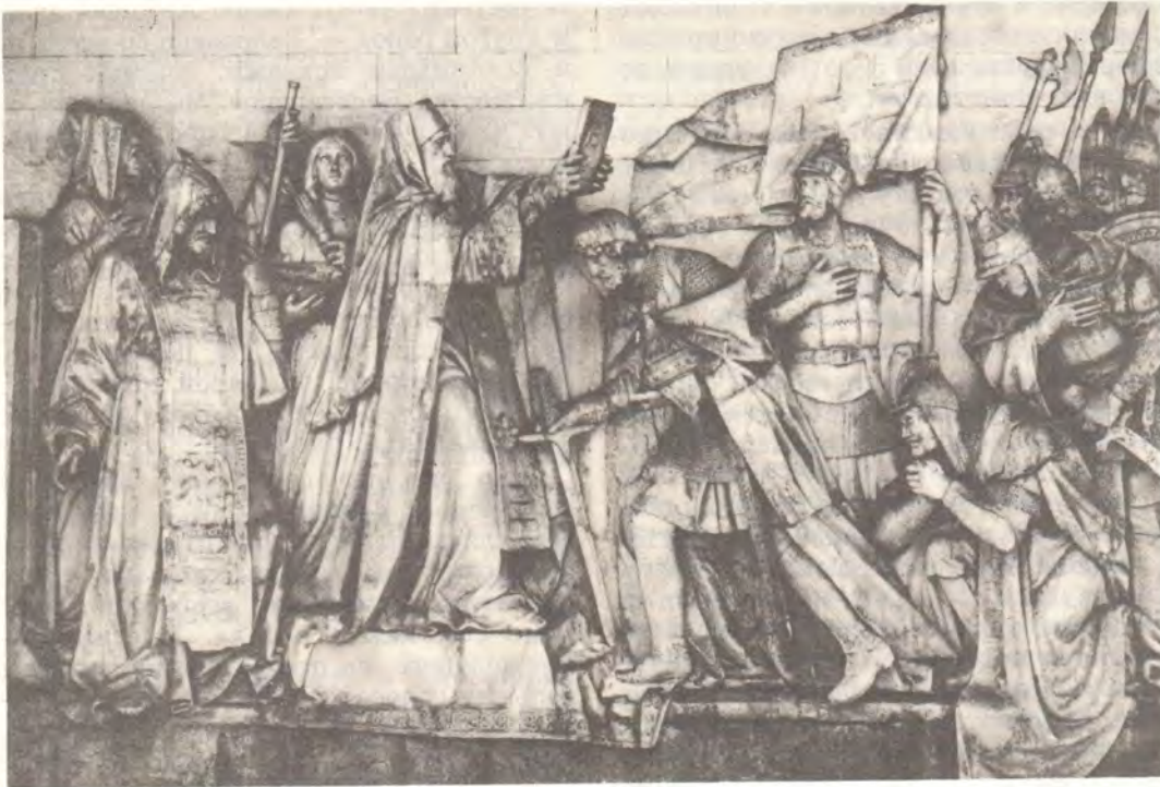
Преподобный Сергей Радонежский благословляет святого благоверного князя Дмитрия перед Куликовской битвой Горельеф из храма Христа Спасителя (Донской монастырь в Москве)

Еще дерзну безупречно рассказать о жизни великого князя и царя русского Дмитрия Иоанновича, да, услышав это, цари и князи научатся так же творить. Он от юности Бога возлюбил и к духовным прилежал делам, хотя не был хорошо обучен книгам, но духовные книги в сердце своем держал. И это единое поведаем о жизни его: тело свое честно сохранил до женитьбы, как и Церковь Святому Духу соблюл нескверную, очами глядя часто в землю, от нее же взят был, а душу и ум простирал к Небу, где ему прекрасно пребывать. И после брака тело свое чисто соблюдал, непричастно греху.