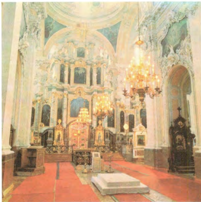
Внутренний вид Свято-Духова собора Виленского монастыря. Главный иконостас