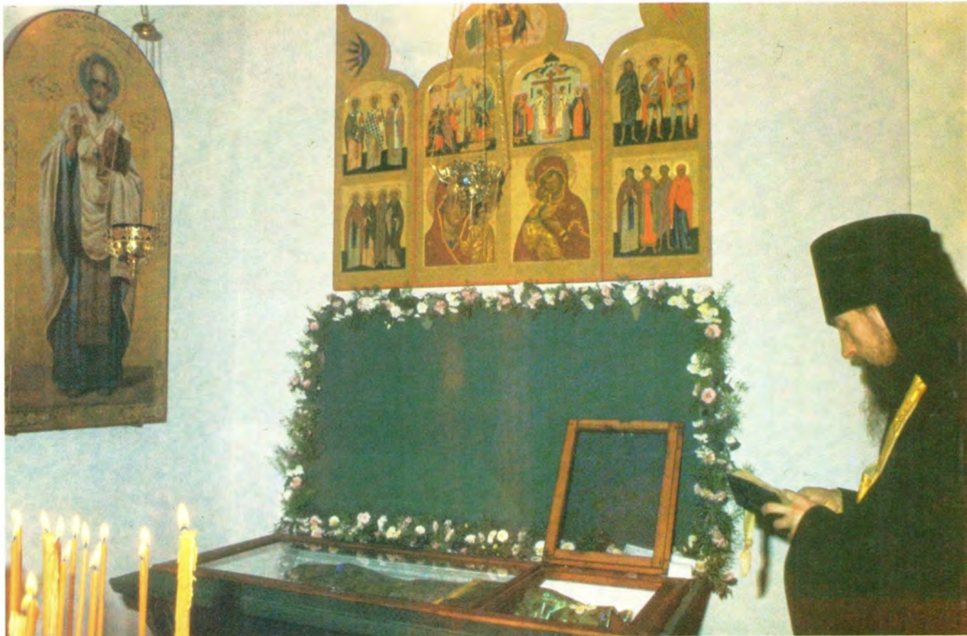
Не престаю́т моли́твенно́я у раки с мо́щами преподо́бнаго Амвро́сия Опти́нскаго