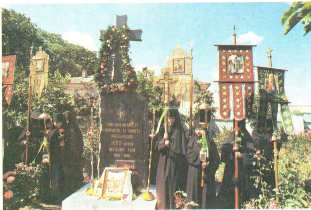
Крест, сооруженный в память празднования 1000-летия Крещения Руси в Свято-Троицком Корецком женском монастыре