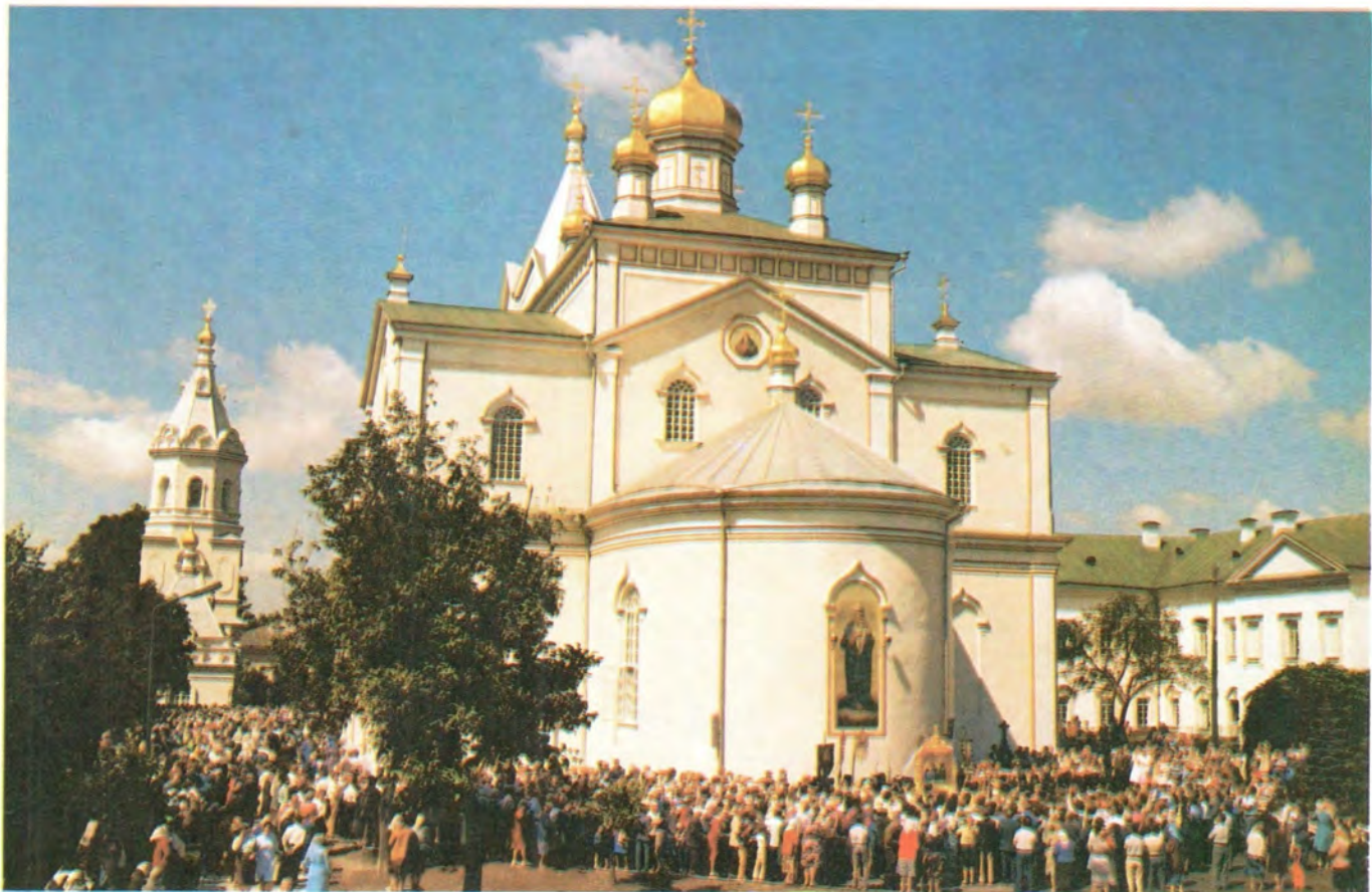
Во дворе Корецкого монастыря в дни юбилея