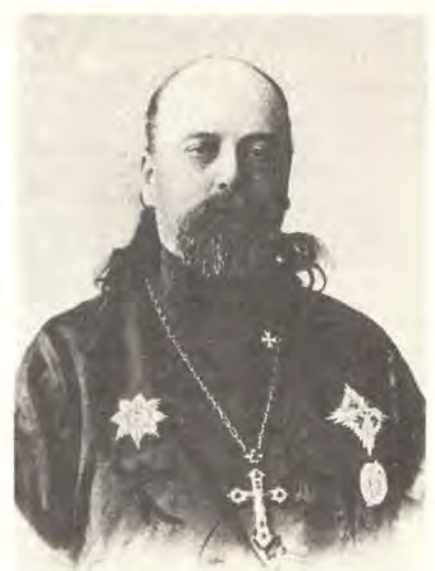
Архимандрит Серафим (Чичагов), автор Летописи Серафимо-Дивеевского монастыря

и теперь умирает. И в действительности это произошло, и я служил по блаженной Прасковии первую панихиду.