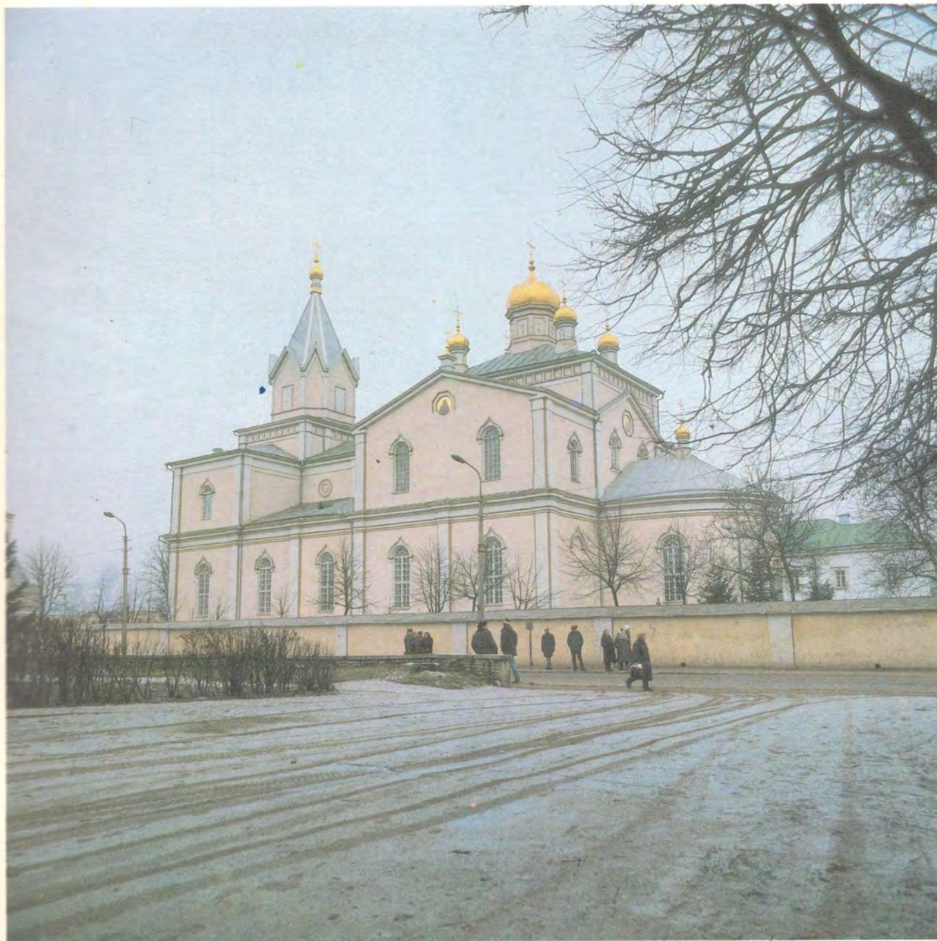
СВЯТО-ТРОИЦКИЙ КОРЕЦКИЙ ЖЕНСКИЙ МОНАСТЫРЬ