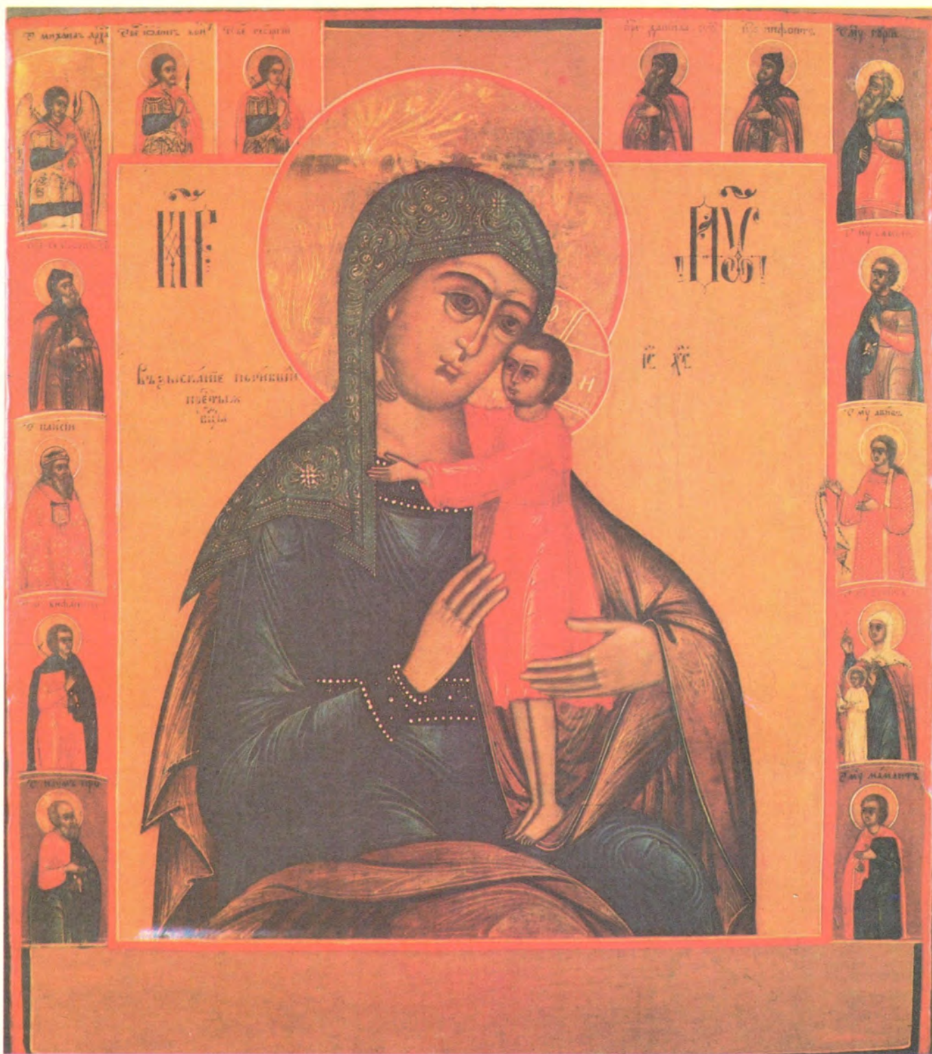
ИКОНА БОЖИЕЙ МАТЕРИ «ВЗЫСКАНИЕ ПОГИБШИХ»