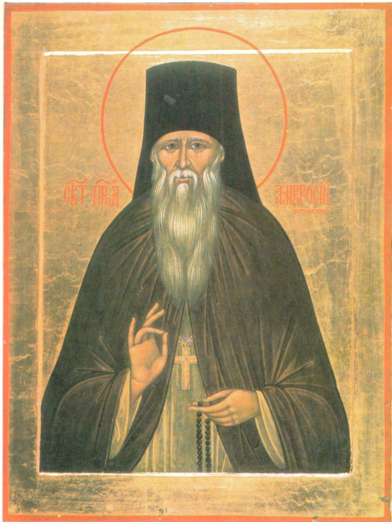
ПРЕПОДОБНЫЙ АМВРОСИЙ ОПТИНСКИЙ