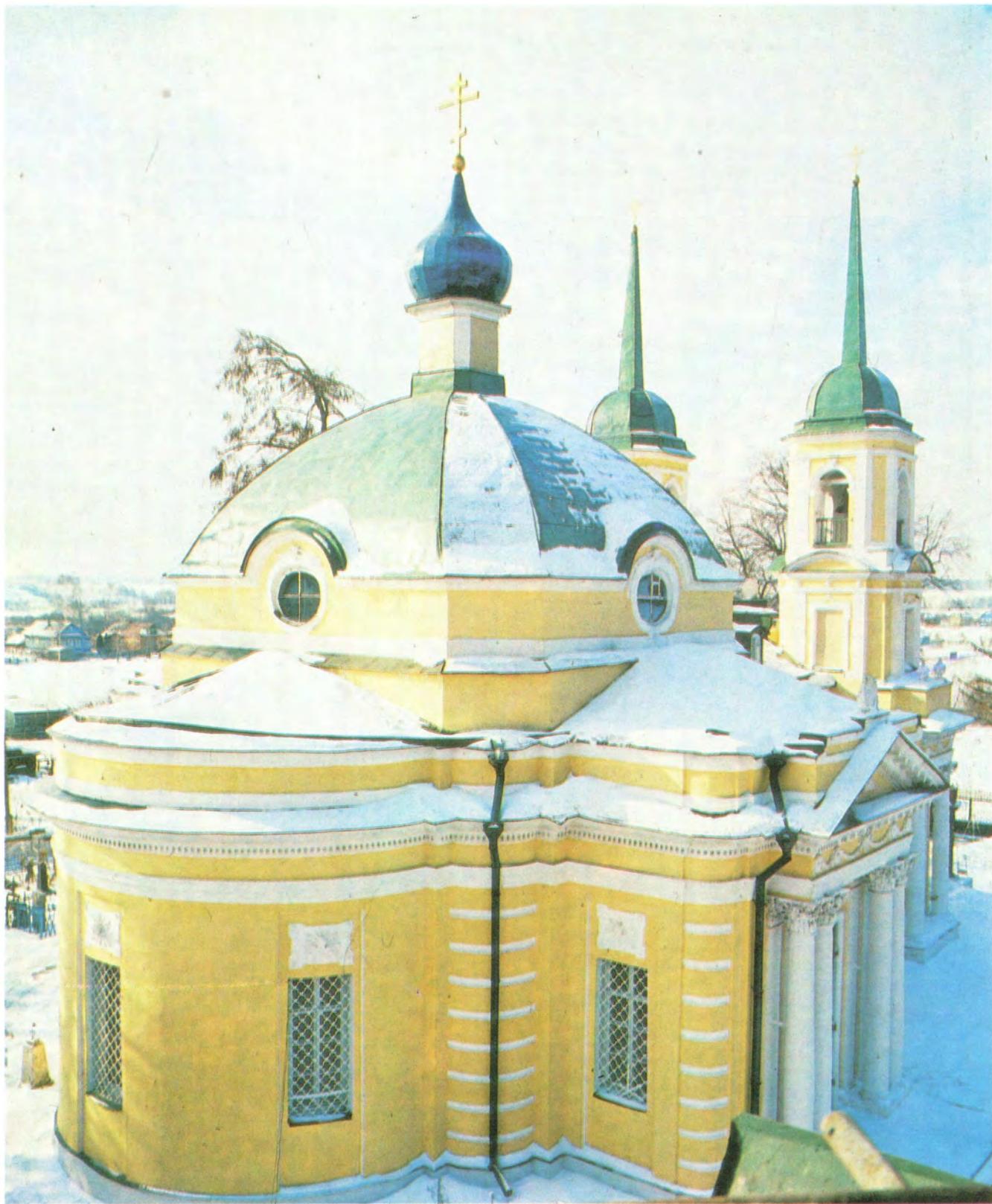
Храм Святой Троицы в подмосковном селе Павлино (см. статью в номере)