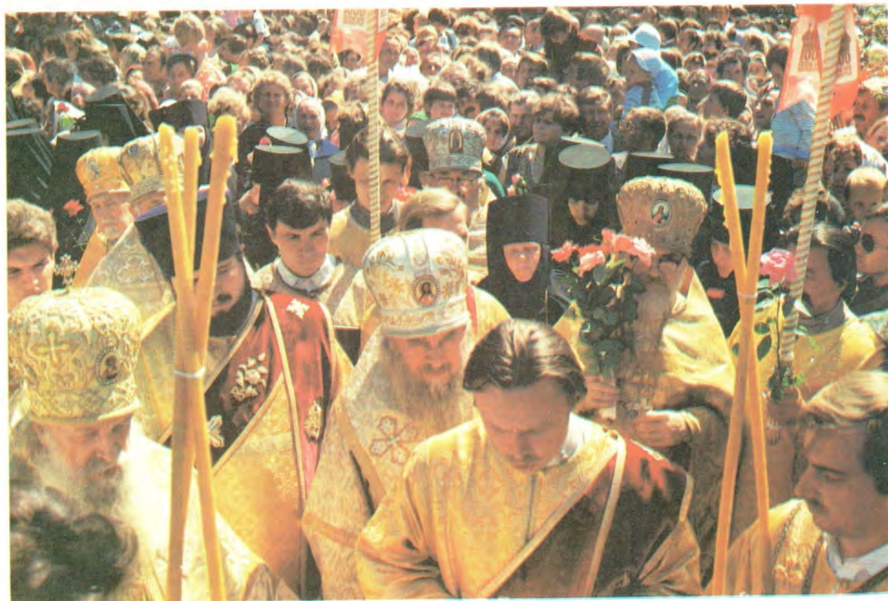
Крестный ход в Корецкой обители во время юбилейных торжеств