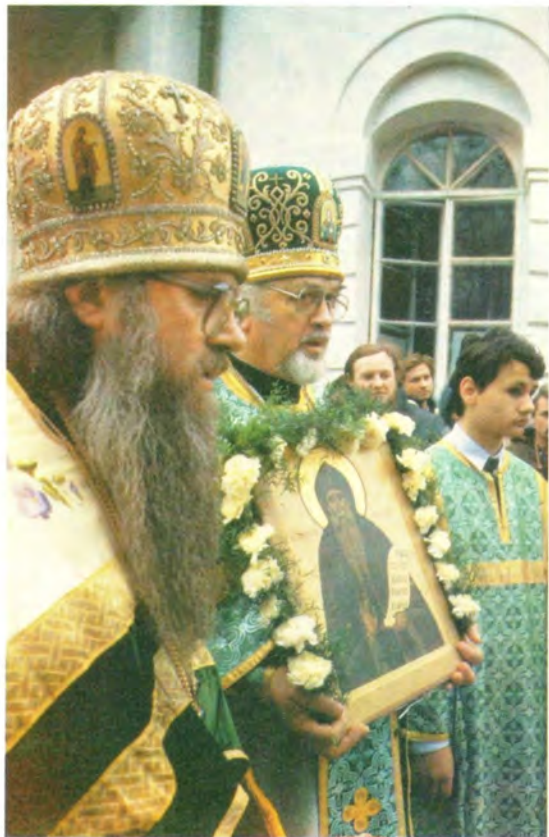
Около двух часов длилось богослужение на монастырской площади