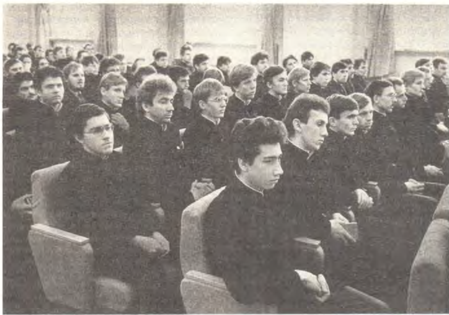
В Большом актовом зале

Покрова Богоматери усугубляет нашу радость от только что пережитого торжественного празднования великого юбилея нашей Русской Православной Церкви — Тысячелетия Крещения Руси, которое перешло церковные границы и было широко отмечено в нашей стране и за рубежом.