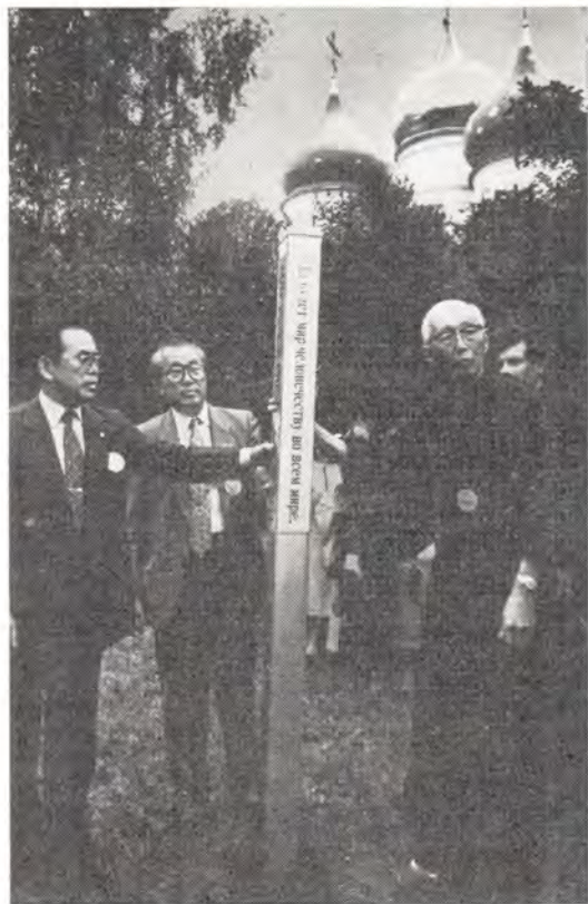
Члены японской ассоциации «За мир во всем мире через молитву» устанавливают памятную «стелу мира» в саду Московской Духовной Академии