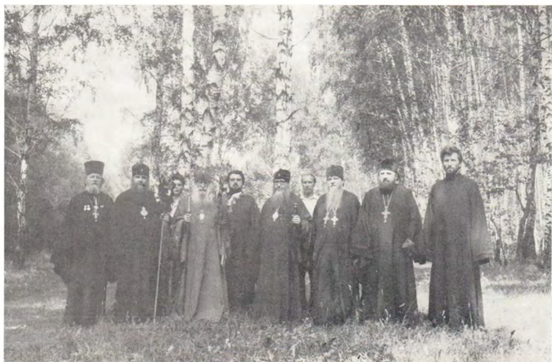
Встреча участников празднования на границе Орловской области