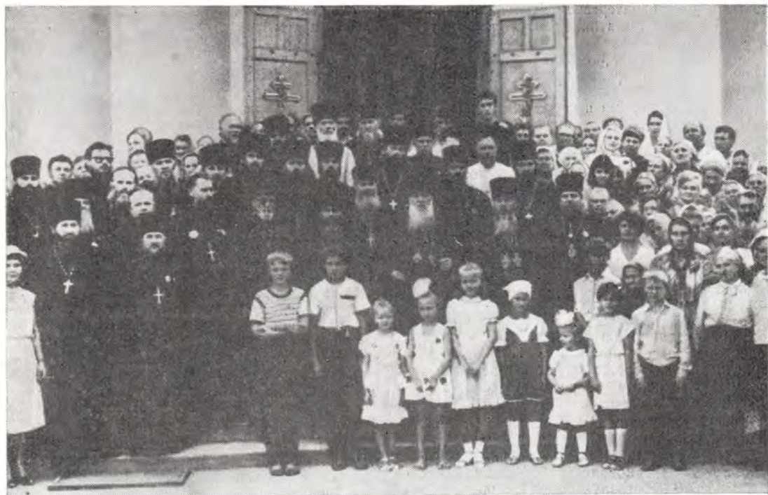
Участники и гости празднования 1000-летия Крещения Руси в Симферопольской епархии у Свято-Троицкого кафедрального собора в г. Симферополе 28 июля 1988 года

нощное бдение, которое возглавил архиепископ Симферопольский и Крымский Леонтий. Напевами Киево-Печерской Лавры, болгарским и Оптиной пустыни соборный хор исполнил стихиры службы Крещению Руси, молитвенно и торжественно прозвучали исполненные духовенством величания Пресвятой Троице, Пресвятой Богородице, всем русским святым, равноапостольному князю Владимиру.