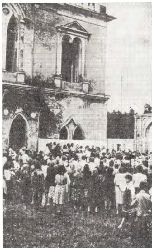
Во время молебна у Никольского храма в Ржавках