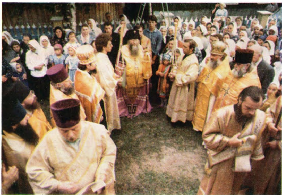
Торжества возглавил архиепископ Рязанский и Касимовский Симон

Рака с мощами Вышенского подвижника в освященном в его честь приделе Сергиевского храма села Эммануилвка Рязанской епархии