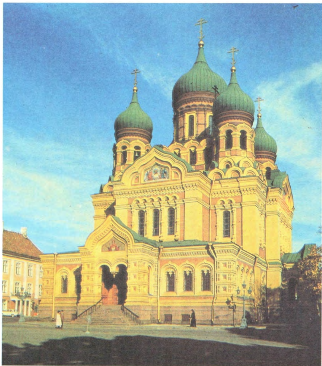
Собор во имя святого благоверного князя Александра Невского в Таллине, построен в 1900 году