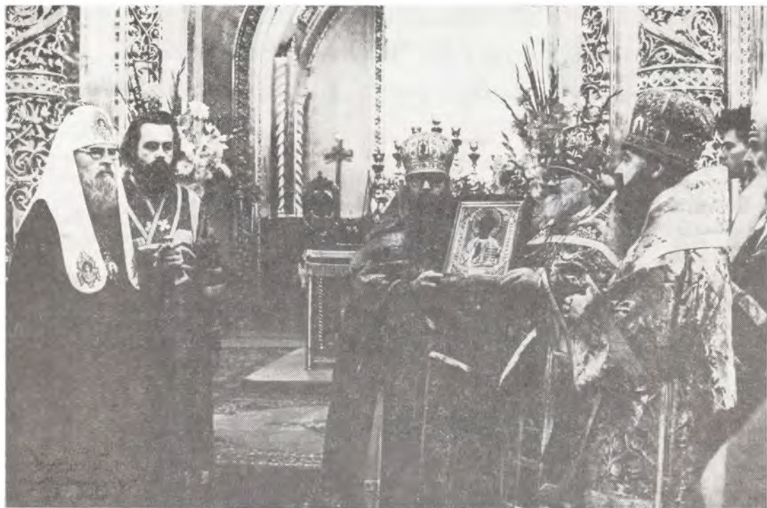
Святейшего Патриарха Пимена поздравляет с днем тезоименитства митрополит Крутицкий и Коломенский Ювеналий в Богоявленском патриаршем соборе 9 сентября 1988 года

какой-то подарок, то что можем мы, Ваши духовные дети, сегодня, в светлый день Ваших именин, преподнести Вам?