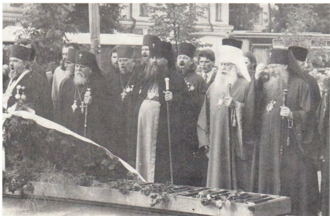
У памятника павшим воинам