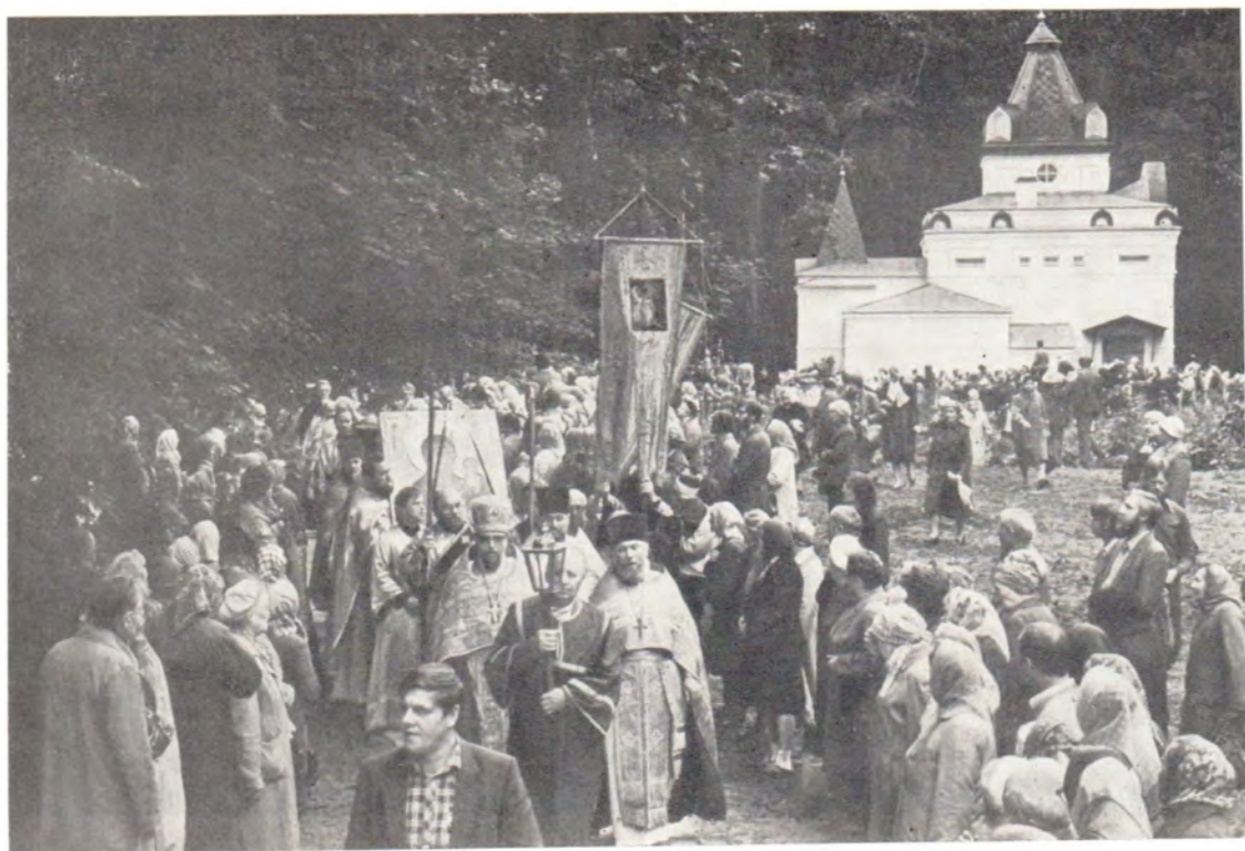
Множество верующих приняли участие в торжествах