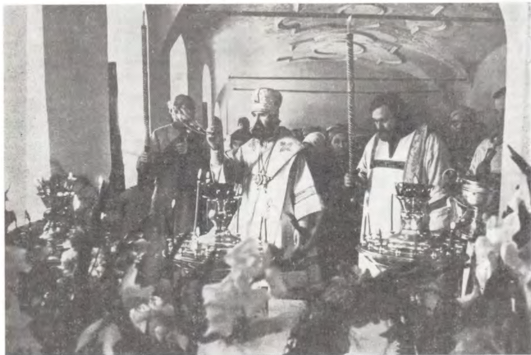
Архиепископ Ярославский и Ростовский Платон совершает богослужение в Толгской обители 29 июля 1988 года

— До сих пор у нас была лишь временная церковь в здании бывшей монастырской гос-