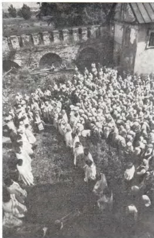
Молебен в монастырской ограде

тиницы, — рассказал архиепископ Платон. — Теперь мы имеем храм в исторических стенах обители. На восстановлении монастыря сейчас работает около 40 рабочих, из них — 10 местные жители (из поселка Толга). Они завершают восстановление Спасской церкви и продолжают работать на Спасском корпусе, куда сестры вскоре смогут переселиться из монастырской гостиницы. Затем будем восстанавливать Никольский архиерейский корпус с домовою церковью Святителя Николая, после чего займемся Введенским собором. Думаю, года через 3—4 в нем можно будет совершать богослужения. Восстанавливать Толгскую обитель помогают верующие всех епархий. Многие приезжают работать бесплатно. Они очистили территорию монастыря от многолетнего мусора, построили временные помещения: столовую для рабочих и паломников, склады. Устроен огород, очищен пруд — в него уже пустили карасей. Помогают нам и деньгами. От Горьковской епархии — первой — мы получили 100 тысяч рублей. Троице-Сергиева Лавра выделила дефицитную кровельную медь. Из необходимых для восстановления монастыря 14 миллионов рублей собран сейчас один миллион сто тысяч.