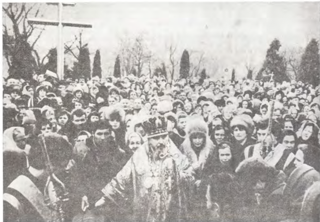
Митрополит Львовский и Тернопольский Никодим совершает крестный ход вокруг Крестовоздвиженского храма в с. Берездовцы 6 марта 1988 года

За богослужениями в храмах епархии Высокопреосвященный Никодим поздравлял верующих с юбилеем 1000-летия Крещения Руси, в проповедях он освещал исторический путь Православия на Галицкой земле, говорил о великом братстве и единстве, к которому всегда стремились наши предки-славяне. Архипастырь призывал беречь православную веру, до-