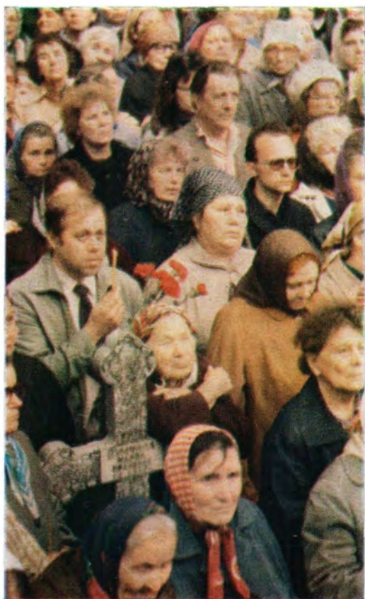
Тысячи молящихся собрались перед часовней блаженной Ксении на Смоленском кладбище