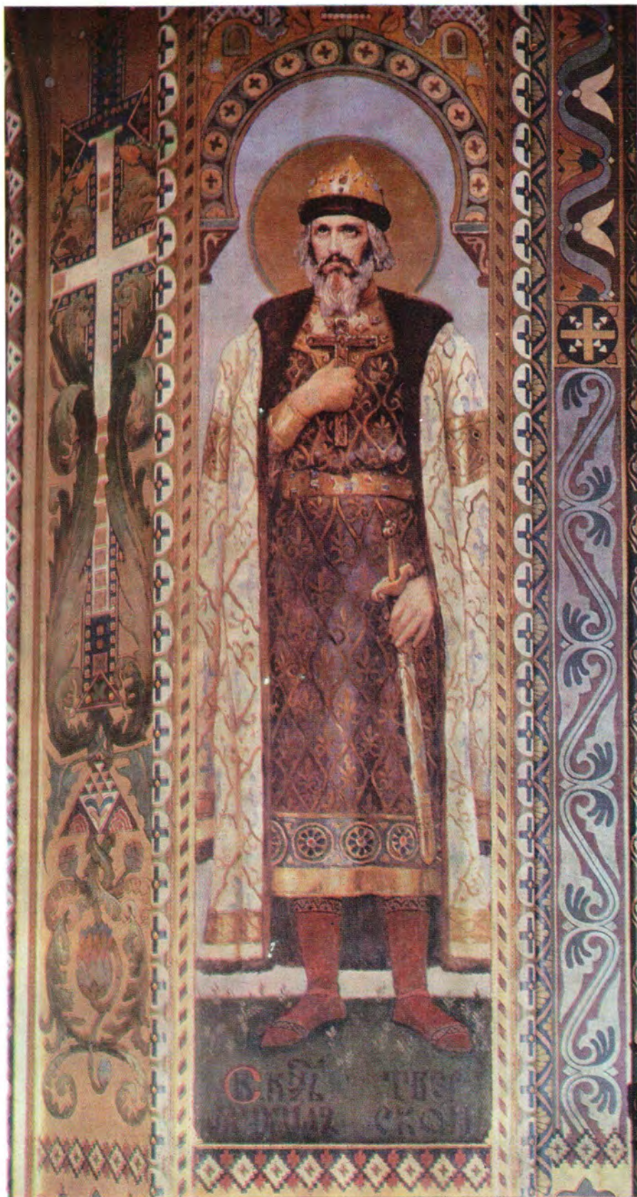
СВЯТОЙ БЛАГОВЕРНЫЙ КНЯЗЬ МИХАИЛ ТВЕРСКОЙ

Роспись В. М. Васнецова во Владимирском соборе в Киеве