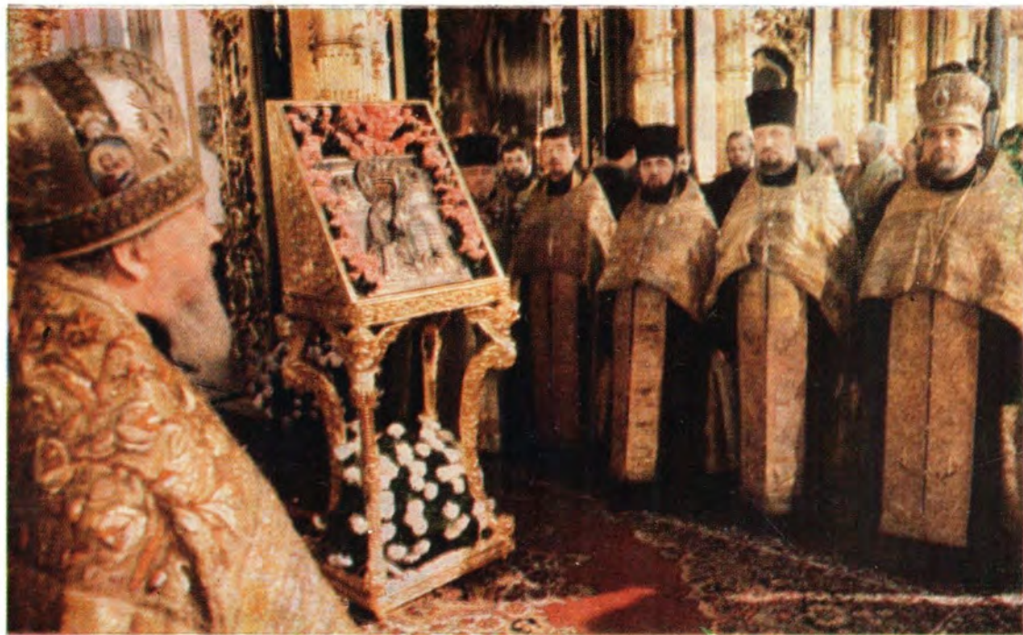
Молебен перед образом Святителя Николая в Николо-Богоявленском соборе 14 июня