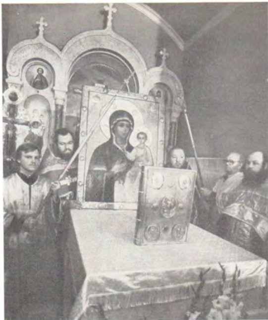
Молебен перед Смоленской иконой Божией Матери у могилы блаженной Ксении