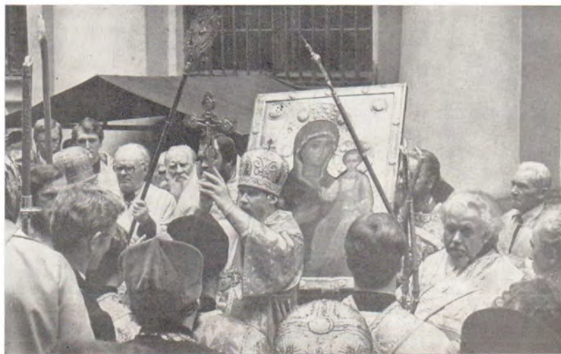
Митрополит Алексий освящает верующих крестом