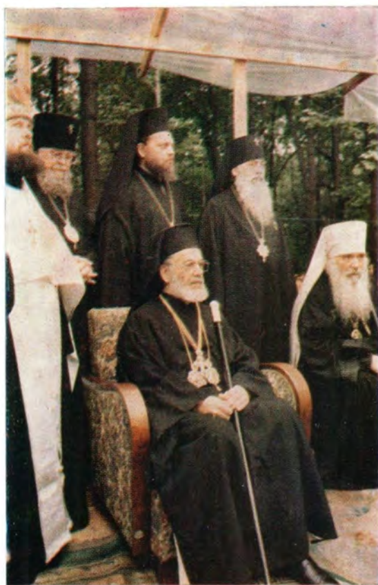
Блаженнейший Патриарх Антиохийский и всего Востока Игнатий IV и Блаженнейший Митрополит Варшавский и всей Польши Василий — почетные гости Русской Православной Церкви