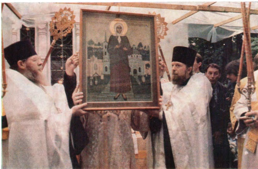
Во время освящения иконы блаженной Ксении Петербургской