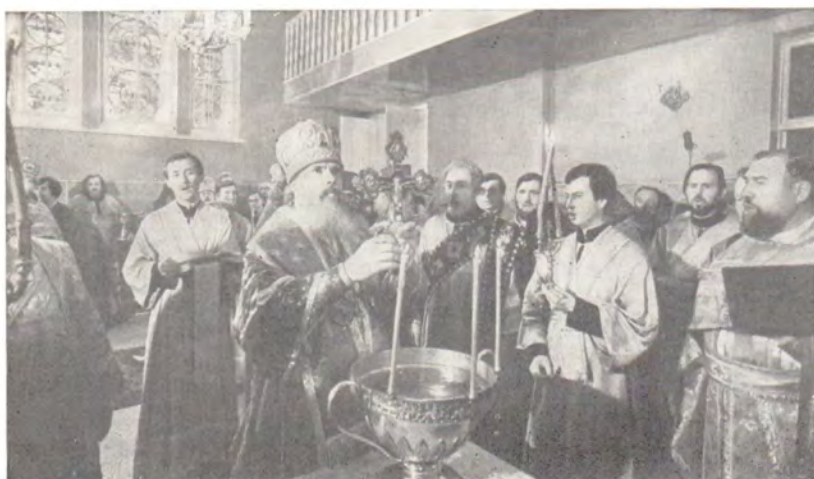
Водосвятный молебен перед освящением часовни возглавил митрополит Ленинградский и Таллинский Алексий