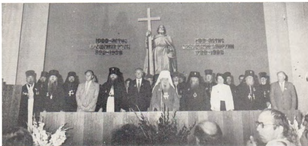
Открытие торжественного акта