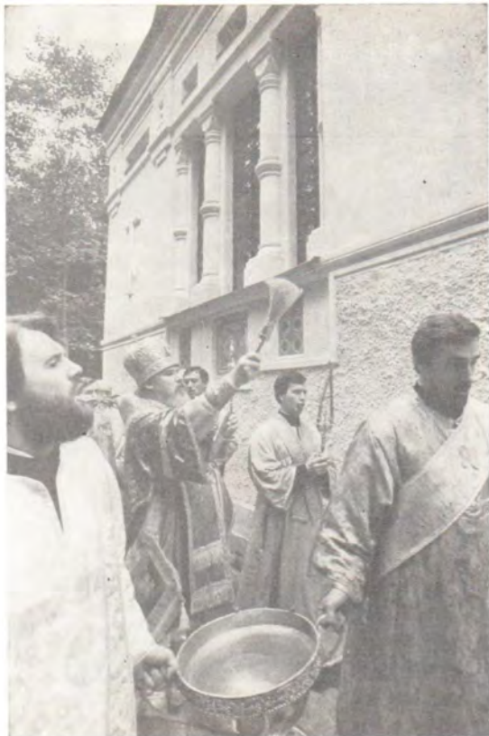
Митрополит Алексей совершает освящение часовни