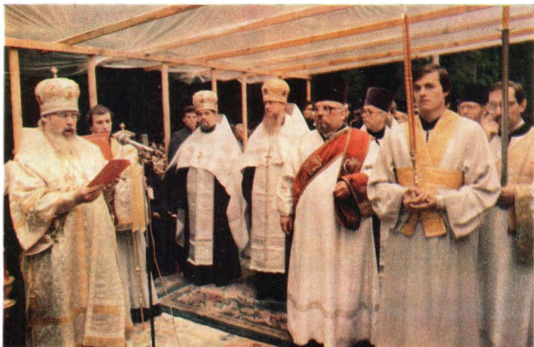
Молебен у часовни блаженной Ксении на Смоленском кладбище стал главным событием первого дня торжеств