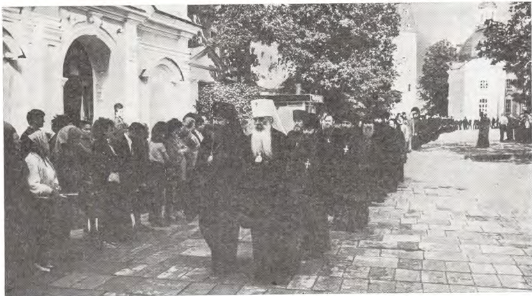
Традиционное шествие на молебен к Преподобному Сергию в Троицкий собор 1 сентября 1988 года