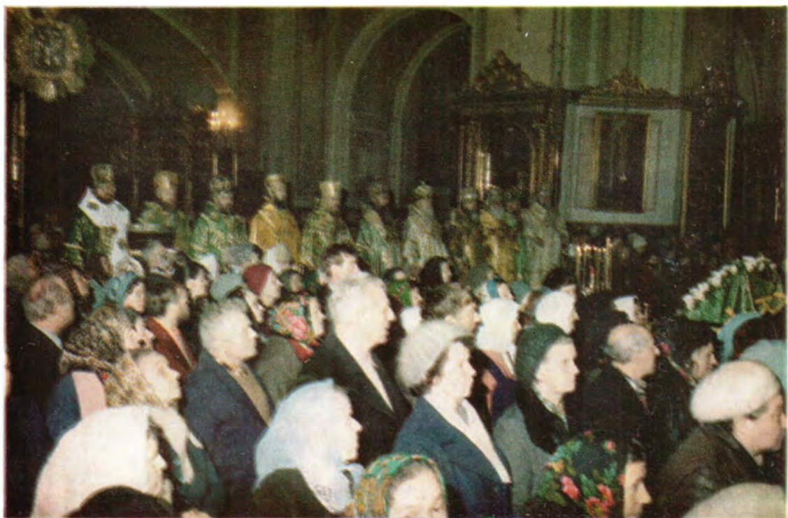
Во время Божественной литургии