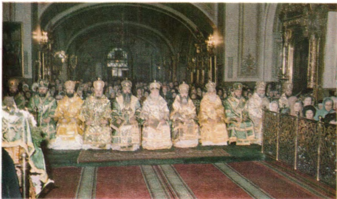
Божественную литургию в Богоявленском патриаршем соборе в день празднования совершают Преосвященные архиереи