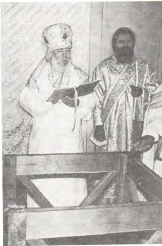
Архиепископ Куйбышевский и Сызранский Иоанн освящает престол в Казанском храме в г. Тольятти

Иоанна было совершено освящение нового здания и в нем начались богослужения, в то же время продолжались строительные работы, которые были завершены к августу 1987 года.