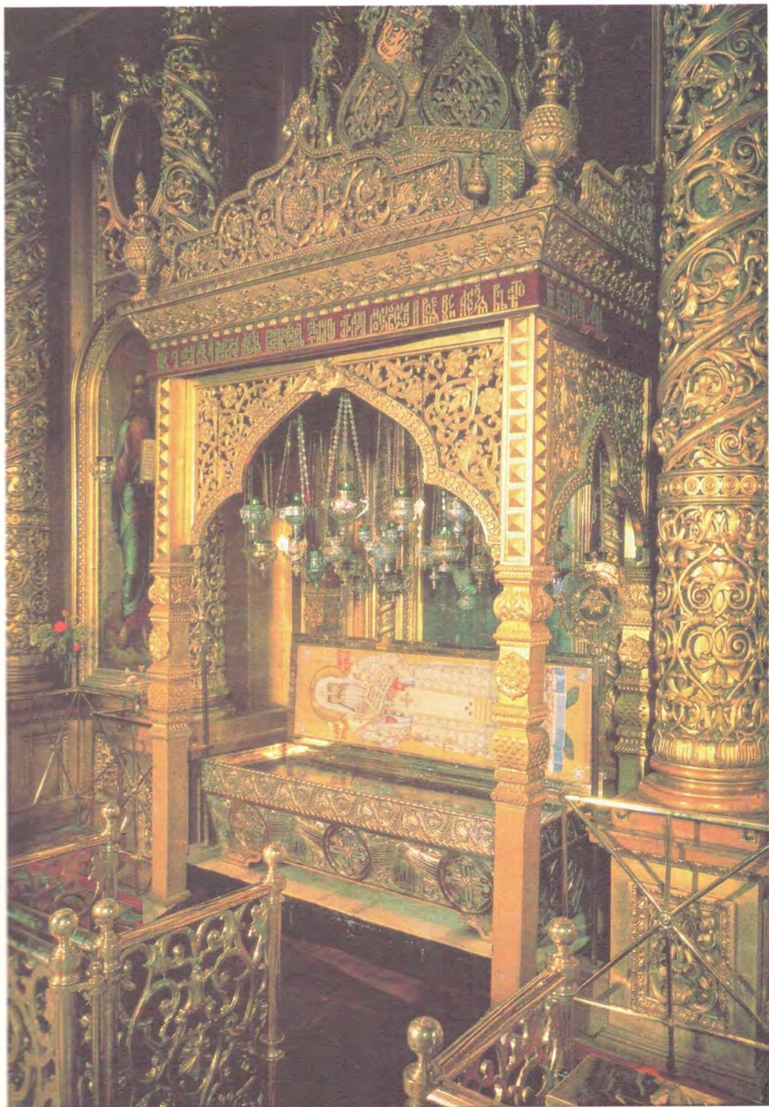
РАКА С МОЩАМИ СВЯТИТЕЛЯ МОСКОВСКОГО АЛЕКСИЯ В БОГОЯВЛЕНКОМ ПАТРИАРШЕМ СОБОРЕ В МОСКВЕ