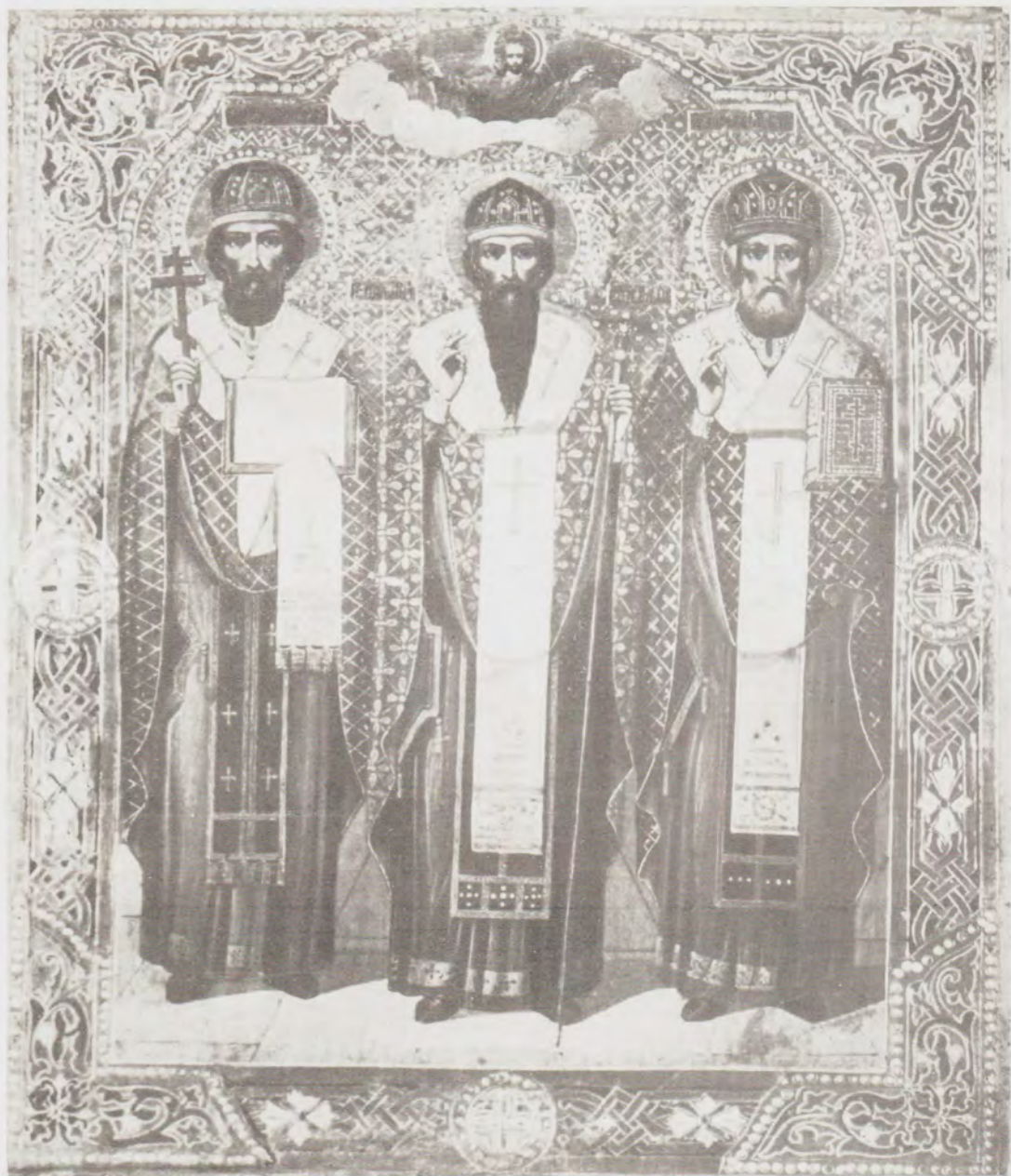
СВЯТИТЕЛИ ГЕРАСИМ, ПИТИРИМ, ИОНА, ЕПИСКОПЫ ВЕЛИКОПЕРМСКИЕ И УСТЬ-ВЫМСКИЕ