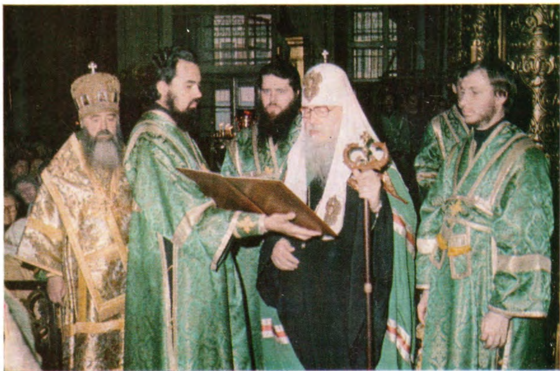
Святейший Патриарх Пимен произносит ответное слово