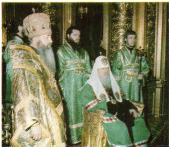
Святейший Патриарх Пимен принимает поздравление Священного Синода