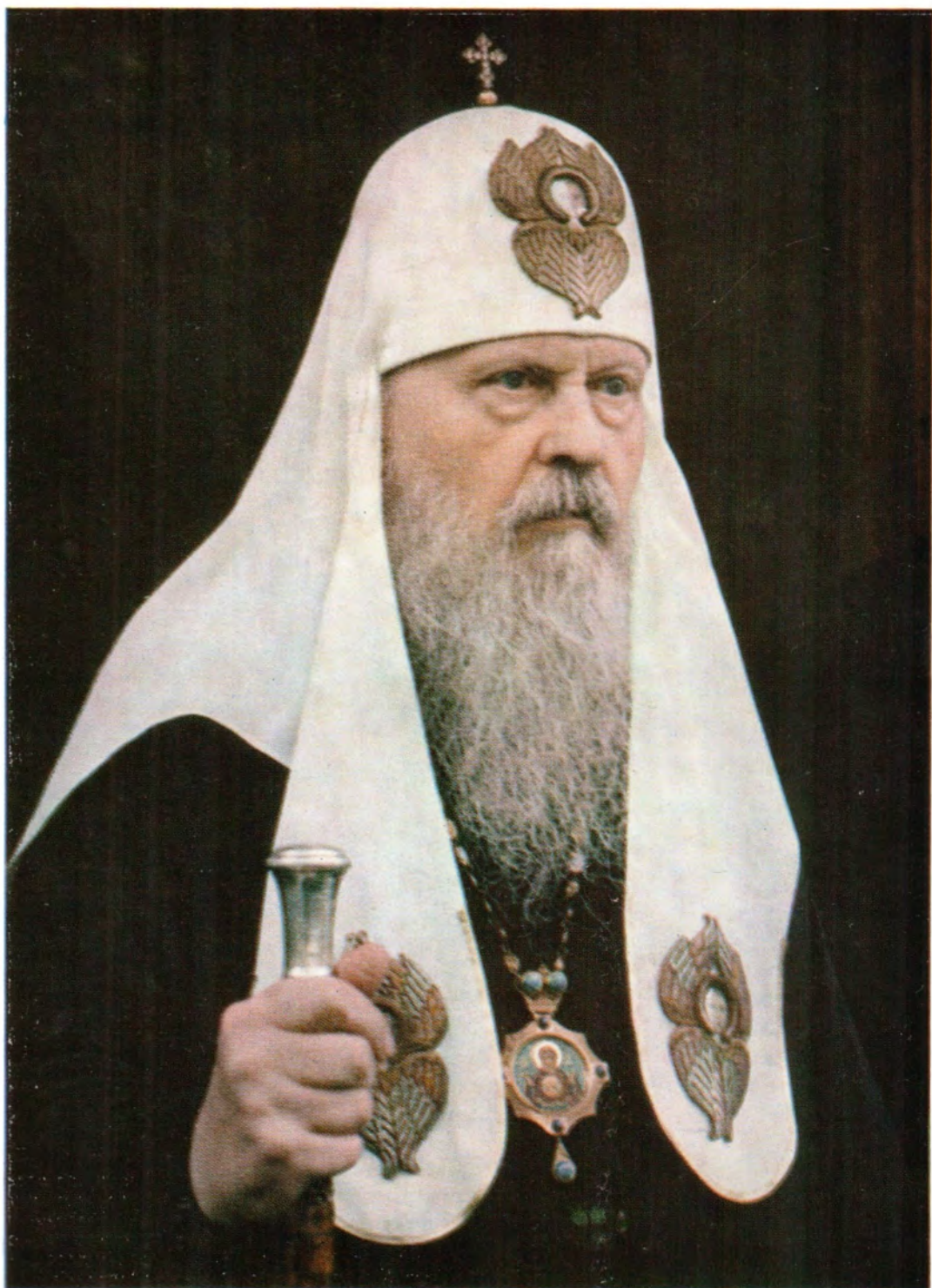
Святейший Патриарх Московский и всея Руси Пимен