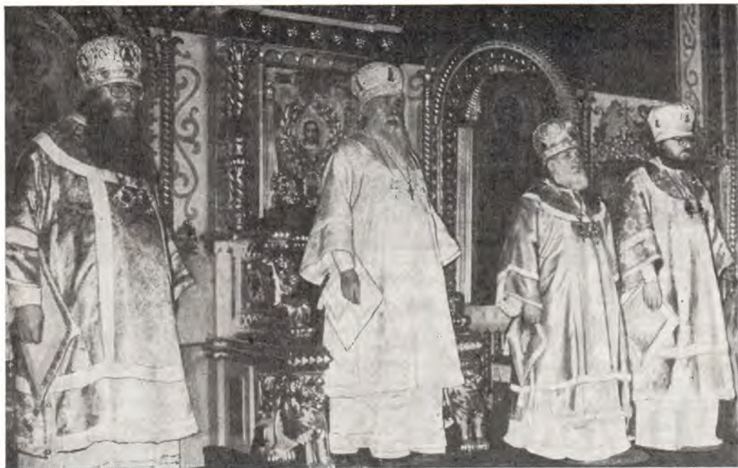
За Божественной литургией в Успенском кафедральном соборе 14 октября 1987 года