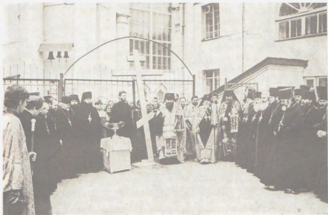
Освящение креста для соборной колокольни