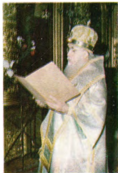
Приветственный адрес оглашает митрополит Одесский и Херсонский Сергей