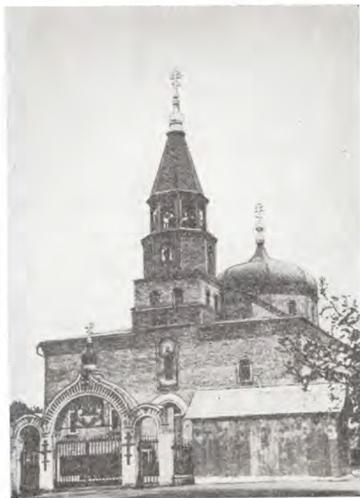
Казанский храм в г. Тольятти

В 1985 году по благословию архиепископа Иоанна и с разрешения городских властей в течение пяти месяцев вместо деревянного молитвенного дома усердием верующих был построен кирпичный храм, увенчанный голубыми куполами с позолоченными крестами. Внутренний вид храма отличается благолепием и красотой. Художественно выполнены резной иконостас, стенная роспись. Новые панно освещают храм. Во время строительства богослужения ни на день не прекращались и совершались в крестильном помещении. После того как были возведены стены и устроено перекрытие, по благословию Высокопреосвященного