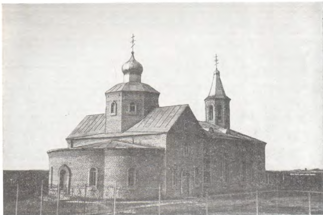
Покровский храм в с. Средняя Ахтуба