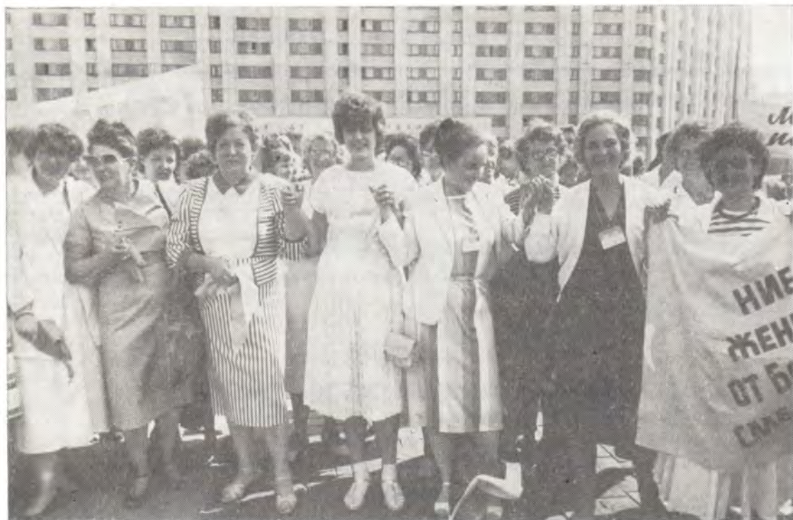
Участницы Всемирного конгресса на Марше мира в Москве

нация в Западных странах, профсоюзное движение и так далее.