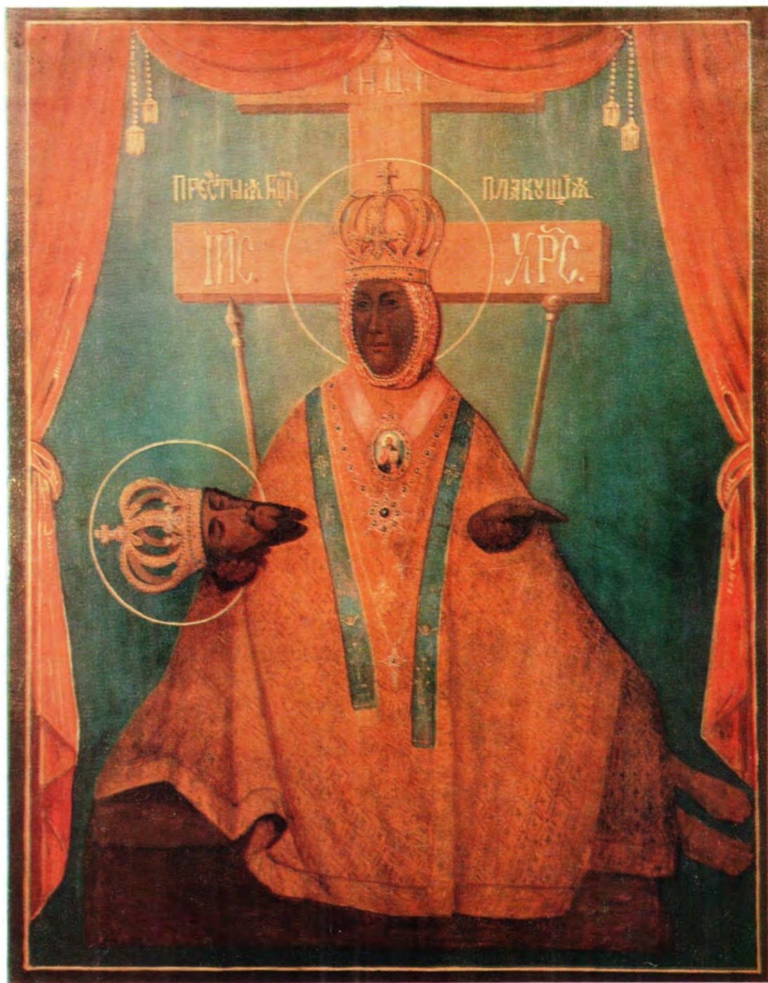
ИКОНА ПРЕСВЯТОЙ БОГОРОДИЦЫ «ПЛАКУЩАЯ»

конца XVIII — начала XIX века из Успенского храма в с. Шубино Домодедовского района Московской области