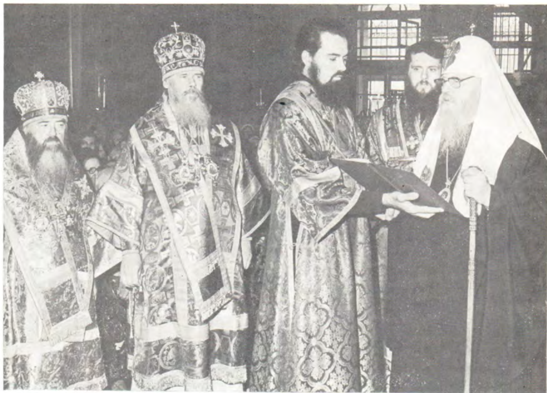
Святейший Патриарх Пимен отвечает на приветствие митрополита Сергия