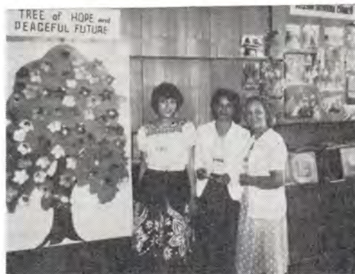
Представительницы Русской Православной Церкви на выставке, открытой для участниц Всемирного конгресса женщин в Москве

В ходе заседания также отмечалась необходимость обуздания гонки вооружений, недопустимость размещения новых военных систем в космосе. Делегаты религиозной группы заявили о своей решимости не только обсу-