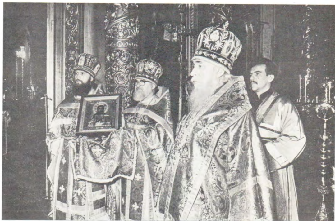
Митрополит Одесский и Херсонский Сергий поздравляет Святейшего Патриарха Пимена с днем Ангела