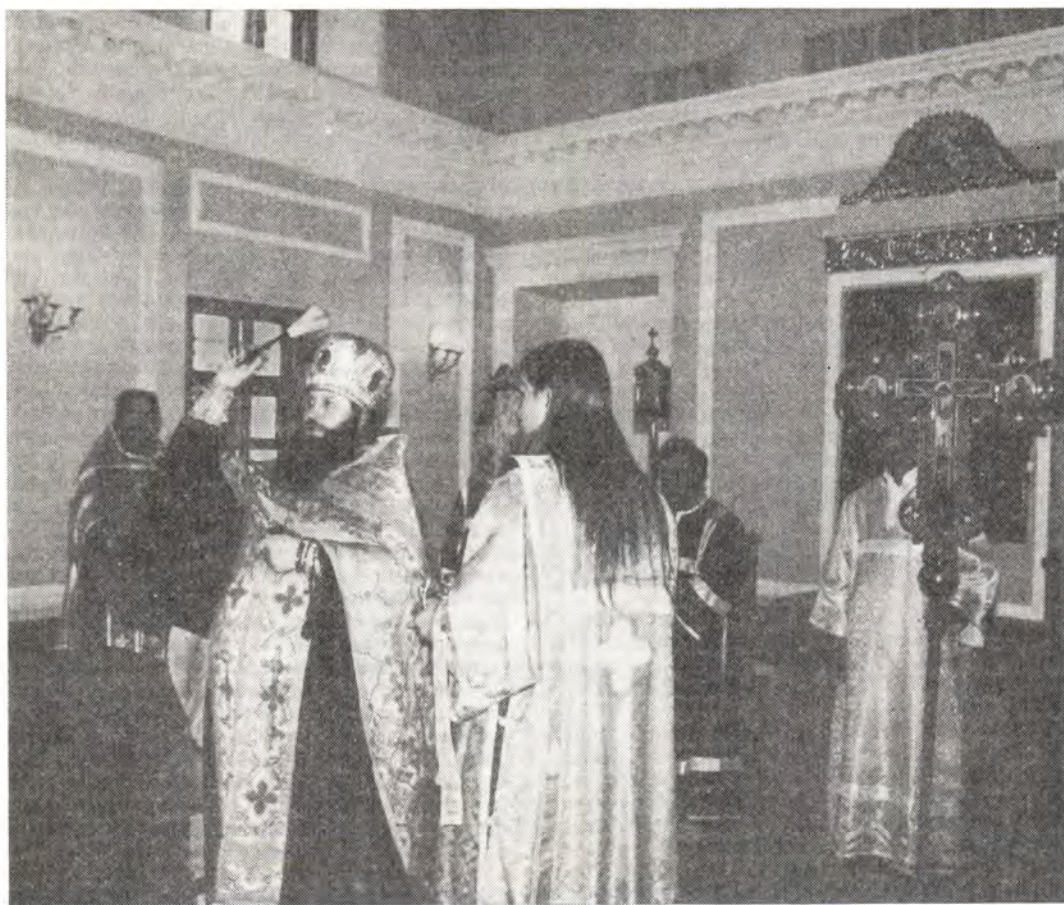
Наместник Московского Данилова монастыря архимандрит Тихон освящает новую монастырскую трапезную

14 августа 1987 года, в день празднования Происхождения (Изнесения) честных древ Животворящего Креста Господня, по благословению Святейшего Патриарха Пимена в Московском Даниловом монастыре состоялось освящение вновь сооруженной братской трапезной. По окончании Божественной литургии в Троицком соборе и молебна с водоосвящением на монастырской площади наместник монастыря архимандрит Тихон с братией в помещении новой трапезной совершили чин освящения ее, окропив святой водой трапезный зал, помещения кухни, складов и подсобные помещения. В этот же день, в 13 часов, состоялся первый обед в новой трапезной, на котором вместе с братией присутствовали инженеры, архитекторы, рабочие, потрудившиеся при ее строительстве. Поздравляя братию и тружеников обители с успешным окончанием очередного этапа реставрации монастыря, архимандрит Тихон сердечно поблагодарил всех, трудом или молитвой