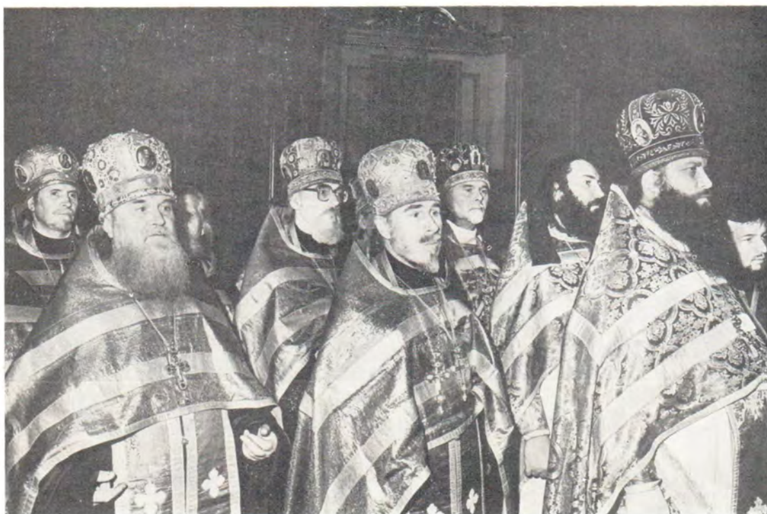
Клирики Москвы во время поздравления Святейшего Патриарха Пимена в Богоявленском патриаршем соборе