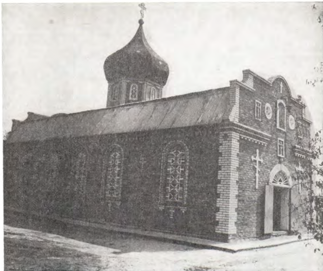
Георгиевский храм в селе Кулишовке Азовского района Ростовской области