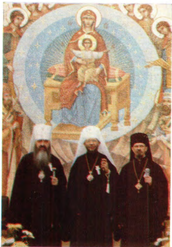
Блаженнейший Архиепископ Вашингтонский Митрополит всей Америки и Канады Феодосий митрополит Ювеналий и епископ Филадельфийский Герман на территории монастыря