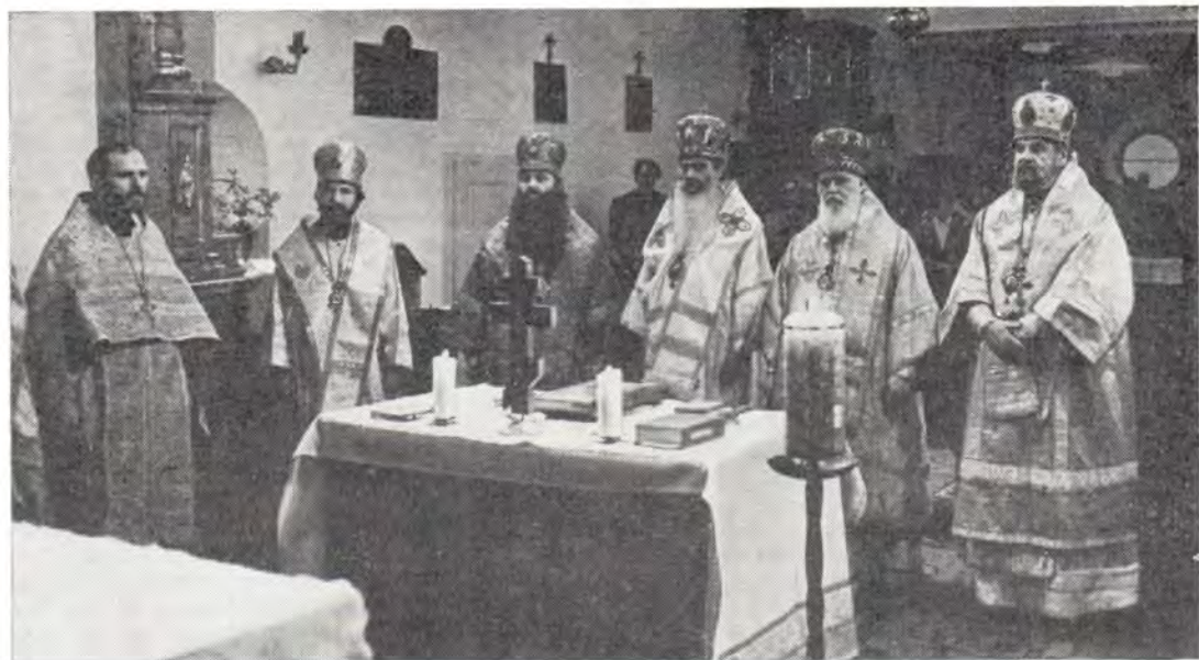
Представители Русской Православной Церкви во главе с митрополитом Киевским и Галицким Филаретом, Патриаршим Экзархом Украины, совершают Божественную литургию в храме Института Восточных Церквей в Регенсбурге 26 апреля 1987 года

Для участия в симпозиуме была приглашена представительная делегация Московского Патриархата, которая прибыла в Регенсбург в составе: митрополит Киевский и Галицкий Филарет, Патриарший Экзарх Украины (глава делегации), митрополит Волоколамский и Юрьевский Питирим, председатель Издательского отдела, митрополит Венский и Австрий-