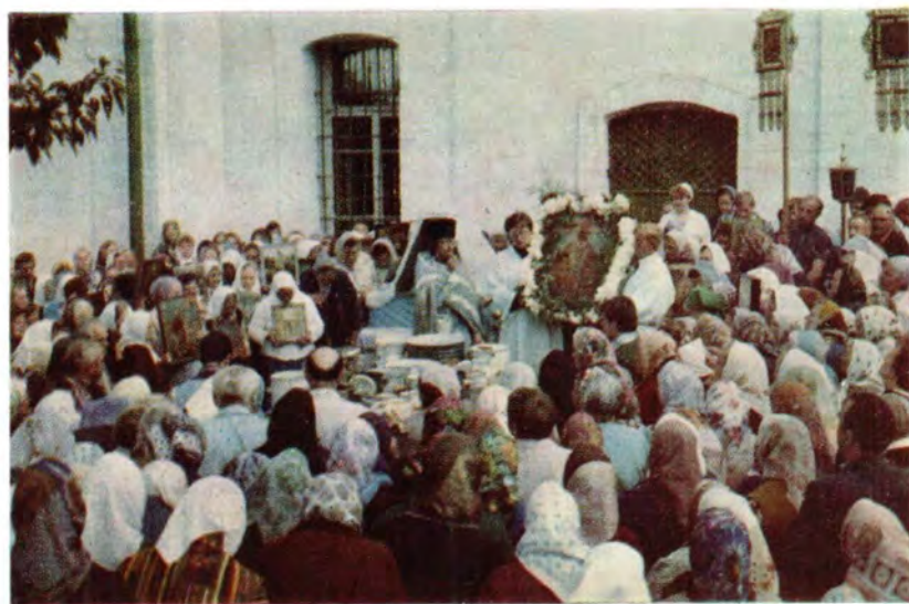
Во время молебна