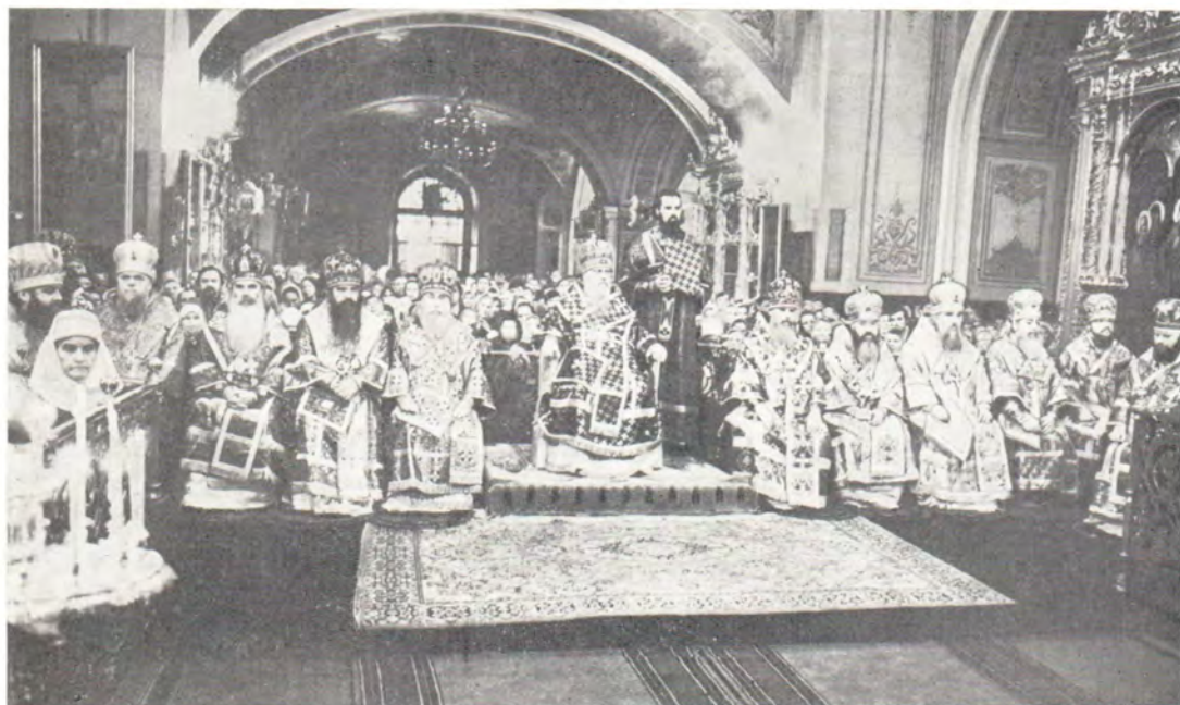
Святейший Патриарх Пимен и Преосвященные архиереи за Божественной литургией в Богоявленском патриаршем соборе