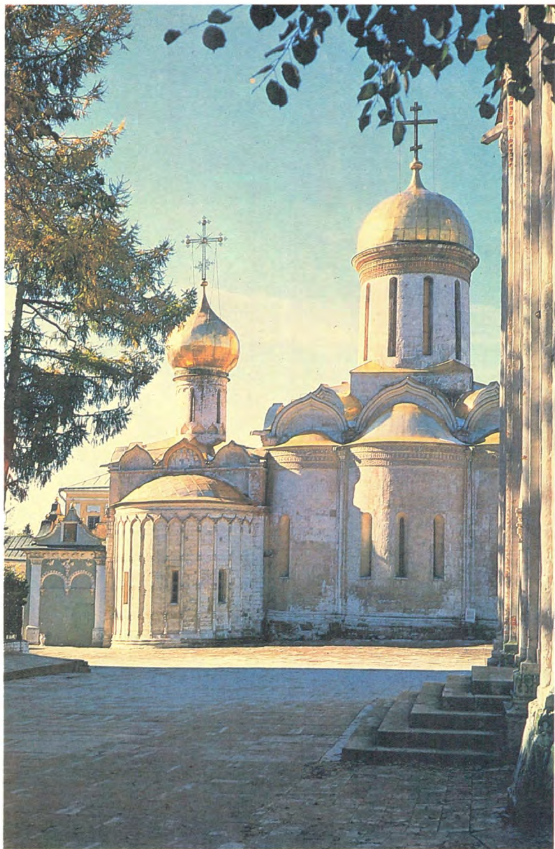
ТРОИЦКИЙ СОБОР (1422 год) И ХРАМ ВО ИМЯ ПРЕПОДОБНОГО НИКОНА РАДОНЕЖСКОГО (1623 год) в Троице-Сергиевой Лавре