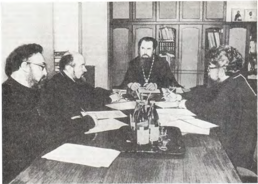
Во время совещания ректоров Духовных школ, 31 марта 1987 года

Оживленную дискуссию вызвал вопрос о подготовке Духовных школ Русской Православной Церкви к 1000-летию Крещения Руси. Участники совещания высказались за организацию в Духовных школах юбилейных выставок, за включение богословских и церковноисторических вопросов, связанных с юбилеем, в тематику курсовых и семестровых сочинений. Была признана целесообразность издания сборника Духовных школ, в котором можно было бы помещать статьи и доклады преподавателей, а также лучшие работы студентов, что, несомненно, явилось бы важным вкладом профессорско-преподавательской корпорации и учащихся в подготовку к юбилею и стимулировало бы ин-