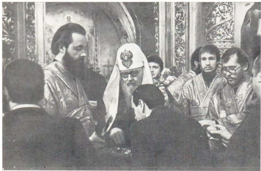
Святейший Патриарх Пимен принимает праздничные поздравления молящихся