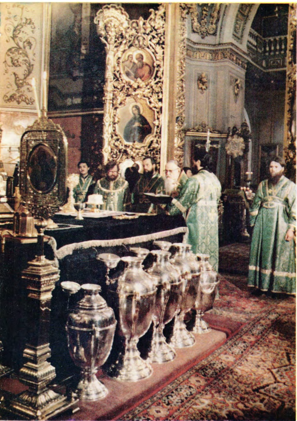
Святейший Патриарх Пимен читает молитву на освящение мира за Божественной литургией в Богоявленском патриаршем соборе в Великий четверг, 16 апреля 1987 года