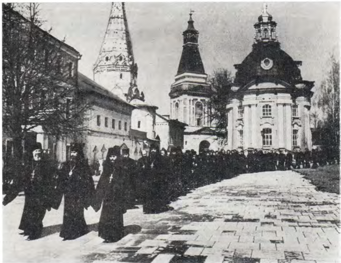
Традиционное шествие в Троицкий собор на благодарственный молебен Преподобному Сергию