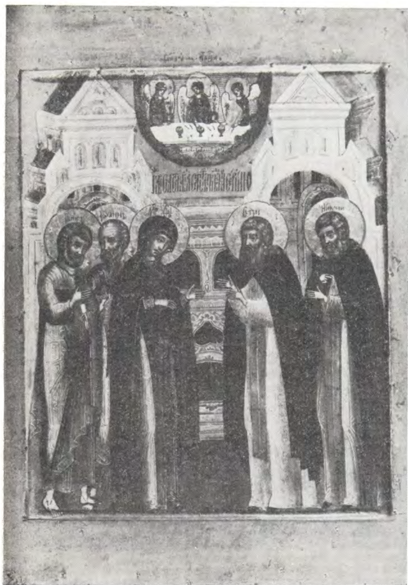
Явление Божией Матери Преподобному Сергию