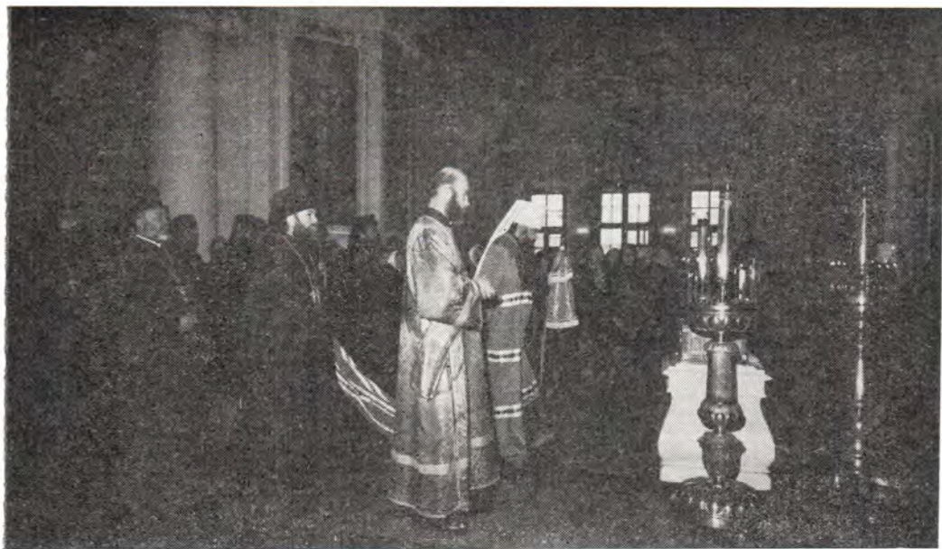
Перед началом Божественной литургии в Троицком соборе Данилова монастыря