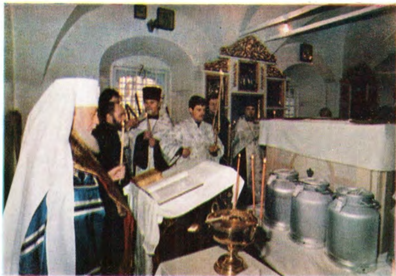
Митрополит Одесский и Херсонский Сергий совершает молебен перед началом мироварения в соборе в честь Донской иконы Божией Матери Донского монастыря в Великий понедельник, 13 апреля 1987 года