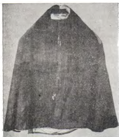
Фелонь Преподобного Сергия