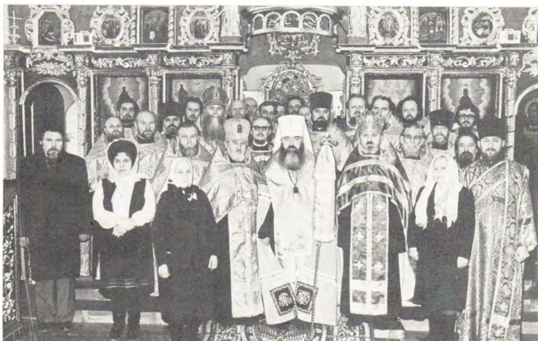
Митрополит Крутицкий и Коломенский Ювеналий, клирики и церковнослужители Московской епархии после вручения патриарших и архипастырских наград в Преображенском домовом храме в Новодевичьем монастыре, 9 апреля 1987 года