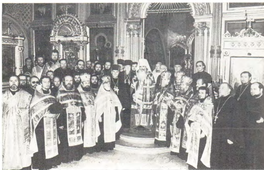
Митрополит Волоколамский и Юрьевский Питирим и клирики Москвы после вручения патриарших наград в храме Воскресения славущего на ул. Неждановой в Москве, 15 апреля 1987 года