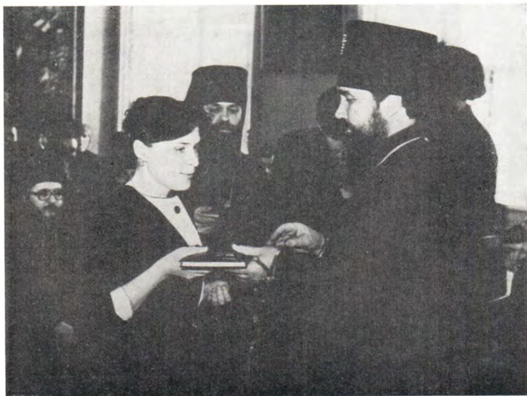
Вручение свидетельств выпускникам регентского класса