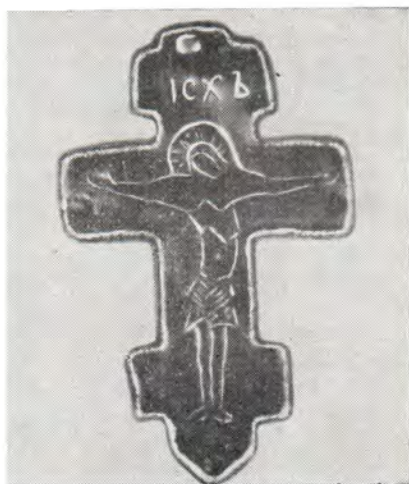
Крест-мошевик Преподобного Сергия