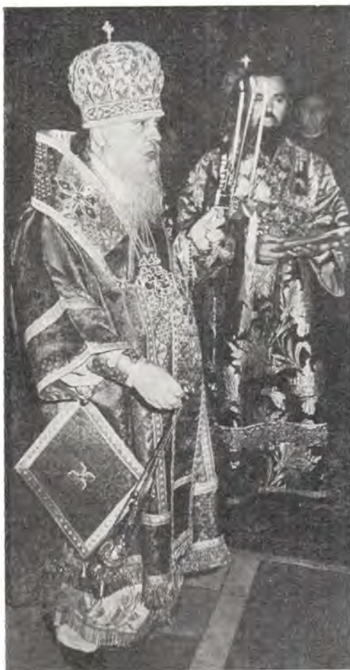
Святейший Патриарх Пимен начинает пасхальную утреню в Богоявленском патриаршем соборе