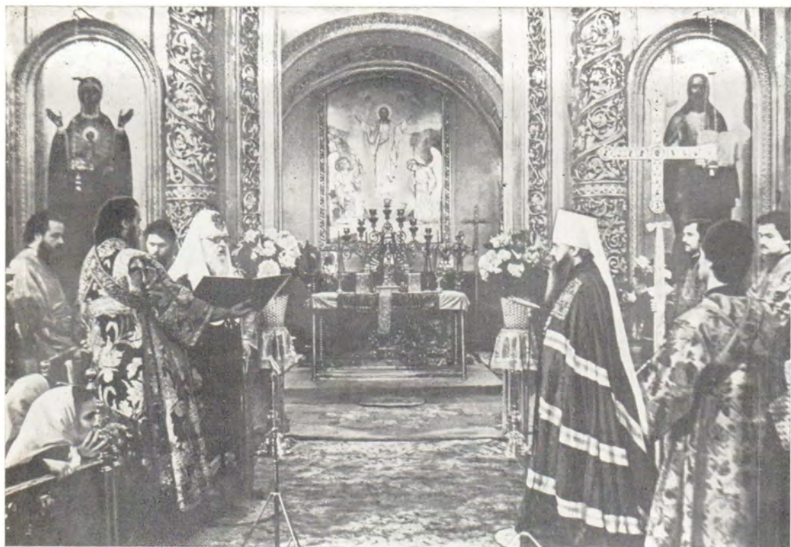
Святейший Патриарх Пимен отвечает на пасхальное приветствие митрополита Крутицкого и Коломенского Ювеналия в патриаршем соборе, 20 апреля 1987 года