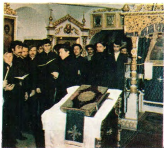
Песнопения за богослужением исполняет хор учащихся Московских Духовных школ