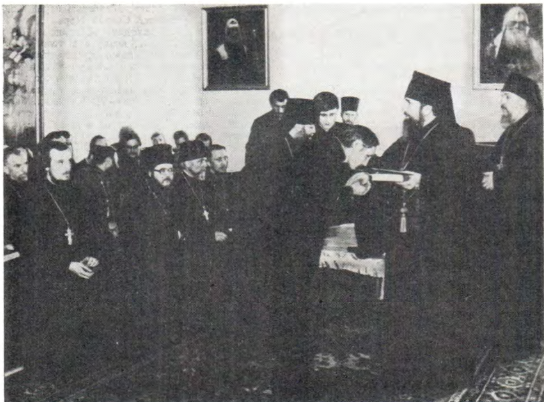
Ректор архиепископ Дмитровский Александр вручает дипломы выпускникам Семинарии