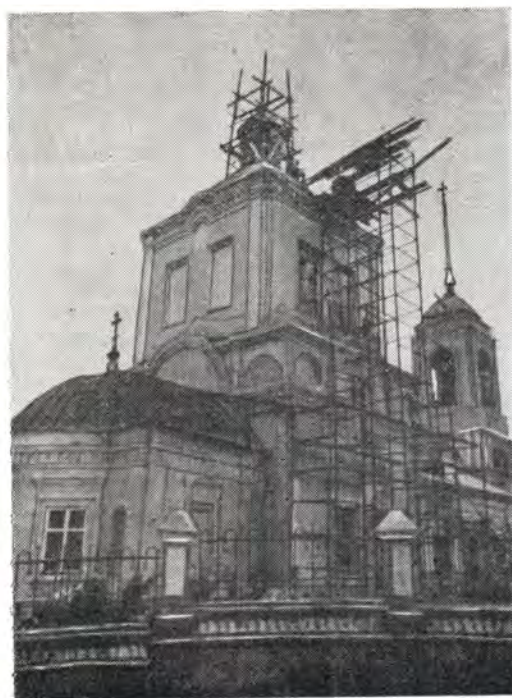
Воскресенский храм в процессе восстановительных работ

Всего год потребовался для того, чтобы Воскресенский храм в Брянске приобрел свой первоначальный облик, теперь он вновь украшает центр древнего Брянска