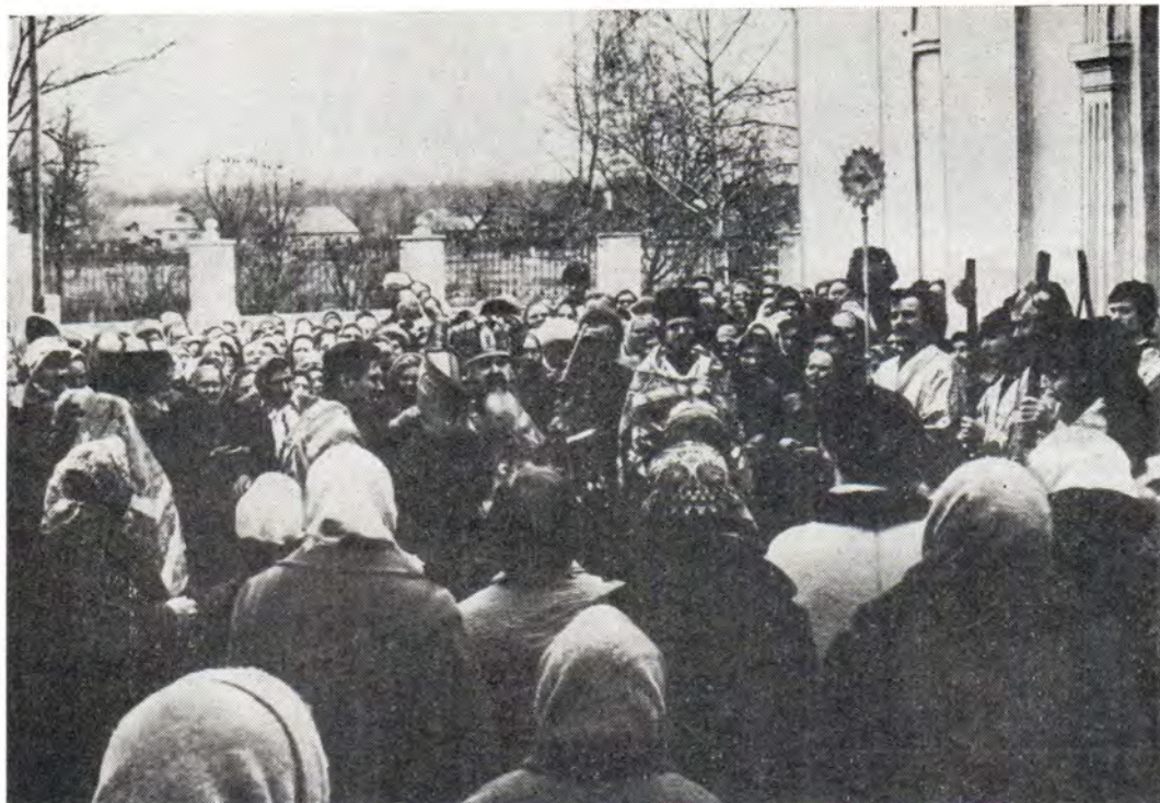
Крестный ход вокруг Тихвинского храма в г. Ступино Московской епархии совершает митрополит Крутицкий и Коломенский Ювеналий