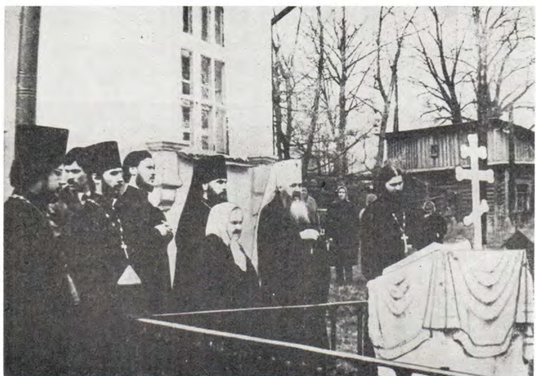
Митрополит Крутицкий и Коломенский Ювеналий у могилы архимандрита Германа (Красильникова; † 1985) в ограде Казанского храма в с. Шеметово Московской епархии, в котором покойный пастырь прослужил более 30 лет