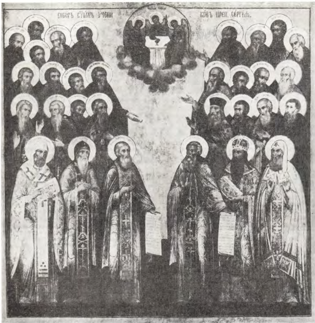
Собор Радонежских святых

Икона XIX века из Успенского собора Троице-Сергиевой Лавры