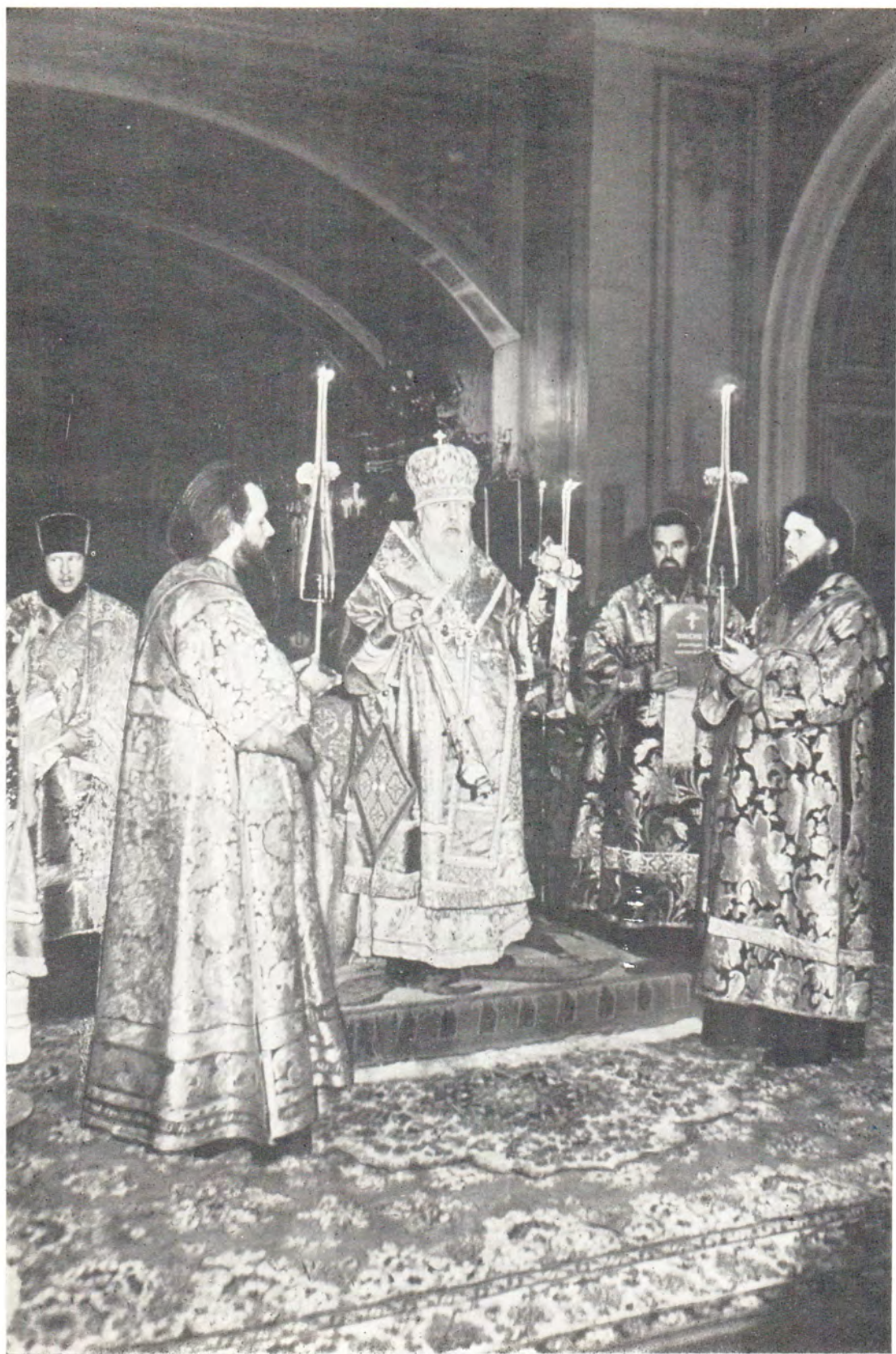
Святейший Патриарх Пимен совершает пасхальную утреню