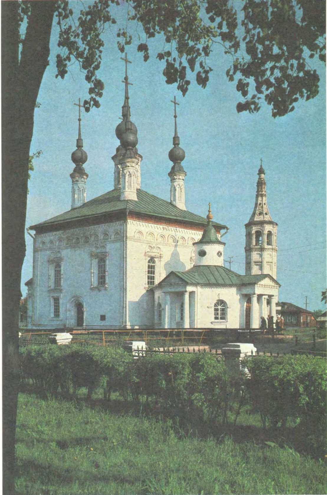
ЦАРЕКОНСТАНТИНОВСКИЙ ХРАМ В СУЗДАЛЕ