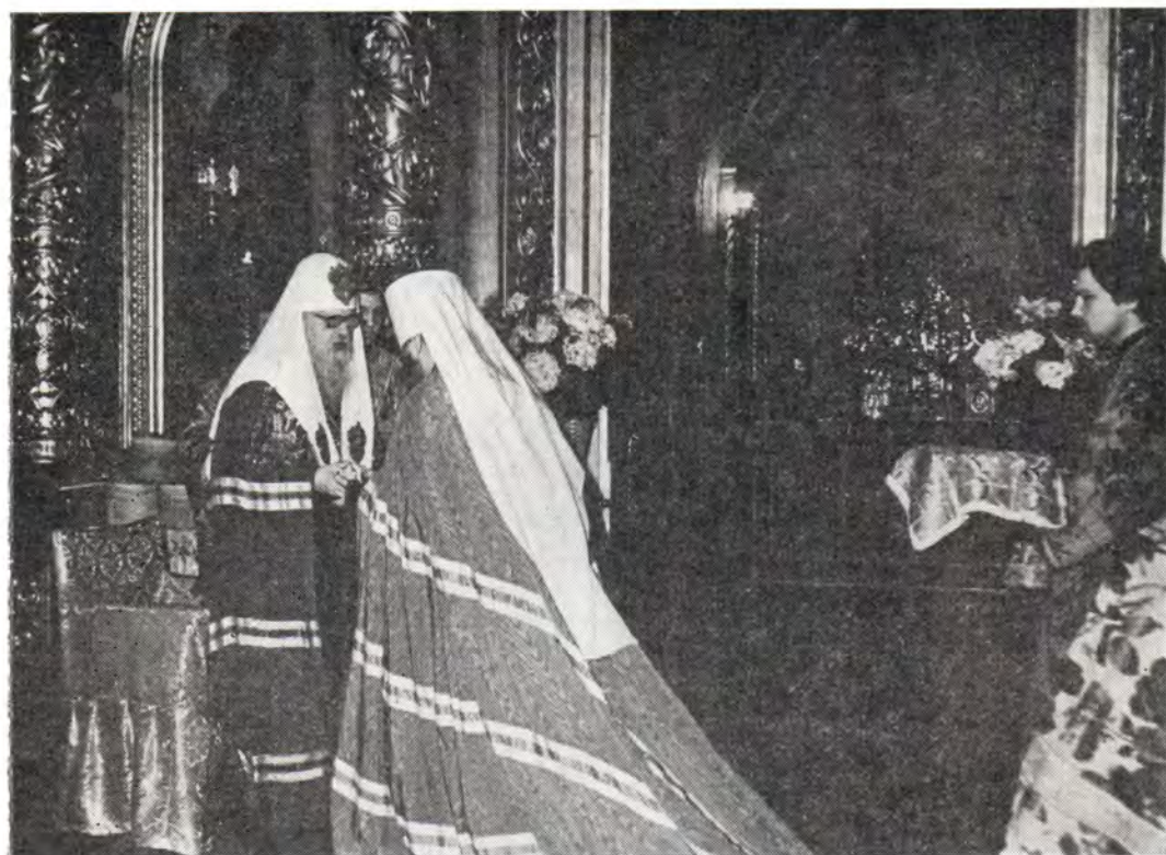
Святейший Патриарх Пимен обменивается пасхальным приветствием с митрополитом Крутицким и Коломенским Ювеналием в Богоявленском патриаршем соборе 20 апреля 1987 года

радость совместной молитвы, за то, что вы пришли поздравить меня с праздником Пасхи. Я желаю всем вам от Воскресшего Господа много радостей, здоровья, чтобы вы еще много раз встречали праздник Светлого Христова Воскресения. Христос воскрес!