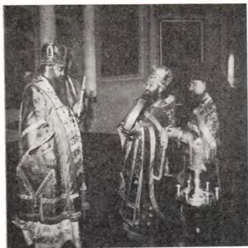
Архимандрит Пантелеимон преподносит митрополиту Минскому и Белорусскому Филарету икону преподобного князя Даниила Московского

В конце литургии архимандрит Пантелеимон, обращаясь к митрополиту Филарету, выразил чувства сыновней любви и благодарности Его Святейшеству Святейшему Патриарху Пимену за отеческое внимание и любовь к монастырю. Высокопреосвященному Филарету наместник обители преподнес образ преподобного князя Даниила Московского. Архимандрит Пантелеимон поблагодарил гостей и всех участников торжества за молитвы и участие в общей радости насельников Даниловой обители.