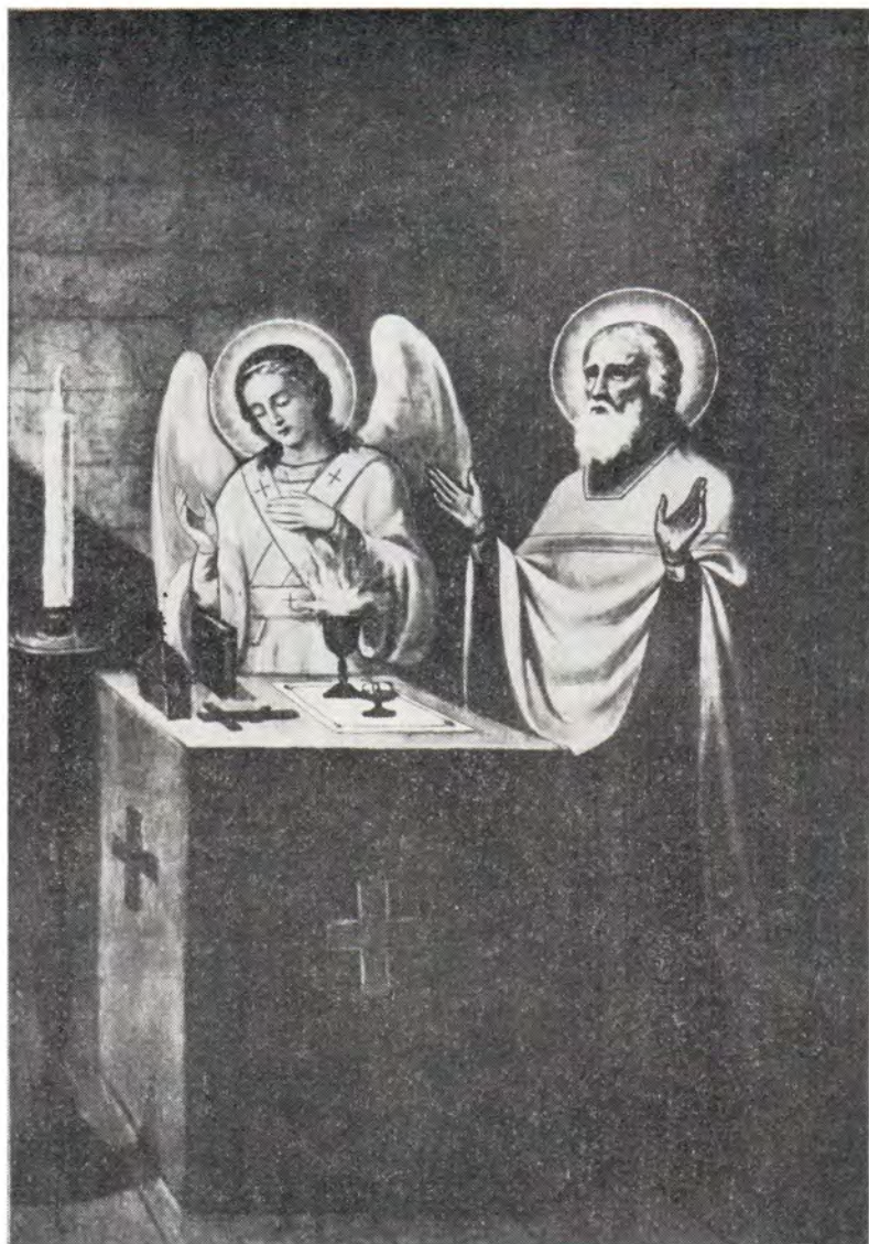
Преподобный Сергий совершает Божественную литургию