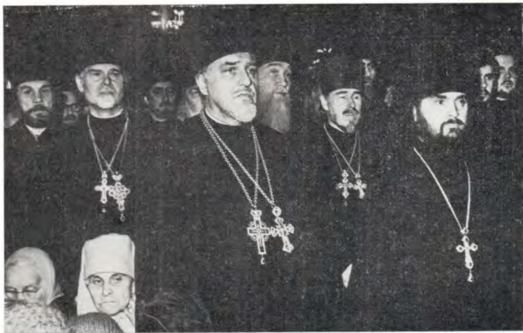
Клирики г. Москвы и Московской епархии во время поздравления Святейшего Патриарха Пимена с праздником Пасхи в Богоявленском патриаршем соборе 20 апреля 1987 года