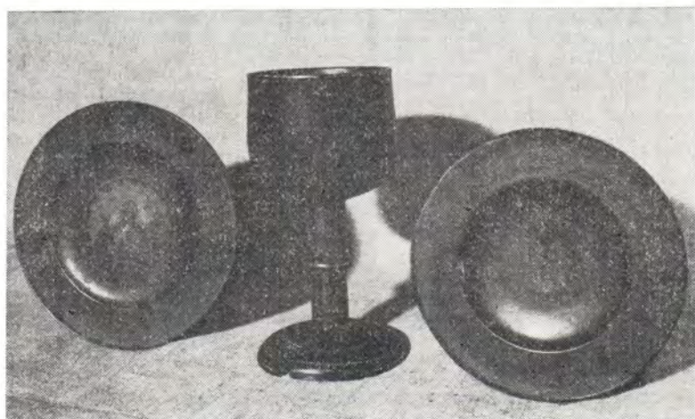
Потир и диски, которые Преподобный Сергий использовал при совершении Божественной литургии