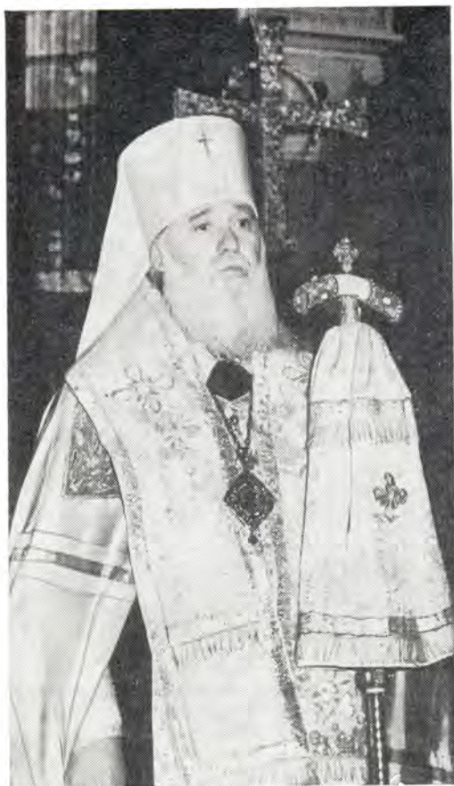
Митрополит Киевский и Галицкий Филарет, Патриарший Экзарх Украины, за богослужением во Владимирском кафедральном соборе в Киеве