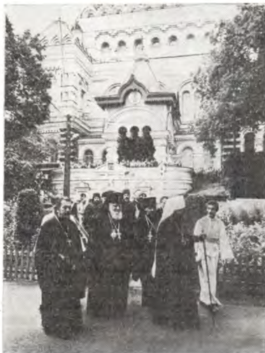
Участники и гости конференции во время посещения Покровского женского монастыря в Киеве