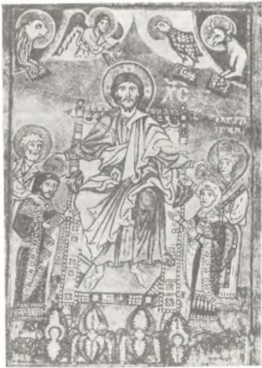
Спаситель, венчающий святого князя Ярополка и княгиню Ирину