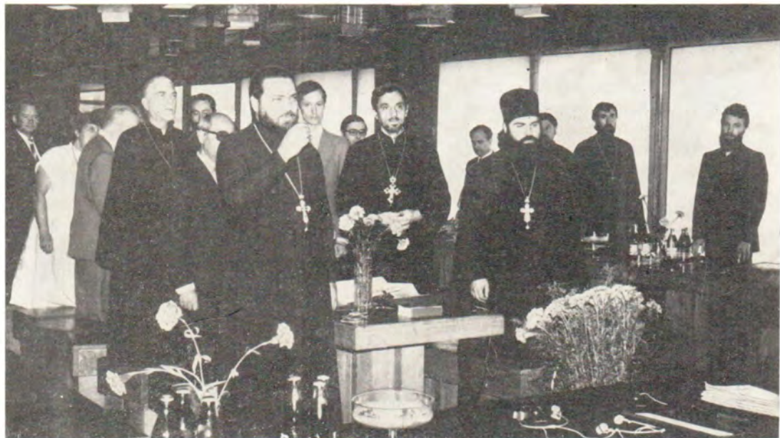
▲ Во время общей молитвы перед началом заседания