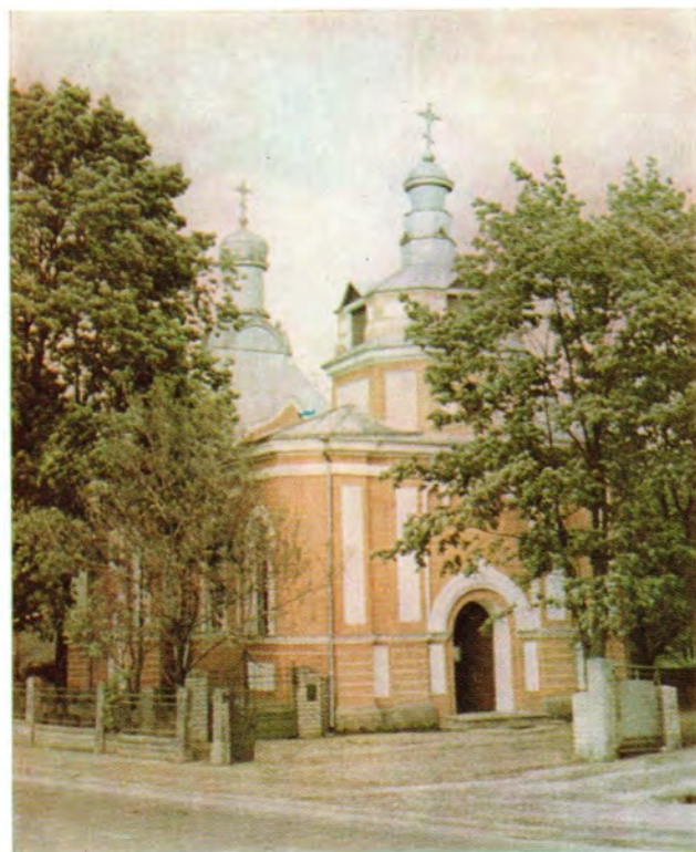
Храм во имя великомученика Георгия в г. Тарту. Внешний вид