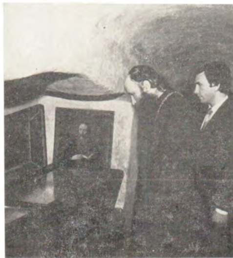
В пещерах Киево-Печерской Лавры