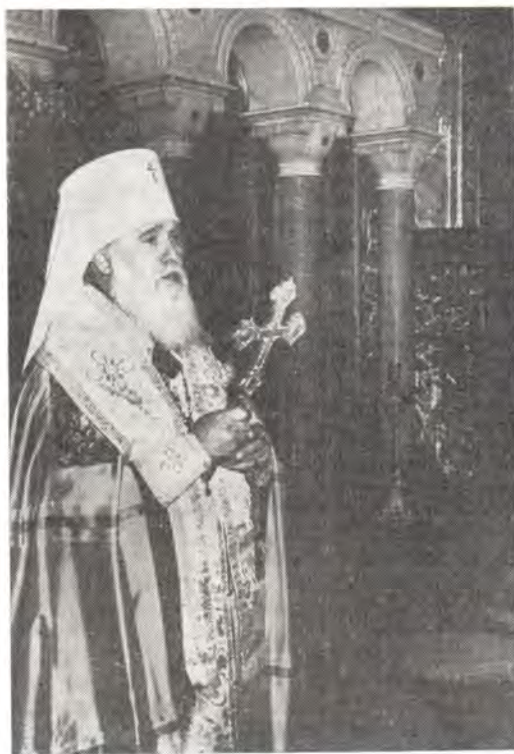
Митрополит Киевский и Галицкий Филарет, Патриарший Экзарх Украины, произносит слово во время молебна перед началом работы конференции

Настоящая конференция имеет своей задачей изучение прошлого, но мы делаем это для настоящего и будущего, сказал митрополит Филарет. Это значит, что конференция не может пройти мимо насущных проблем современности, к которым прежде всего относится сохранение мира и жизни на Земле. Празднование тысячелетнего юбилея Крещения Руси должно способствовать развитию идей мира, свободы, братства, любви и взаимопонимания между народами. Мы надеемся, что конференция будет служить укреплению братских отношений между христианскими Церквями, дружбы между народами и мира на Земле.