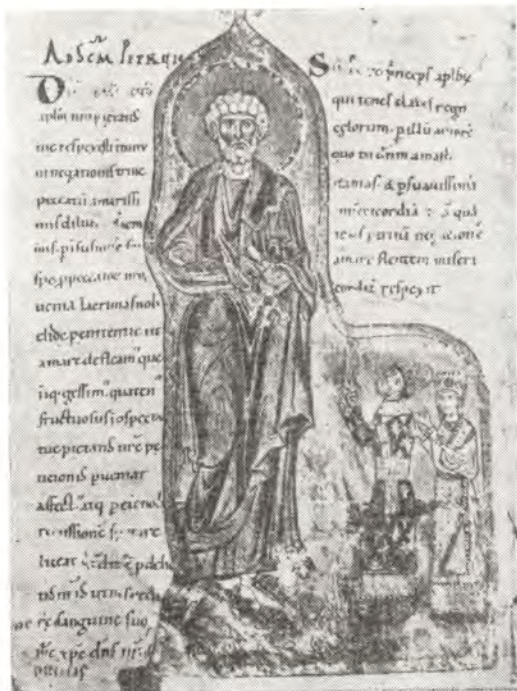
Святой князь Ярополк и княгиня Ирина обращаются с молитвой к святому апостолу Петру