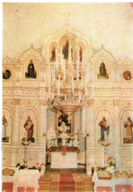
Интерьер храма ▶