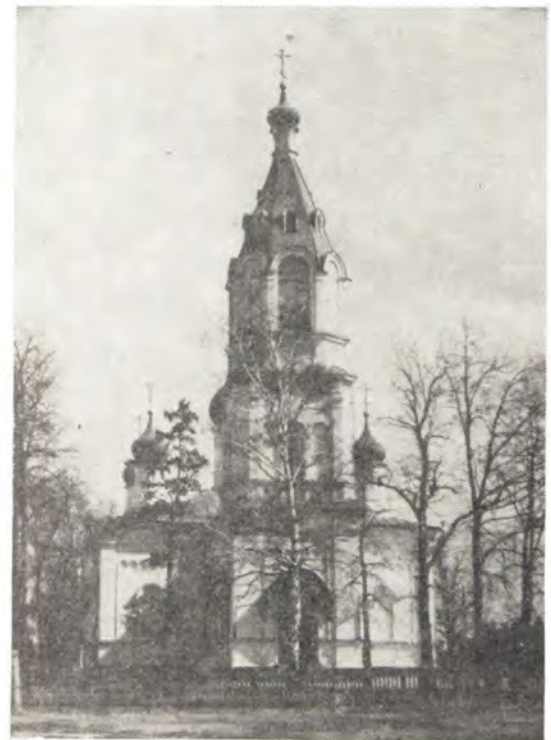
▲ Храм в честь Казанской иконы Божией Матери в с. Казанское, Московская епархия