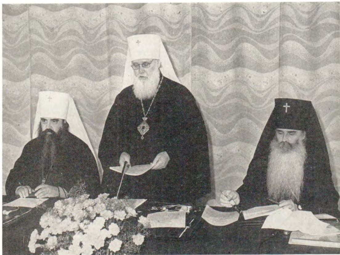
Президиум в день открытия конференции. Слева направо: митрополит Минский и Белорусский Филарет, митрополит Киевский и Галицкий Филарет, архиепископ Волоколамский Питирим