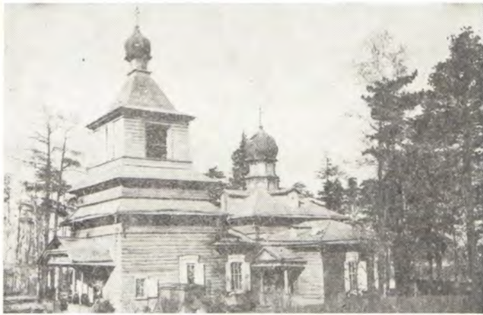
Храм во имя Архистратига Божия Михаила в Иркутске