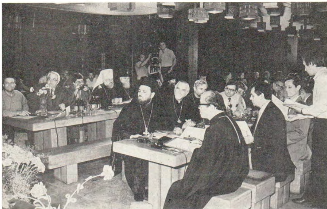
В зале заседаний