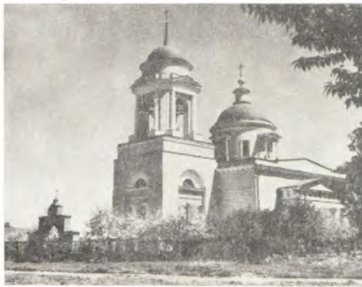
◀ Храм во имя Архистратига Божия Михаила в с. Михайловское, Домодедовского района, Московская епархия