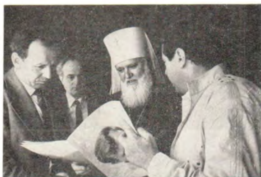
В перерыве между заседаниями