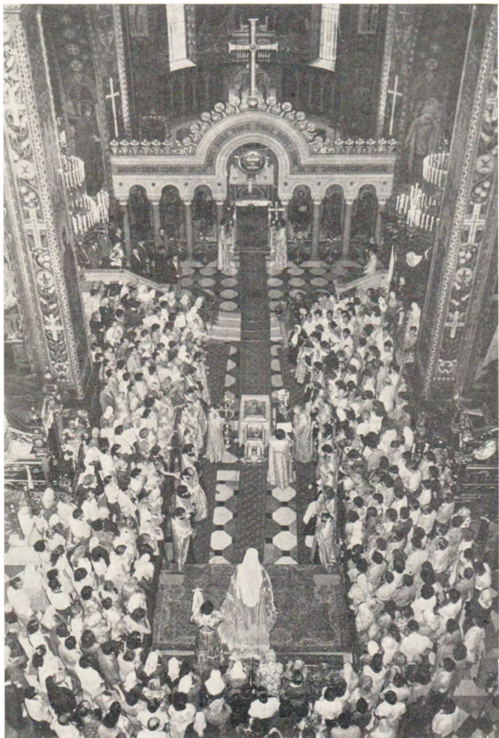
Молебен во Владимирском кафедральном соборе перед открытием конференции