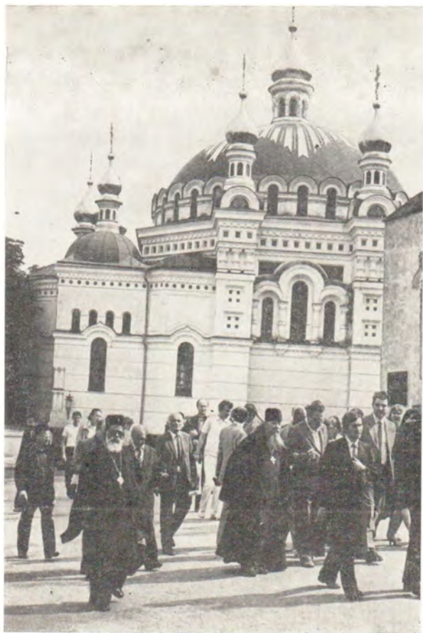
Участники и гости конференции во время осмотра Киево-Печерской Лавры