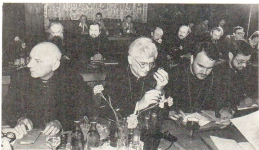
В зале заседаний