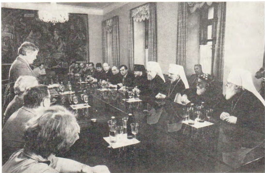
Во время встречи с представителями советской общественности в Украинском республиканском комитете защиты мира