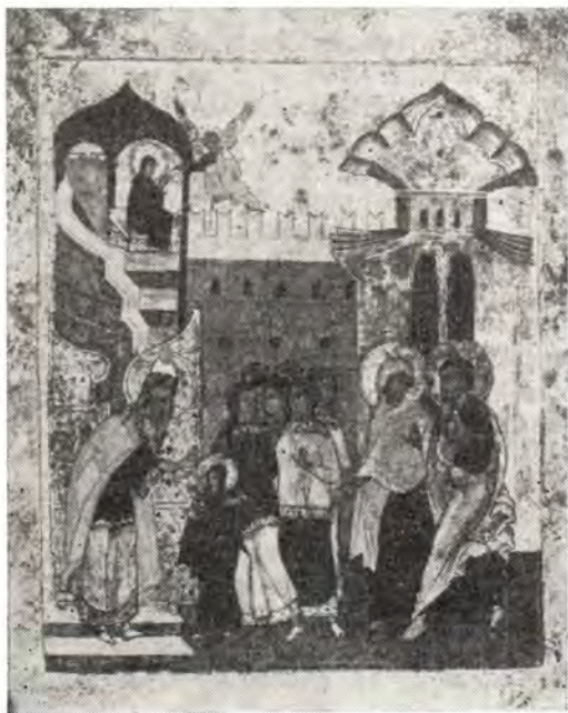
Введение во храм Пресвятой Владычицы нашей Богородицы и Приснодевы Марии

В этих священных образах Святая Церковь исповедует прехвальный и единственный храм души Пресвятой