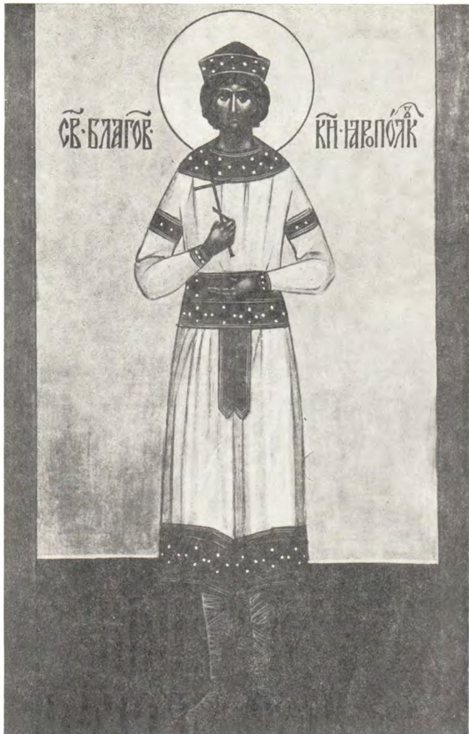
СВЯТОЙ БЛАГОВЕРНЫЙ КНЯЗЬ ЯРОПОЛК, ВО СВЯТОМ КРЕЩЕНИИ ПЕТР (†1086)