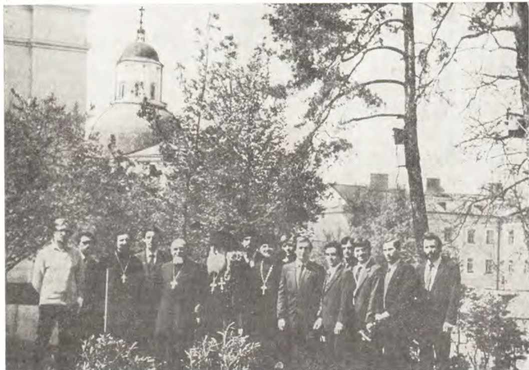
Студенты ЛДА в Жировицком монастыре.