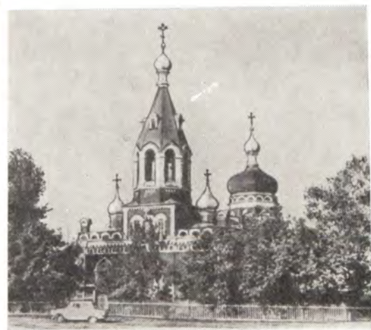
ХРАМ В ЧЕСТЬ РОЖДЕСТВА БОГОРОДИЦЫ В с. САМОДУРОВКА (Воронежская епархия)