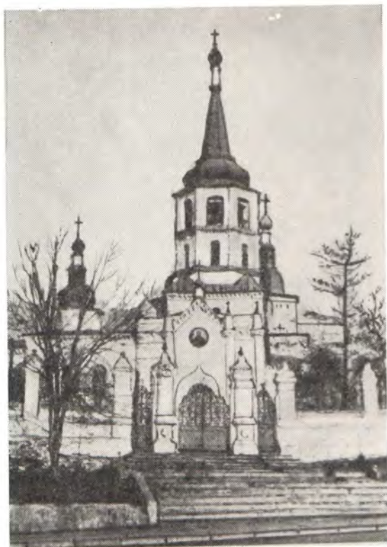
ХРАМ В ЧЕСТЬ ВОЗДВИЖЕНИЯ КРЕСТА ГОСПОДНЯ В г. ИРКУТСКЕ (Иркутская епархия)