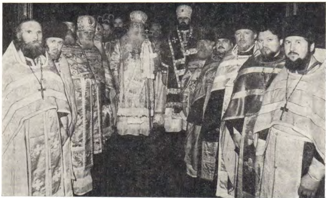
Архиепископы Костромской и Галичский Кассиан, Ярославский и Ростовский Платон совершают молебен в день празднования 25-летия архиерейской хиротонии архиепископа Кассиана 27 марта 1986 года

Костромская епархия. Юбилей архипастыря. 26 марта 1986 года исполнилось 25 лет служения в архиерейском сане архиепископа Костромского и Галичского Кассиана.