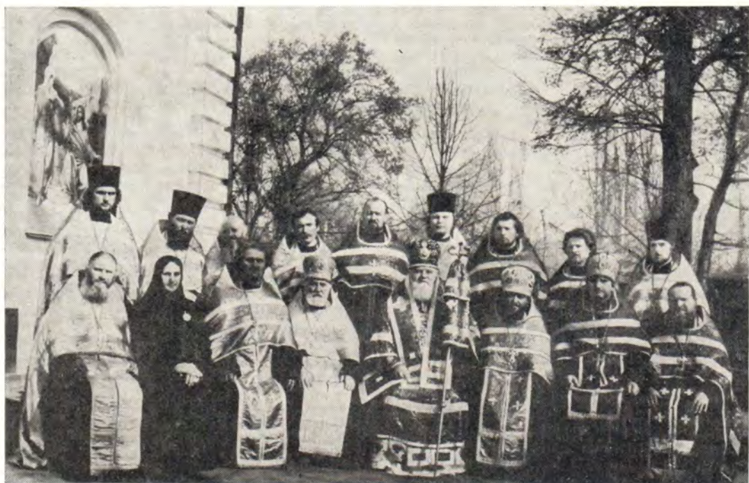
Архиепископ Черниговский и Нежинский Антоний с удостоенными церковных наград ко дню Святой Пасхи