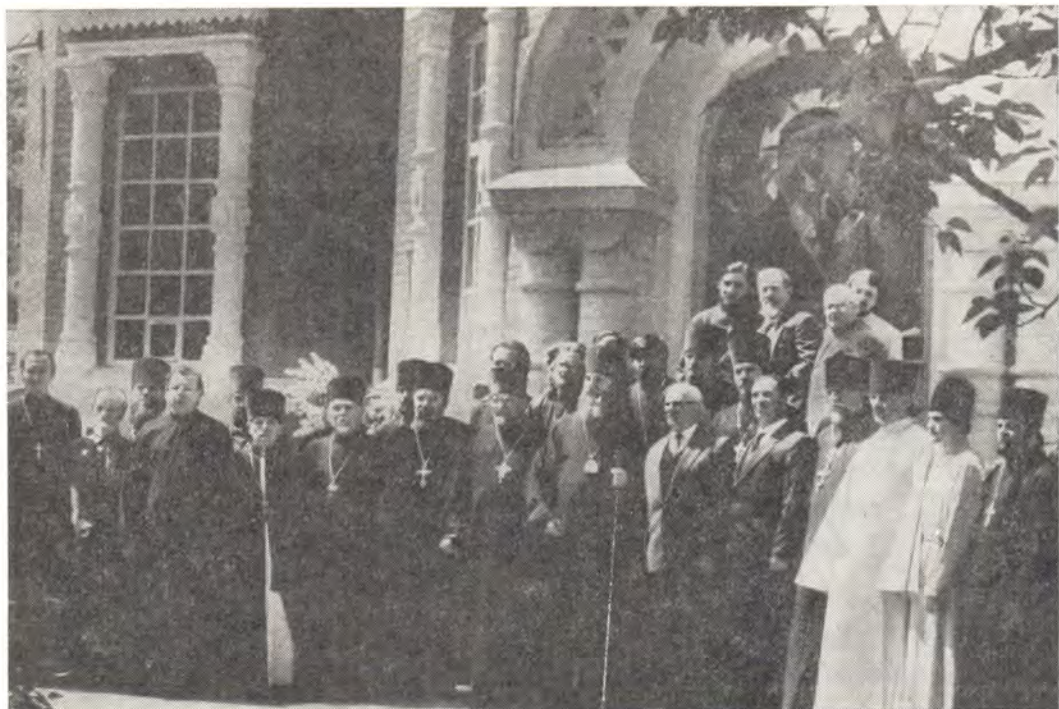
Архиепископ Саратовский и Волгоградский Пимен с участниками богослужения и гостями возле алтаря Казанского собора в Волгограде, 8 мая 1986 года

Саратовская епархия. Торжественно и радостно прошли пасхальные богослужения в храмах Саратовской епархии. В Свято-Троицком кафедральном соборе в Саратове пасхальную утреню и первую Божественную литургию в день Святой Пасхи, 4 мая 1986 года, совершил архиепископ Саратовский и Волгоградский Пи-