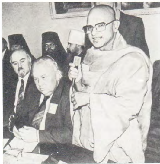
Выступает досточтимый пандит Медагода Суманатисса Тхеро (Шри Ланка)