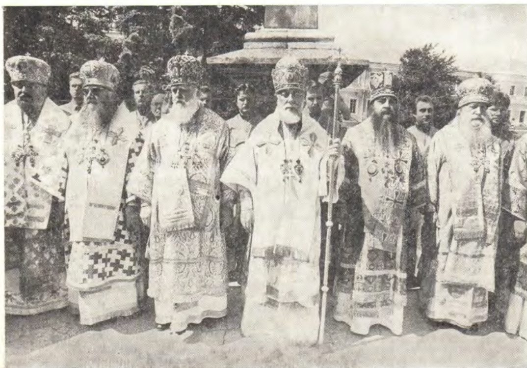
Молебен на лаврской площади