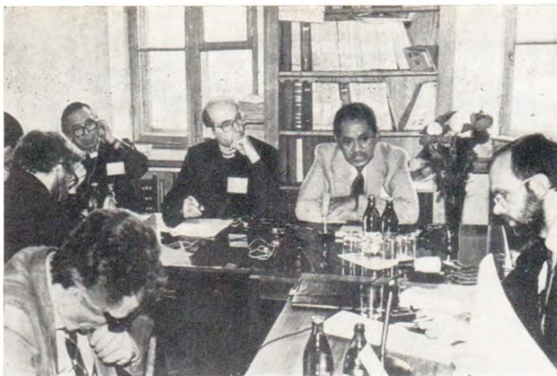
Заседание рабочей группы «Разоружение и развитие»