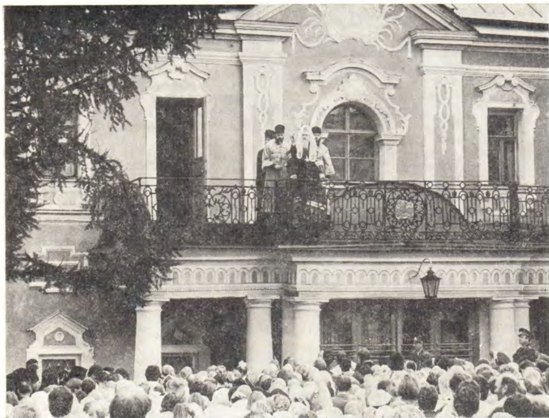
Святейший Патриарх Пимен с балкона патриарших покоев благословляет паломников