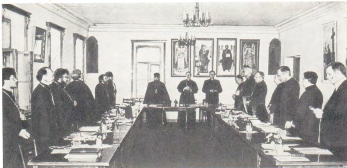
Совместная молитва перед началом богословского собеседования в актовом зале Отдела внешних церковных сношений в Даниловом монастыре