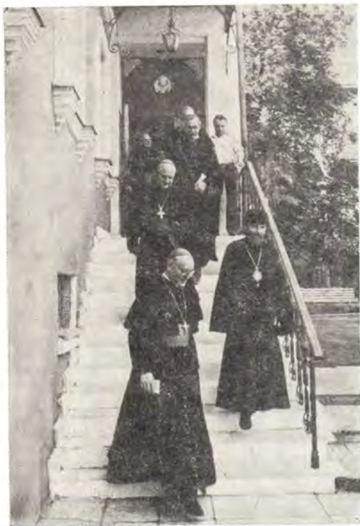
Делегация Германской Епископской Конференции посетила храм в честь Воскресения Словущего на ул. Неждановой в Москве, 2 июня 1986 года

ной нравственности. Поэтому Церковь использует право подвергать политические вопросы нравственной оценке, если того требуют основные права личности или спасение души» (из Слова Германской Епископской Конференции «Справедливость созидает мир», 1, 3).