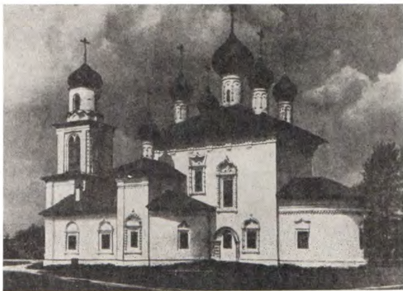
ХРАМ В ЧЕСТЬ РОЖДЕСТВА БОГОРОДИЦЫ В г. КАРГОПОЛЕ (Архангельская епархия)