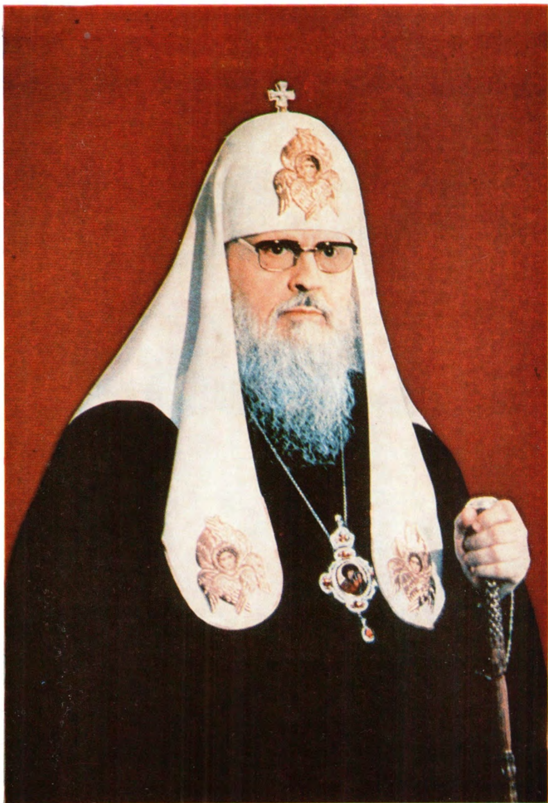
3 июня 1986 года Русская Православная Церковь молитвенно отметила 15-летие интронизации на Патриарший престол Первосвященителей Московских Святейшего Патриарха ПИМЕНА