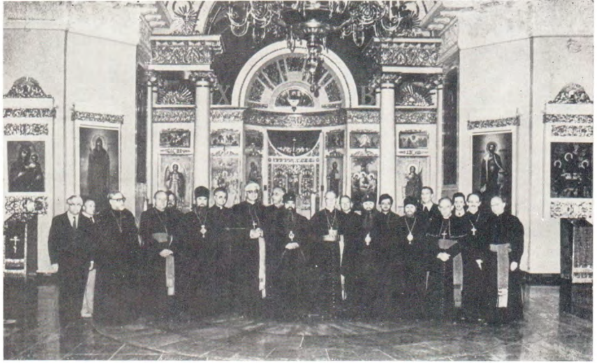
Участники собеседования в Троицком соборе Данилова монастыря