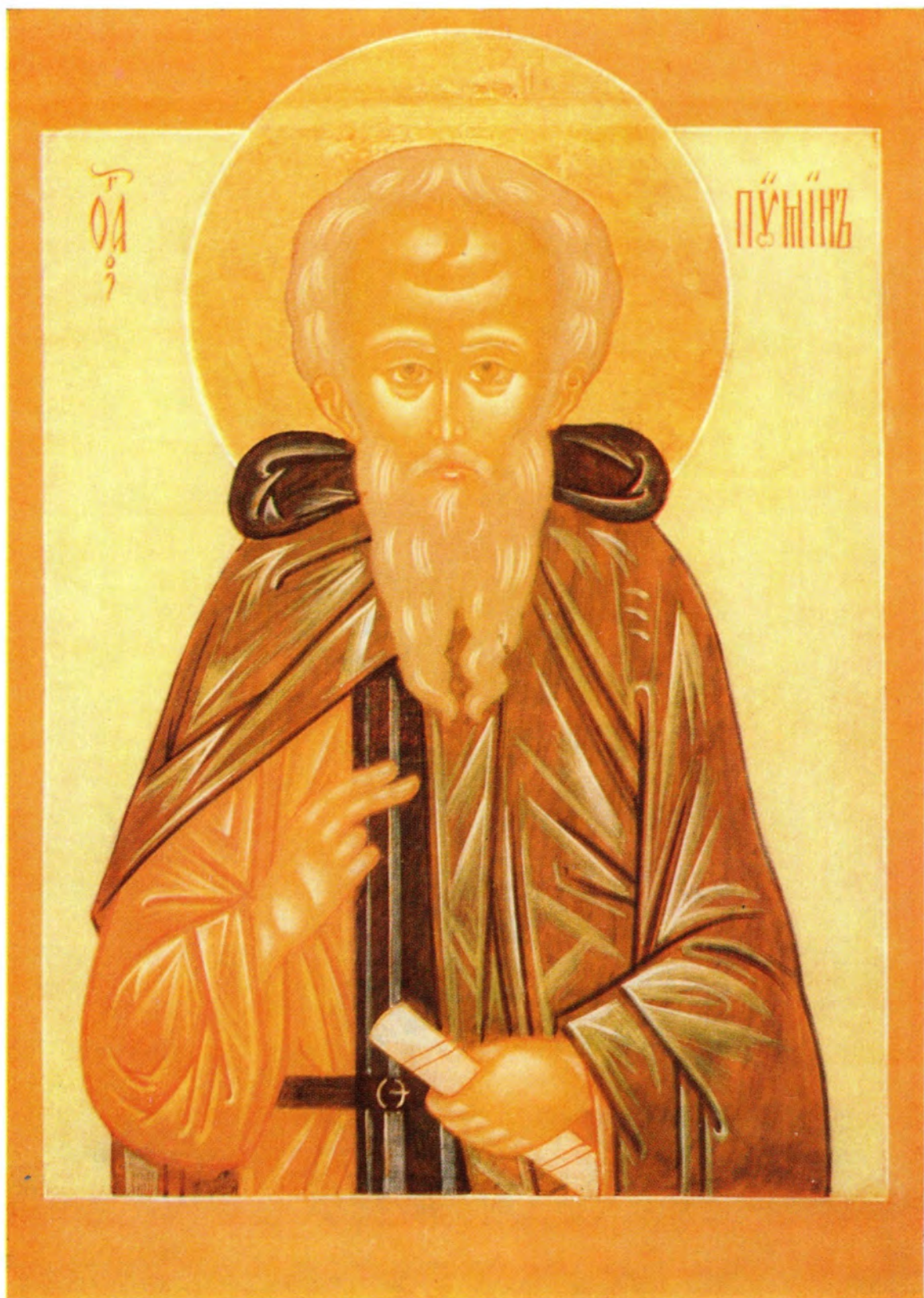
ПРЕПОДОБНЫЙ ПИМЕН ВЕЛИКИЙ