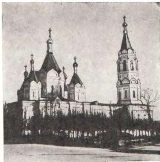
ХРАМ ВО ИМЯ СВЯТОГО БЛАГОВЕРНОГО КНЯЗЯ АЛЕКСАНДРА НЕВСКОГО В г. ЕГОРЬЕВСКЕ (Московская епархия)