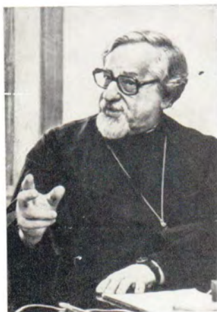
◀ Выступление в дискуссии профессора протопресвитера Виталия Борового