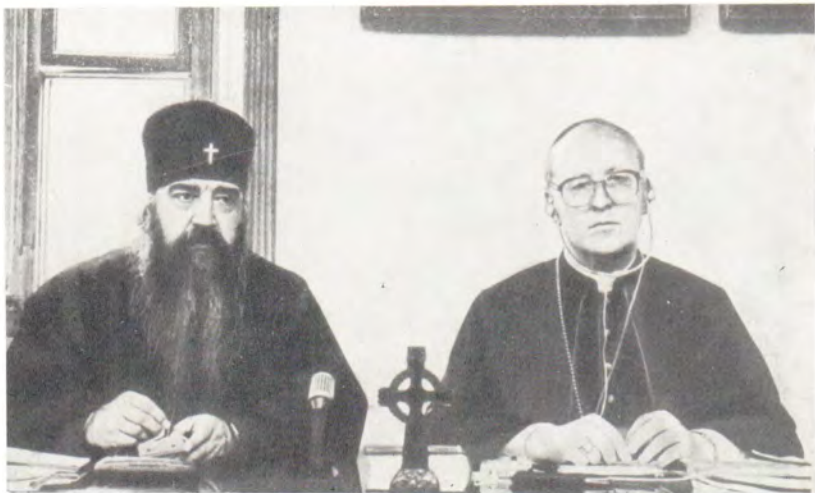
Выступает епископ Вюрцбургский Пауль Вернер Шееле ▶