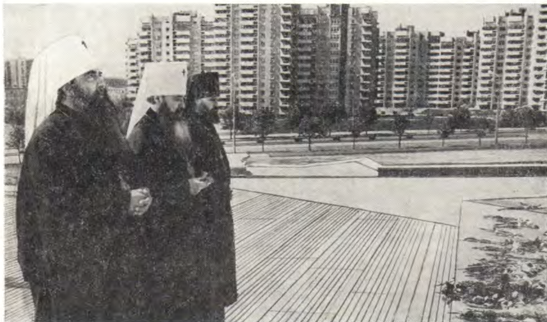
Митрополиты Минский и Белорусский Филарет, Крутицкий и Коломенский Ювеналий и секретарь Московского епархиального управления архимандрит Григорий возложили цветы к памятнику 40-летия освобождения Белоруссии от немецко-фашистских захватчиков, Минск, 19 мая 1986 года

13 апреля, в Великую субботу, в 2 часа пополудни, митрополит Филарет совершил в кафедральном соборе Божественную литургию святителя Василия Великого.