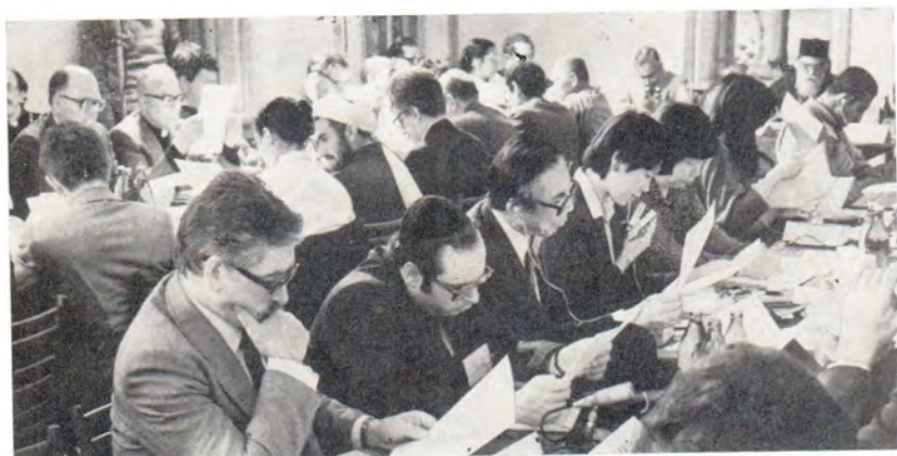
На пленарном заседании