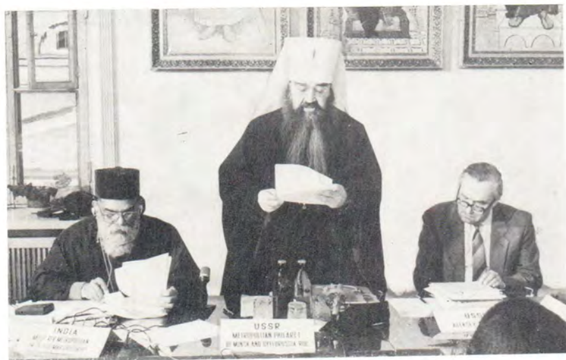
Выступление митрополита Минского и Белорусского Филарета на открытии конференции