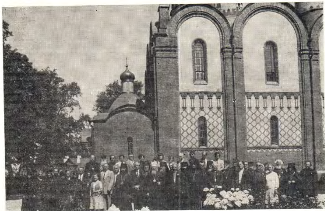
Участники семинара «Пюхтицы-III» в Пюхтицком Свято-Успенском монастыре

Присутствующие на семинаре поблагодарили Высокопреосвященного митрополита Таллинского и Эстонского Алексия, настоятельно