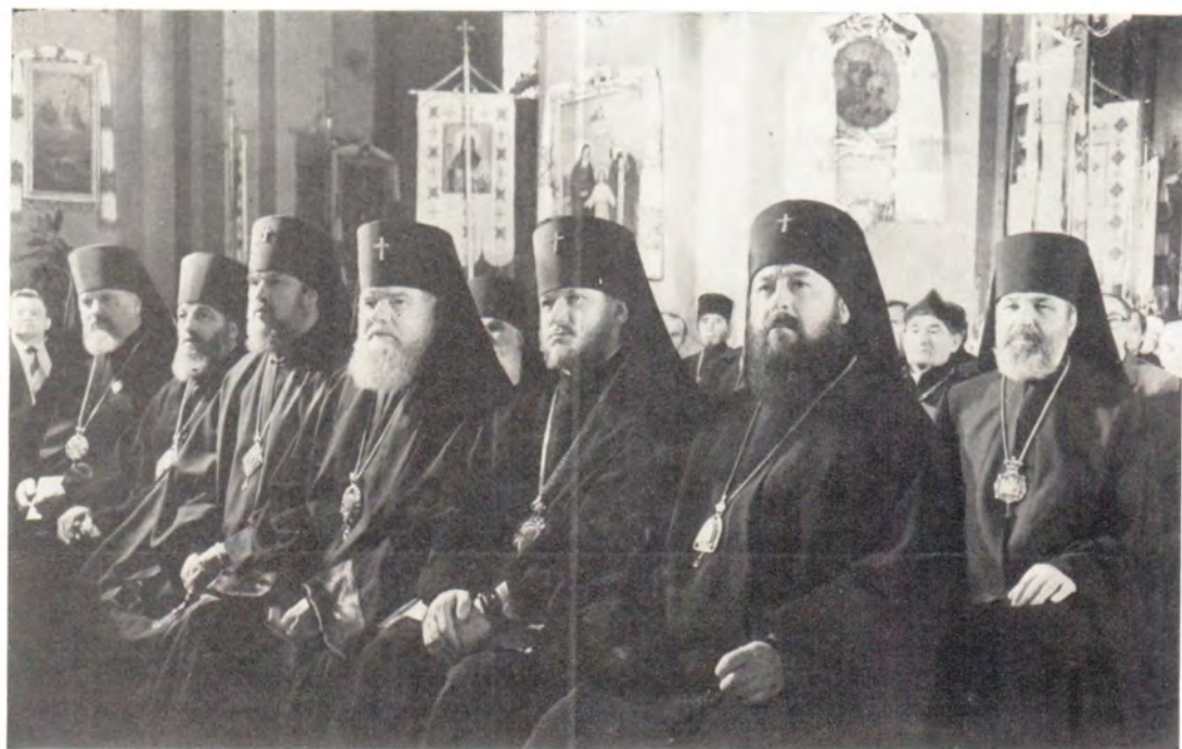
Торжественное заседание в кафедральном соборе Святого Юра 17 мая 1986 года