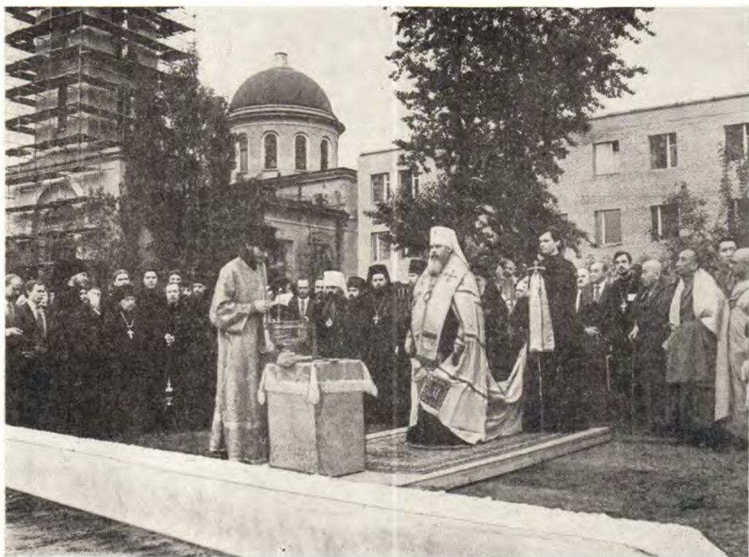
Во время молебна перед закладкой гостиничного комплекса Московской Патриархии

20 мая 1986 года была забита первая свая в основание гостиничного комплекса Московской Патриархии, который будет построен за южной стеной Данилова монастыря. Перед этим митрополит Таллинский и Эстонский Алексей, председатель Ответственной комиссии по реставрации и строительству Данилова монастыря, совершил возле котлована молебен и окропил первую свая святой водой.