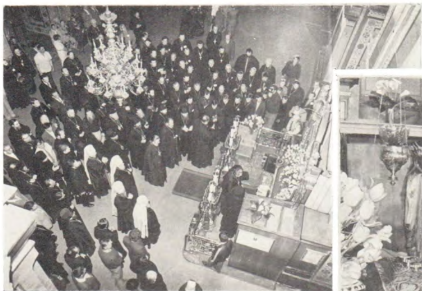
У стопы Божией Матери