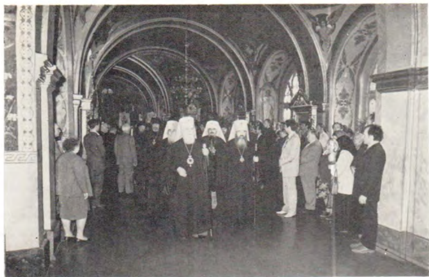
В Успенском соборе Лавры