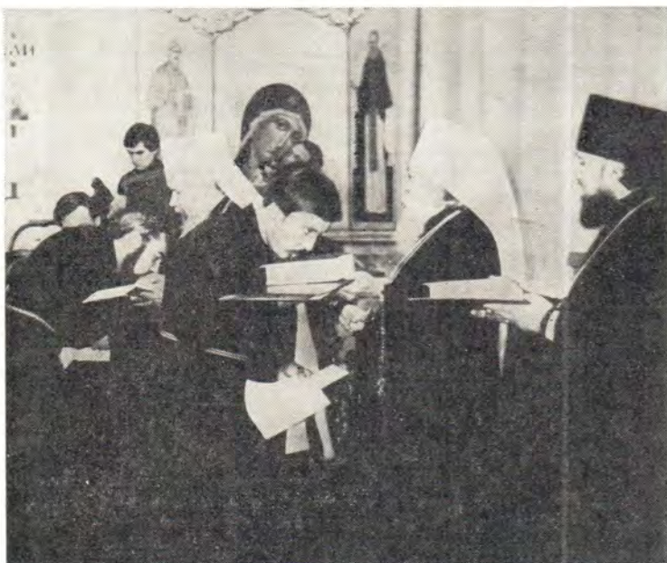
Митрополиты Таллинский и Эстонский Алексей и Одесский и Херсонский Сергей вручают дипломы и памятные книги выпускникам Одесской Духовной Семинарии