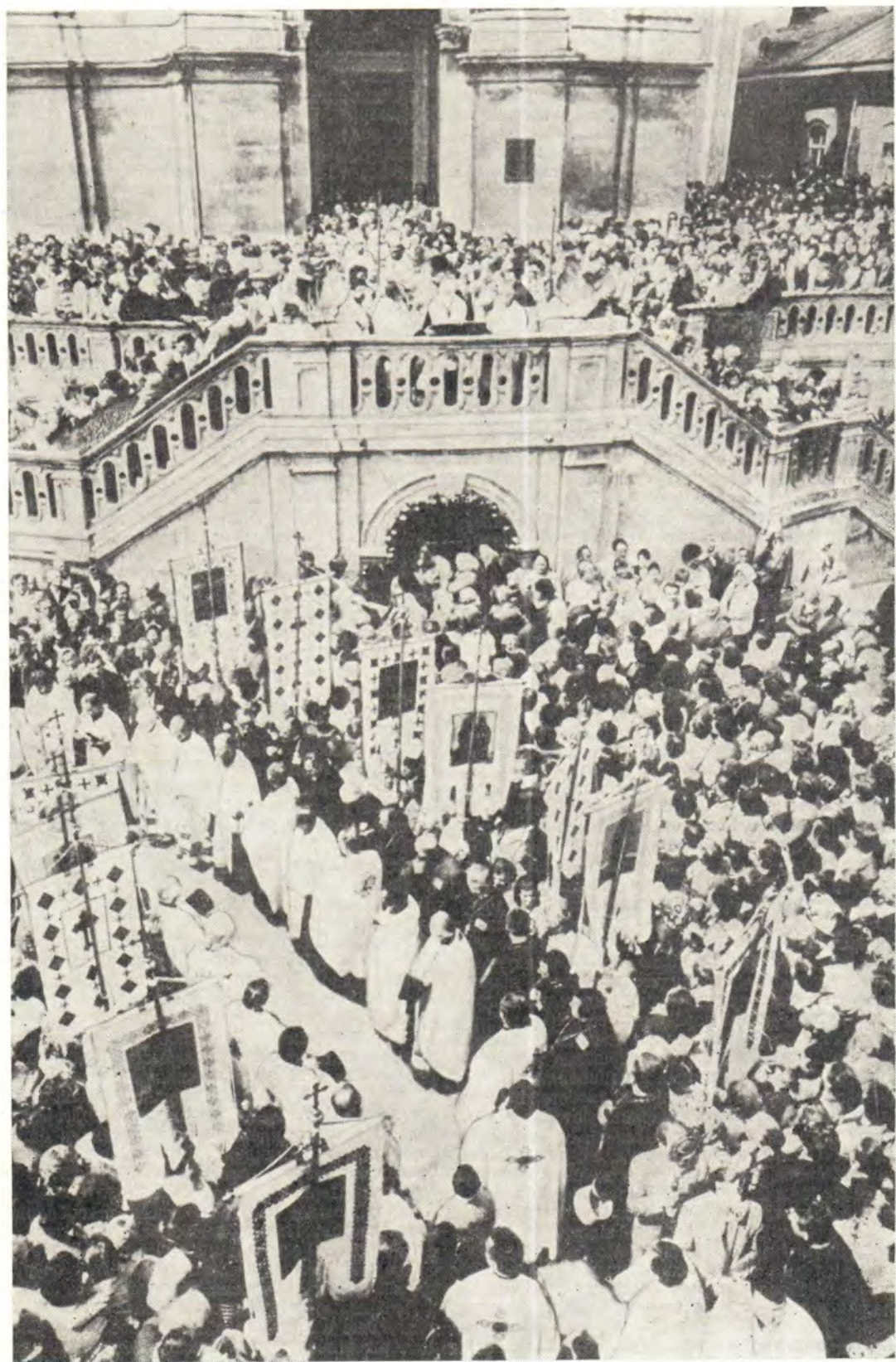
Во время крестного хода 18 мая 1986 года