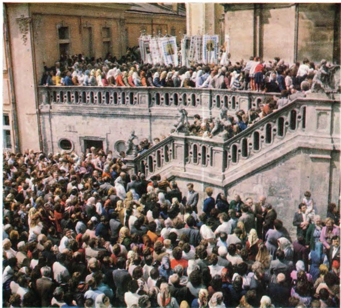
Крестный ход вокруг собора Святого Юра по окончании Божественной литургии 18 мая 1986 года