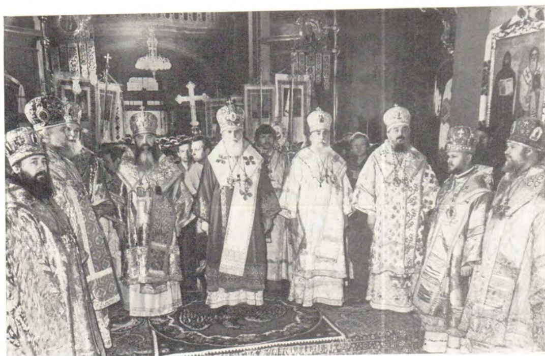
Во время Божественной литургии