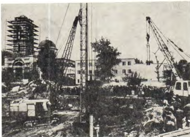
Забита первая свая

При закладке комплекса присутствовали братья обители, сотрудники Отдела внешних церковных сношений во главе с председателем Отдела митрополитом Минским и Белорусским Филаретом, сотрудники отделов и учреждений Московского Патриархата, Управления по строительству монастыря, а также участники IV межрелигиозной миротворческой конференции «круглый стол», проходившей в здании Отдела внешних церковных сношений в Даниловом монастыре с 20 по 23 мая 1986 года. (Материалы конференции будут опубликованы в