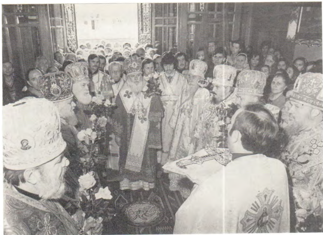
Встреча Преосвященных архиереев перед началом Божественной литургии в соборе Святого Юра 18 мая 1986 года