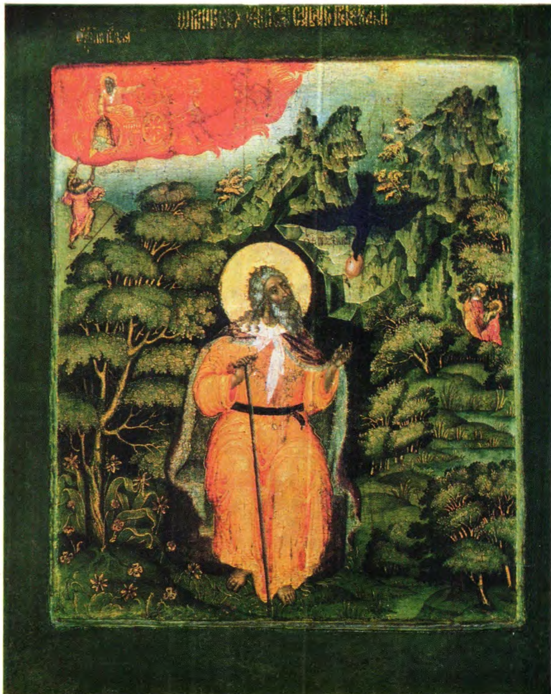
СВЯТОЙ ПРОРОК БОЖИЙ ИЛИЯ (X в. до Р. Х.)