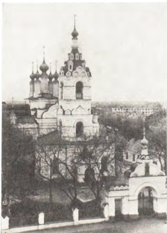
Храм в г. Иваново