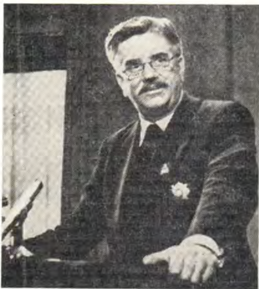
Д-р Глен Гарфилд Вильямс, генеральный секретарь КЕЦ

Когда я оглядываюсь назад, на этот долгий период служения, я не могу не удивляться происшедшим переменам. Ассамблеи всегда были исключительно важными моментами в жизни КЕЦ. И размышляя об этих Ассамблеях, можно увидеть ясную перемену от того, что было, к тому, что есть. Атмосфера на различных Ассамблеях показала стабильный прогресс во взаимопонимании и взаимном доверии. Это развитие взаимопонимания и доверия отражается затем в решениях различных Ассамблей. Первые Ассамблеи были, конечно, поводом для встречи и знакомства, но как только была создана основа для доверия среди представителей европейских Церквей, появилась возмож-