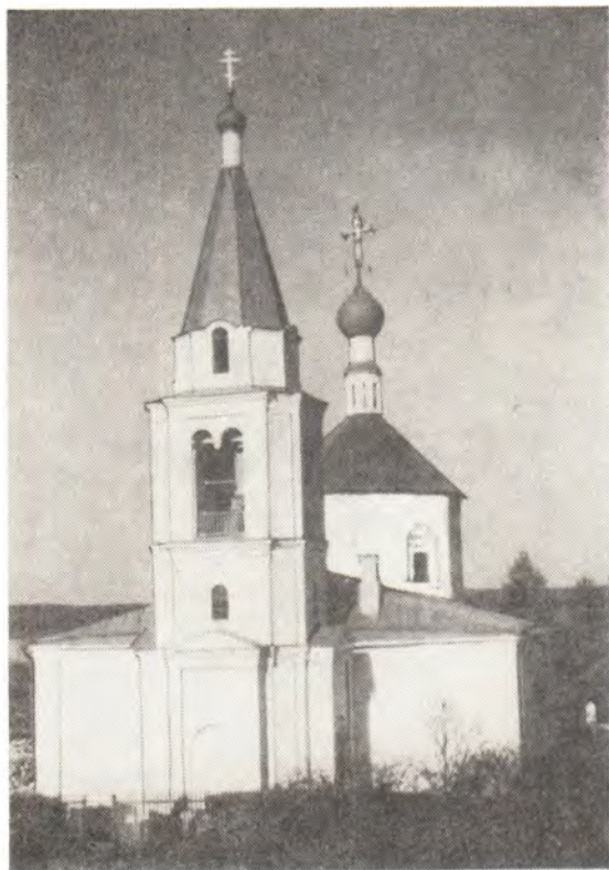
Храм в с. Верзилово Ступинского района Московской епархии