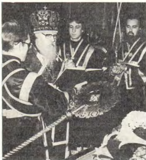
Святейший Патриарх Пимен читает канон перед Святой Плащаницей

27/14 апреля, Неделя ваий, Вход Господень в Иерусалим. Накануне Святейший Патриарх Пимен совершил в патриаршем соборе всеобщее бдение в сослужении архиепископов Но-