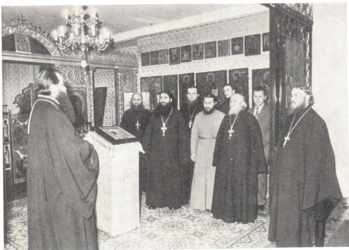
Насельники Почаевской обители в домовом храме во имя преподобного Иосифа Волоцкого, Издательский отдел Московского Патриархата