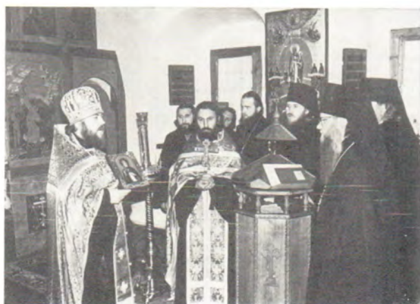
После молебна в Покровском храме Данилова монастыря