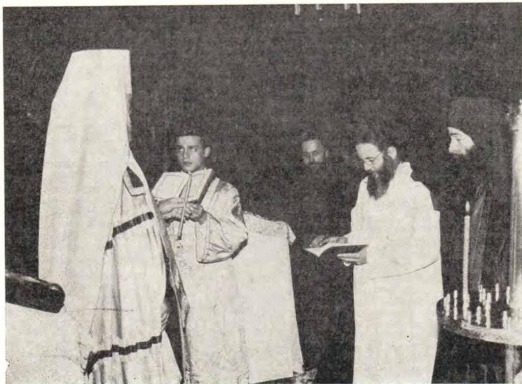
Постриг в Трехсвятительском подворье