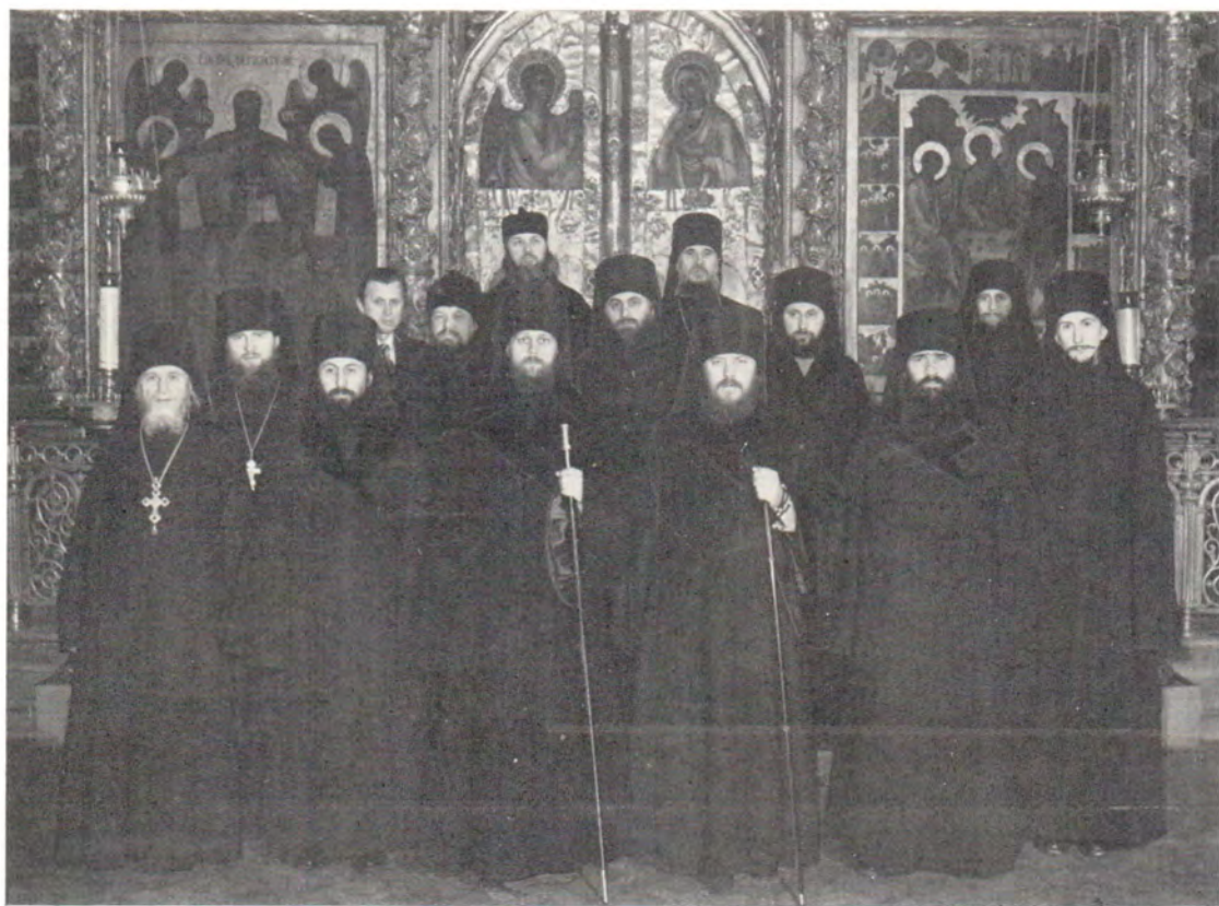
Паломники из Почаева в Успенском соборе Троице-Сергиевой Лавры