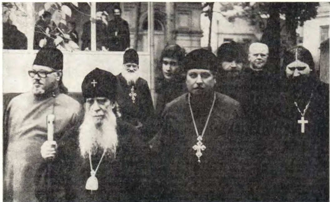
Высокопреосвященный митрополит Зиновий с клириками Александро-Невского храма в день своего Ангела, 12 ноября 1984 года