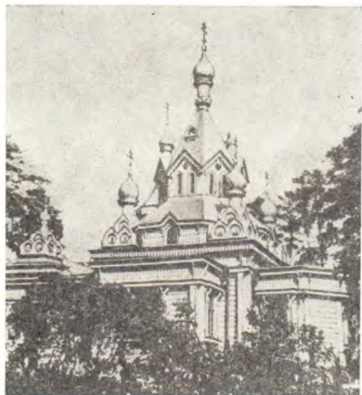
Храм в пос. Удельная Раменского района