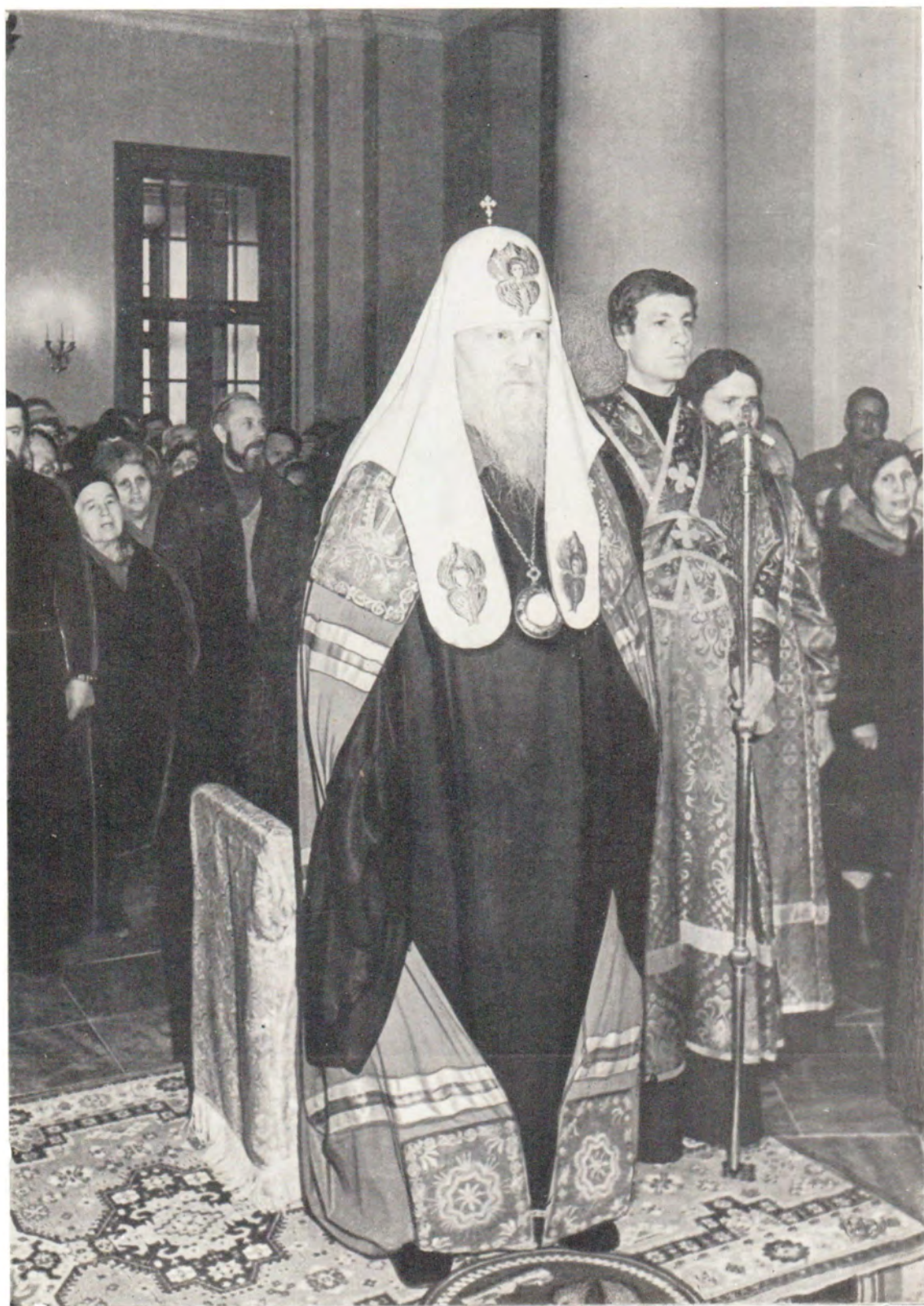
Святейший Патриарх Пимен в Троицком соборе (см. статью на стр. 24)