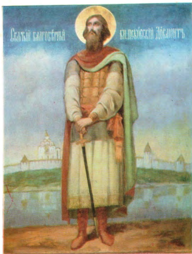
Святой благоверный князь Псковский Довмонт, во святом крещении Тимофей

Икона начала XX века из псковского кафедрального собора