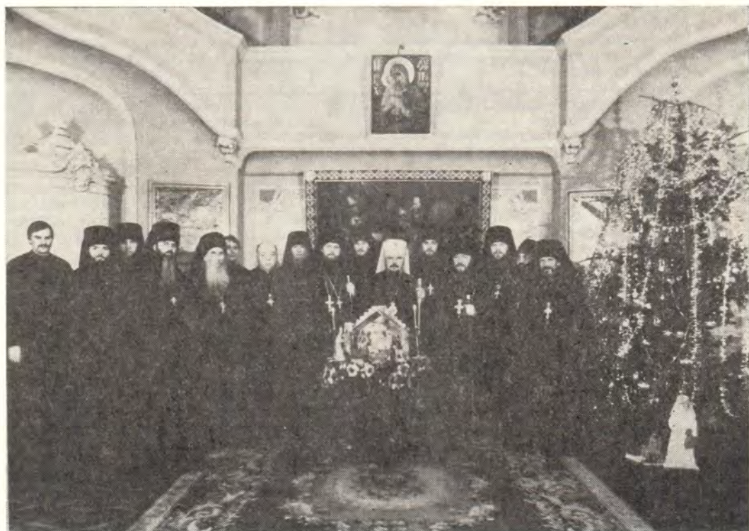
Паломники Троице-Сергиевой Лавры на приеме у митрополита Львовского и Тернопольского Никодима в епархиальном управлении

день, в Неделю по Рождестве Христовом и пред Богоявлением,— за Божественной литургией в кафедральном соборе Святого Юра (во имя великомученика Георгия). Великолепное внутреннее убранство львовских храмов в дни святок, стечение молящихся, всеобщее пение колядок, своеобразие праздничной атмосферы, несущей в себе неповторимый колорит местных традиций, произвели на гостей большое впечатление. После литургии иноков Троице-Сергиевой Лавры принял в Львовском епархиальном управлении митрополит Никодим.