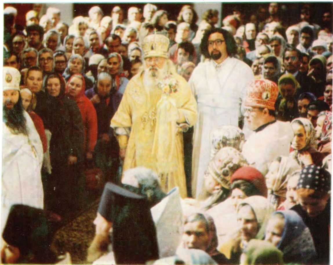
Встреча архипастыря перед началом богослужения