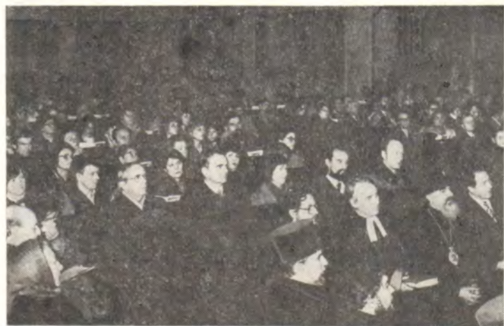
Во время концерта в Софиенкирхе