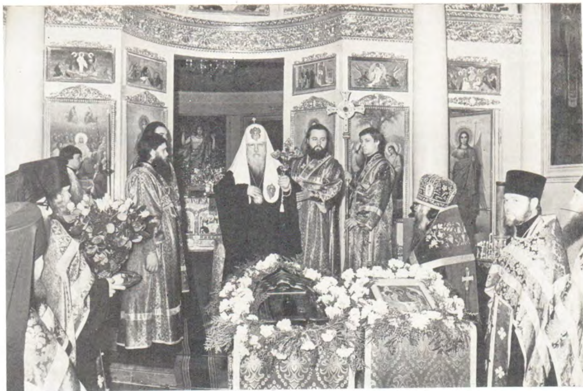
Во время благодарственного молебна в Троицком соборе по случаю окончания реставрационных работ