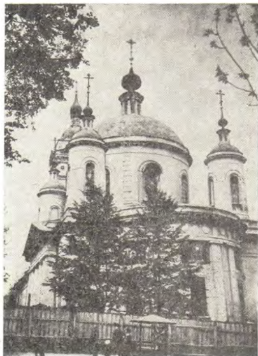
Храм в г. Подольске