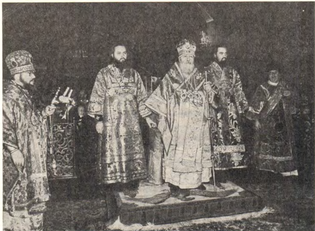
Во время пасхальной утрени

В эти пасхальные дни, когда мы торжественно вспоминаем тридневное восстание из мертвых Христа Жизнодавца, хочется особенно вспомнить, что первыми обращениями Воскресшего Господа и Спасителя нашего Иисуса Христа к Его ученикам были многократно повторяемые слова: Мир вам! Они явились Божественным повелением для Его Церкви, которую Господь создал Своею Божественной Кровию. Можно с уверенностью сказать, что в последние десятилетия с особой силой Русская Православная Церковь проповедует и утверждает мир, благовествуя его дальним и ближним. В своем перво-святительском Послании на праздник Святой Пасхи Вы, Ваше Святейшество, упомянули о настоящем лете благодати Господней, провозглашенном Организацией Объединенных Наций Международным годом мира. В этой связи уместно сказать, что недавно под Вашим председательством Священный