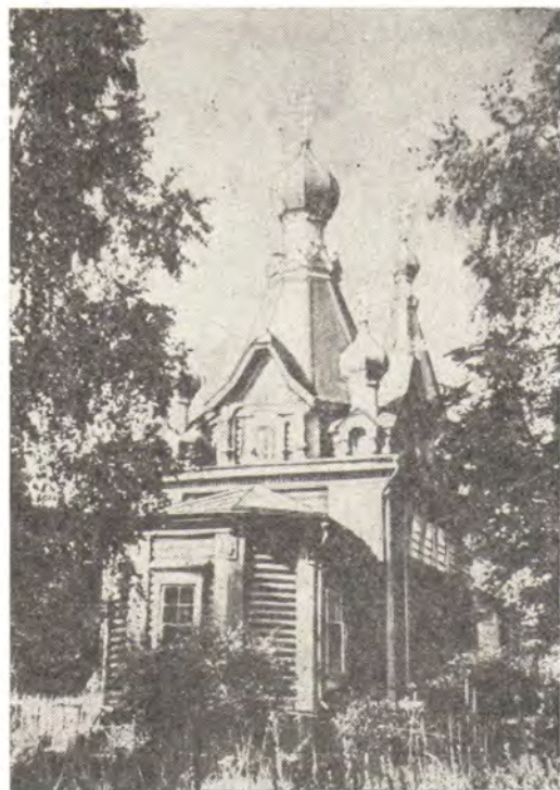
Храм в с. Наташино Люберецкого района