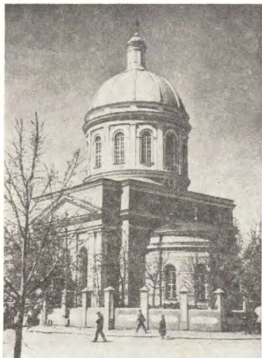
Храм в г. Озеры Коломенского района