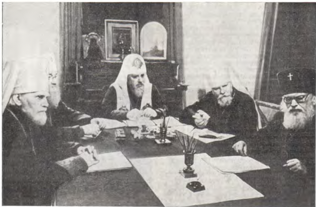
Митрополит Ленинградский и Новгородский Григорий (крайний слева) на заседании Священного Синода под председательством Святейшего Патриарха Алексия, октябрь 1945 года