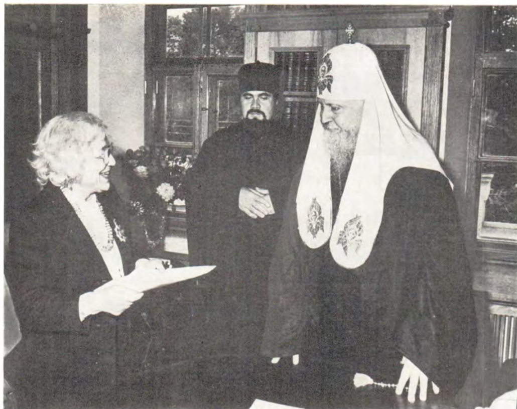
Святейший Патриарх Пимен во время встречи с субсекретарем по делам культа министра иностранных дел и культа Аргентины г-жой д-ром Марией Терезой де Морини в новом здании Отдела внешних церковных сношений в Даниловом монастыре в Москве 12 сентября 1985 года