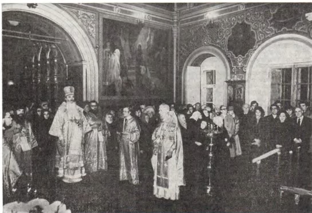
На снимке: начало Божественной литургии

За литургией молились посол Греции в СССР Иоаннис Григориадис, посол Республики Кипр в СССР Михалис Шерифис и находившийся в нашей стране посол Греции в Ирландии Иоаннис Цунис.