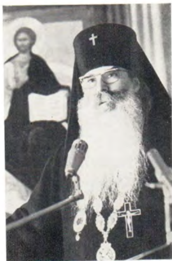
С приветствием выступает архиепископ Волоколамский Питирим