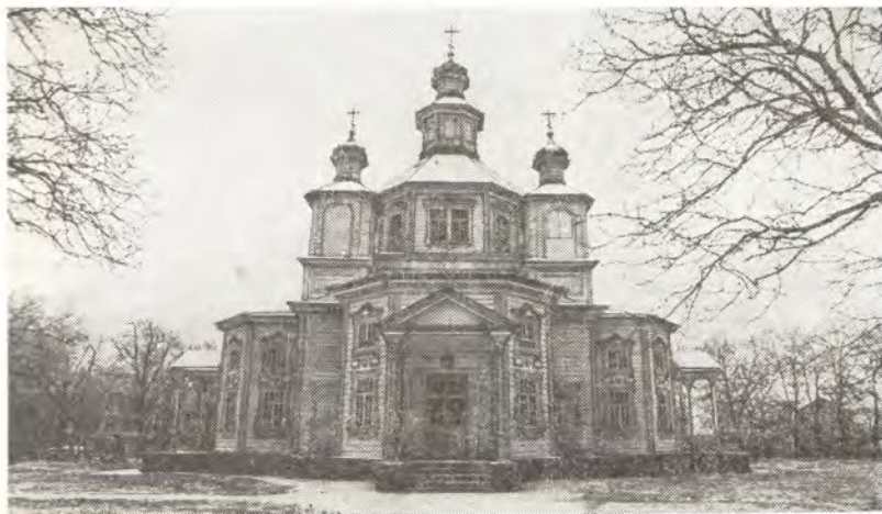
Храм в честь Рождества Пресвятой Богородицы в станице Лысогорской