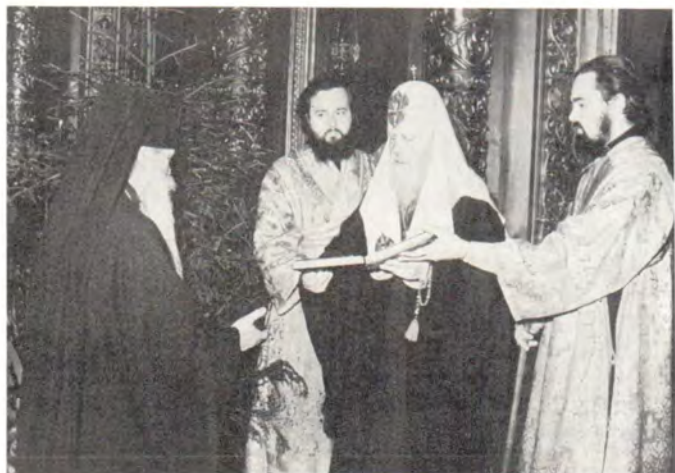
Святейший Патриарх Пимен поздравляет архиепископа Волоколамского Питирима с 60-летием и вручает ему памятные крест и панагию 8 января 1986 года