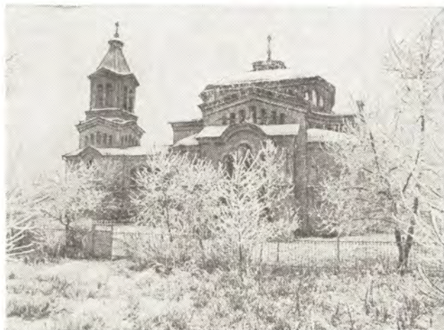
Храм во имя Святителя Николая в станице Зольская, XIX век