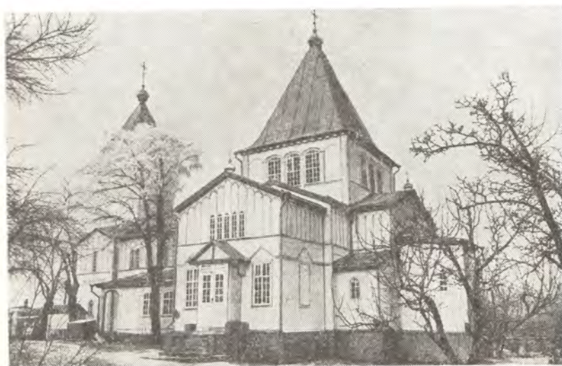
Храм во имя Святителя Николая в г. Эссентуки, основан в 1825 году