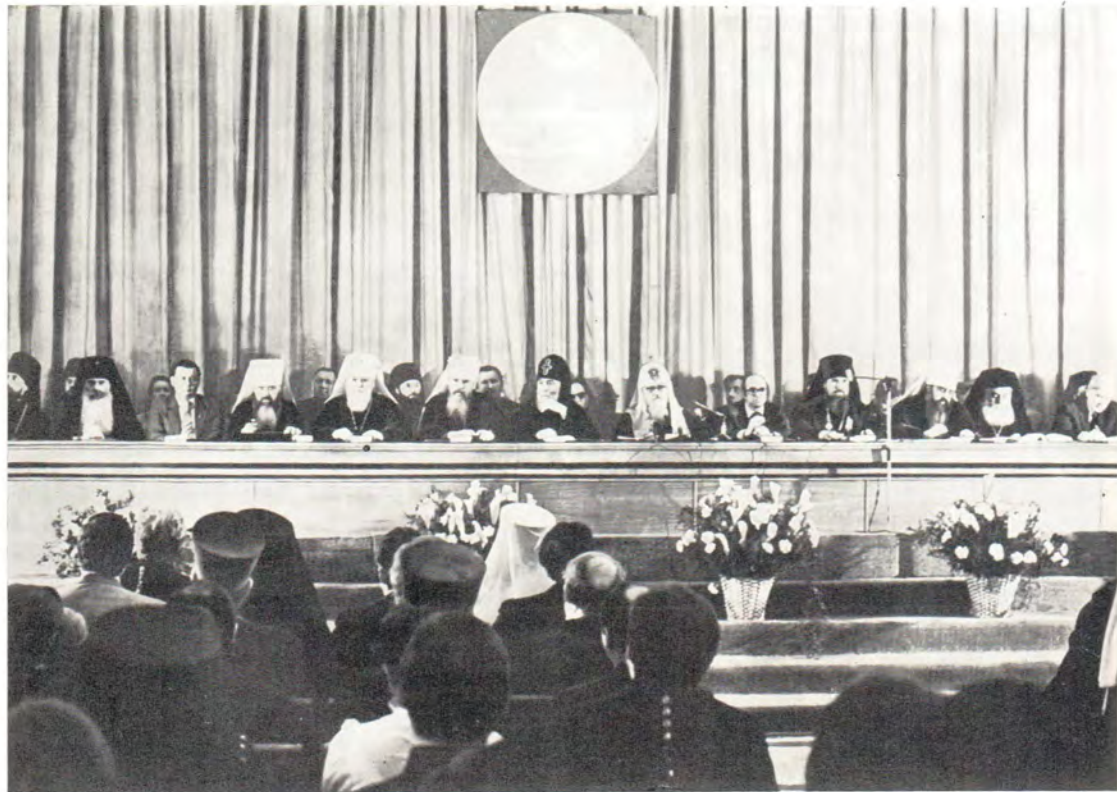
В Большом актовом зале МДА во время юбилейных торжеств 29 декабря 1985 года