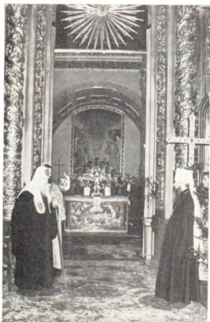
Митрополит Крутицкий и Коломенский Ювеналий поздравляет Святейшего Патриарха Пимена с праздником Рождества Христова по окончании вечернего богослужения 8 января 1986 года