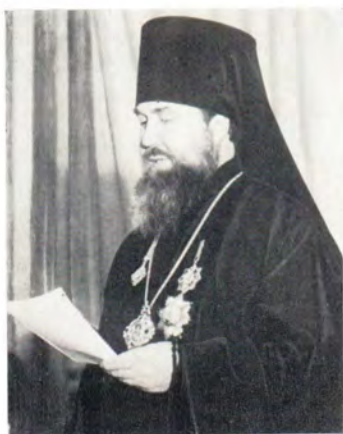
Выступает ректор МДА епископ Дмитровский Александр