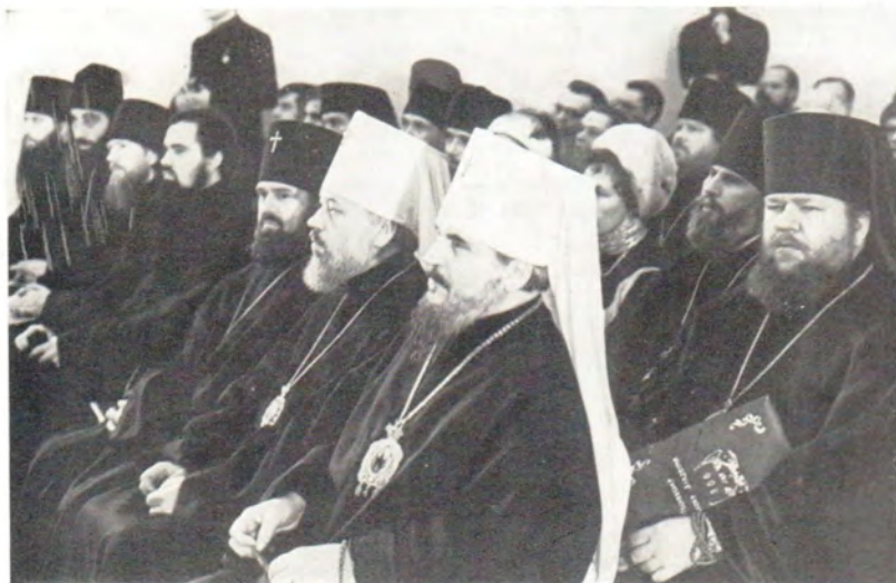
Участники юбилейных торжеств