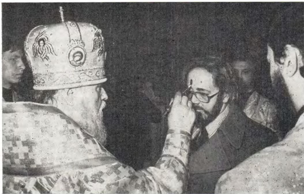
Святейший Патриарх Пимен в Богоявленском патриаршем соборе за всенощным бдением в канун праздника Рождества Христова, 6 января 1986 года, совершает помазание верующих освященным елеем

23 (10) февраля, Неделя о мытаре и фарисее. Накануне Святейший Патриарх Пимен в Богоявленском патриаршем соборе совершил всенощное бдение в сослужении архиепископа Зарайского Иова.