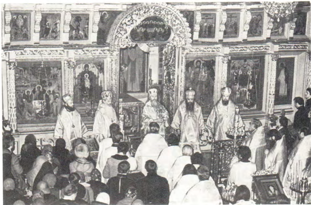
В день юбилея, 29 декабря 1985 года, после Божественной литургии в академическом Покровском храме с приветственным словом к собравшимся обращается митрополит Таллинский и Эстонский Алексей