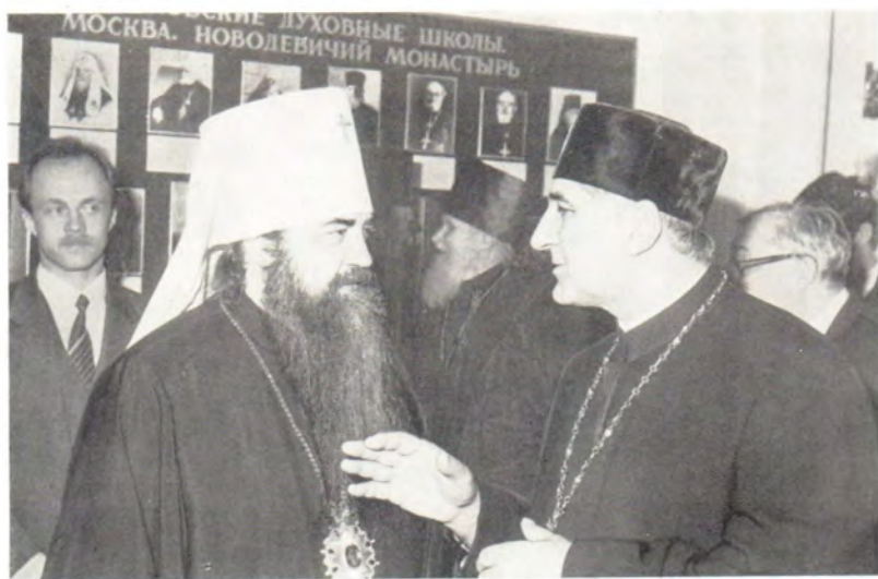
Митрополит Минский и Белорусский Филарет беседует с представителем Румынской Православной Церкви профессором протоиереем Стефаном Алексеем