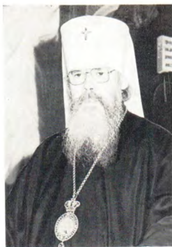
Приветствие митрополита Таллинского и Эстонского Алексия