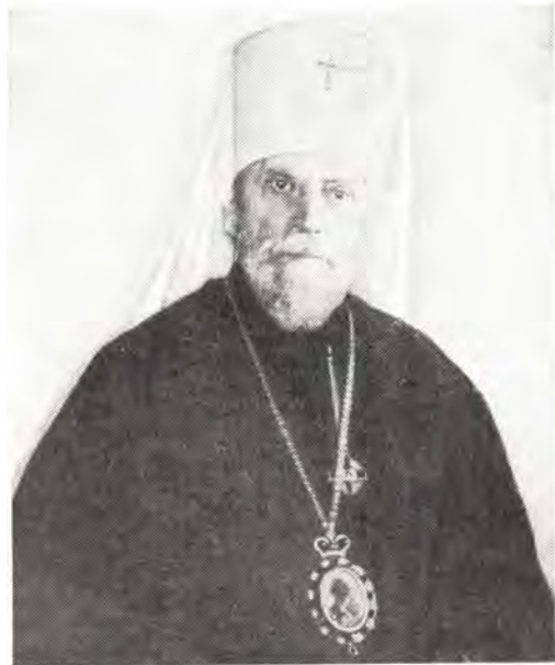
Высокопреосвященный Григорий, митрополит Ленинградский и Новгородский

Как известно, в 1922 году в Русской Церкви возникло так называемое обновленческое движение. Свое отношение к нему протоиерей Николай Чуков выразил в беседе «О церковных разделениях», проведенной в Николо-Богоявленском соборе 21 (8) августа 1929 года: «В са-