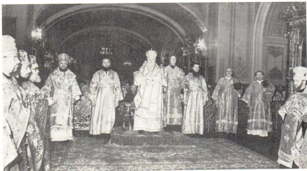
В канун праздника Рождества Христова Святейший Патриарх Пимен совершает все-нощное бдение в Богоявленском соборе в сослужении архиепископа Зарайского Иова и клириков, 6 января 1986 года