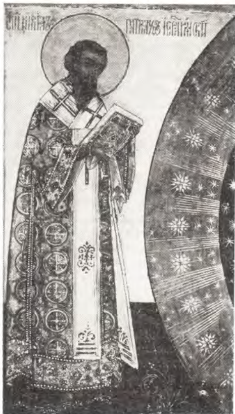
Святитель Кирилл Иерусалимский

Фрагмент иконы «О Всепетая Мати» из храма во имя пророка Илии в Черкизове в Москве, XVIII век