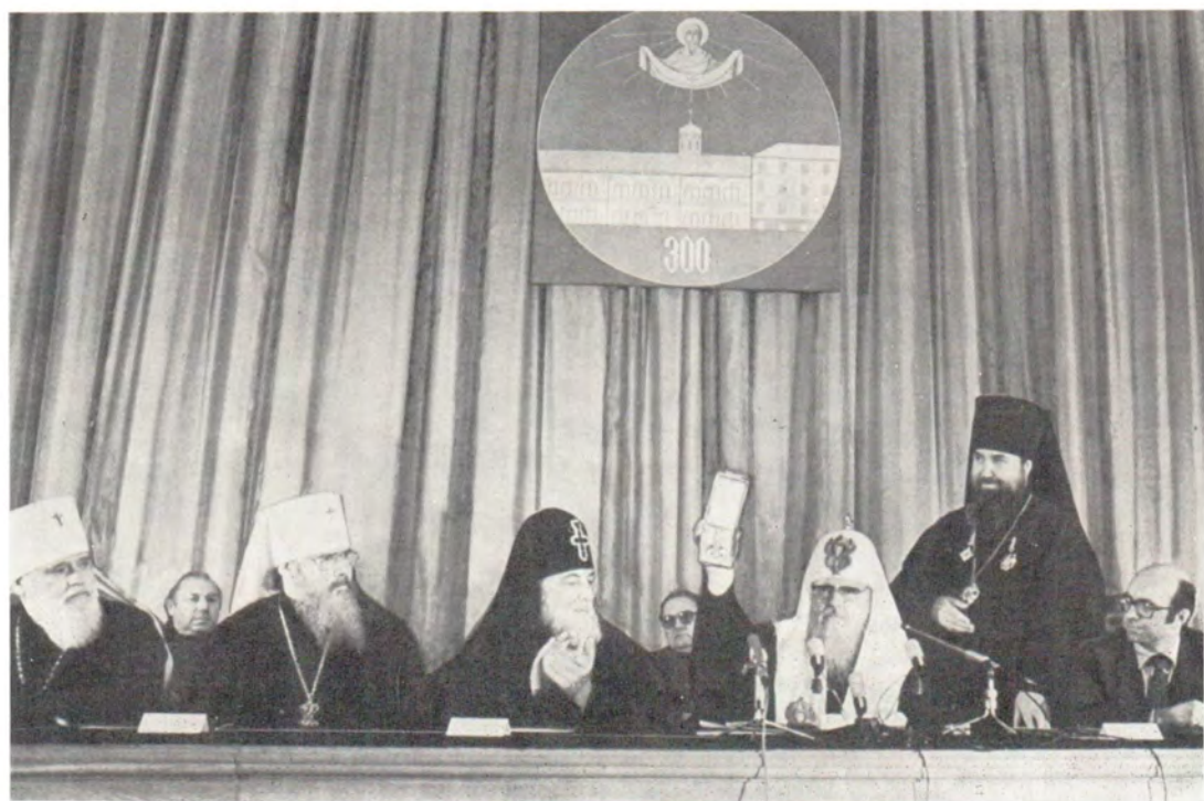
Святейший Патриарх Пимен награждает Московскую Духовную Академию орденом Преподобного Сергия Радонежского I степени