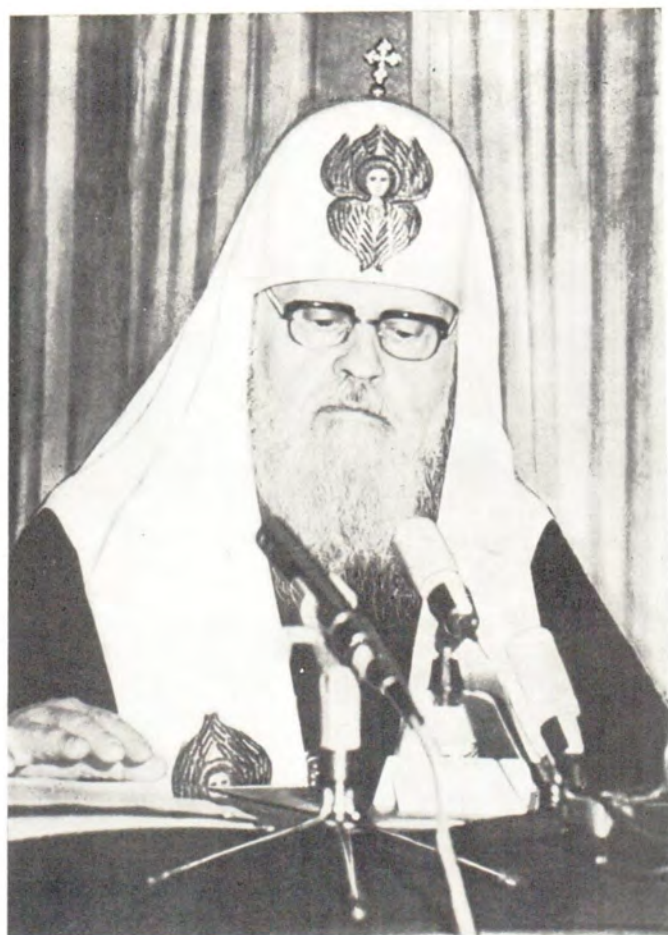
Святейший Патриарх Пимен поздравляет Московскую Духовную Академию с ее знаменательным юбилеем