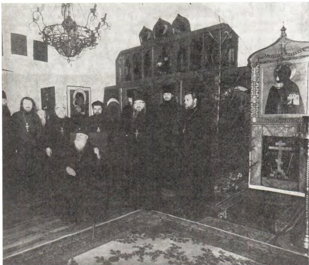
Святейший Патриарх Пимен, сопровождавшие его архиепископ Воронежский и Липецкий Мефодий и протопресвитер Матфей Стаднюк в гостях у братии Данилова монастыря, 15 января 1986 года

приступить к строительству гостиничного комплекса. Восстановлены почти все фасады храмов и соборов.