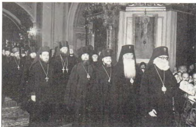
Преосвященные архиереи и клирики во время рождественского поздравления Святейшего Патриарха Пимена 8 января 1986 года