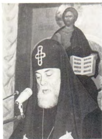
Выступление Католикоса-Патриарха всей Грузии Или II