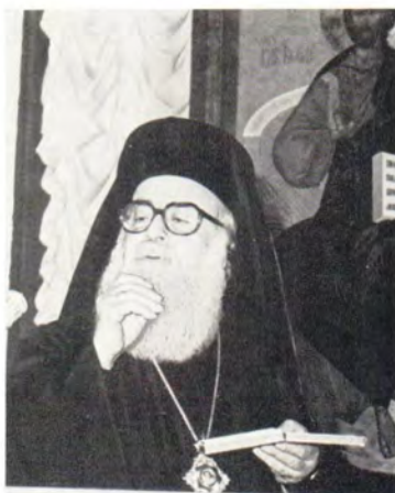
Выступление митрополита Бострского Василия Самаха