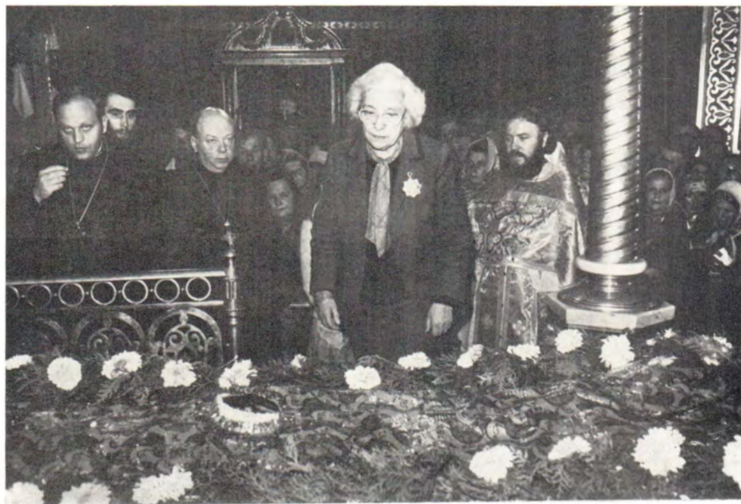
Субсекретарь по делам культа министра иностранных дел и культа Аргентины г-жа д-р Мария Тереза де Морини в Почаевской Успенской Лавре у раки с мощами преподобного Иова Почаевского в Успенском соборе Лавры в праздник Обретения мощей преподобного Иова, 10 сентября 1985 года