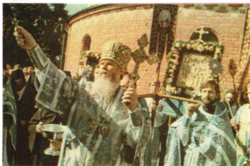
Митрополит Таллинский и Эстонский Алексей окропляет верующих святой водой во время крестного хода