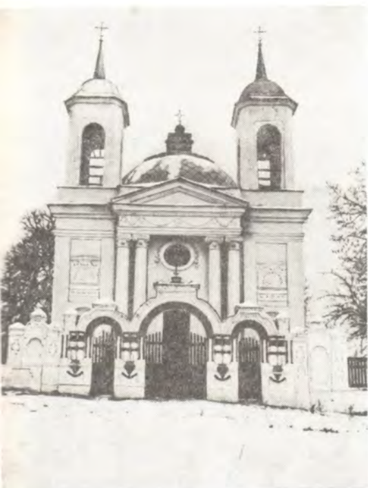
Успенский храм в с. Вишенки Коропского района