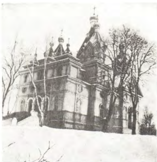
Успенский храм в с. Сильченково Талалаевского района