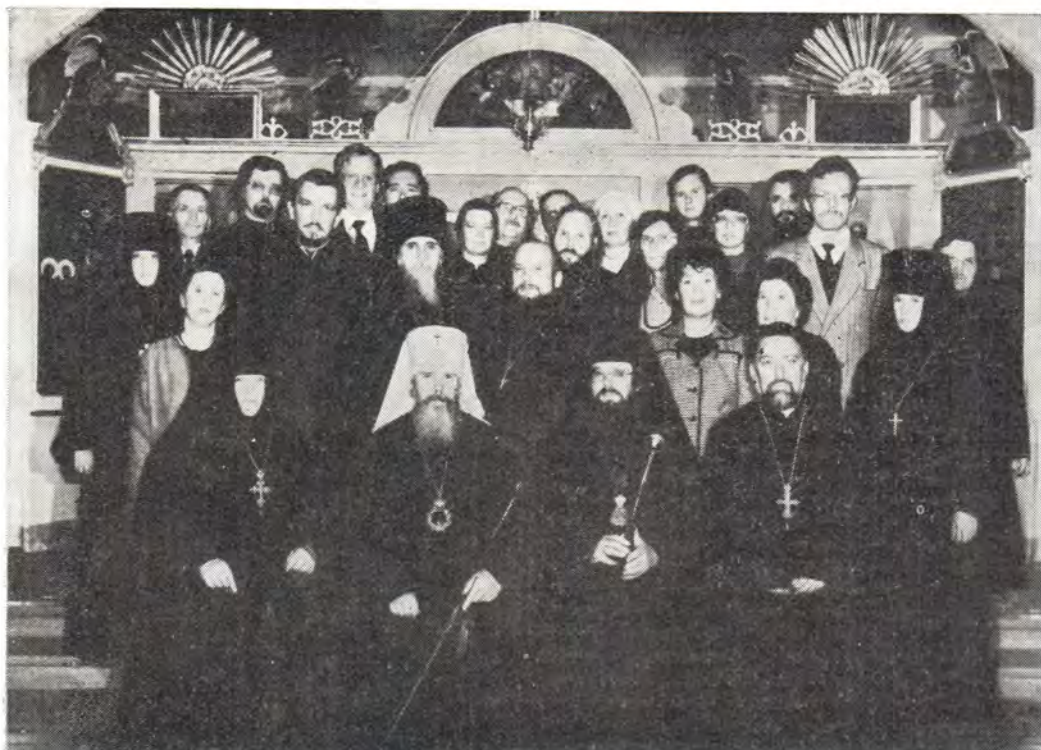
Митрополит Таллинский и Эстонский Алексей и митрополит Оулуский Лев, паломники из Финляндии и клирики Таллинской епархии в Пюхтицком Успенском монастыре 29 сентября 1985 года

ра, монастырское духовенство, насельницы обители, богомольцы.