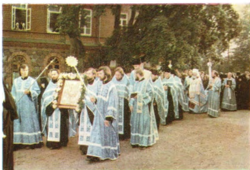
Крестный ход в праздник Успения Пресвятой Богородицы, 28 августа 1985 года