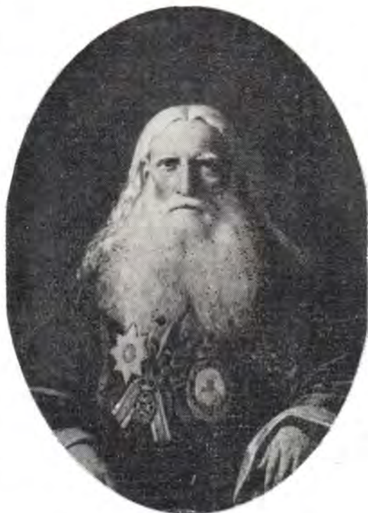
Епископ Чигиринский Порфирий (Успенский; † 1885)

Во время пребывания на Ближнем Востоке архимандрит Порфирий много ездил по Палестине, Сирии, Египту. Посещая христианские святыни, он изучал древние манускрипты, хранящиеся в монастырских книгохранилищах. В Иверском монастыре на Афоне отец Порфирий обнаружил некоторые документы, имевшие отношение к попыткам восстановления церковного единства между Армянской Апостольской и Православной Церквями в XII веке. Вот что сообщал он по этому поводу митрополиту Петербургскому Антонию (Рафальскому; 1843—1848) в письме от 12 февра-