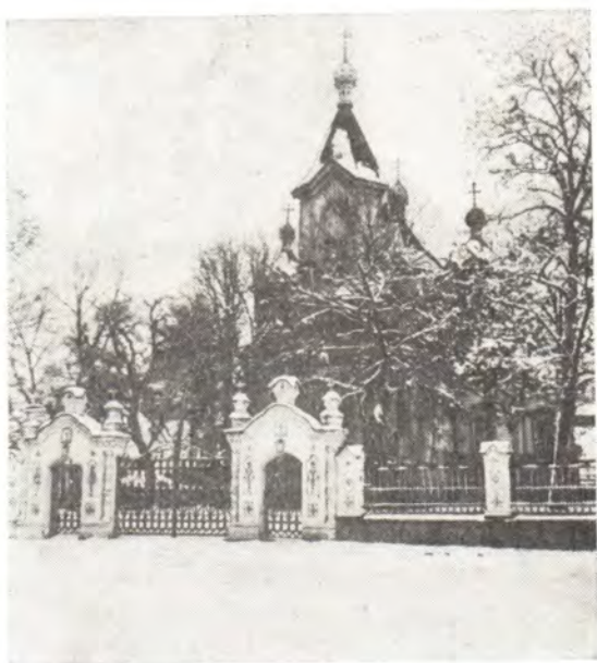
Трехсвятительский храм в г. Прилуки