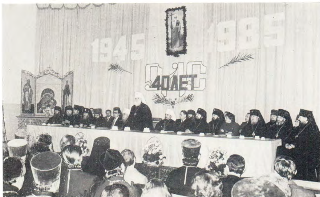
Речь митрополита Киевского и Галицкого Филарета на торжественном акте