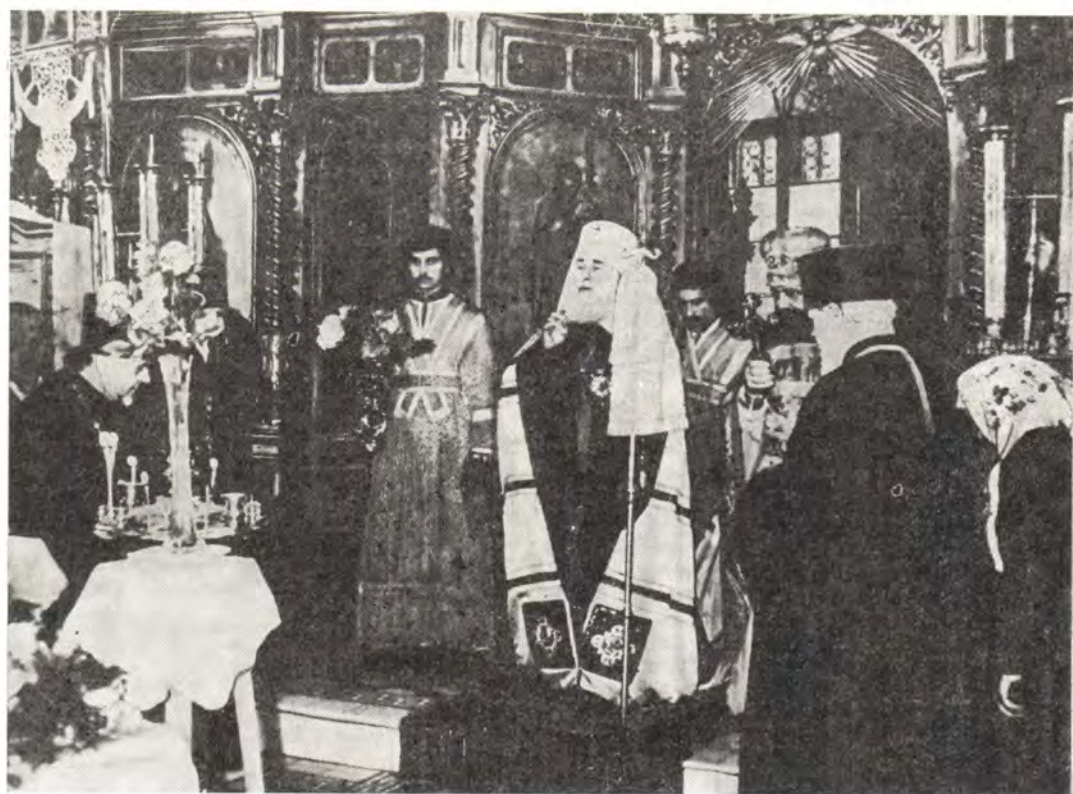
Митрополит Одесский и Херсонский Сергей благословляет молящихся в Николаевском храме в г. Вилкове после Божественной литургии 22 сентября 1985 года

строен на средства, собранные местными жителями.