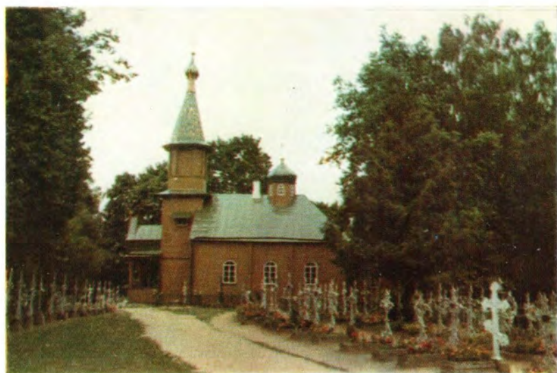
Арсениевский храм имя Святого Арсения Большого