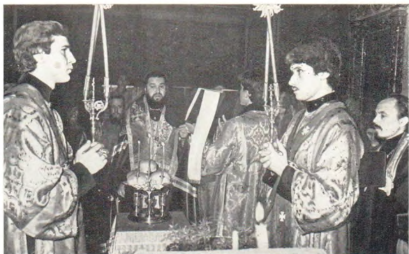
Во время литии на всеобщем бдении