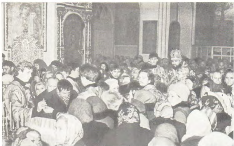
За всеобщим бдением