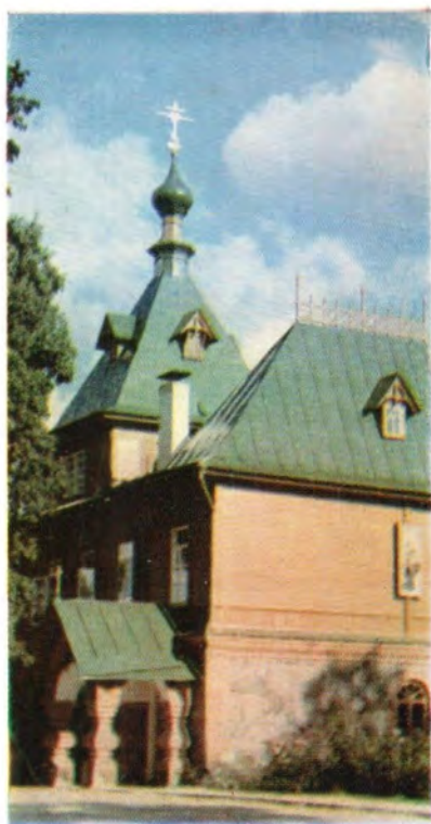
Храм во имя святых Симеона Богоприимца и Анны пророчицы