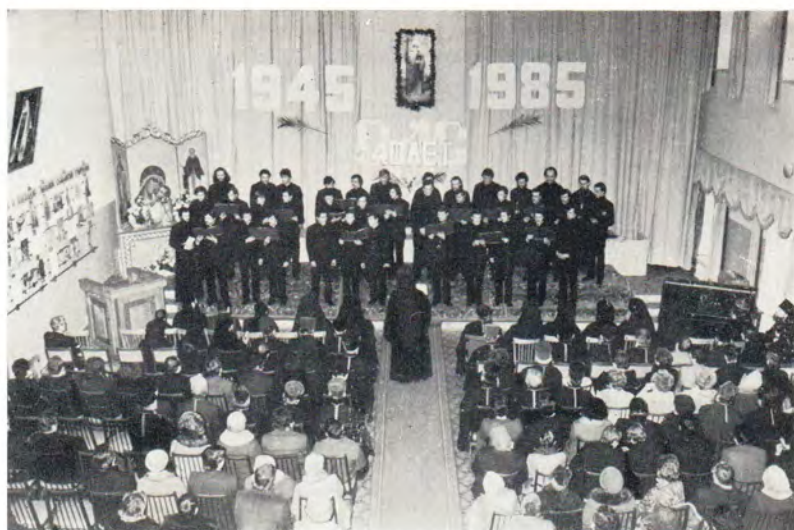
Концерт духовной музыки