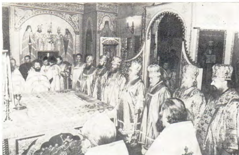
Пресвященные архиереи и клирики — участники Божественной литургии в храме в честь Успения Божией Матери