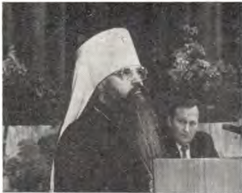
Выступает митрополит Минский и Белорусский Филарет

очень легким; разделено царство твое... (Дан. 5, 26—28). Так Высшая Мудрость вносит свои коррективы в великую книгу мировой истории, сметая с лица Земли грех и зло и очищая в этом горниле золото добра.