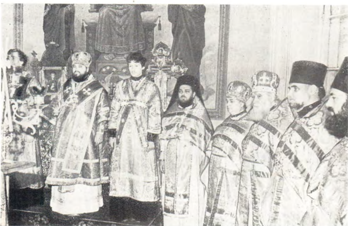
За Божественной литургией