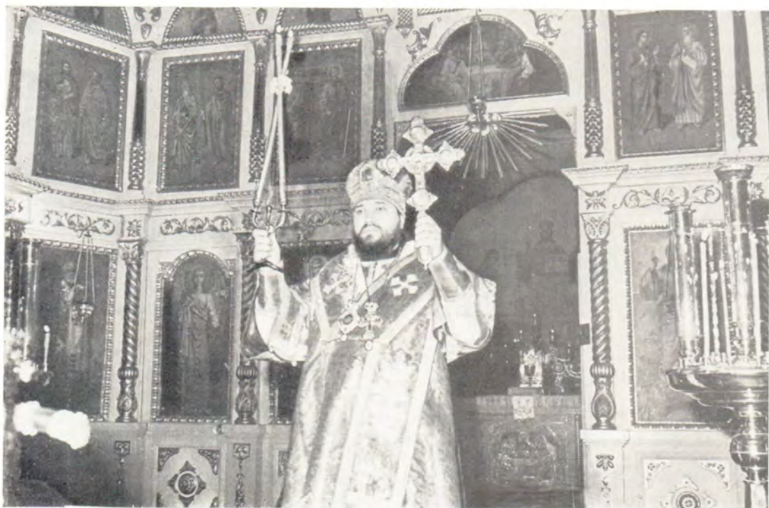
Богослужение совершает епископ Ставропольский и Бакинский Антоний