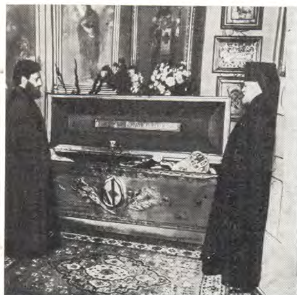
Рака с мощами святителя Феодосия, архиепископа Черниговского, в алтаре Воскресенского кафедрального собора в г. Чернигове. Справа — архиепископ Черниговский и Нежинский Антоний

шим о поездке паломнической группы Русской Православной Церкви, которую он возглавлял, во Святой Град Иерусалим в 1985 году.