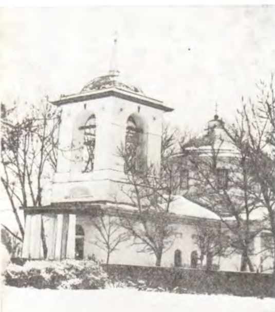
Михайловский храм в с. Безугловке Нежинского района