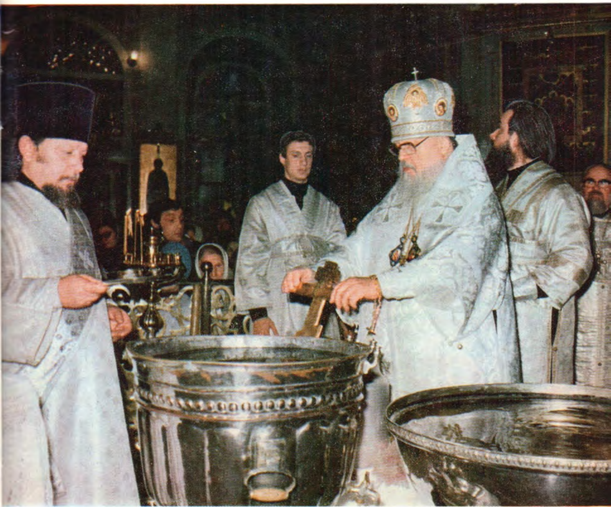
Праздник Святого Богоявления. Освящение воды 19 января 1985 года в Богоявленском патриаршем соборе совершает Святейший Патриарх Пимен