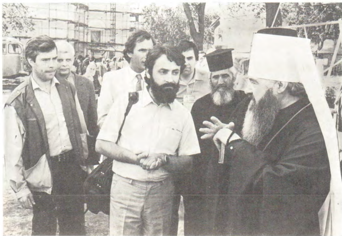
Митрополит Крутицкий и Коломенский Ювеналий беседует с гостями XII Всемирного фестиваля молодежи и студентов — участниками экуменического заседания, 28 июля 1985 года