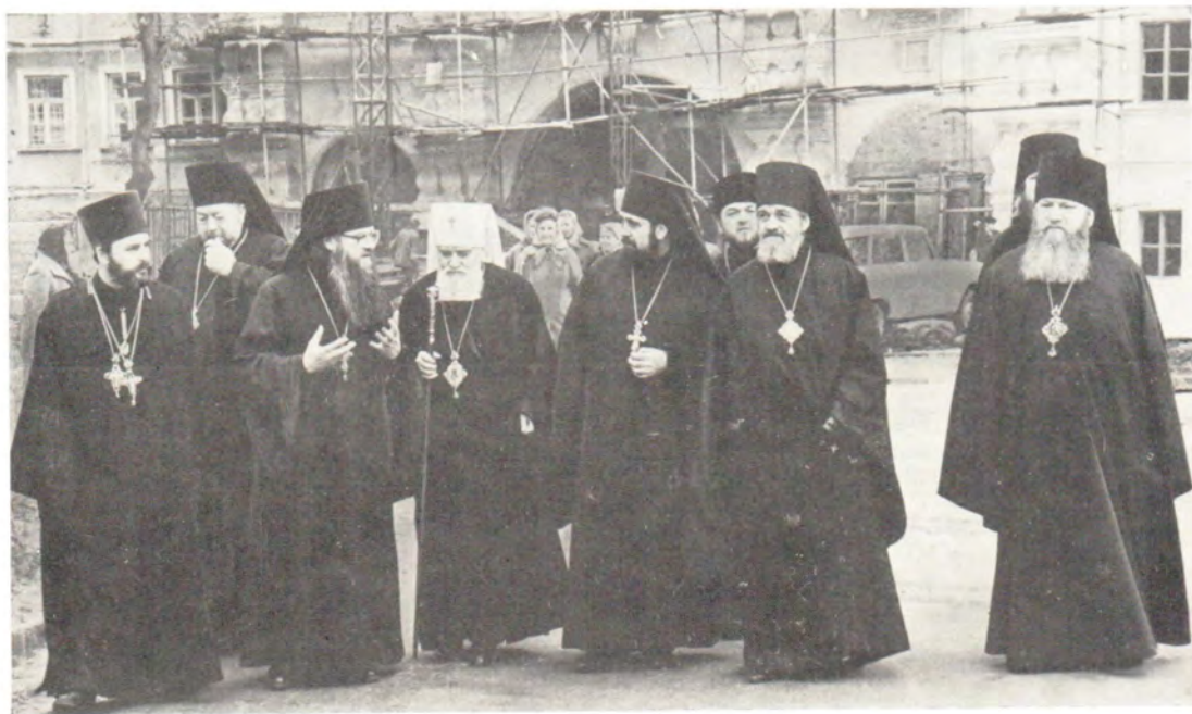
Делегация Чехословацкой Православной Церкви во главе с Блаженнейшим Митрополитом Пражским и всей Чехословакии Дорофеем на территории монастыря, 8 октября 1984 года