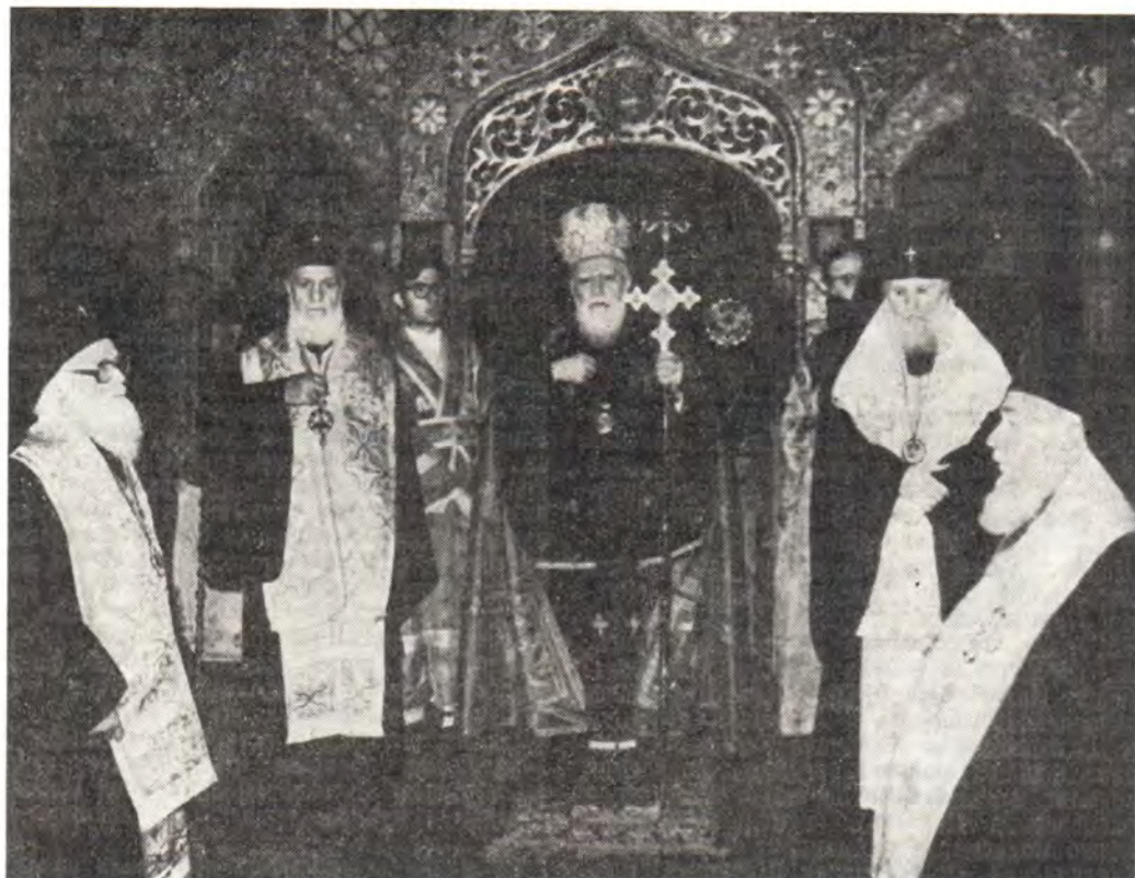
Святейший Патриарх Болгарский Максим и сослужащие ему архипастыри во время благодарственного молебна

«В дивный ряд знаменательных годовщин, светлых праздников и чествований, — сказал Высокопреосвященный Панкратий, — сегодня Божий Промысл, Его всеблагая воля включает еще одно юбилейное празднование — 75-летие со дня рождения Его Святейшества Патриарха Московского и всея Руси Пимена. Мы совершаем сейчас этот благословенный праздник, украшенный молитвенным участием Вашего Святейшества, Высокопреосвященных митрополитов, Преосвященных епископов, клира и боголюбивого народа, выражая наше высокое уважение и любовь к досточтимому юбиляру, Духовному Кормчому великой Русской Православной Церкви, выдающемуся гражданину-патриоту и общественному деятелю своей славной и могучей Родины, большому другу нашей Святой Церкви и Отечества».