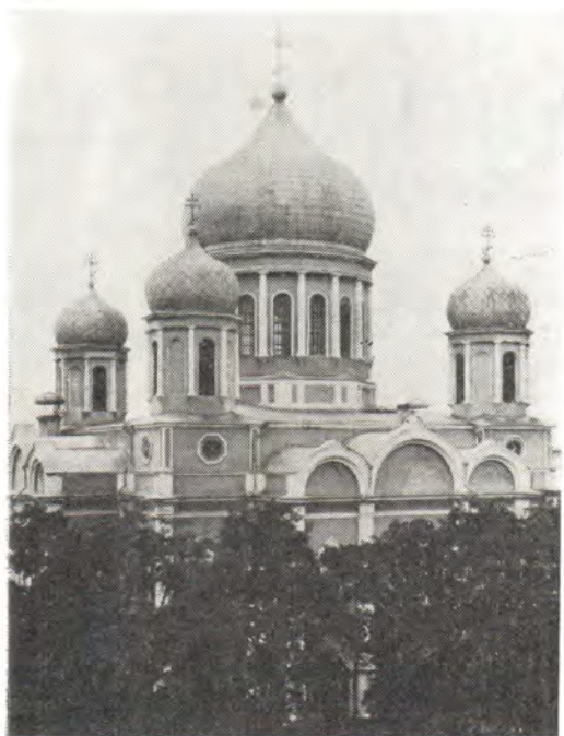
Кафедральный собор в честь Рождества Пресвятой Богородицы в г. Ростове-на-Дону

Пимен, Краснодарский и Кубанский Владимир, Винницкий и Брацлавский Агафангел. После литургии были совершены молебен, крестный ход и возглашены уставные многолетия.