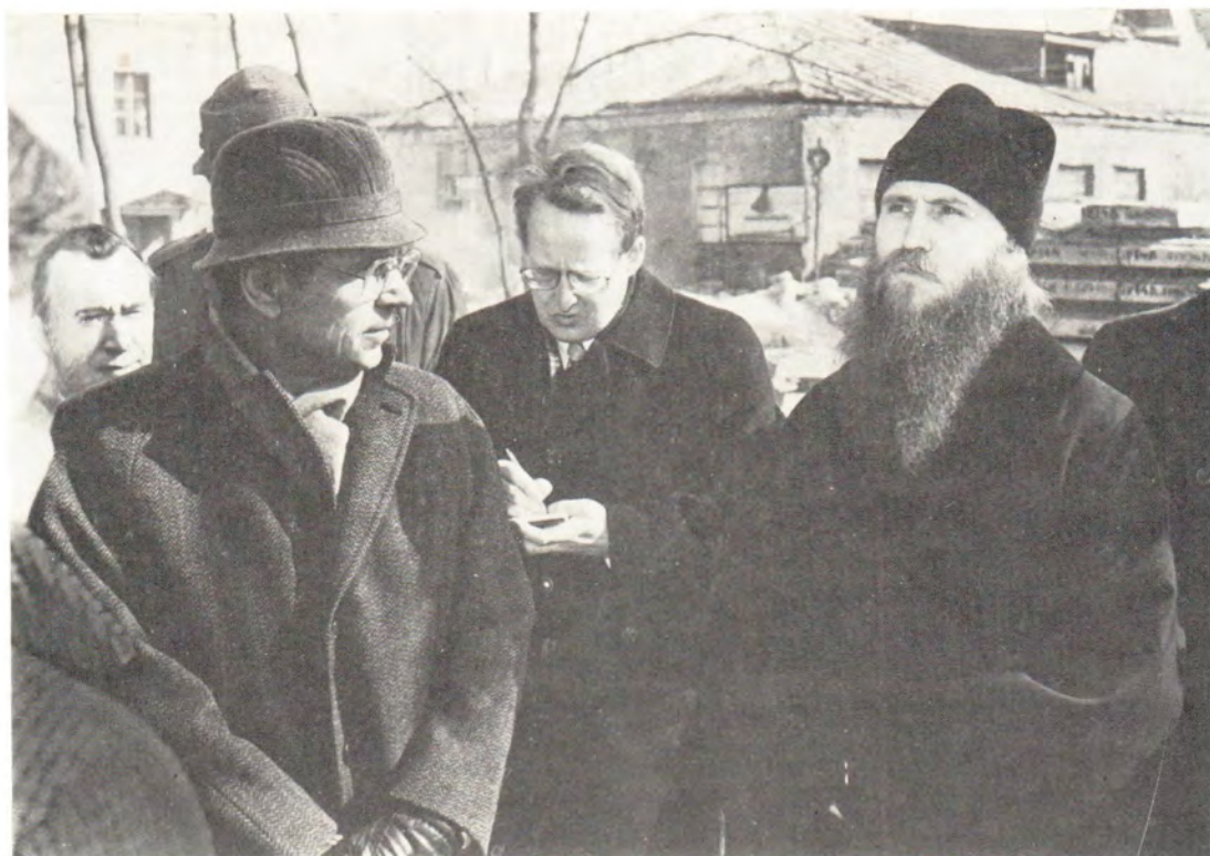
Участники международного семинара «Христианские коммуникаторы в борьбе за мир» знакомятся с жизнью монастыря, 22 марта 1985 года