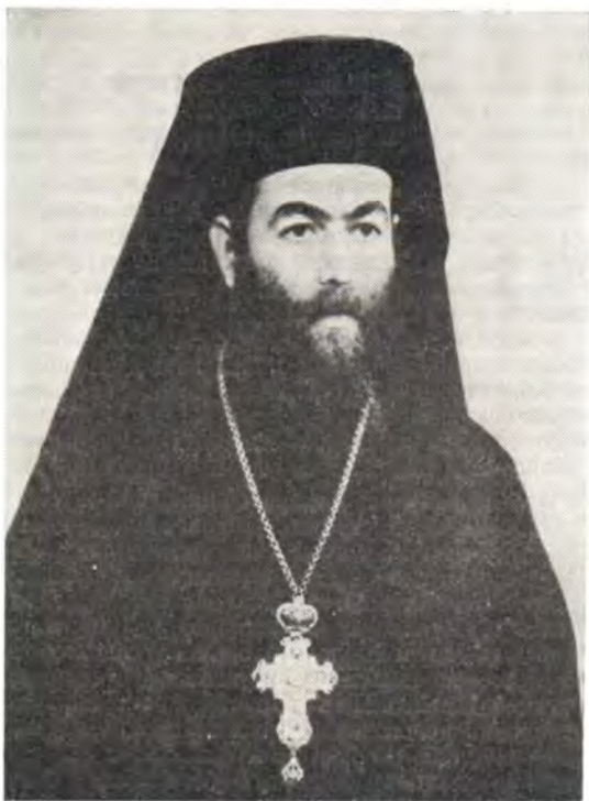
Экзарх Патриарха Александрийского архимандрит Феодор

Затем состоялся официальный прием по случаю прибытия архимандрита Феодора, на котором были митрополит Сергей, делегация Элладской Церкви, клирики Одессы, сотрудники епархиального управления.