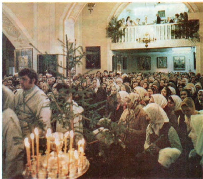
Верующий народ во время молитвы за Божественной литургией