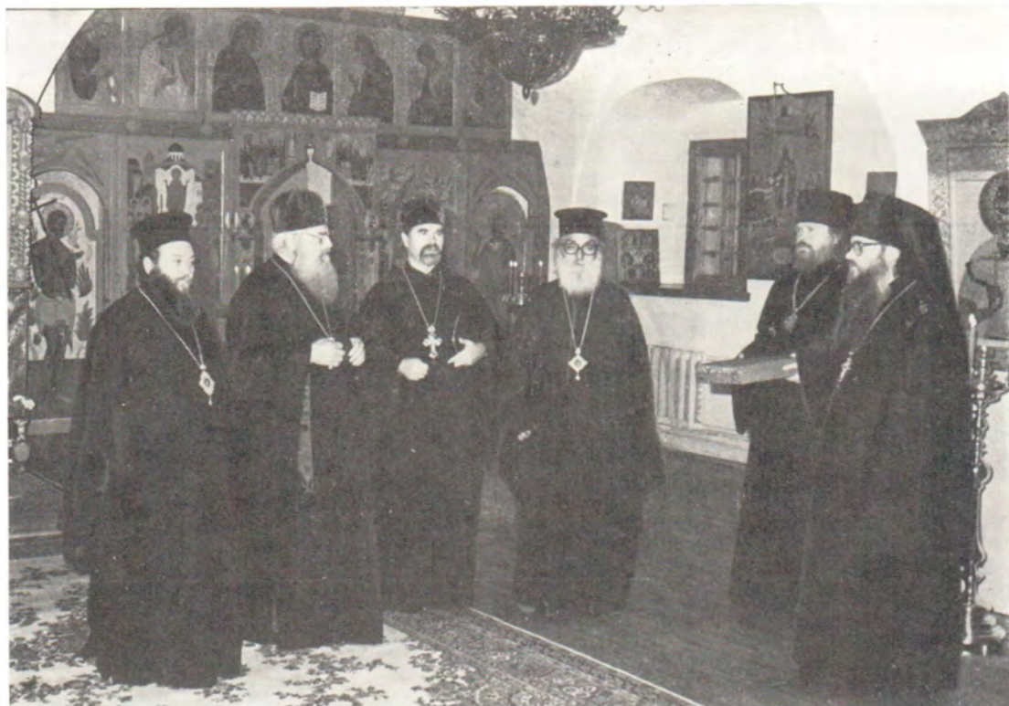
Наместник монастыря архимандрит Евлогий приветствует Блаженнейшего Папу и Патриарха Александрийского Николая VI в Покровском храме, 22 марта 1985 года