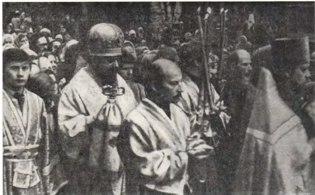
Епископ Пермский и Соликамский Афанасий совершает крестный ход вокруг Всехсвятского храма в г. Перми 9 июня 1985 года, в Неделю Всех святых

голетия. У могил почивших строителей и духовенства храма была совершена лития. Архипастырь благословил молящихся и вручил каждому из них крестик.