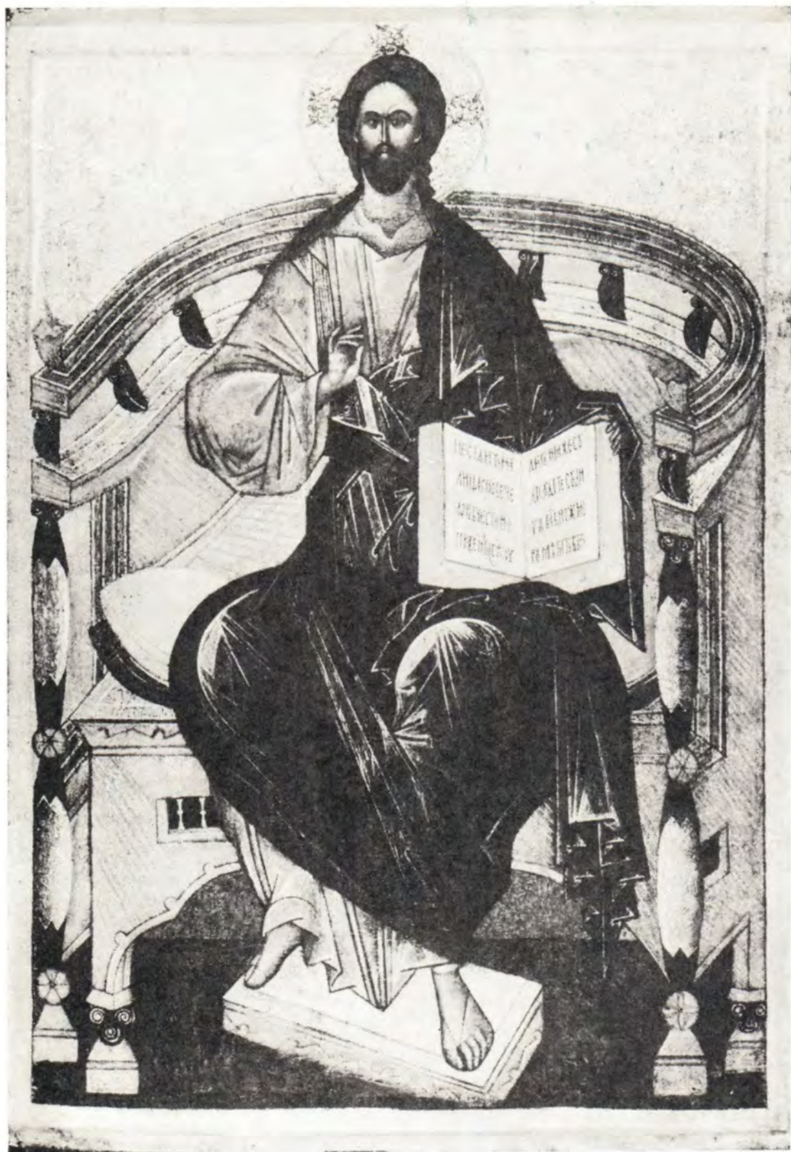
ГОСПОДЬ ВСЕДЕРЖИТЕЛЬ НА ПРЕСТОЛЕ