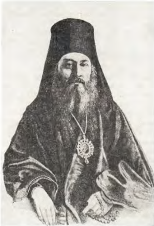
Архиепископ Иннокентий (в миру Иван Алексеевич Борисов) родился в 1800 году в семье священника. По окончании Киевской

Духовной Академии в 1823 году назначен инспектором и профессором церковной истории и греческого языка Санкт-Петербургской Духовной Семинарии, затем — ректором Александро-Невского Духовного училища, где он принял монашество с именем Иннокентий — в честь святителя Иннокентия, епископа Иркутского, и был рукоположен во иеромонаха. В 1826 году возведен в сан архимандрита и назначен преподавателем в Санкт-Петербургскую Духовную Академию, где вскоре стал инспектором и профессором.