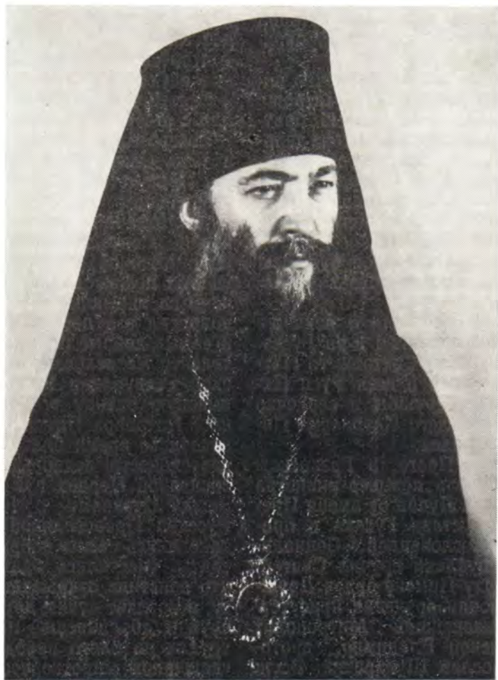
Епископ Переяслав-Хмельницкий Антоний

Постановлением Святейшего Патриарха Пимена и Священного Синода от 4 октября 1985 года архимандриту Антонию (Москаленко), настоятелю Владимирского кафедрального собора в г. Киеве и управляющему делами Украинского Экзархата, определено быть епископом Переяслав-Хмельницким.