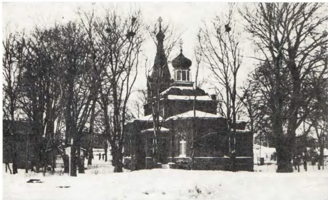
Богоявленский храм в г. Иыхви, Таллинская епархия