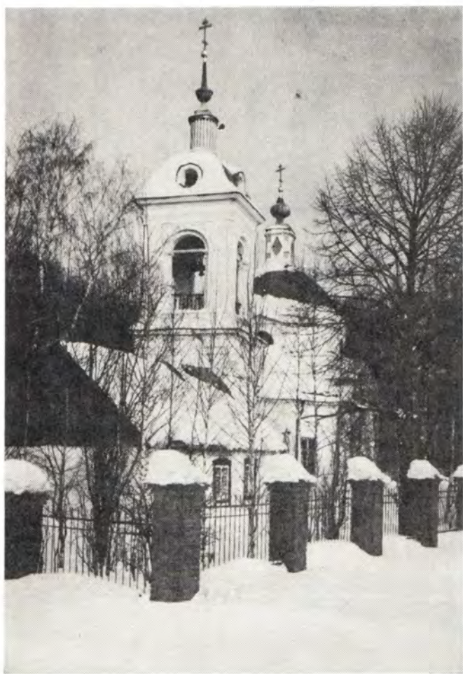
Храм во имя Иоанна Предтечи в с. Ивановское, Московская епархия