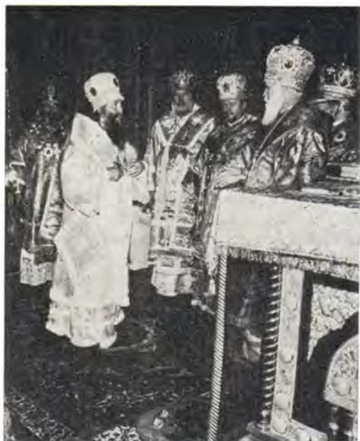
Участники хиротонии после совершения Таинства

служении, к которому меня призываете, избытком вашей любви восполните мое убожество, вашей духовной мудростью просветите мое неведение, ведите мою немощь благим путем делания предлежащего мне великого дела Христова. Ему же да будут честь и слава во веки веков! Аминь».