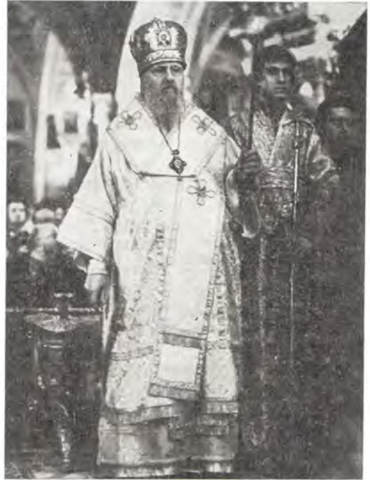
Святейший Патриарх Пимен совершает всенощное бдение в Богоявленском патриаршем соборе в канун дня памяти Святителя Николая, 18 декабря 1985 года

Во время литургии Святейший Патриарх Пимен удостоил митрополита Ростовского и Новочеркасского Влади-