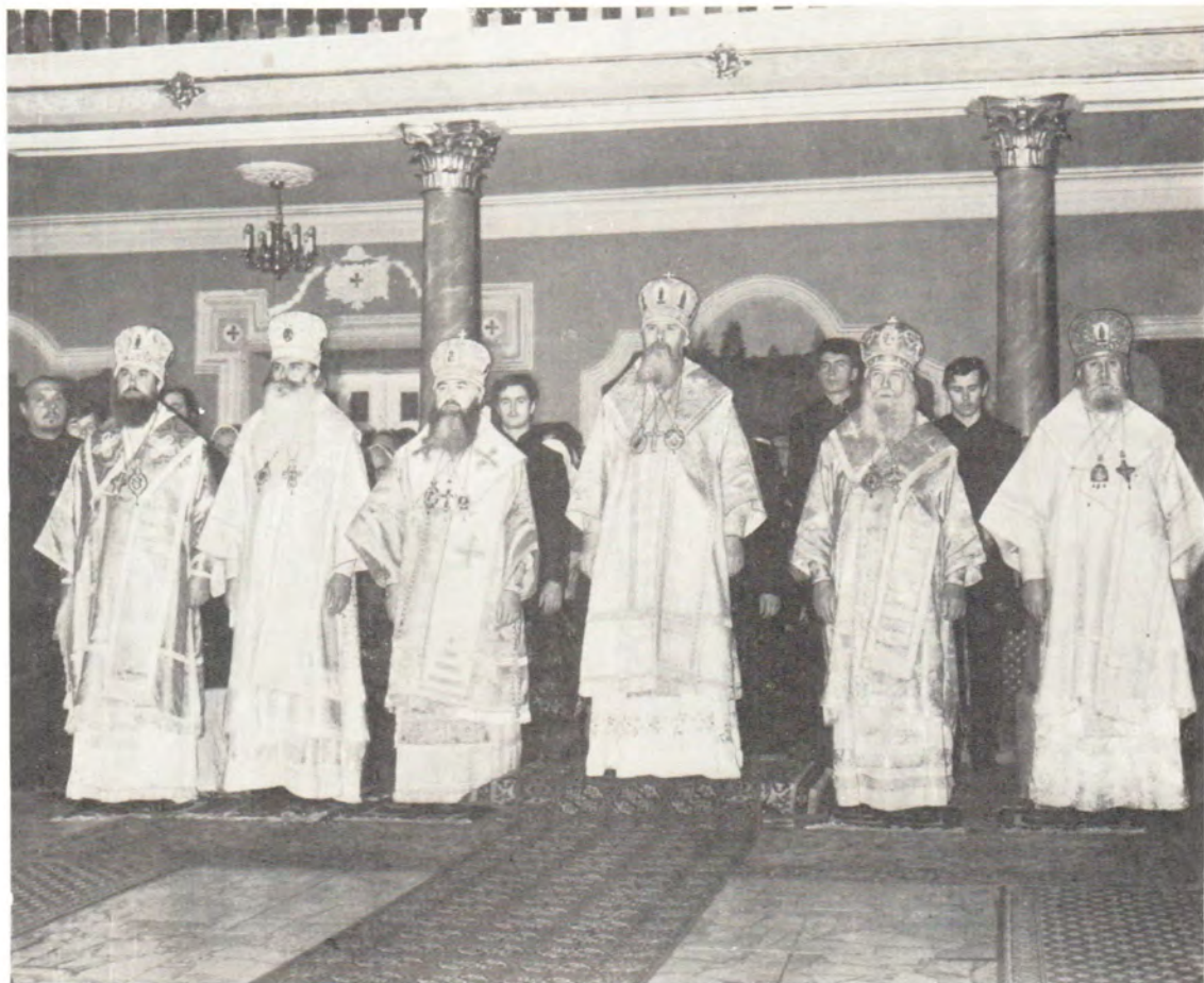
Божественную литургию в Покровском храме МДА совершают митрополиты Таллинский и Эстонский Алексей, Крутицкий и Коломенский Ювеналий, Калининский и Кашинский Алексей, архиепископы Волоколамский Питирим, Чебоксарский и Чувашский Варнава и епископ Дмитровский Александр