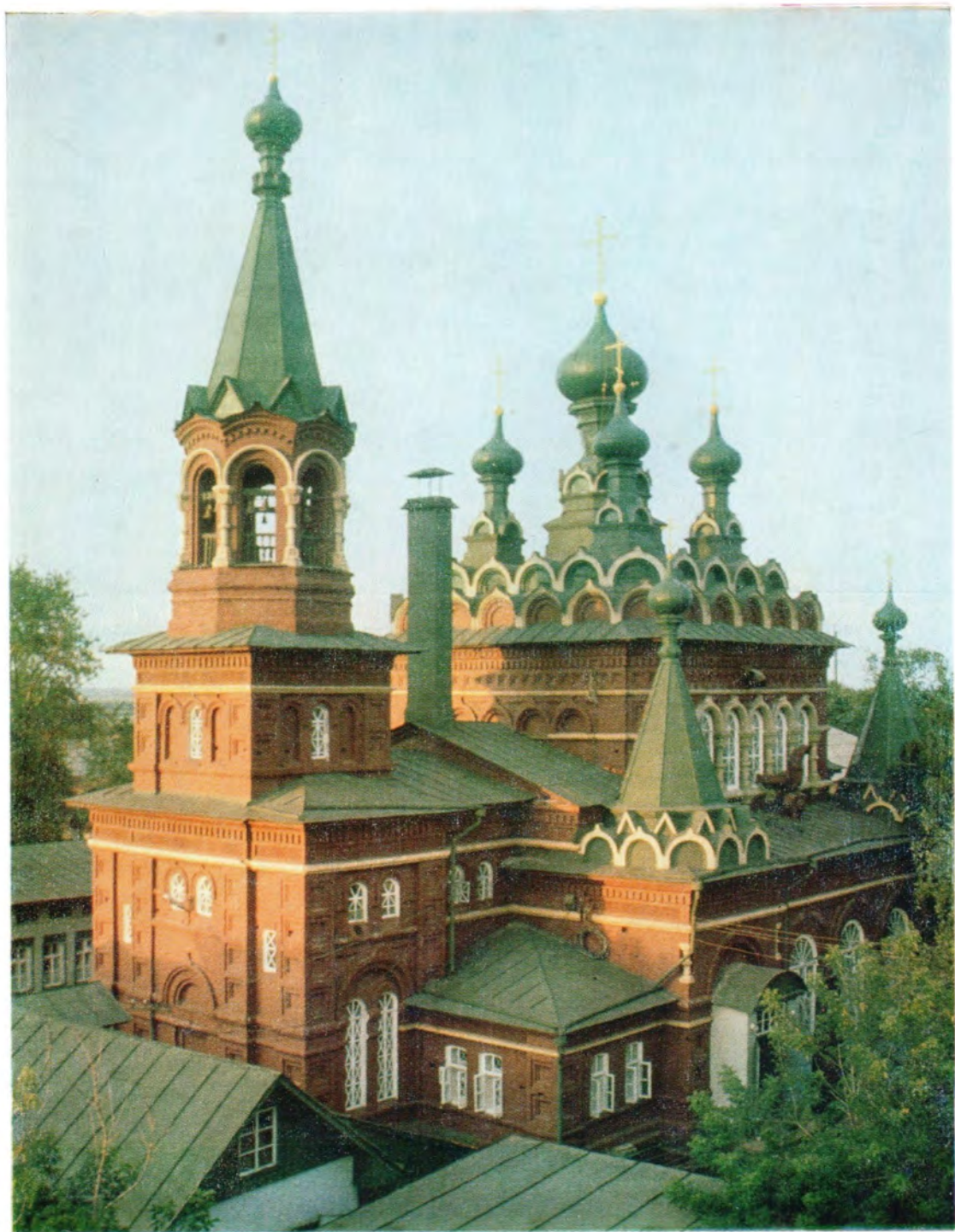
Кафедральный собор во имя преподобного Серафима Саровского в г. Кирове