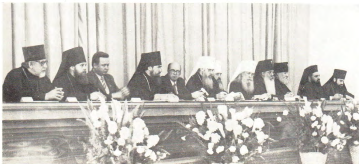
В президиуме торжественного заседания