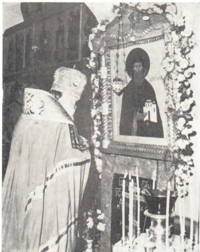
Святейший Патриарх Пимен перед иконой благоверного князя преподобного Даниила