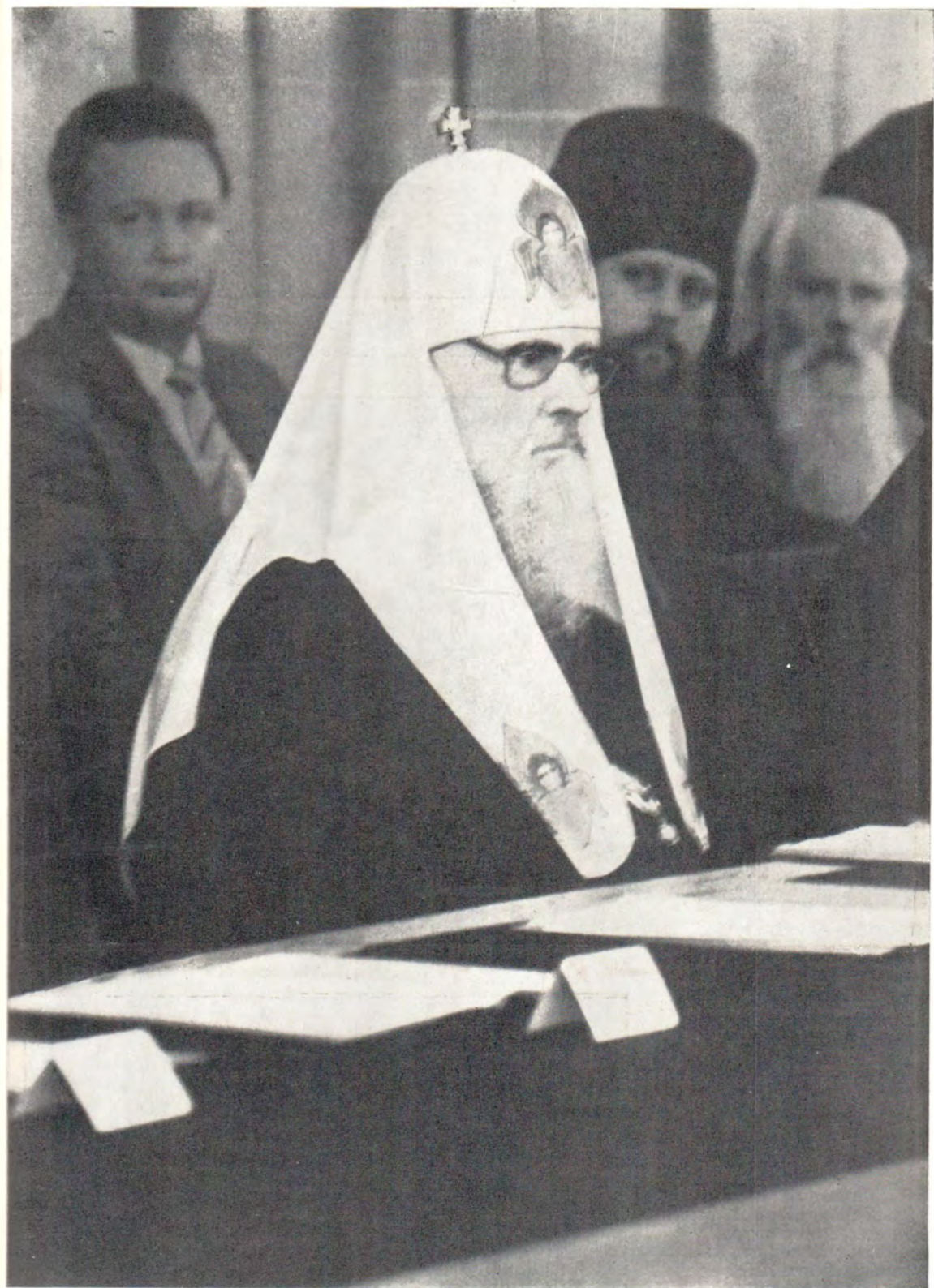
Святейший Патриарх Московский и всея Руси Пимен в президиуме торжественного юбилейного акта, Актный зал Московских Духовных Академии и Семинарии