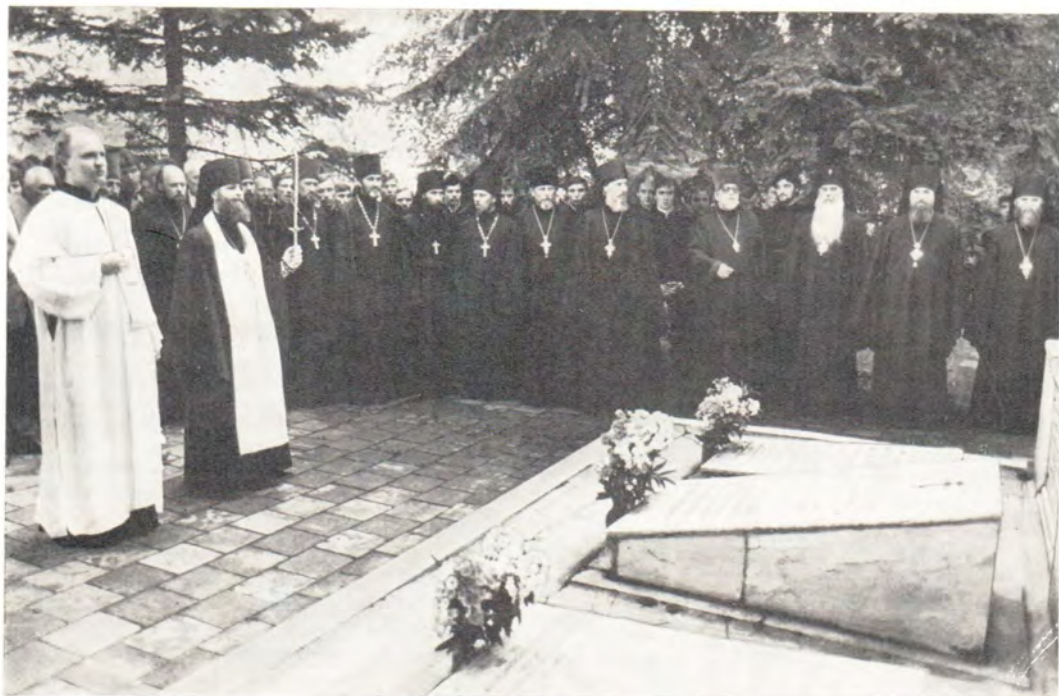
Заупокойная лития у памятника всем учившим и учившимся в МДА и МДС