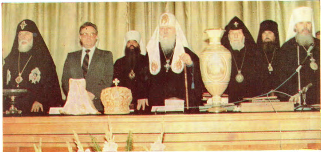
Президиум торжественного юбилейного акта