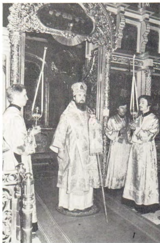
Слово перед молебном на начало учения произносит епископ Александр