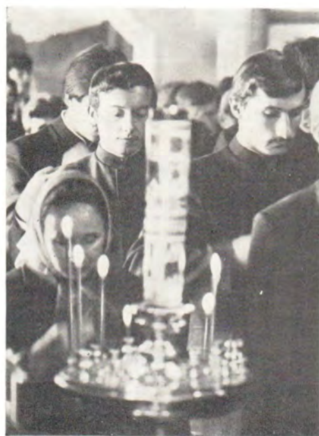
За богослужением в академическом храме