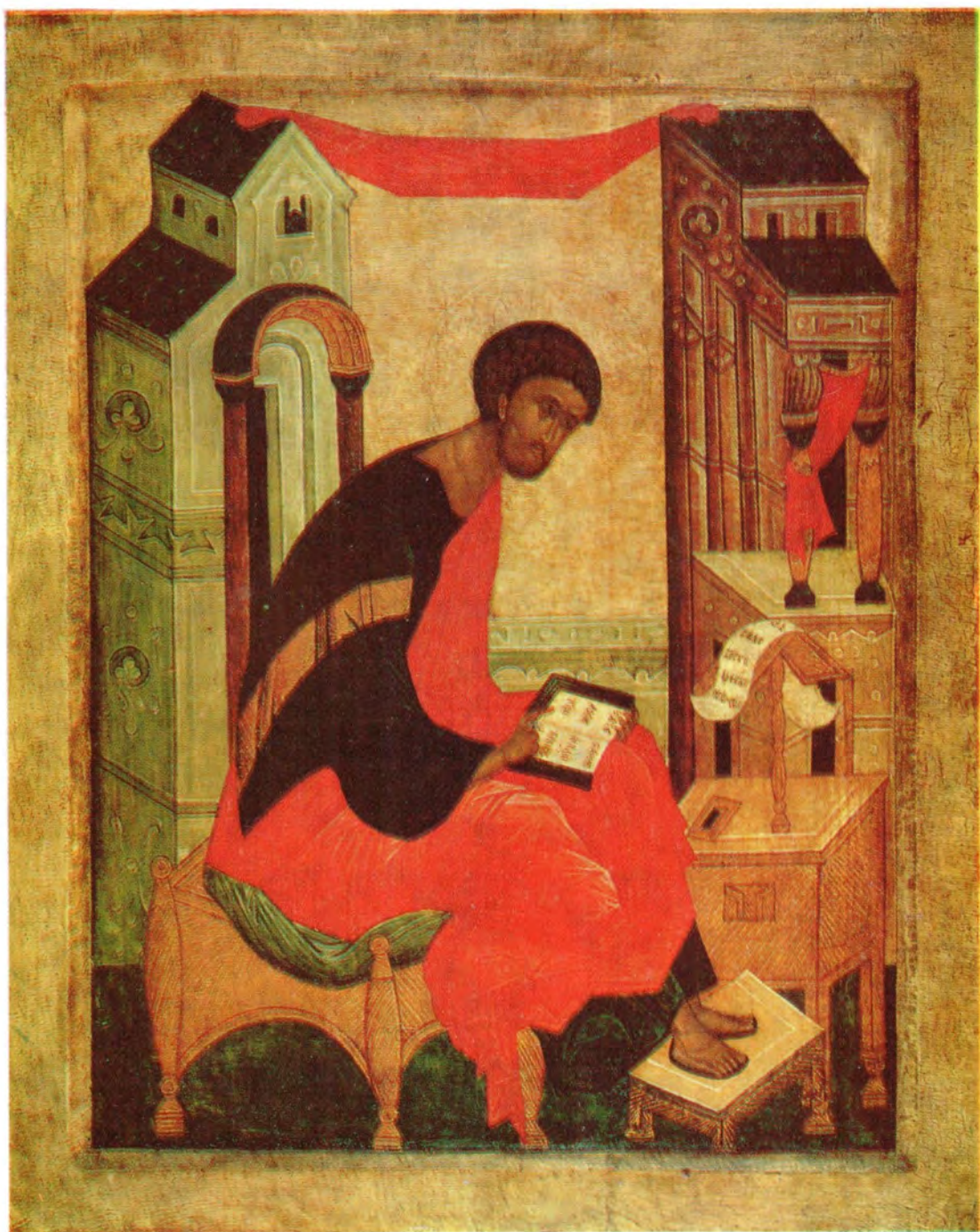
СВЯТОЙ АПОСТОЛ И ЕВАНГЕЛИСТ ЛУКА