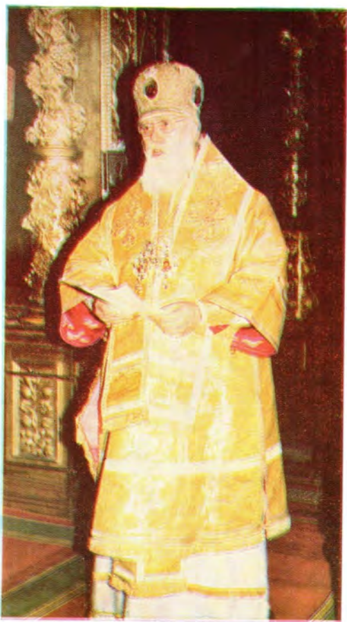
Митрополит Киевский и Галицкий Филарет, Патриарший Экзарх Украины, произносит слово в Успенском соборе Лавры