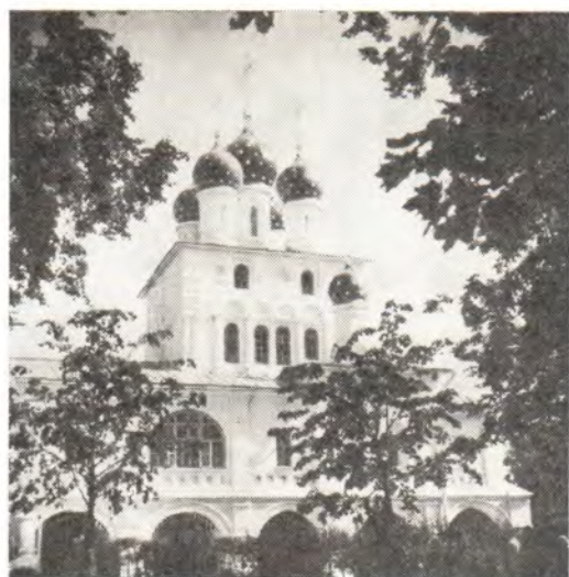
◀ Храм в честь Казанской иконы Божией Матери в с. Коломенском (Москва)