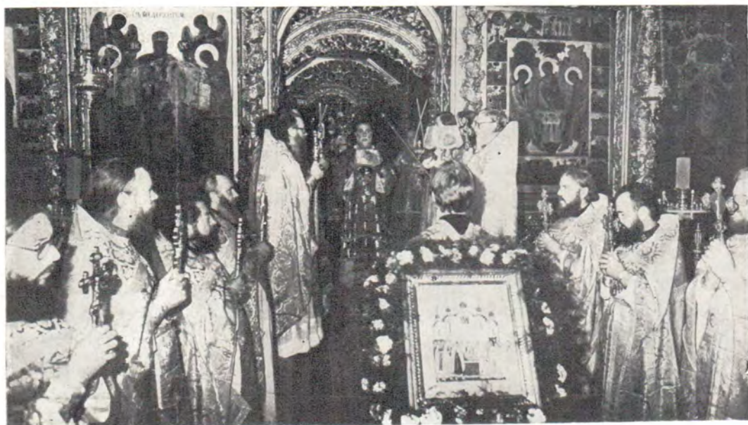
Великий вход за Божественной литургией в Успенском соборе Лавры

Святейший Верховный Патриарх и Католикос всех армян Вазген I, другие почетные гости — участники юбилейного празднования — за богослужением в Успенском соборе Лавры