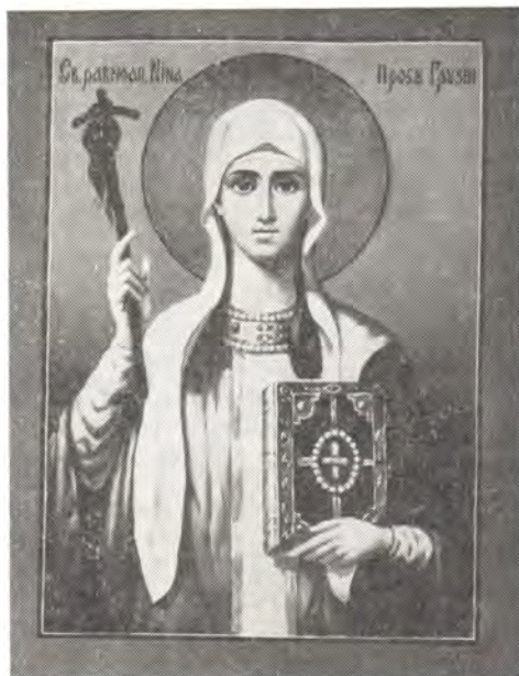
Святая равноапостольная Нина, просветительница Грузии. Икона XIX века в храме во имя Святого Николая в Хамовниках в Москве

невидимых врагов...» (10, с. 456). Святая Нина взяла врученный ей крест и смиренно, с простотой святости, отправилась в неведомую страну, твердо веря в благодатную помощь свыше.