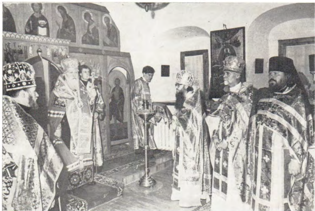
Святейший Патриарх Пимен произносит отпуст после праздничного молебна в Покровском храме Данилова монастыря 12 сентября 1985 года