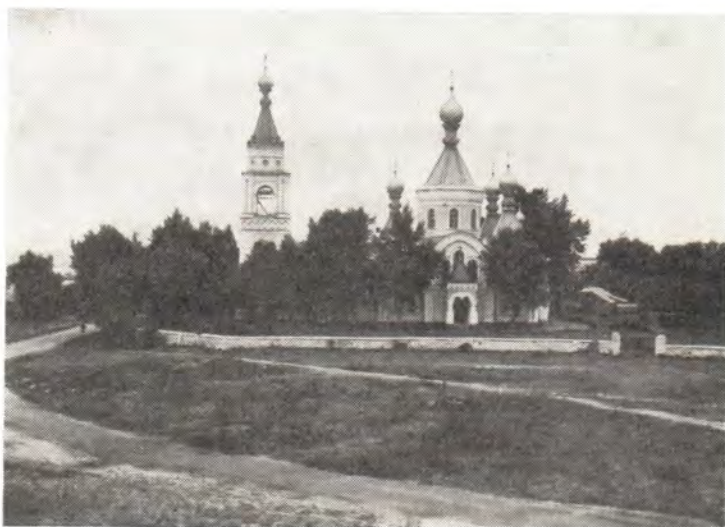
Храм в честь Казанской иконы Божией Матери в Воронеже