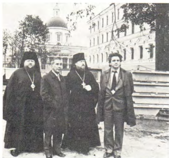
Д-р Эмилио Кастро осматривает реставрационно-строительные работы в Даниловом монастыре 16 сентября 1985 года