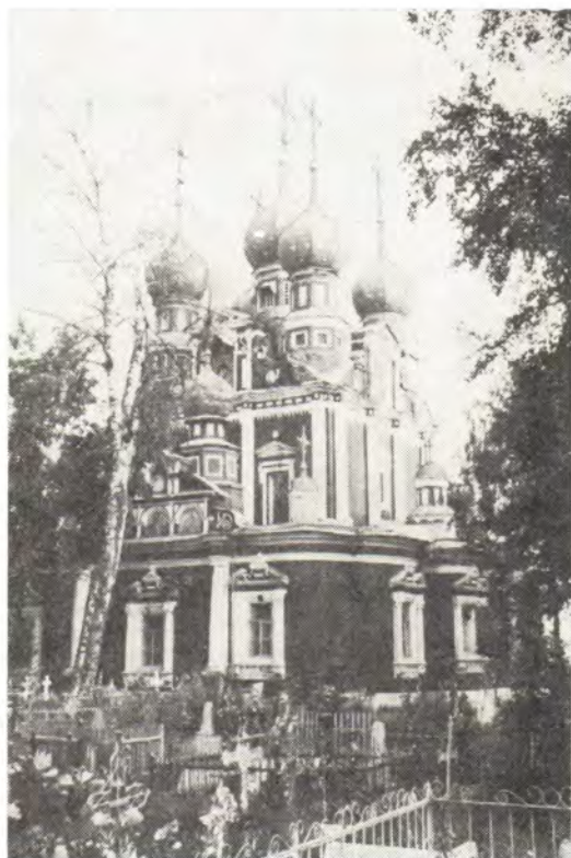
Храм в честь Казанской иконы Божией Матери в г. Устюжна (Вологодская епархия)