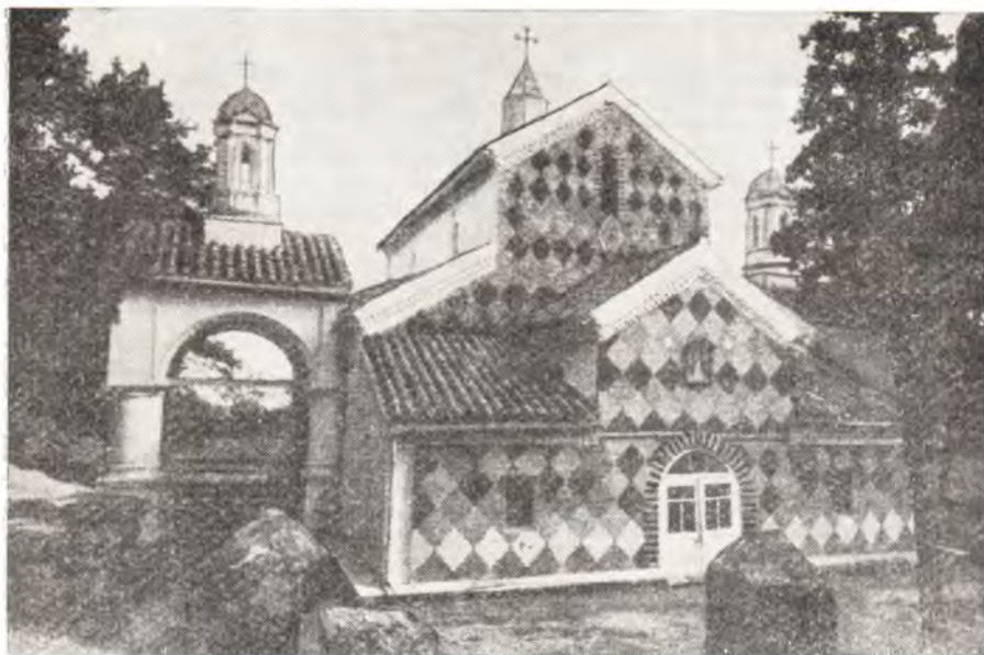
Храм во имя великомученика Георгия Победоносца в Бодбе (Восточная Грузия), в котором находятся мощи святой равноапостольной Нины, просветительницы Грузии

Вскоре обратилось ко Христу несколько еврейских женщин, а также первосвященник карталинских иудеев Авиафар, потомок раввина Элиоза. Услышав от святой Нины, как в лице Иисуса Христа исполнились ветхозаветные пророчества о Мессии, он исповедал Христа обетованным пророками Господом.