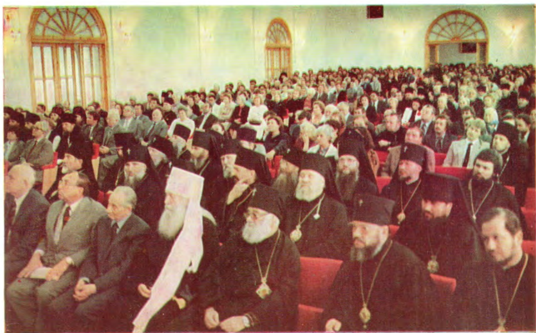
В Актовом зале Московских Духовных Академии и Семинарии во время торжественного юбилейного акта