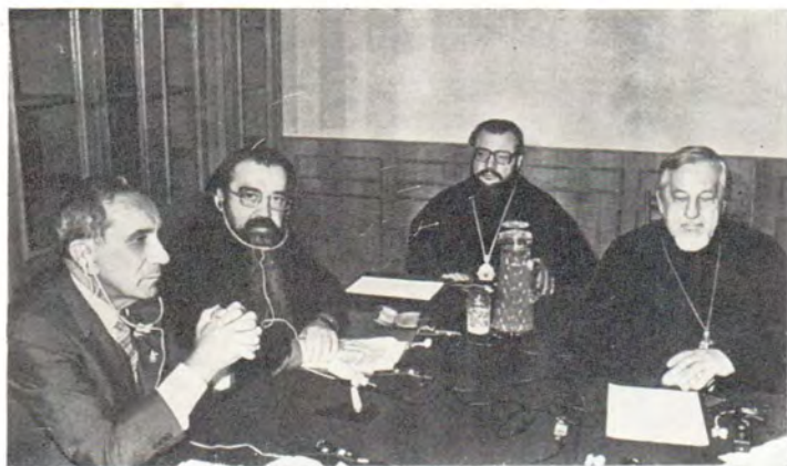
Д-р Эмилио Кастро на собеседовании у председателя Отдела внешних церковных сношений митрополита Минского и Белорусского Филарета в новом здании Отдела в Даниловом монастыре 16 сентября 1985 года