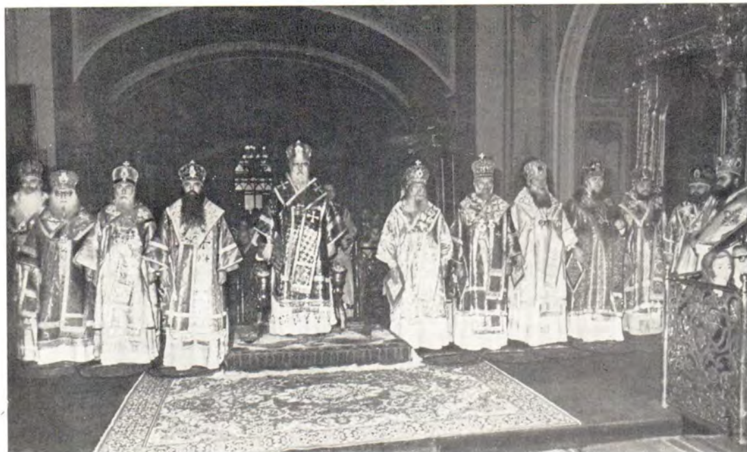
Святейший Патриарх Пимен и Преосвященные архиереи за Божественной литургией в Богоявленском патриаршем соборе 9 сентября 1985 года