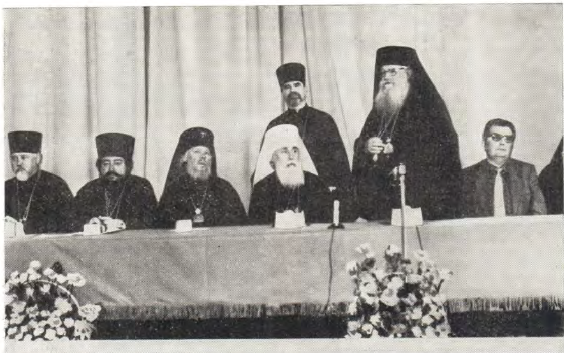
Блаженнейший Папа и Патриарх Александрийский и всей Африки Николай VI произносит речь на торжественном акте, посвященном 39-му выпуску в ОДС, 6 июня 1985 года

По дороге гости посетили монастырь Джвари (в честь Святого Креста; V в.). В городе Мцхета, в патриаршем соборе во имя святых Двенадцати апостолов Светицховели, Предстоятели Церквей встречали Преосвященные архиереи Грузинской Церкви и настоятель собора. Гости осмотрели женский монастырь Самтавро, Мхетскую Духовную Семинарию, храм Преображения Господня, где покоятся мощи святого Мириана и его супруги Нонны — первых христиан Грузии (IV в.).