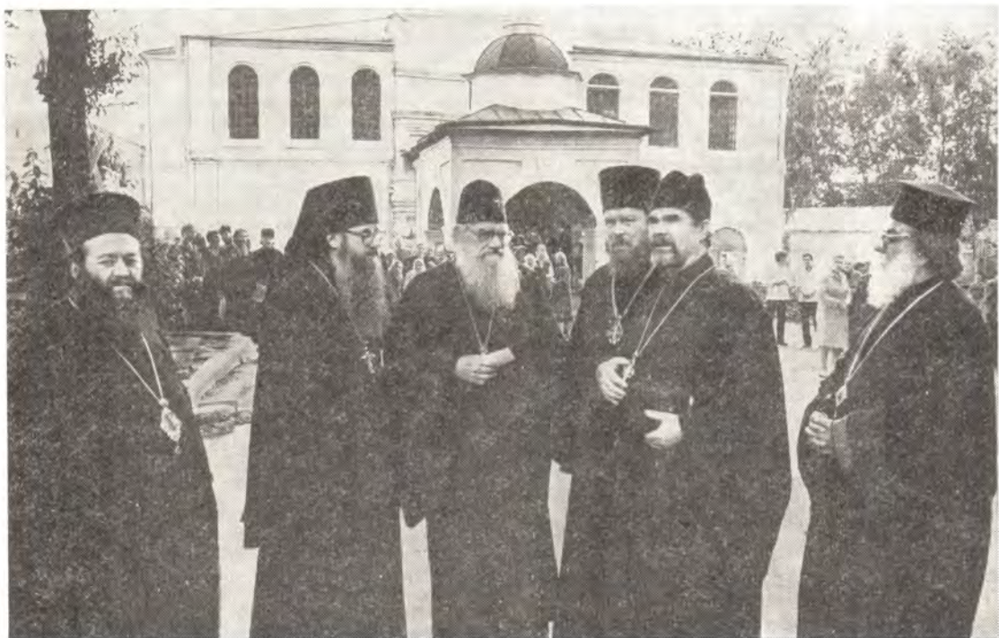
Блаженнейший Папа и Патриарх Александрийский Николай VI во время осмотра Московского Данилова монастыря 20 июня 1985 года