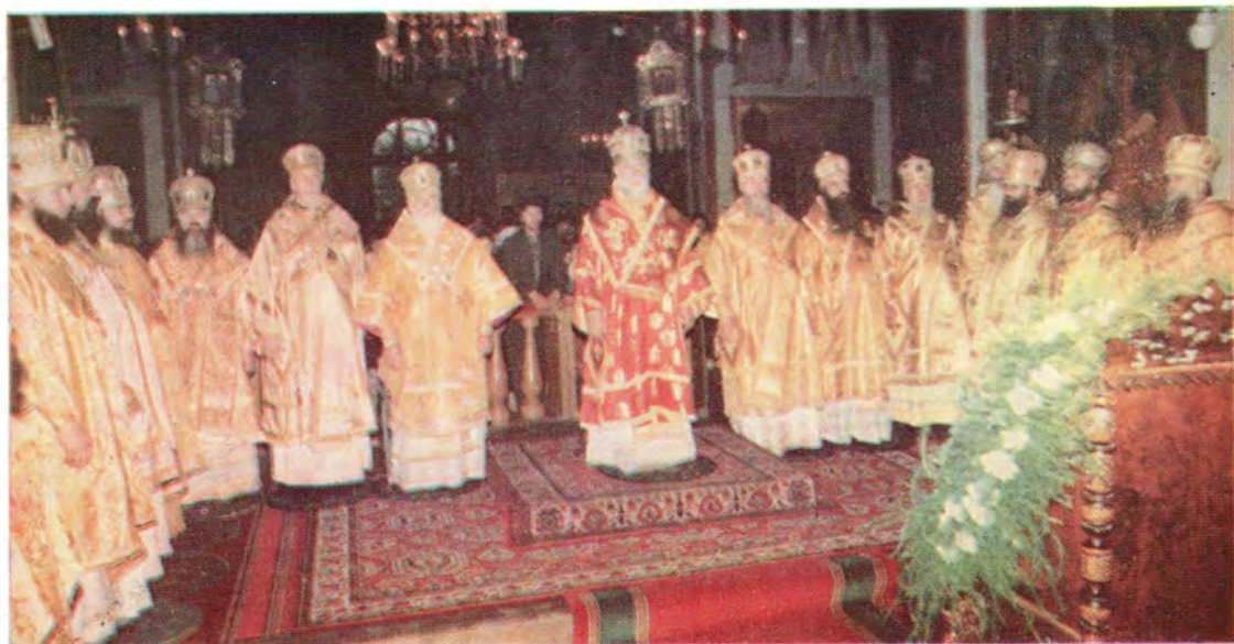
Святейший и Блаженнейший Католикос-Патриарх всей Грузии Илия II с сослужащими иерархами за Божественной литургией в Успенском соборе Лавры