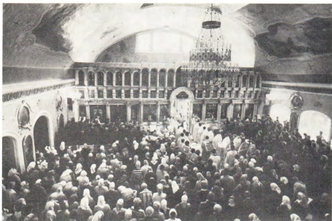
В Покровском храме МДА перед молебном на начало учебного года