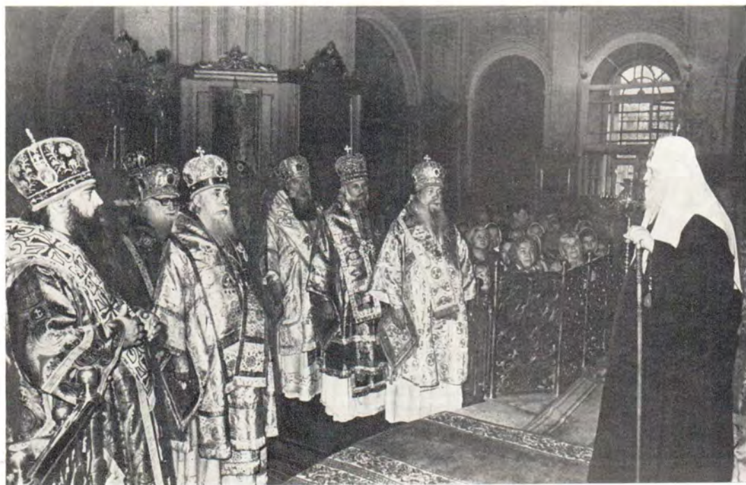
Митрополит Минский и Белорусский Филарет (слева) обращается с поздравлением к Святейшему Патриарху Пимену в Богоявленском патриаршем соборе 9 сентября 1985 года