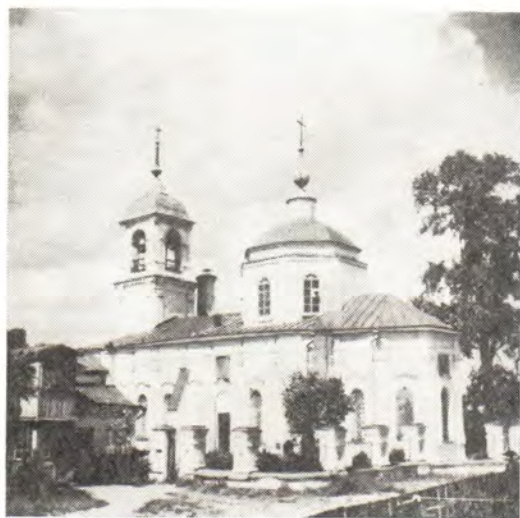
▲ Храм в честь Казанской иконы Божией Матери в г. Дмитрове (Московская епархия)