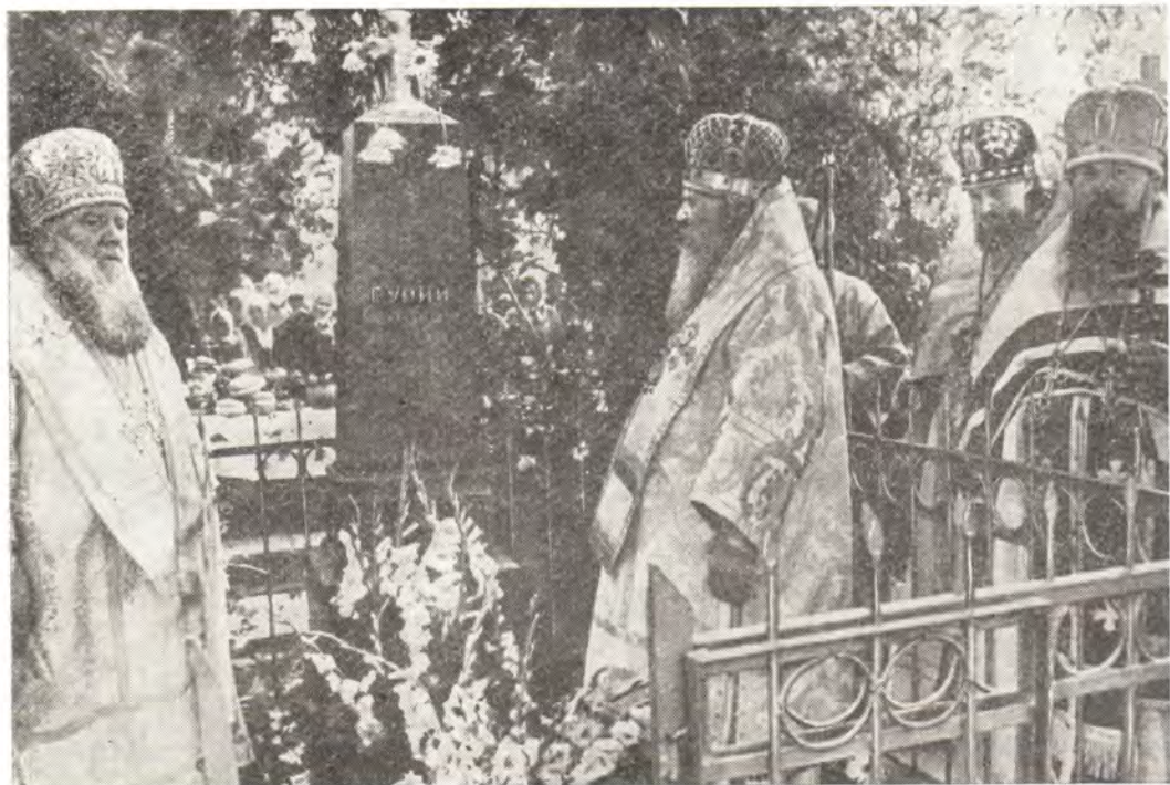
Митрополит Иоанн (бывший Ярославский) и архиепископ Симферопольский и Крымский Леонтий с клириками на могиле митрополита Гурья 12 июля 1985 года

Харьковская епархия. 11 июня 1984 года, в День Святого Духа, архиепископ Харьков-