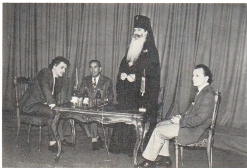
Д-р Эмилио Кастро в Издательском отделе Московского Патриархата 17 сентября 1985 года. Председатель отдела архиепископ Волоколамский Питирим приветствует высокого гостя