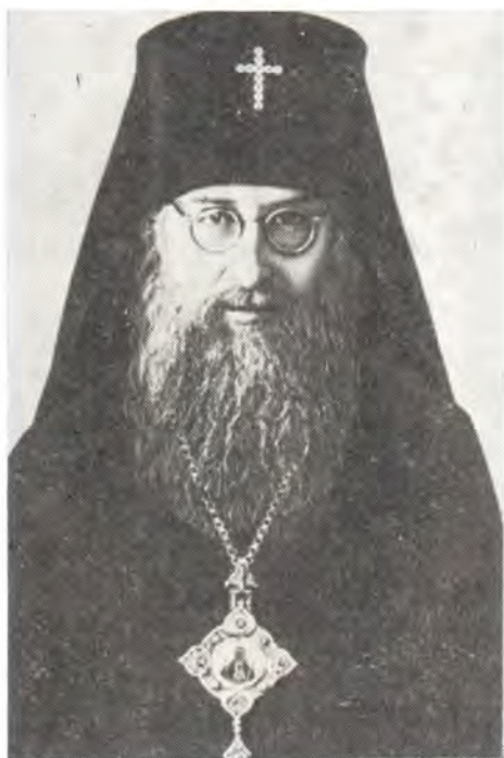
Архиепископ Тамбовский и Мичуринский Михаил (Чуб)

Способности к языкам, рано проявившиеся у Владыки, были присущи и его родителям. Позднее он отмечал, что своим исследовани-