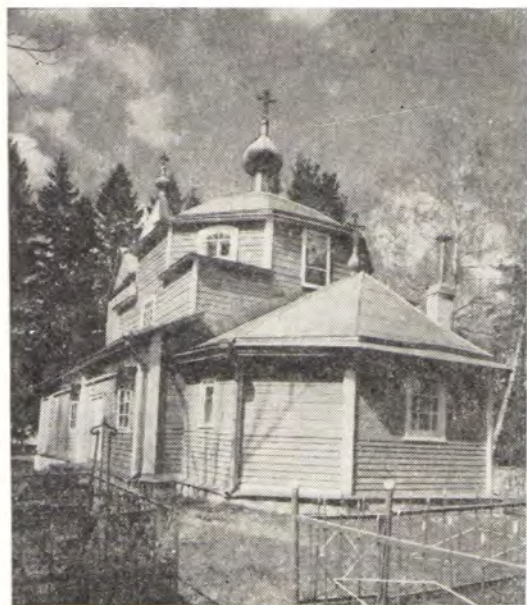
Храм во имя пророка Или в с. Далигино (Юшково) Печерского района