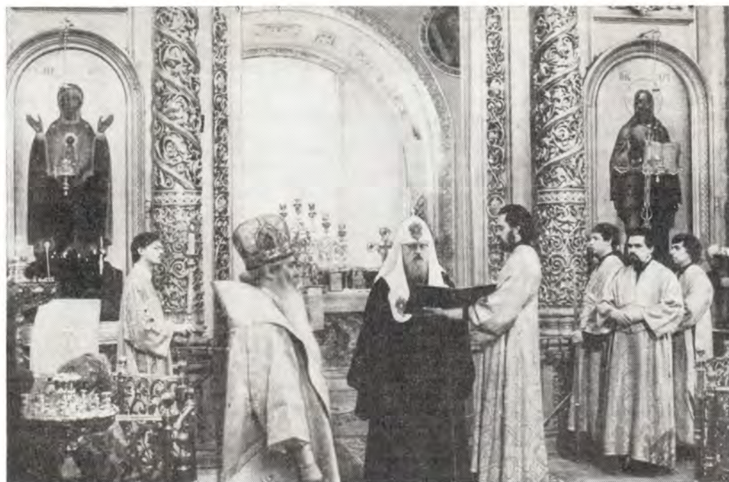
Слово Святейшего Патриарха Пимена в связи с 1100-летием со дня блаженной кончины святого равноапостольного Мефодия. Богоявленский патриарший собор, 23 июня 1985 года

ских землях, в лоне молодых Православных Поместных Церквей.