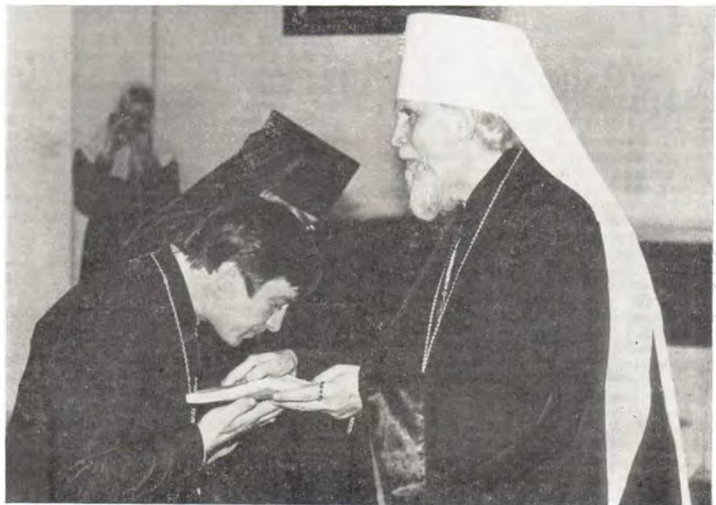
Дипломы выпускникам Ленинградских Духовных школ вручает митрополит Ленинградский и Новгородский Антоний. ЛДА, 16 июня 1985 года

седателя Учебного комитета митрополита Таллинского и Эстонского Алексия, председателя Отдела внешних церковных сношений митрополита Минского и Белорусского Филарета, от Ленинградских Духовных школ и Одесской Духовной Семинарии.