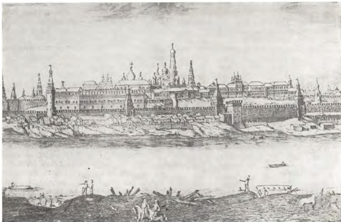
И. Бликландт. Панорама Москва. Фрагмент гравюры. Ок. 1708 г.

рых, миряне — по всем духовным делам и некоторым гражданским. С мирян, как и с духовенства, взимались некоторые сборы в пользу архиереев 3 .