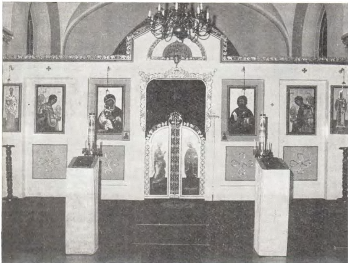
Иконостас храма в честь Покрова Пресвятой Богородицы в Дюссельдорфском (ФРГ) епархиальном центре Московского Патриархата

3 марта, в Неделю 1-ю Великого поста, епископ Лонгин совместно с митрополитом Германским Августином, Экзархом Константинопольского Патриарха, и епископом Западноевропейским Лаврентием (Сербская Православная Церковь) совершил Божественную литургию в храме в честь Успения Пресвятой Богородицы в Сербском епархиальном центре в Химмельстуре.