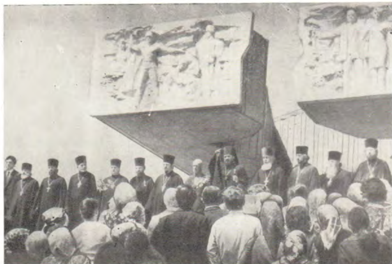
Архиепископ Винницкий и Брацлавский Агафангел возлагает цветы к памятнику погибшим воинам в сквере Славы в г. Хмельницком 13 мая 1985 года