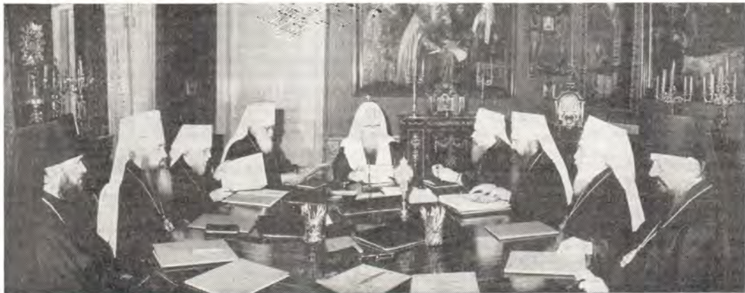
Заседание Священного Синода Русской Православной Церкви под председательством Святейшего Патриарха Пимена 26 июня 1985 года

Церкви Победы советского народа в Великой Отечественной войне вылилось в яркую поддержку епископатом, клиром и мирянами миролюбивой политики нашего государства. Оно стимулировало личную жертвенность церковных людей в укреплении Советского фонда мира.