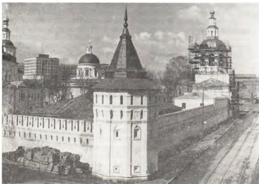
Московский Данилов монастырь сегодня. Идет реставрация

От имени возглавляемой им комиссии Высокопреосвященный Алексей выразил искреннюю благодарность Совету по делам религий при Совете Министров СССР и государственным учреждениям за содействие в успешном проведении реставрационно-строительных работ.