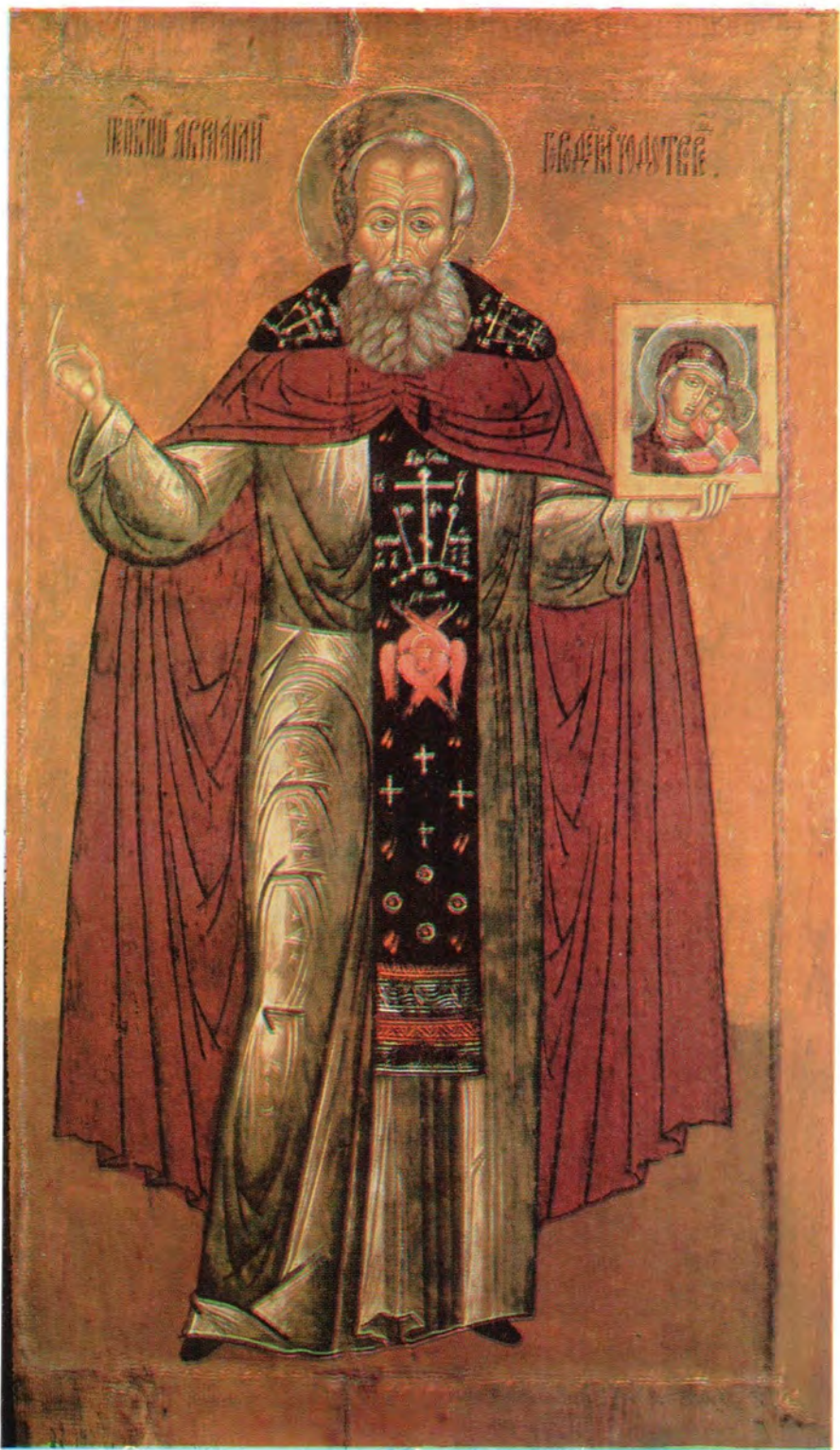
ПРЕПОДОБНЫЙ АВРААМИЙ ГАЛИЧСКИЙ, ЧУХЛОМСКОЙ (ГОРОДЕЦКИЙ) Память 20 июля/2 августа