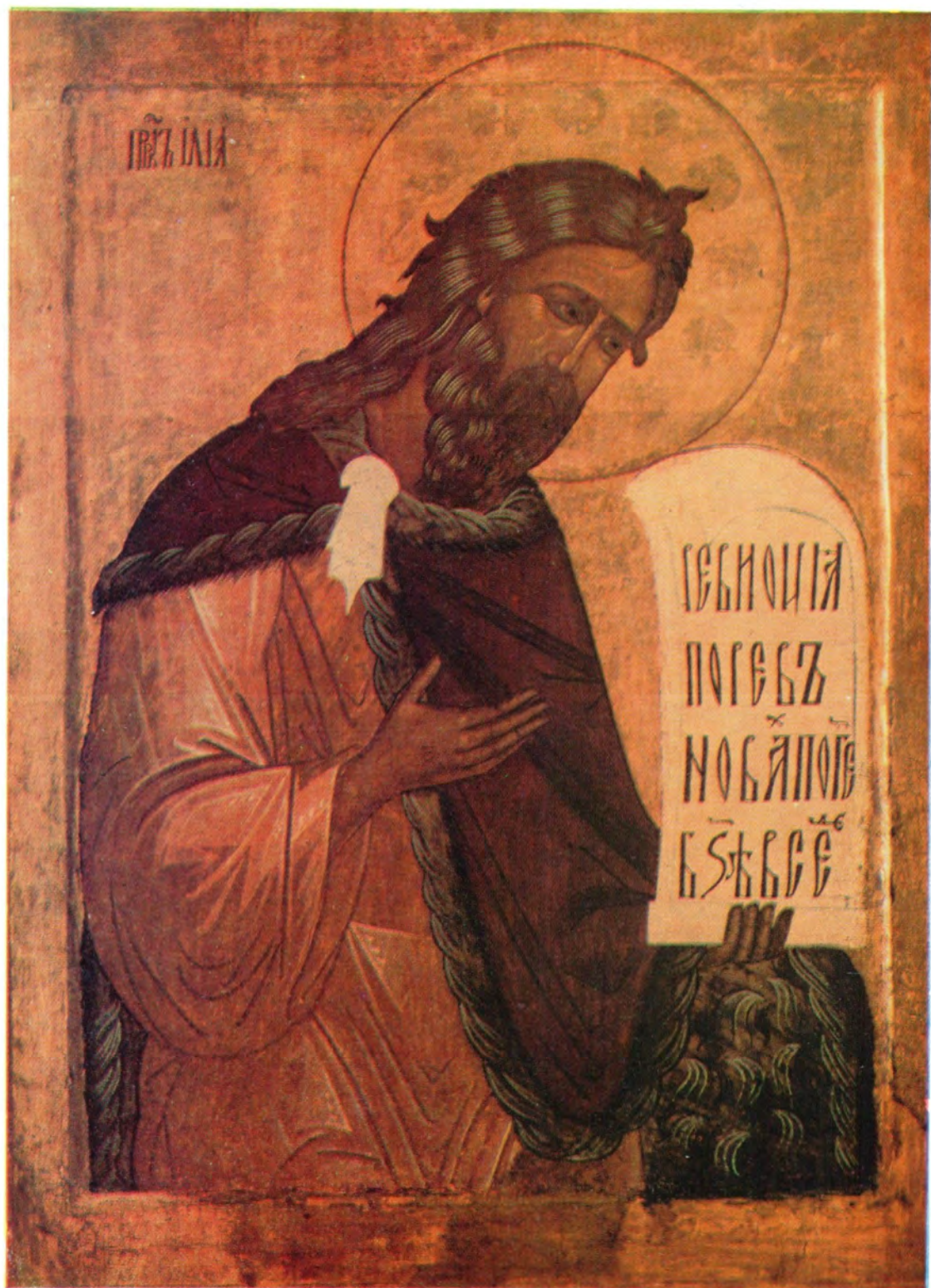
СВЯТОЙ ПРОРОК ИЛИЯ Память 20 июля/2 августа