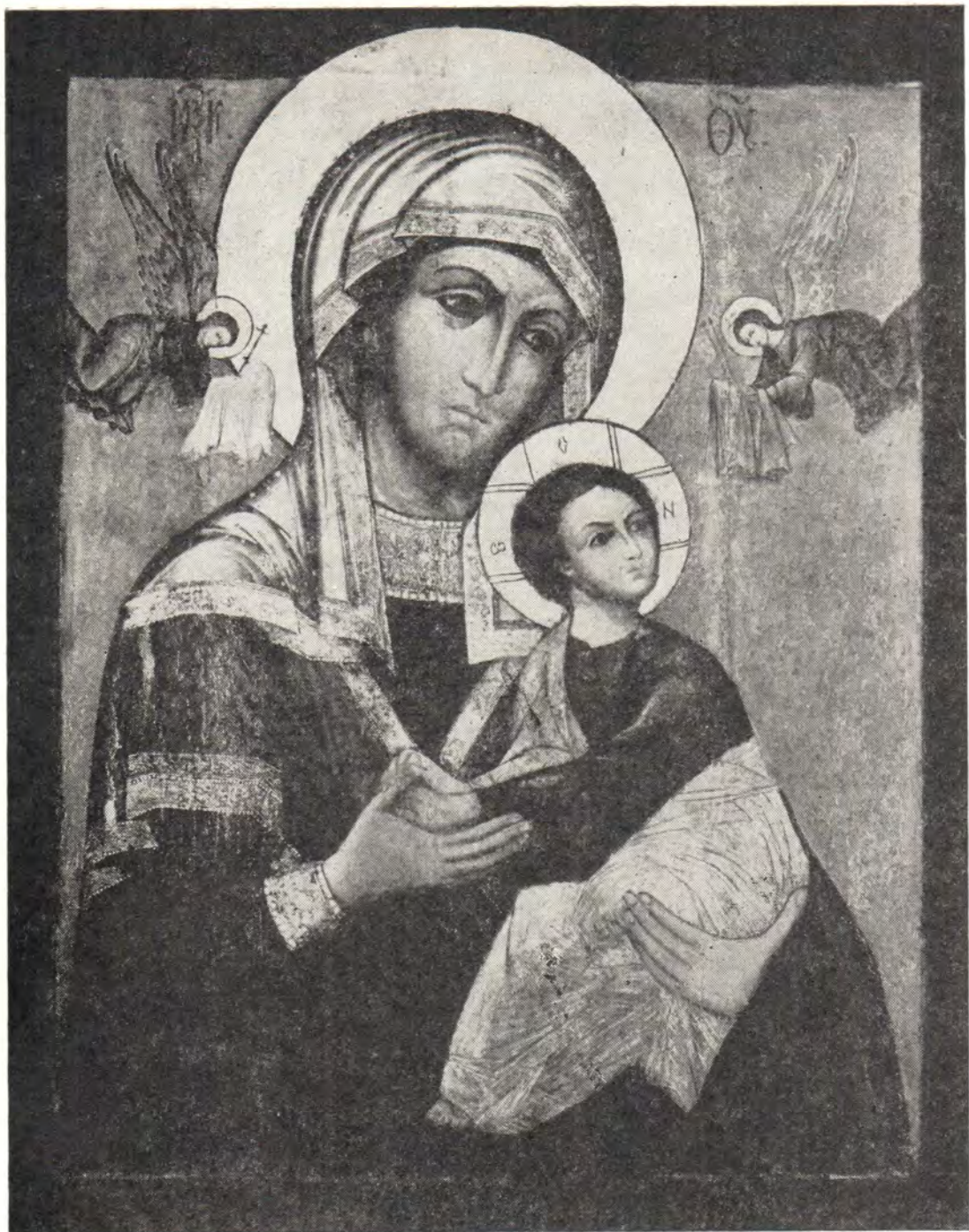
«СТРАСТНАЯ» ИКОНА БОЖИЕЙ МАТЕРИ, XVII в.

Икона Богоматери «Страстная» относится к типу Одигитрии. Название «Страстная» получила оттого, что на ней изображены два ангела с орудиями страданий Христовых. Благодатное знамение милости Божией святая икона явила впервые в Нижнем Новгороде, исцелив женщину, страдавшую расслаблением. В 1641 году икона была перенесена в Москву, и на месте ее сретения, у Тверских ворот, в 1654 году был построен женский монастырь, названный Страстным. Празднество святой иконе совершается 13 августа и в шестое воскресенье по Пасхе