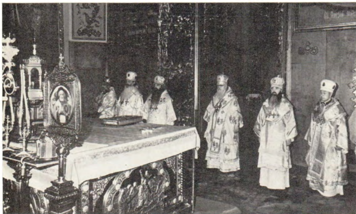
Божественную литургию совершают Святейший Патриарх Пимен, митрополит Минский и Белорусский Филарет, митрополит Крутицкий и Коломенский Ювеналий, архиепископ Волоколамский Питирим, архиепископ Можайский Николай