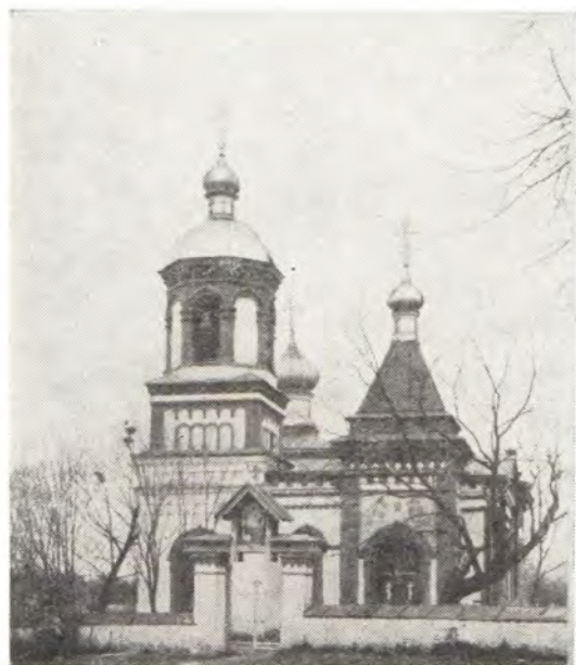
Храм во имя великомученика Георгия Победоносца в с. Печки Печерского района