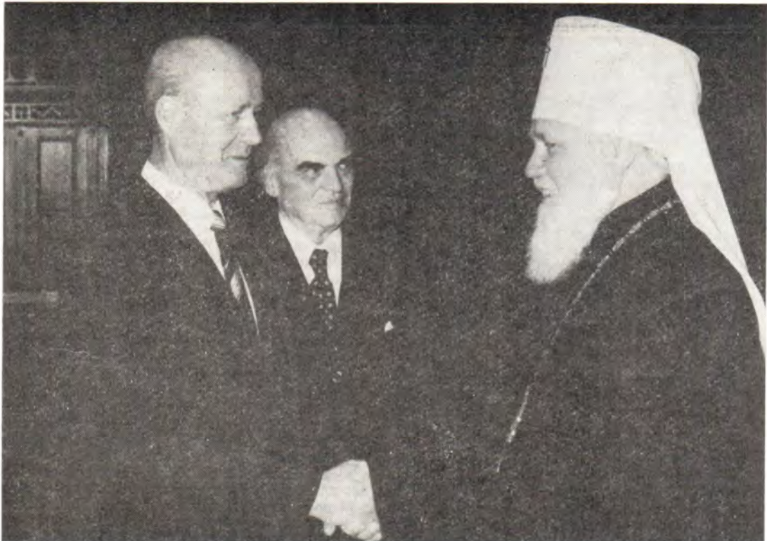
Митрополит Киевский и Галицкий Филарет, Патриарший Экзарх Украины, председатель Комитета продолжения работы ХМК, на приеме у Председателя Президиума ВНР Пала Лощонци (слева)