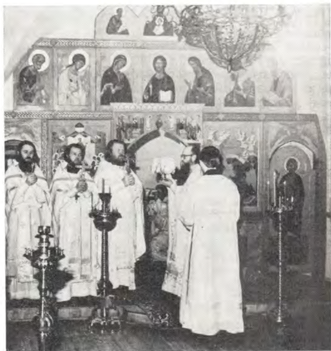
Великий вход на Божественной литургии в Покровском приделе храма во имя святых отцов Семи Вселенских Соборов в Даниловом монастыре 8 июня 1985 года, Отдание праздника Пятидесятницы