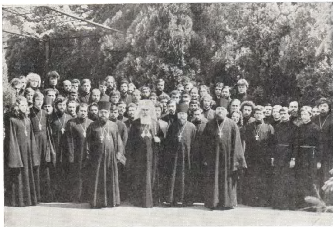
Выпускники и преподаватели Одесской Духовной Семинарии в день выпуска 6 июня 1985 года

Затем в Актовом зале Семинарии состоялось торжественное собрание, на котором присутствовала делегация Александрийской Церкви во главе с Блаженнейшим Папой и Патриархом Александрийским и всей Африки Николаем VI. На собрании присутствовал также уполномоченный Совета по делам религий при Совете