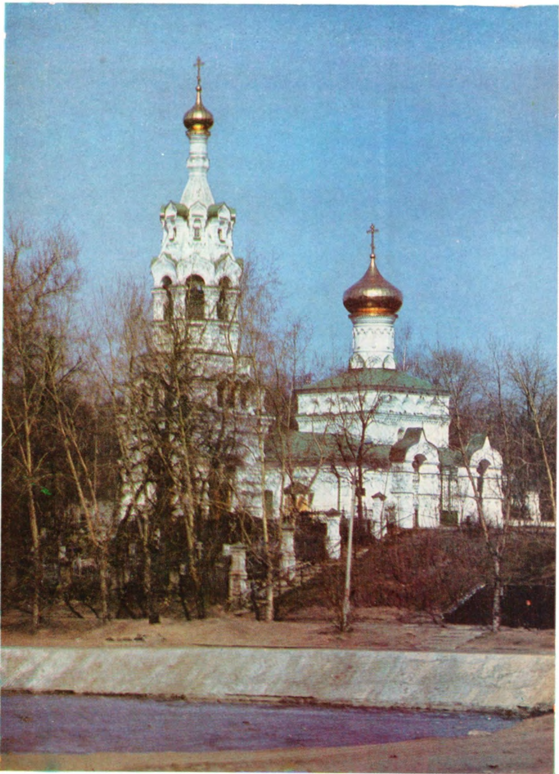
Храм во имя пророка Или в Черкизове в Москве