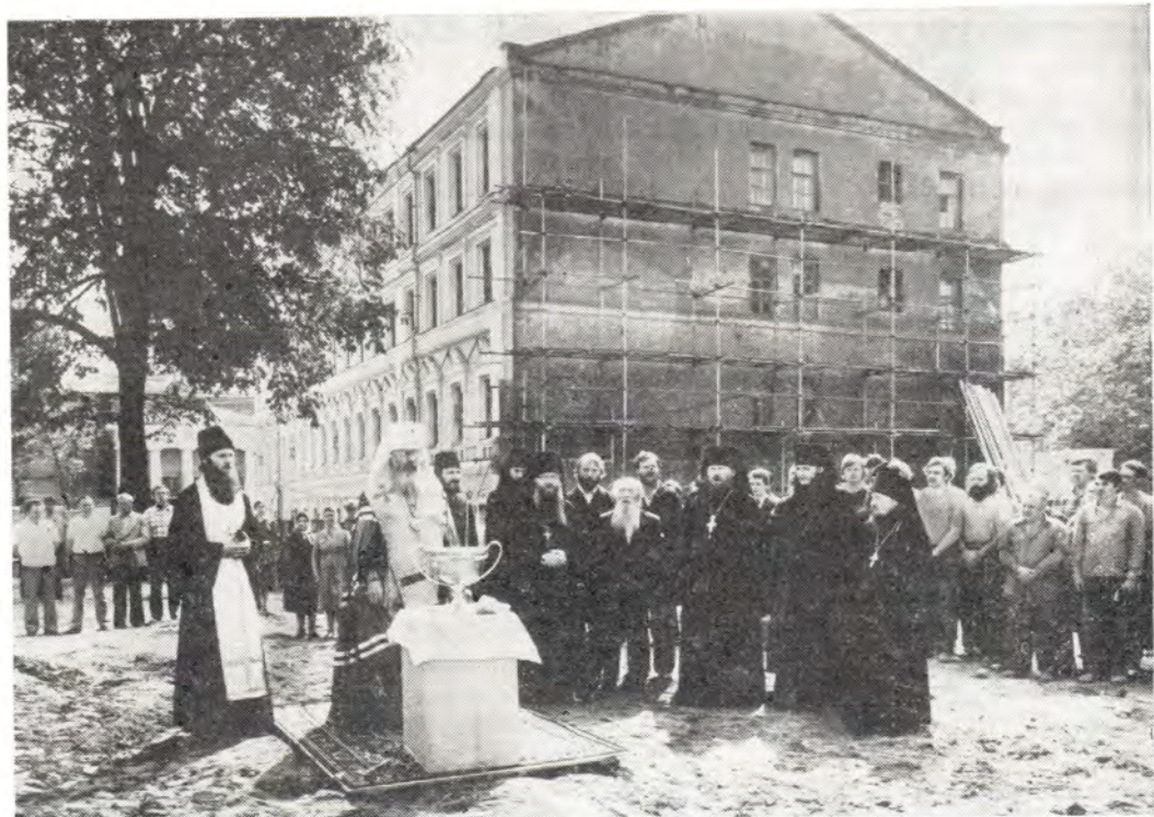
Митрополит Таллинский и Эстонский Алексей совершает молебен при закладке фундамента нового здания Московской Патриархии в Московском Даниловом монастыре 31 мая 1985 года