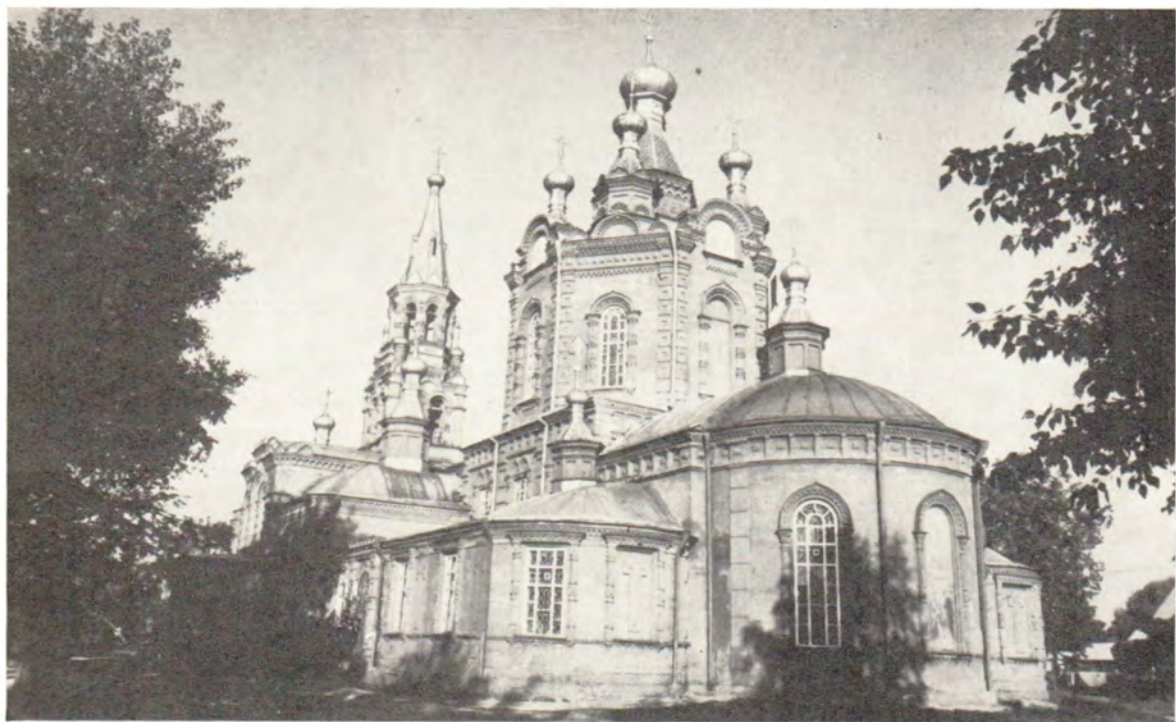
Знаменский собор в г. Осташкове