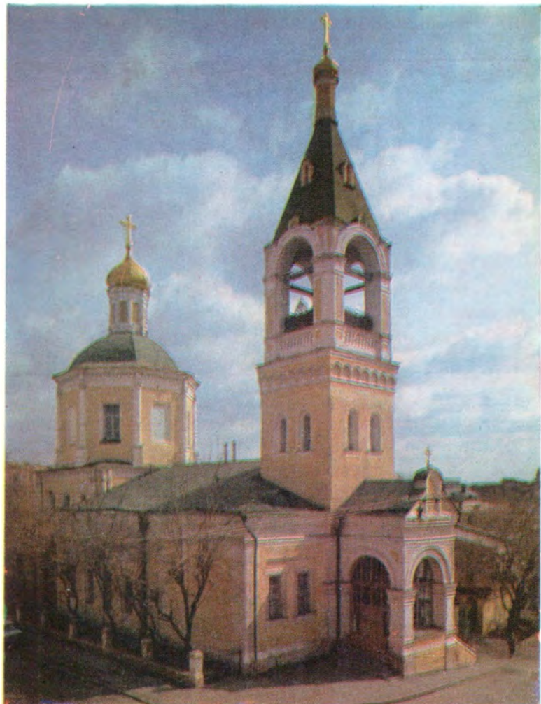
Храм во имя пророка Илии в Обьденском пер. в Москве