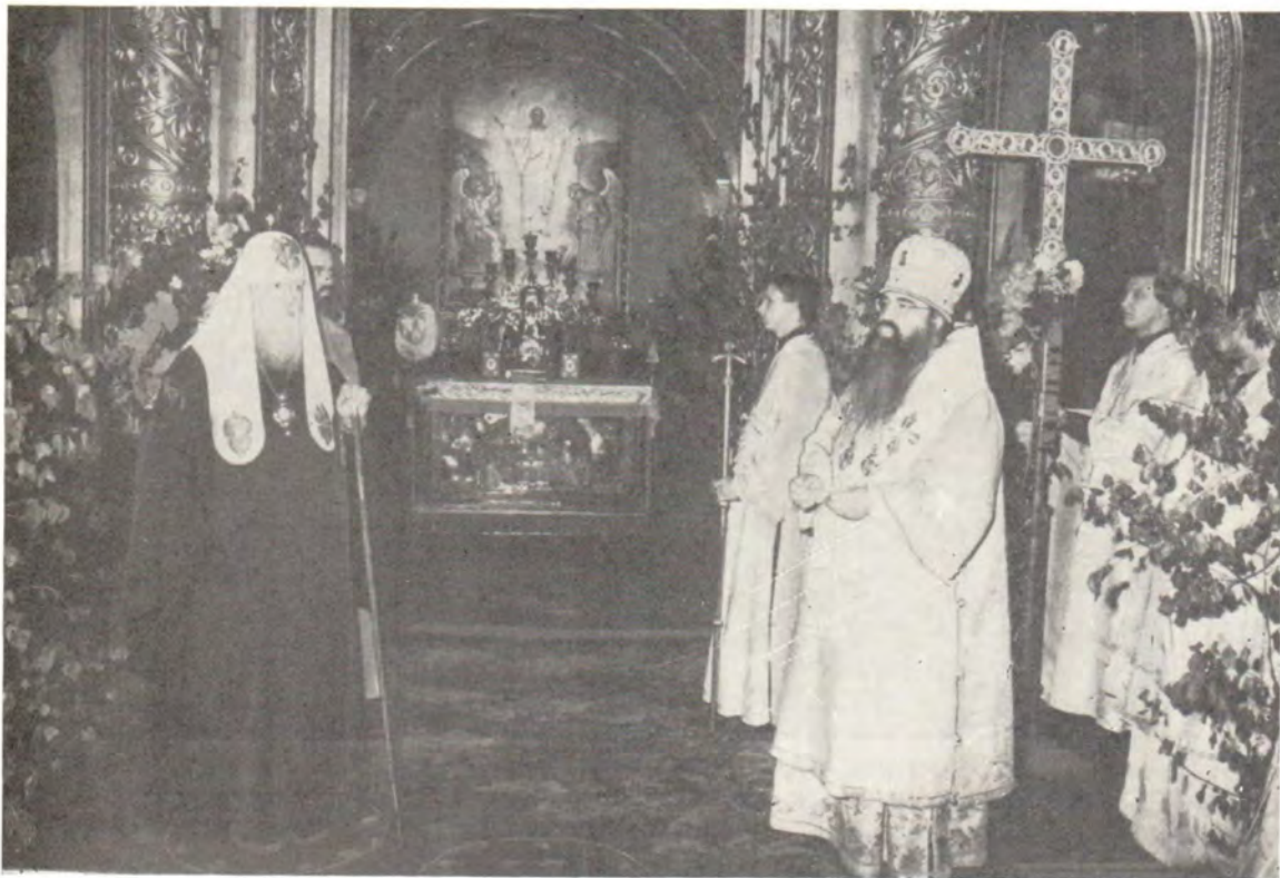
Митрополит Минский и Белорусский Филарет приветствует Святейшего Патриарха Московского и всея Руси Пимена