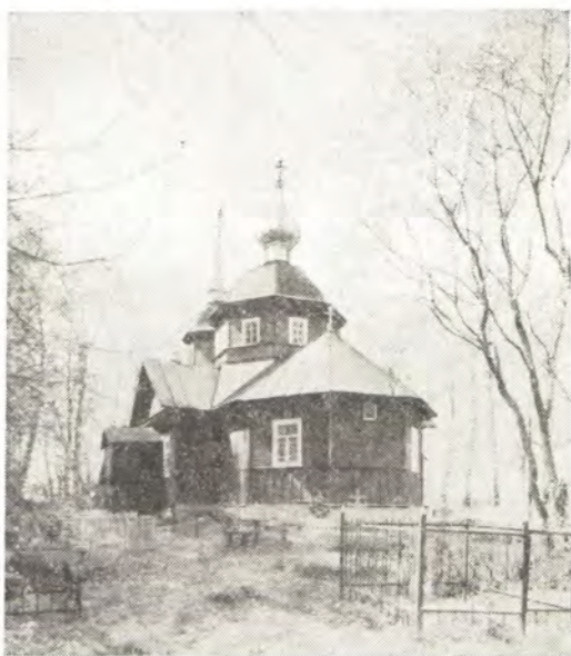
Храм во имя мучеников Флора и Лавра в с. Хредино Струго-Красненского района