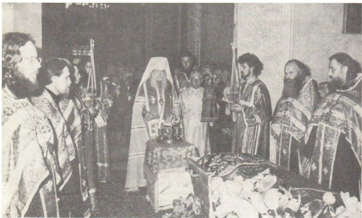
Митрополит Калининский и Кашинский Алексей совершает всенощное бдение в канун празднования в Знаменском соборе