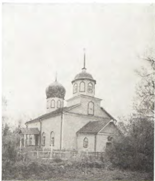
Храм в честь Грузинской иконы Божией Матери в с. Хохловы горки Порховского района