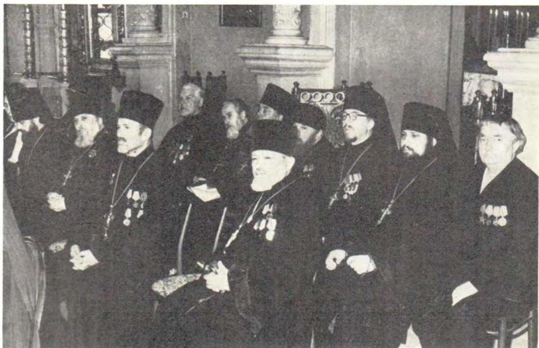
В Успенском храме во время заседания