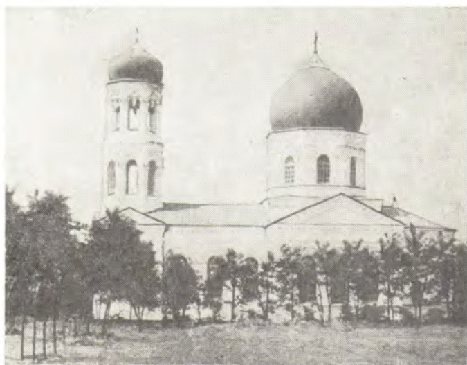
Успенский храм в с. Ново-Красное