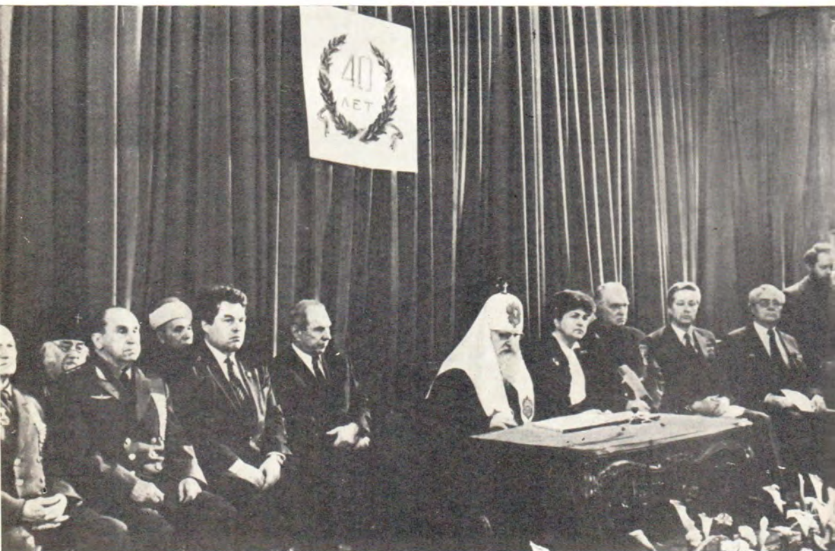
Речь Святейшего Патриарха Пимена

Издательский отдел Московского Патриархата, 24 апреля 1985 года