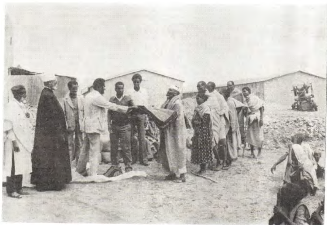
Архиепископ Тигрейский Ефрем распределяет предметы первой необходимости, поступившие от Русской Православной Церкви пострадавшему от засухи населению Эфиопии на одном из пунктов, устроенном Эфиопской Церковью, июнь 1985 года

1 марта делегация Московского Патриархата через Аден и Каир возвратилась в Москву.