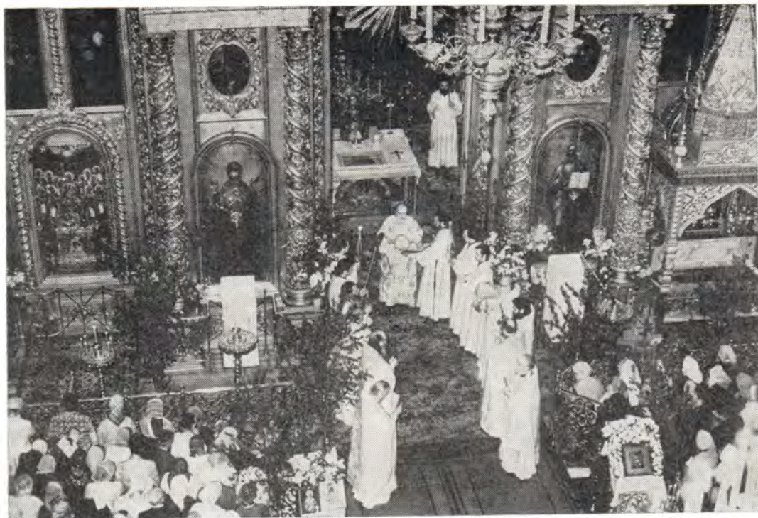
Божественная литургия в Богоявленском патриаршем соборе 3 июня 1985 года, в день 14-й годовщины интронизации Святейшего Патриарха Пимена

Дай, Господи, ему здоровье и мудрость в управлении Русской Православной Церковью! Дай, Господи, мудрость для окормления паствы на пути ее духовного спасения, дабы наша Патриаршая Церковь была всегда со своим народом и дорогим Отечеством». В настоящий сложный и ответственный исторический момент Ваше служение как святителя-мироворца имеет огромную воспитательную силу и свидетельствует о понимании жизни как священного Божьего дара.