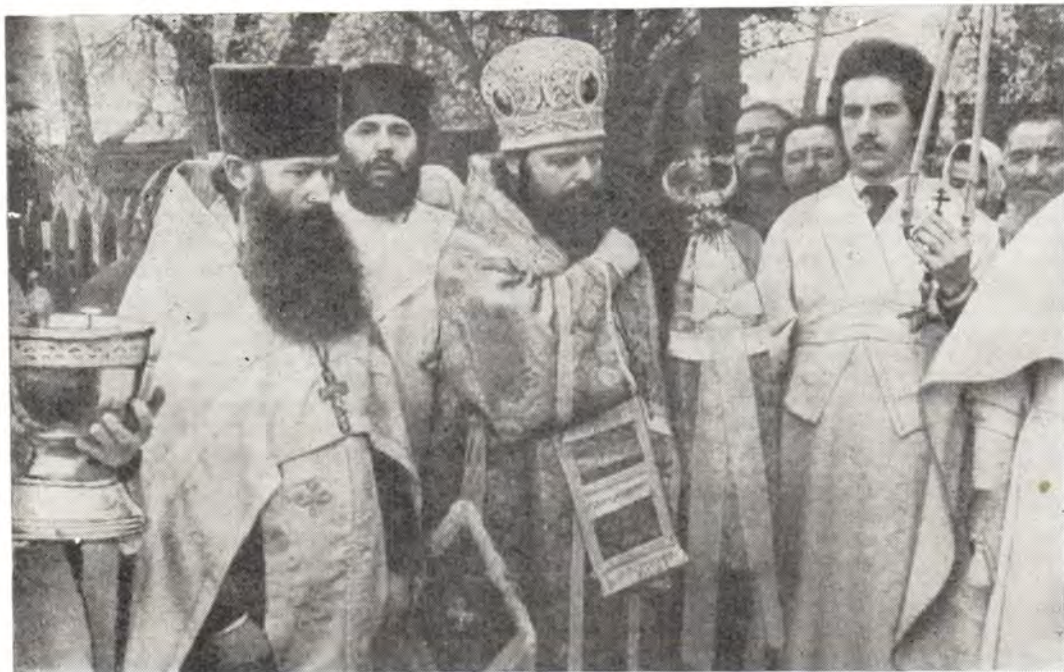
Епископ Алма-Атинский и Казахстанский Евсевий совершает крестный ход вокруг храма в честь Рождества Пресвятой Богородицы в г. Караганде 21 сентября 1984 года, праздник Рождества Пресвятой Богородицы

17 октября, день памяти святого мученика Евсевия. Епископ Евсевий совершил в этот день Божественную литургию, а накануне — всенощное бдение в кафедральном соборе в сослужении клириков епархии, прибывших в собор поздравить своего архипастыря с днем