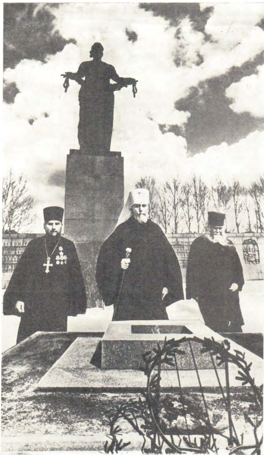
Митрополит Ленинградский и Новгородский Антоний с клириками на Пискаревском мемориальном кладбище в Ленинграде 26 апреля 1985 года