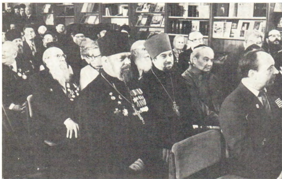
В конференц-зале Издательского отдела