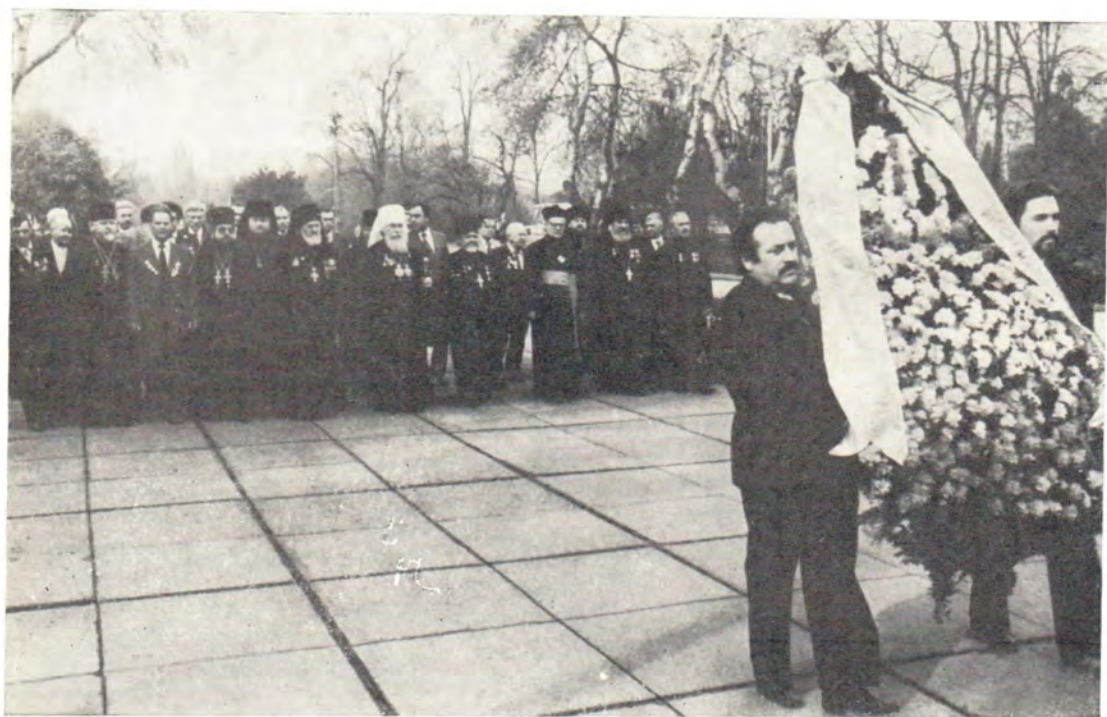
Митрополит Одесский и Херсонский Сергей, клирики и миряне православных храмов г. Одессы, представители других религиозных общин возлагают венок к могиле Неизвестного матроса в Одессе 9 мая 1985 года