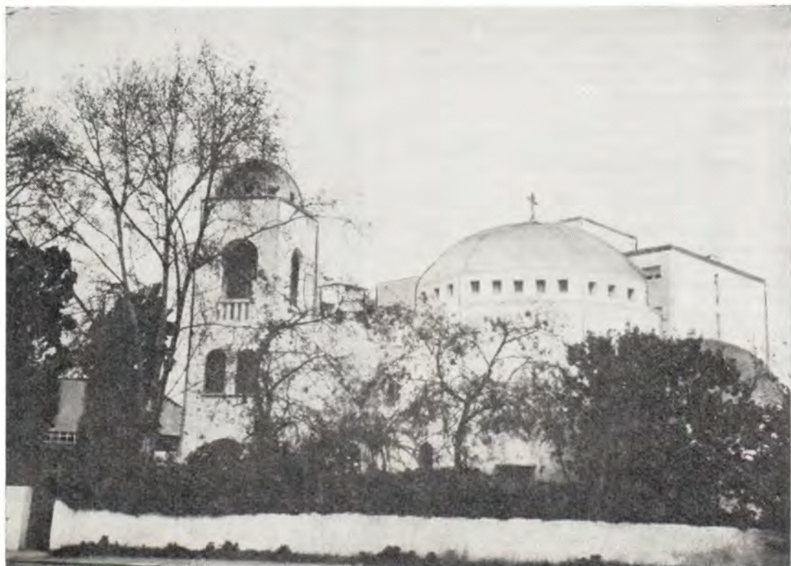
Воскресенский храм в Рабате (Марокко)

нием Шалимовым была совершена Божественная литургия, на которой присутствовали, кроме православных, представители духовенства и миряне римско-католического и протестантских исповеданий. Архимандрит Савва произносил возгласы и ектении по-гречески, священник Георгий Шалимов — по-французски. За богослужением пели хор греческого прихода — по-гречески, хор католических монахинь — по-французски, хор монахинь маронитской общины г. Касабланки — по-арабски. На великом входе архимандрит Савва возносил имя Святейшего Патриарха Московского и всея Руси Пимена, священник Георгий Шалимов — имена Блаженнейшего Папы и Патриарха Александрийского и всей Африки Николая VI, митрополита Минского и Белорусского Филарета (председатель Отдела внешних церковных сношений является по должности правящим архиереем рабатского Воскресенского прихода) и митрополита Карфагенского Парфения, правящего архиерея греческого прихода. Молитва Господня пелась и читалась на греческом, английском, арабском, французском языках. Священник Георгий Шалимов читал ее по-церковнославянски.