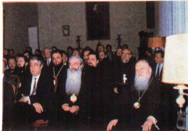
На фото в центре: приветствия архиепископа Ярославского и Ростовского Платона, архимандрита Георгия, Ханса Вольфганга Хесслера (ФРГ). Внизу: зарубежные гости у стенда с изданиями Московской Патриархии. Святейший Патриарх Пимен и участники семинара на концерте духовной музыки