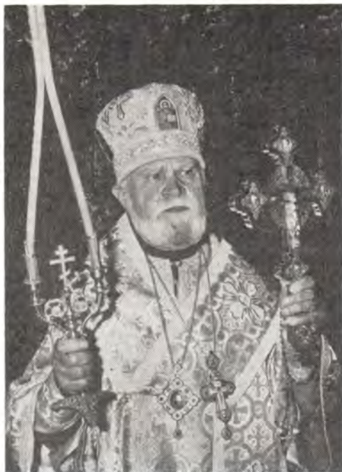
Архиепископ Волынский и Ровенский Дамиан за Божественной литургией в день своего 85-летия в Свято-Троицком кафедральном соборе в Луцке, 27 ноября 1984 года

От клира кафедрального собора и Волынской епархии, сотрудников епархиального уп-