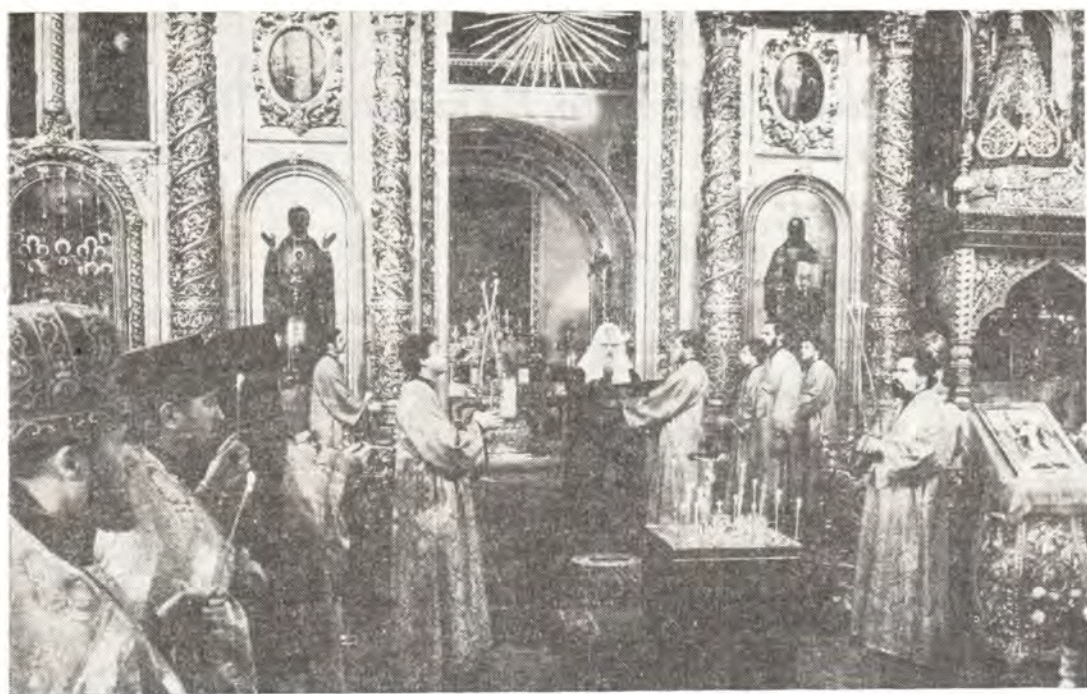
В Богоявленском патриаршем соборе 5 мая 1985 года. Святейший Патриарх Пимен обращается к молящимся с словом, посвященным 40-летию Победы советского народа в Великой Отечественной войне

сковского и Коломенского Сергия, с которым он обратился в первый день войны ко всем чадам Русской Православной Церкви. Выражая глубокую веру в правую Победу советского народа, Митрополит Сергей писал: «Отечество защищается оружием и общим народным подвигом, общей готовностью послужить Отечеству в тяжкий час испытаний, всем, чем каждый может».