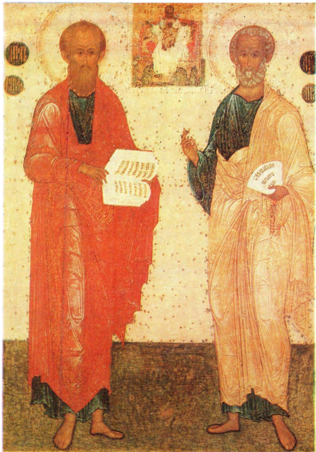
СВЯТЫЕ ПЕРВОВЕРХОВНЫЕ АПОСТОЛЫ ПЕТР И ПАВЕЛ