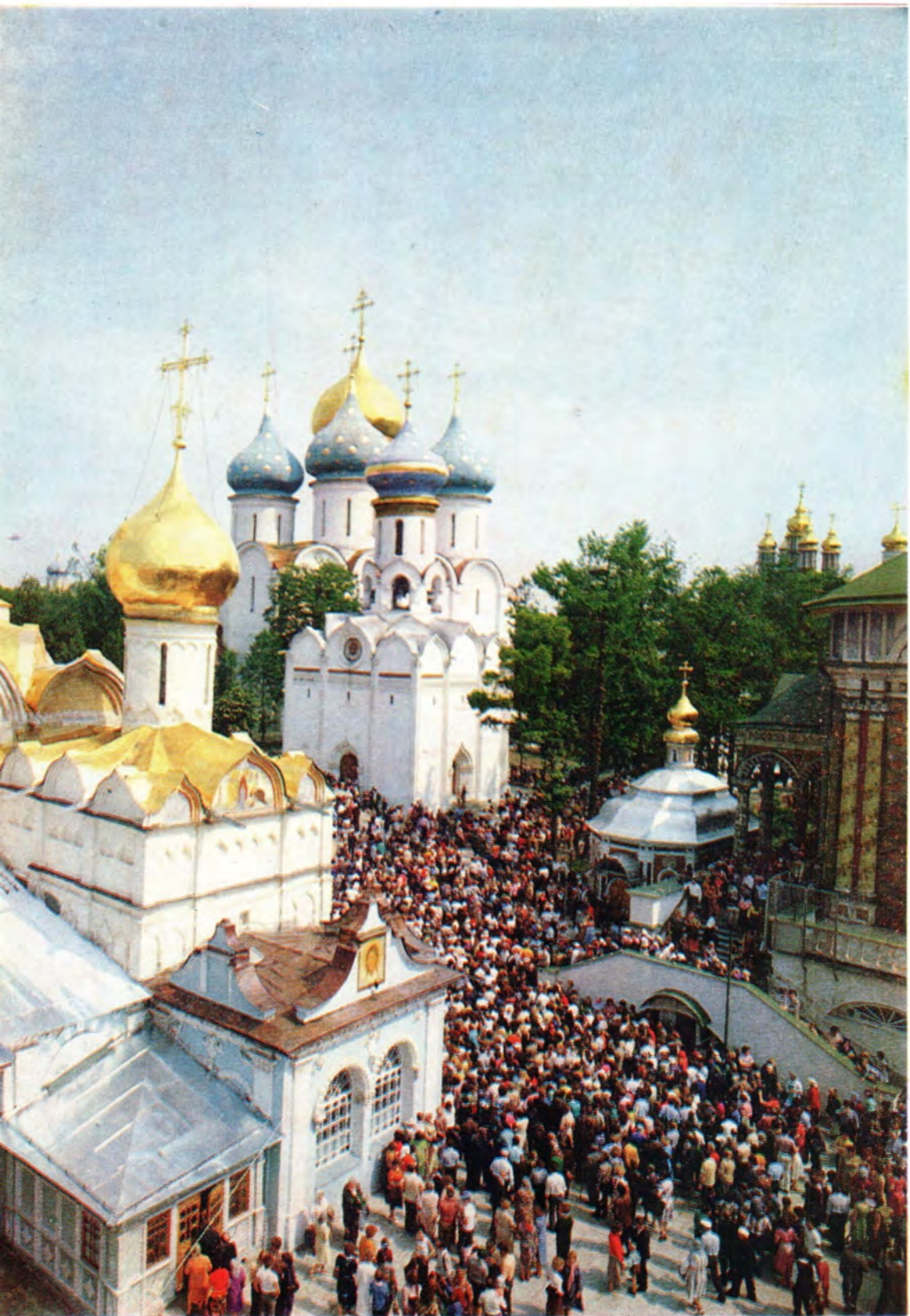
НА ПРАЗДНИКЕ ПРЕПОДОБНОГО СЕРГИЯ РАДОНЕЖСКОГО В ТРОИЦЕ-СЕРГИЕВОЙ ЛАВРЕ 18 июля 1984 года