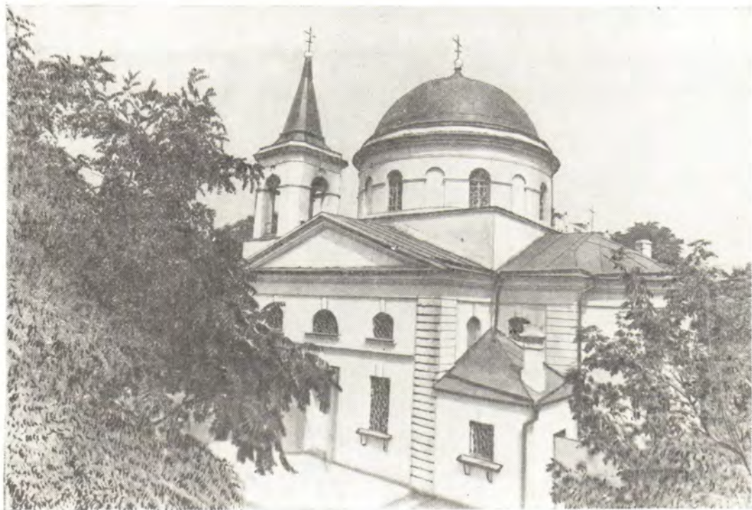
Собор во имя Святителя Николая в г. Николаеве