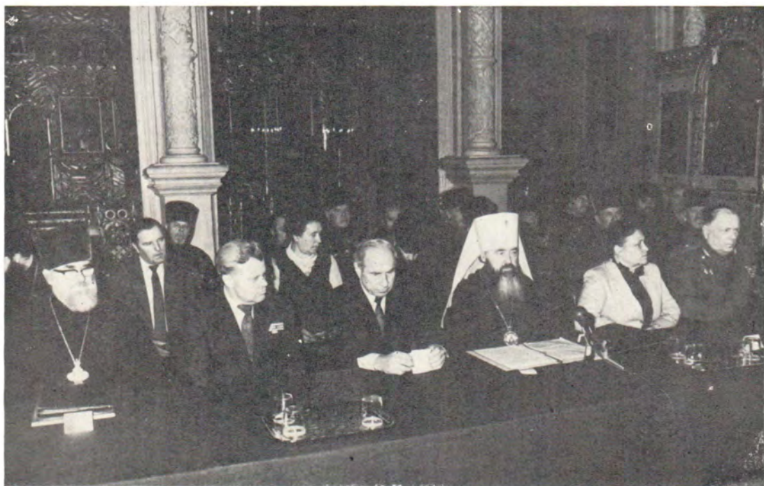
Президиум собрания. В центре — митрополит Крутицкий и Коломенский Ювеналий

Успенский храм в Новодевичьем монастыре. Москва, 25 апреля 1985 года