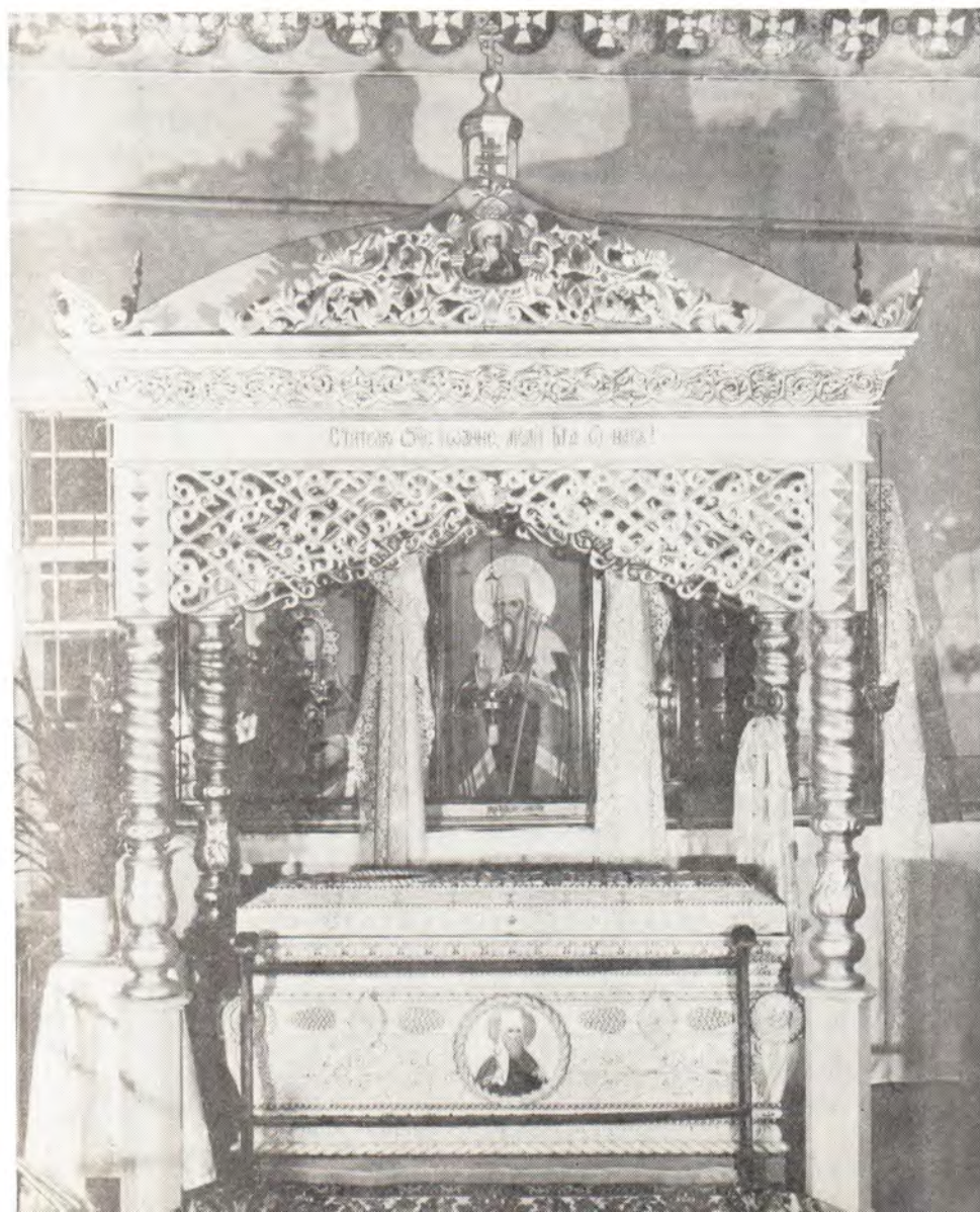
Рака с мощами свяителя Иоанна, митрополита Тобольского