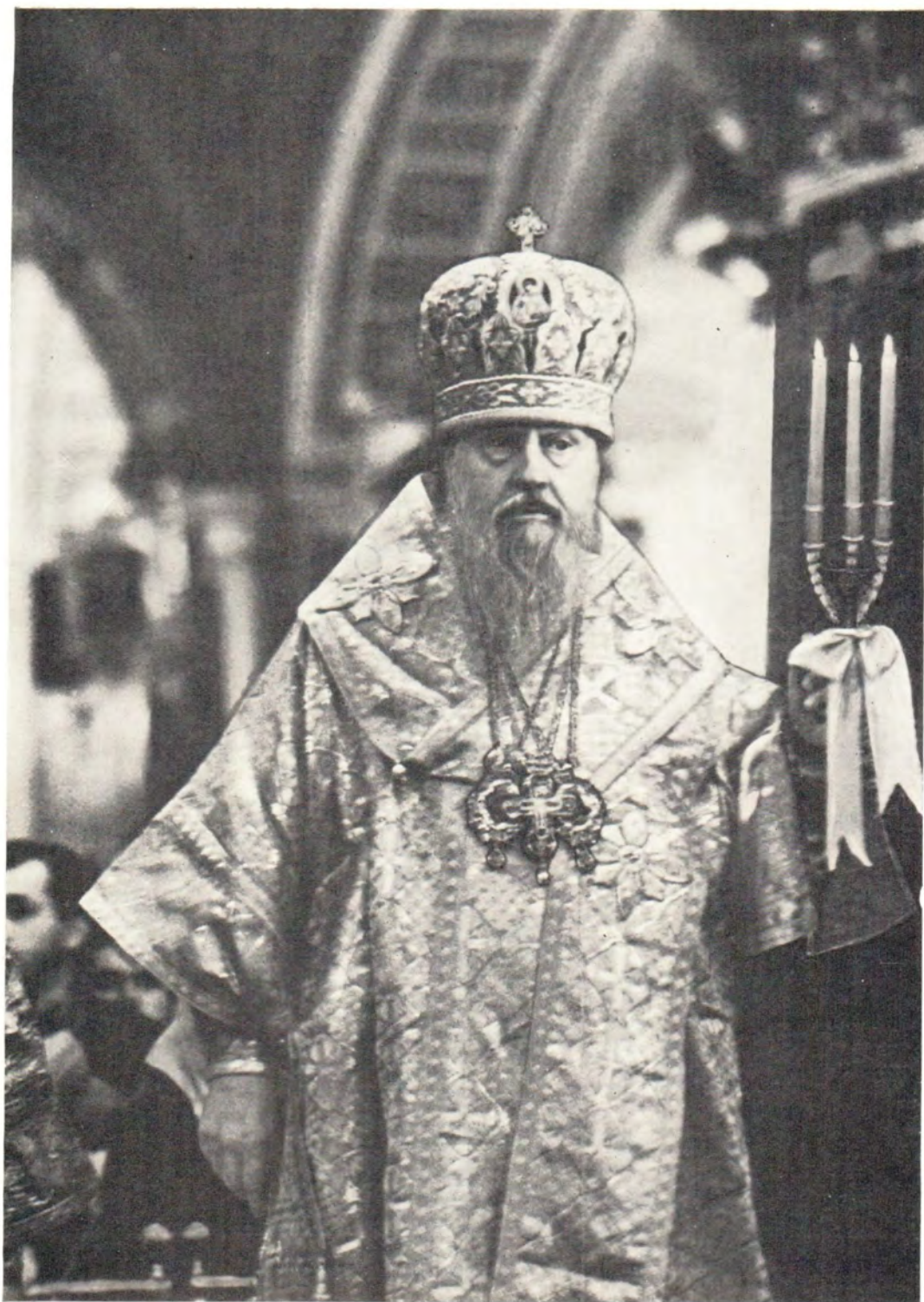
Святейший Патриарх Пимен на пасхальной утрени в Богоявленском патриаршем соборе в ночь на 14 апреля 1985 года