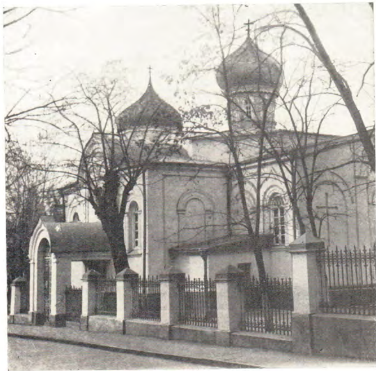
Храм во имя святого благоверного великого князя Александра Невского в г. Тбилиси