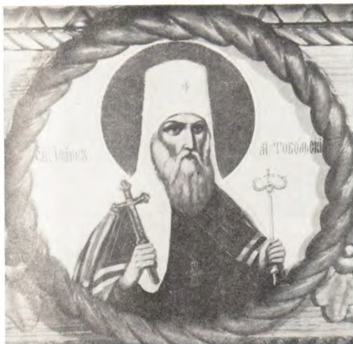
СВЯТИТЕЛЬ ИОАНН, МИТРОПОЛИТ ТОБОЛЬСКИЙ. Память 10/23 июня. Икона на раке с мощами свяителя Тобольского Иоанна в Покровском соборе в г. Тобольске