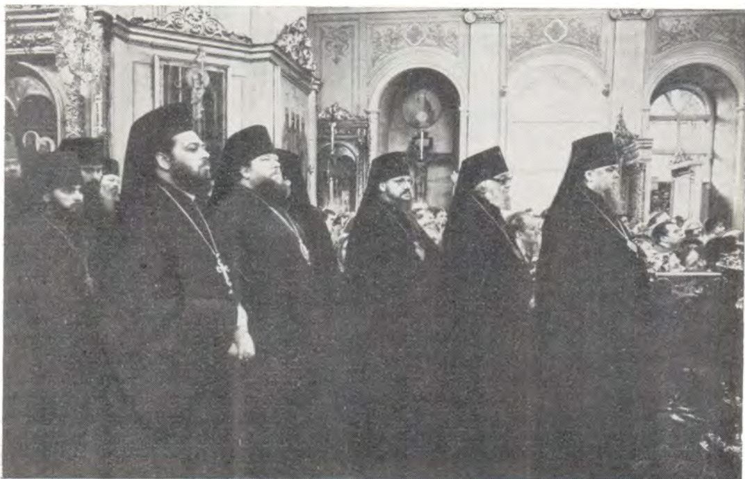
Преосвященные архиереи и клирики во время пасхального поздравления Святейшего Патриарха Пимена в Богоявленском патриаршем соборе 15 апреля 1985 года