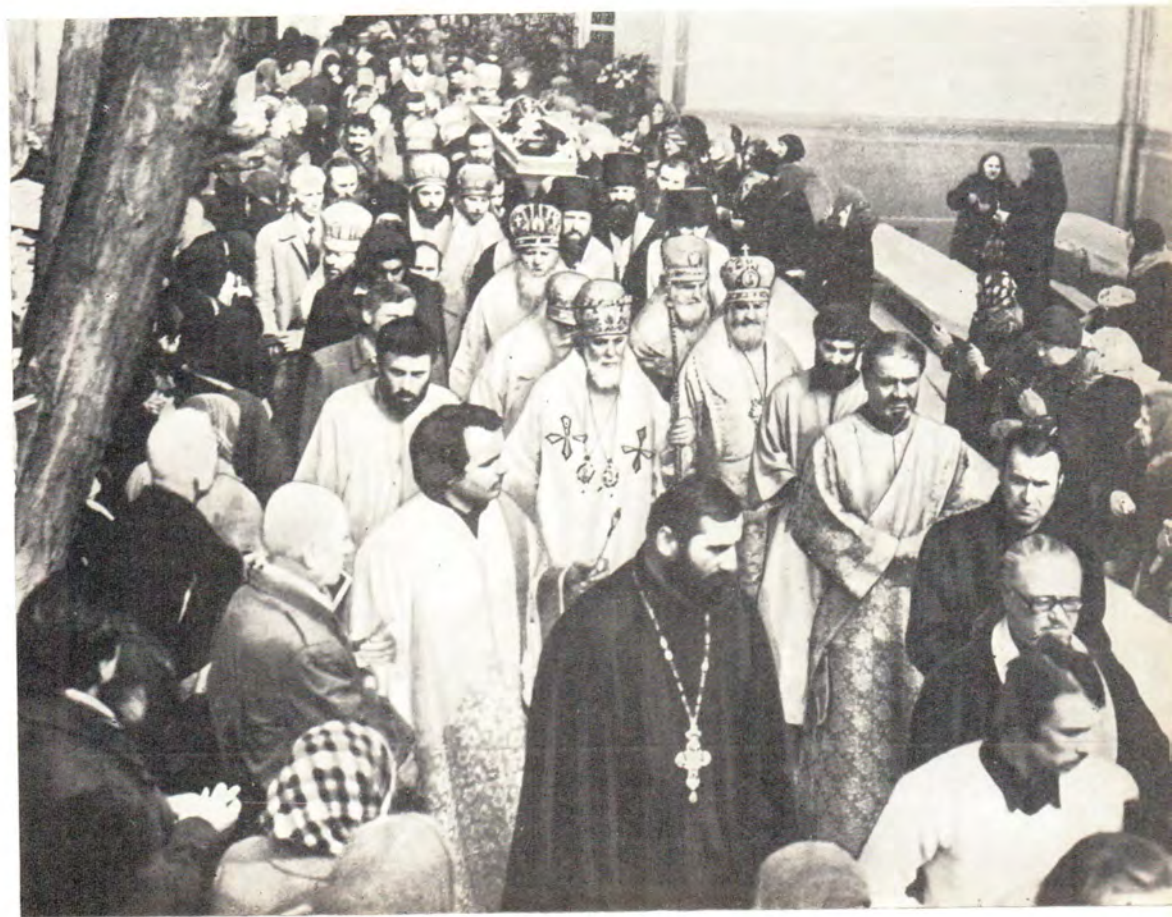
Обнесение гроба с телом митрополита Зиновия вокруг храма. В центре — Святейший и Блаженнейший Илия II, Католикос-Патриарх всей Грузии