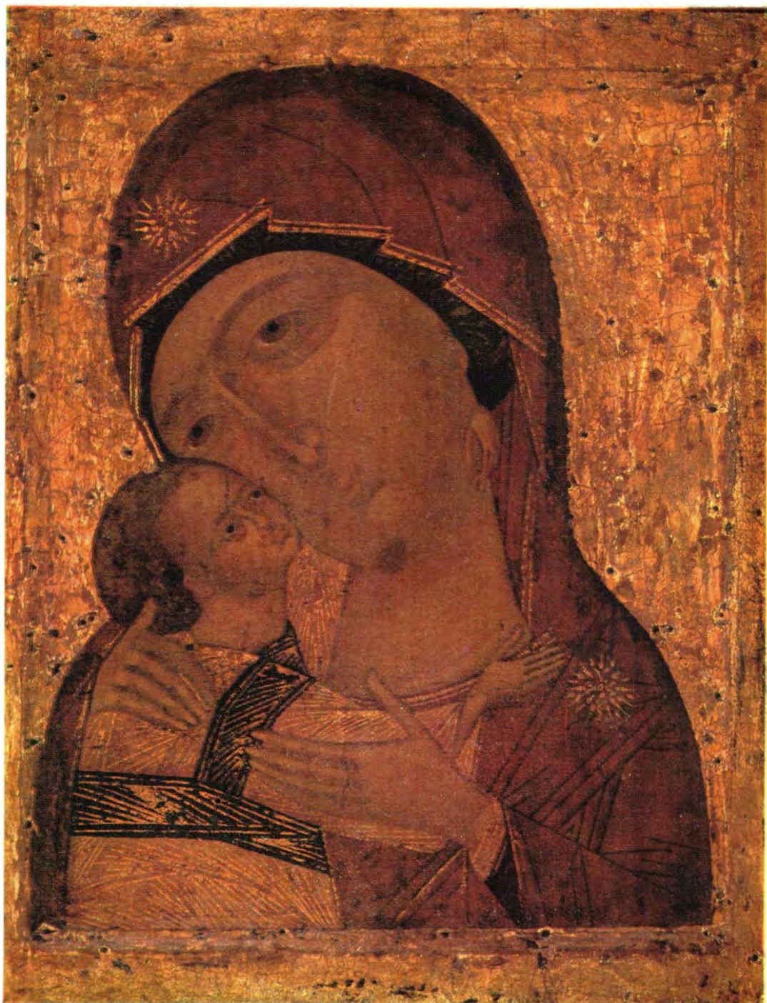
ИГОРЕВСКАЯ ИКОНА БОЖИЕЙ МАТЕРИ (Празднование совершается 5/18 июня)