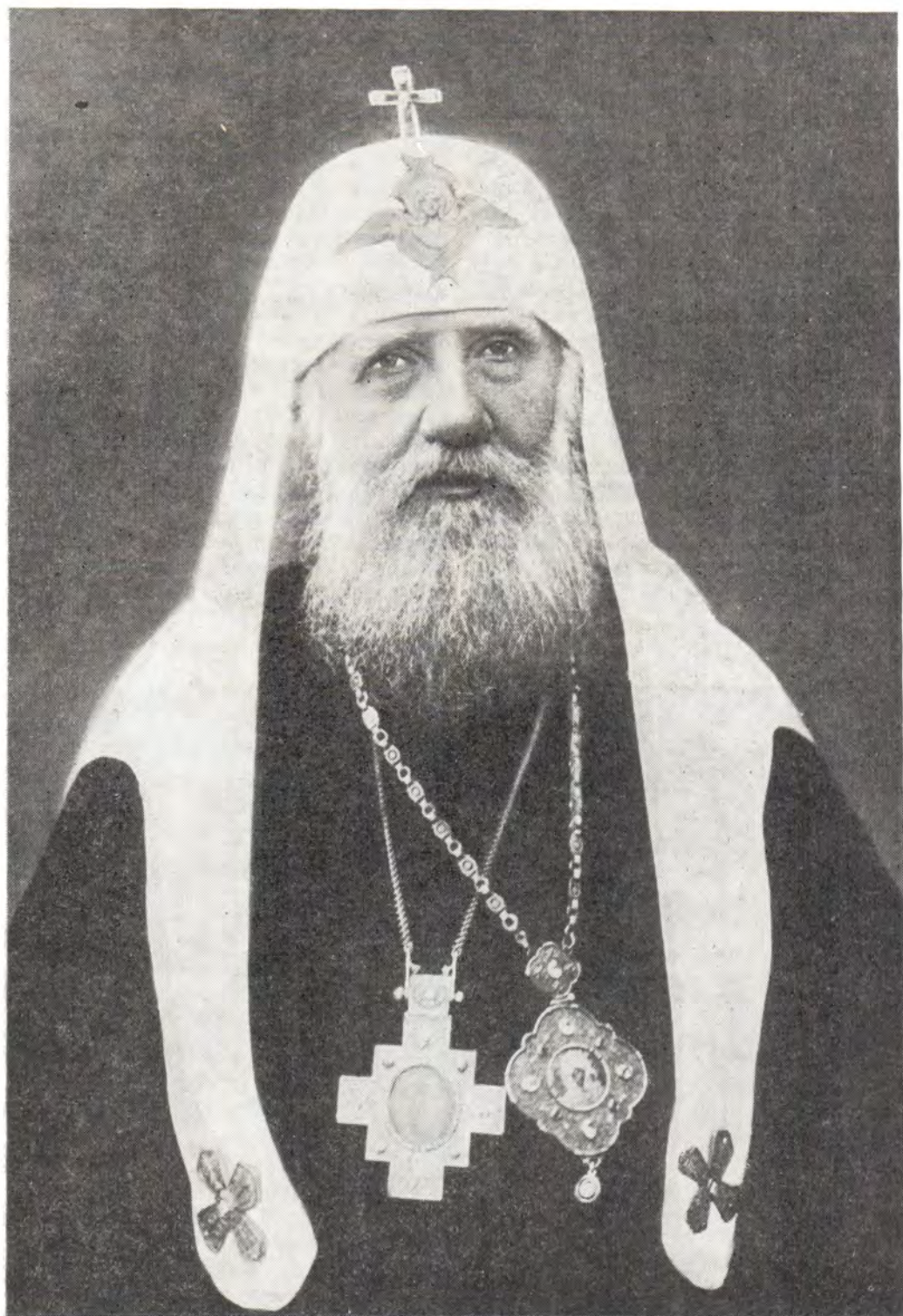
СВЯТЕЙШИЙ ПАТРИАРХ МОСКОВСКИЙ И ВСЕЯ РОССИИ ТИХОН († 25 марта/7 апреля 1925 года)