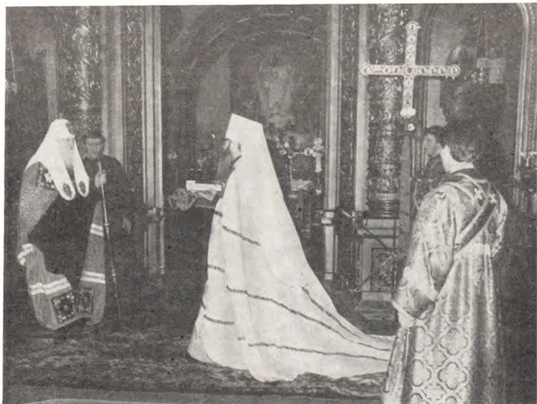
Богоявленский патриарший собор, 15 апреля 1985 года. Митрополит Крутицкий и Коломенский Ювеналий от имени клира и мирян Москвы и Московской епархии поздравляет Святейшего Патриарха Пимена с праздником Святой Пасхи

Святейший Патриарх Пимен в ответ на приветствие сказал: Ваше Высокопреосвященство, дорогой Владыко! Вы сказали много добрых слов в мой адрес. Во всем, что сделано, мне помогал Господь и помогала Ваша любовь и вера. Все члены Священного Синода, все те, кто посещает святые храмы, несомненно, содействуют успеху миротворческого дела. Борьба за мир — сейчас самое важное в жизни наших граждан. Нам Господь помогает, с нами Бог! И помощь Божия позволит нам умножить наш вклад в священную борьбу за мир во всем мире.