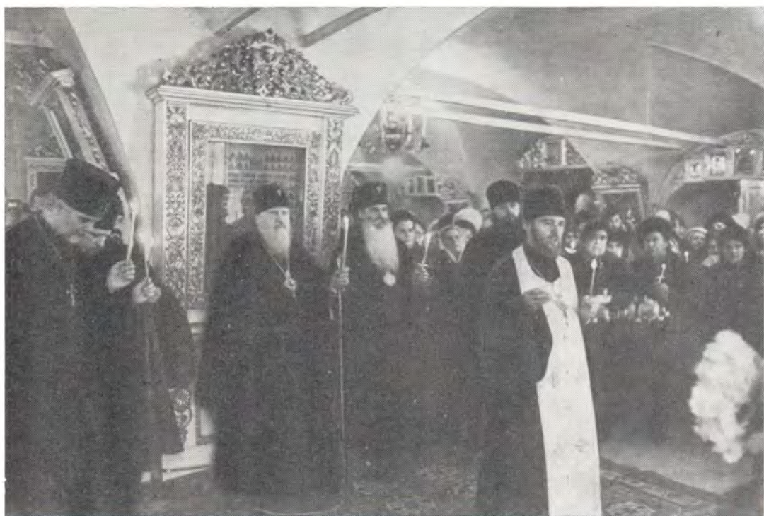
Малый собор в честь Донской иконы Божией Матери в Донском монастыре в Москве, 7 апреля 1985 года. Панихида по Святейшем Патриархе Тихоне. В центре — Святейший Патриарх Пимен и архиепископ Волоколамский Питирим

вершили панихиду. В тот же день почтить память в Бозе почившего Предстоятеля Русской Церкви в малый собор Донского монастыря прибыл Святейший Патриарх Московский и всея Руси Пимен, которого сопровождали архиепископ Волоколамский Питирим, настоятель Богоявленского патриаршего собора протопресвитер Матфей Стаднюк, благочинный храмов Москворецкого округа г. Москвы, настоятель храма в честь Положения Ризы Господней в Москве протоиерей Василий Свиденюк. В храме собрались многие клирики и прихожане московских храмов. Панихиду по Святейшем Патриархе Тихоне совершил настоятель Патриарших Крестовых храмов архимандрит Трифон. По окончании панихиды Святейший Патриарх Пимен и все пришедшие вознести молитву о Святейшем Патриархе Тихоне поклонились его гробнице.