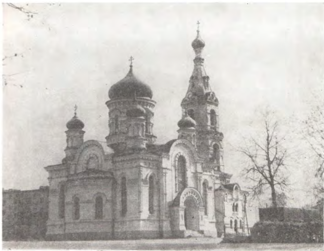
Успенский храм в г. Малоярославце, Калужская епархия