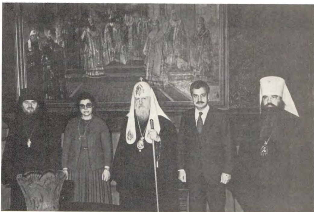
10 октября 1984 года Святейшему Патриарху Пимену в его московской резиденции нанес визит посол Республики Кипр в СССР г-н Ангелос М. Ангелидис с супругой по случаю его отъезда из Москвы