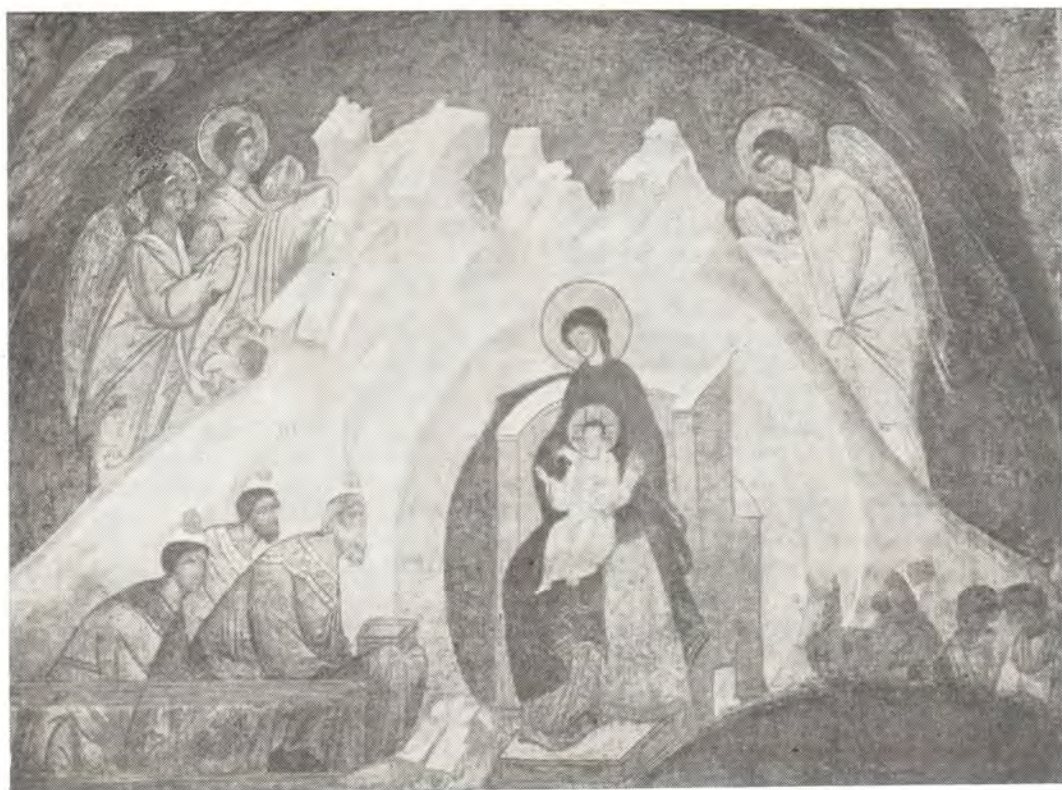
Поклонение волхвов. Фрагмент росписи «Собор Богоматери», школа Дионисия, 1481 год. Фреска придела в честь Похвалы Пресвятой Богородицы в Успенском соборе Московского Кремля

ста в Вифлееме, о звезде, о пастухах и Крещении в Иордане 1 . У Оригена под Богоявлением — επιφανεια понимается Крещение Господне, а от его ученика святого Григория Неоцесарийского дошло до нас Слово на Богоявление. В мученических актах епископа Иераспольского Филиппа (†304) сообщается о всеобщем распространении этого праздника во Фракии.