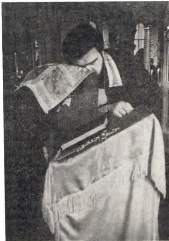
Слово назидания в Таинстве Покаяния

В Таинстве Покаяния душа человека погружается как бы в купель милосердия Божия, чтобы вновь умереть для греха и восстать под благодатным воздействием Царства Божия и правды Его (Мф. 6, 33) и вновь обрести путь