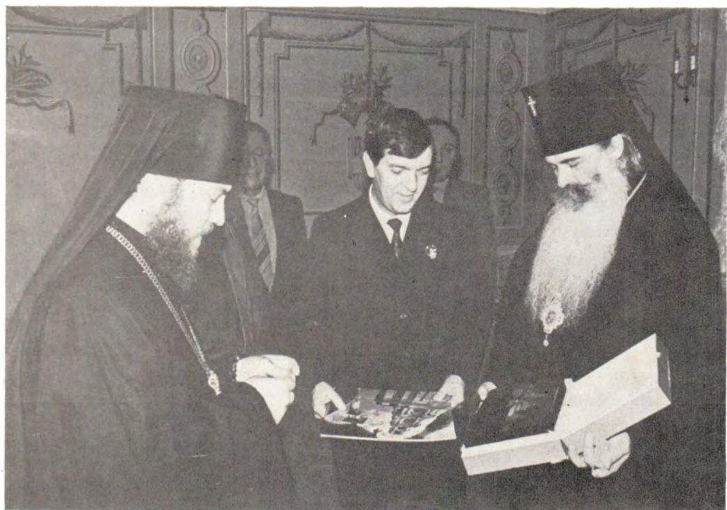
22 октября 1984 года Троице-Сергиеву Лавру посетил заместитель премьер-министра Финляндии, министр иностранных дел П. Вяюрюнен (в центре), находившийся с официальным визитом в СССР. Министра приветствовал архиепископ Волоколамский Питирим, председатель Издательского отдела (справа)