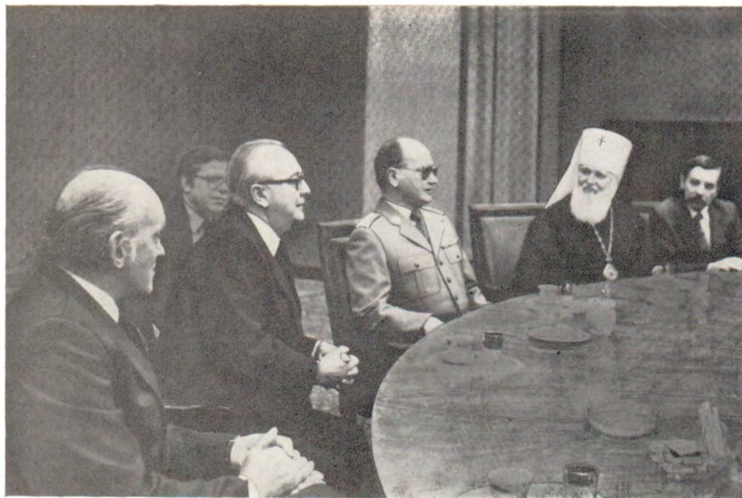
Руководители Христианской Мирной Конференции на приеме у Председателя Совета Министров ПНР В. Ярузельского 5 июня 1984 года, во время специального заседания Президиума ХМК в Ойржакове, близ Варшавы (ПНР), 4—6 июня 1984 года