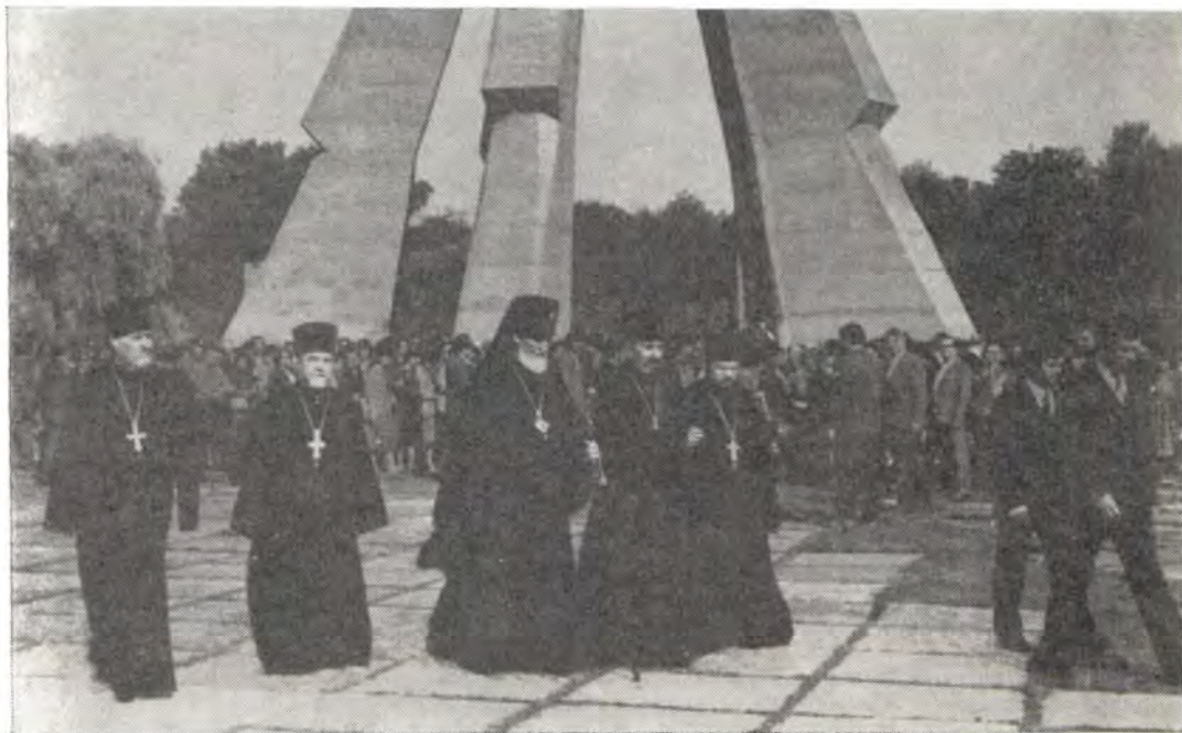
Архиепископ Кишиневский и Молдавский Ионафан и клирики Кишиневской епархии после возложения венка к Мемориалу воинской славы в г. Кишиневе 24 августа 1984 года