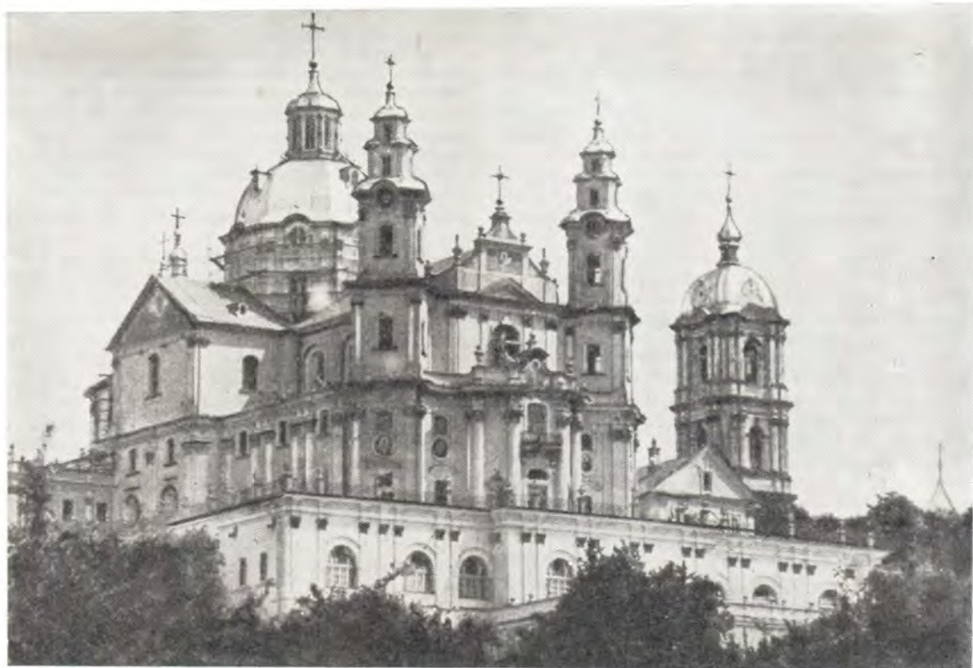
Почаевская Успенская Лавра