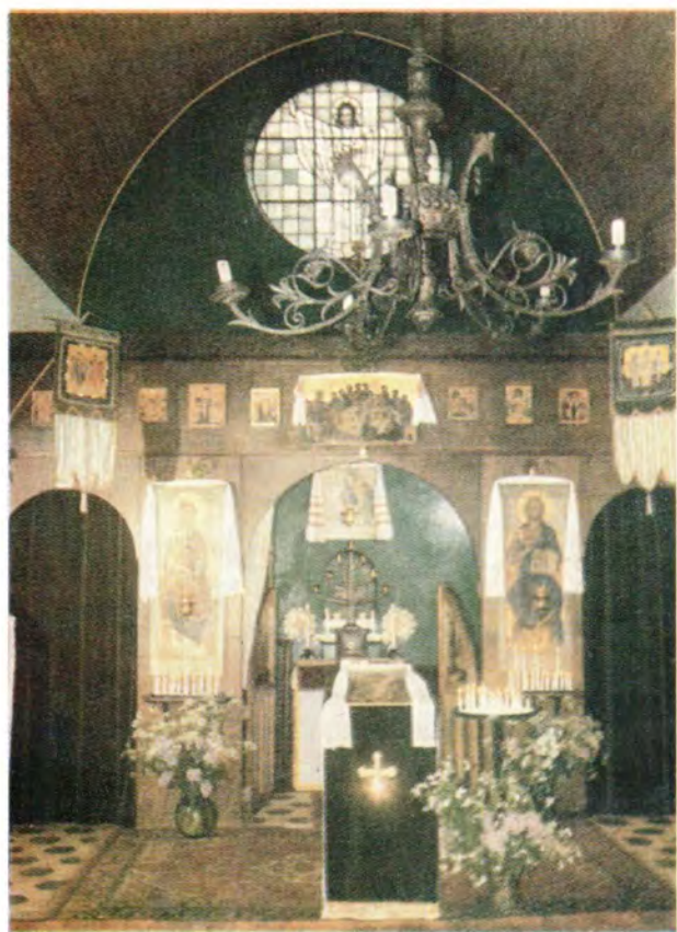
Внутренний вид Преображенского храма в г. Гронингене