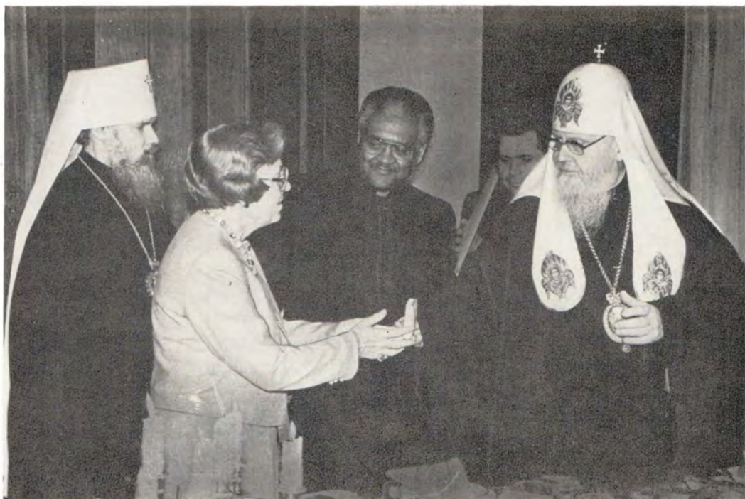
Святейший Патриарх Пимен вручает орден святого князя Владимира II степени генеральному секретарю Национального Совета Церквей Христа в США д-ру Клэр Ренделл 23 октября 1984 года на приеме, устроенном его Святейшеством в честь делегации НСЦХ