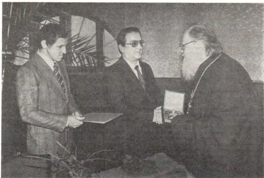
Президент Христианского социального объединения в Польше Казимир Моравский вручает Святейшему Патриарху Пимену медаль «Блаженны миротворцы» за активную миротворческую деятельность 18 октября 1984 года

20 октября делегация побывала в г. Туле, где ей оказал внимание архиепископ Тульский и Белевский Герман. Гости ознакомились с религиозной и культурной жизнью города, посетили мемориальный музей-усадьбу Л. Н. Толстого «Ясная Поляна».