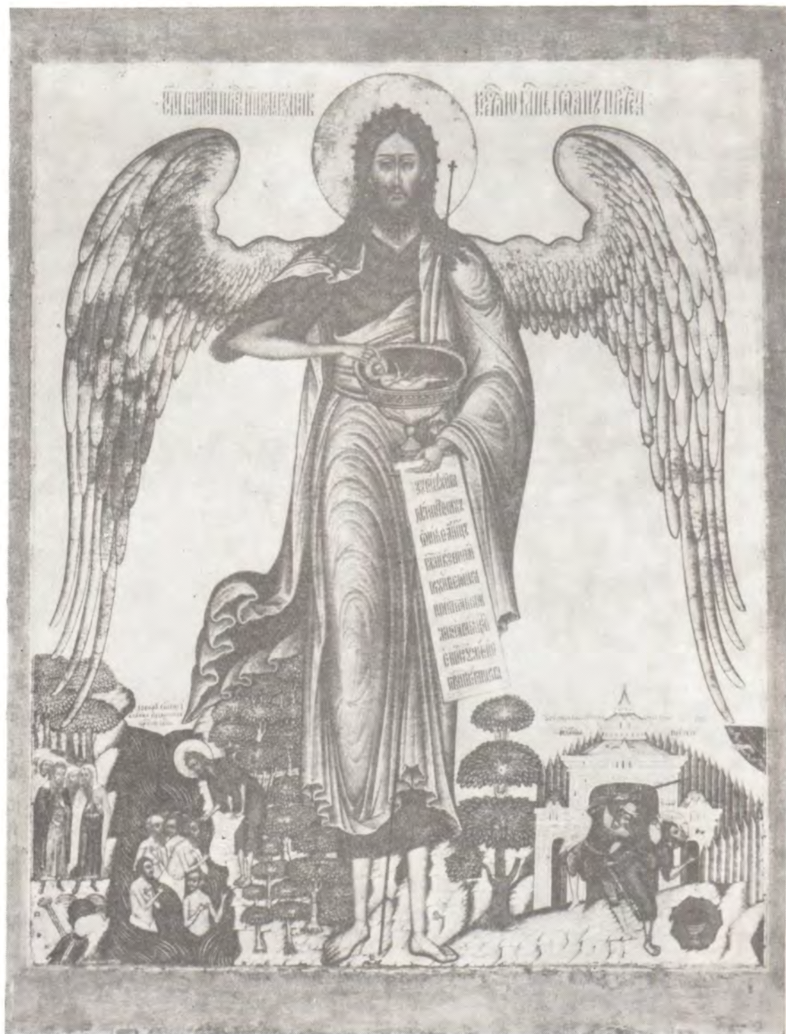
СВЯТОЙ ПРОРОК, ПРЕДТЕЧА И КРЕСТИТЕЛЬ ГОСПОДЕНЬ ИОАНН Память 7/20 января