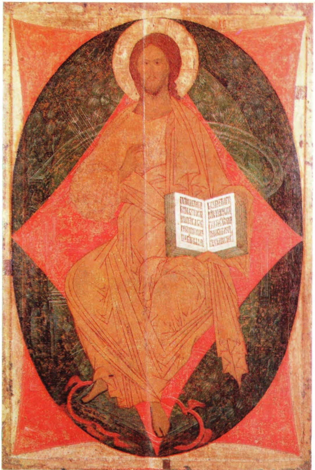
ГОСПОДЬ ВСЕДЕРЖИТЕЛЬ НА ПРЕСТОЛЕ