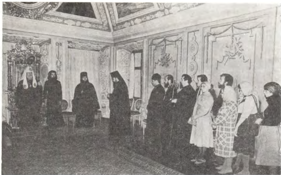
Делегация Польской Православной Церкви во главе с епископом Белостокским и Гданьским Саввой на приеме у Святейшего Патриарха Пимена в патриарших покоях в Троице-Сергиевой Лавре в праздник Преподобного Сергия Радонежского, 8 октября 1984 года