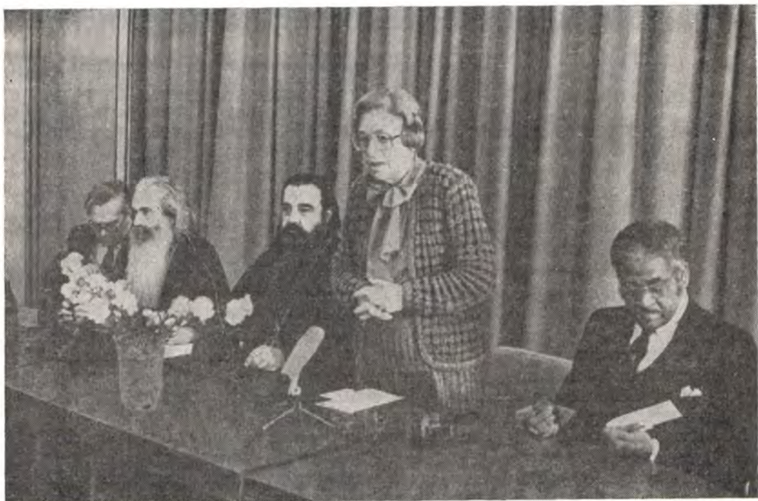
Президиум богословского собеседования представителей Правления НСЦХ в США с представителями Церквей в СССР, состоявшегося в Издательском отделе Московского Патриархата 23 октября 1984 года

Церквей к единству, свидетельству и служению. Было подчеркнуто, что для обновления важное значение имеют богословски образованные женщины и семья, как место христианского окормления. Ученичество, свидетельство Церкви в обществе и единство Церкви были определены как моменты, существенно важные для обновления. Обе стороны согласились с тем, что задача обновленной Церкви состоит в том, чтобы стремиться не к власти в мирском понимании, а в том, чтобы оставаться верной в стремлении стать солью, придающей вкус всем нашим обществам, сияющей идеей справедливости и мира для всего мира.