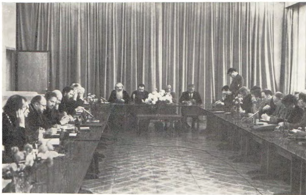
Представители правления НСЦХ в США на собеседовании с представителями Церквей в СССР в Издательском отделе Московского Патриархата 23 октября 1984 года