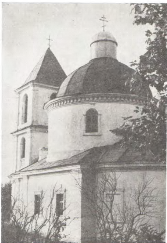
Храм во имя Святителя Николая в г. Верхнедвинске, Минская епархия