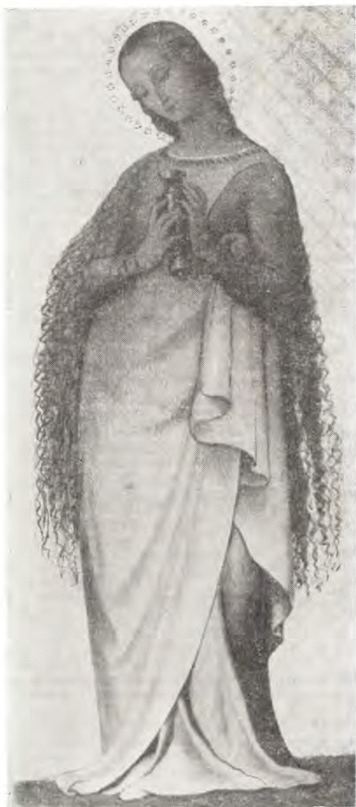
Икона равноапостольной Марии Магдалины из веймарского храма