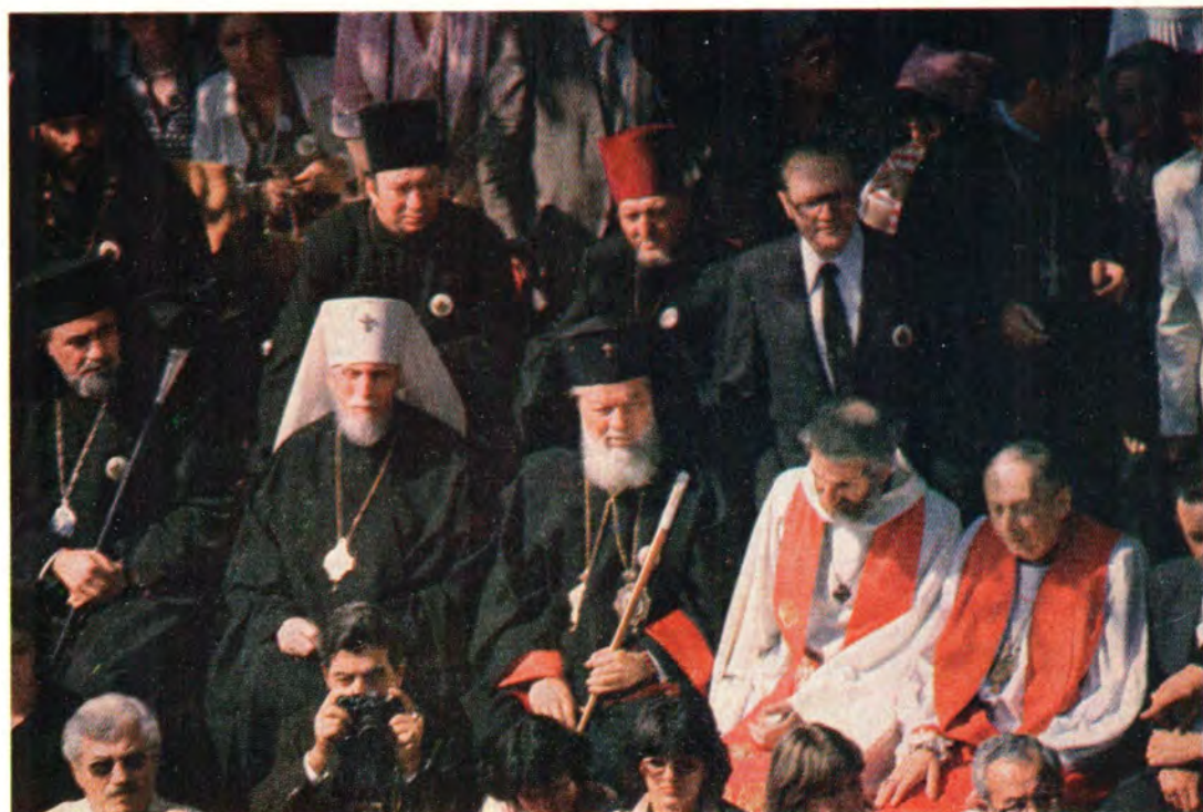
25 сентября 1983 года, Святой Эчмиадзин. Почетные гости на празднике. В первом ряду: епископ г. Альба-Юлия Емилиан (Румынская Православная Церковь), митрополит Ленинградский и Новгородский Антоний, митрополит Молдовы и Сучавы Феоктист (Румынская Православная Церковь), настоятель кентерберийского собора каноник Виктор де Ваал, епископ Генри Хилд (Англиканская Церковь, Канада)