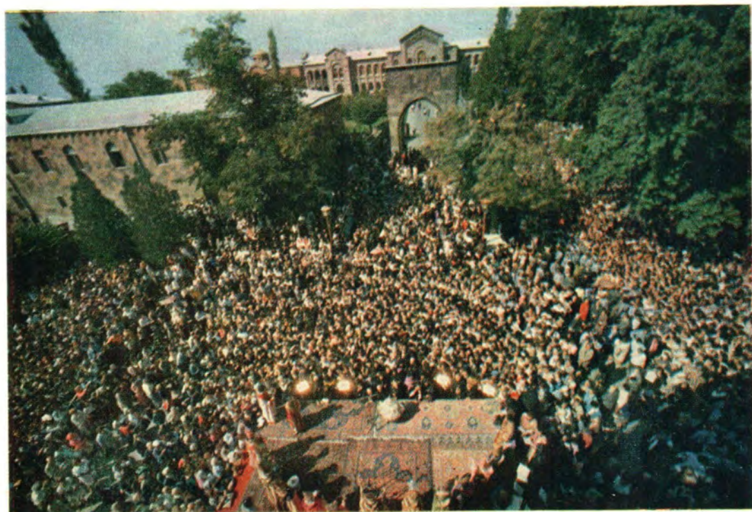
25 сентября 1983 года. Во время совершения чина освящения мира. Площадь перед кафедральным собором Святой Эчмиадзин, заполненная верующими