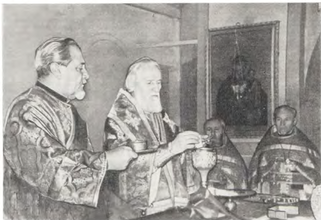
Архиепископ Кишиневский и Молдавский Ионафан совершает Божественную литургию в Феодоро-Тироновском кафедральном соборе в Кишиневе 21 ноября 1983 года

прочих Небесных Сил бесплотных, в Феодоро-Тироновском кафедральном соборе в г. Кишиневе было молитвенно отмечено 50-летие служения архиепископа Кишиневского и Молдавского Ионафана в священном сане.