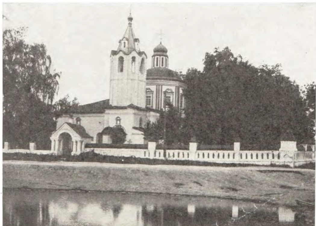
Всехсвятский храм в с. Эдемкое