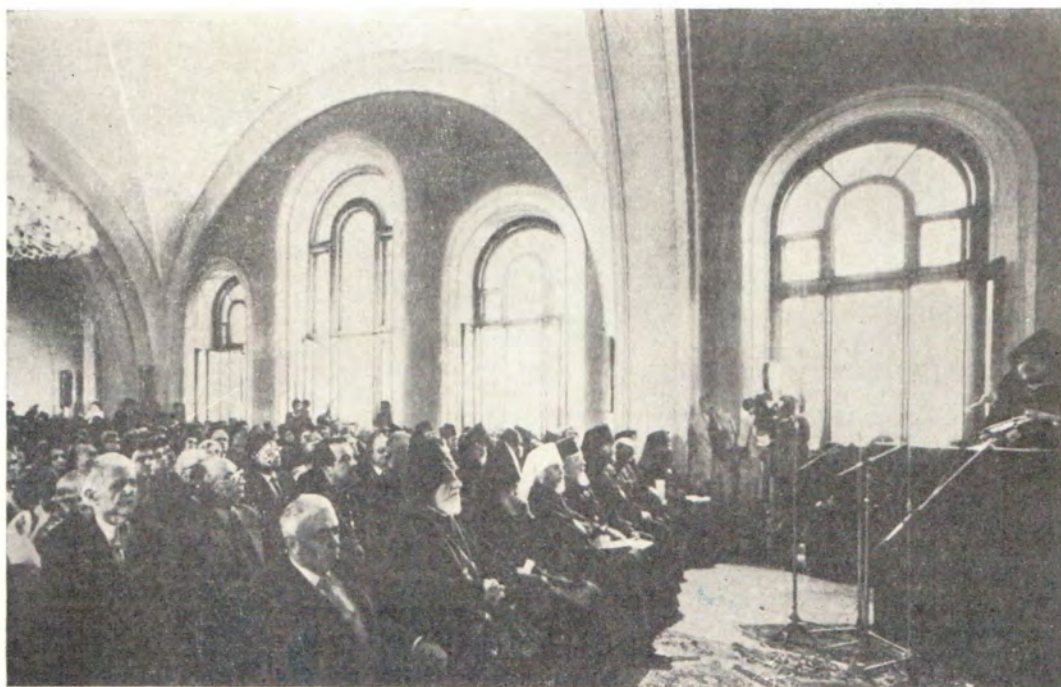
На торжественном собрании, посвященном 75-летию Святейшего Верховного Патриарха-Католикуса всех армян Вазгена I, в патриаршей резиденции 27 сентября 1983 года