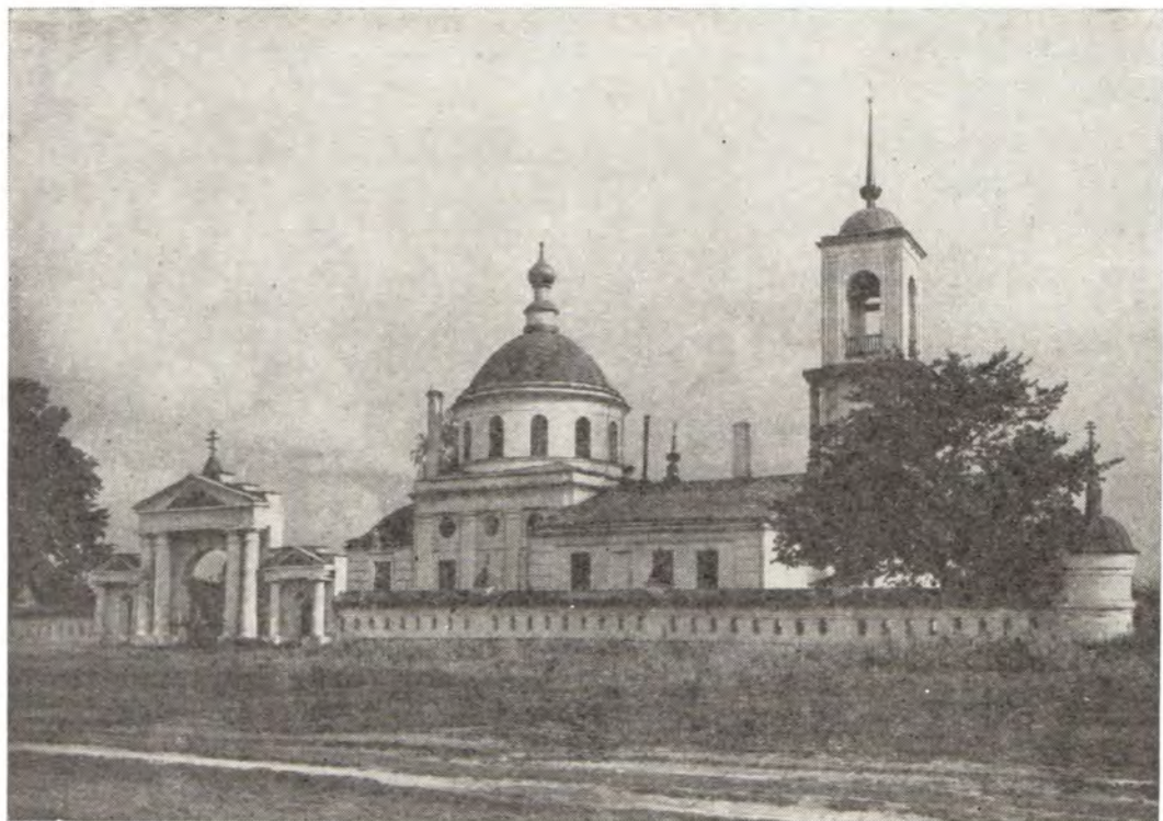
Троицкий храм в с. Горки