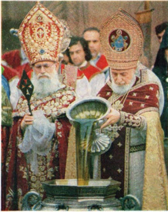
25 сентября 1983 года. Святейший Верховный Патриарх-Католикос всех армян Вазген I совершает освящение мира. Слева — Блаженнейший Константинопольский Армянский Патриарх Архиепископ Шнорк Галустян