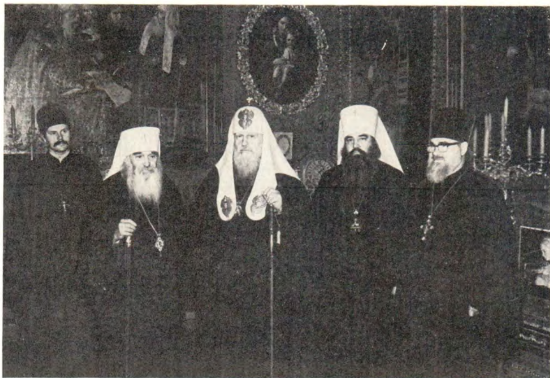
Блаженнейший Митрополит Варшавский и всей Польши Василий на приеме у Святейшего Патриарха Московского и всея Руси Пимена 6 февраля 1984 года