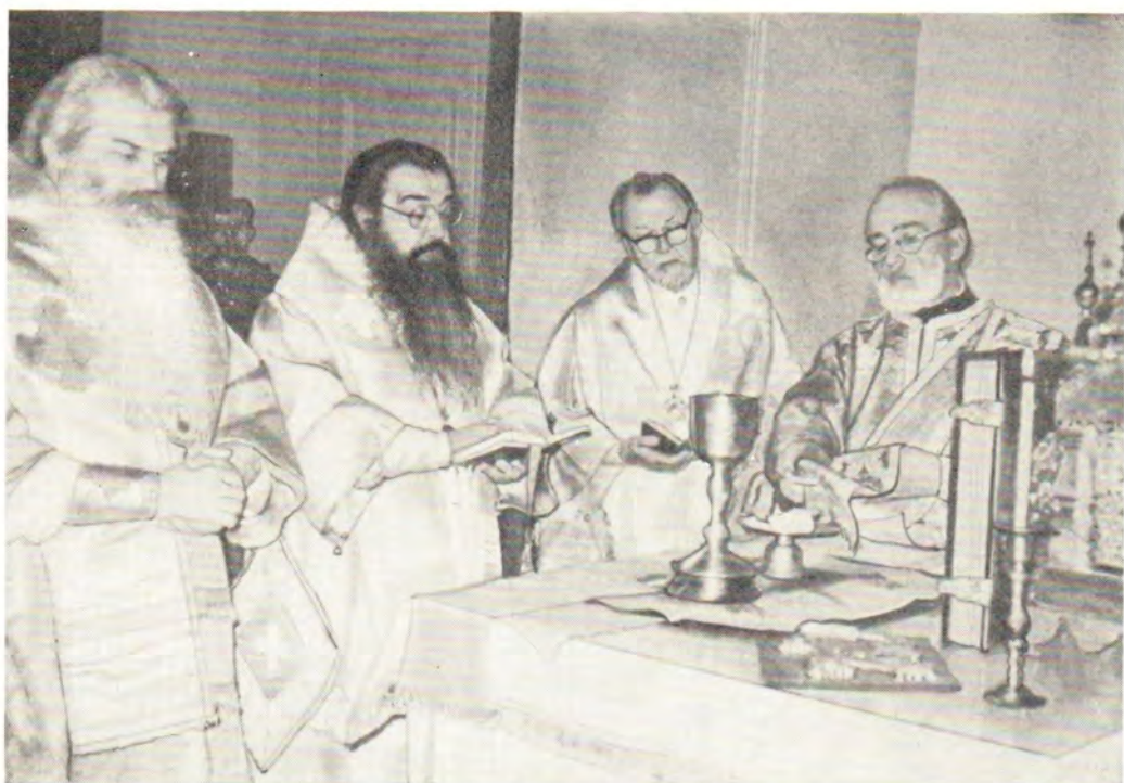
В воскресенье 15 января 1984 года митрополит Минский и Белорусский Филарет, Патриарший Экзарх Западной Европы, архиепископ Волоколамский Питирим и епископ Цюрихский Серафим за Божественной литургией в храме в честь Рождества Пресвятой Богородицы в представительстве Русской Православной Церкви при ВСЦ в Женеве (снимок вверху). На фото внизу: митрополит Филарет отвечает на приветствие профессора протопресвитера Виталия Борового, представителя Русской Православной Церкви при ВСЦ и настоятеля храма в честь Рождества Пресвятой Богородицы в Женеве