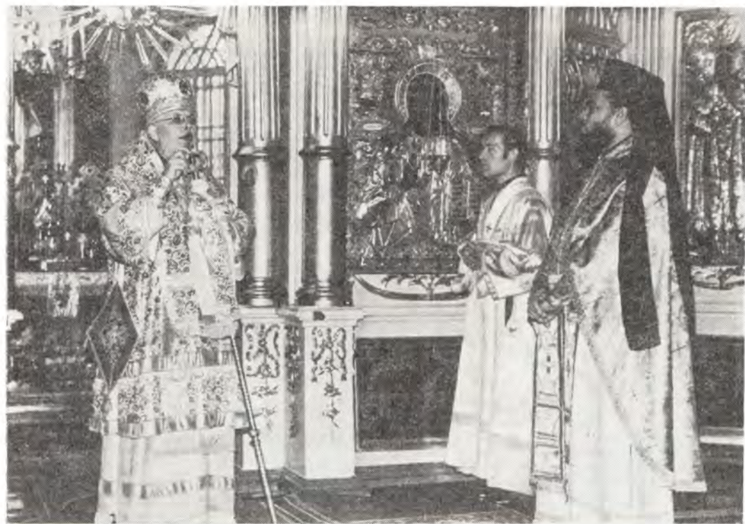
В Преображенском кафедральном соборе в г. Иваново 27 ноября 1983 года. Епископ Ивановский и Кинешемский Амвросий приветствует архимандрита Нифона, представителя Патриарха Антиохийского при Патриархе Московском

Кишиневская епархия. 21 ноября 1983 года, в праздник Архистратига Божия Михаила и