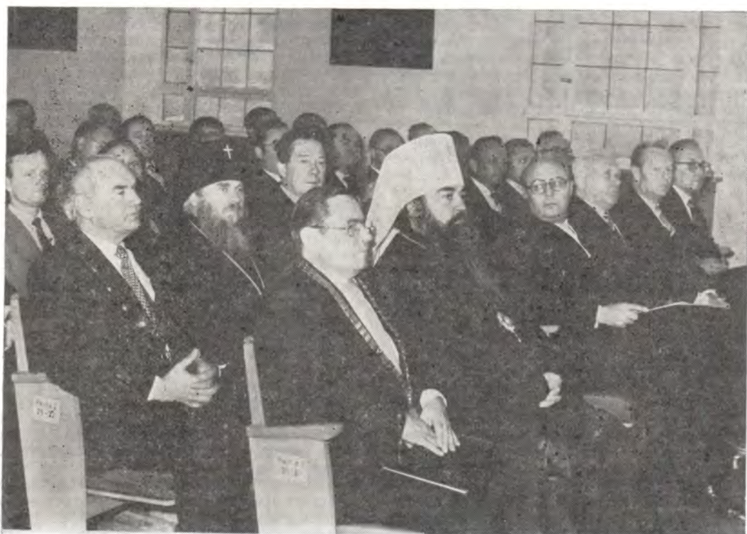
15 ноября 1983 года в Актовом зале университета Галле-Виттенберг им. Мартина Лютера

4. 4. Две опасности подстерегали Церковь на ее сложных исторических путях. Одна опасность — неумеренный консерватизм в отношении Предания. Часто, сохраняя вместе со Священным Преданием и естественные традиции