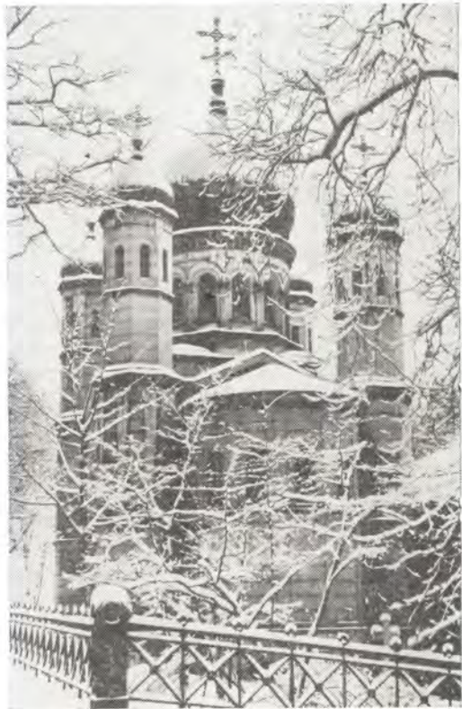
Храм во имя святой равноапостольной Марии Магдалины в Веймаре, ГДР

Академическое образование во многом способствовало становлению научно-богословских интересов Стефана Сабинина. Под влиянием известного русского богослова, переводчика Священного Писания, филолога и гебраиста протоиерея Герасима Павского (1787—1863) он усердно изучал Священное Писание Ветхого Завета. «Еще будучи студентом, когда он еще руководился наставлениями Павского в познании священного языка», Стефан Сабинин осуществил перевод книги пророка Иова на русский язык с помощью своего наставника. Прочитав перевод, протоиерей Герасим Павский дал такой отзыв об этом первом опыте своего ученика: «Желаю, чтобы еще начало повело к дальнейшему исследованию других книг Священ-