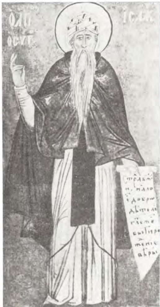
Преподобный Исаак Сирин

Память преподобного Исаака Сирина совершается Церковью 28 января/10 февраля.