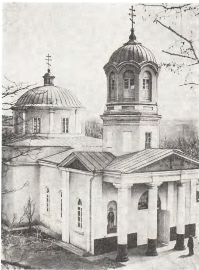
Храм во имя святой Параскевы Сербской в с. Твардице Кишиневской епархии

2 марта, в день памяти великомученика Фео-