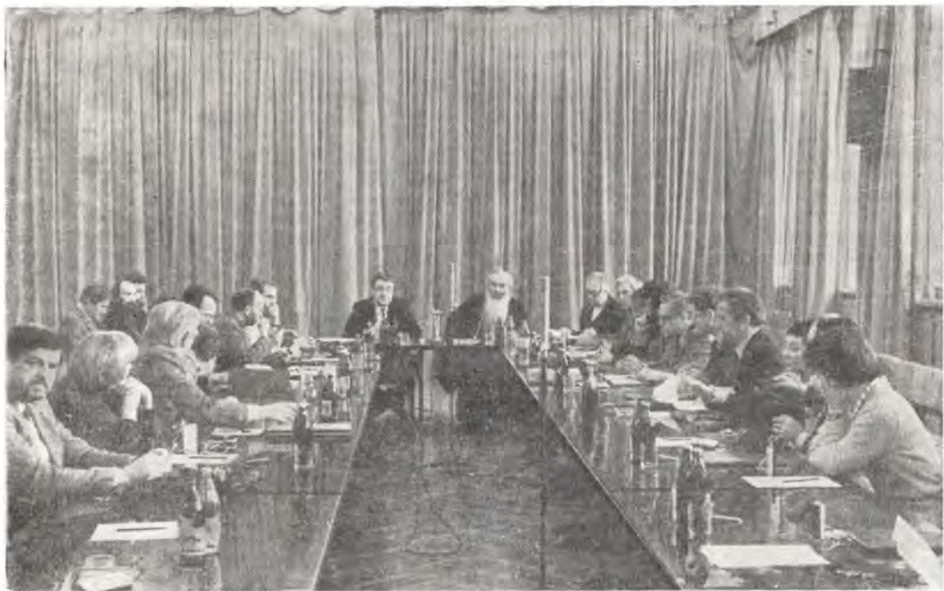
Рабочее заседание Экуменического круга по информации в Европе (ЭКИЕ) в конференц-зале Издательского отдела. Москва, 1 октября 1983 года

Участники собеседования были солидарны в том, что такие встречи необходимы «для получения информации из первых рук».