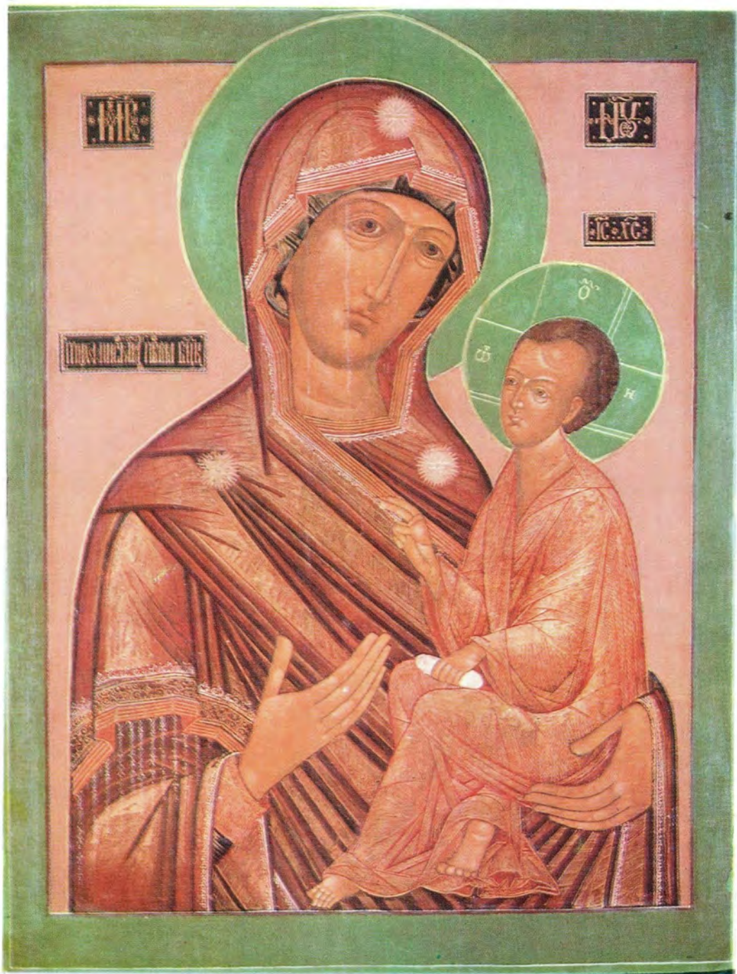
ТИХВИНСКАЯ ИКОНА БОЖИЕЙ МАТЕРИ

Из храма Воскресения словущего, что на Успенском Вражке в Москве XVII в.