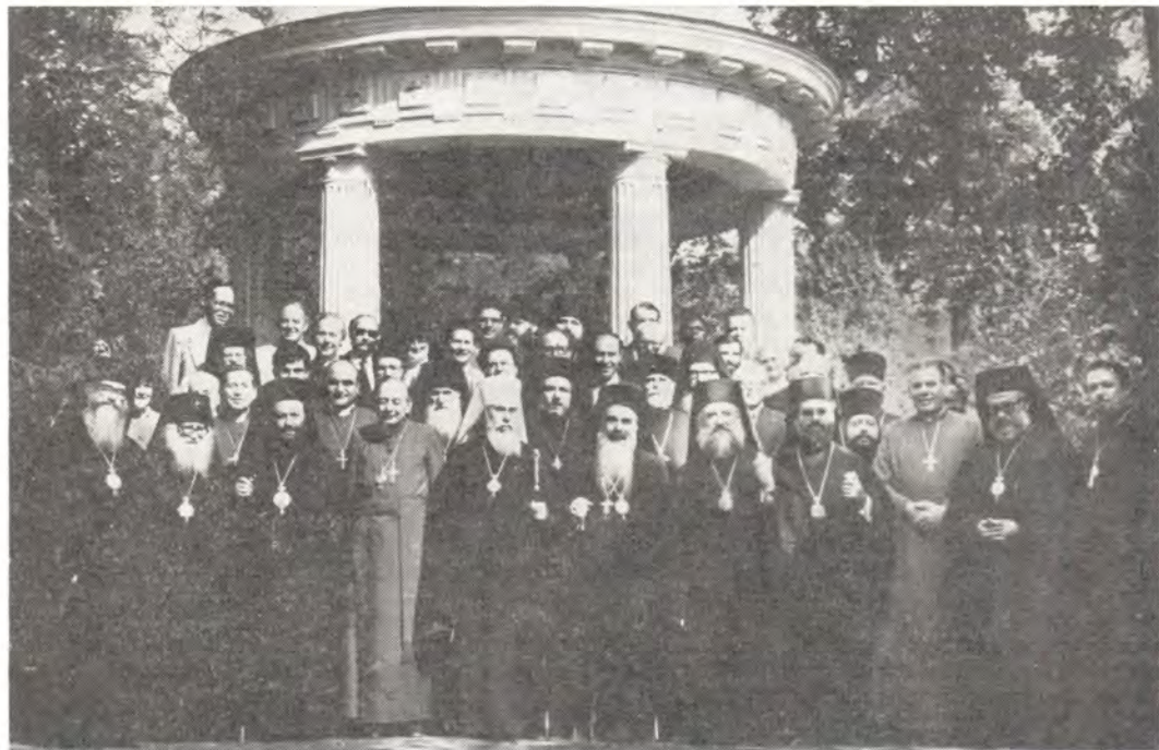
Участники заседания Объединенной англикано-православной комиссии по доктринальным вопросам в Успенском мужском монастыре в Одессе 18 сентября 1983 года