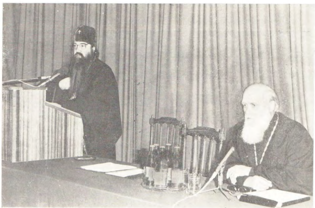
Семинар по итогам VI Ассамблеи Всемирного Совета Церквей в Ванкувере, Канада. Модератор — митрополит Киевский и Галицкий Филарет, Патриарший Экзарх Украины. Вверху: выступает митрополит Минский и Белорусский Филарет, Патриарший Экзарх Западной Европы, председатель Отдела внешних церковных сношений. Внизу: общий вид зала заседаний. Издательский отдел Московского Патриархата, 5—6 октября 1983 года