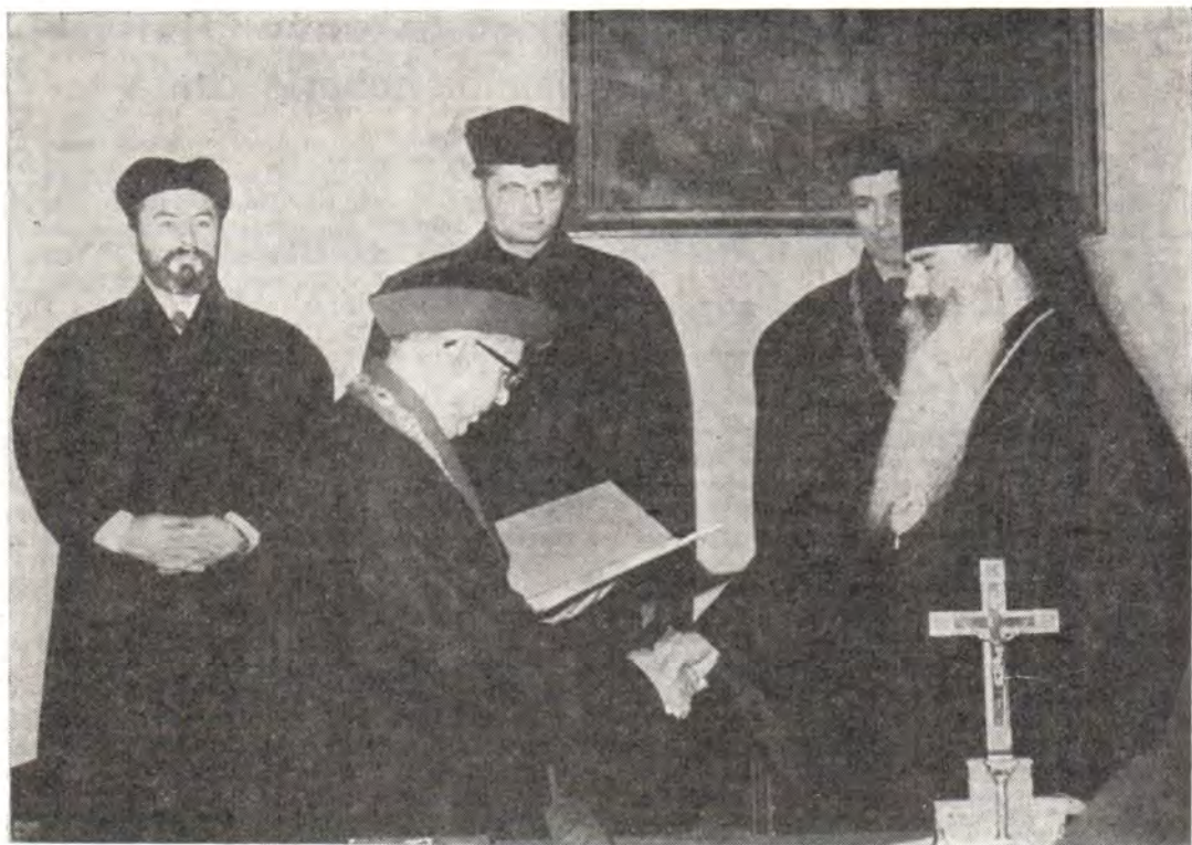
Д-р А. Гнидык вручает диплом доктора богословия honoris causa архиепископу Волоколамскому Питириму в Прешовском богословском факультете 22 ноября 1983 года

и миротворческом служении Церкви Христовой и миру во всем мире. От имени Чехословацкого правительства архиепископа Питирима тепло поздравил д-р К. Гомола.