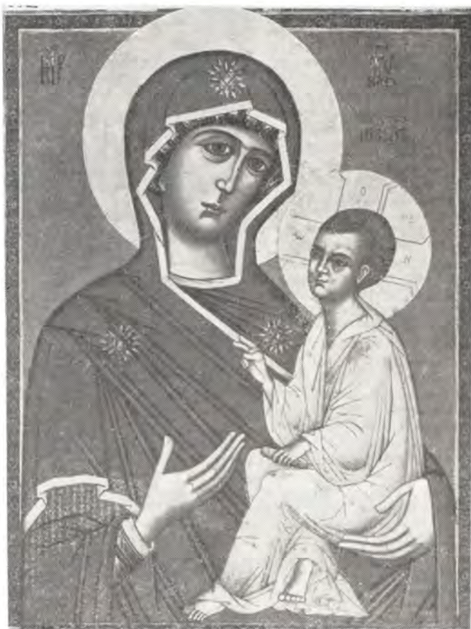
ТИХВИНСКАЯ ИКОНА БОЖИЕЙ МАТЕРИ

К числу чтимых икон Божией Матери принадлежит Тихвинская-Ополченнная. В 1812 году, во время Отечественной войны, было сформировано Тихвинское народное ополчение, в котором находилась Тихвинская икона, взятая из Тихвинского монастыря и названная Ополченнной. После успешного окончания военных действий в память о победе воины вместе с