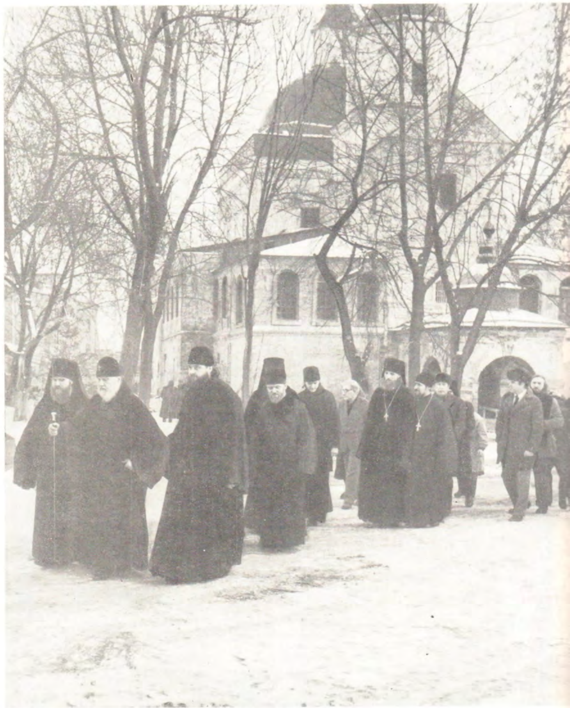
ПОСЕЩЕНИЕ СВЯТЕЙШИМ ПАТРИАРХОМ ПИМЕНОМ МОСКОВСКОГО ДАНИЛОВА МОНАСТЫРЯ 12 ЯНВАРЯ 1984 ГОДА