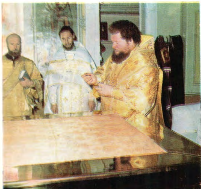
Епископ Солнечногорский Сергей, викарий Московской епархии, совершает чин освящения престола в Преображенском храме в г. Солнечногорске