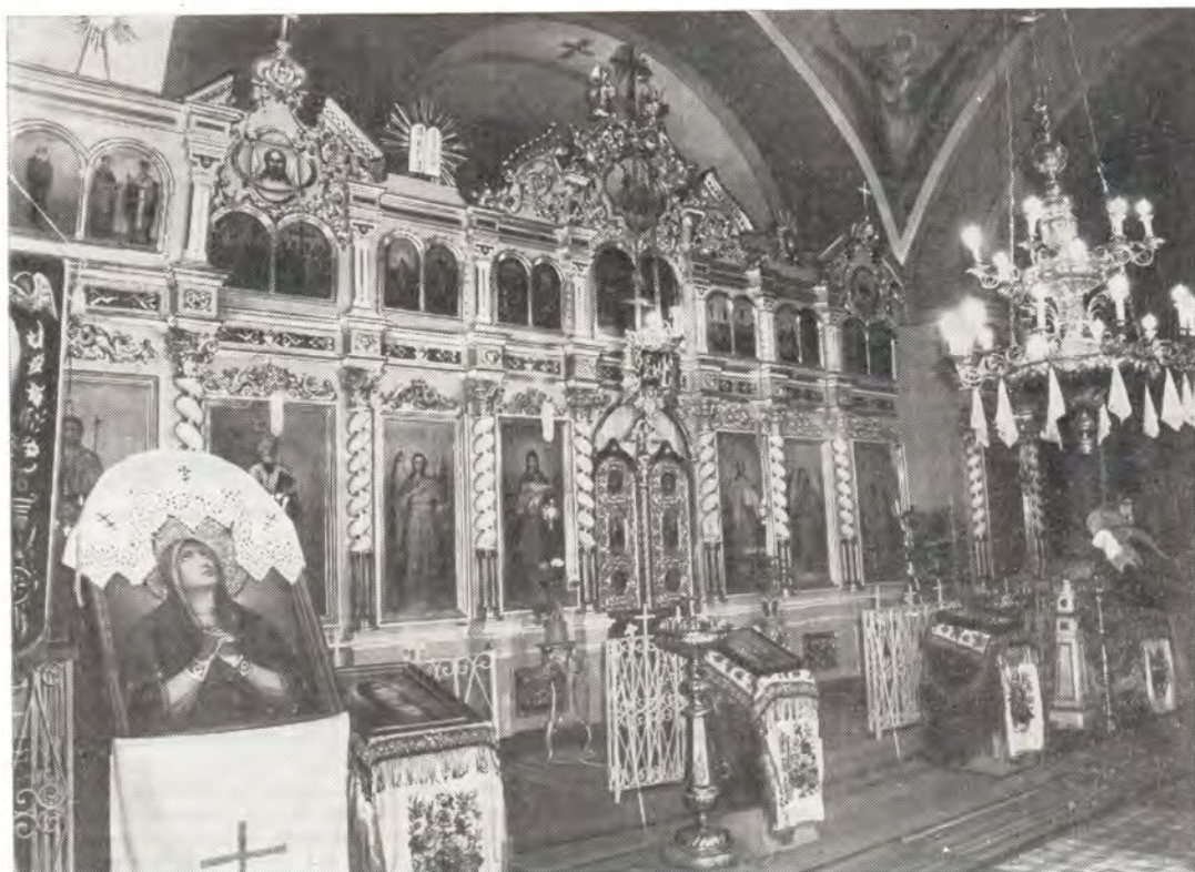
Иконостас Георгиевского храма в с. Кожушна Кишиневской епархии