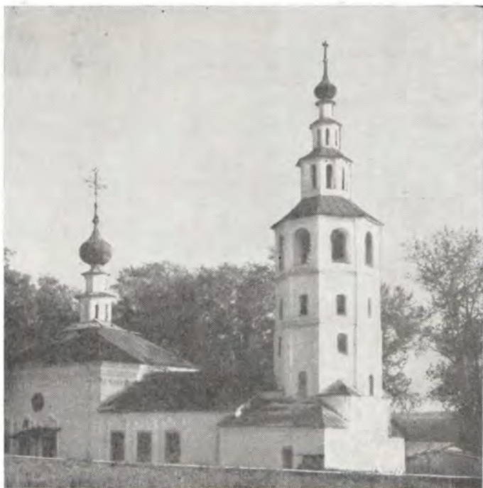
Знаменский храм в пос. Городище (Пермская епархия)

стоятеля Русской Православной Церкви на ниве Христовой.