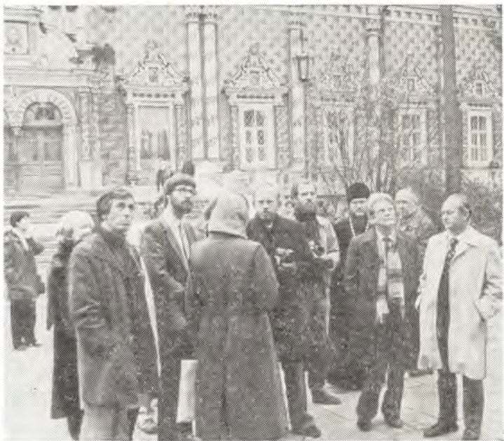
Христианские публицисты в Троице-Сергиевой Лавре 7 октября 1983 года