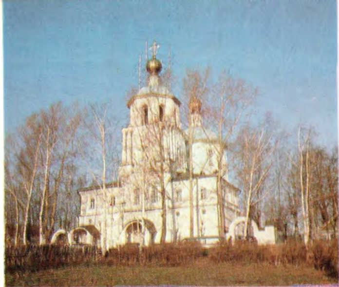
Преображенский храм в г. Солнечногорске (Московская епархия)