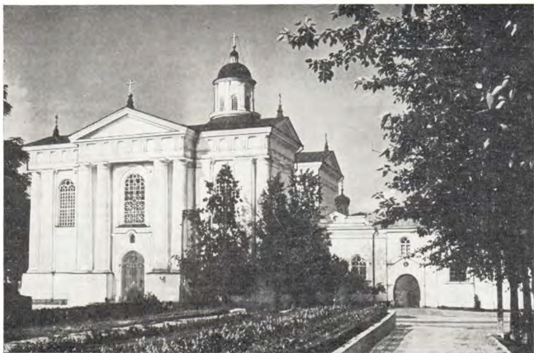
Успенский собор в Жировицком Успенском монастыре (Минская епархия)