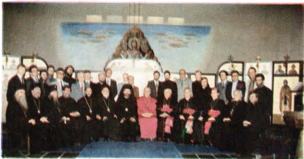
Пятая встреча смешанной богословской комиссии по православно-старокатолическому диалогу. Шамбези (Швейцария), 3—10 октября 1983 года. На снимке: участники встречи в храме во имя апостола Павла в Православном центре Константинопольского Патриархата в Шамбези