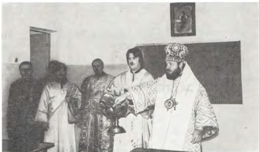
14 октября 1983 года, праздник Покрова Божией Матери. Архиепископ Выборгский Кирилл окропляет святой водой аудиторию нового учебного корпуса регентского класса при Ленинградских Духовных школах

Вместе со студентами Академии и воспитанниками Семинарии учащиеся регентского клас-