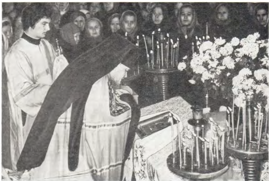
4 ноября 1983 года, в праздник в честь Казанской иконы Божией Матери, архиепископ Черниговский и Нежинский Антоний перед началом Божественной литургии в Вознесенском храме в г. Коропе

14 ноября, день памяти бессребреников и чудотворцев Космы и Дамиана, Высокопреосвященный Антоний совершил Божественную литургию в Вознесенском храме в с. Новая Басань Бобровицкого района. После литургии был совершен крестный ход вокруг храма.