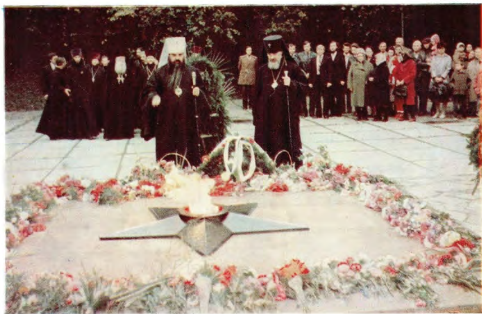
Возложение венка к Вечному огню в Сквере героев, павших за освобождение Смоленска, 24 сентября 1983 года