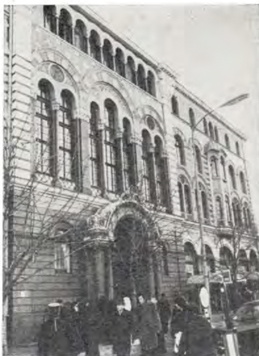
Здание Софийской Духовной Академии