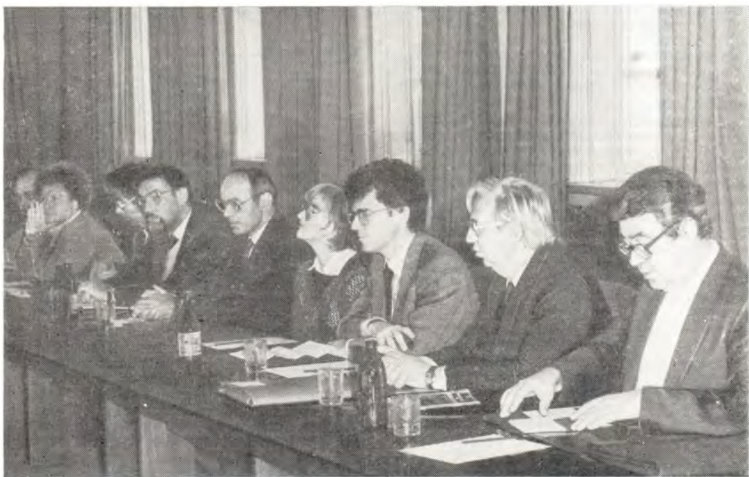
Христианские публицисты в конференц-зале Издательского отдела во время заседания 28 сентября 1983 года

Христианские коммуникаторы имели встречу с ответственными сотрудниками Совета по