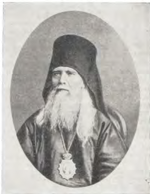
Епископ Феофан Затворник (Говоров)

Своей главной задачей святитель Феофан считал создание религиозной психологии. В свете святоотеческого учения о духовной жизни он разрешает главную проблему этой психологии — вопрос о психической норме. Здоровым внутренним соотношением трехчастной природы человека является состояние подчинения души и тела духу. «Не то сие означает, чтобы, когда человек бывает духовен, душевность и телесность не имели бы в нем места, но то, что тогда духовность у него бывает господствующей...» По мысли епископа Феофана, норму духовной жизни следу-