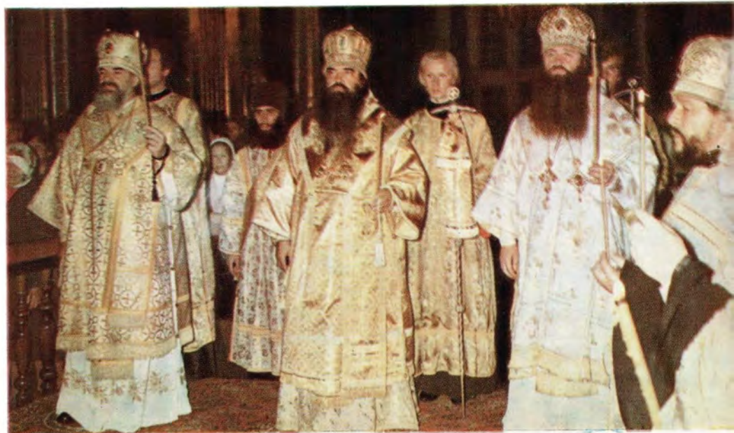
Всенощное бдение в субботу 24 сентября 1983 года в Успенском кафедральном соборе в г. Смоленске. Слева направо — архиепископ Смоленский и Вяземский Феодосий, митрополит Минский и Белорусский Филарет, Патриарший Экзарх Западной Европы, архиепископ Тульский и Белевский Герман