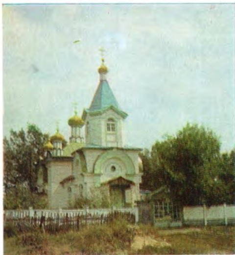
Храм во имя Иоанна Предтечи в дер. Везовое