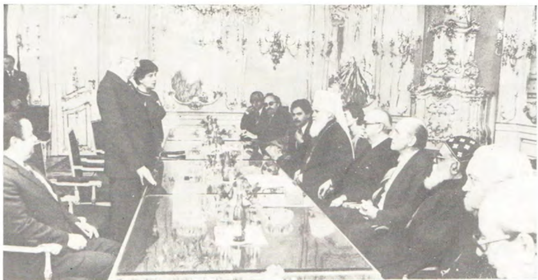
Прием делегации Христианской Мирной Конференции Президентом ЧССР д-ром Густавом Гусаком 14 октября 1983 года в связи с 25-летием образования ХМК. Д-р Густав Гусак произносит приветственную речь