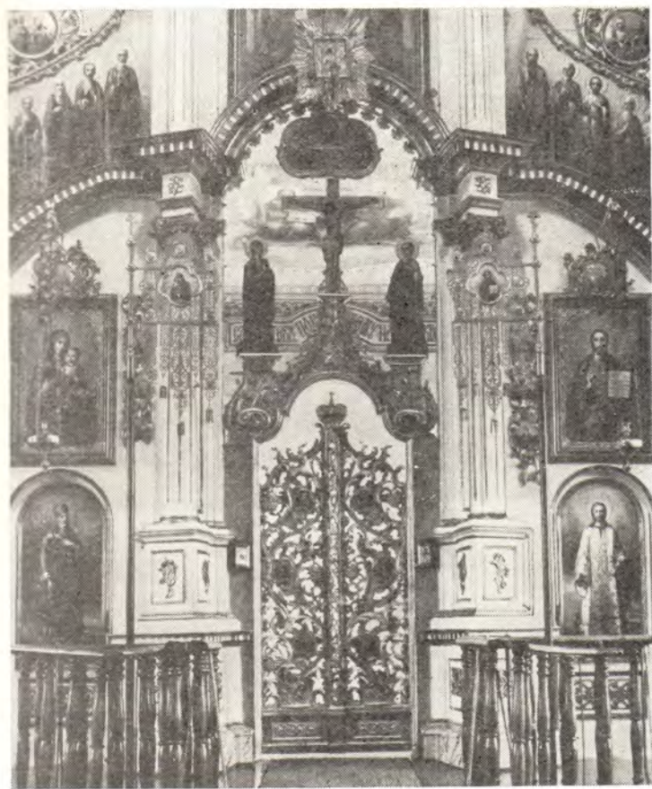
Центральная часть иконостаса в храме во имя святых бессребреников Космы и Дамиана в г. Корце