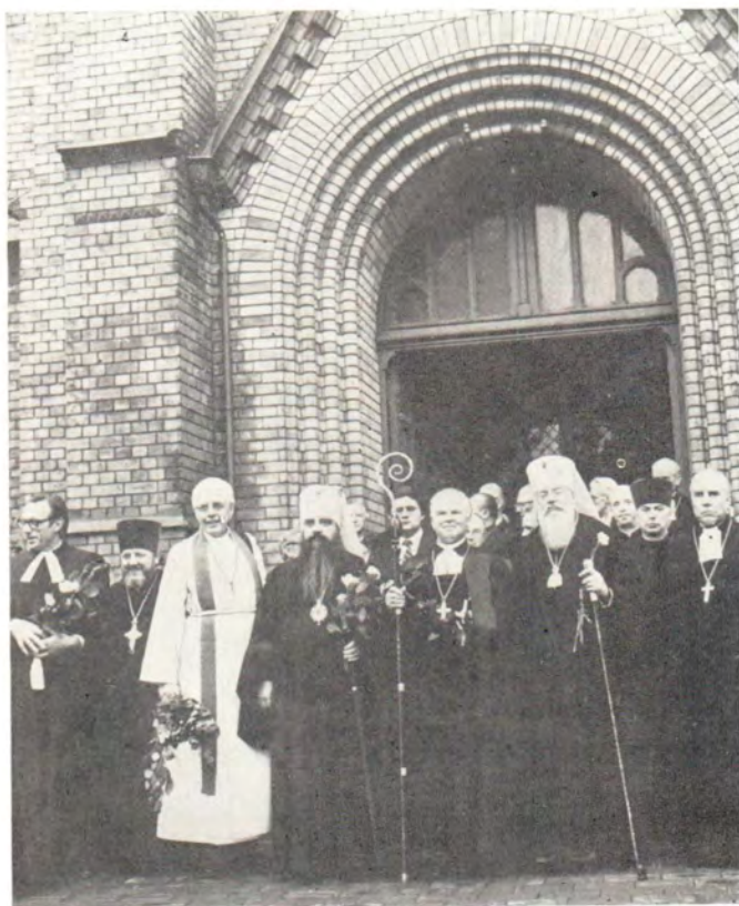
Участники торжеств, посвященных 500-летию со дня рождения Мартина Лютера, у храма в честь Мартина Лютера в Риге, 9 октября 1983 года