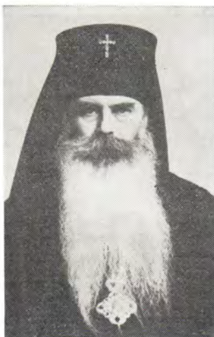
Блаженнейший Митрополит Московский и Коломенский (впоследствии Святейший Патриарх) Сергий, Митрополит Ленинградский и Новгородский (впоследствии Святейший Патриарх) Алексей, митрополит Крутицкий и Коломенский Николай и Новгородский Никодим и архиепископ Волоколамский Питирим