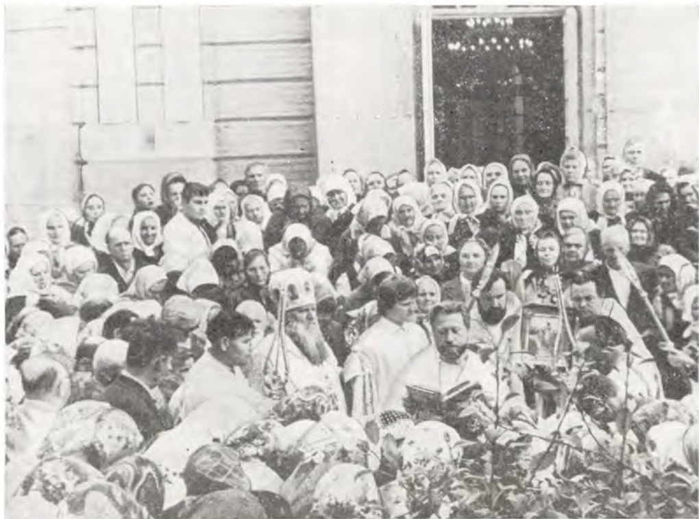
21 августа 1983 года, день памяти мучеников Елеферия и Леонида. Архиепископ Симферопольский и Крымский Леонтий, временно управляющий Днепропетровской епархией, совершает крестный ход вокруг Покровского храма в с. Широком

с. Широком Днепропетровской области в со- служении клириков епархии. После литургии архипастырь произнес слово о духовном смы- сле и значении для христианина праздника Пре- ображения Господня.