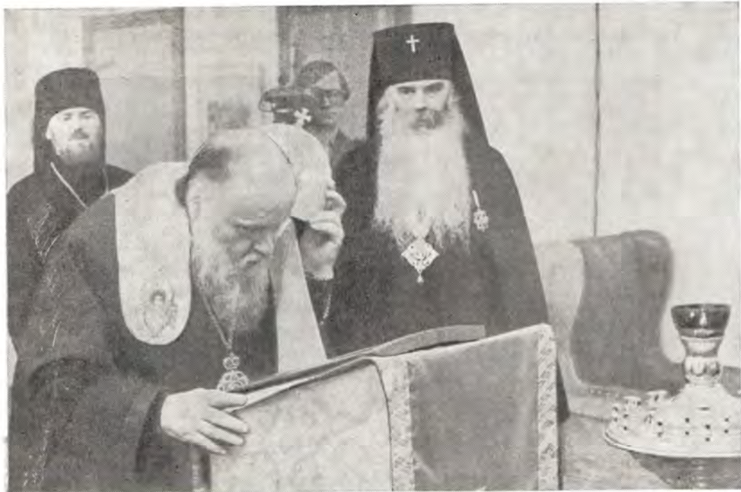
22 сентября 1983 года. Святейший Патриарх Пимен в домовом храме во имя преподобного Иосифа Волоцкого в Издательском отделе

ниях со страниц журнала призывали пасомых к защите Родины и самоотверженному труду, утешали скорбящих, ободряли слабевших, воздавали славу и честь нашему победоносному воинству.