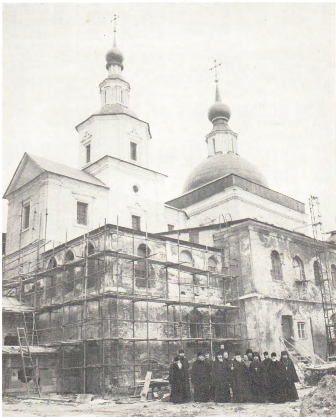
1 ноября 1983 года, день памяти преподобного Иоанна Рыльского, Московский Даниловский монастырь. Святейший Патриарх Московский и всея Руси Пимен с участниками осмотра монастыря у храма в честь Святых Отцов Семи Вселенских Соборов