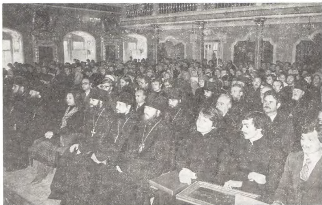
Во время торжественного акта 14 октября 1983 года, в праздник Покрова Пресвятой Богородицы, в Покровском академическом храме