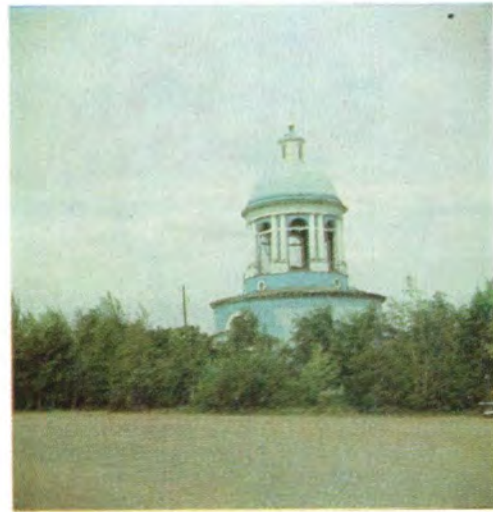
Храм во Имя Святой Троицы в с. Бондари