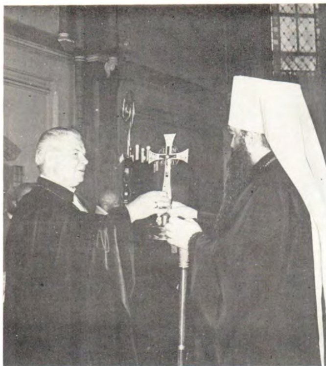
9 октября 1983 года митрополит Минский и Белорусский Филарет, Патриарший Экзарх Западной Европы, председатель Отдела внешних церковных сношений, вручает на престольный крест — дар Святейшего Патриарха Пимена — Архиепископу Евангелическо-Лютеранской Церкви Латвии д-ру Янису Матулису