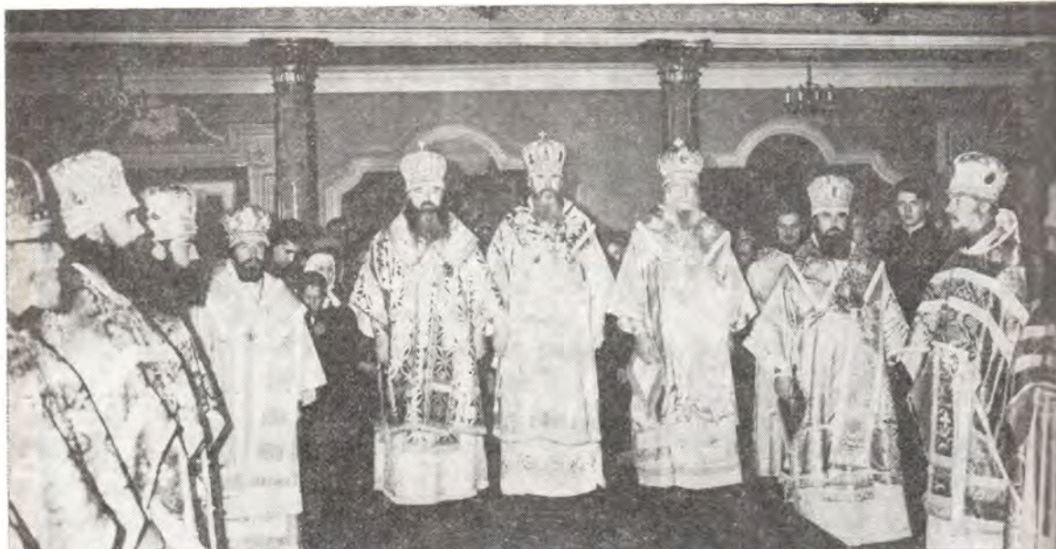
14 октября 1983 года, праздник Покрова Пресвятой Богородицы. За Божественной литургией в Покровском храме Московских Духовных школ