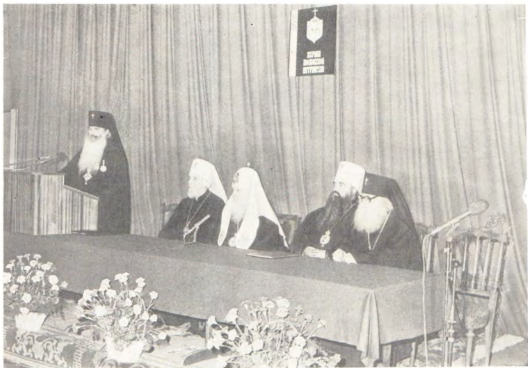
22 сентября 1983 года, день памяти преподобного Иосифа Волоцкого. В президиуме торжественного собрания, посвященного 40-летию «Журнала Московской Патриархии»: слева направо — митрополит Ленинградский и Новгородский Антоний, Святейший Патриарх Пимен, митрополит Минский и Белорусский Филарет, Патриарший Экзарх Западной Европы, председатель Отдела внешних церковных сношений, архиепископ Брюссельский и Бельгийский Василий. С докладом выступает архиепископ Волоколамский Питирим, председатель Издательского отдела