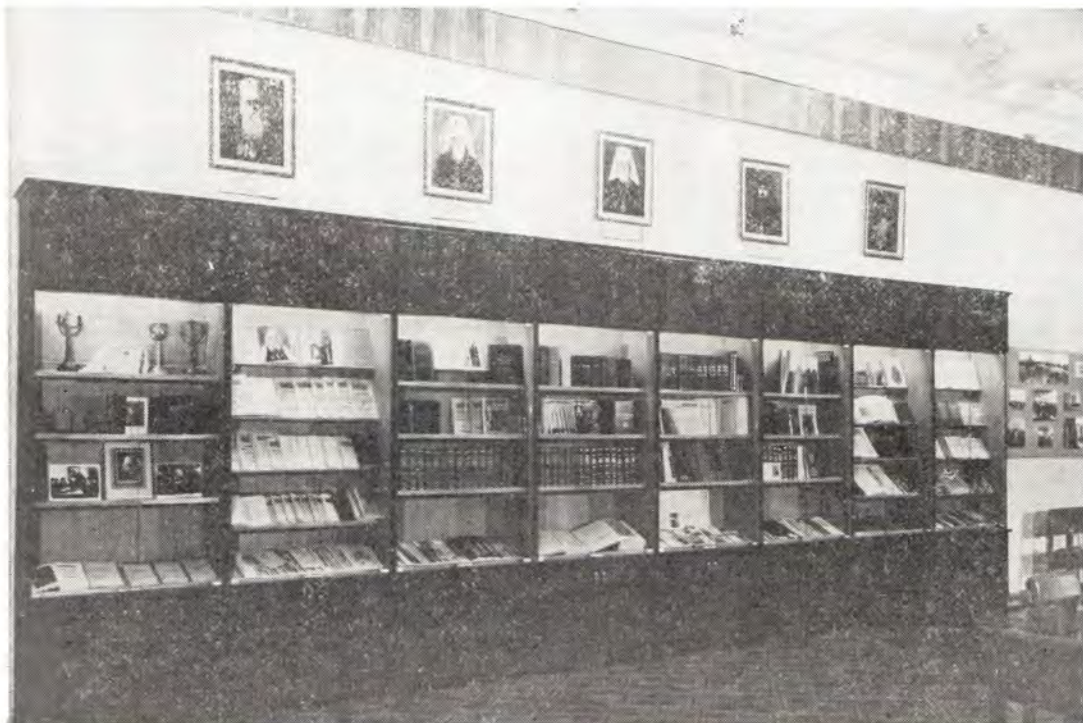
Конференц-зал Издательского отдела. Выставка изданий Московской Патриархии, посвященная 40-летию «Журнала Московской Патриархии»

ков Издательского отдела Московского Патриархата, провел большую работу. В передаче информации о Конференции приняли участие более 250 советских и зарубежных журналистов. 17 телекомпаний вели съемку и прямую передачу из зала заседаний. Впервые религиозный форум получил большую прессу: церковные и светские публицисты внесли свой вклад в дело распространения идей Конференции религиозных деятелей, обратившихся к людям всей планеты с призывом спасти священнейший дар жизни от ядерной катастрофы.