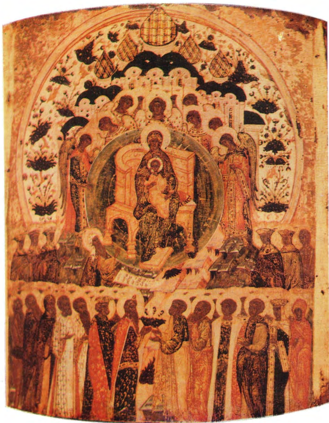
СОБОР ПРЕСВЯТОЙ БОГОРОДИЦЫ

Икона начала XV века Суздальско-Нижегородских писем