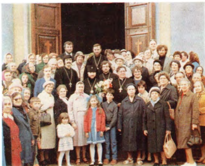
15 мая 1983 года. Архиепископ Выборгский Кирилл и паломники из Финляндии у входа в Преображенский собор в г. Выборге