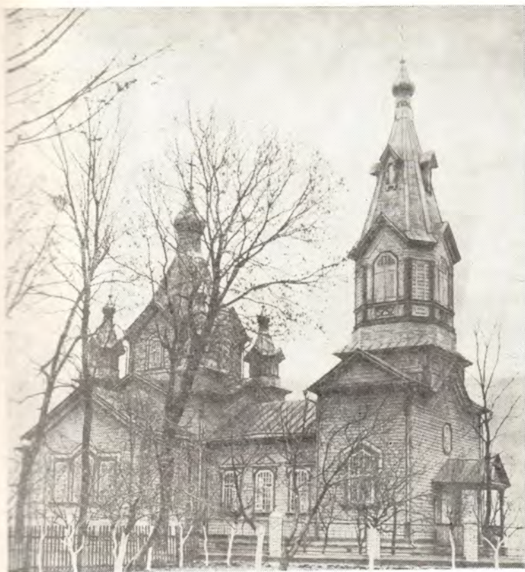
Храм во имя святых бессребреников Космы и Дамиана в г. Корце (Волынская епархия)