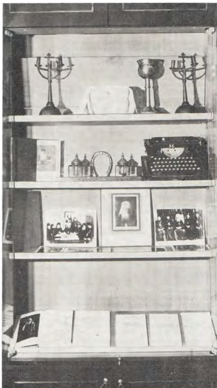
Стенд с личными вещами Святейшего Патриарха Сергия — первого Главного редактора журнала на выставке с изданиями Московской Патриархии, посвященной 40-летию «Журнала Московской Патриархии»

С 1968 года в «Богословском отделе» стали