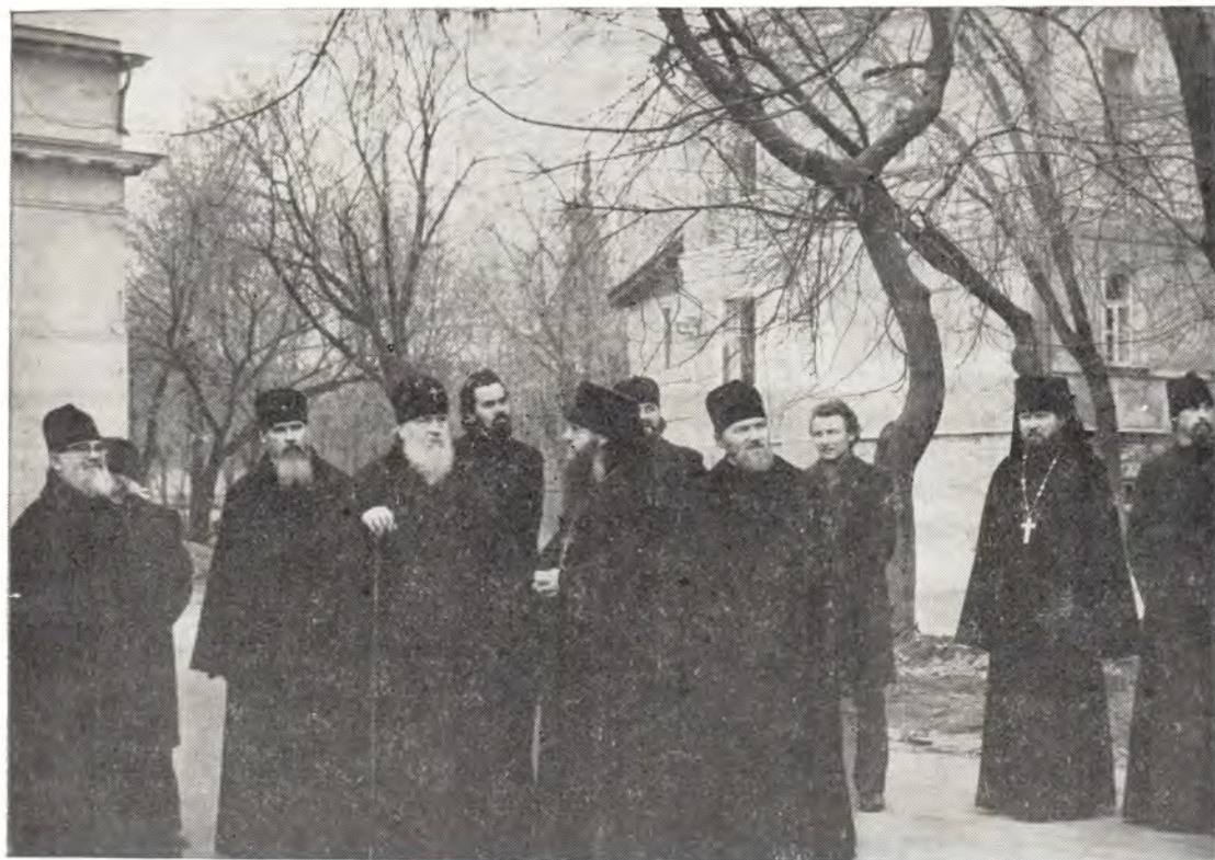
1 ноября 1983 года, день памяти преподобного Иоанна Рыльского. Первое посещение Святейшим Патриархом Пименом Московского Даниловского монастыря