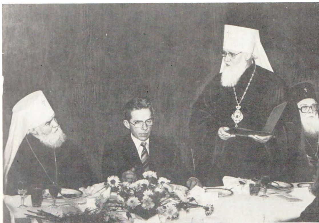
15 октября 1983 года, Прага, ЧССР, 70-летие Блаженнейшего Митрополита Пражского и всей Чехословакии Доротея. Митрополит Киевский и Галицкий Филарет, Патриарший Экзарх Украины, обращается с приветствием к юбиляру