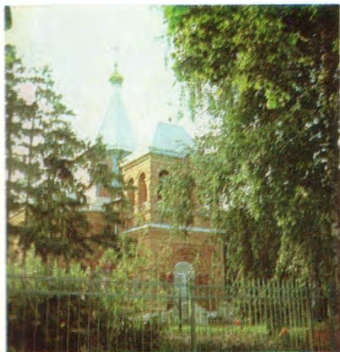
Благовещенский храм в дер. Новотомниково