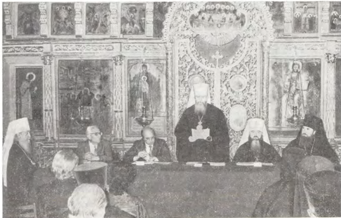
Митрополит Таллинский и Эстонский Алексей, председатель Учебного комитета при Священном Синоде, оглашает Послание Святейшего Патриарха Пимена Московским Духовным школам