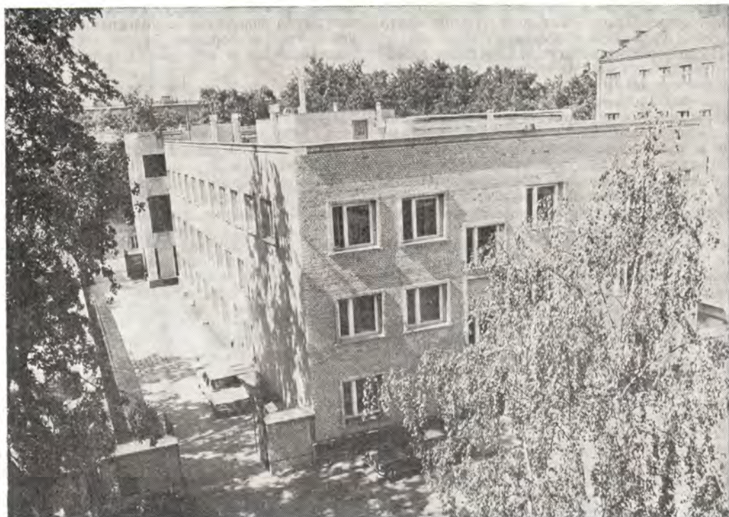
Здание Издательского отдела Московского Патриархата

Вслед за Патриархом видные иерархи Русской Православной Церкви — митрополиты Ленинградский и Новгородский Алексей и Киевский и Галицкий Николай в своих посла-