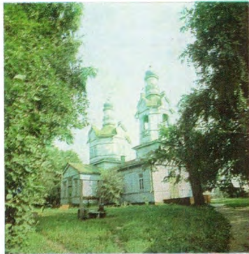
Храм во имя Архистратига Михаила в дер. Тернаво