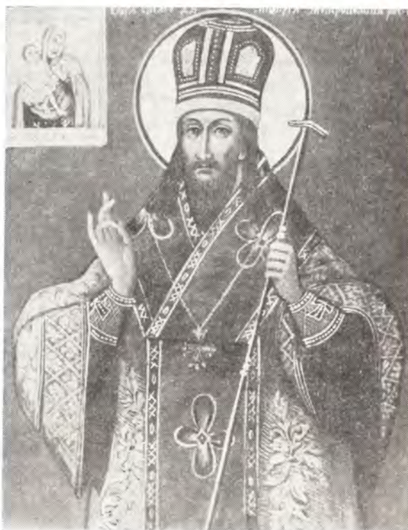
Святитель Димитрий, митрополит Ростовский