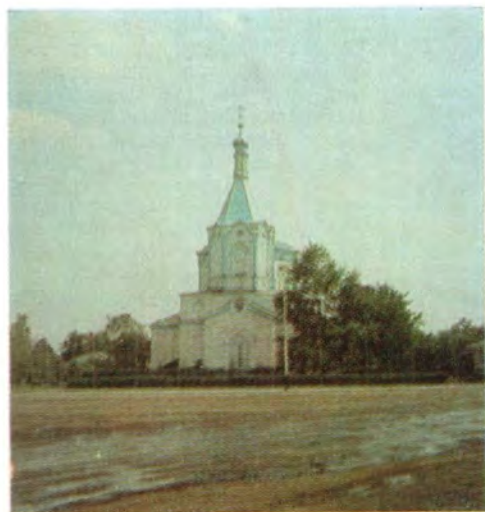
Храм во имя святого апостола Иоанна Богослова в г. Рассказове