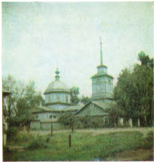
Храм во имя Свяителя Николая в г. Моршанске