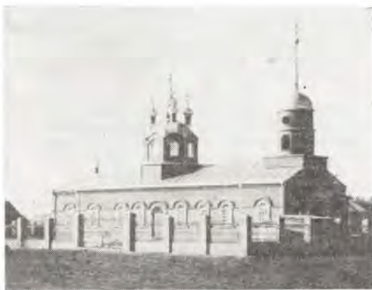
Храм во имя святого равноапостольного князя Владимира в пос. Клетня (Орловская епархия)