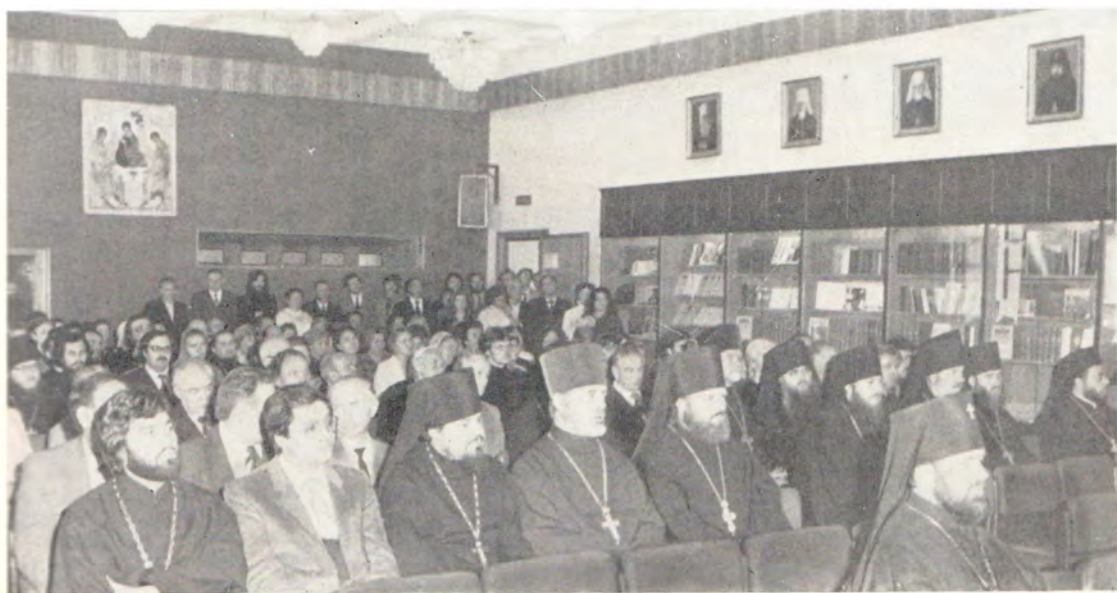
В конференц-зале Издательского отдела во время торжественного собрания по случаю 40-летия «Журнала Московской Патриархии»