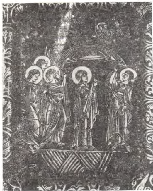
Покров Пресвятой Богородицы Клеймо суздальских Златых врат, XII в. Рис. 1

дицы, находящаяся в проложном сказании 1 октября и на свитке Боголюбской иконы, ведет свое начало лишь со времен святого князя Андрея, как думает Спасский 17 . К тому же архиепископ Сергей показал, что, кроме сходства, между обоими текстами есть весьма немаловажные отличия 18 . Единственным веским аргументом остается иконографическое совпадение образа Боголюбской иконы Богородицы и Ее образа в изображении Покрова на суздальских вратах (рис. 1). Архиепископ Сергей не пропустил этого сходства, но считает его второстепенным 19 . В свете современных открытий этот аргумент вовсе теряет свою силу. Не так давно была опубликована икона Покрова совершенно особой иконографии (см. рис. 2), происходящая из Восточной Галиции. Необычно прежде всего то, что Божия Матерь изображена, в отличие от всех других изводов иконы Покрова, в виде сидящей Оранты с Младенцем перед Ней. Два ангела держат покров, образующий как бы арку над Богоматерью. Внизу, справа и слева, две группы предстоящих — среди них святые Андрей, Епифаний, Роман Сладкопевец. Икона датируется в публикации XIII