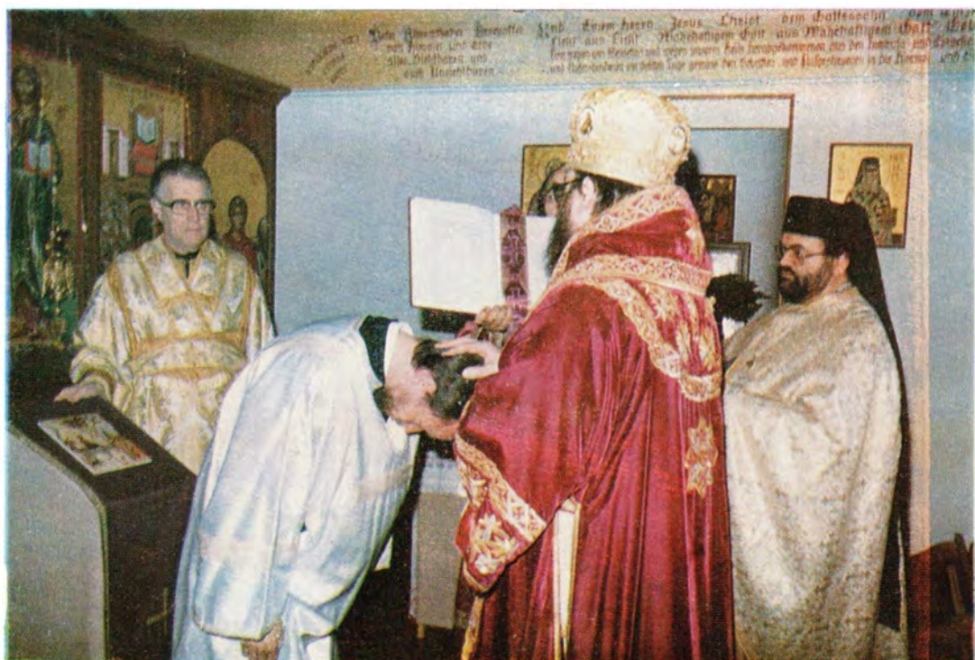
1 мая 1983 года. Епископ Дюссельдорфский Лонгин совершает чин хиротесии во чтеца в храме во имя святых отцов Первого Вселенского Собора в г. Вецларе (Дюссельдорфская епархия)