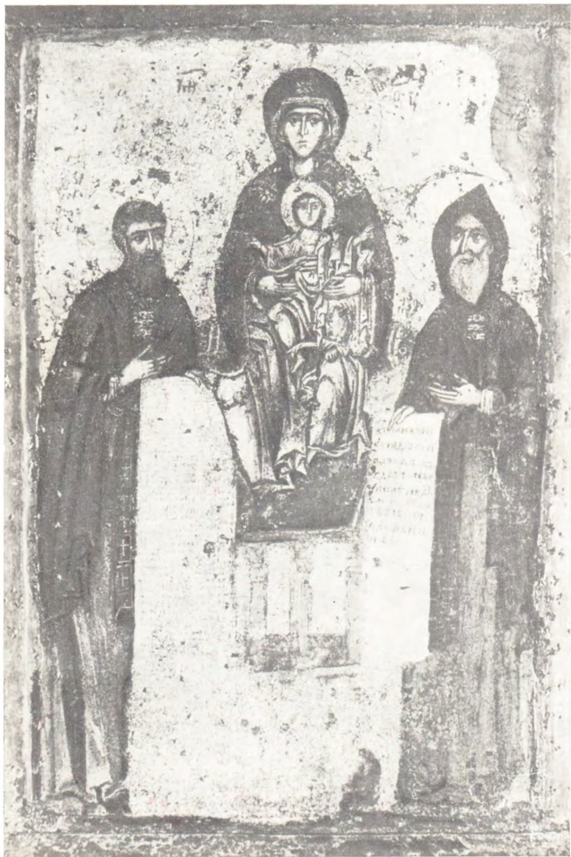
ПЕЧЕРСКАЯ [СВЕНСКАЯ] ИКОНА БОЖИЕЙ МАТЕРИ, XIII в.