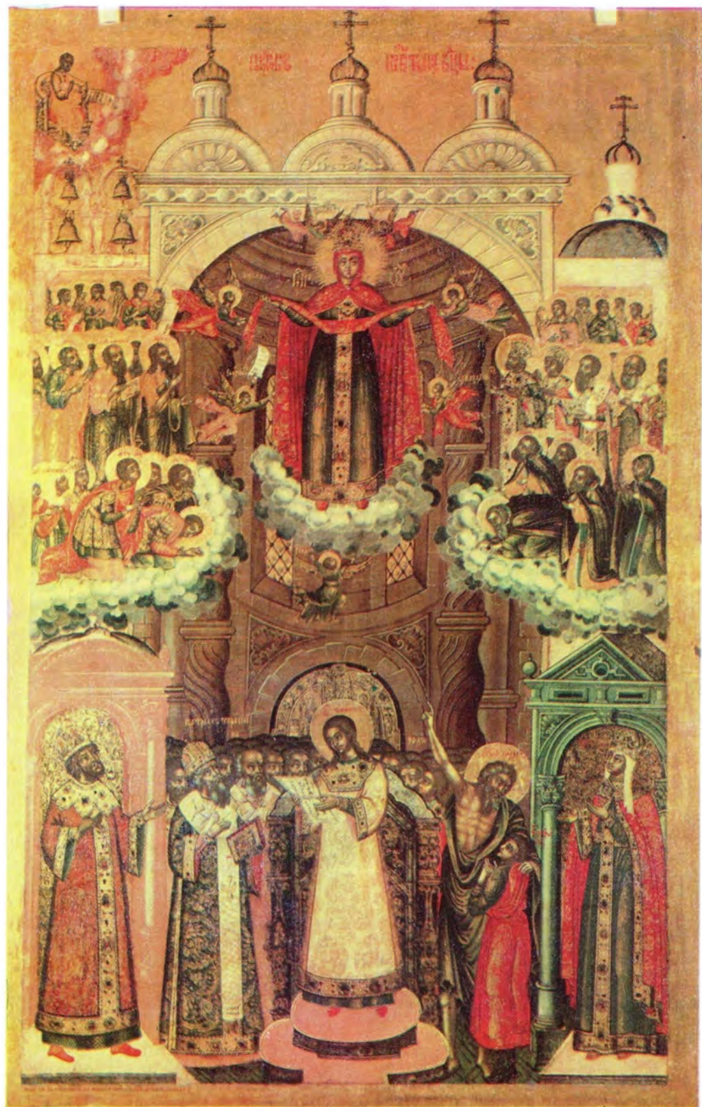
ИКОНА ПОКРОВА ПРЕСВЯТОЙ БОГОРОДИЦЫ