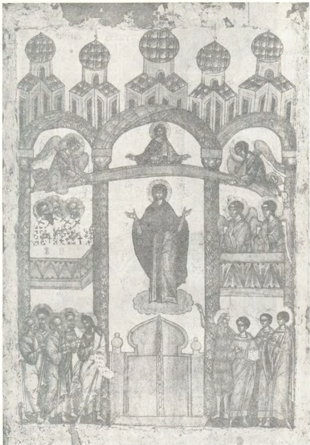
ИКОНА ПОКРОВА ПРЕСВЯТОЙ БОГОРОДИЦЫ