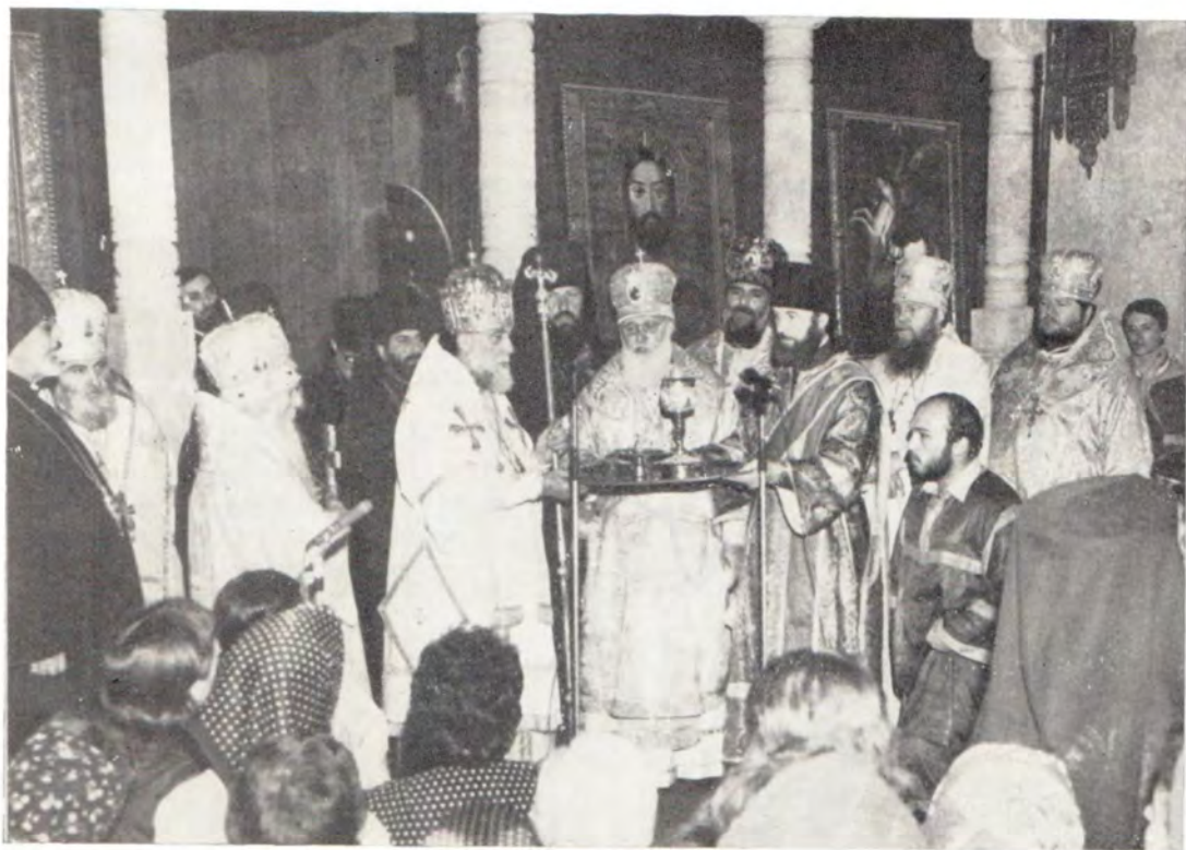
3 июля 1983 года. Мцхетский патриарший собор Светицховели — во имя святых Двенадцати Апостолов. Митрополит Киевский и Галицкий Филарет, Патриарший Экзарх Украины, по окончании Божественной литургии по поручению Святейшего Патриарха Пимена передает дар Русской Церкви — священные сосуды Святейшему и Блаженнейшему Католикосу-Патриарху всей Грузии Илию II в память 1500-летия автокефалии Грузинской Православной Церкви и 200-летия Георгиевского трактата