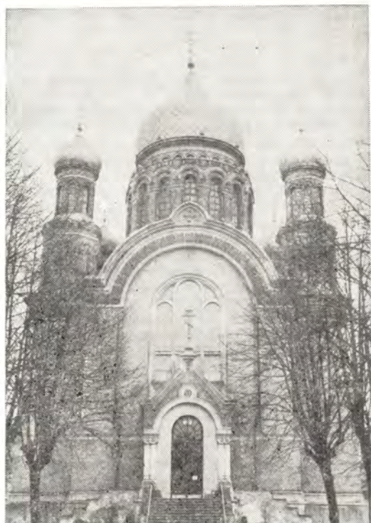
Вверху: Троицкий собор Рижского Свято-Троицкого женского монастыря. Внизу: Интерьер Троицкого собора в г. Риге

Ставропольская епархия. С 26 по 31 июля 1982 года в Ставропольской епархии находилась в гостях группа паломников из Западного Берлина. Гости знакомились с достопримечательностями, культурной и духовной жизнью Ставропольского края. Они присутствова-