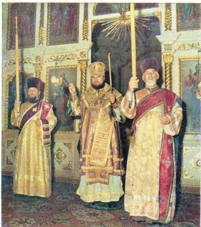
Кафедральный собор во имя святого апостола Андрея Первозванного в г. Ставрополе. Епископ Ставропольский и Бакинский Антоний совершает всенощное бдение накануне праздника Воздвижения Креста Господня, 26 сентября 1982 года