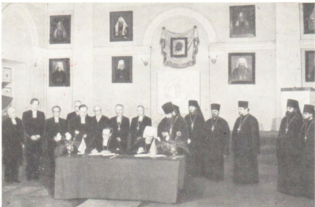
10 июня 1983 года. Актовый зал Ленинградских Духовных Академии и Семинарии. Подписание результативных документов VI богословского собеседования между представителями Русской Православной Церкви и Евангелическо-Лютеранской Церкви Финляндии