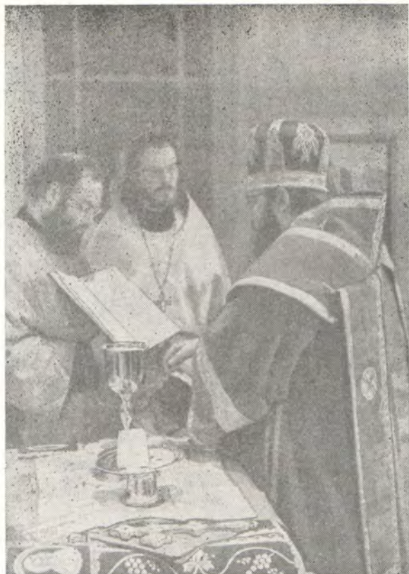
8 мая 1983 года. Светлое Христово Воскресение. Епископ Дюссельдорфский Лонгин совершает диаконскую хиротонию в Покровском Крестовом храме в г. Дюссельдорфе [ФРГ]