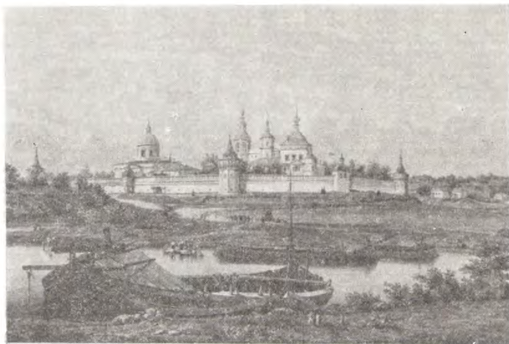
Московский Даниловский монастырь