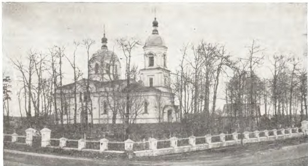
Храм в честь Воздвижения Креста Господня в с. Ополье Ленинградской епархии

Единственный купол храма довольно высок, с большими полукруглыми окнами. Трехъярусная, с небольшой «луковкой» наверху колокольня примыкает к храму. Еще издали в листве деревьев, над светло-голубой крышей бело-снежного храма, видны две «солнечные» луковки с крестами, венчающими колокольню и купол храма.