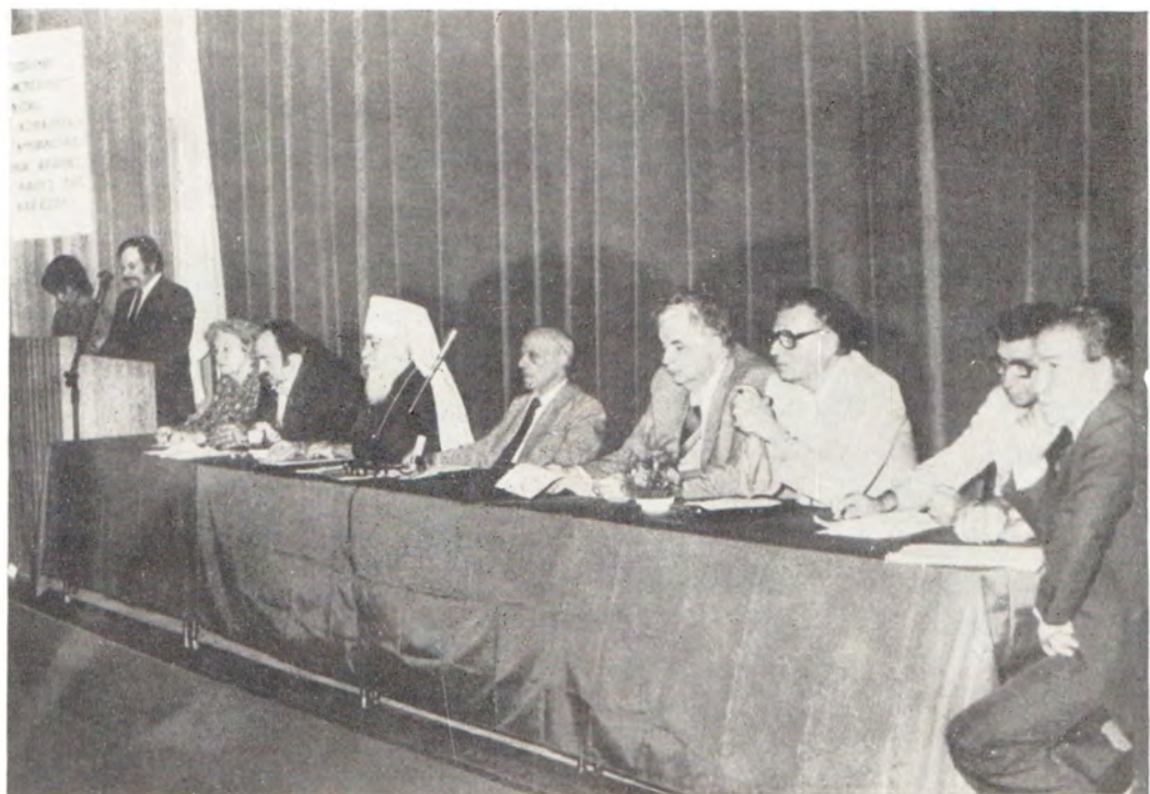
28 мая 1983 года. Никосия, Кипр. Май 1983 года. Симпозиум на тему «Мир, безопасность, ядерное разоружение и укрепление дружбы и сотрудничества между народами Кипра и Советского Союза». В президиуме — митрополит Одесский и Херсонский Сергей