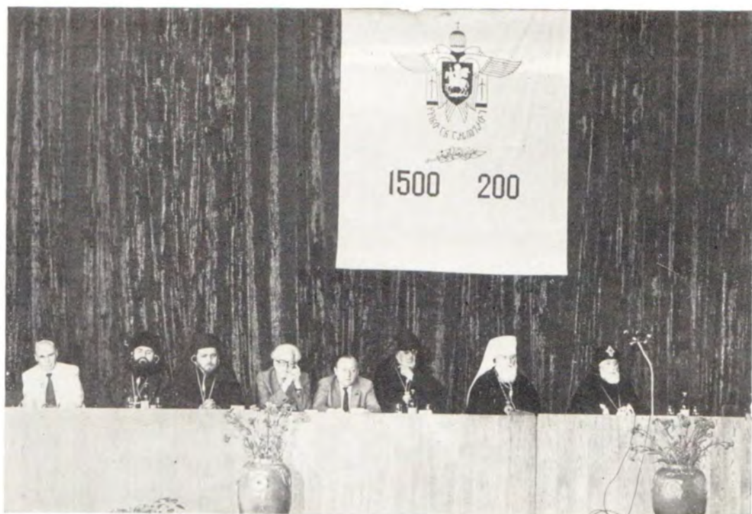
2 июля 1983 года. Тбилиси. Президиум юбилейной сессии, посвященной 1500-летию автокефалии Грузинской Православной Церкви и 200-летию Георгиевского трактата