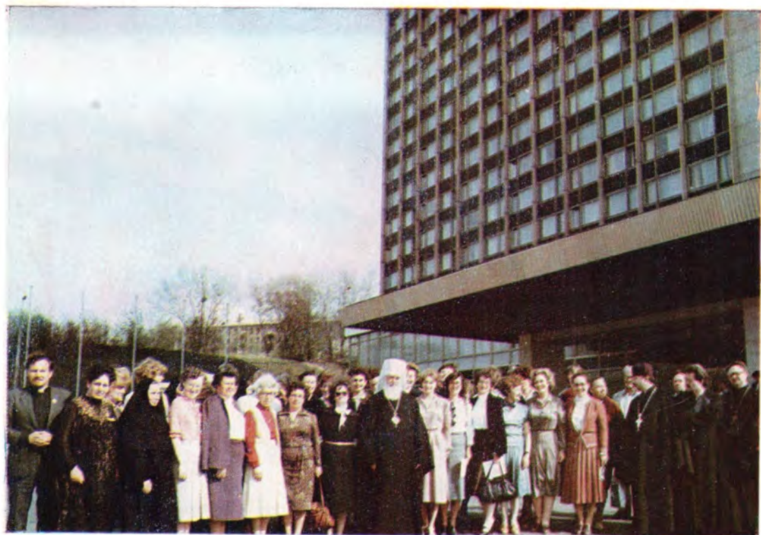
Участники конференции женщин-христианок из социалистических стран Европы. Киев, 20—25 апреля 1983 года