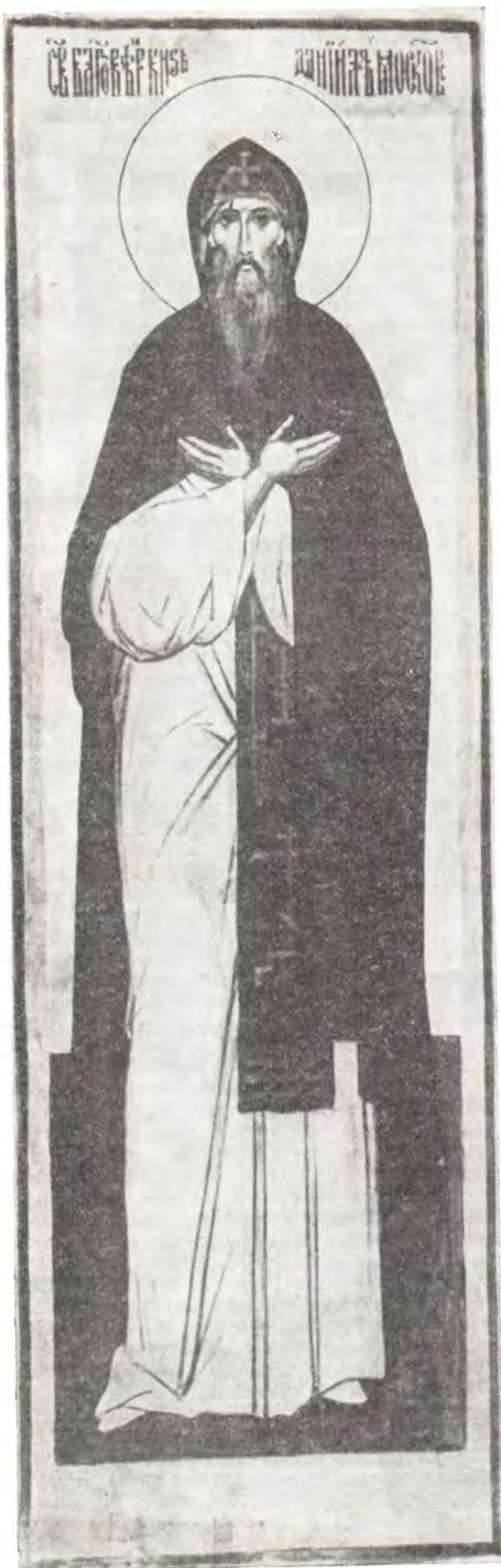
Святой благоверный князь Даниил Икона написана монахиней Иулианией

ского благоустройства: в политической жизни здесь началось постепенное, но дружелюбное слияние областей России» (12, с. 18). Мирное княжение святого Даниила сделало его владельцем и весьма влиятельным князем на Руси, строящим и украшающим родную Русскую землю.