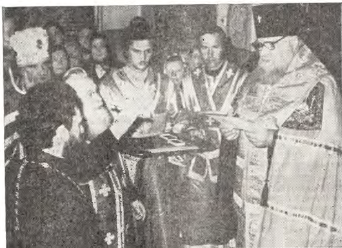
28 апреля 1983 года. Воскресенский кафедральный собор в г. Чернигове. Архиепископ Черниговский и Нежинский Антоний вручает клирикам Черниговской епархии патриаршие награды ко дню Святой Пасхи

В другие воскресные и праздничные дни архиепископ Антоний служил в Воскресенском кафедральном соборе, где произносил проповеди на темы праздников и евангельских чтений.