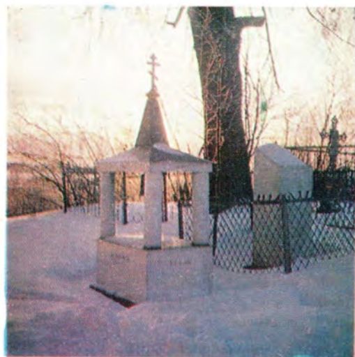
Могила участника Бородинского сражения А. Н. Корбутовского [1785—1830]