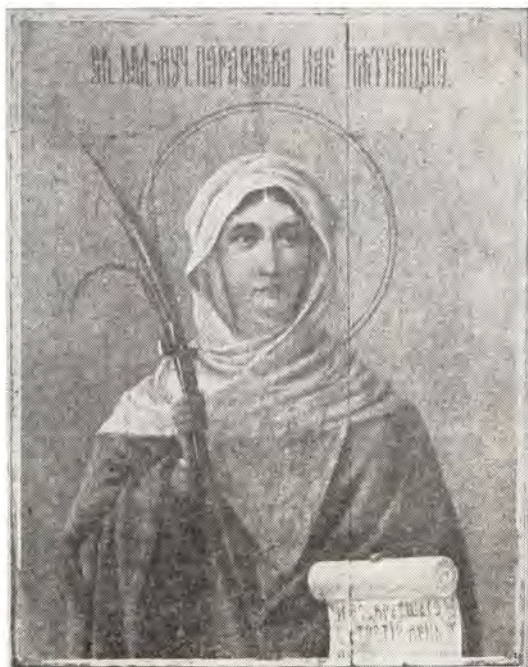
Чтимая икона святой мученицы Параскевы Пятницы из Знаменского храма