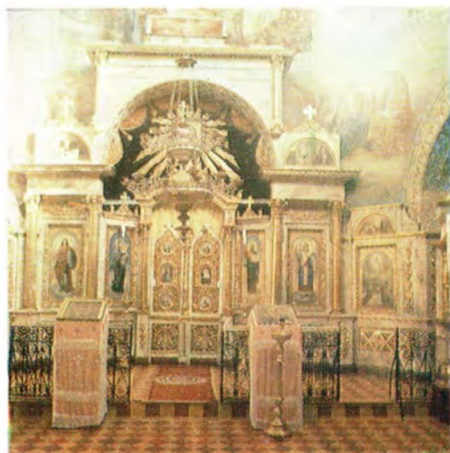
Иконостас главного алтаря