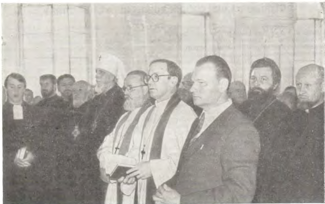
12 июня 1983 года. Участники богословского собеседования перед началом евхаристического богослужения в лютеранском храме в г. Пушкине