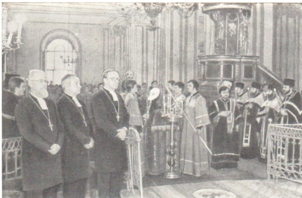
11 июня 1983 года, канун Недели 6-й по Пасхе. Делегация Евангелическо-Лютеранской Церкви Финляндии за всеобщим бдением в Николо-Богоявленском кафедральном соборе в Ленинграде