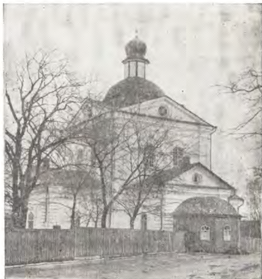
Воскресенский кафедральный собор в г. Чернигове

18 февраля, в день памяти святителя Феодосия, архиепископа Черниговского, архиепископ Антоний в кафедральном соборе совершил Божественную литургию, а накануне — всенощное бдение в сослужении прибывших на празднование, по приглашению правящего архиерея, митрополита Ростовского и Новочеркасского Владимира и архиепископа Свердловского и Курганского Платона.