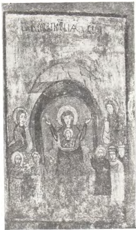
Покров Пресвятой Богородицы Икона кон. XII — нач. XIII в. Рис. 2