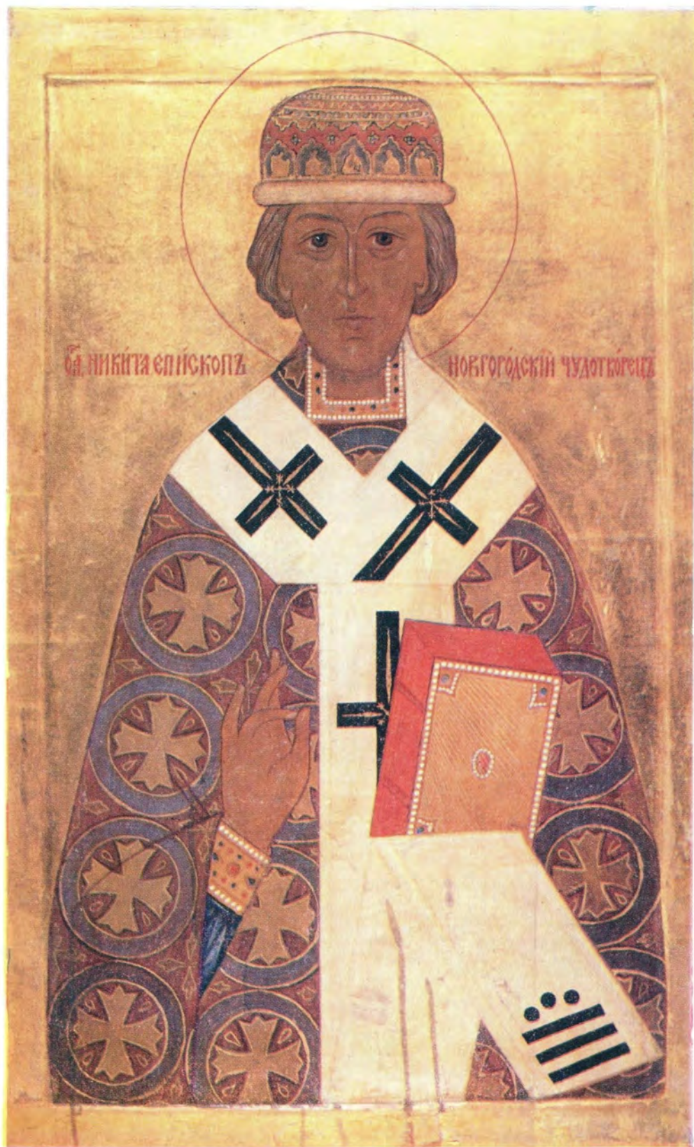
СВЯТИТЕЛЬ НИКИТА, ЕПИСКОП НОВГОРОДСКИЙ († 31 января 1108 года)

Икона письма архиепископа Сергия (Голубцова; † 1982) К стр. 33