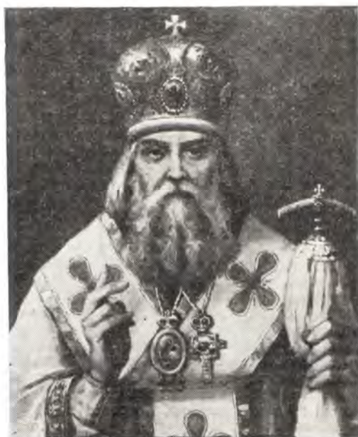
Преосвященный Игнатий (Брянчанинов), епископ Кавказский и Черноморский (1807—1867)

4 июля того же года монах Игнатий был рукоположен епископом Стефаном во иеродиакона, а 25 июля — во иеромонаха. Видя духовную зрелость иеромонаха Игнатия, епископ Стефан назначил его вскоре настоятелем Пельшемского Лопотова монастыря. За короткое время благодаря своей мудрости, твердой воле и энергии отец Игнатий возродил обитель в духовном и хозяйственном отношении.