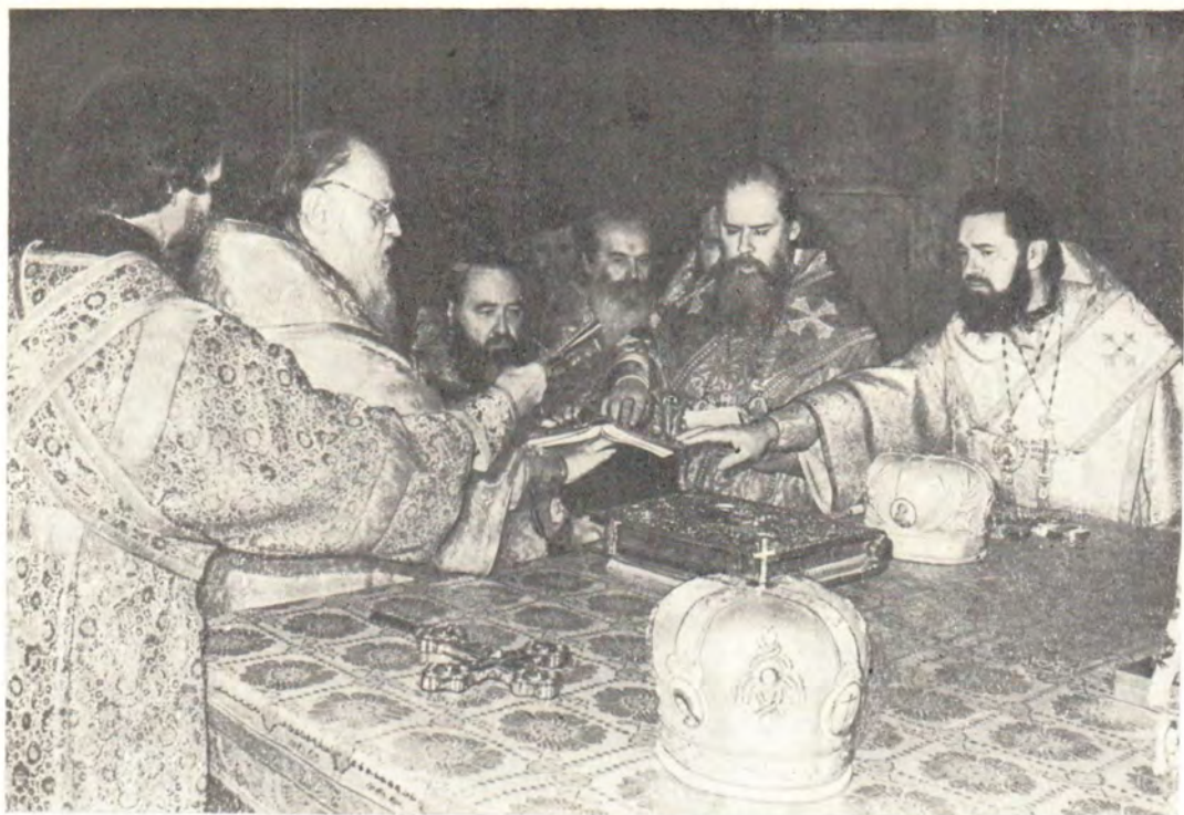
30 января 1983 года, Богоявленский патриарший собор. Святейший Патриарх Пимен с Преосвященными архиереями совершает хиротонию архимандрита Сергия во епископа Солнечногорского