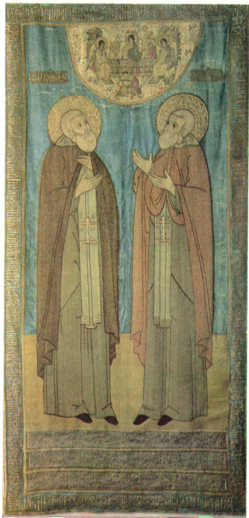
Преподобные СЕРГИЙ и НИКОН Радонежские