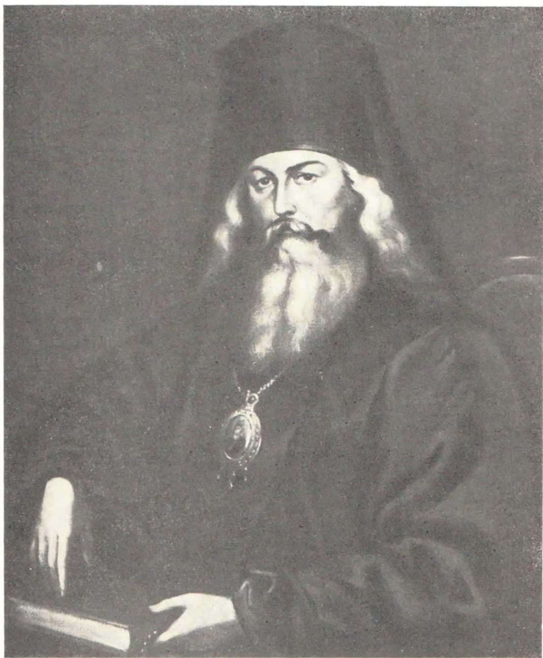
ПРЕОСВЯЩЕННЫЙ ЕПИСКОП ИГНАТИЙ (БРЯНЧАНИНОВ)

Портрет написан в 1982 году игуменом Зеноном Троице-Сергиева Лавра