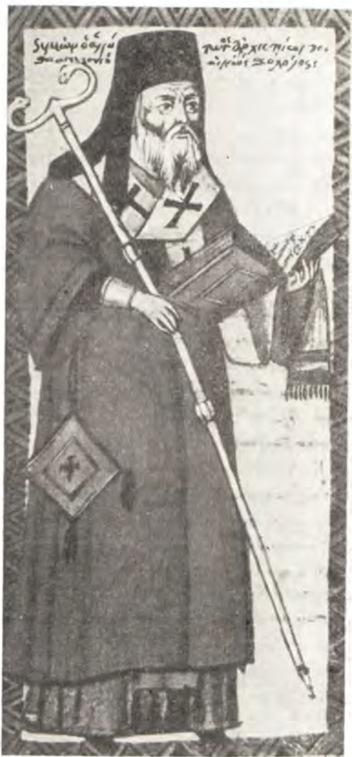
Святитель Симеон, архиепископ Солунский Миниатюра Ватопедской рукописи, 1763 г.

Около 1415—1416 годов святой Симеон был рукоположен во архиепископа Фессалоникского. Архидиоцезийское служение святителя Симеона совпало с чрезвычайно трудным периодом в жизни города. Внешняя опасность — нападения турок-османов держали жителей Фессалоник в постоянной тревоге и навлекали на них невыносимые беды. Их мучили голод и болезни, внутренние раздоры потрясали жизнь солунцев: «господствовали зависть и ненависть»,