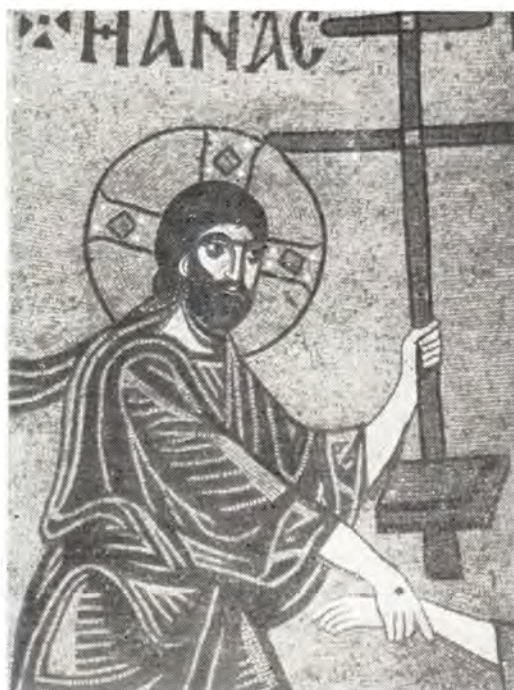
Господь Иисус Христос

Деталь мозаики «Сошествие во ад», XI век, Хиос, Неа Мони (рис. 2)