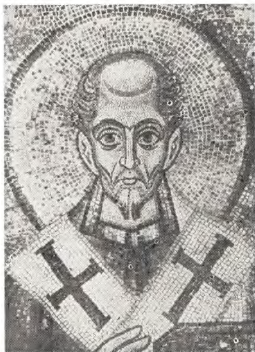
Святитель Иоанн Златоуст. Из святительского чина

Мозаика из храма Святой Софии Киевской, XI век (рис. 3)