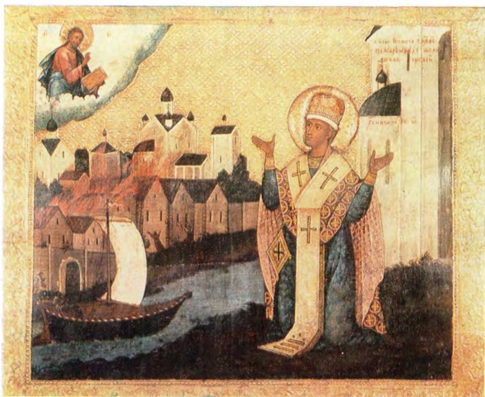
Вверху: икона над гробницей свяителя Никиты [обретение — 30 апреля 1558 года] в Никольском приделе храма во имя апостола Филиппа в Новгороде. Внизу: гробница свяителя Никиты