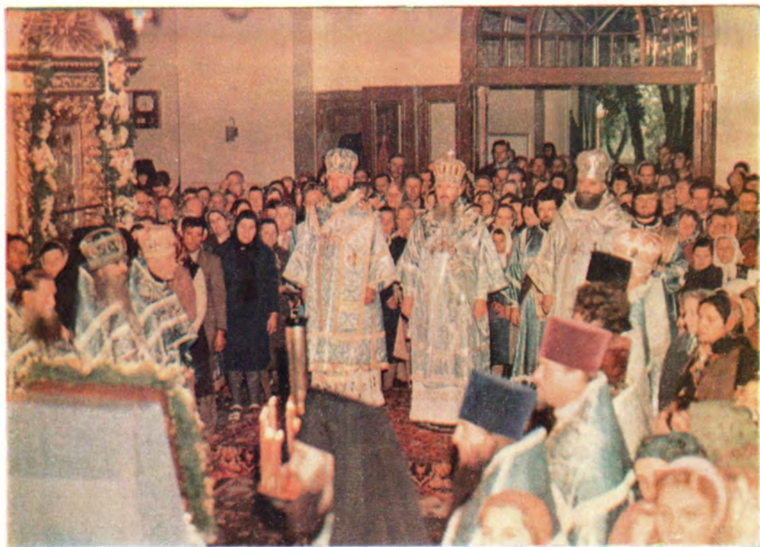
28 августа 1981 года. Митрополит Таллинский и Эстонский Алексей, епископ [ныне архиепископ] Винницкий и Брацлавский Агафангел, епископ Кировский и Слободской Хрисанф во время богослужения в праздник Успения Пресвятой Богородицы в Пюхтицком Успенском женском монастыре