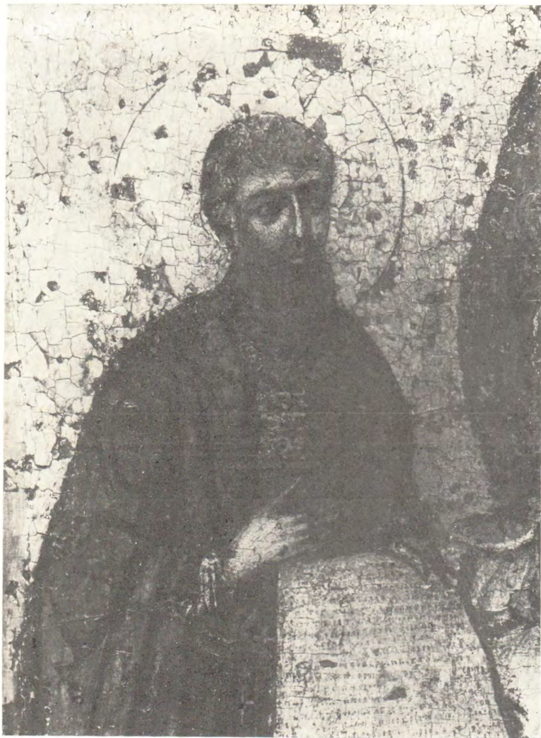
ПРЕПОДОБНЫЙ ФЕОДОСИЙ, ИГУМЕН КИЕВО-ПЕЧЕРСКИЙ

Фрагмент Печерской-Свенской иконы Божией Матери, 1288 год