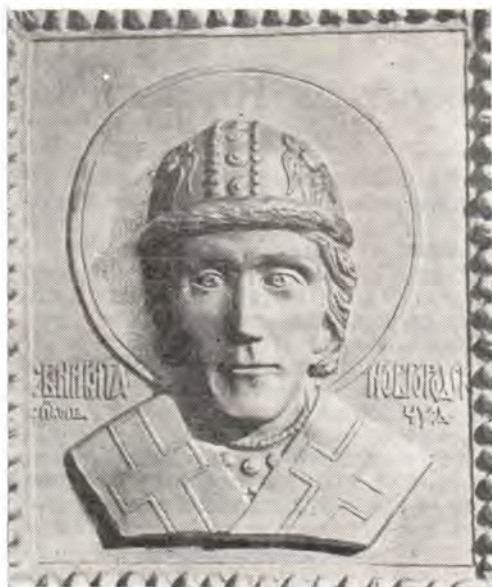
Святитель Никита, епископ Новгородский Горельеф-реконструкция архиепископа Сергия (Голубцова; † 1982)

Антониев монастырь, второй в Новгороде, был основан по благословению святителя Никиты преподобным Антонием Римлянином († 3 августа 1147; память 17 января, 3 августа, также в первую пятницу после дня памяти апостолов Петра и Павла) в начале XII века. Благодаря содействию святителя Никиты преподобный Антоний получил для монастыря территорию на берегу реки Волхова, где остановился камень, на котором Антоний чудесно приплыл из Рима. Незадолго до кончины святитель Никита вместе с преподобным Антонием разметил место для нового, каменного, монастырского храма, который благословил освятить так же, как и прежний (деревянный), в честь Рождества Пресвятой Богородицы. Святитель Никита собственноручно начал копать ров под его основание. Но построен храм был уже при его преемнике — епископе Иоанне (1108—1130). Весной 1108 года, уже после кончины святителя Никиты, была начата роспись стен новгородского собора во Имя Святой Софии — Премудрости Божией, по завещанию святителя Никиты. Летопись сообщает об этом: «В лето 6616 (1108) преставися архи-