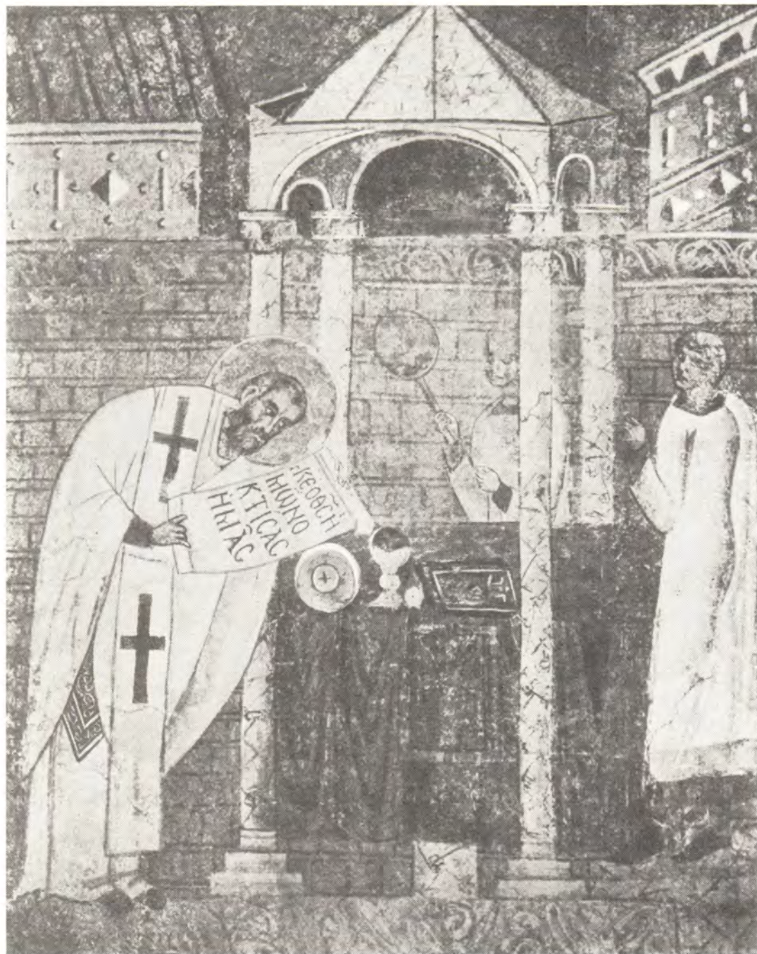
СВЯТИТЕЛЬ ВАСИЛИЙ ВЕЛИКИЙ

Фреска XI века в храме святой Софии в Охриде