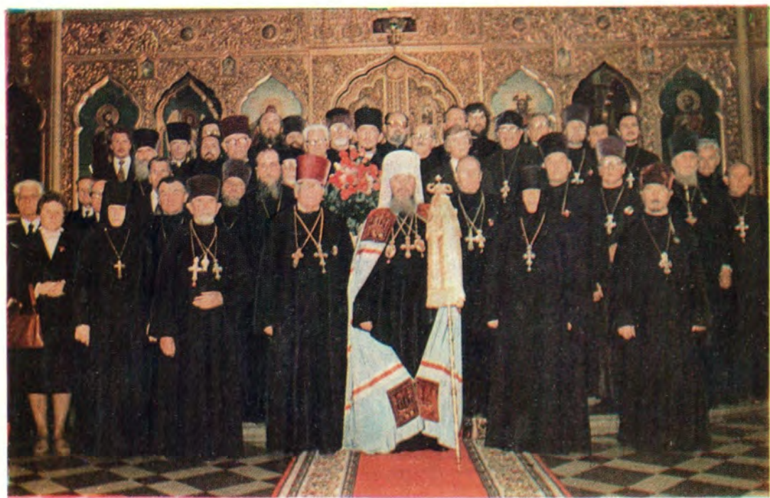
3 сентября 1981 года. Митрополит Таллинский и Эстонский Алексей с клириками Таллинской епархии, настоятельницей Пюхтицкого Успенского женского монастыря игуменьей Варварой после Божественной литургии в Александро-Невском кафедральном соборе в г. Таллине