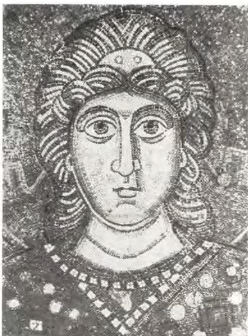
Лик Архангела Мозаика из храма Святой Софии Киевской, XI век (рис. 1)

Искусство, основанное на такой эстетике, — поистине соборно. В противном случае, художники не найдут связующего начала; беспредельный индивидуализм замкнет их в роковую темницу субъективизма. История христианского православного искусства сохранила только несколько имен художников. И это не следствие чрезмерной забывчивости истории или чувства смирения того или иного мастера, но ощущение соборного сознания, что истинный Творец — Бог и что только то творчество достойно такого именования, которое пронизано Божественной, сверхличной силой. Соборность, а не случайное соединение художников, возможна лишь в том случае, когда художники чувствуют себя объединенными Красотой. Красота эта тождественна сверхсущностному Благу, Божественному Добру. Тогда искусство органически этично, оно не морализует, не читает сухих нравственных прописей, но излучает свет Премирного Добра. «Красота отождествляется с Благом, потому что во всякой причине к Кра-