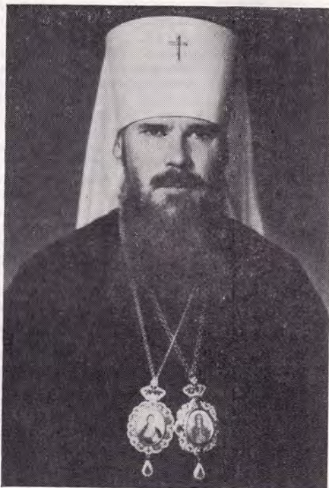
Высокопреосвященный Алексей, митрополит Таллинский и Эстонский

Торжественное заседание открыл д-р Йозеф Смолик. Он приветствовал среди присутствовавших Блаженнейшего Митрополита Дорофея, Патриарха д-ра Мирослава Новака (Чехословацкая Гуситская Церковь), Генерального епископа д-ра Яна Михалко (Лютеранская Церковь в Словакии), синодального синьора д-ра Милана Гаека (Евангелическая Церковь Чешских Братьев), кардинала Томашека