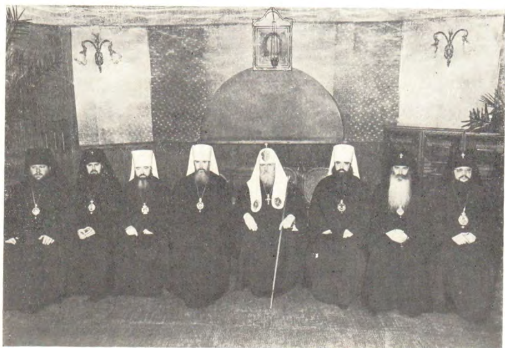
30 января 1983 года после богослужения в Богоявленском патриаршем соборе. Справа налево: архиепископ Зарайский Иов, архиепископ Волоколамский Питирим, митрополит Минский и Белорусский Филарет, Патриарший Экзарх Западной Европы, Святейший Патриарх Пимен, митрополит Таллинский и Эстонский Алексей, митрополит Крутицкий и Коломенский Ювеналий, архиепископ Свердловский и Курганский Платон, епископ Солнечногорский Сергей