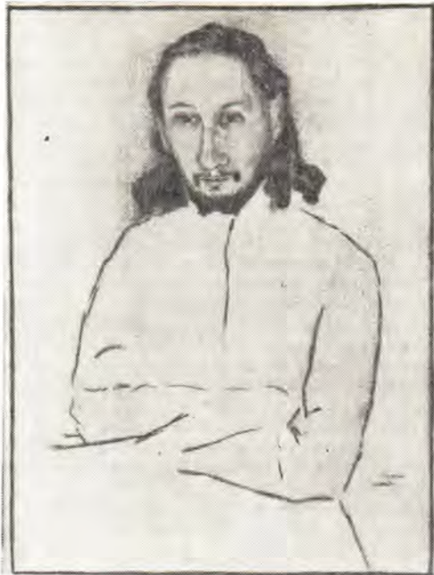
Священник Павел Флоренский Портрет работы В. А. Комаровского, 1924

Современному человечеству нужна христианская культура, не буфалория, а серьезная, действительно по Христу и действительно культура. Во всяком случае каждому требуется искренно определить себя, хочет ли он и считает ли возможной такую. Если нет, то тогда незачем говорить о христианстве и сбивать себя и других туманными надеждами на несбыточное. Тогда правы будут те, кто требует усилий устроиться как-нибудь иначе. Тогда наивны бессильные протесты против отрицания идеалов христианской нравственности, потому что без христианской веры они суть только праздные мечтания и, как таковые, мешают жизни: Если Христос не воскрес, то