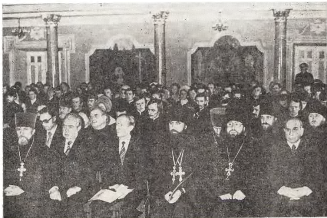
Участники торжественного собрания, посвященного 25-летию епископской хиротонии Святейшего Патриарха Пимена, в Покровском храме МДА и МДС 2 декабря 1982 года

ственное собрание, в котором приняли участие председатель Учебного комитета митрополит Таллинский и Эстонский Алексей, митрополиты — Ленинградский и Новгородский Антоний, Крутицкий и Коломенский Ювеналий, предсе-