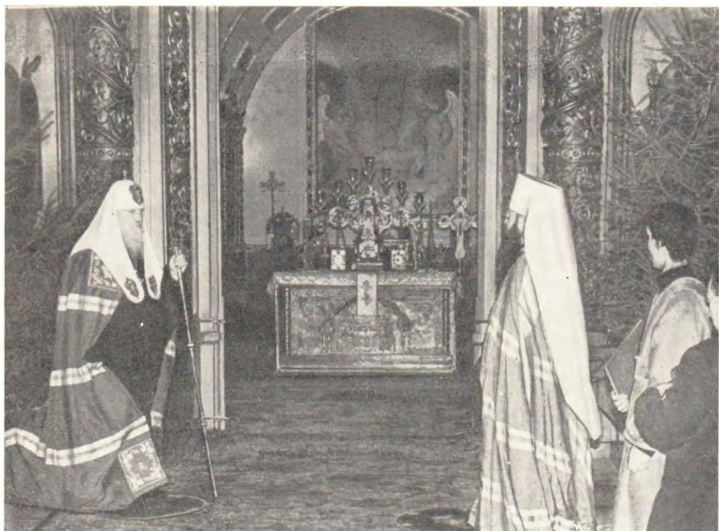
9 января 1983 года, Богоявленский патриарший собор в Москве. Митрополит Крутицкий и Коломенский Ювеналий произносит слово приветствия Святейшему Патриарху Пимену К стр. 2