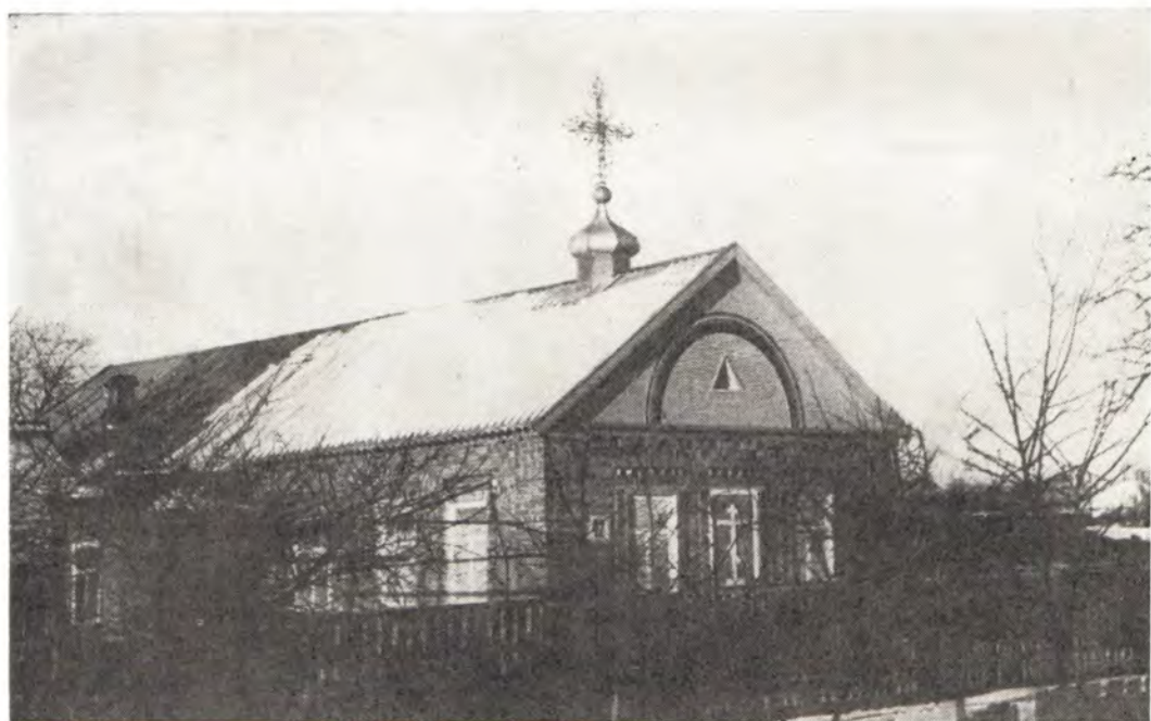
Покровский молитвенный дом в станице Копанской Краснодарского края