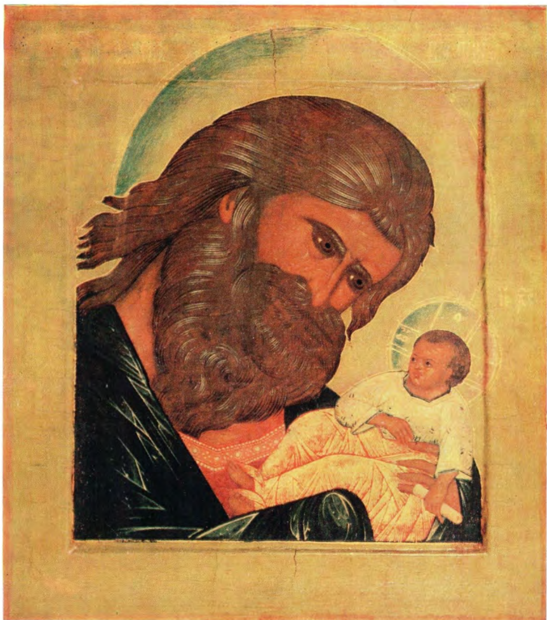
СВЯТОЙ ПРАВЕДНЫЙ СИМЕОН БОГОПРИИМЕЦ (память 3/16 февраля)