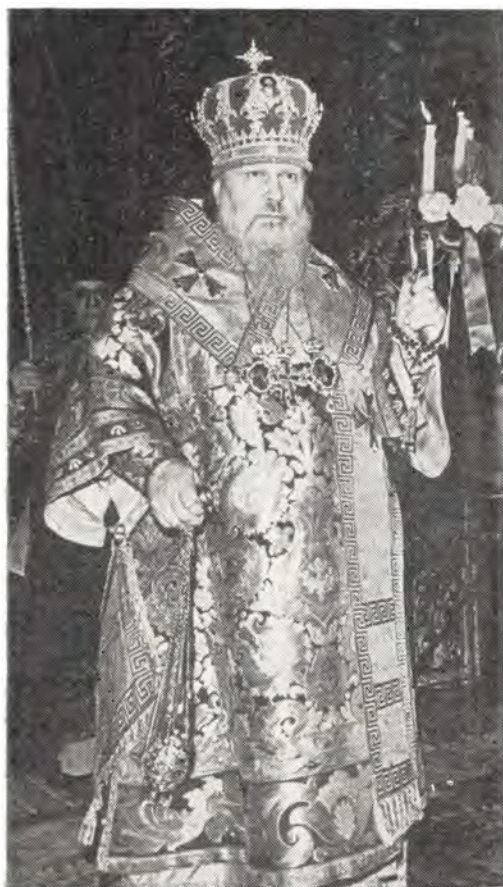
Святейший Патриарх Пимен в Богоявленском патриаршем соборе за богослужением в праздник Святой Пасхи 29 апреля 1973 года

жне о пришествии Искушителя... (там же, с. 99). Таким образом, для богословствования Святейшего Патриарха характерна подчеркнутая актуальность и практическая направленность во имя спасения чад Церкви.