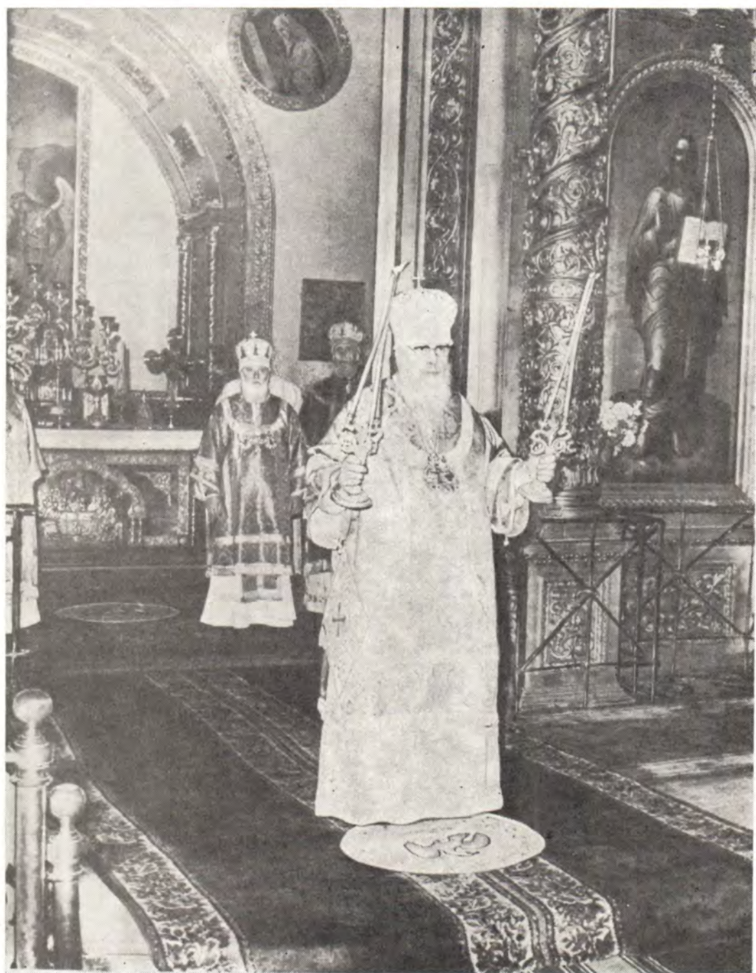
Празднование 25-летия архиерейского служения Святейшего Патриарха Пимена 4 декабря 1982 года. Божественная литургия в Богоявленском патриаршем соборе в Москве