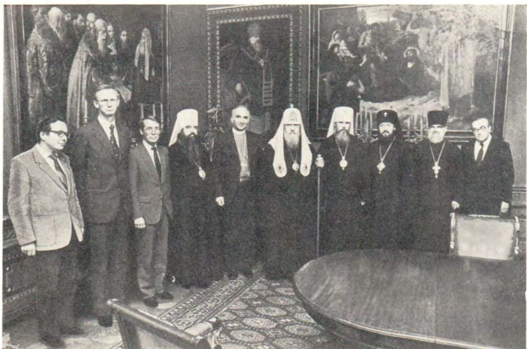
Епископ г. Осло д-р Андреас Орфлот с делегацией Церкви Норвегии на приеме у Святейшего Патриарха Пимена. Москва, 1 октября 1982 года