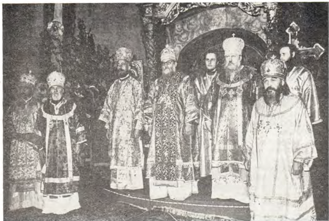
Святейший Патриарх Пимен, Предстоятели Александрийской, Кипрской, Польской, Чехословацкой Автокефальных Православных Церквей за Божественной литургией в Троицком соборе Троице-Сергиевой Лавры в День Святой Троицы, 6 июня 1971 года

рами и преподавателями Московских Духовных школ он призывает хранить «наше богословие всегда сугубо ортодоксальным... чтобы традиции Русской Православной Церкви неукоснительно сохранялись и чтобы... в учебных программах уделялось этому большое внимание» (там же, с. 362).