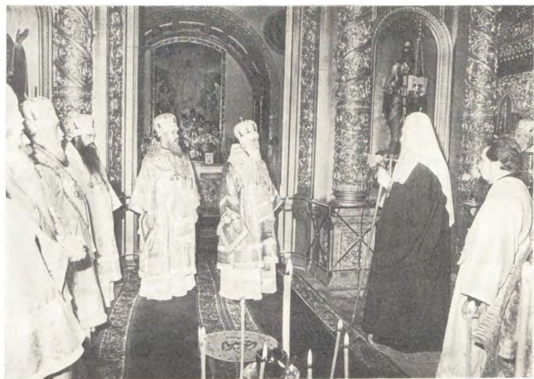
Митрополит Киевский и Галицкий Филарет, Патриарший Экзарх Украины, обращается с приветственным словом к Святейшему Патриарху Пимену после благодарственного молебна в Богоявленском патриаршем соборе 4 декабря 1982 года