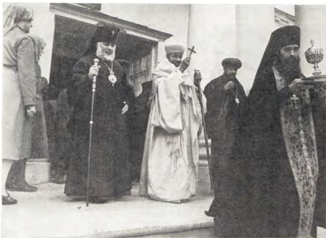
17 мая 1982 года Святейший Патриарх Эфиопский Абуна Текле Хайманот принял участие в совершении чина о Панагии по окончании Божественной литургии в Псково-Печерском монастыре