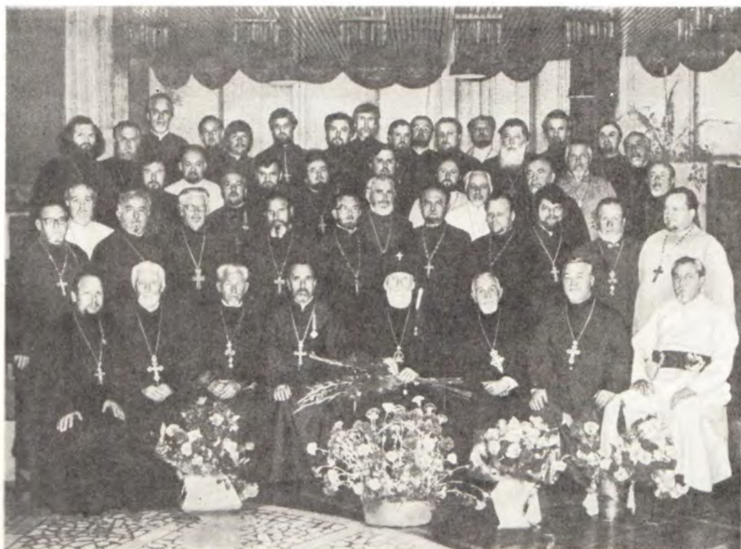
8 июня 1982 года, архиепископ Кишиневский и Молдавский Ионафан с клириками епархии в день своего 70-летия