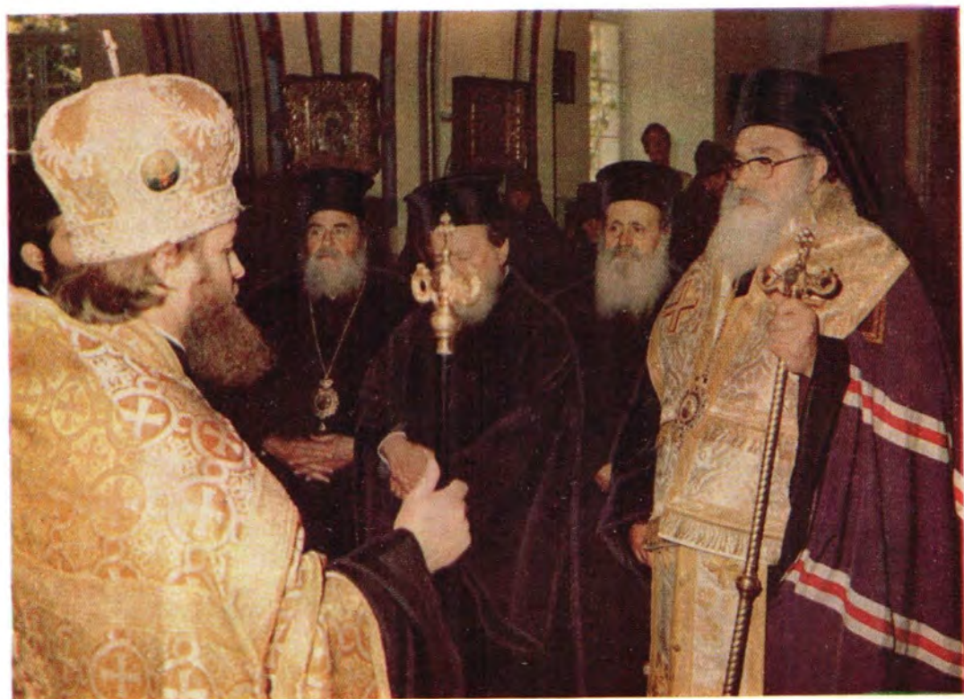
27 июля 1982 года. Архимандрит Пантелеимон, начальник Русской Духовной Миссии в Иерусалиме, после возведения в сан архимандрита обращается с приветственным словом к Блаженнейшему Патриарху Иерусалимскому Диодору в храме во имя святой мученицы царицы Александры