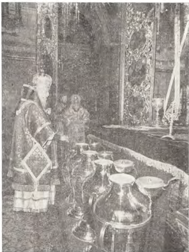
Святейший Патриарх Пимен совершает чин освящения мира в Богоявленском патриаршем соборе 23 апреля 1981 года в Великий Четверток

В заключение хотелось бы привести слова постоянного члена Священного Синода митрополита Таллинского и Эстонского Алексия, обращенные к