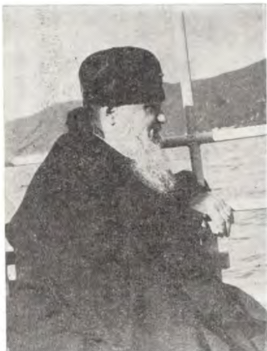
Святейший Патриарх Пимен во время паломничества на Святую Гору Афон

управляющего делами Московской Патриархии.