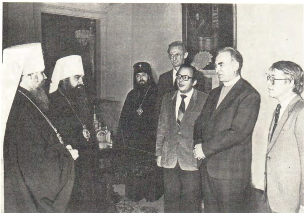
Епископ д-р Андреас Орфлот во время беседы с постоянными членами Священного Синода митрополитом Таллинским и Эстонским Алексием и митрополитом Минским и Белорусским Филаретом, Патриаршим Экзархом Западной Европы, в резиденции Святейшего Патриарха в Москве, 1 октября 1982 года