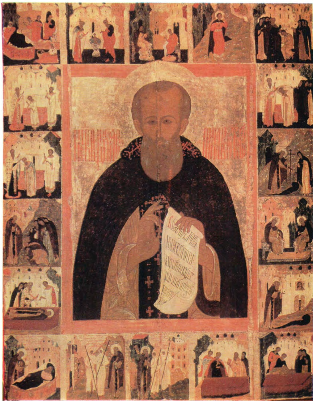
ПРЕПОДОБНЫЙ ДИМИТРИЙ ПРИЛУЦКИЙ, ВОЛОГОДСКИЙ (память 11/24 февраля)