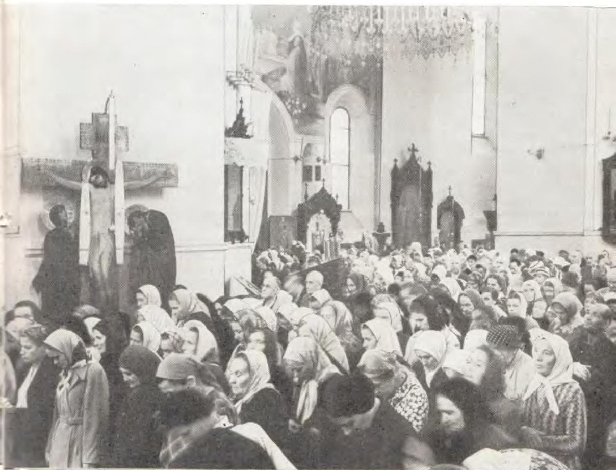
Воскресения Христова, что в Сокольниках в Москве, 21 августа 1960 года

гочестивым человеком, который сказал так: «Касперовская икона Божией Матери написана с Младенцем на левой руке — это потому, что левая рука ближе к сердцу. На иконе Богоматерь Своей щекой прильнула к щеке Богомладенца Христа. Это потому, что Она Богомладенцу рассказывает о всех печалях и скорбях, которые Ей приносит человечество. А правая рука у Нее свободна, ею Она помогает всем, кто к Ней обращается» (129).