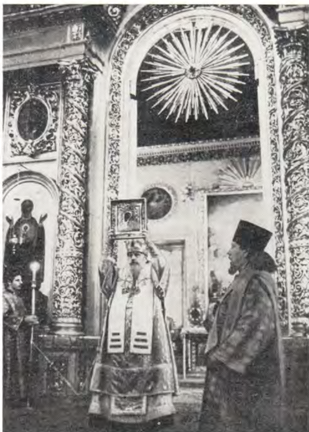
Богоявленский патриарший собор 8 июля 1979 года. Святейший Патриарх Пимен осеняет богомольцев чтимым Казанским образом Божией Матери

В условиях напряженной международной обстановки каждый человек должен стать «сознательным и идейным борцом за мир, и в первых рядах борцов должны быть христиане» (388). Христианин должен рассматривать миротворческое служение как существенную часть спасительной миссии Церкви (1982, 2, 29). Его Святейшество призывает боголюбивую паству объединиться «в общей молитве о мире всего мира и усердную молитву