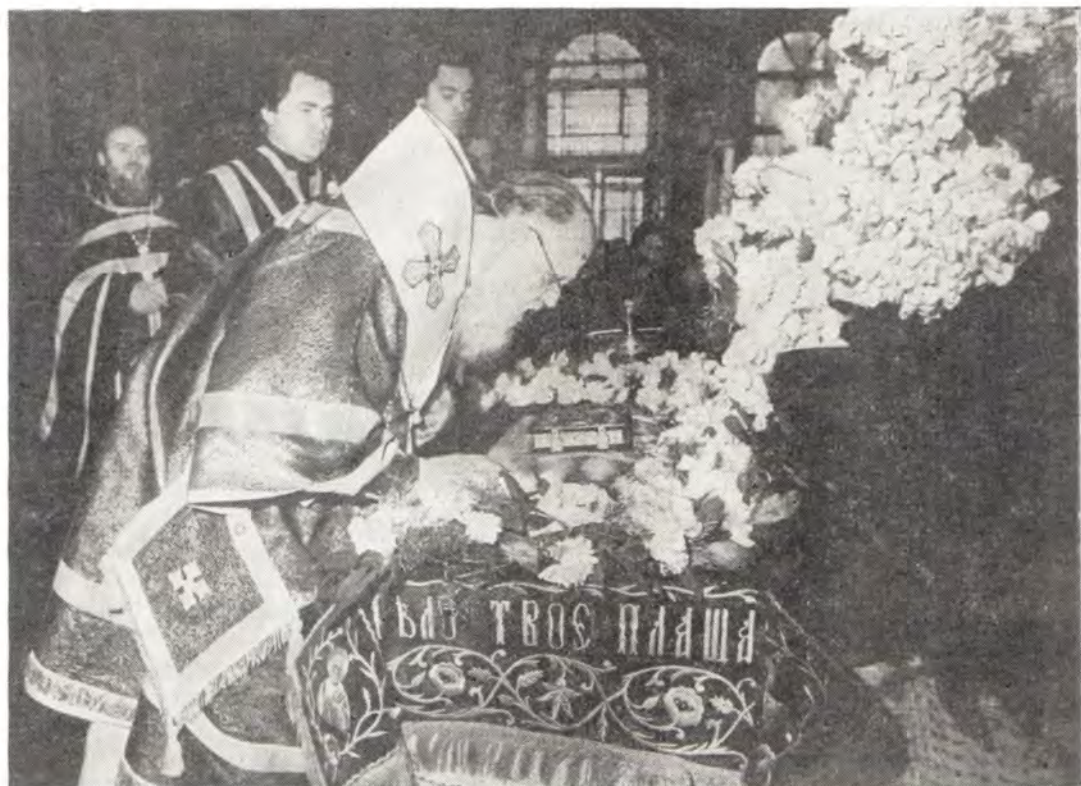
24 апреля 1981 года. Богоявленский патриарший собор. Святейший Патриарх Пимен у святой Плащаницы

патриарший престол была восхождением на высшую в Православной Церкви ступень архиерейского служения. С этого времени под высшей его церковной властью и духовным окормлением пребывают не только многомиллионная паства и клир, но и все архиереи Русской Православной Церкви, находящиеся в нашей стране и за ее пределами. Его архиерейское служение отныне становится первосвятительским.