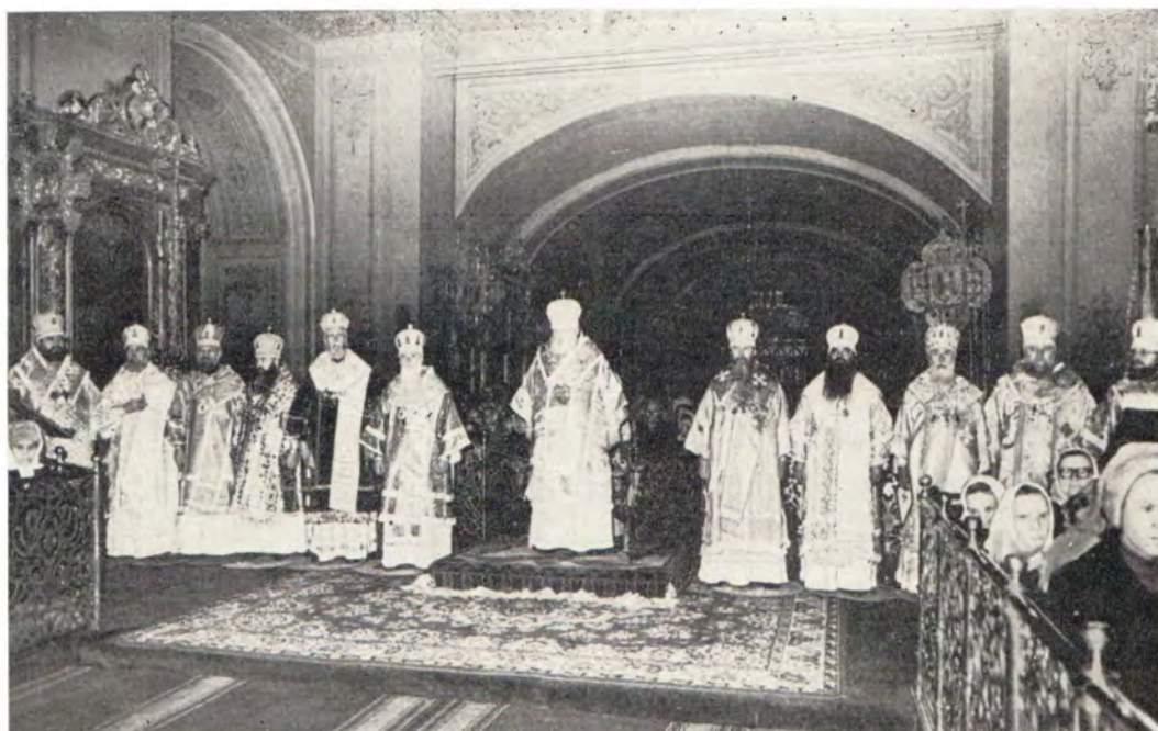
4 декабря 1982 года. Празднование 25-летия архиерейского служения Святейшего Патриарха Пимена. Божественная литургия в Богоявленском патриаршем соборе в Москве