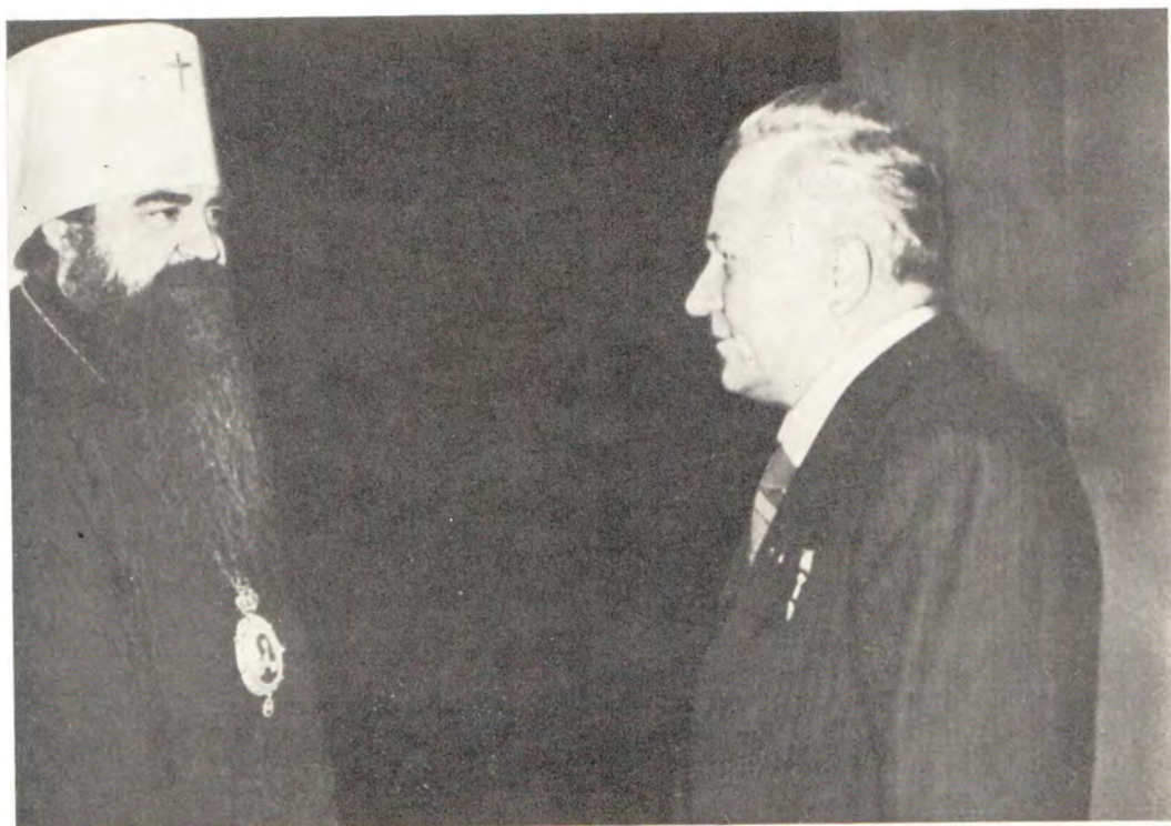
Митрополит Минский и Белорусский Филарет, Патриарший Экзарх Западной Европы, был принят И. П. Шамякиным, Председателем Президиума Верховного Совета БССР. Минск, 25 октября 1982 года