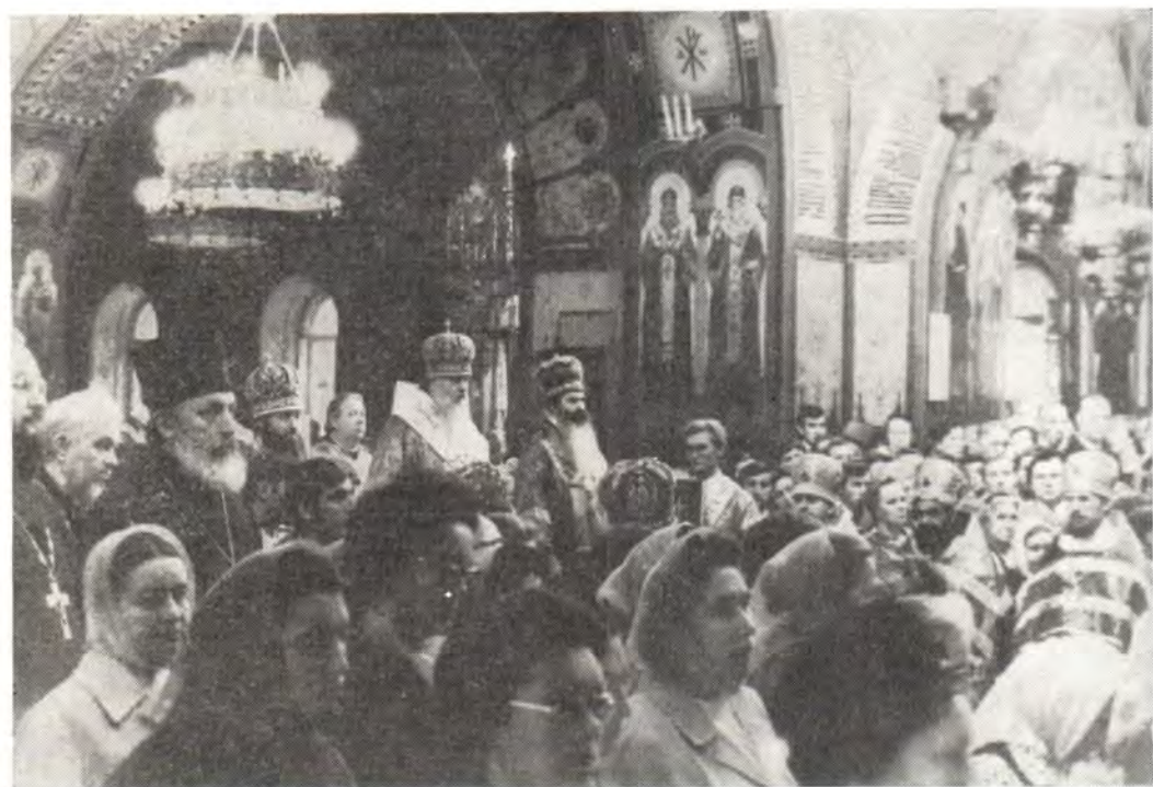
Святейший Патриарх Пимен в сослужении Преосвященных архиереев и клириков совершает Божественную литургию в Пименовском храме в Москве в день своего тезоименитства

Всемирная конференция «Религиозные деятели за прочный мир, разоружение и справедливые отношения между народами».