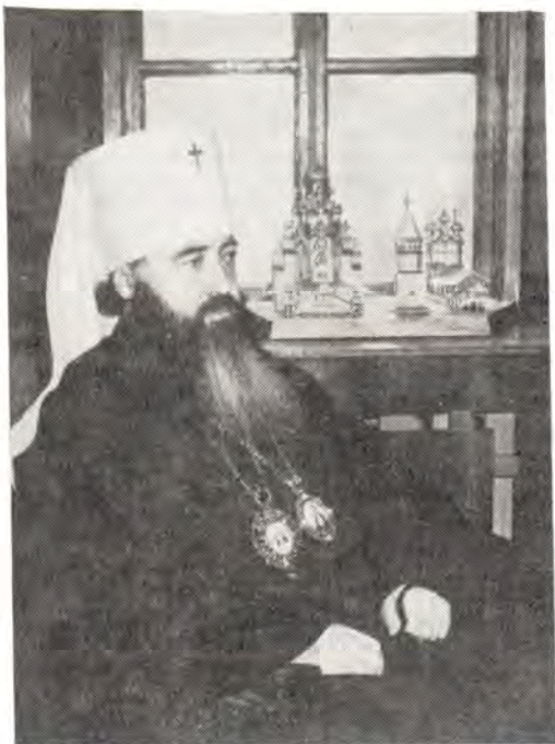
Высокопреосвященный Ювеналий, митрополит Крутицкий и Коломенский

укрепления безопасности. В эти дни вновь мощно прозвучит многомиллионный голос советской общественности, которая вместе со всеми миролюбивыми силами планеты требует: Нет — ядерному оружию во всем мире! За разоружение и мир!»