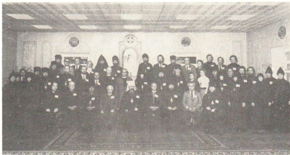
Участники экуменического семинара