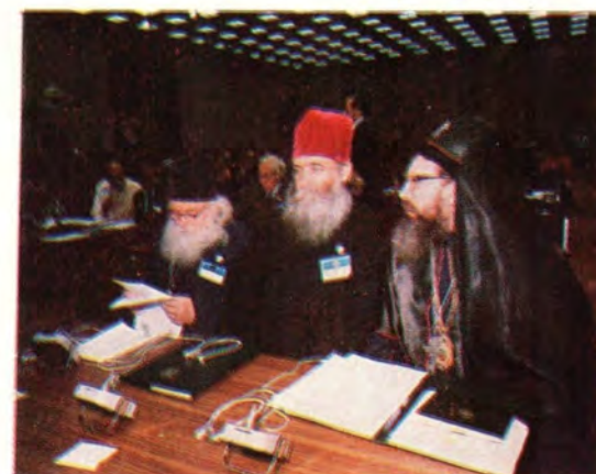
На верхних снимках и на среднем справа — в президиуме Конференции; на других снимках — в зале заседаний