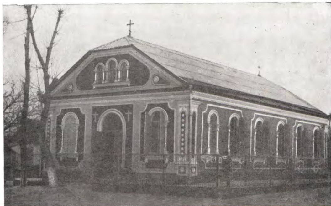
Новое здание молитвенного дома во имя святого великомученика Георгия Победоносца в станице Варениковской (Краснодарская епархия). На нижнем снимке — иконостас нового молитвенного дома