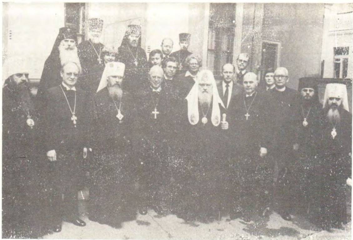
13 июня 1982 года. Святейший Патриарх Пимен принял в своей московской резиденции делегацию Союза Евангелических Церквей в Германии (ФРГ)