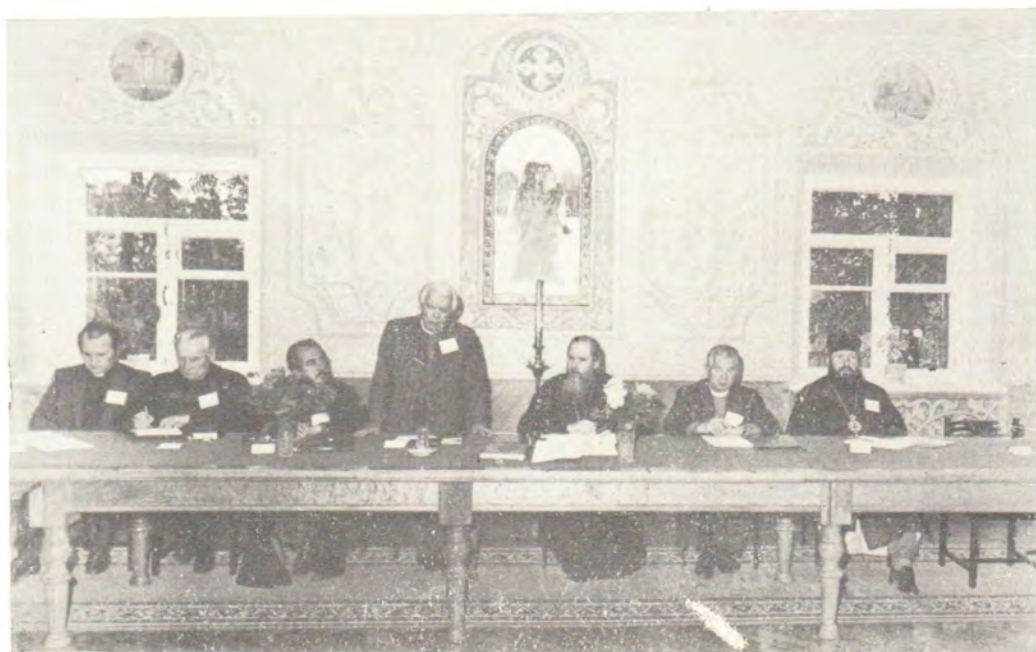
Выступление Архиепископа Евангелическо-Лютеранской Церкви Эстонии д-ра Эдгара Харка на экуменическом семинаре

Пюхтицкий монастырь, 27—29 июня 1982 года