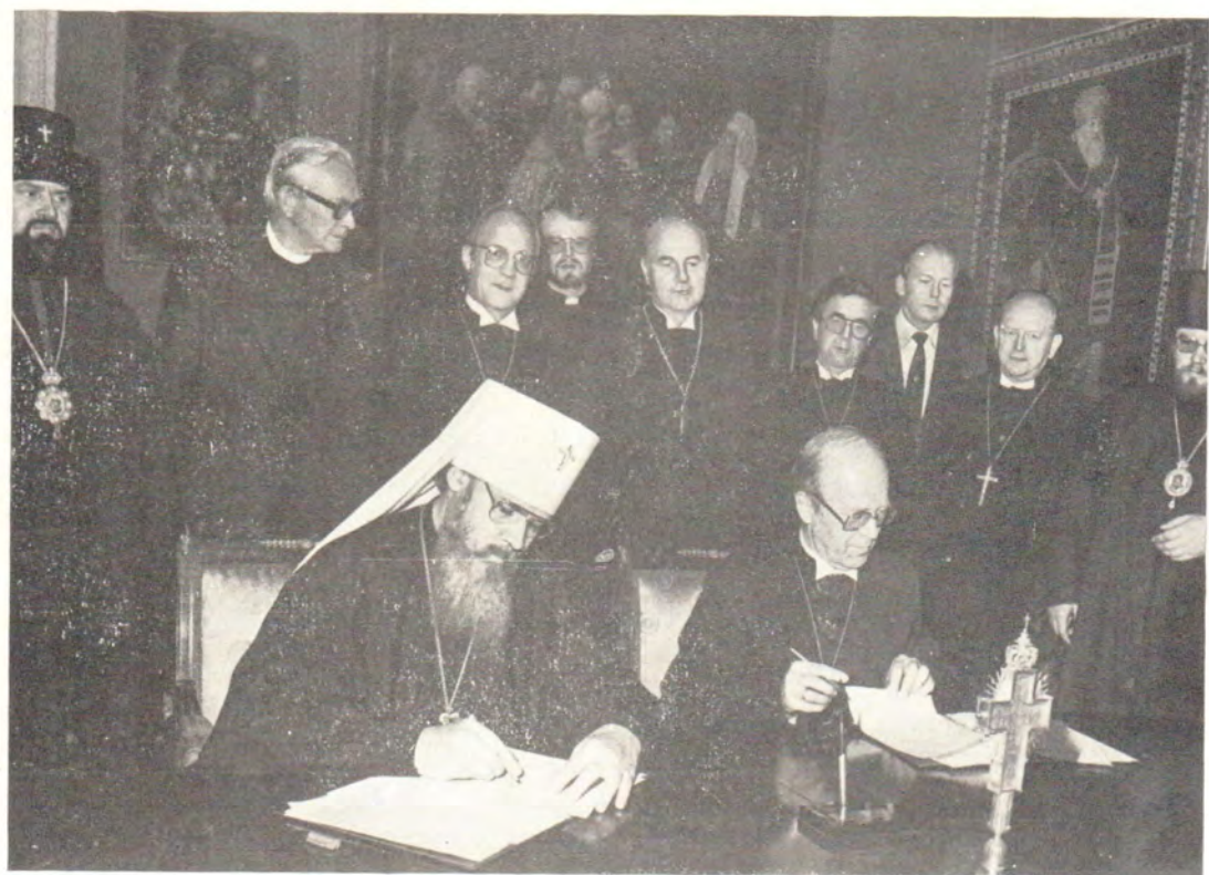
24 июня 1982 года в Московской Патриархии. Митрополит Таллинский и Эстонский Алексий и Епископ д-р Эдвард Лозе подписывают коммюнике о визите в нашу страну делегации Союза Евангелических Церквей в Германии (ФРГ)