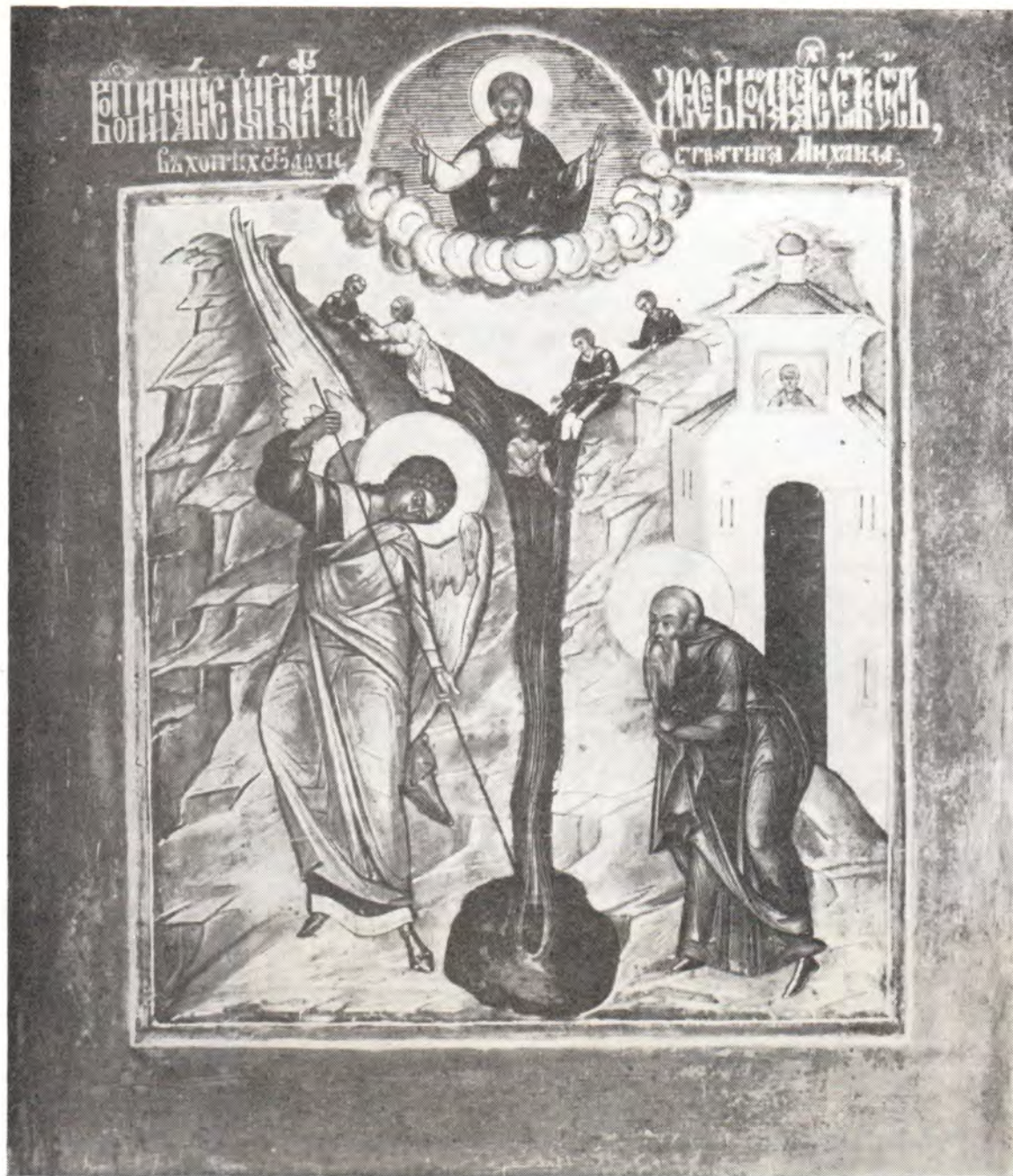
ЧУДО АРХИСТРАТИГА БОЖИЯ МИХАИЛА В ХОНЕХ