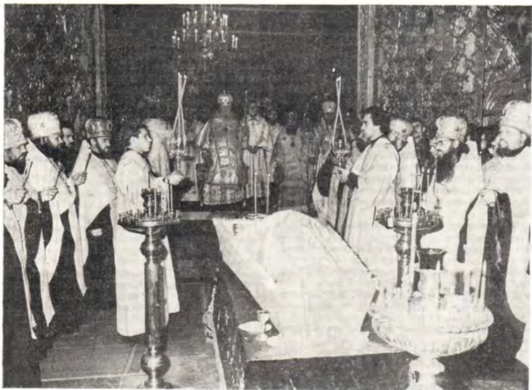
1 апреля 1982 года. Сергиевский трапезный храм Троице-Сергиевой Лавры. Святейший Патриарх Пимен возглавляет отпевание наместника архимандрита Иеронима

Различны направления иноческой жизни, монашеского повседневного быта. Заботы разного рода — внешние и внутренние — лежат на плечах наместника. Вот как, в частности, о некоторых из них говорится в Уставе Троице-Сергиевой Лавры: