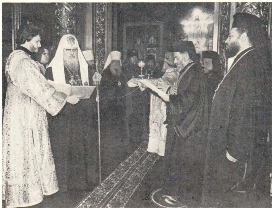
Блаженнейший Патриарх Игнатий IV отвечает на приветственное слово Святейшего Патриарха Пимена в Богоявленском патриаршем соборе 18 октября 1981 года