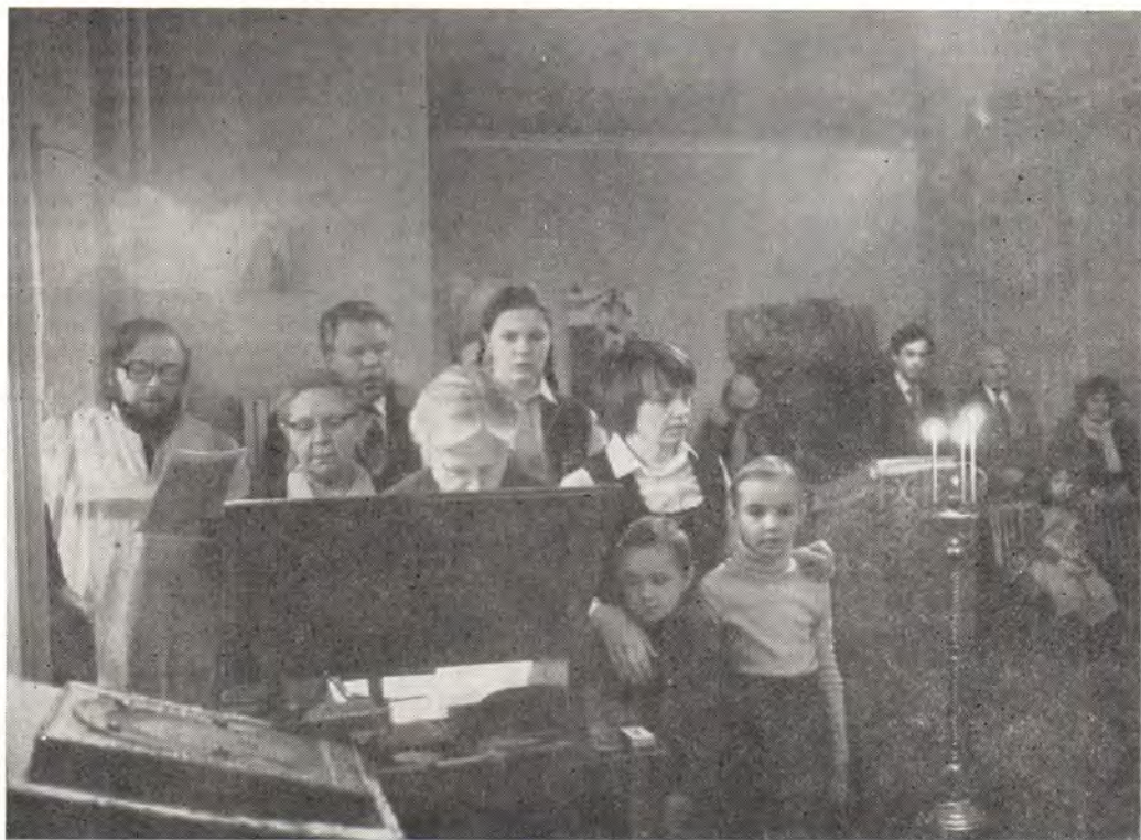
8 февраля 1981 года за Божественной литургией в храме Рождества Пресвятой Богородицы в Представительстве Русской Православной Церкви при ВСЦ