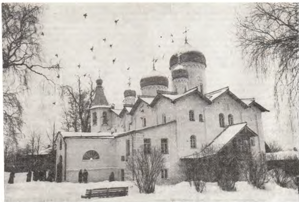
Храм во имя святого апостола Филиппа в Новгороде

Ней вы приходите со своими радостями, скорбями и нуждами и находите утешение. Пренепорочная Матерь Спасителя — Ходатаица за нас, грешных, прибегающих к Ее покрову и заступлению. Она — надежная наша Покровительница, и вы Ее умоляйте, чтобы сохранила всех нас в мире и благополучии».