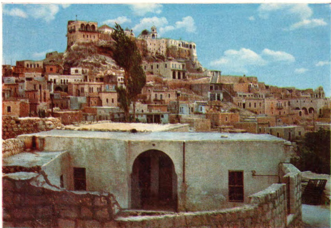
Седнайский монастырь [Сирия]. Общий вид