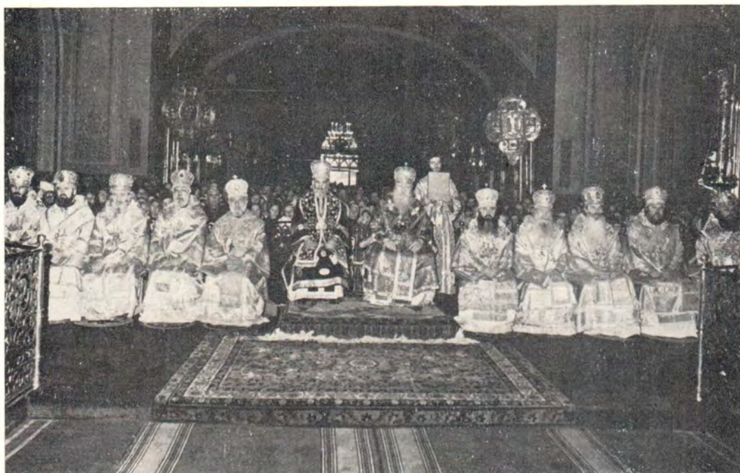
18 октября 1981 года. Блаженнейший Патриарх Игнатий IV и Святейший Патриарх Пимен в сослужении Превосвященных архиереев и клириков Антиохийской и Русской Церквей совершили Божественную литургию в Богоявленском патриаршем соборе