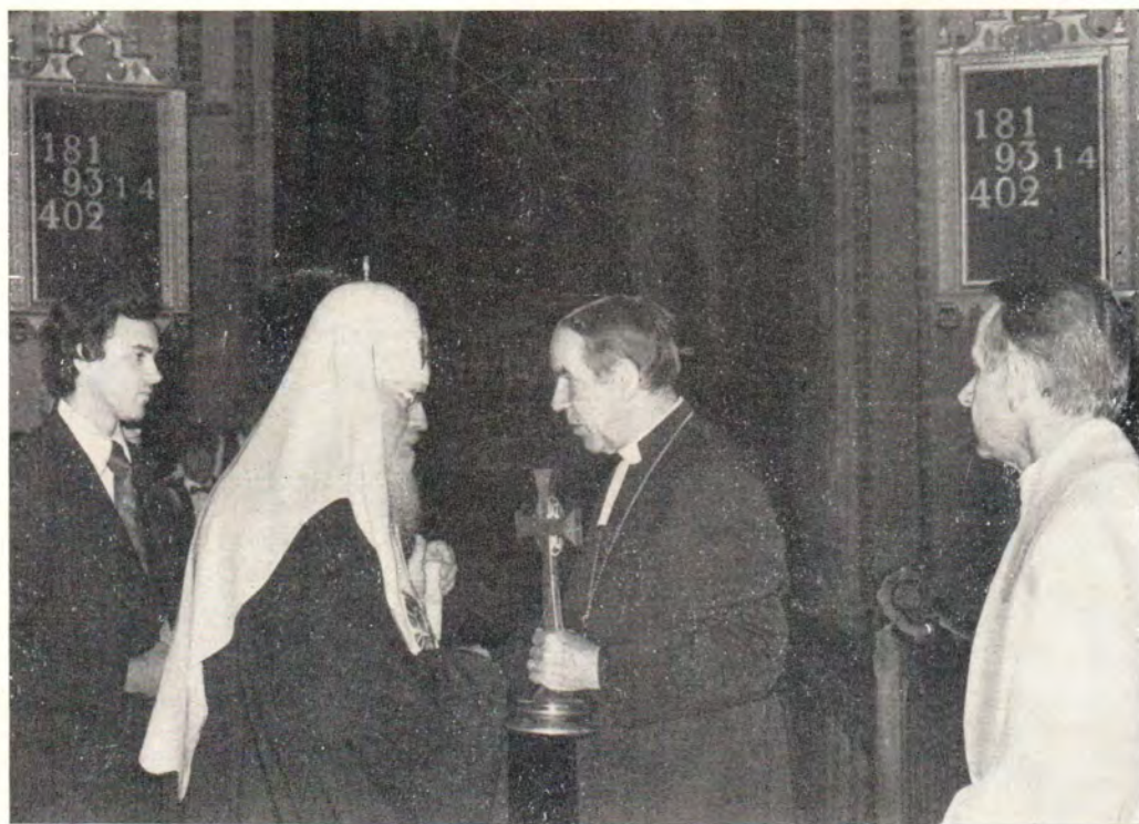
1 сентября 1981 года. Святейший Патриарх Пимен вручает крест в дар Архиепископу д-ру Микко Юве