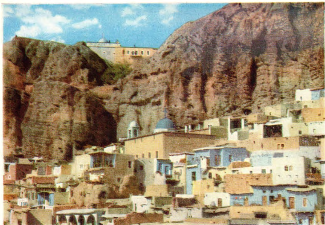
Маалула. Общий вид селения. Вверху: монастырь святого мученика Сергия