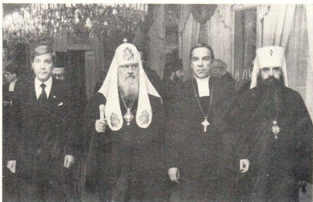
Святейший Патриарх Пимен на приеме у министра просвещения Финляндии П. Стенбека 3 сентября 1981 года. На фото слева направо: министр П. Стенбек, Святейший Патриарх Пимен, Архиепископ д-р Микко Юва, митрополит Минский и Белорусский Филарет, Патриарший Экзарх Западной Европы