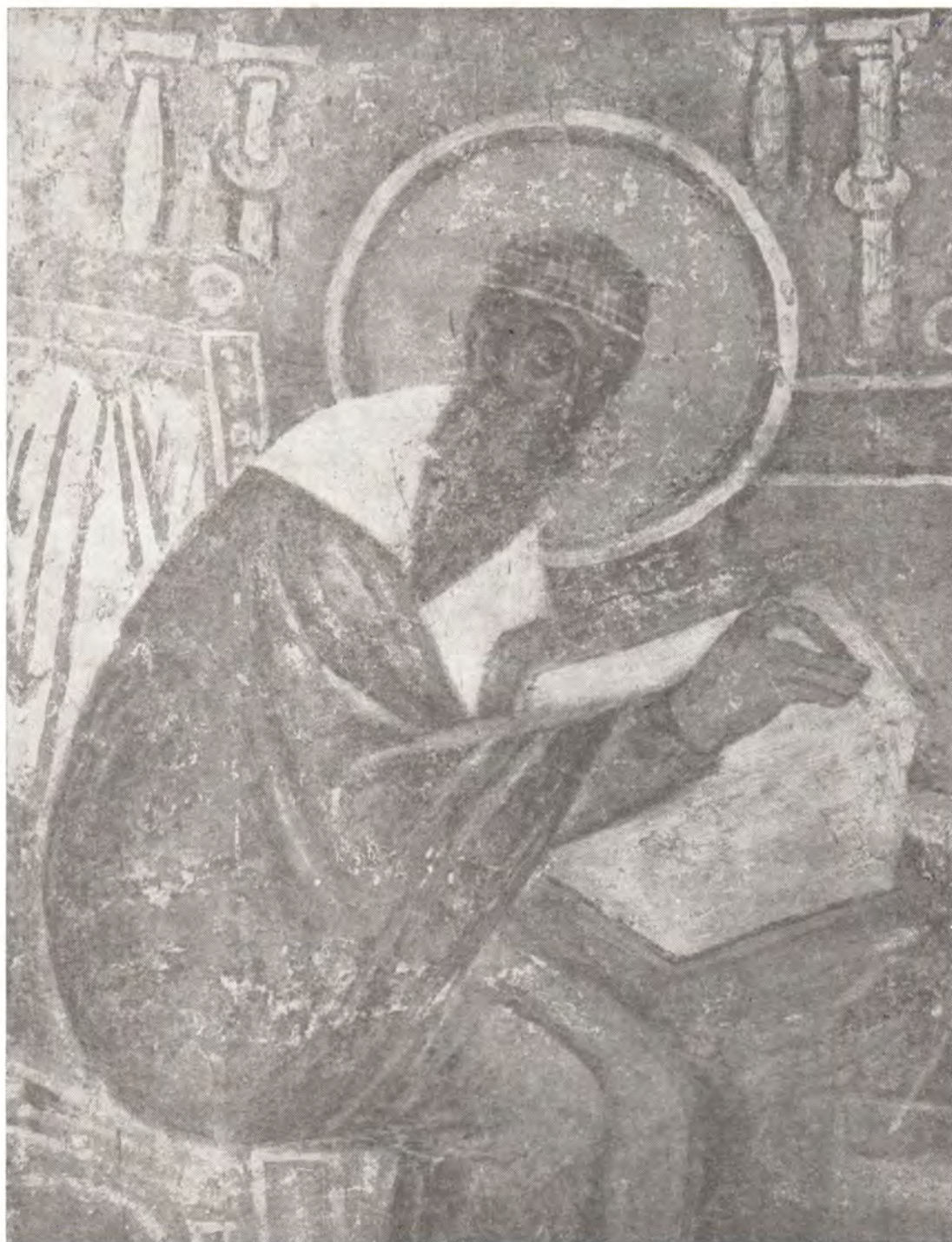
СВЯТОЙ РАВНОАПОСТОЛЬНИЙ КИРИЛЛ ФИЛОСОФ Фреска XII в. в Кирилловской церкви в Киеве