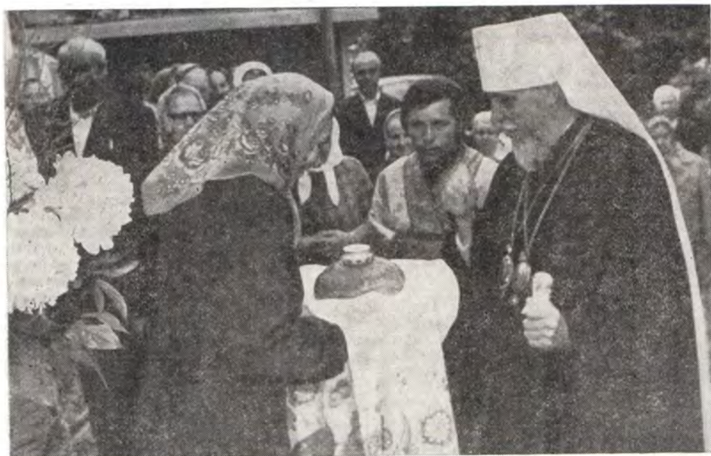
Хлебом-солью по русской традиции встретили митрополита Ленинградского и Новгородского Антония прихожане Свято-Троицкого храма в г. Петрозаводске