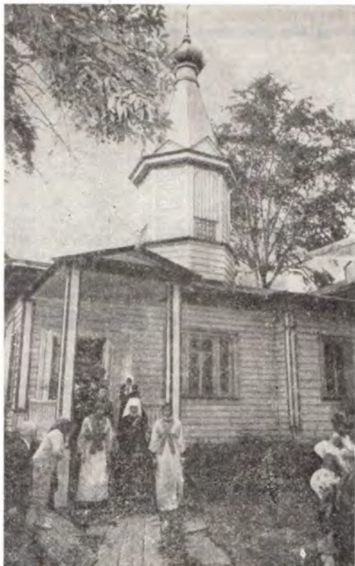
Митрополит Ленинградский и Новгородский Антоний у входа в храм во имя великомученицы Екатерины в г. Петрозаводске по окончании всенощного бдения

Вечером 4 июля в г. Петрозаводске Владыка Антоний в сослужении петрозаводских клириков совершил всенощное бдение в кладбищенском храме во имя святой великомученицы Екатерины. Этот храм — уникальный памятник северного деревянного зодчества. Здесь хранится чтимый деревянный крест, с которым связано основание города царем Петром I в 1703 году. На южной стене храма находится редкая икона — Собор преподобных отцов земли Карельской, на которой изображены преподобные Александр Свирский, Иона Климецкий, Иона Яшезерский, Корнилий Палеостровский, Лазарь и Афанасий Мурманские, Адриан Ондрусовский, Александр Ошевенский, Кирилл Челмогорский, Афанасий Сяндемский, Никифор и Геннадий Важеозерские, Пахомий Важский (статью об иконе Карельских святых см. в «ЖМП», 1974, № 12, с. 16). После всенощной Владыка Антоний произнес слово. В заключение он сказал, обращаясь к верующим: «Святая Церковь учит, чтобы сердце человека было добрым, и чтобы оно отображало истинную любовь, ибо,