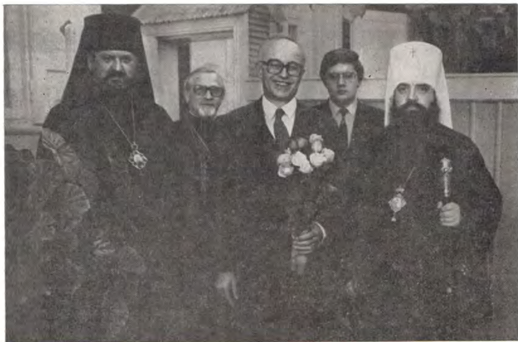
Митрополит Минский и Белорусский Филарет, Патриарший Экзарх Западной Европы, председатель Отдела внешних церковных сношений, во время встречи с послом Франции в СССР А. Фроман-Мерисом

При благословении верующих он сказал: «Пресвятая Богородице, спаси нас! Ваш храм посвящен Успению Божией Матери. К