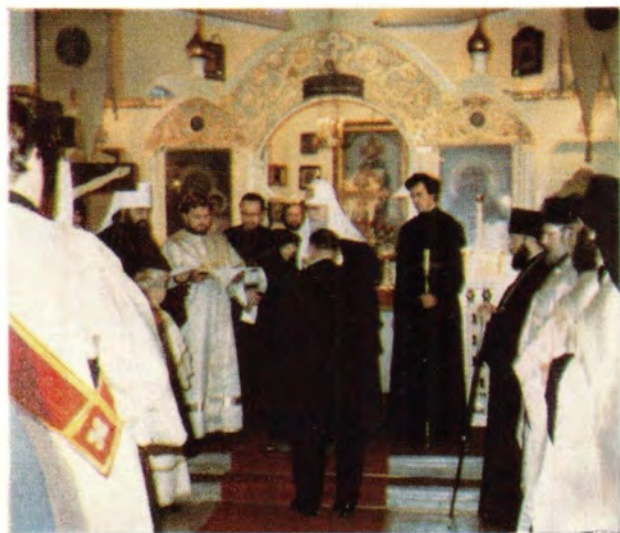
31 августа 1981 года, встреча Святейшего Патриарха Пимена на железнодорожном вокзале в Хельсинки