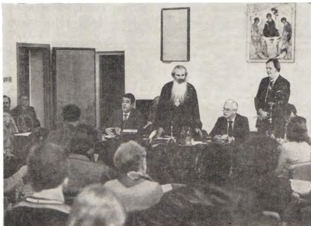
Пресс-конференция для советских и иностранных журналистов в конференц-зале Издательского отдела

каций в будущем с тем, чтобы документы эти были приняты к рассмотрению и изучению на Ассамблее.