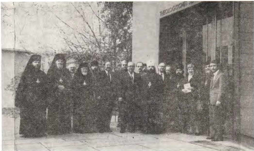
Митрополит Минский и Белорусский Филарет и члены делегации Русской Православной Церкви у входа в Богословский факультет Эрлангенского университета вместе с профессорами факультета

ствий считать в этом отношении возложение рук на посвящаемого таинством — не имеет». Подобные отклонения от предшествовавшей традиции в лютеранстве возникли и были обусловлены историческими обстоятельствами Реформации.