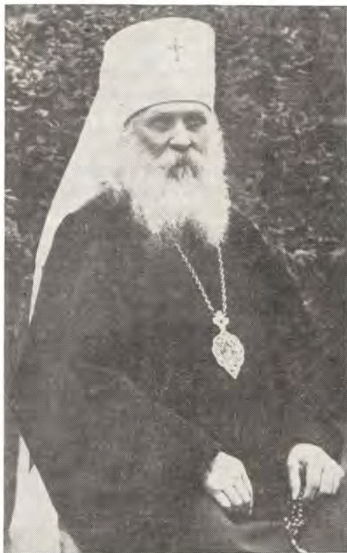
Митрополит Вениамин (Федченков)

Если бы центральный смысл Евхаристии был в Жертве, тогда весь этот канон и сводился бы к этой идее; она должна была бы занять и заполнить всё. Между тем Евхаристия как Жертва занимает лишь часть канона, именно: от тайной молитвы, даже второй половины ее, читаемой во время пения «Свят, Свят, Свят» («С сими и мы блаженными Силами»), где говорится, что Бог так возлюбил мир, что и Сына Своего Единородного дал за спасение его, и Он, все сделав для этого в жизни Своей, наконец «Сам Себе предавшие за мирский живот и спасение», для чего перед смертью Своею установил таинство Причащения, Бескровную Жертву Тела и Крови. Затем произносятся слова Господа «Примите, ядите», «Пейте от нея вси», а после возносятся Дары как жертва Богу — Ему от Его же Даров: «Твоя от Твоих Тебе приносяще о всех и за вся». И, наконец, после призвания Святого Духа