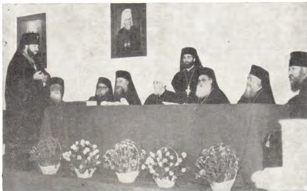
12 сентября 1981 года в Ленинградских Духовных Академии и Семинарии. Ректор архиепископ Выборгский Кирилл обращается с приветствием к Блаженнейшему Патриарху Диодору в связи с избранием Его Блаженства почетным членом ЛДА

Заключительная встреча Предстоятелей двух Церквей состоялась 21 сентября.