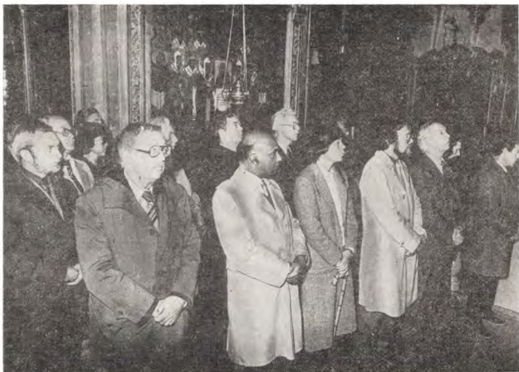
Христианские публицисты в Успенском соборе Троице-Сергиевой Лавры

мыслом Божиим наступят времена, когда мировая и церковная пресса будут говорить не о проблемах взаимоотношений Востока и Запада, Севера и Юга, вызывающих серьезную тревогу тех, кому дорого будущее человечества, но о том, что Восток с Западом, Север с Югом — друг с другом и все вместе — направят свою волю к созиданию такого мира, в котором хочет видеть нас пребывающими Иисус Христос.