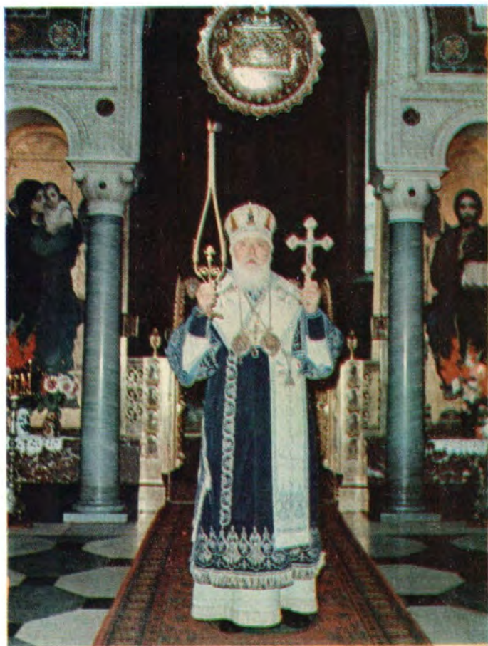
Митрополит Киевский и Галицкий Филарет, Патриарший Экзарх Украины, за Божественной литургией во Владимирском кафедральном соборе в Киеве в день праздника Успения Пресвятой Богородицы, 28 августа 1981 года