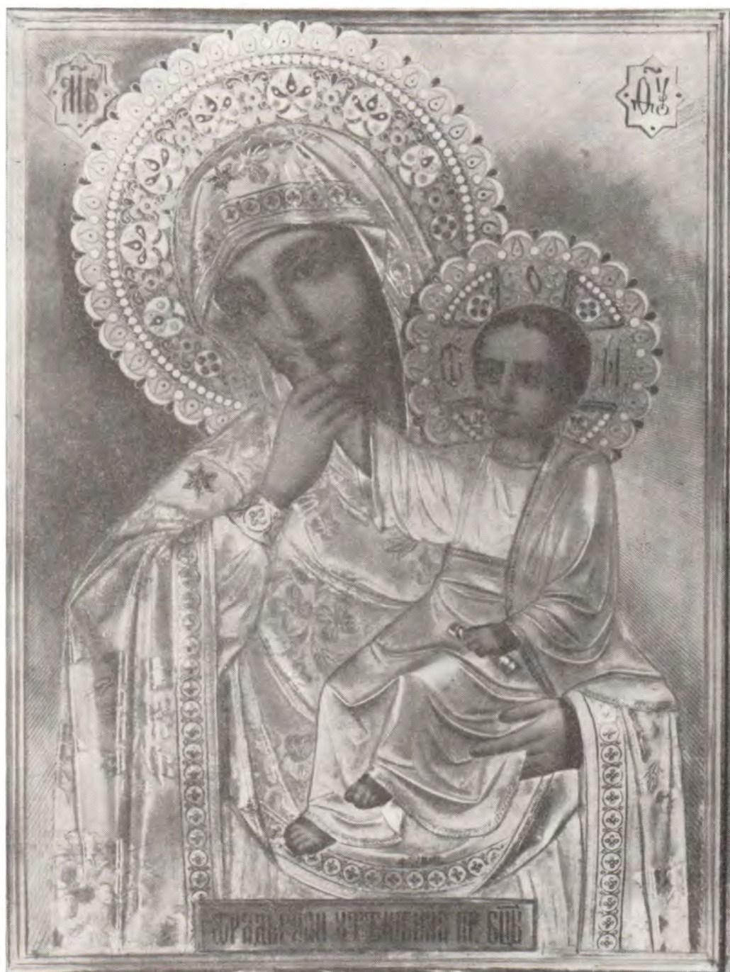
Образ Божией Матери «Отрада», или «Утешение»