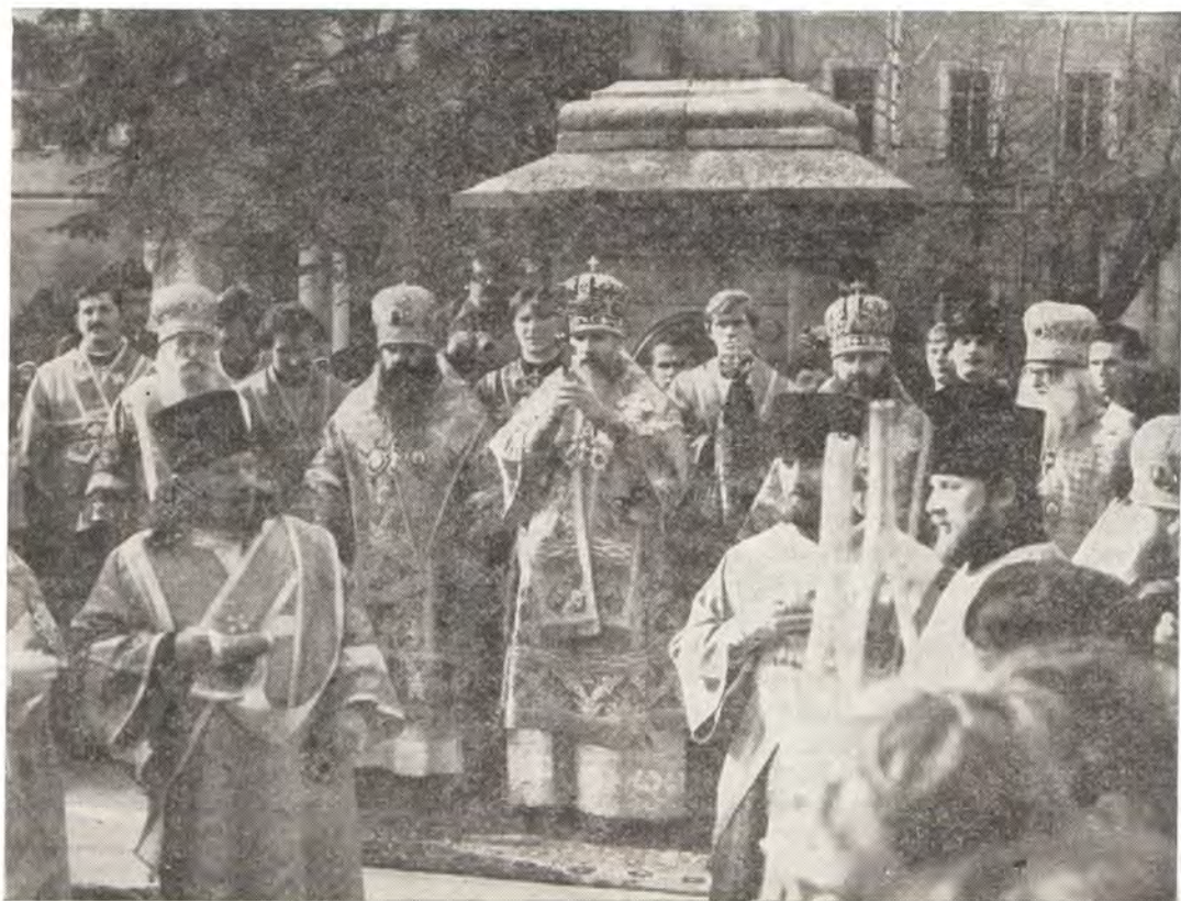
Митрополит Таллинский и Эстонский Алексей осеняет богомольцев крестом во время пения многолетия по окончании молебна на лаврской площади 8 октября 1981 года

В соборе во имя Живоначальной Троицы, где находится рака с мощами