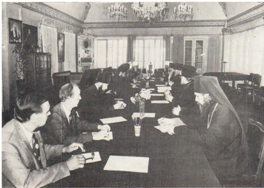
Заседание Комиссии Священного Синода по подготовке празднования 1000-летия Крещения Руси

(См. с. 5, а также «ЖМП», 1981, № 11, с. 2)