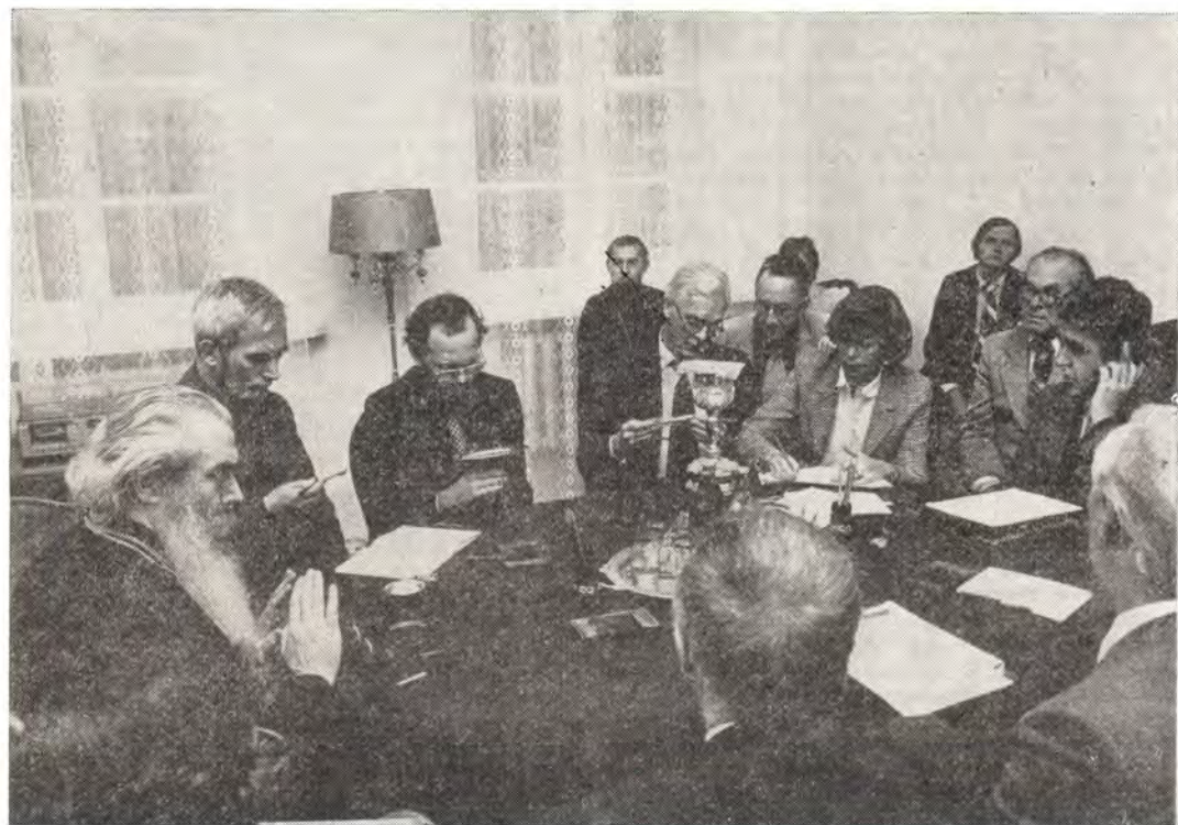
Рабочее заседание трех исполкомов в Издательском отделе Московского Патриархата

На следующий день, 3 октября, работа исполкомов была продолжена в Волоколамске. Церковные коммуникаторы в ходе своего рабочего заседания выразили надежду, что Про-