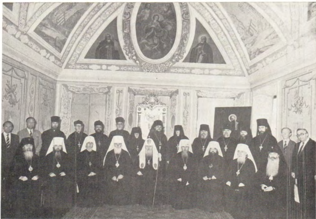
Святейший Патриарх Пимен с членами Комиссии Священного Синода по подготовке празднования 1000-летия Крещения Руси