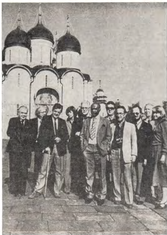
Христианские публицисты на Соборной площади Московского Кремля.