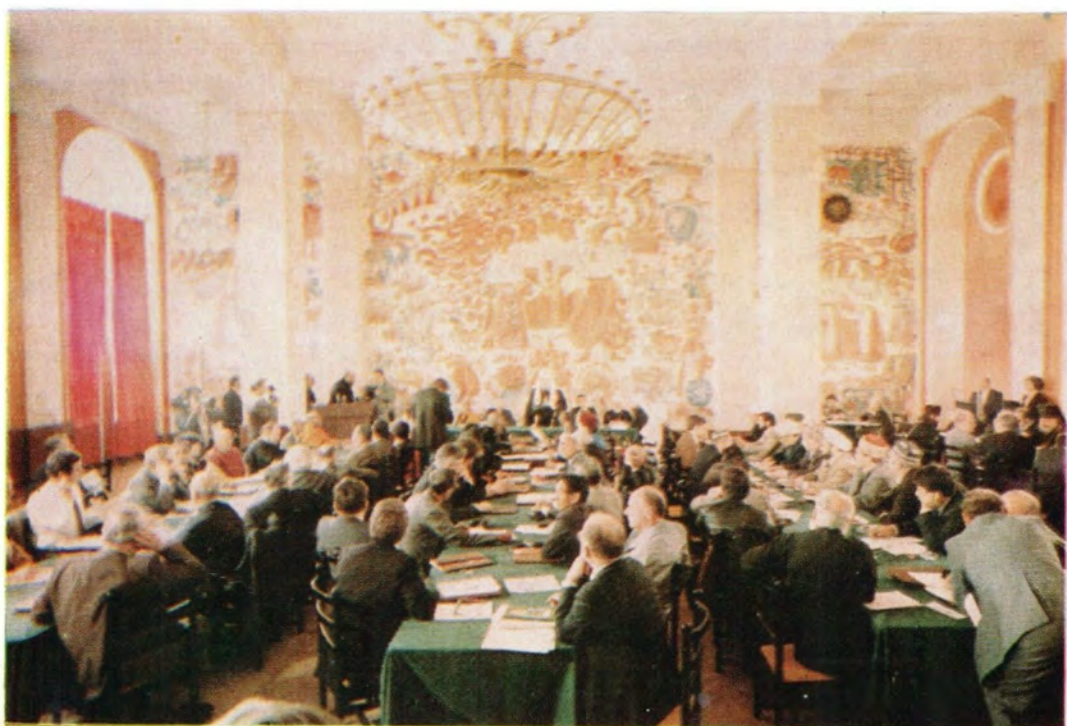
В зале во время заседания