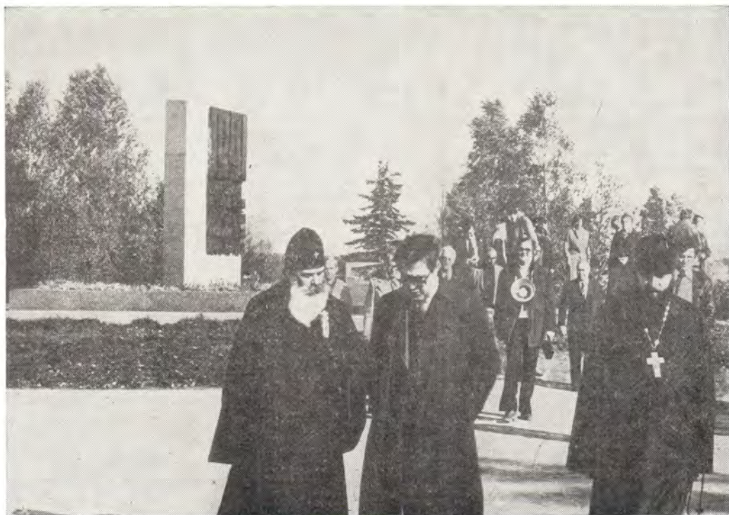
Участники московской встречи у памятника советским воинам-панфиловцам близ разъезда Дубосеково под Волоколамском — в с. Нелидово

Участники встречи отметили в своих выступлениях ответственную роль христианских коммуникаторов в период подготовки VI Ассамблеи Всемирного Совета Церквей и необходимость дальнейших усилий в подготовке документов, не только анализирующих и обобщающих опыт работы христианских коммуникаторов, но и позволяющих достоверно оценить настоящее и наметить перспективы развития христианских коммуни-