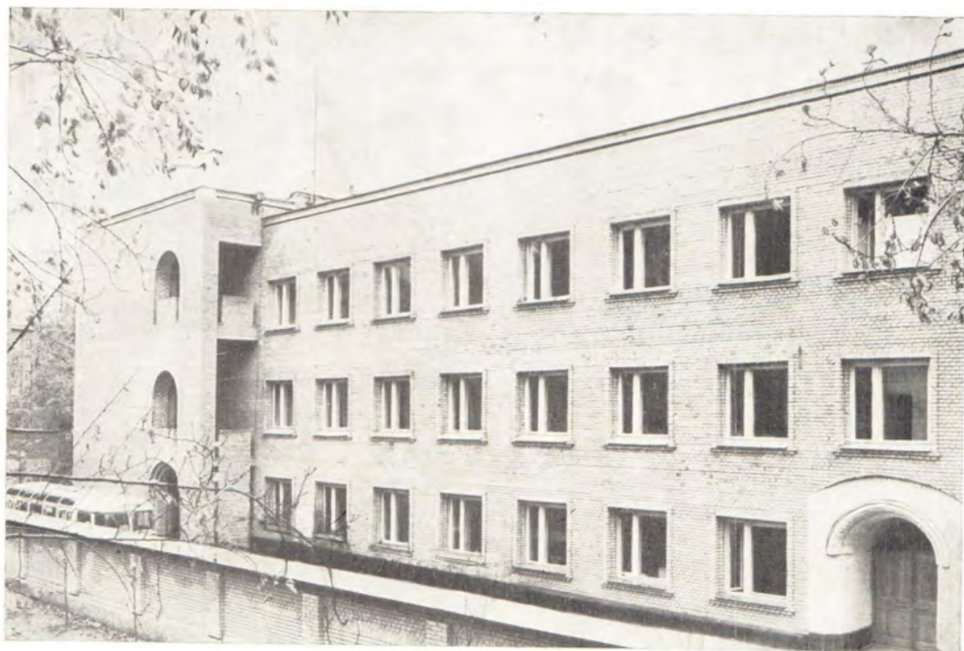
Новое здание Издательского отдела Московского Патриархата