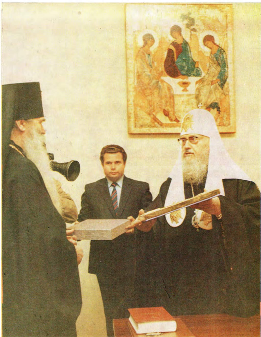
Святейший Патриарх Пимен вручает архиепископу Волоколамскому Питириму, председателю Издательского отдела, Владимирскую икону Божией Матери в день открытия нового здания Издательского отдела