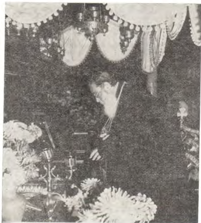
15 сентября 1981 года. Блаженнейший Патриарх Диодор I у раки с мощами святой великомученицы Варвары во Владимирском кафедральном соборе в Киеве

осмотрели кремлевские соборы и сокровища Оружейной палаты. В Ленинграде гости посетили величественный Исаакиевский собор, побывали в Эрмитаже, смотрели балет «Дон Кихот» в Ленинградском академическом театре оперы и балета имени С. М. Кирова, ознакомились с архитектурными памятниками города.