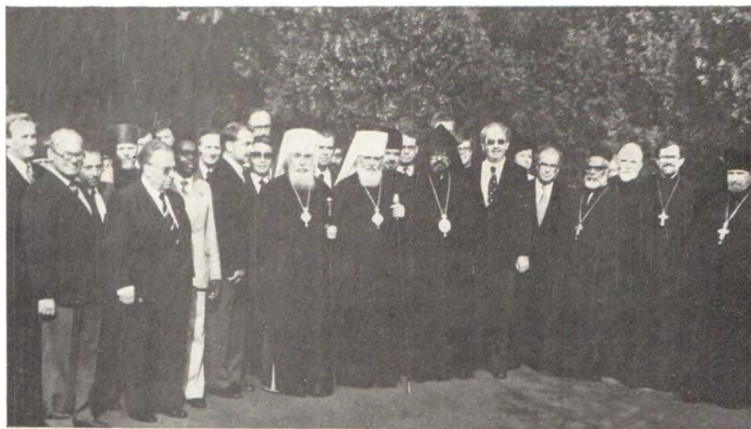
Митрополит Киевский и Галицкий Филарет, Патриарший Экзарх Украины, митрополит Одесский и Херсонский Сергей и участники консультации Комиссии ВСЦ «Вера и церковное устройство» в Успенском мужском монастыре в Одессе 11 октября 1981 года