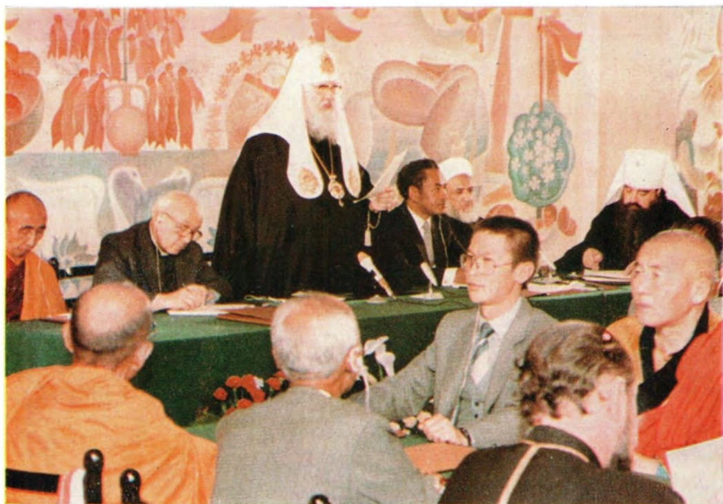
Президиум встречи. Святейший Патриарх Пимен произносит речь