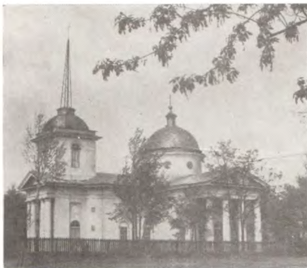
Вверху слева: Казанский храм в с. Туровка Корюковского района, справа: Свято-Троицкий храм в с. Варваровка Бахмачского района, в центре слева: Преображенский храм в с. Стрельники Бахмачского района, справа: Спасо-Преображенский храм в с. Киревка Сосницкого района, внизу слева: Успенский храм в с. Ново-Быково Бобровицкого района