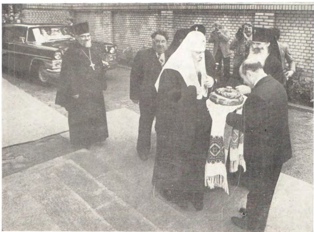
Торжественная, хлебом-солью, встреча Святейшего Патриарха Пимена у входа в новое здание Издательского отдела