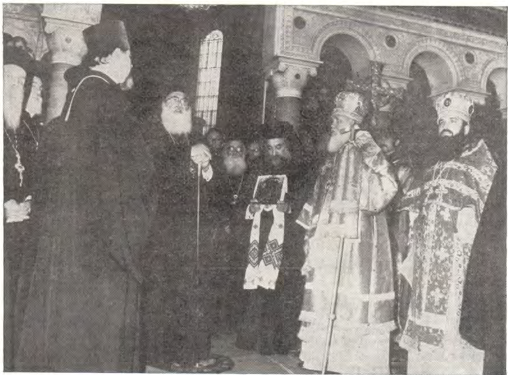
Владимирский кафедральный собор в Киеве 15 сентября 1981 года. Блаженнейший Патриарх Диодор отвечает на приветствие митрополита Киевского и Галицкого Филарета

Блаженнейший Патриарх Диодор и его спутники побывали также в Московском Кремле,