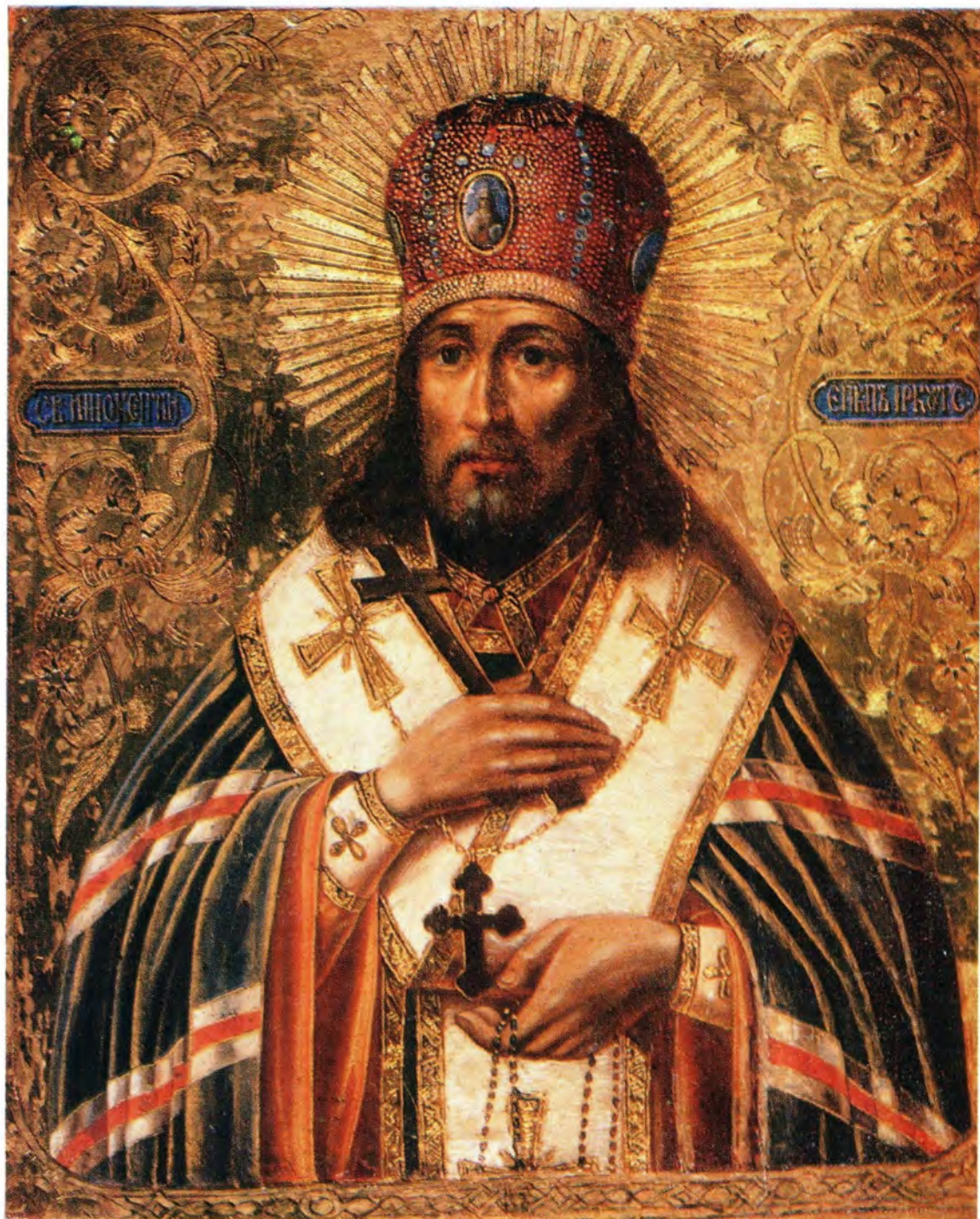
СВЯТИТЕЛЬ ИННОКЕНТИЙ, первый епископ Иркутский и Нерчинский

К 250-летию СО ВРЕМЕНИ ПРЕСТАВЛЕНИЯ 1731—1981