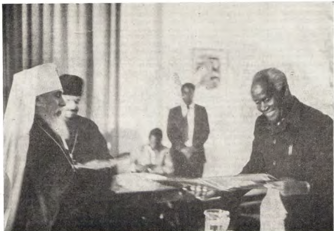
Митрополит Сергей вручает церковные пластинки Президенту Замбии Кеннету Каунде

колониализма. И тем более отраднее сейчас сознавать, что почти все страны африканского континента обрели свободу и независимость, а точнее сказать, с оружием в руках завоевали их. В наш век Африка поднимается во весь свой могучий рост. Широко направляя богатырские плечи, многострадальный народ Африки рвет оковы колониализма. Появляются национальные Церкви. Они объединяются в христианские Советы Церквей, ими руководят сами африканцы без вмешательства извне.