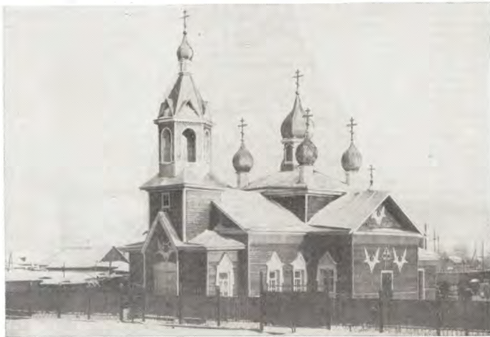
Новосибирская епархия. Новоосуществленный храм, освященный 13 января 1980 года во имя Святителя Николая в Славгороде Алтайского края (см. заметку в «ЖМП», 1981, № 4, с. 21)

В понедельник, вторник, среду и четверг первой седмицы Великого поста Владыка читал Великий канон Андрея Критского в черниговском кафедральном соборе.