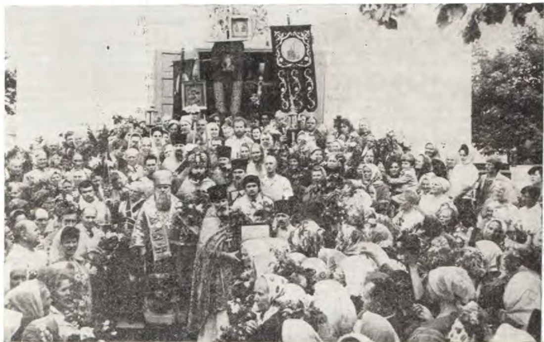
Архиепископ Симферопольский и Крымский Леонтий с клириками и молящимися совершает крестный ход в престольный праздник — День Святой Троицы вокруг кафедрального собора в г. Симферополе

14 июня, День Святой Троицы, престольный праздник Свято-Троицкого кафедрального собора в г. Симферополе. Всенощное бдение и Божественную литургию архиепископ Леонтий совершал в сослужении соборного духовен-