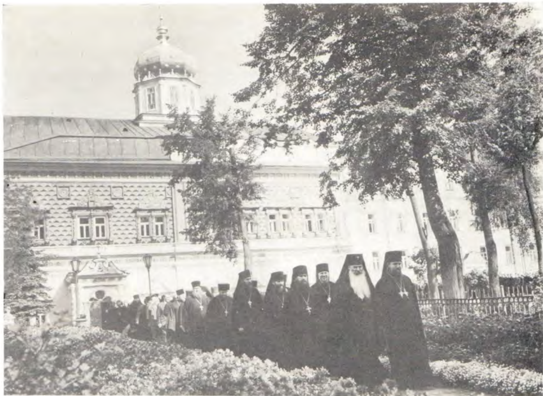
Начало учебного года в Московских Духовных школах 1 сентября 1981 года. Профессора, преподаватели и учащиеся Московских Духовных школ направляются в Троицкий собор Троице-Сергиевой Лавры для совершения молебна