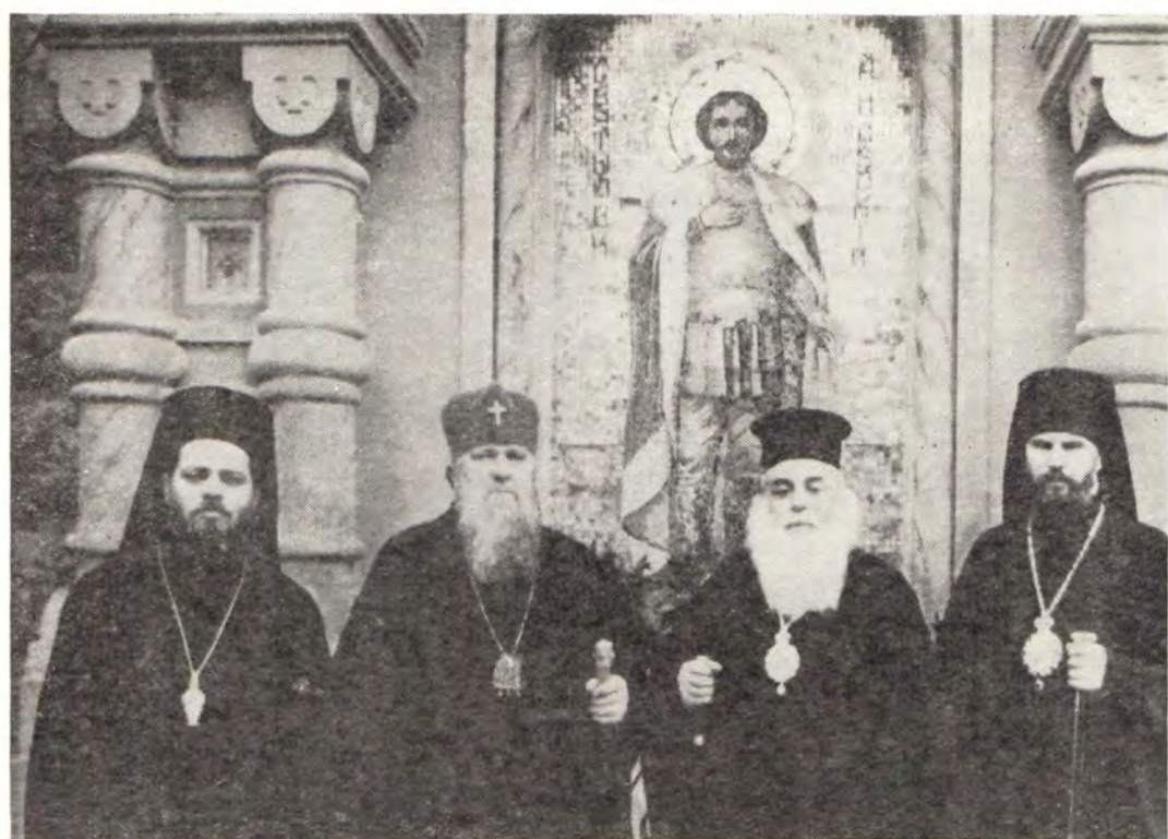
Архиепископ Симферопольский и Крымский Леонтий с митрополитом Василием Самой, архимандритом Нифоном (Антиохийская Православная Церковь) и епископом Звенигородским Валентином у храма во имя святого князя Александра Невского в г. Ялте 21 января 1981 года