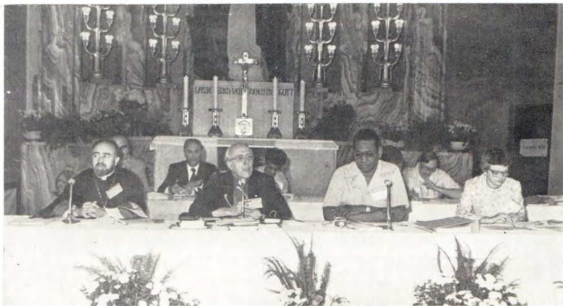
Президиум заседания. В центре: архиепископ д-р Эдвард Скотт, модератор Центрально-го комитета, и д-р Филип Поттер, генеральный секретарь ВСЦ