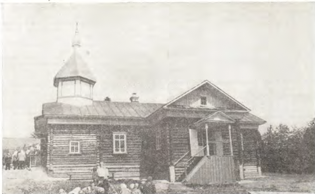
Вновь построенный Успенский храм в с. Бурдино Очерского района Пермской епархии