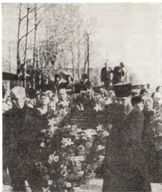
11 мая 1980 года. Возложение венка на могилы воинов от клира и прихожан кафедрального собора в г. Вологде

Посещения приходов епархии Владыкой Михаилом начались на первой неделе Великого поста. Своего нового архипастыря во всех храмах тепло приветствовали настоятели, церковные исполнительные органы и множество прихожан. Посвятив вечера первых дней седмицы Святой Четырдесятницы чтению Великого канона святого Андрея Критского в храмах города, Владыка в среду читал его в Крестовоздвиженском храме в г. Чирзовце, а в четверг — в Свято-Ильинском в г. Кадникове.