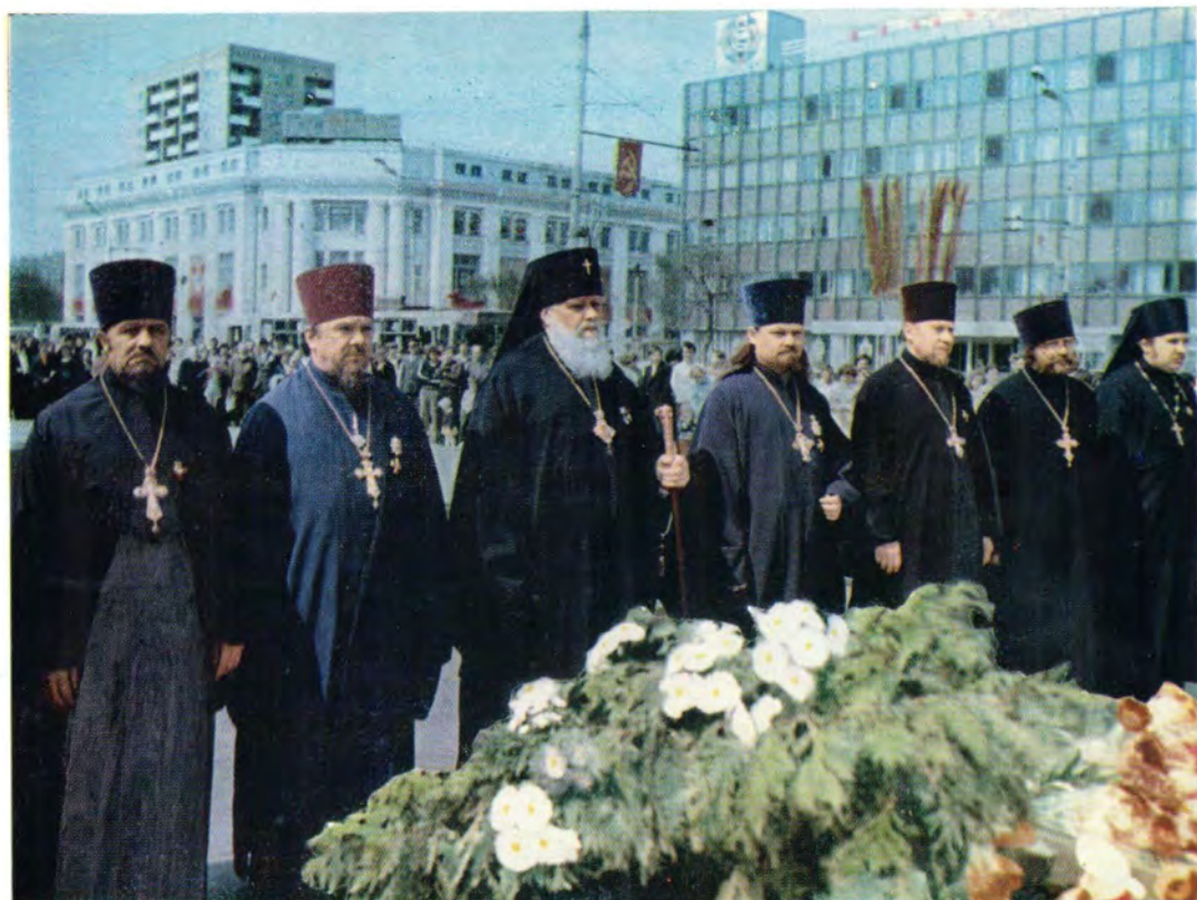
9 мая 1981 года. Архиепископ Орловский и Брянский Глеб с клириками Орловской епархии во время возложения венков к вечному огню в Сквере танкистов