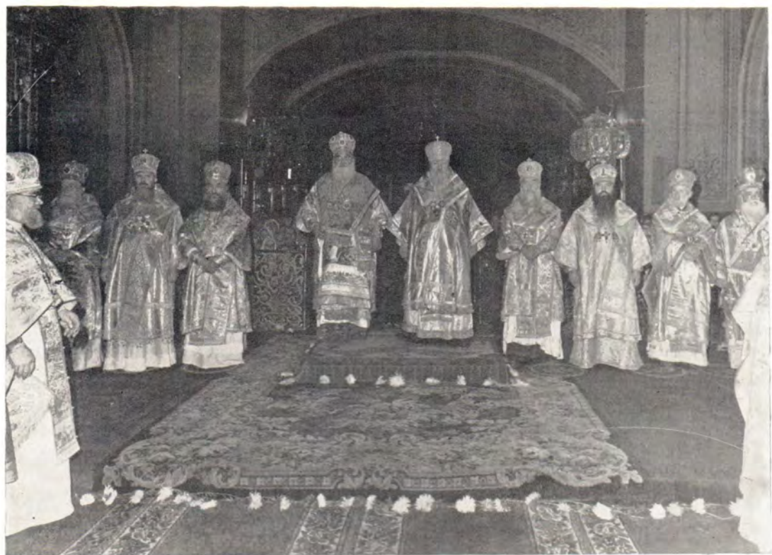
Блаженнейший Патриарх Диодор и Святейший Патриарх Пимен с иерархами и клириками Иерусалимской и Русской Православных Церквей за Божественной литургией в Богоявленском патриаршем соборе в Москве 9 сентября 1981 года, в день памяти преподобного Пимена Великого