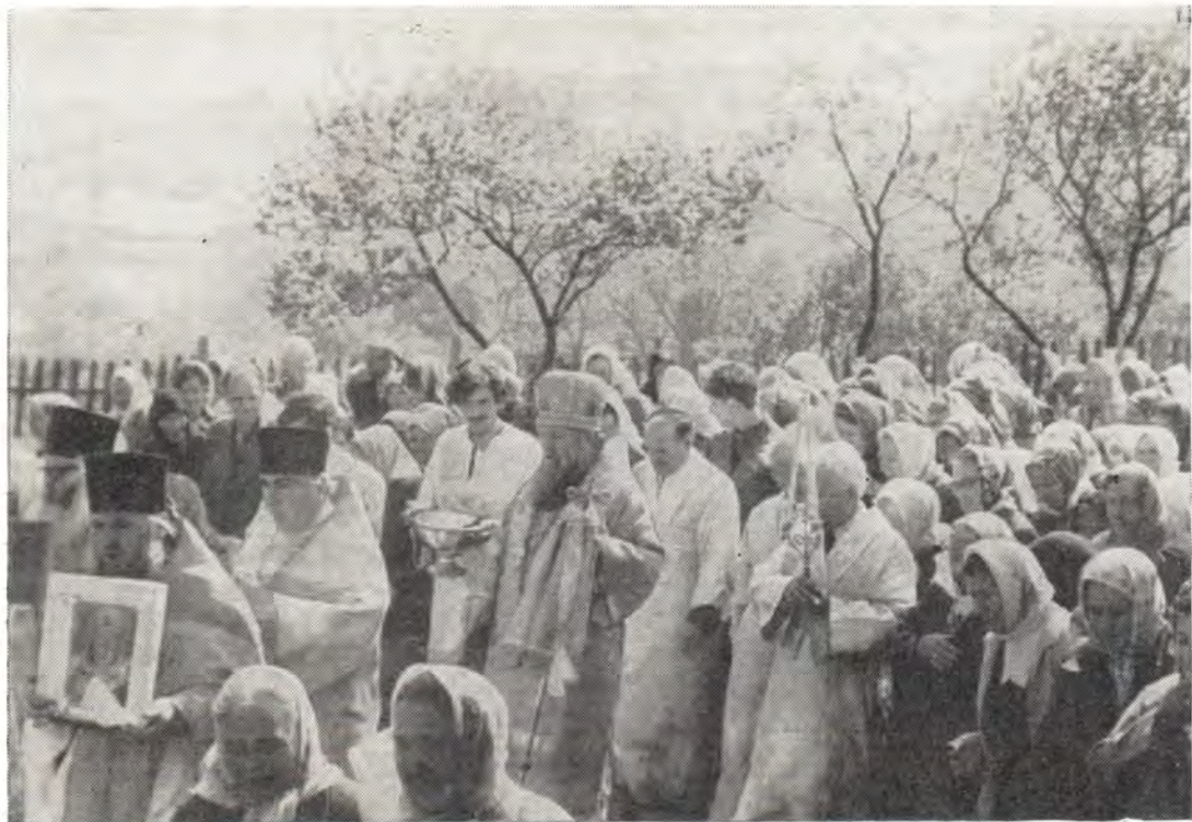
22 мая 1981 года, праздник Перенесения мощей Святителя Николая. Архиепископ Леонтий совершает крестный ход вокруг Никольского храма в с. Мазанке Крымской области

ства. В самый день праздника перед литургией духовенство и прихожане торжественно встречали своего архипастыря. Вход в храм и вся церковь были украшены розами и другими цветами, зелеными ветками.