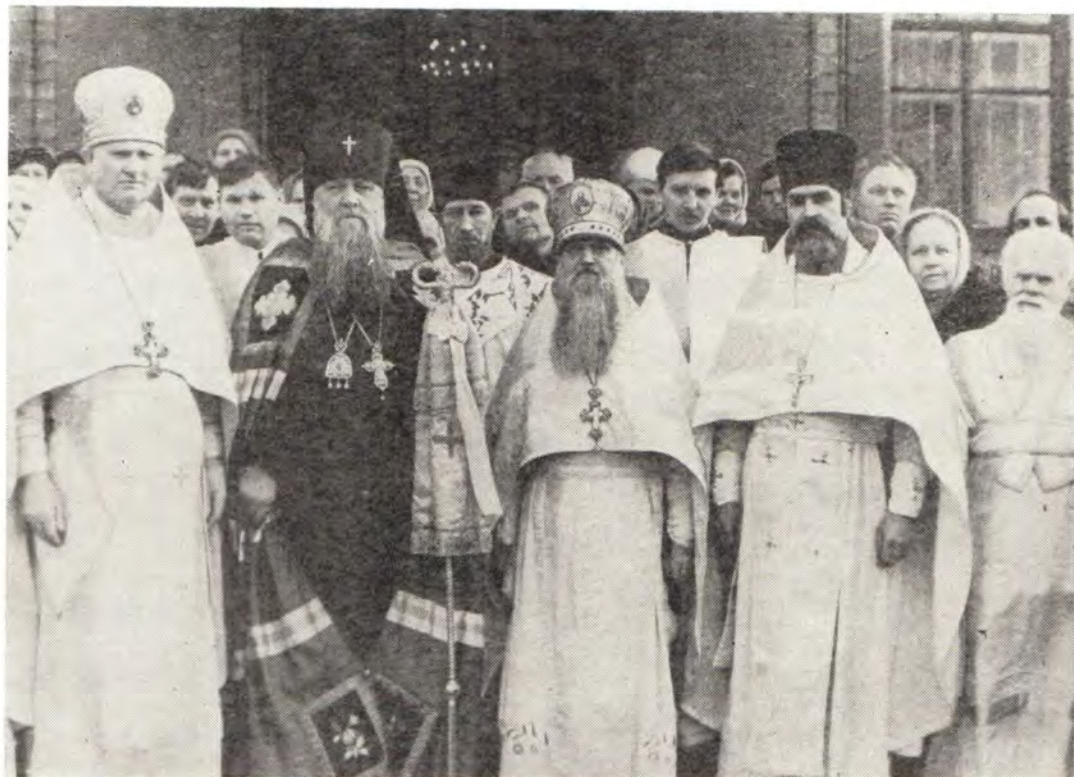
Архиепископ Симферопольский и Крымский Леонтий, временно управляющий Днепропетровской епархией, после литургии на второй день праздника Рождества Христова 1981 года у входа в храм в пос. Кулебовке г. Днепропетровска