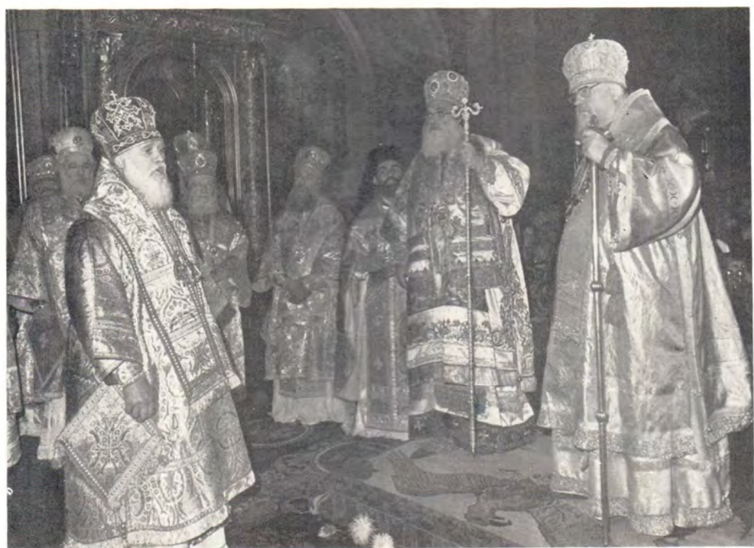
9 сентября 1981 года, день памяти преподобного Пимена Великого, в Богоявленском патриаршем соборе. Митрополит Киевский и Галицкий Филарет, Патриарший Экзарх Украины, поздравляет Святейшего Патриарха Пимена с днем Тезоименитства