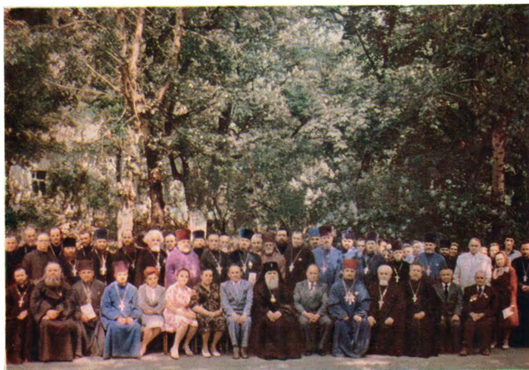
26 мая 1981 года. Собрание духовенства и председателей исполнительных органов храмов Орловской епархии