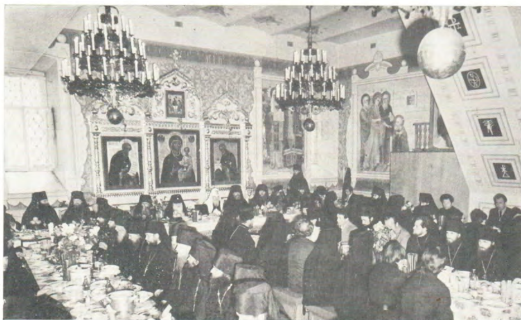
В престольный праздник Святой Троицы Святейший Патриарх Пимен среди братии Троице-Сергиевой Лавры