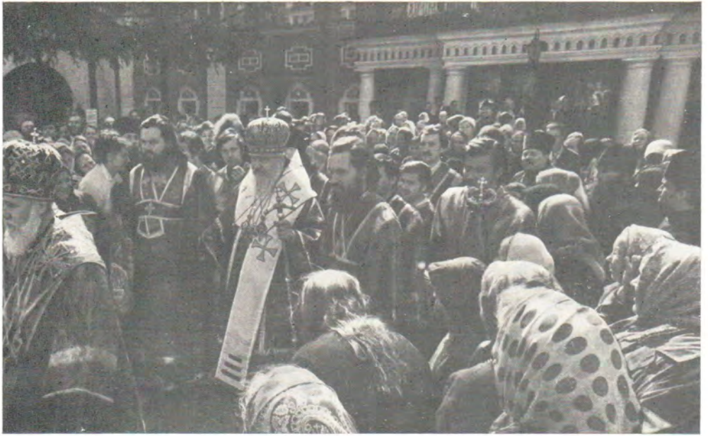
Праздник Обретения мощей Преподобного Сергия, 18 июля 1978 года в Троице-Сергиевой Лавре. После торжественной встречи Преосвященными архиереями и клириками при множестве богомольцев (снимок внизу) Святейший Патриарх Пимен направляется к Божественной литургии в Троицкий собор (верхний снимок)