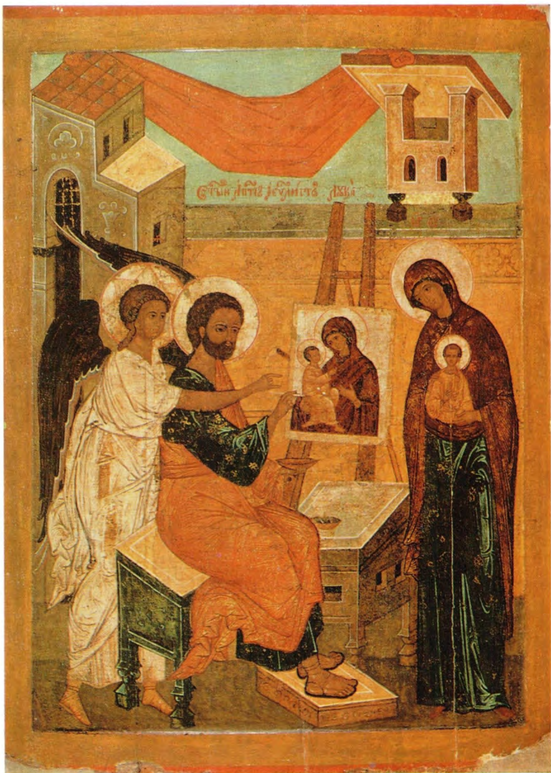
СВЯТОЙ АПОСТОЛ И ЕВАНГЕЛИСТ ЛУКА