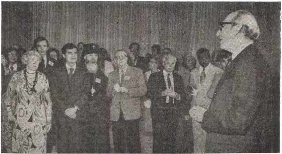
На приеме, устроенном Генеральным секретарем ООН д-ром Куртом Вальдхаймом для глав неправительственных делегаций

воли. Президент Всемирного Совета Мира Ромеш Чандра вручил Генеральному секретарю ООН Курту Вальдхайму послание, в котором сообщалось, что под новым Стокгольмским воззванием с требованием прекратить гонку вооружений подписались 600 миллионов человек из ста с лишним стран. Японская делегация (в составе 500 человек) привезла в ООН воззвание о запрещении ядерного оружия. Под воззванием подписались 20 миллионов человек. Ящики с подписями, весом 12 тонн, будут поставлены в ООН в Центре по разоружению. Газета «Нью-Йорк таймс» сообщала 28 июня с. г., что в ООН в Секретариат поступило 50 000 открыток из Советского Союза с требованием запретить нейтронную бомбу. Такое же количество писем с требованием начать разоружение поступило от членов Союза французских женщин. Тысячи других требований поступали из разных концов планеты. В самом Нью-Йорке на улице перед штаб-квартирой ООН 27 мая состоялось шестое мира, в котором приняли участие 15 000 человек. Перед зданием миссии США при ООН состоялась демонстрация протеста против политики гонки вооружений правительства США. Подобные демонстрации протеста проходили в разных городах США.