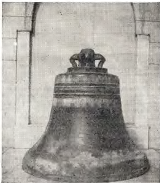
Русский колокол из г. Измаила

та, имеет высоту 240 сантиметров, вес его 400 пудов. Язык колокола, длиной 190 сантиметров, находится вдали от колокола — у южной монастырской стены. В декабре 1955 года Святейший Патриарх Московский и всея Руси Алексей подарил этот колокол Александрийской Православной Церкви для колокольной храма св. Саввы. Из-за громадного веса и большой силы звука колокол не мог быть повешен на небольшую колокольную. Его лишили языка и водрузили на небольшое каменное основание, покрытое белым мрамором. Представителю Измаила так и не пришлось звонко явить себя в Александрии. Он молчаливо, но величественно вещает о себе, о Земле Русской, русских умельцах, свидетельствует о братских связях между русским, греческим и арабским народами, проживающими в Египте.