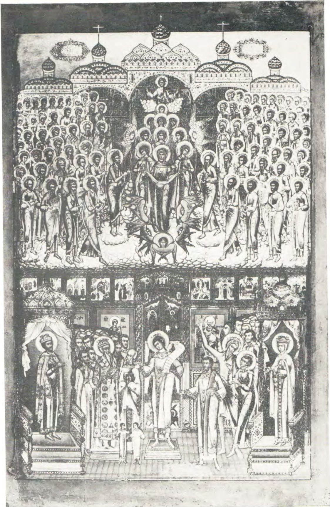
ИКОНА ПОКРОВА ПРЕСВЯТОЙ БОГОРОДИЦЫ