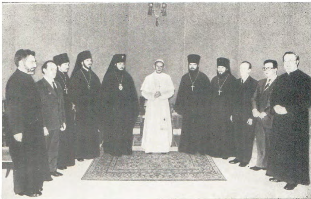
Делегация Русской Православной Церкви во главе с ректором Ленинградской духовной академии архиепископом Кириллом на приеме у Папы Павла VI 30 ноября 1977 года