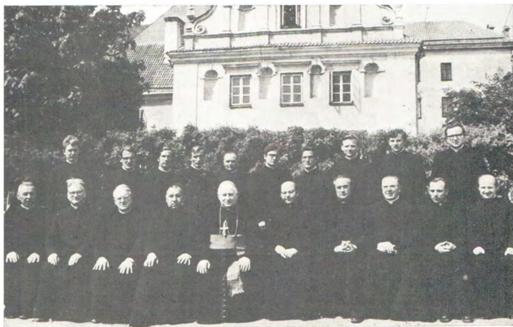
Преподаватели и студенты V курса Каунасской католической духовной семинарии. Май 1978 года