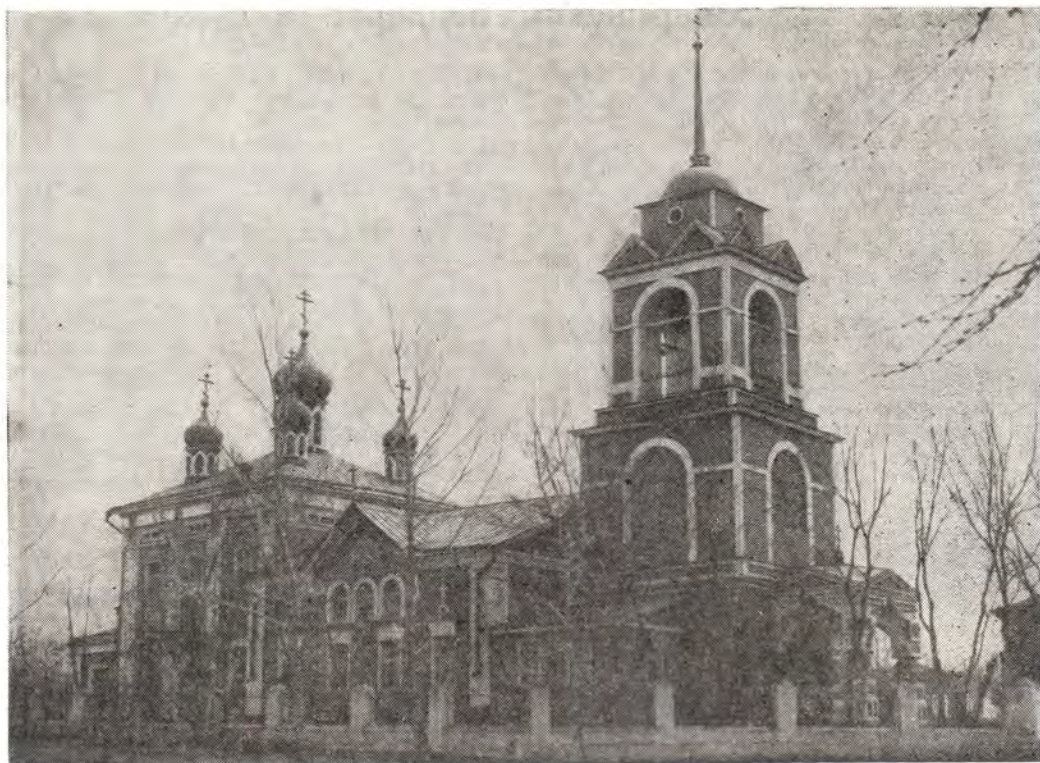
Храм в честь святых мучеников Флора и Лавра в г. Кашире Московской епархии