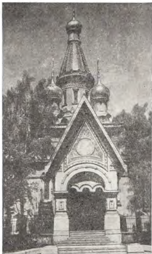
Храм во имя Святителя Николая в Софии

Третья зона охватывает остальное пространство вниз до покрытого масляной краской свода храма. В средней части, между двумя окнами, помещено большое изображение Пресвятой Богородицы с Богомладенцем в окружении Сид Небесных. Два ангела распростерли над Ней свои крылья, а за Ней легко, как