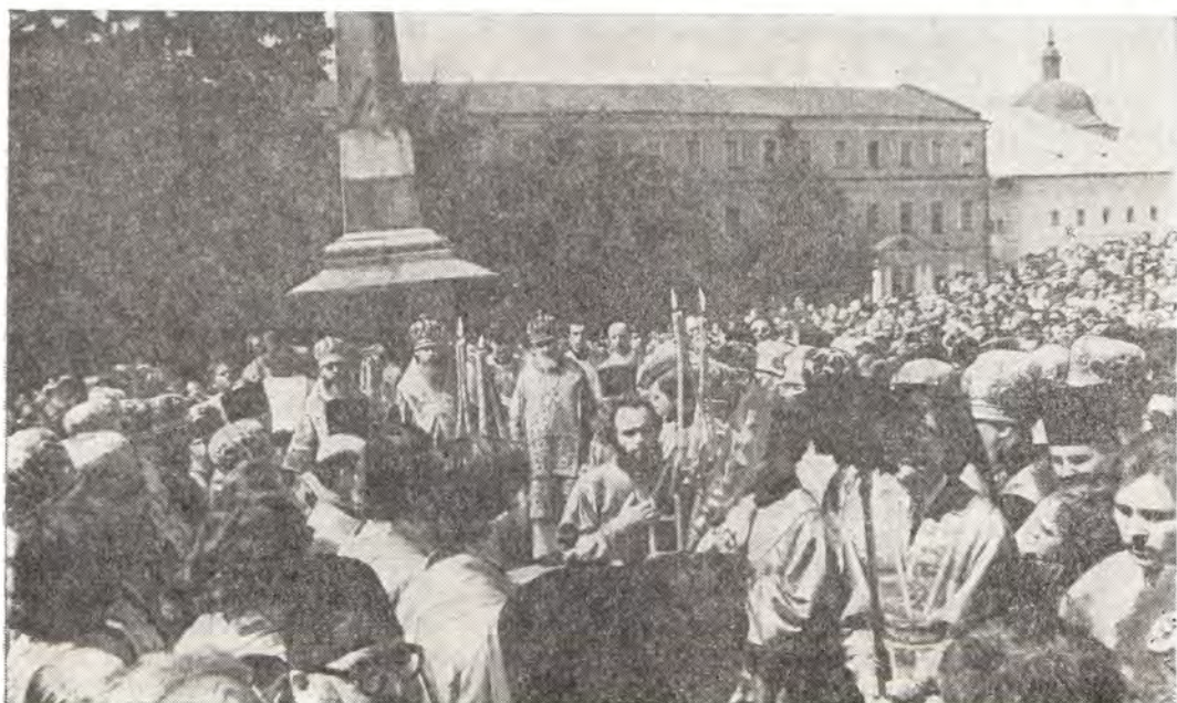
Троице-Сергиева Лавра. Праздничный молебен на лаврской площади, 18 июля 1978 года

Перед поздней литургией иерархи и клирики в облачениях пришли к патриаршим покоям — на торжественную встречу Святейшего Патриарха. Отсю-