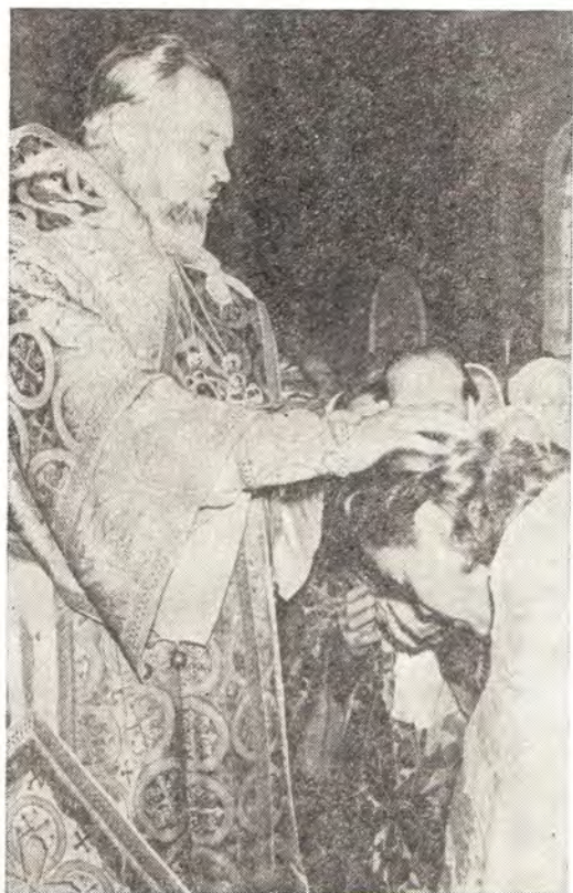
300-летие обращения мощей преподобного Аркадия Новоторжского (1677—1977) 13 сентября 1977 года в Михаило-Архангельском храме в г. Торжке. На верхнем фото: архиепископ Калининский и Кашинский Гермоген совершает чтение молитвы над клириками, удостоенными патриаршей награды — сана протоиерея. На фото внизу: крестный ход в ограде Михаило-Архангельского храма.