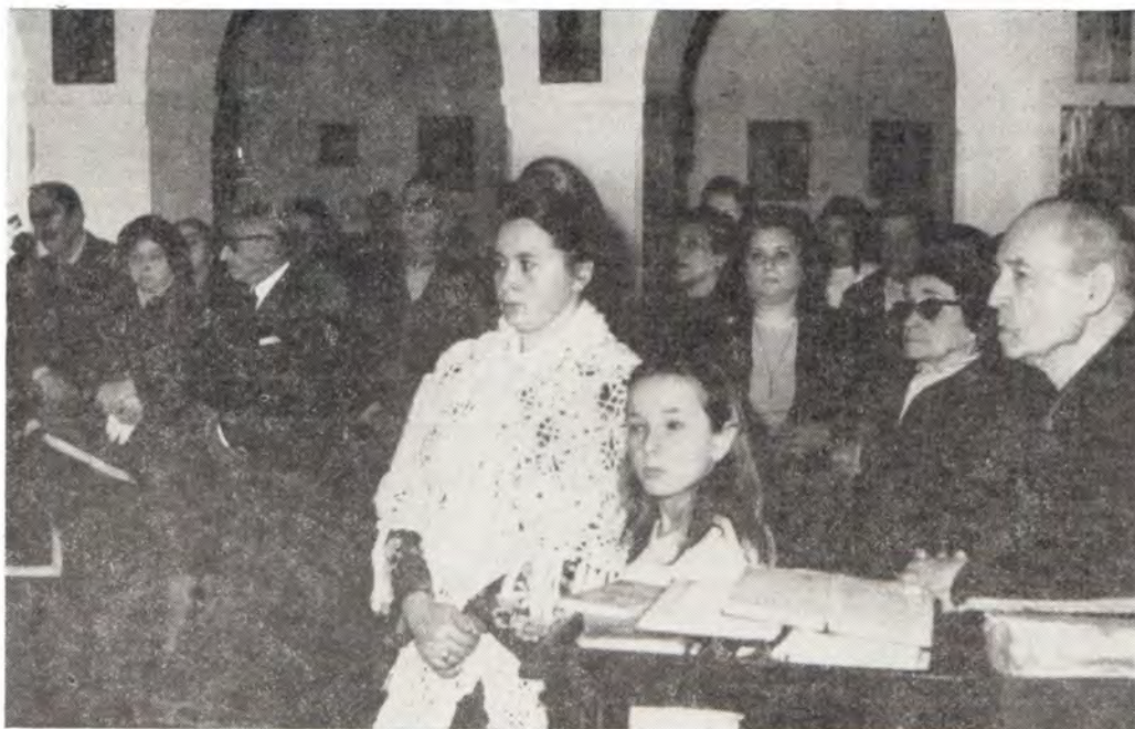
За Божественной литургией в русском патриаршем Александро-Невском храме-подворье в Александрии, АРЕ

После богослужения настоятель передал прихожанам благословение Святейшего Патриарха Пимена и каждому вручил от имени Его Святейшества памятные нательные крестики и медальоны с изображением Божией Матери. Настоятель также передал прихожанам благословение и добрые пожелания митрополита Крутицкого и Коломенского Юве-