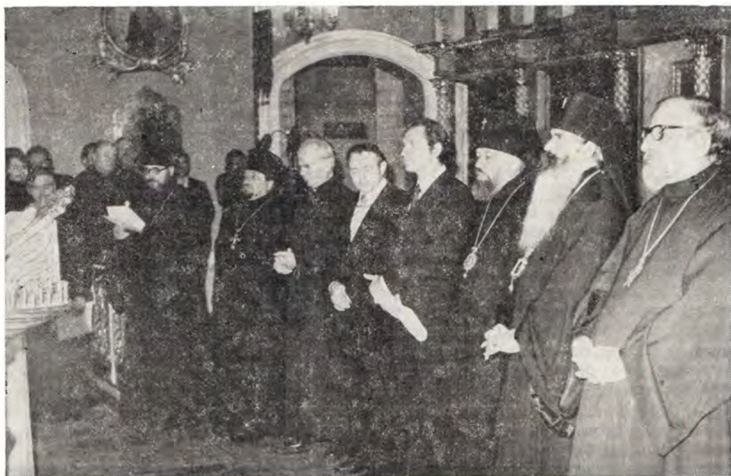
Участники экуменической молитвы в Покровском храме Московской духовной академии

испокон веков каждый день в мирной ектении молится о соединении всех христиан. Но сравнительно недавно возникли особые молитвы, особые чины таких молитв, в которых христиане обращаются за помощью в их собственных трудах на пути единения.