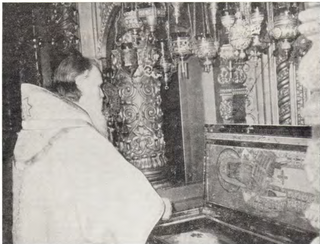
Святейший Патриарх Пимен у раки святителя Московского Алексия

5 марта (20 февраля), в Неделю мясопустную, о Страшном суде, Святейший Патриарх Пимен совершил в патриаршем соборе Божественную литургию вместе со Святейшим и Блаженнейшим Католикосом-Патриархом всей Грузии Илией II в сослужении иерархов Русской и Грузинской Православных Церквей — митрополитов Тетрицкаройского Зиновия, Таллинского и Эстонского Алексия, Крутицкого и Коломенского Ювеналия, Одесского и Херсонского Сергия, Урбнисского Гайоза, Алавердского Григория, Минского и Белорусского Антония, епископа Сухумского и Абхазского Николая. Возгласы за литургией произносились на