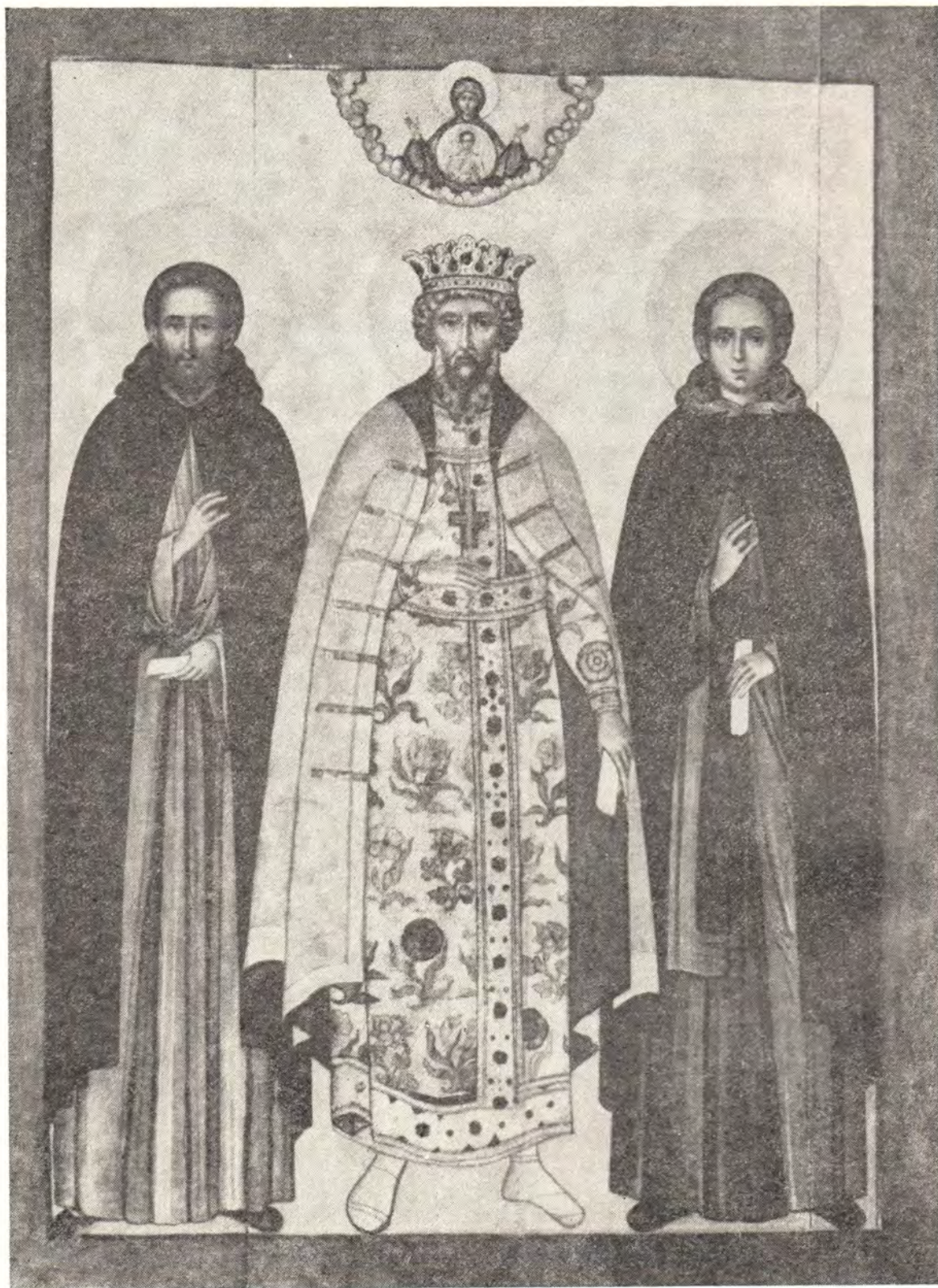
300-летие обретения мощей преподобного Аркадия Новоторжского (1677—1977) Преподобный Аркадий Новоторжский (справа), святой равноапостольный князь Влади- мир (в центре) и преподобный Моисей Угрин

Икона, написанная Симоном Ушаковым в 1677 году