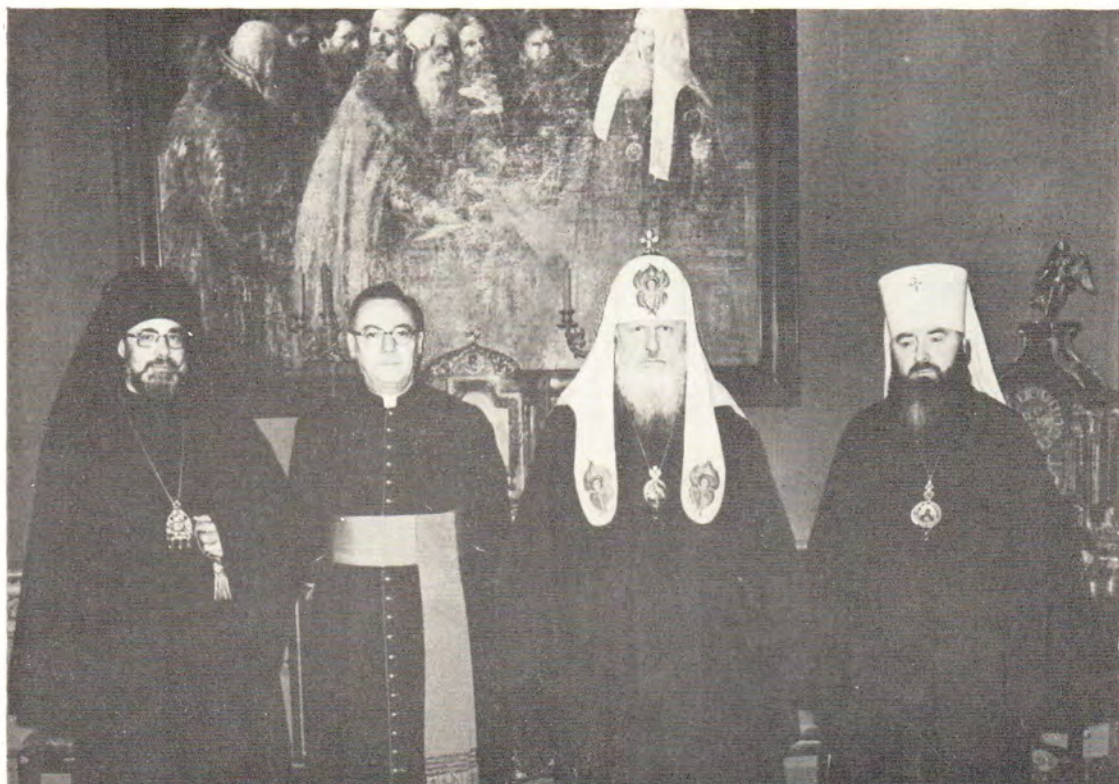
13 февраля 1978 года Святейший Патриарх Московский и всея Руси Пимен принял ректора Парижского католического института монсеньора Павла Пупара и епископа Корсунского Петра. Справа от Святейшего Патриарха — митрополит Крутицкий и Коломенский Ювеналий. К стр. 9