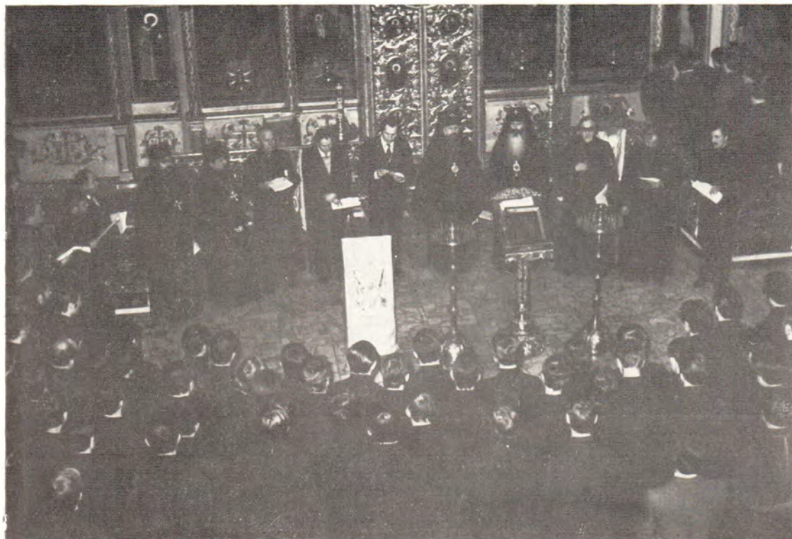
Внизу: экуменическая молитва в храме Московской духовной академии 16 февраля 1978 года К стр. 57