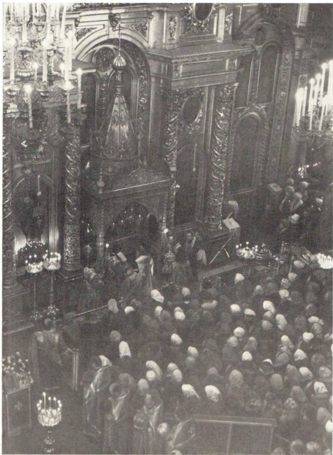
Богоявленский патриарший собор. Святейший Патриарх Пимен читает молитву у раки с мощами святителя Московского Алексия