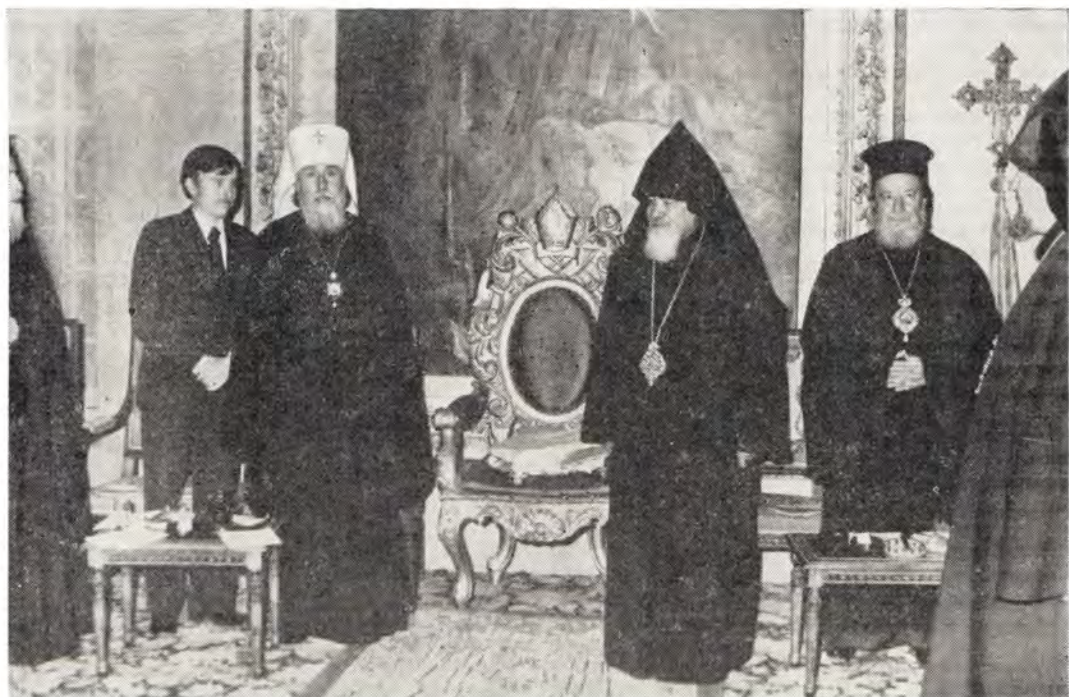
13 апреля 1977 года, Святой Град Иерусалим. В центре — Блаженнейший Армянский Иерусалимский Патриарх Егише Тертерян и митрополит Одесский и Херсонский Сергей

ния, которое они несут во славу нашей Русской Церкви.