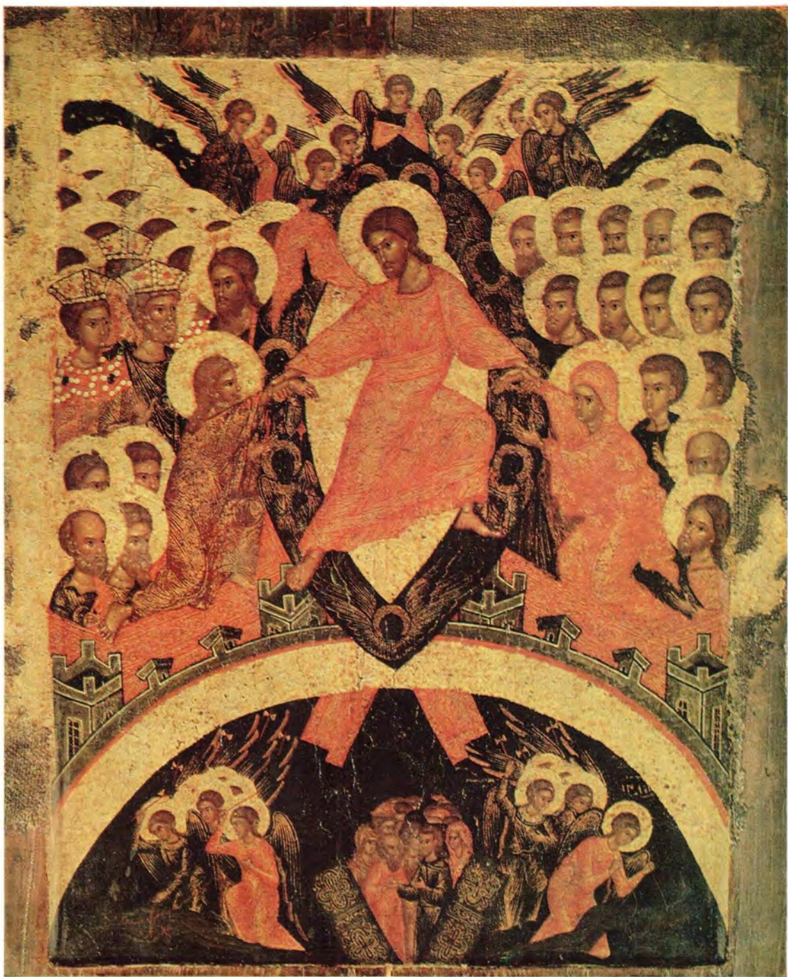
ИКОНА ВОСКРЕСЕНИЯ ГОСПОДА НАШЕГО ИИСУСА ХРИСТА