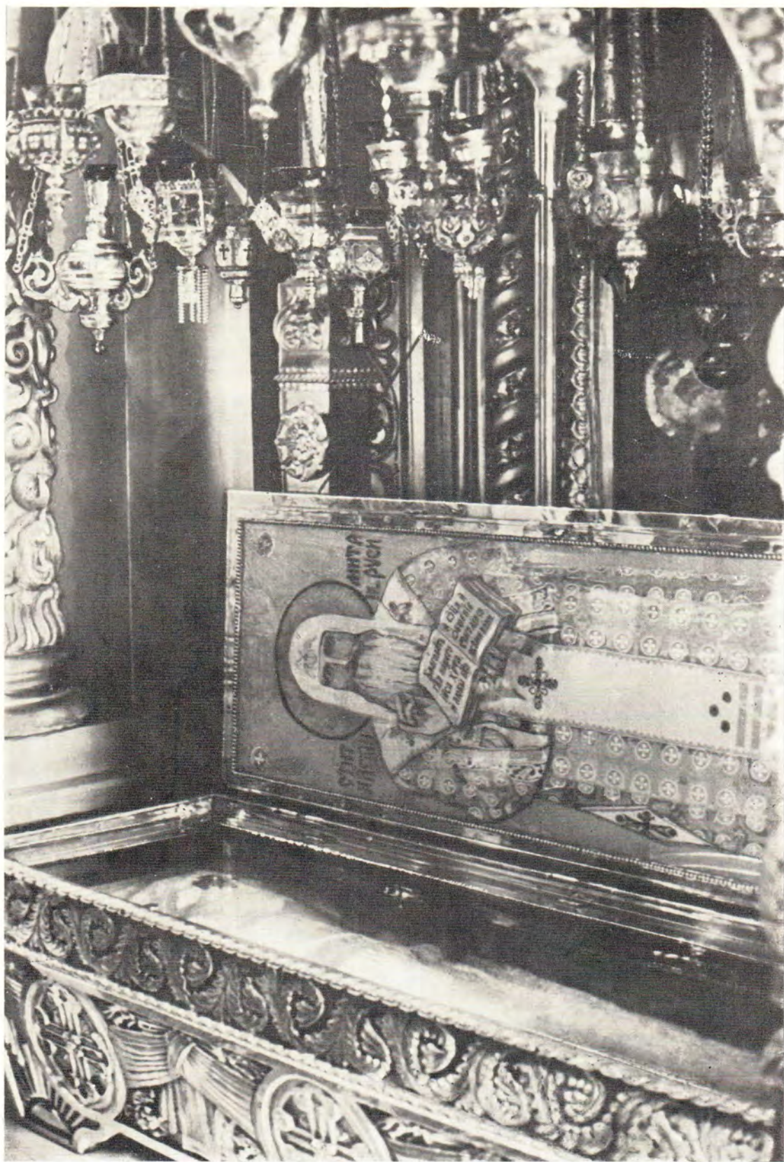
Богоявленский патриарший собор. Рака святителя Московского Алексия