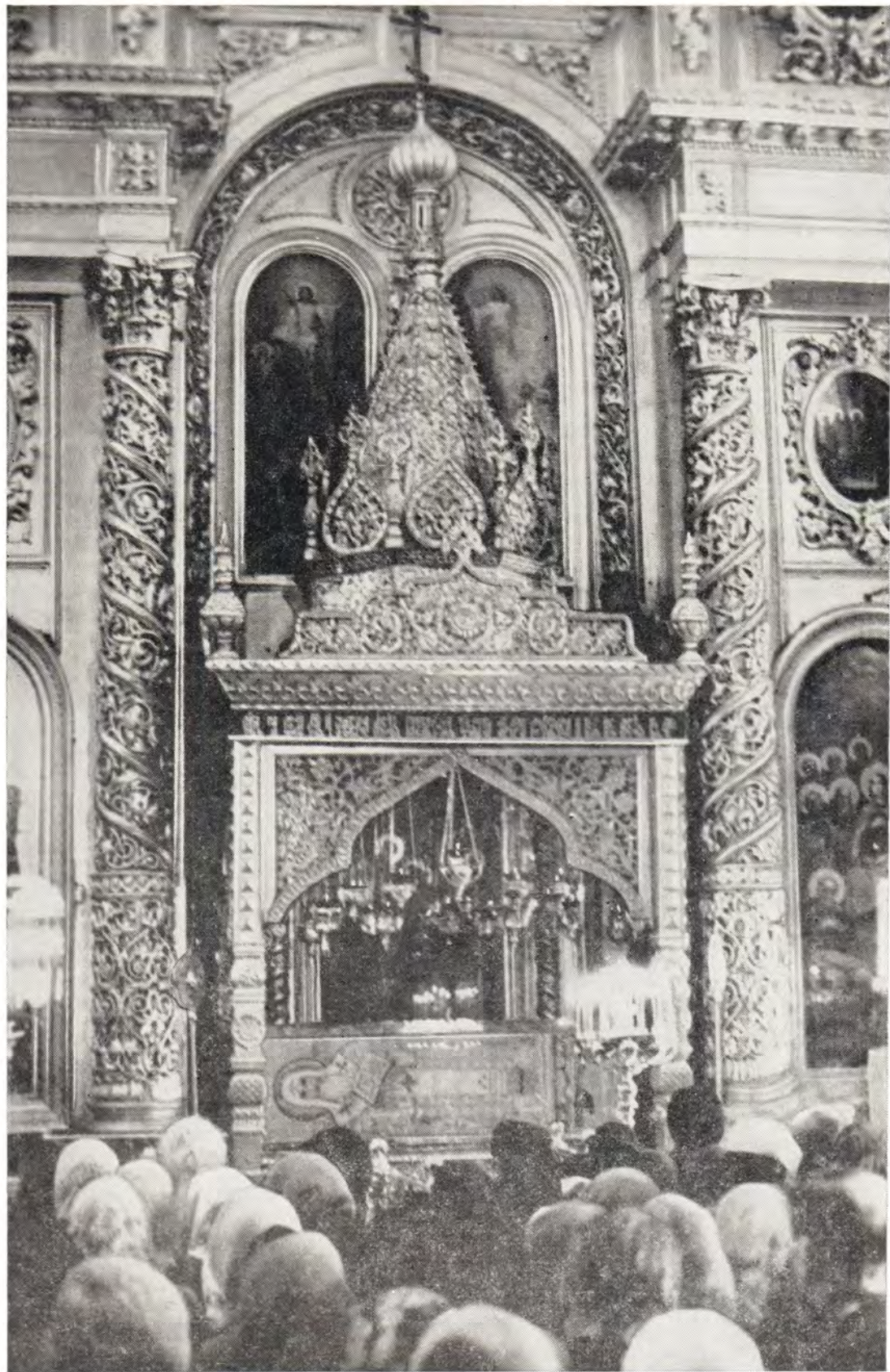
В Богоявленском патриаршем соборе за богослужением в праздничный день. В центре — рака святого Московского Алексия