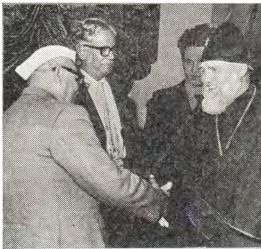
17 декабря 1974 года. Делегацию христианских Церквей Советского Союза приветствует главный министр штата Дели г-н Радхараман

Это один из промышленных городов Индии с населением в 2 миллиона человек. В аэропорту делегацию встречали архиепископ Римско-Католической Церкви Пакиама Арокиасвами, епископ Церкви Южной Индии К. Гилл, представитель Малабарской Церкви священник Коши Адабара и другие. Архиепископ Бенгалурский Пакиама Арокиасвами предложил делегации остановиться в его резиденции. В честь делегации он устроил обед, на котором присутствовали министр продовольствия штата Карнатака г-жа Ева Ваз, епископ К. Гилл, а также духовенство Римско-Католической Церк-