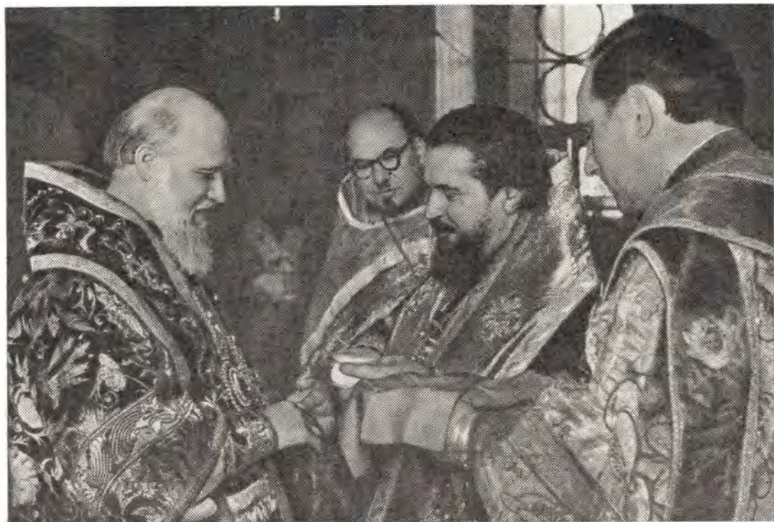
Архиепископ Харьковский и Богодуховский Никодим приветствует митрополита Киевского и Галицкого, Патриаршего Экзарха Украины, Филарета после Божественной литургии в Благовещенском кафедральном соборе в Харькове 2 февраля 1975 года (к с. 17)