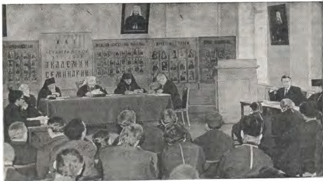
Магистерский диспут в Актовом зале ЛДА