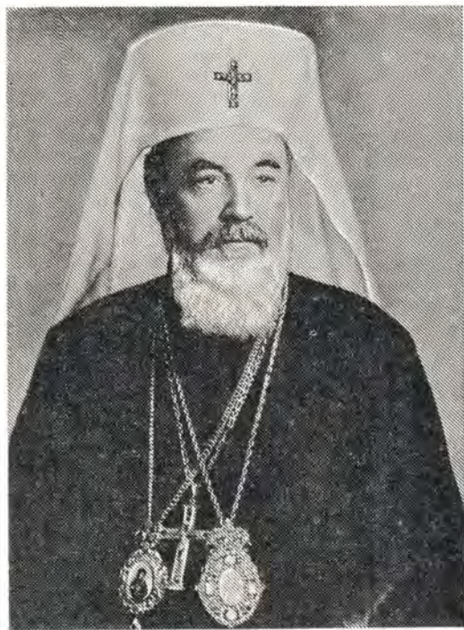
Святейший Патриарх Болгарский Кирилл

ла занимает его обширная литературная деятельность. Совершая неоднократные поездки за границу, Святейший Патриарх всегда находил время для научной работы в библиотеках Москвы, Ленинграда, Белграда, Берлина, Будапешта, Вены, Парижа, Праги. По его заказу московские и ленинградские государственные книгохранилища подготовили ряд фотокопий редких архивных материалов, которые им были использованы для его научных трудов.