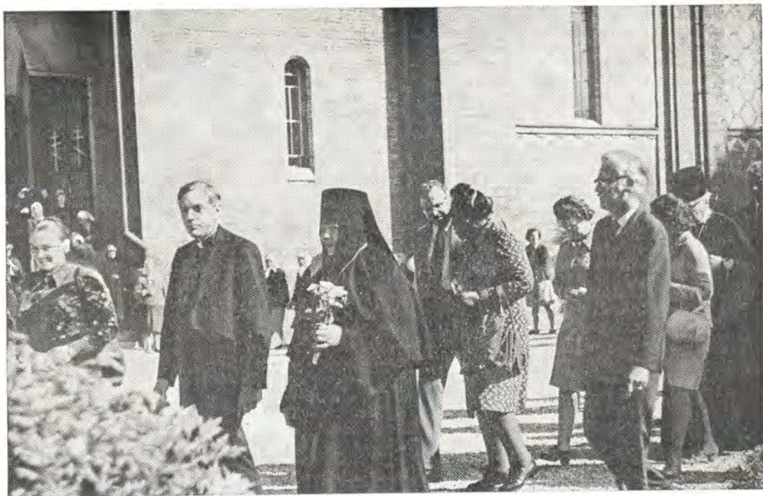
Члены делегации Национального Совета Церквей Христа в США в Пюхтицком Успенском женском монастыре (Таллинская епархия)