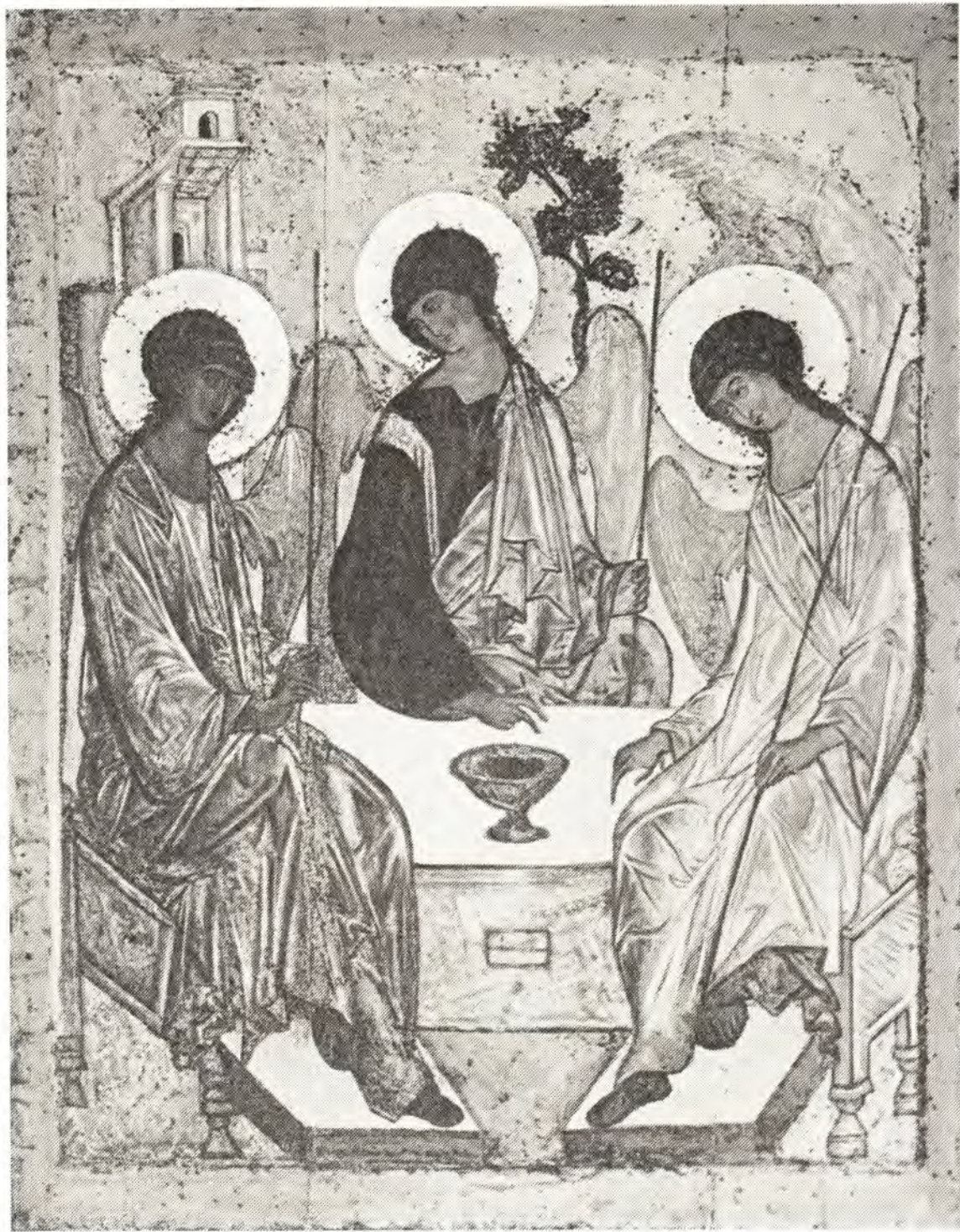
ЖИВОНАЧАЛЬНАЯ ТРОИЦА Икона преподобного Андрея Рублева