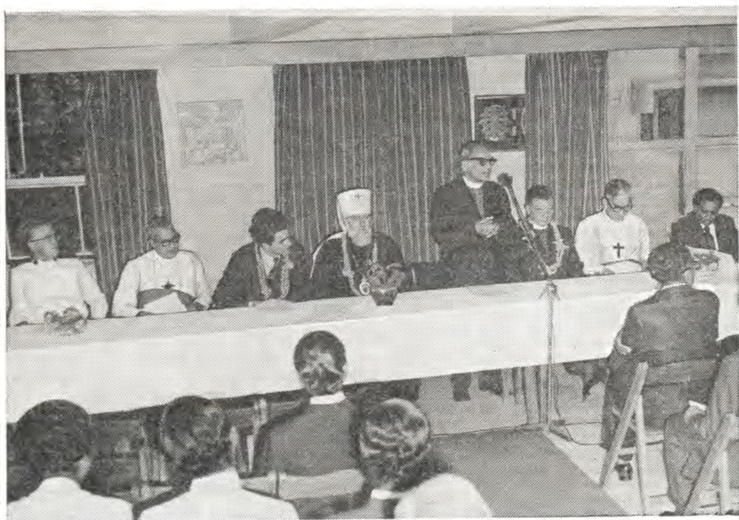
На собрании церковной общественности Бомбея 29 декабря 1974 года с приветствием выступает епископ Методистской Церкви Р. Д. Джоши. Справа от него — глава делегации митрополит Филарет, слева — архиепископ Янис Матулис

теля Русской Православной Церкви. Митрополит Филарет от имени делегации поблагодарил участников Ассамблеи за честь присутствовать на открытии этого студенческого форума, который будет обсуждать важную тему современности «Свобода и авторитет». Он особенно подчеркнул важность христианского взгляда на свободу человека и предостерег от злоупотребления этим великим даром Божиим, данным человеку.