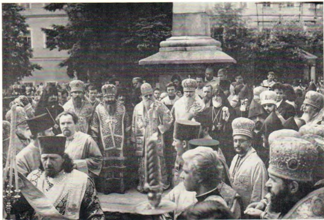
Праздник Обретения мощей Преподобного Сергия Радонежского в Троице-Сергиевой Лавре 18 июля 1974 года. Вверху: молебен на лаврской площади. Рядом со Святейшим Патриархом Пименом — Блаженнейший Папа и Патриарх Александрийский Николай VI, Верховный Патриарх-Католикос всех армян Вазген I и Иерусалимский армянский Патриарх Егише Дардарян. Внизу: Блаженнейший Патриарх Николай, Святейший Патриарх Пимен, иерархи Александрийской и Русской Православных Церквей за Божественной литургией в Успенском соборе Лавры 18 июля 1974 г.