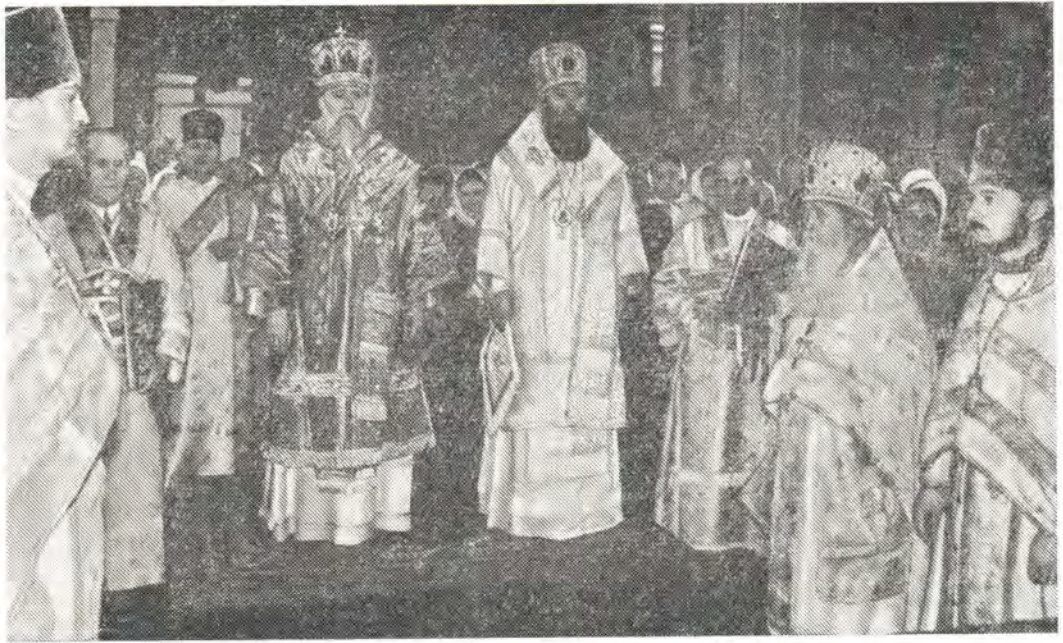
Митрополит Киевский Филарет и архиепископ Симферопольский Леонтий за Божественной литургией в Свято-Троицком кафедральном соборе в Симферополе 9 июня 1974 года

могилах Пресвященных Симферопольских митрополита Гурья († 12 июля 1965) и архиепископа Луки († 11 июня 1961) заупокойную литию. Затем митрополит Филарет благословил прихожан.