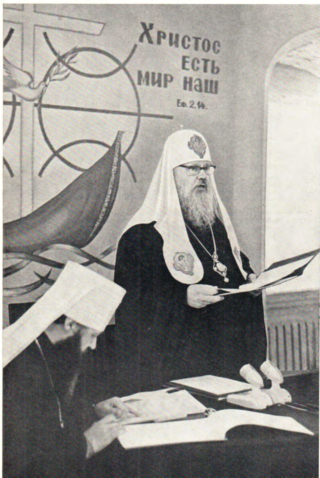
Выступает Святейший Патриарх Московский и всея Руси ПИМЕН