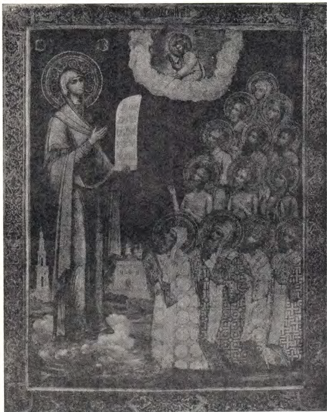
БОГОЛЮБСКАЯ ИКОНА БОЖИЕЙ МАТЕРИ. XIX век

В храме Воскресения Слоущего, что на Успенском Вражке в Москве