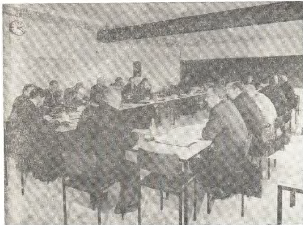
На богословском собеседовании

На следующий день, помимо пленарных заседаний, состоялась пресс-конференция с представителями прессы, радио и телевидения. Пресс-конференцию открыл Архиепископ д-р Мартти Симойоки, который рассказал о собеседовании и представил участников встречи. Затем выступил архиепископ Дмитровский Владимир. Он, в частности, отметил, что в добрых и дружественных отношениях между Русской Православной Церковью и Евангелическо-Лютеранской Церковью Финляндии особое значение имеют ставшие систематическими собеседования. Они служат не только развитию церковных отношений, но также являют-