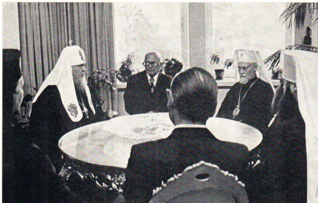
Святейший Патриарх Пимен на приеме у Президента Финляндской Республики Урхо Калева Кекконена 9 мая 1974 года