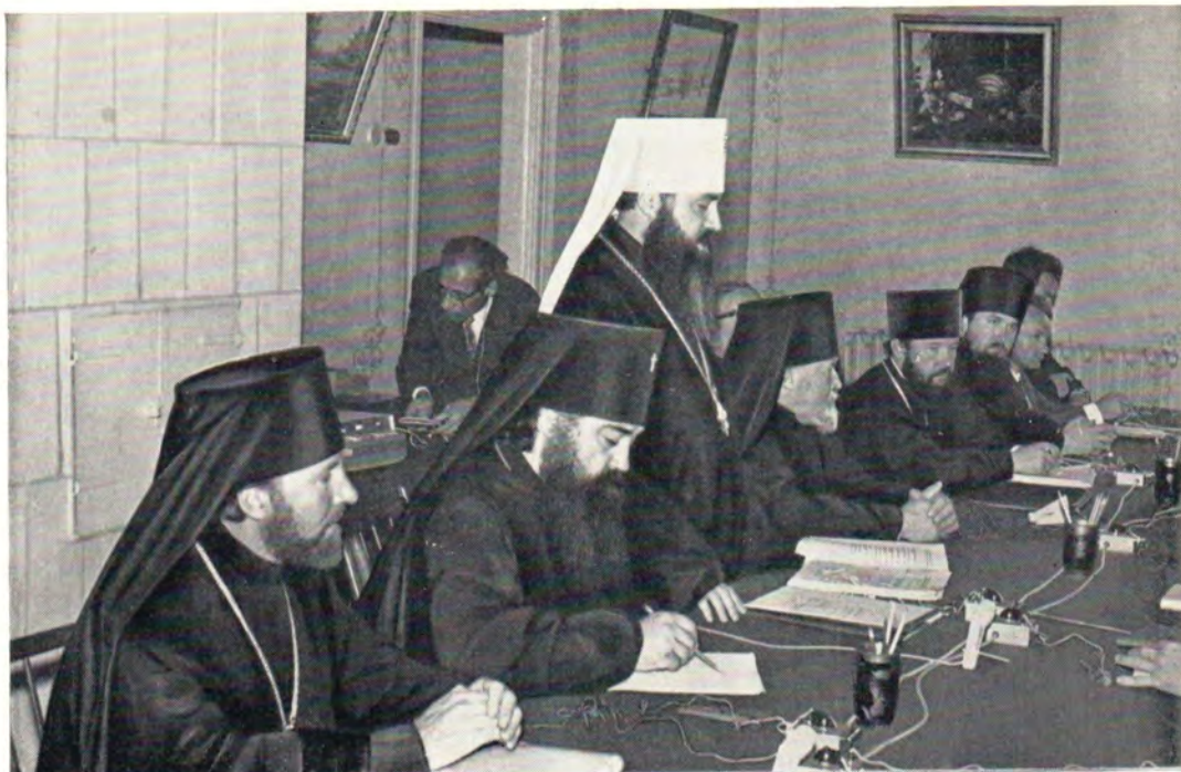
Богословское собеседование между представителями Союза Евангелических Церквей в ГДР и Русской Православной Церкви в Загорске 8—11 июля 1974 года. На верхнем снимке: митрополит Тульский и Белевский Ювеналий открывает собеседование. Внизу: участники собеседования перед входом в академический храм