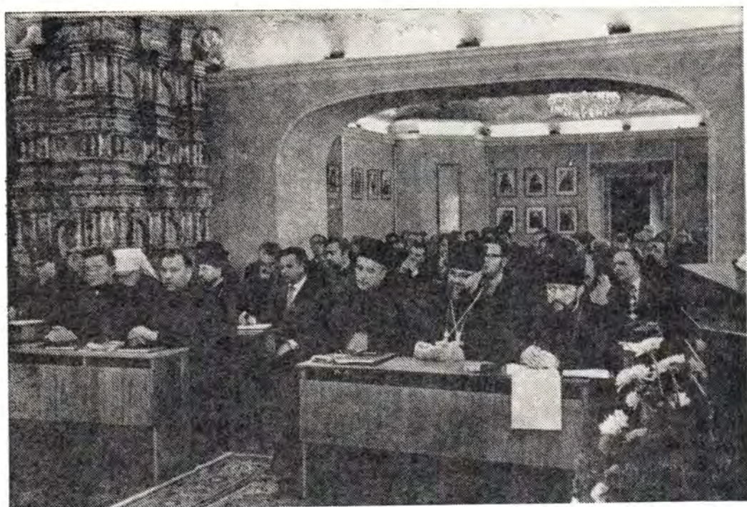
Участники встречи в зале заседаний