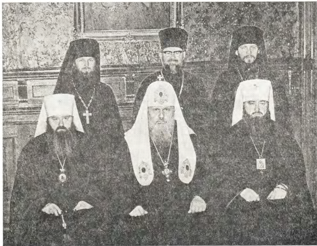
Святейший Патриарх Московский и всея Руси Пимен с группой сопровождающих его лиц перед отъездом в Финляндию в Московской Патриархии 2 мая 1974 года