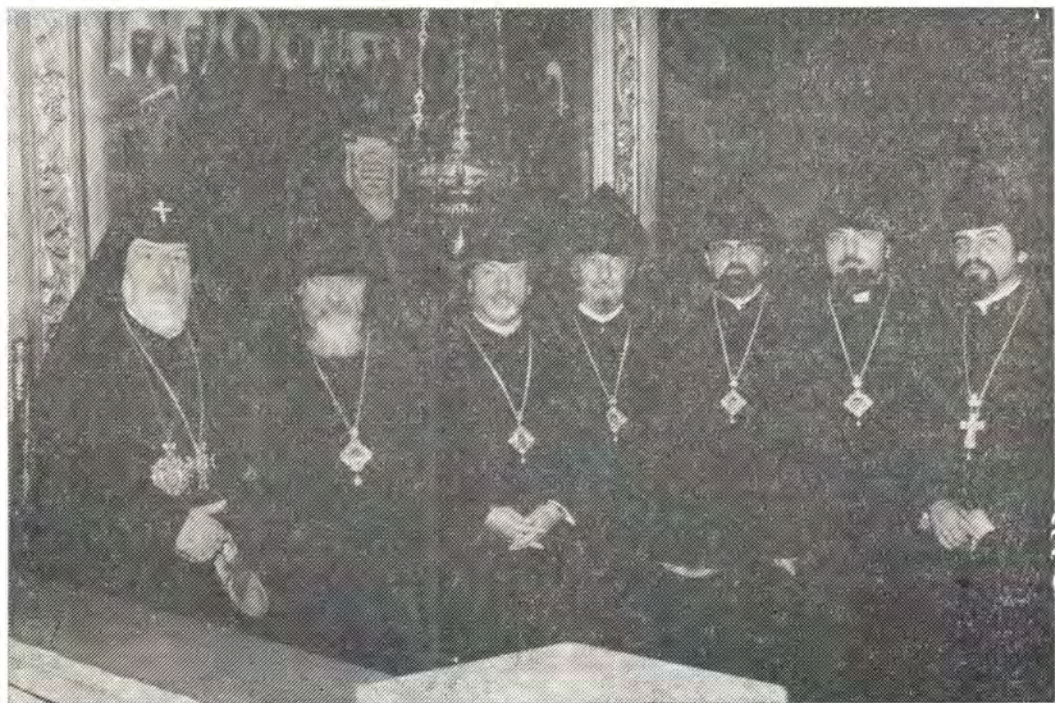
Иерархи Армянской Церкви во главе с Патриархом-Католикосом Вазгеном I

Мы воодушевлены единодушием нашим в этом служении с братской Армянской Апостольской Церковью, не-