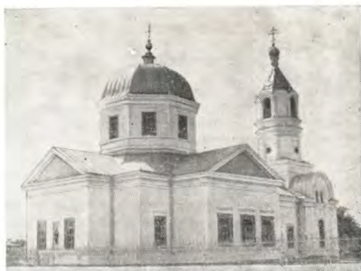
Собор в честь Покрова Пресвятой Богородицы в г. Килия Одесской епархии