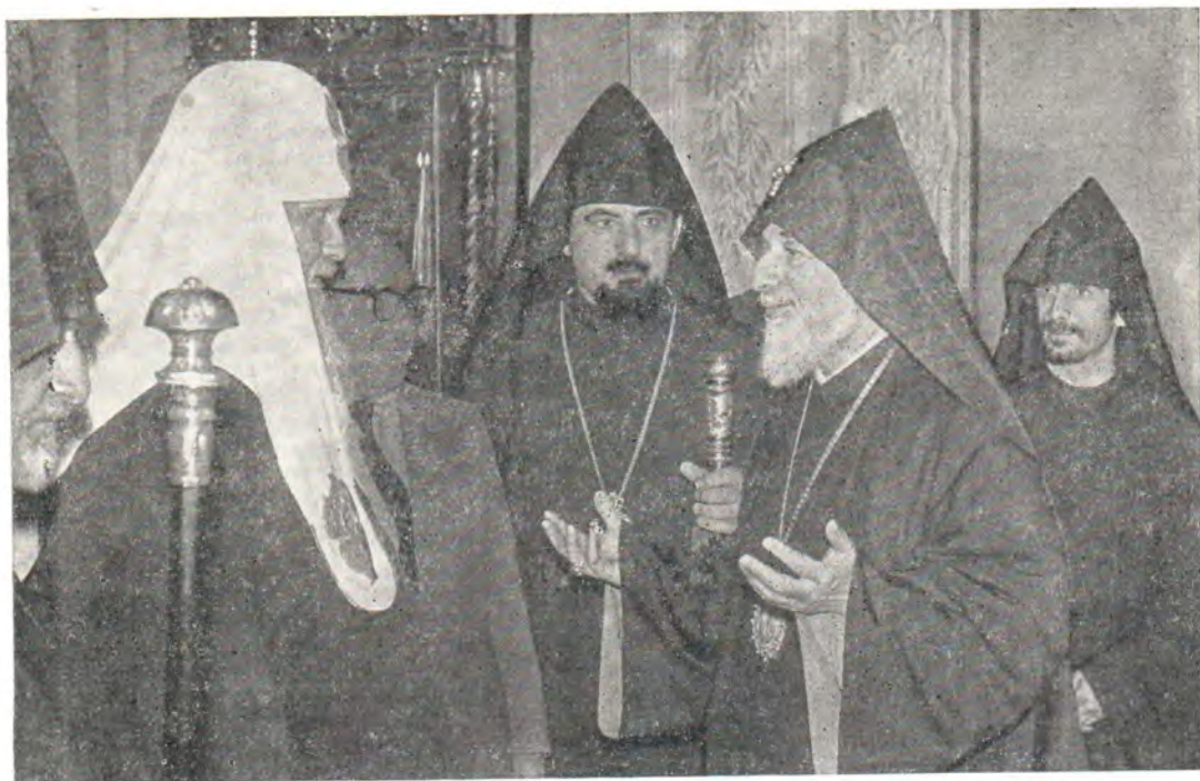
Святейший Патриарх Московский и всея Руси Пимен и Святейший Патриарх-Католикос всех армян Вазген I

стиан совместно трудиться на благо мира во всем мире.