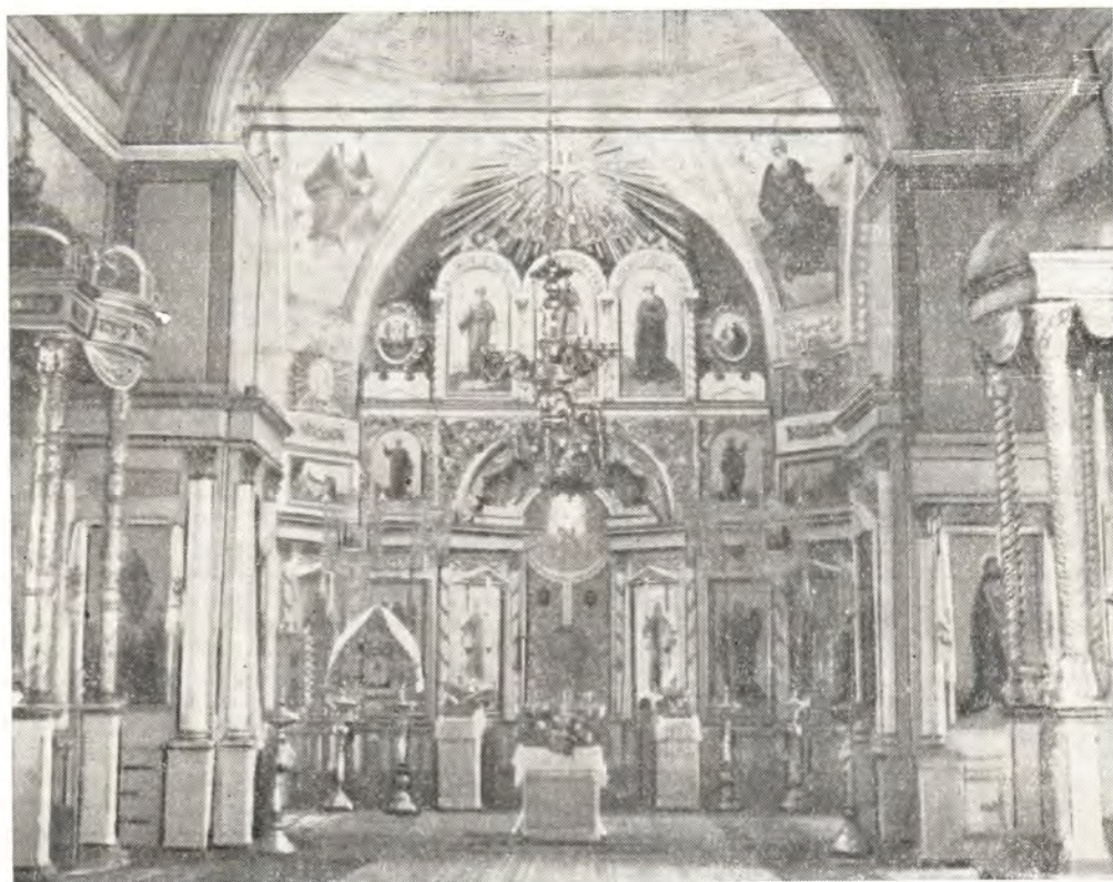
Внутренний вид Покровского собора в г. Килия