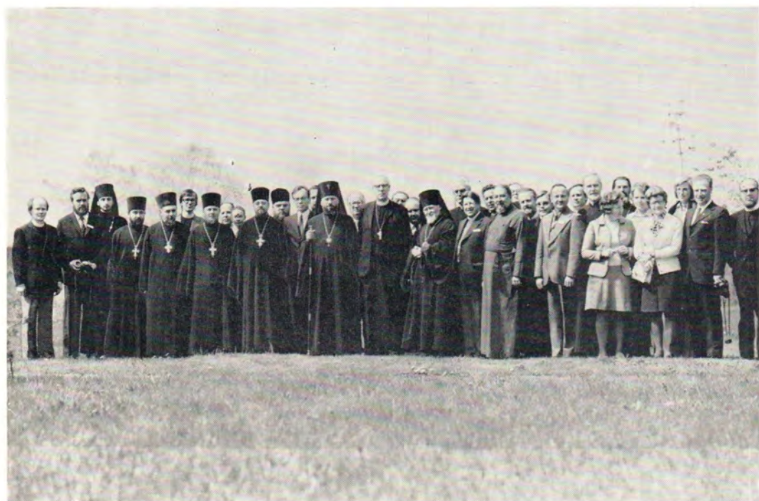
Участники III богословского собеседования между представителями Русской Православной Церкви и Евангелическо-Лютеранской Церкви в Финляндии. В центре — Архиепископ Мартти Симойоки и архиепископ Дмитровский Владимир