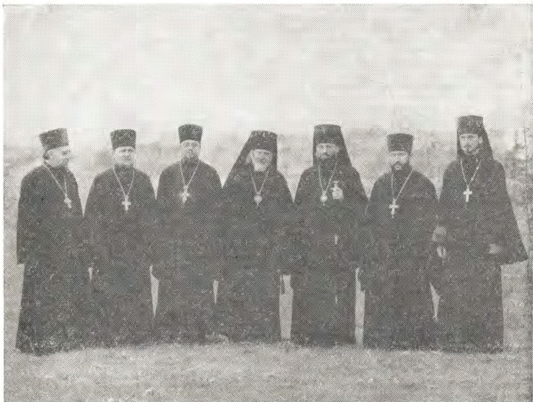
Делегация Русской Православной Церкви в Финляндии