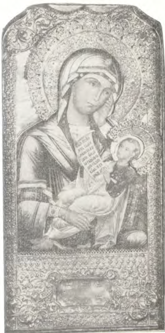
Икона Божией Матери, именуемая «Утоли моя печали», из леоновского храма. XVIII в.

Интересна по композиции одна из икон Покрова Божией Матери, находящаяся в правом,