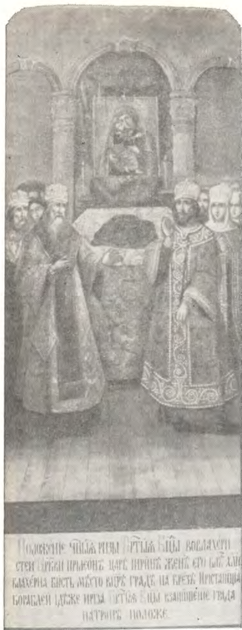
Престольный образ леоновского храма «Положение честных ризы Пресвятыя Богородицы во Влахернстей церкви». XIX в.