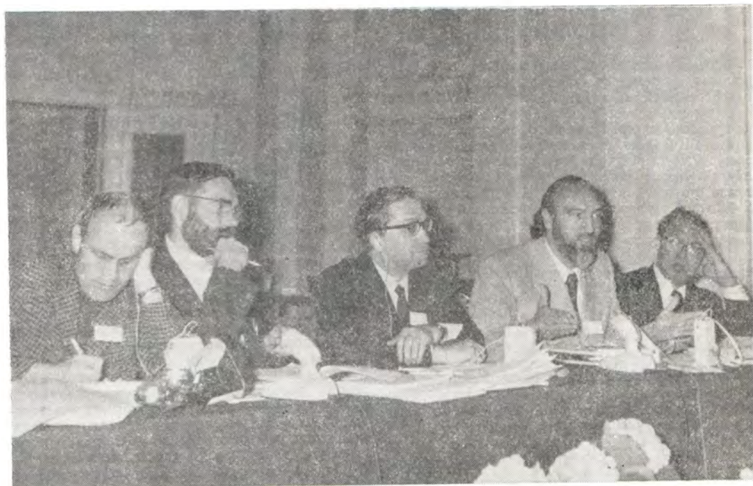
Сессия Комитета по продолжению работы Христианской Мирной Конференции в Москве, 25—28 мая 1973 года. Заседание группы по международным вопросам.