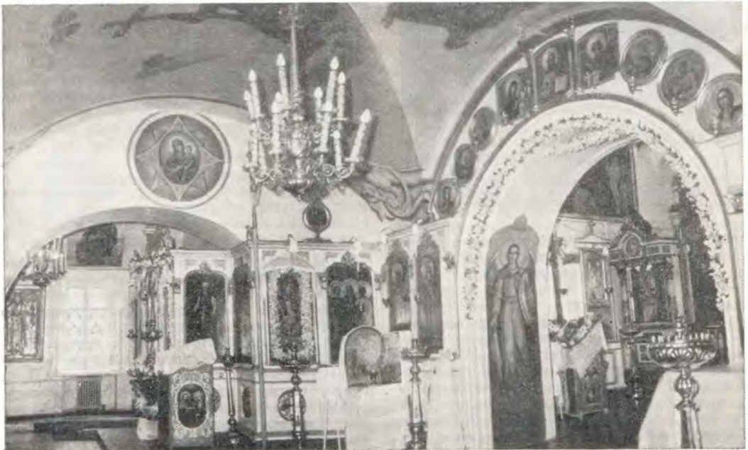
Внутренний вид леоновского храма. Слева—арка придела в честь иконы Божией Матери «Неопалимая Купина»

После этого случая Хованский обратился в Синод с ходатайством о разрешении построить новую, каменную церковь. Но каменное строительство, по указу 1714 года, в ту пору было запрещено повсеместно, кроме Санкт-