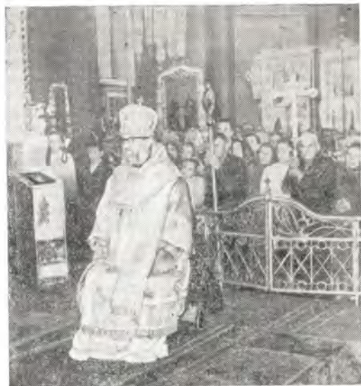
Митрополит Львовский Николай за богослужением в Свято-Юрском соборе 6 мая 1973 года

В Житии великомученика говорится, что он жил во второй половине III века, был сыном