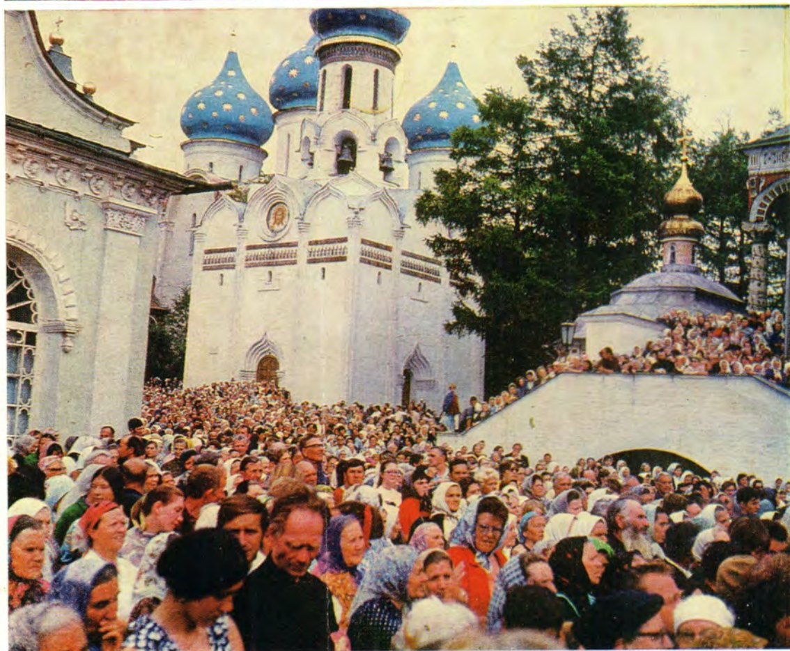
Патриаршее благословение паломникам в праздничный день 18 [5] июля 1973 года