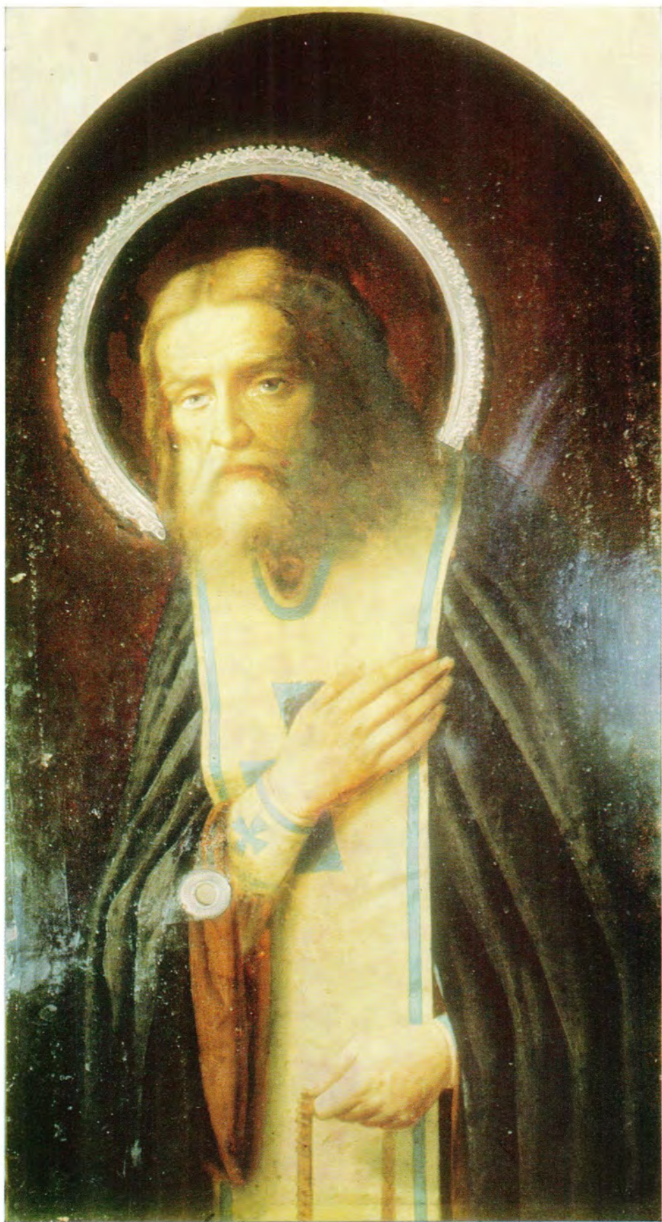
К 70-летию прославления преподобного Серафима Саровского, чудотворца (1903—1973; † 1838)