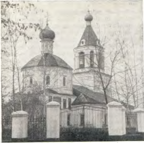
Храм Положения ризы Пресвятой Богородицы, что в Леонове

Ризоположенского храма пустошь Леоново превратилась в село Леоново, хотя селá в нашем понимании на этом месте еще долго не было. При наследниках И. Н. Хованского — братьях Иване и Петре Хованских — здесь жило всего 8 семей «деловых, кабальных и задворных», «да два человека кабальных», т. е. всего, вероятно, 40—45 человек.