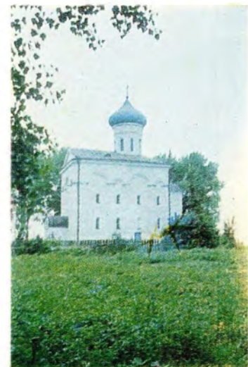
К 800-летию со дня блаженной кончины [1173—1973] преподобной Евфросинии Полоцкой. Справа — Спасо-Евфросиниевский собор в г. Полоцке, построенный усердием преподобной Евфросинии в 1-й пол. XII в., — место подвигов и посмертного упокоения преподобной Евфросинии