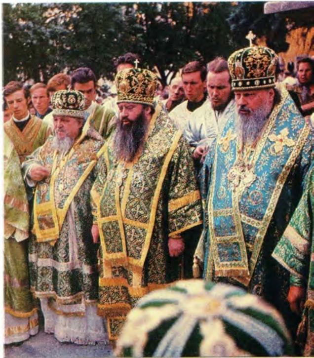
В Троице-Сергиевой Лавре 18 [5] июля 1973 года. Святейший Патриарх Московский и всея Руси Пимен с собором иерархов и клириков по окончании Божественной литургии совершает на лаврской площади праздничный молебен