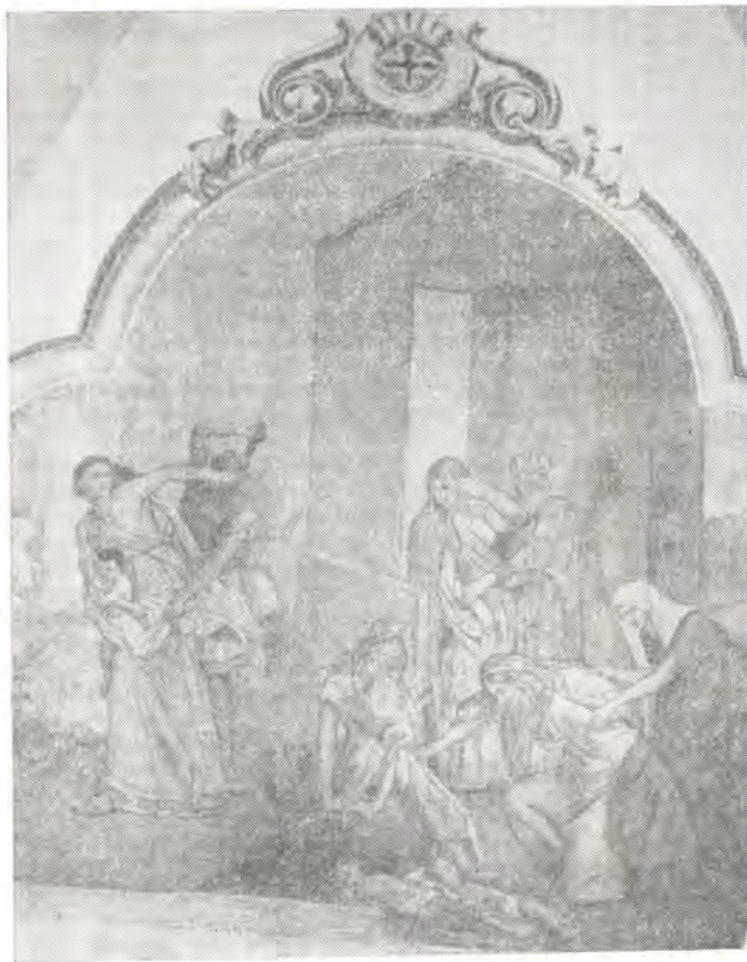
«Избиение младенцев». Роспись западной стены Никольского придела в леоновском храме