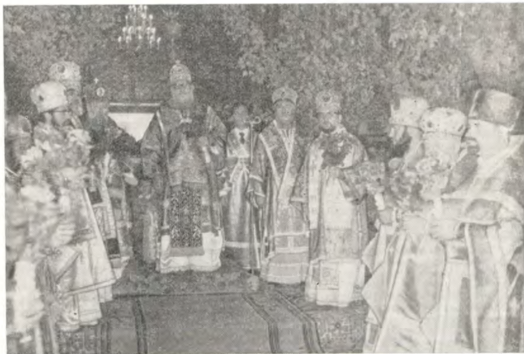
Блаженнейший Патриарх Николай с иерархами Александрийской и Русской Церквей за богослужением в Успенском соборе в Одессе в День Святой Троицы 17 июня 1973 года

В аэропорту «Внуково» Блаженнейшего Патриарха Николая и сопровождавших его лиц встречали Святейший Патриарх Пимен, председатель Отдела внешних церковных сношений митрополит Тульский и Белевский Ювеналий, заместитель председателя ОВЦС