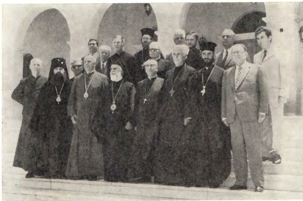
С 9 по 14 июля 1973 года в Греции в монастыре Пендели (близ Афин) проходила встреча Межправославной комиссии по диалогу со старокатоликами и Международной комиссии Утрехтского Союза по православно-старокатолическому диалогу. На снимках, вверху: участники встречи; внизу: заседание комиссии (к с. 8)