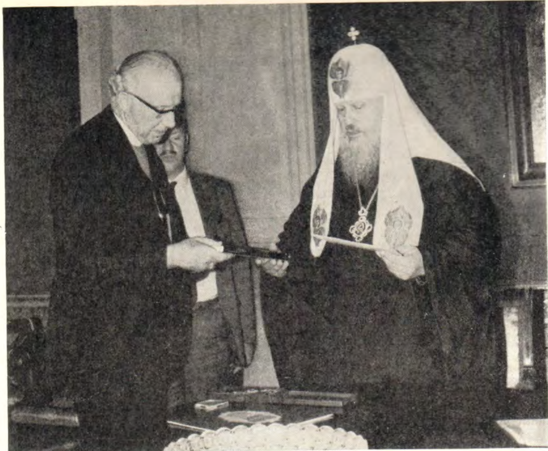
19 июля 1973 года Святейший Патриарх Пимен принял находившуюся в Москве по приглашению Русской Православной Церкви делегацию Совета Церквей в Нидерландах. На снимках, вверху: Святейший Патриарх Пимен и глава делегации д-р Маринус Кок, Архиепископ Утрехтский [Старокатолическая Церковь]; внизу: гости из Нидерландов на приеме у Святейшего Патриарха (к с. 8)