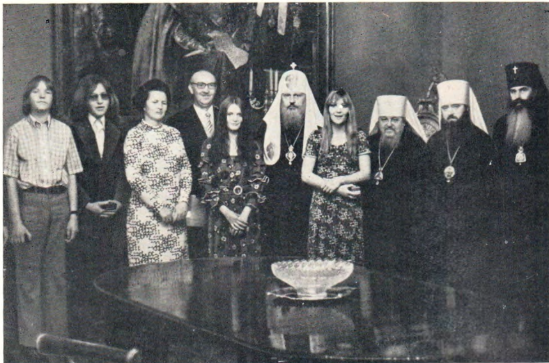
12 июня 1973 года Святейший Патриарх Московский и всея Руси Пимен принял г-на Георга Штейна [ФРГ] и членов его семьи. На приеме присутствовали митрополит Крутицкий и Коломенский Серафим, митрополит Тульский и Белевский Ювеналий и архиепископ Волоколамский Питирим (к с. 1)