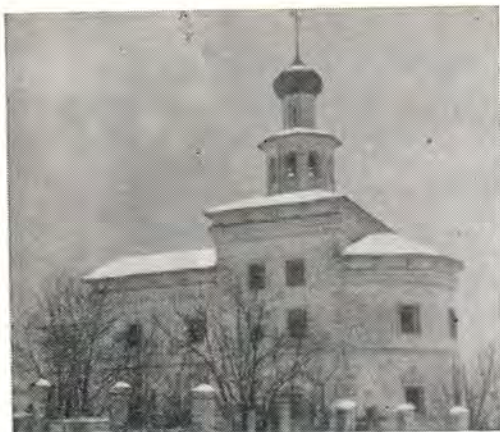
Храм во имя апостола Иоанна Богослова в г. Чердыни Пермской епархии