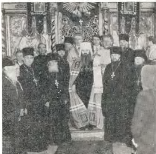
Митрополит Ленинградский и Новгородский Никодим с клириками и мирянами в храме в г. Старая Русса 17 мая 1973 года

17 мая после торжественной, по Уставу, встречи Владыка митрополит совершил с участием многих священнослужителей Божественную литургию. Храм был заполнен богомольцами, многие молились в ограде храма. После всенощной и после литургии Владыка проповедовал о Матери Божией, являющейся Матерью всех православных христиан. Она всегда милостиво примет наши молитвы,