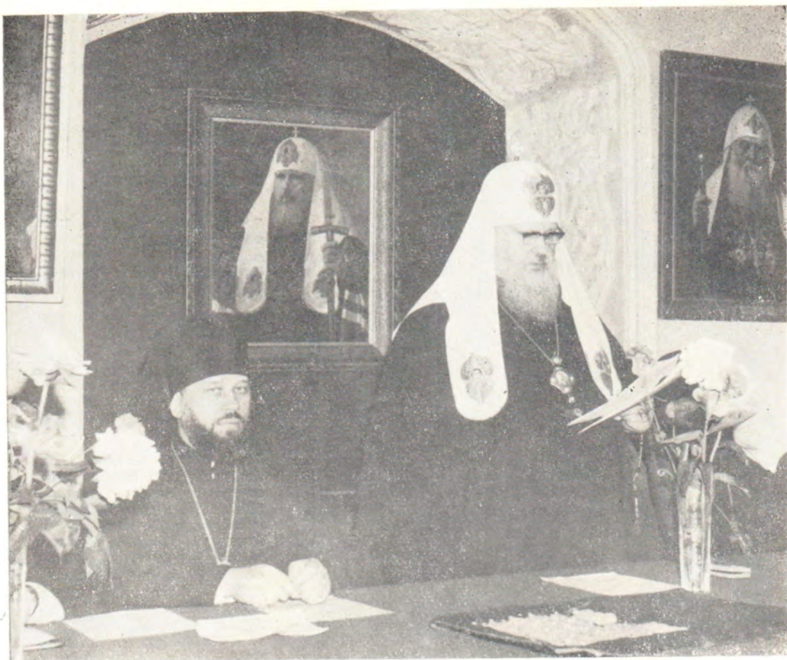
Святейший Патриарх Пимен произносит речь на выпускном акте в Московских духовных академии и семинарии 14 июня 1973 года. Слева — ректор МДА епископ Дмитровский Владимир

14 июня 1973 года на выпускном акте Московских духовных школ. Святейший Патриарх Пимен вручает диплом доктора богословия honoris causa и докторский крест протоиерею Феризу Берки, благочинному-администратору венгерских патриарших православных приходов в Венгрии