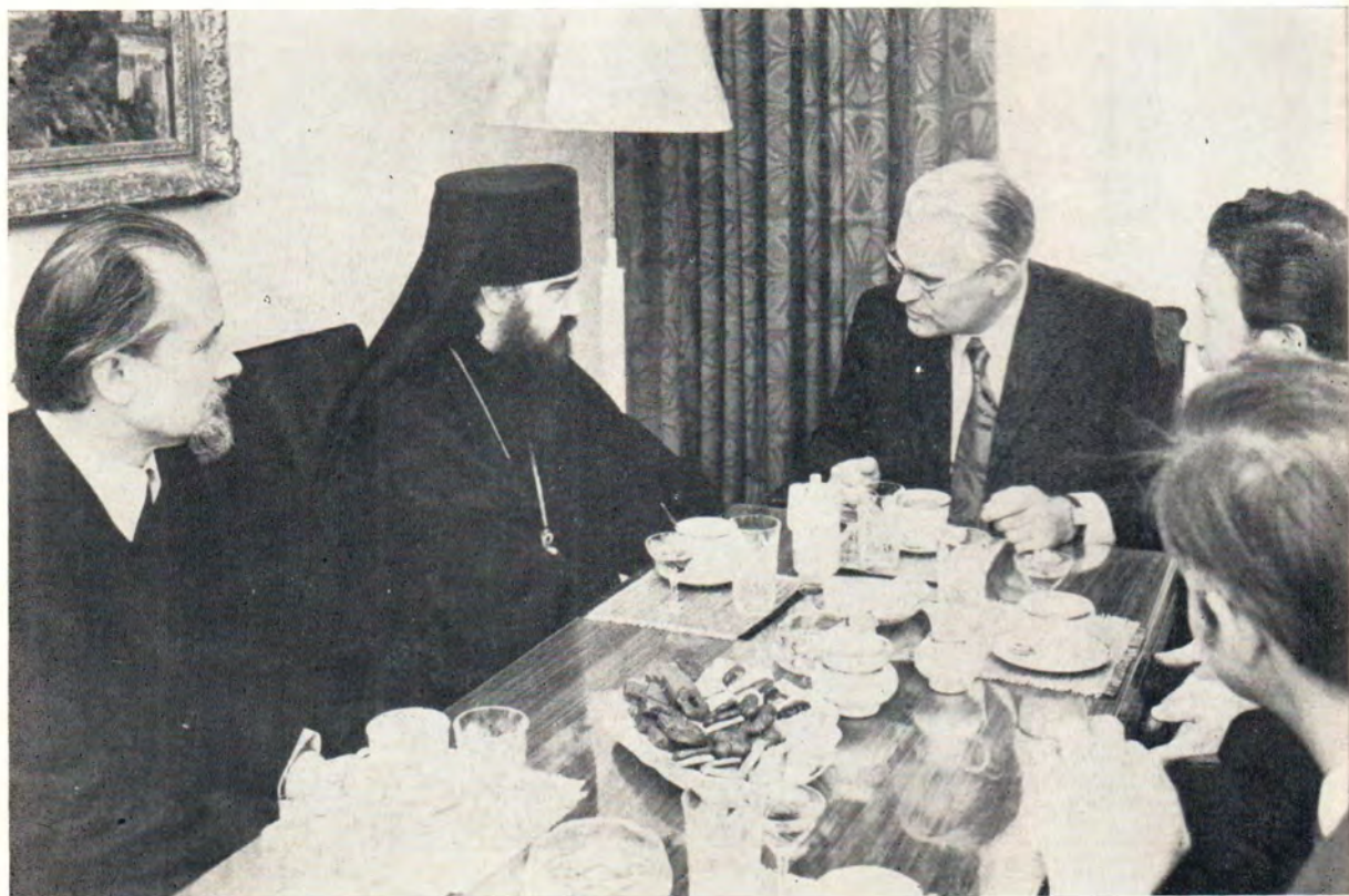
Архиепископ Берлинский и Среднеевропейский Филарет, Патриарший Экзарх Средней Европы, и председатель Христианско-Демократического Союза ГДР Геральд Геттинг во время беседы 8 июня 1973 г. (К хронике Среднеевропейского Экзархата, стр. 12)