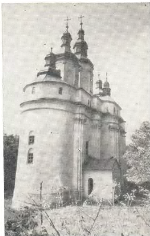
Храм в честь Рождества Пресвятой Богородицы в местечке Гореча-Монастырь (г. Черновцы)

29 апреля, в пасхальную ночь, Преосвященный Савва совершил пасхальную утреню и Божественную литургию в кафедральном со-