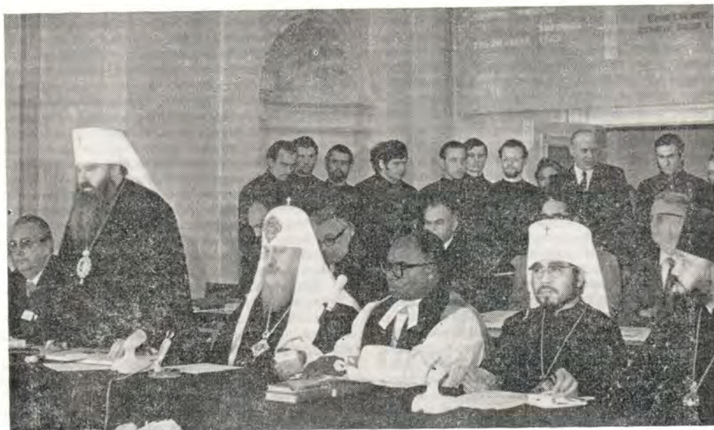
Президент ХМК митрополит Ленинградский и Новгородский Никодим открывает заседание КОПра 25 мая 1973 года

Проникновенны слова французского писателя Антуана де Сент-Экзюпери: «Я понимаю, наконец, почему любовь к Богу наложила на людей ответственность друг за друга и предписала им надежду как добродетель. Ведь каждого человека она превращала в посланца одного и того же Бога, в руки каждого отдавала спасение всех» 13 .