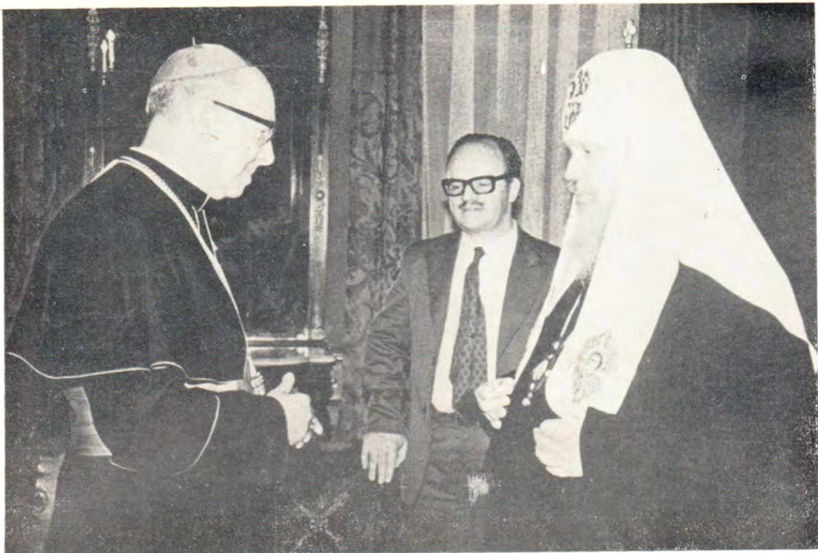
Святейший Патриарх Московский и всея Руси Пимен в Москве принимает председателя Секретариата по содействию христианскому единству кардинала Иоанна Виллебрандса 11 июня 1973 года