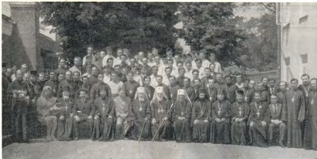
Митрополит Киевский и Галицкий Филарет, митрополит Херсонский и Одесский Сергей, митрополит Иоанн [Кухтин], преподаватели, воспитанники ОДС и гости в день выпуска, 14 июня 1973 года

торые трудились неленостно над воспитанием будущих пастырей Церкви Христовой, от имени дорогих наших воспитанников, тружеников нашей семинарии и всех здесь собравшихся сердечно братски благодарю Ваше Высокопреосвященство за то, что Вы прибыли в наш богоспасаемый град и вместе с нами разделили радость, которая является радостью не только для Одесской духовной семинарии, но и радостью для всей Русской Православной Церкви.