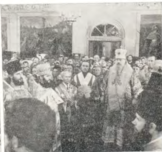
Святейший Патриарх Пимен совершает праздничный молебен пред чтимой иконой Божией Матери «Споручница грешных» 11 июня 1973 года