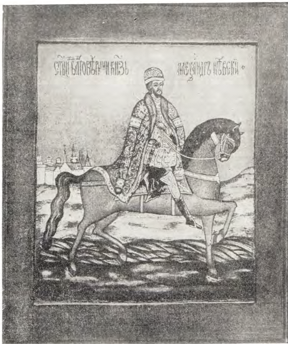
Святой благоверный князь Александр Невский Икона XVIII в.

чувства горделивого превосходства над ними. Так, он повторил в Новгороде свадебный пир (по дипломатическим соображениям), после совершения своего бракосочетания в 1239 году с дочерью полоцкого князя Брячислава в городе Торжке.