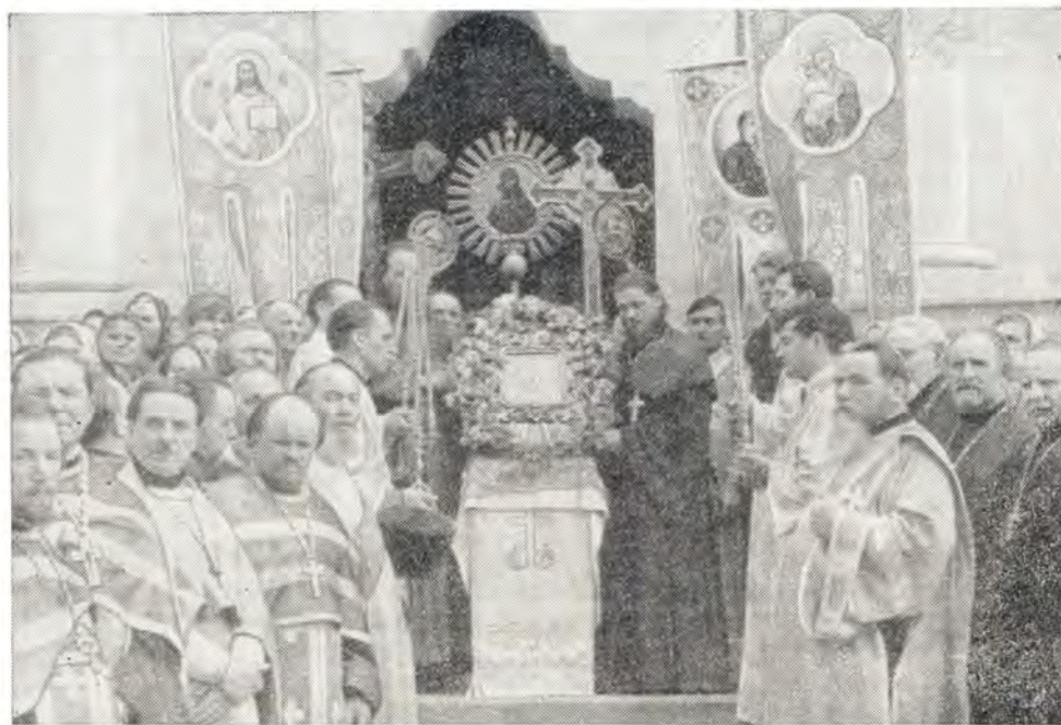
20 мая 1970 года. На ступенях монастырского храма на месте явления Жировицкой иконы Божией Матери

По окончании поздней литургии был совершен традиционный крестный ход с иконой Божией Матери к храму Рождества Богородицы, именуемому Явленским, где под 500-летней липой, свидетельницей истории монастыря, был прочитан акафист, в котором раскрывается большая и славная история обители, повествуется о великих милостях, ниспосланных ей Божией Матерью.