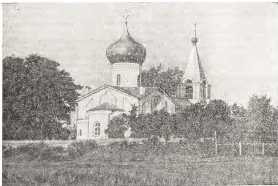
Храм-памятник близ «Ледового побоища» во имя Архангела Михаила в с. Курган Александра Невского, Псковской епархии