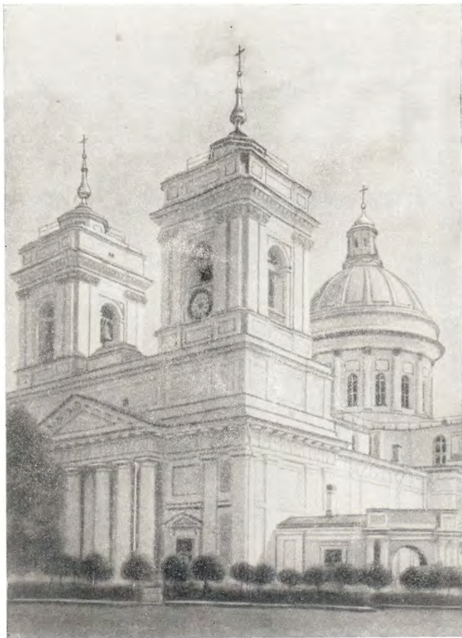
Троицкий собор Александро-Невской Лавры

преподобного и благоверного князя Даниила Московского, на закате своей государственной деятельности также испрашивали у Церкви великую схиму. Великий полководец и государственный деятель отошел ко Господу, как смиренный схимник, 14 августа 1263 года.