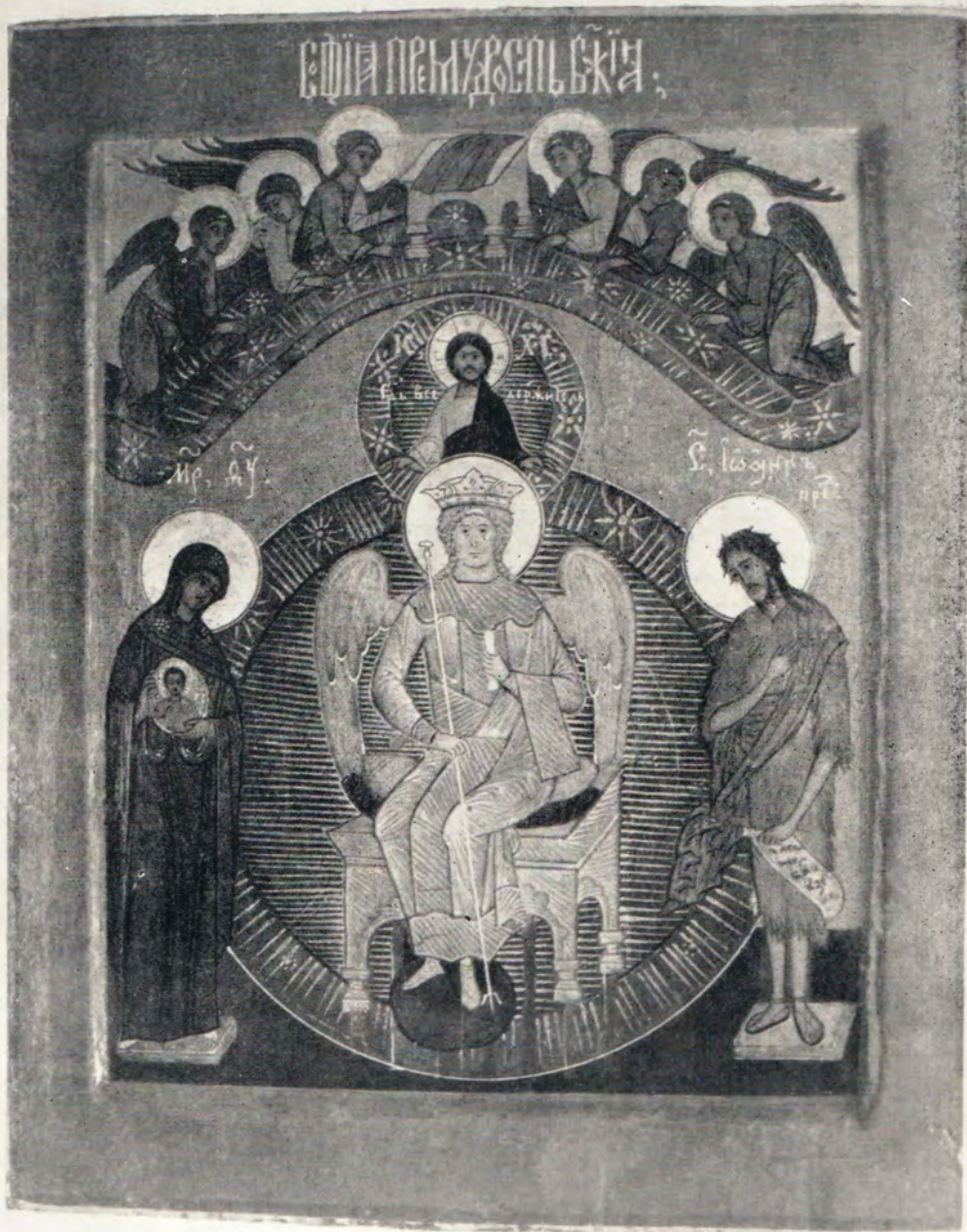
Икона Софии Премудрости Божией, XVII век