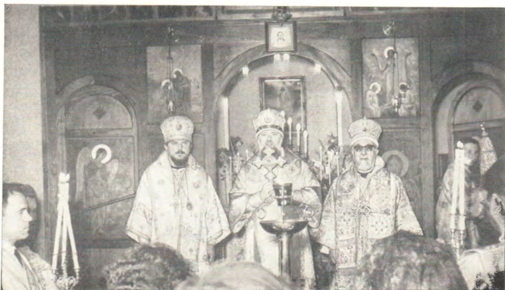
За Божественной литургией 25 февраля 1970 года в Благовещенском соборе в Буэнос-Айресе, Аргентина. Слева направо: архиепископ Аргентинский и Южноамериканский Никодим, митрополит Киевский и Галицкий, Экзарх Украины, Филарет, митрополит Аргентинский и Чилийский Мелетий (Антиохийская Православная Церковь). (К статье в «ЖМП», 1970, № 8, с. 15—19)