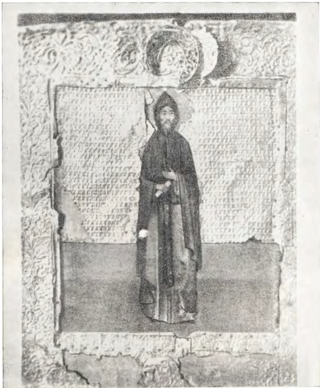
Святой Александр Невский Икона XVI в