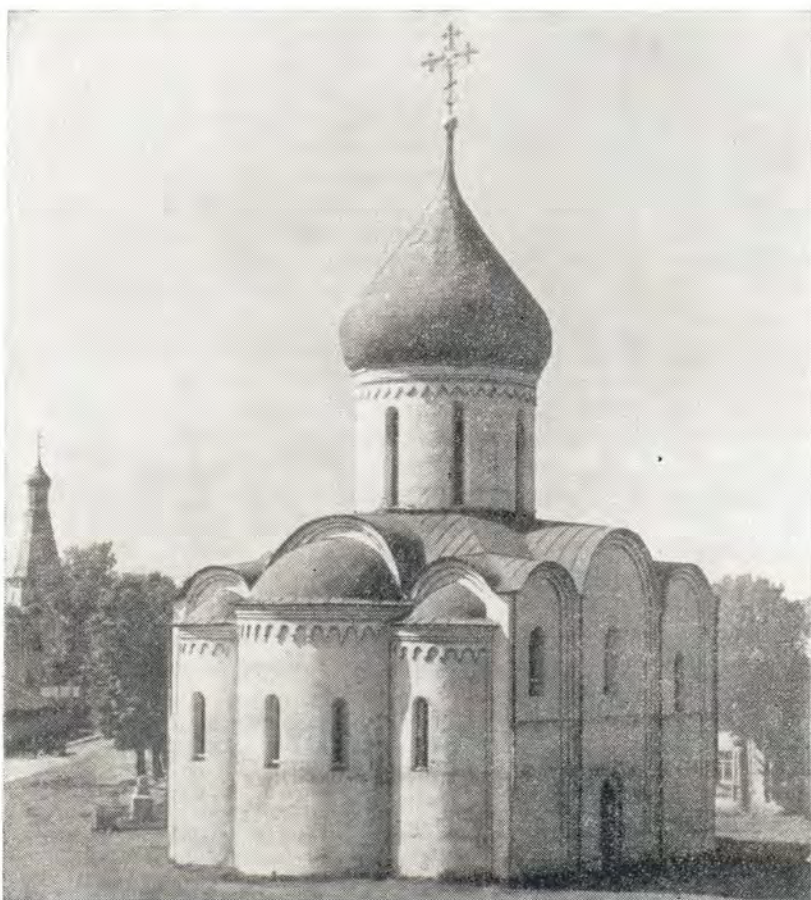
Преображенский собор в г. Переславле-Залесском