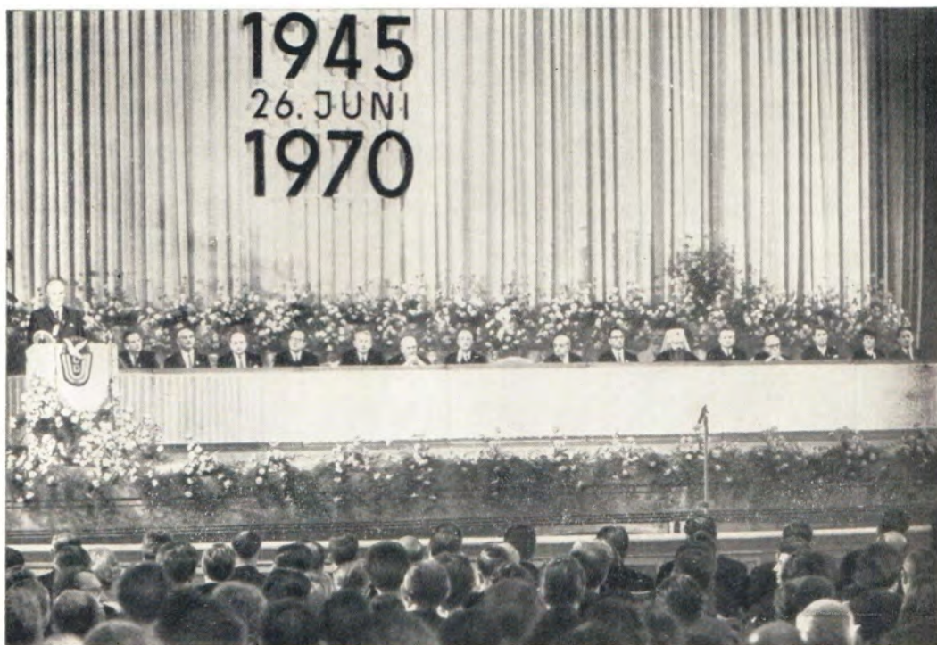
Берлин (ГДР), 26 июня 1970 года. Торжественное заседание по случаю 25-летия Христианско-Демократического Союза Германии. На верхнем фото: председатель ХДС Геральд Гёттинг вручает митрополиту Ленинградскому и Новгородскому Никодиму золотую медаль имени Отто Нушке. (См. № 8, с. 8 и 42—43)