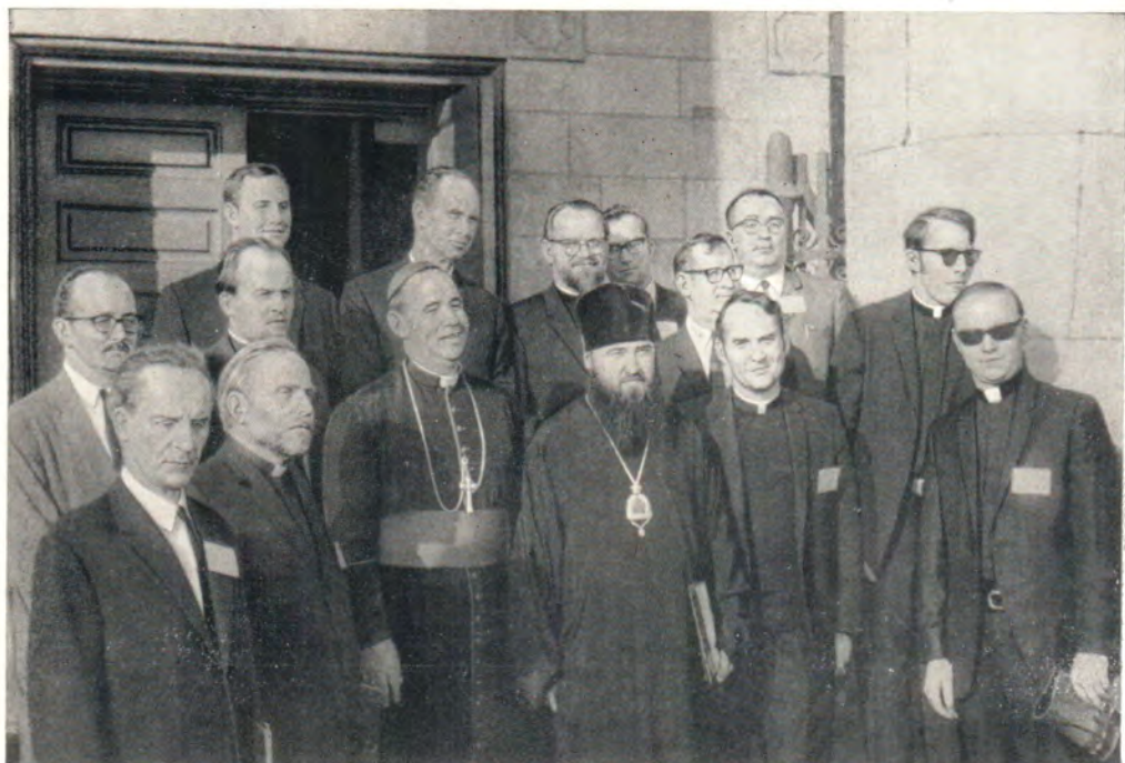
Делегация представителей христианских Церквей из СССР во главе с епископом Тульским и Белевским Ювеналием во время посещения собора св. Людовика в Сент Луисе (Миссури, США) 3 октября 1969 года. Налево от епископа Ювеналия епископ Скала Иосиф Мак-Николаас (см. «ЖМП», 1969, № 11, с. 34—35; 1970, № 1, с. 8, и статью диакона А. Юрченко в № 7, с. 47—52; № 8, с. 44—49, и в этом номере, с. 56—60