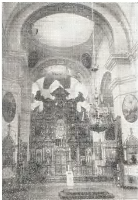
Интерьер Успенского собора Жировицкого монастыря

Сравнительно строгий для эпохи барокко резной иконостас, несколько икон XVIII—XIX вв. — на клиросах, на столбах и на стенах, отдельные стенописи по мотивам Нестерова и Васнецова да два старинных паникадила — вот и всё скромное убранство этого простого, но величественного храма. Такое ограничение в убранстве собора, пожалуй, нельзя объяснить только временным нарушением здесь православных традиций или сравнительной бедностью обители, ибо за прошедшие со времени уничтожения унии почти полтора столетия собор при желании можно было бы украсить с особым великолепием. Скорее, в этом сказались своеобразный духовный «такт» насельников по отношению к главной монастырской святыне — иконе Божией Матери, внутреннее стремление подчинить весь собор, его интерьер, его «духовное» пространство этой святыне, ибо чудотворный древний образ хранится здесь, слева от цар-