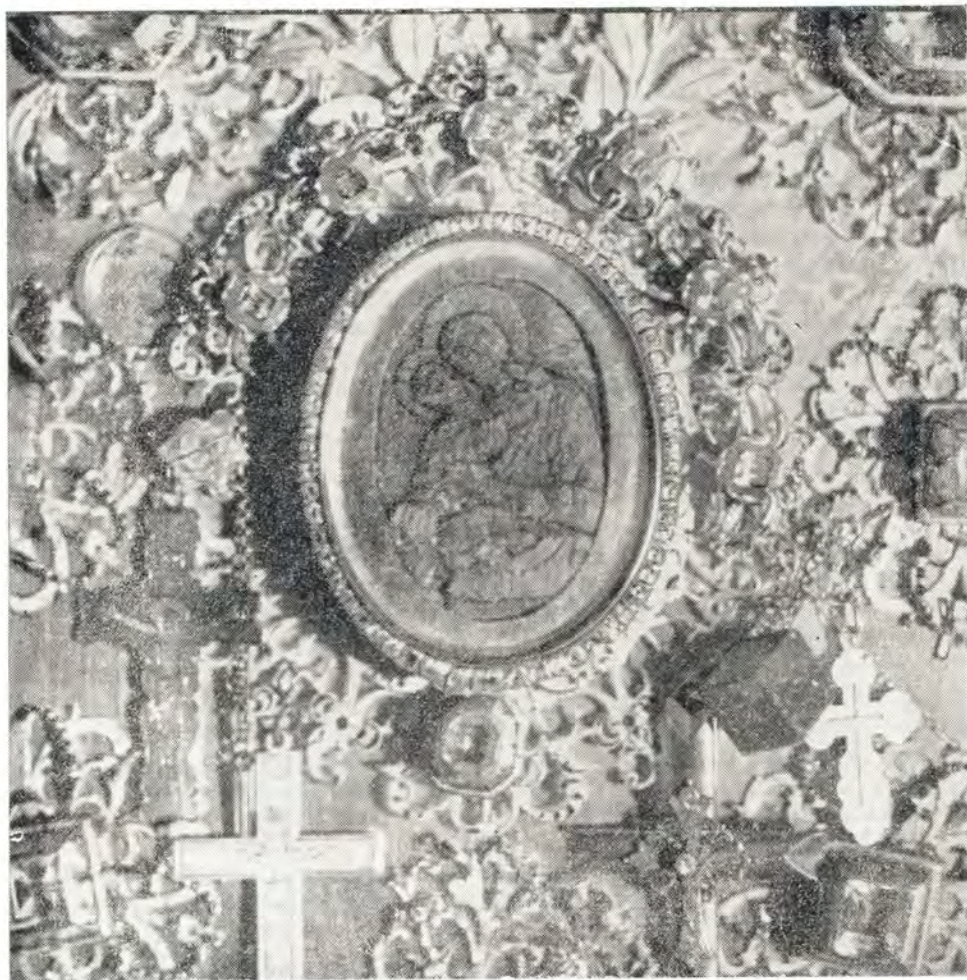
Жиговицкая икона Божией Матери

в ларце не нашел ее. На следующее утро пастухи опять подошли к той груше, где была найдена ими икона, и к великому удивлению снова увидели тот же образ в сиянии. Они вновь сняли икону и отнесли Солтану.