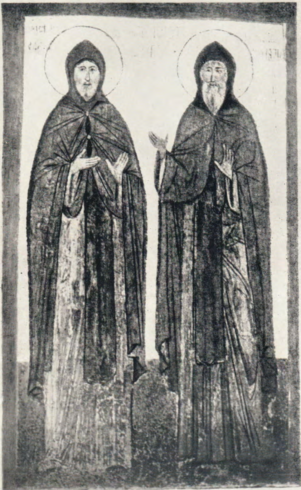
Святой Александр Невский и преподобный Иоанн Дамаскин Фреска из Благовещенского собора Кремля, 1506 г.