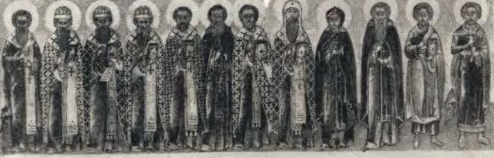
СВЯТЦЫ — МЕСЯЦ МАИ

АПЛЪ АНДРОНЪ СВЕТИ КАССЕКЪ ЧИДОУЕ СЕДИМОЛО ФЕРАПОНЪ НИКИТА ИГНАТИИ ПРЪ МУ ИСАИИ АПЛЪ МЪЧЕННИКЪ КАРПЪ НИКОНЪ ФАТИИ ИСОАНА ФЕРАПОНЪ БЕЛОЗЕРЪ ДАКИДО РОСЛОВСКИ ФЕВДОСИ ДОЛМА СРЕМА ЕРЕМЪ