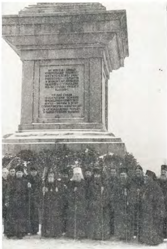
У памятника советским воинам в Варшаве

Святейший и Блаженнейший Католикос-Патриарх всей Грузии Еф-