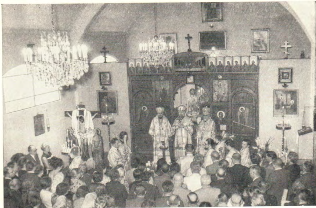
За Божественной литургией в русском православном Благовещенском кафедральном соборе в Буэнос-Айресе 25 января 1970 года