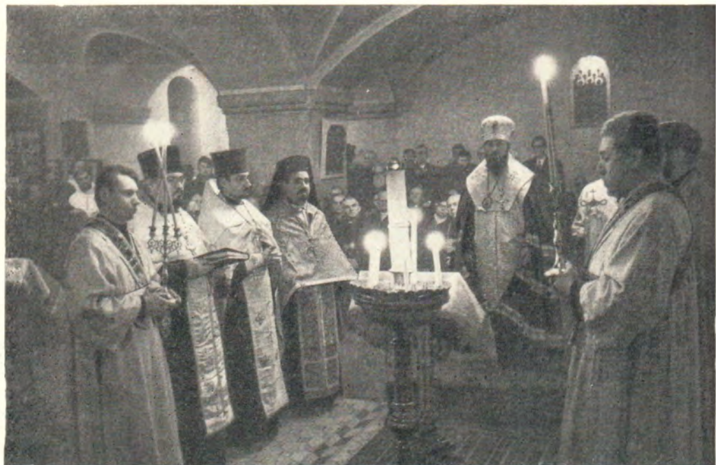
4 февраля 1970 года, в день 25-летия интронизации Святейшего Патриарха Московского и всея Руси Алексия, епископ Венский и Австрийский Мелхиседек совершил в Свято-Николаевском соборе в Вене в сослужении соборного духовенства и священников братских Православных Церквей, представленных в Вене, в присутствии многочисленных экуменических гостей благодарственный молебен. (К статье на с. 28)