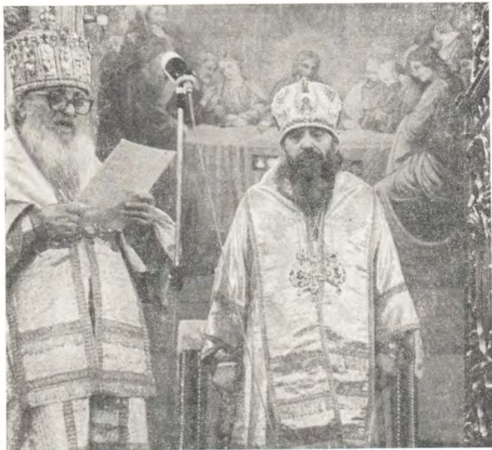
Святейший Католикос-Патриарх всей Грузии Ефрем II приветствует Блаженнейшего Митрополита Варшавского и всей Польши Василия в день интронизации 1 марта 1970 года

После недавних скорбей сиротства, посетивших Польскую Православную Церковь в связи с кончиной ее Предстоятеля Блаженнейшего Митрополита Стефана, Собор епископов 24 января 1970 года избрал новым Предстоятелем Церкви — Митрополитом Варшавским и всей Польши епископа Вроцлавского и Щецинского Василия. На интронизацию Блаженнейшего Митрополита Василия, которая должна была состояться в Варшаве 1 марта 1970 года, были приглашены представители братских Поместных Православных Церквей.