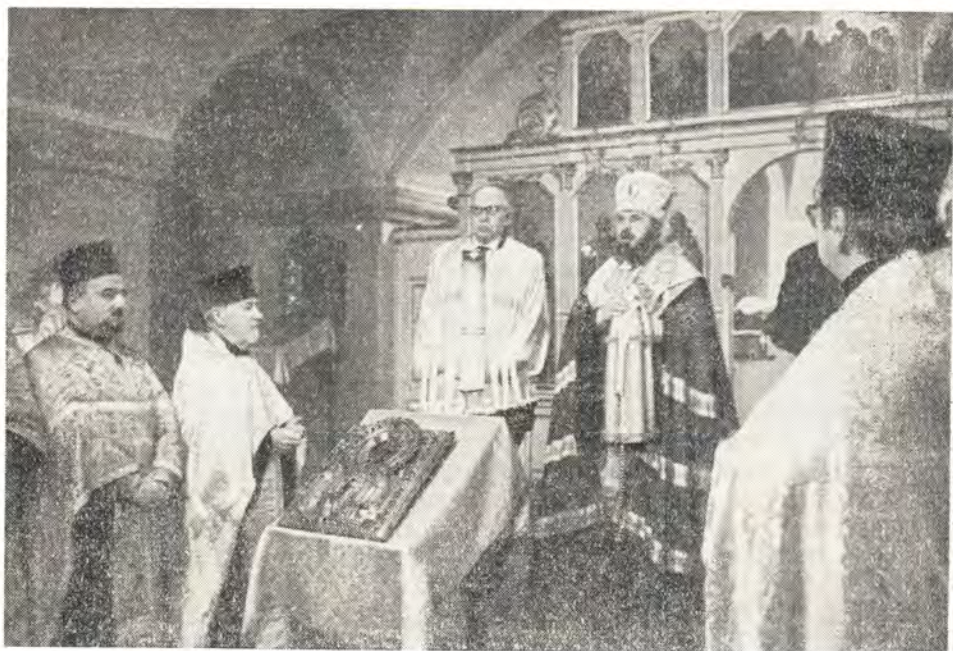
Епископ Мелхиседек после молебна произносит слово

В 1970 году традиционный приём был устроен в честь знаменательной даты — 25-летия интронизации Его Святейшества. Общественность Вены проявила большой интерес к празднику. Два года тому назад Русская Православная Церковь отпраздновала 50-летие восстановления патриаршества. Половину этого периода Русскую Православную Церковь возглавляет достойный преемник Святейших Патриархов Тихона и Сергия — Патриарх Алексий.