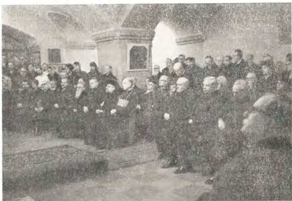
Прихожане и гости — участники юбилейного торжества

Среди гостей на молебне, а затем на приеме были кардинал д-р Франц Кёниг, архиепископ Венский; архиепископ д-р Опиллио Росси, апостольский нунций в Австрии; митрополит Австрийский, Экзарх Константинопольского Патриарха, д-р Хризостом Тситер; мекхитаристский архиепископ Месроп Хабозян; епископ Оскар Сакрауский, глава Евангелическо-Лютеранской Церкви в Австрии, и епископ той же Церкви д-р Герхард Май, находящийся на покое; Чрезвычайный и Полномочный Посол Советского Союза в Австрии Б. Ф. Подцероб; Посол