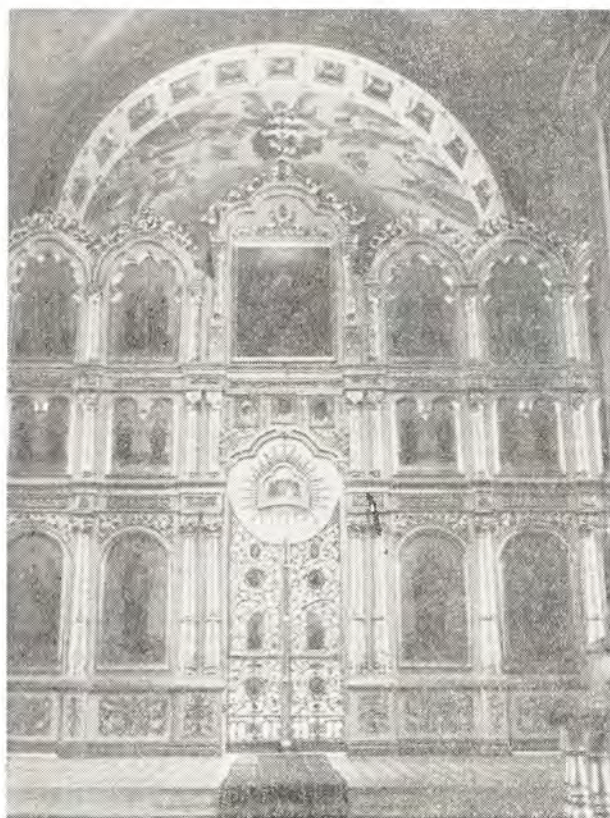
Иконостас саратовского собора в честь Сошествия Святого Духа

5 января 1970 г., в канун Рождественского сочельника, в саратовском соборе в честь Сошествия Святого Духа было совершено освящение нового иконостаса. Этот иконостас — трехъярусный, деревянный, резной, позолоченный — был сооружен вместо временного одноярусного иконостаса. Художественную резьбу по дереву для царских врат, колонок и прочих деталей иконостаса производили местные саратовские мастера-резчики. Часть икон, установленных в иконостасе, имелись уже в соборе, а некоторые были заново написаны приглашенными в Саратов иконописцами. Работы велись целый год. Теперь величественный новый иконостас украшает второй по величине собор Саратова и, гармонично сочетаясь с росписью собора, создает молитвенное, благоговейное настроение у молящихся. Много потрудились в благочестивом деле украшения храма Божия члены исполнительного органа и другие труженики собора.