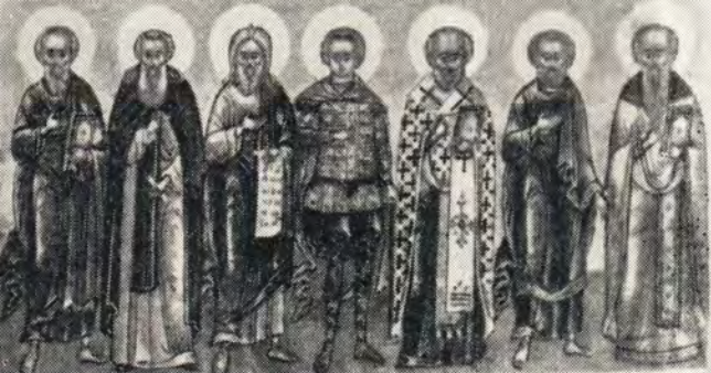
СПІДАНІЙ АРХІСІПІ ІМПІРАКІА ПЕРІАНЪ АННКА ГАІКІВІА СІРІА ІВАНКА СІДОРЪ РОСТОВСКІЙ БІРОСІА ПСКОВСКІЙ ПАХОМІА БЕЛІКІА СІПІА ІСАІА РОСТОВСКІА ЕФІАНЪ ПЕРІКОПІА ПРІВНІЙ ФЕОДОРЪ