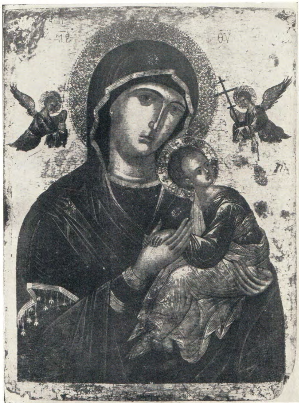
СТРАСТНАЯ ИКОНА БОЖИЕЙ МАТЕРИ, XVI В.