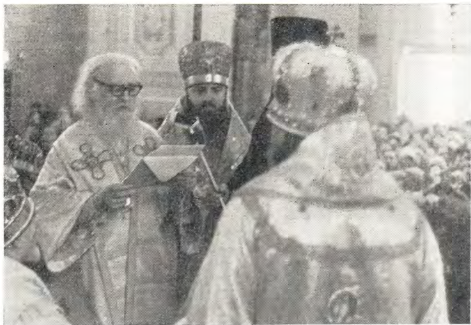
Глава делегации Русской Православной Церкви митрополит Орловский и Брянский Палладий читает приветственное послание Святейшего Патриарха Алексия Митрополиту Варшавскому и всей Польши Василию. Рядом с митрополитом Палладием епископ Ювеналий

Европе, Хризостом; делегацию Грузинской Православной Церкви — Святейший и Блаженнейший Католикос-Патриарх всей Грузии Ефрем II; делегацию Сербской Православной Церкви — епископ Баня-Лукский Андрей; делегацию Румынской Православной Церкви — епископ Тырговиштский Анфим; делегацию Болгарской Церкви — митрополит Великотырновский Стефан; делегацию Элладской Церкви — митрополит Китрский Варнава; делегацию Православной Церкви в Чехословакии — Митрополит Пражский и всей Чехословакии Блаженнейший Дорофей; делегацию Всемирного Совета Церквей — архимандрит Анастасий (Яннулатис).