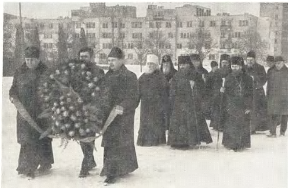
Возложение венка от Русской Православной Церкви к памятнику советским воинам в Варшаве

Официальные торжества закончились 2 марта вечером, когда Блаженнейшим Митрополитом Василием в его резиденции был дан про-