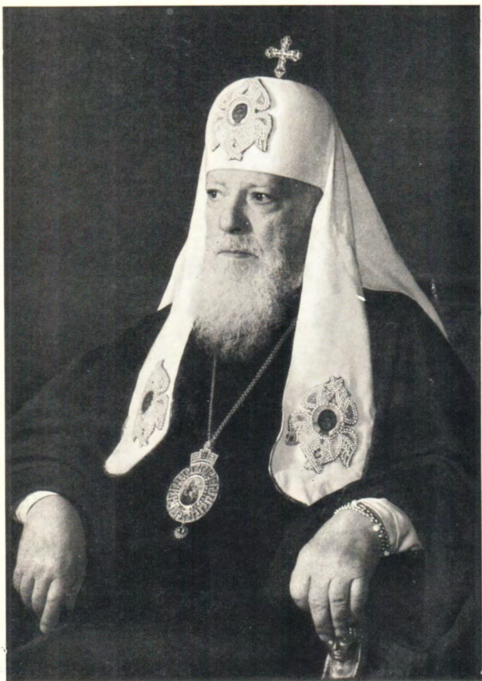
СВЯТЕЙШИЙ ПАТРИАРХ МОСКОВСКИЙ И ВСЕЯ РУСИ АЛЕКСИЙ