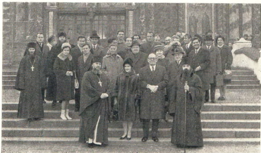
Пребывавший в Советском Союзе с официальным визитом министр иностранных дел Франции Морис Шуман посетил 12 октября 1969 года Троице-Сергиеву Лавру. На фото: г-н Морис Шуман с супругой, посол Франции в СССР г-н Роже Сейду, посол СССР во Франции В. А. Зорин и сопровождавшие их лица с епископом Дмитровским Филаретом и заместителем Лавры архимандритом Платоном у Трапезного Сергиевского храма Лавры