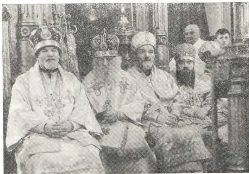
Участники торжеств интронизации Предстоятеля Польской Православной Церкви. Слева направо: Митрополит Пражский и всей Чехословакии Дорофей, митрополит Орловский и Брянский Палладий, епископ Бая-Лукский Андрей, епископ Тульский и Белевский Ювеналий

Делегацию Константинопольского Патриархата возглавлял митрополит Венский, Экзарх Константинопольского Патриарха в Средней