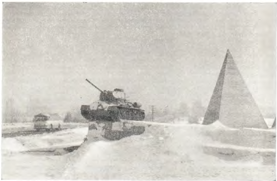
Волоколамское шоссе. Здесь был остановлен враг, рвавшийся к столице, отсюда началось наступление наших войск

Русские верующие люди в невероятно трудных условиях военного времени пока-