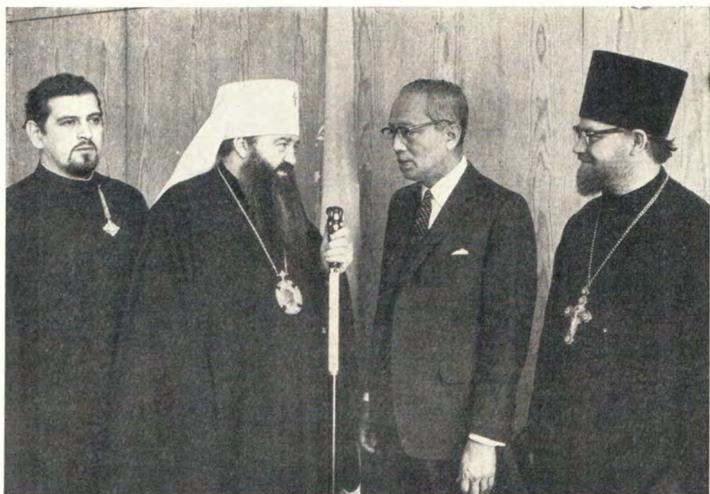
27 марта 1970 года митрополит Ленинградский и Новгородский Никодим, председатель Отдела внешних церковных сношений Московского Патриархата, был принят Генеральным Секретарем Организации Объединенных Наций г-ном У Таном. На фото: протодиакон Богдан Сойко, митрополит Никодим, У Тан, прот. Матфей Стадниук