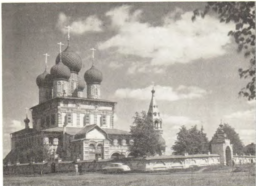
ВОСКРЕСЕНСКИЙ СОБОР В ТУТАЕВЕ