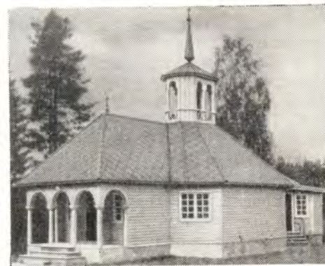
ЧАСОВНИ ПРИХОДА В КУОПИО. Вверху — Мурувеси, Нильсия. Внизу — Тускиэми, Юанкоски