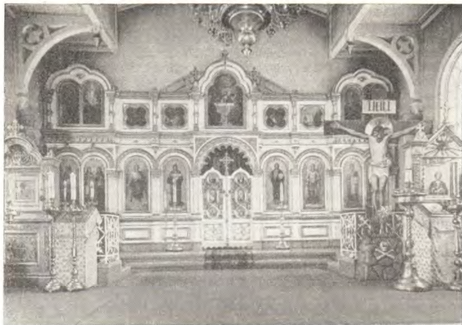
ИКОНОСТАС НИКОЛЬСКОГО КАФЕДРАЛЬНОГО СОБОРА В г. КУОПИО

В этот мой приезд, как и ранее, за богослужениями в наших храмах собирались прихожане, чтобы услышать о жизни Матерн-Церкви и получить благословение, присланное от ее священноначалия.