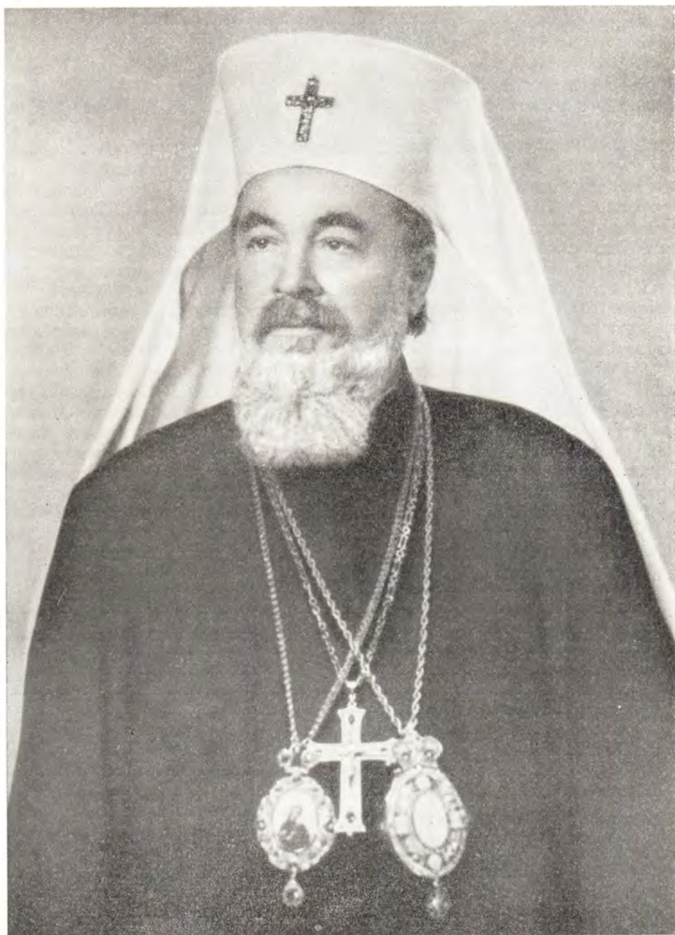
СВЯТЕЙШИЙ КИРИЛЛ, ПАТРИАРХ БОЛГАРСКИЙ

Не осталась безразличной и Церковь и ее служители. Перед ними встала задача оценить и понять происходящее в силу исторической