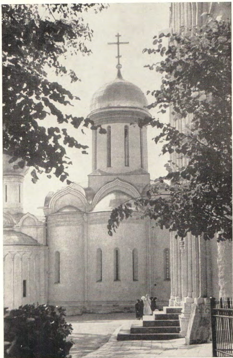
ДРЕВНИЙ ТРОИЦКИЙ СОБОР ТРОИЦЕ-СЕРГИЕВОЙ ЛАВРЫ К КОНЦУ ЛЕТА ПРИОБРЕЛ ПЕРВОНАЧАЛЬНЫЙ ВИД: ЧЕТЫРЕХСКАТНАЯ КРЫША, РЕЗУЛЬТАТ ПОЗДНЕЙШИХ ПЕРЕДЕЛОК И РЕМОНТОВ, РАЗОБРАНА И ВОССТАНОВЛЕНО ДРЕВНЕЕ ПОЗАКОМАРНОЕ ПОКРЫТИЕ. КРОВЛЯ ПОЗОЛОЧЕНА, КАК И КУПОЛ