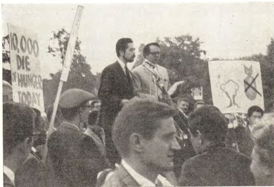
МИТИНГ НА ПЛОЩАДИ НАЦИИ ВО ВРЕМЯ «МАРША ДОБРОЙ ВОЛИ» УЧАСТНИКОВ ВСЕМИРНОЙ КОНФЕРЕНЦИИ «ЦЕРКОВЬ И ОБЩЕСТВО» в ЖЕНЕВЕ 25 июля 1966 года

В заключение автор говорит о задачах христианина и его долге в современном мире. Касаясь политической и социальной проблематики, христианин, как личность и как часть общественного организма, осознает свой долг и свою свободу. Проблемы мира в целом и отдельных государств раскрывают перед ним существующую напряженность и понуждают принимать решения для ее развязки не только лично для себя, но и для общества, с которым он неразрывно связан участием в Теле Христовом. Он свободен в отношении решений, но его долг состоит в том, чтобы принять решения правильные, соответствующие не только его личному пониманию, но и действительной цели мира, руководимого его Господом.