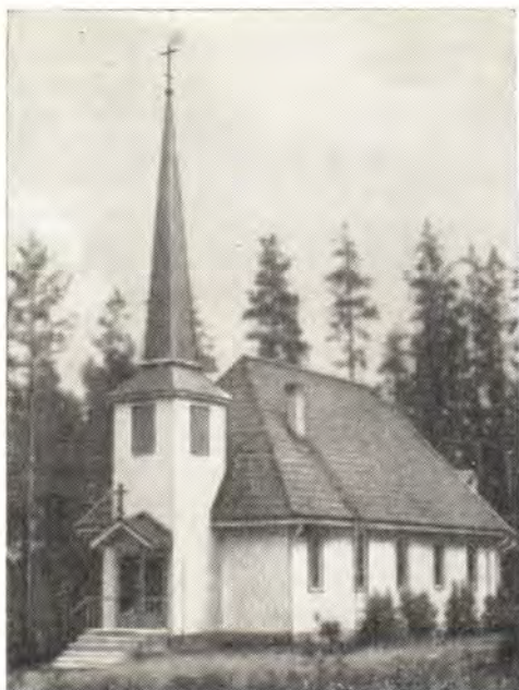
ЧАСОВНЯ В СИЛИНЬЯРВИ

ные Архиепископом Павлом на основе главным образом напевов Валаамского монастыря. Владыка Архиепископ много заботится о музыкальной стройности и благозвучности церковного пения. В июле 1965 г. в г. Иломанси состоялся Певческий съезд с участием хоров и регентов-псаломщиков со всей страны. На литургии в Ильин день во время съезда исполнялись песнопения, также составленные Архиепископом Павлом. Объединенный хор имел в своем составе, кажется, больше 100 человек.