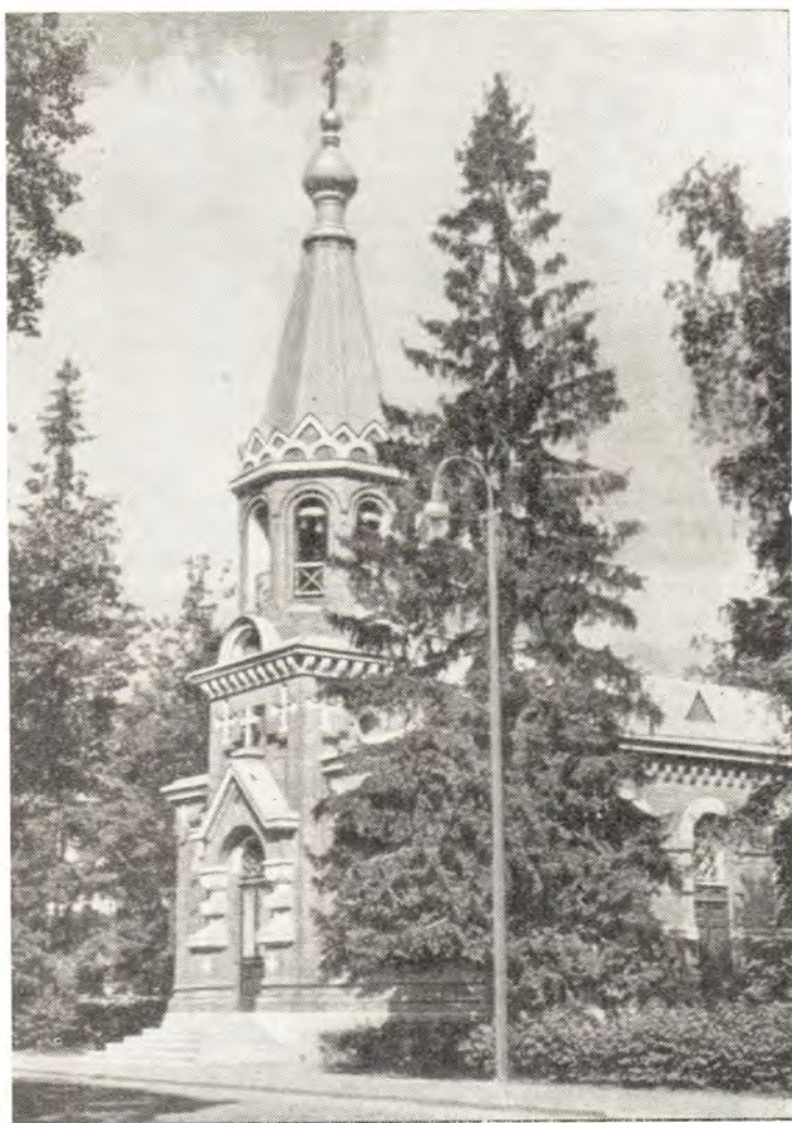
НИКОЛЬСКИЙ КАФЕДРАЛЬНЫЙ СОБОР В г. КУОПИО