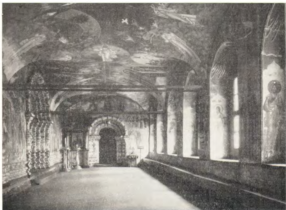
ВОСКРЕСЕНСКИЙ СОБОР В ТУТАЕВЕ. ГАЛЕРЕЯ, ОКРУЖАЮЩАЯ ВЕРХНИЙ (ЛЕТНИЙ) ХРАМ С ТРЕХ СТОРОН, так наз. ГУЛЬБИЩЕ