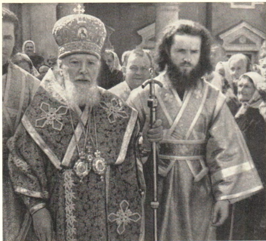
СВЯТЕЙШИЙ ПАТРИАРХ АЛЕКСИЙ В ТРОИЦЕ-СЕРГИЕВОЙ ЛАВРЕ В ПРАЗДНИК ПРЕП. СЕРГИЯ