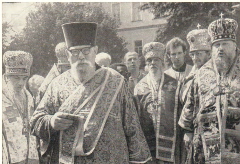
ПРАЗДНИЧНЫЙ МОЛЕБЕН В ТРОИЦЕ-СЕРГИЕВОЙ ЛАВРЕ