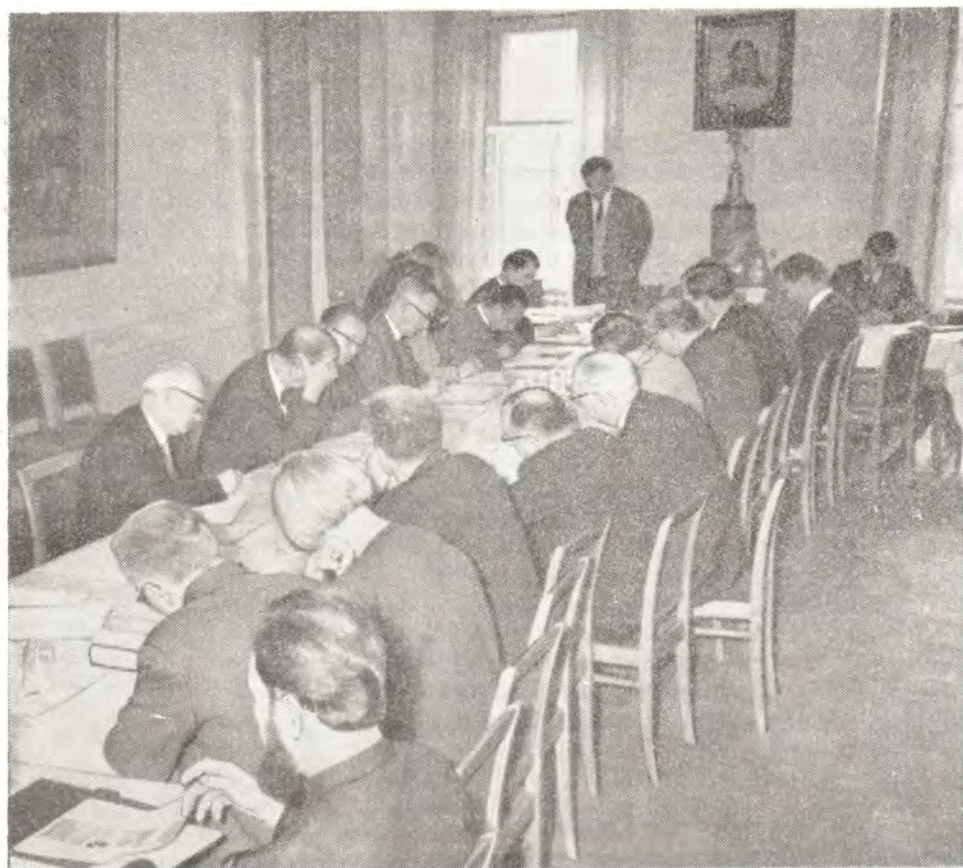
ЗАСЕДАНИЕ РАБОЧЕГО КОМИТЕТА КОМИССИИ «ВЕРА И УСТРОЙСТВО». Загорск, август 1966 года

Да благословит Господь Бог наше общее христианское делание, — делание единства, мира и любви!