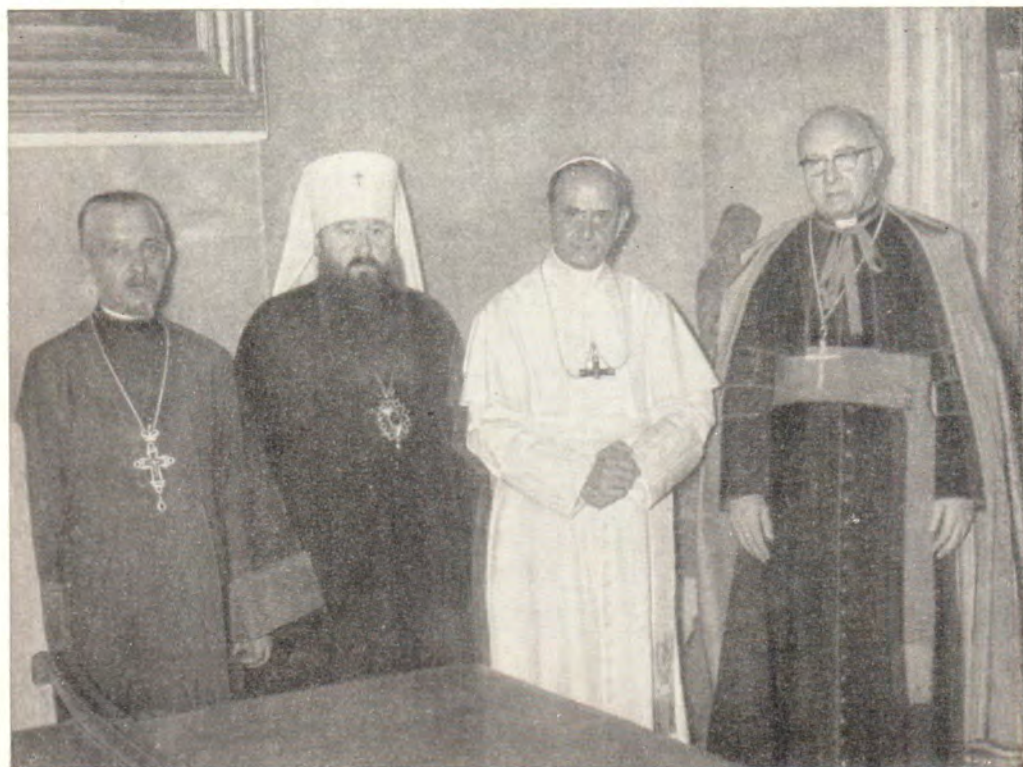
МИТРОПОЛИТ ЛЕНИНГРАДСКИЙ И ЛАДОЖСКИЙ НИКОДИМ НА ПРИЕМЕ У ПАПЫ ПАВЛА VI 9 декабря 1965 г. Слева от Папы Павла епископ Иоанн Виллебрандс