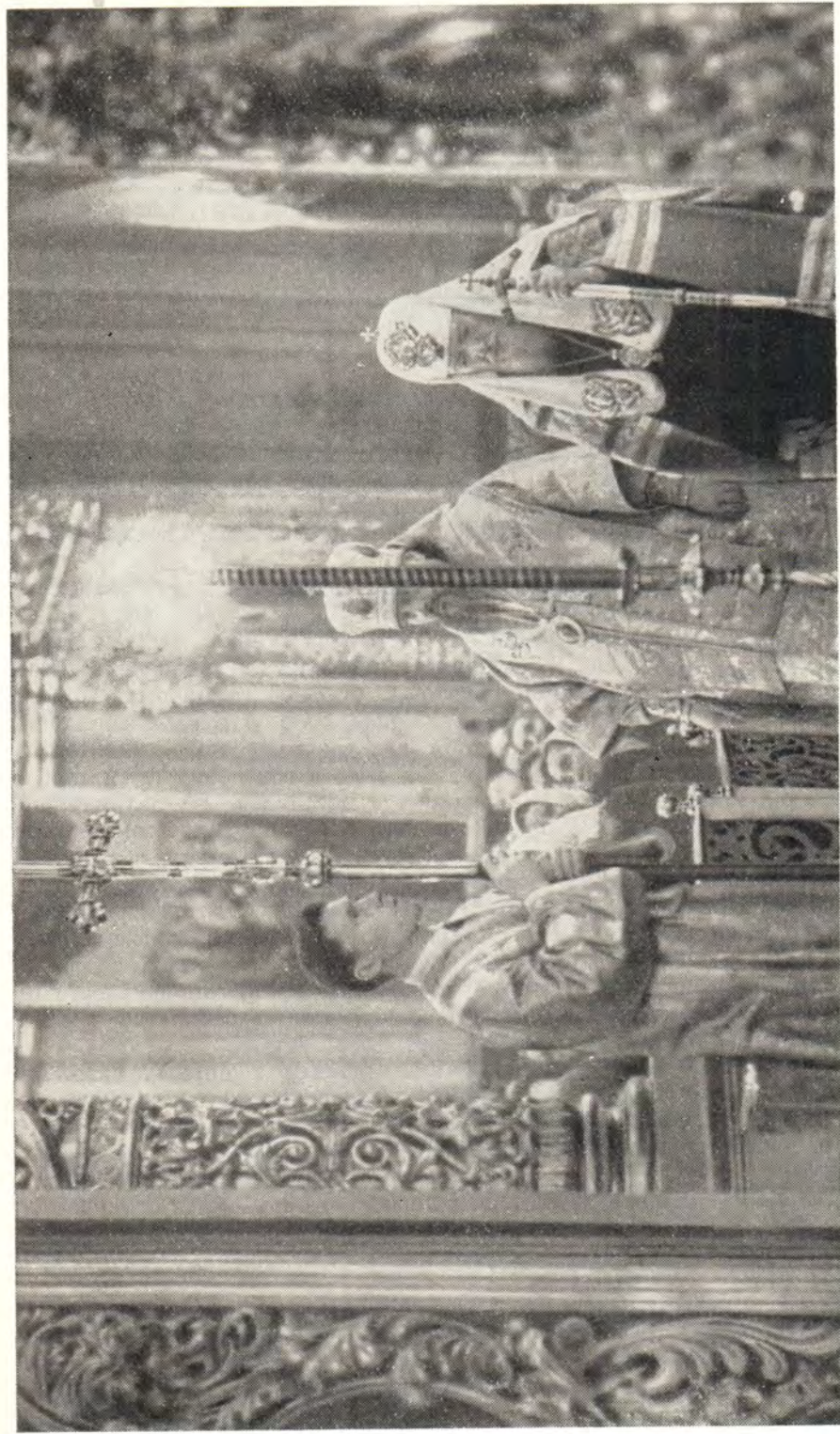
«ПРОСЛАВЛЕНИЕ ПРАЗДНИКА» В НАВЕЧЕРИЕ РОЖДЕСТВА ХРИСТОВА В БОГОЯВЛЕНСКОМ ПАТРИАРШЕМ СОБОРЕ. Справа от Святейшего Патриарха митрополит Пимен