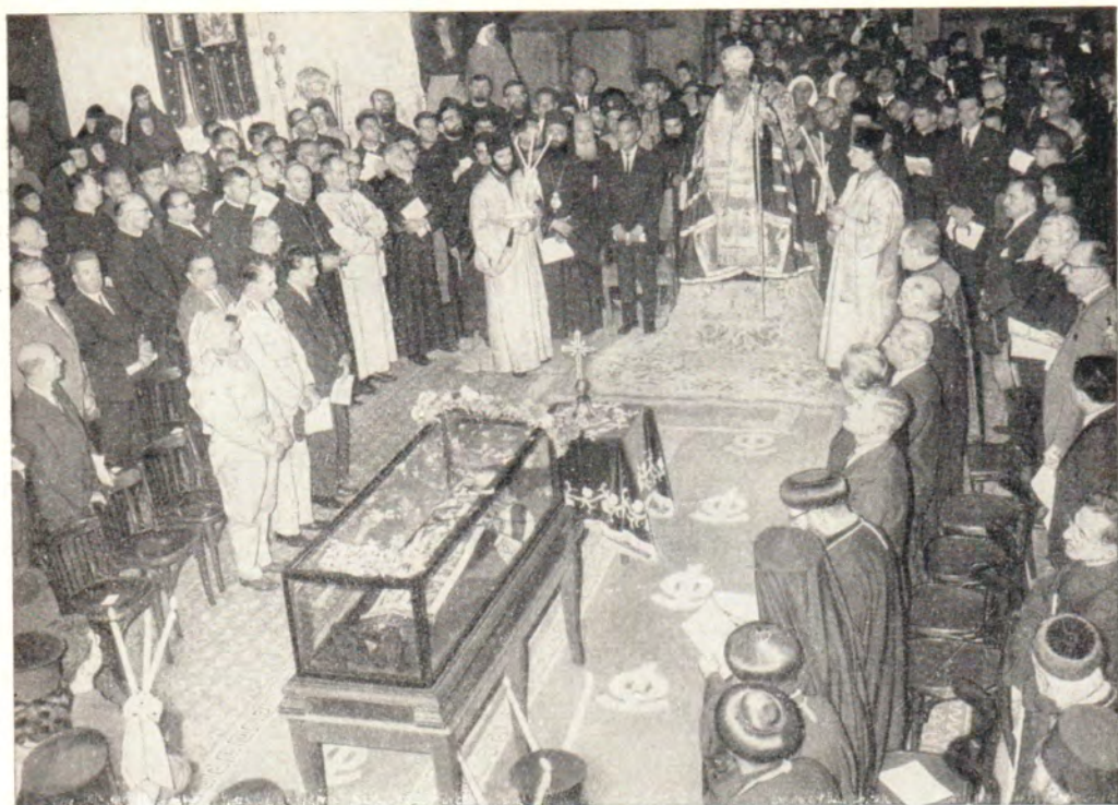
ТОРЖЕСТВЕННЫЙ МОЛЕБЕН В ХРАМЕ ВОСКРЕСЕНИЯ В ИЕРУСАЛИМЕ ПЕРЕД МОЩАМИ ПРЕПОДОБНОГО САВВЫ. В центре — Патриарх Иерусалимский Венедикт