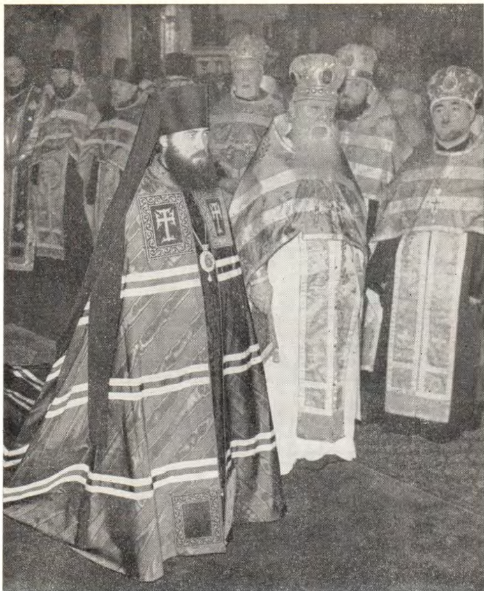
ЕПИСКОП ЮВЕНАЛИЙ СЛУШАЕТ СЛОВО МИТРОПОЛИТА НИКОДИМА ПЕРЕД ПОЛУЧЕНИЕМ ОТ НЕГО АРХИПАСТЫРСКОГО ЖЕЗЛА

нился Духа Святого, отныне сугубо почившего на тебе через молитву церковную и возложение рук нас, недостойных zde присутствующих соепископов, которым, как и всем преемникам святых апостолов, по бесконечной милости Бога нашего, несмотря и даже вопреки человеческого несовершенству и немощи каждого из них, во исполнение обетования Христова о пребывании Его с Церковью до скончания века, дана власть преподавать другдругопримательно этот божественный дар и освящать избранных Святой Церкви.