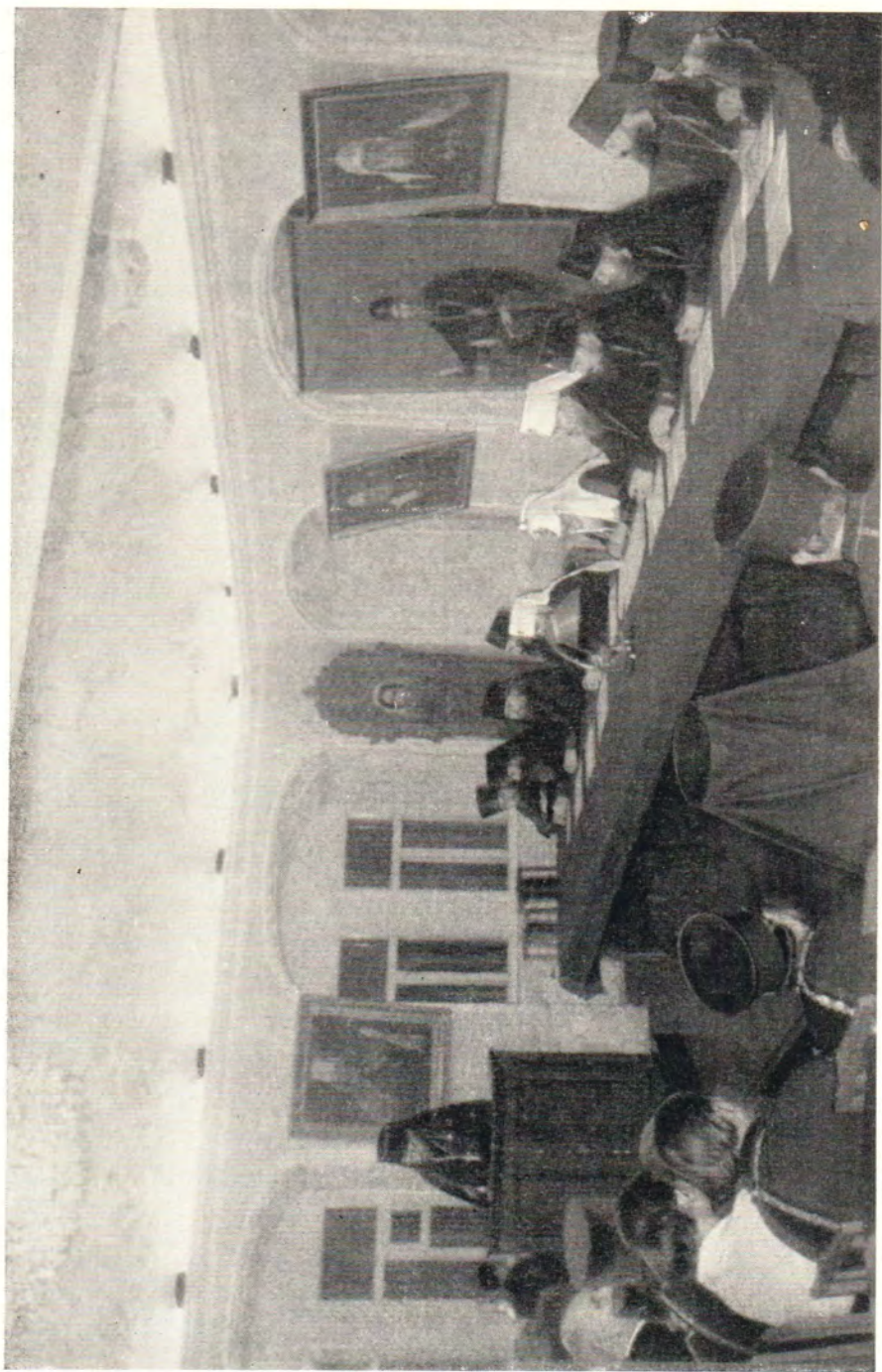
ВЕЧЕР ПАМЯТИ МИТРОПОЛИТА МОСКОВСКОГО ФИЛАРЕТА В МОСКОВСКОЙ ДУХОВНОЙ АКАДЕМИИ 14 декабря 1965 года. Доклад читает иеромонах Марк