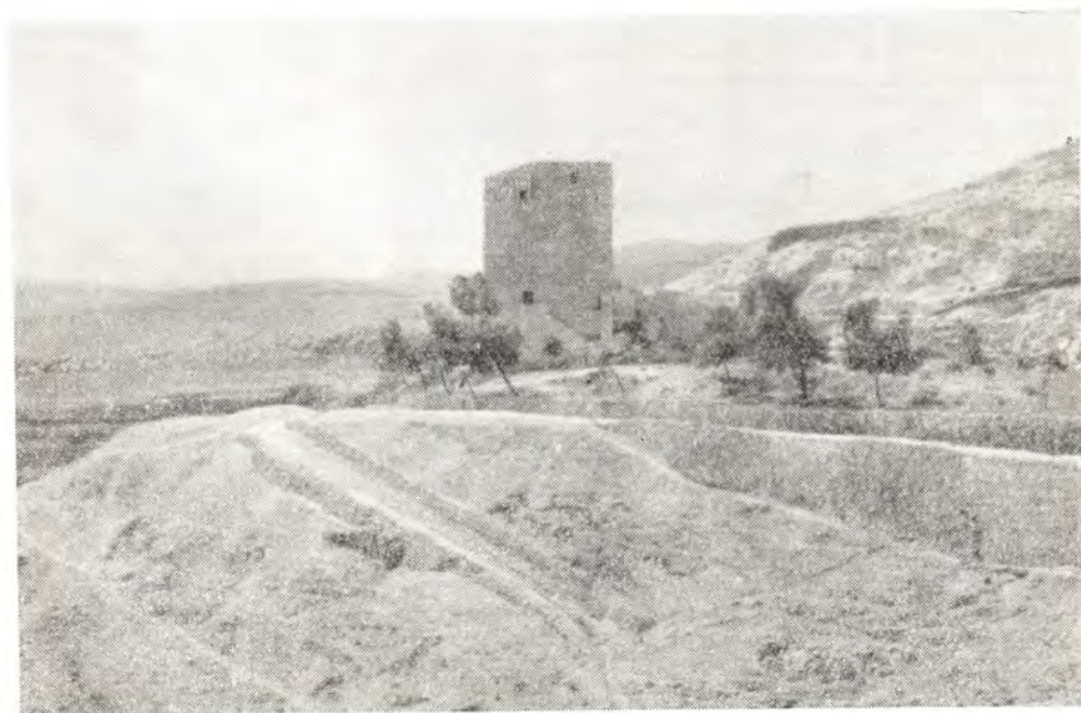
В ОКРЕСТНОСТЯХ ЛАВРЫ ПРЕП. САВВЫ ОСВЯЩЕННОГО