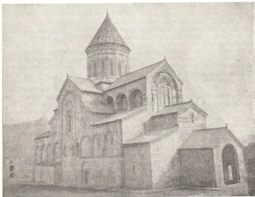
ХРАМ СВЕТИ-ЦХОВЕЛИ В МЦХЕТЕ

И ныне, как и прежде, знает верующая Грузия, много испытавшая за века своей истории, но и видевшая помощь Божию, что она никогда не будет оставлена Богом, ибо по Его Божественной воле она получила как великий дар, как щит и ограждение великую святыню — Хитон Господа и Спасителя нашего Иисуса Христа. Как и всегда, в истекшем году день 1 октября, праздник в честь Хитона Господня и Животворящего Столпа, был отмечен торжественным богослужением,