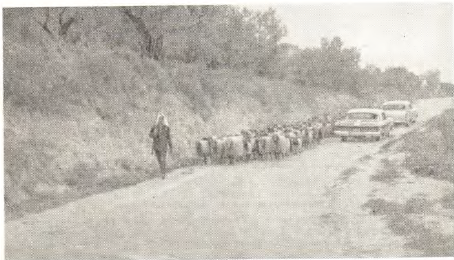
СОВРЕМЕННЫЙ ПАЛЕСТИНСКИЙ ПЕЙЗАЖ