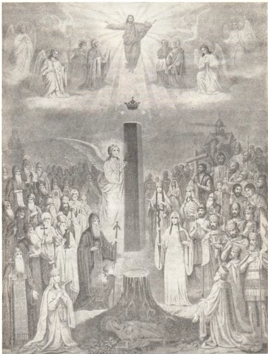
ИКОНА ПРАЗДНИКА ЖИВОТВОРЯЩЕГО СТОЛПА