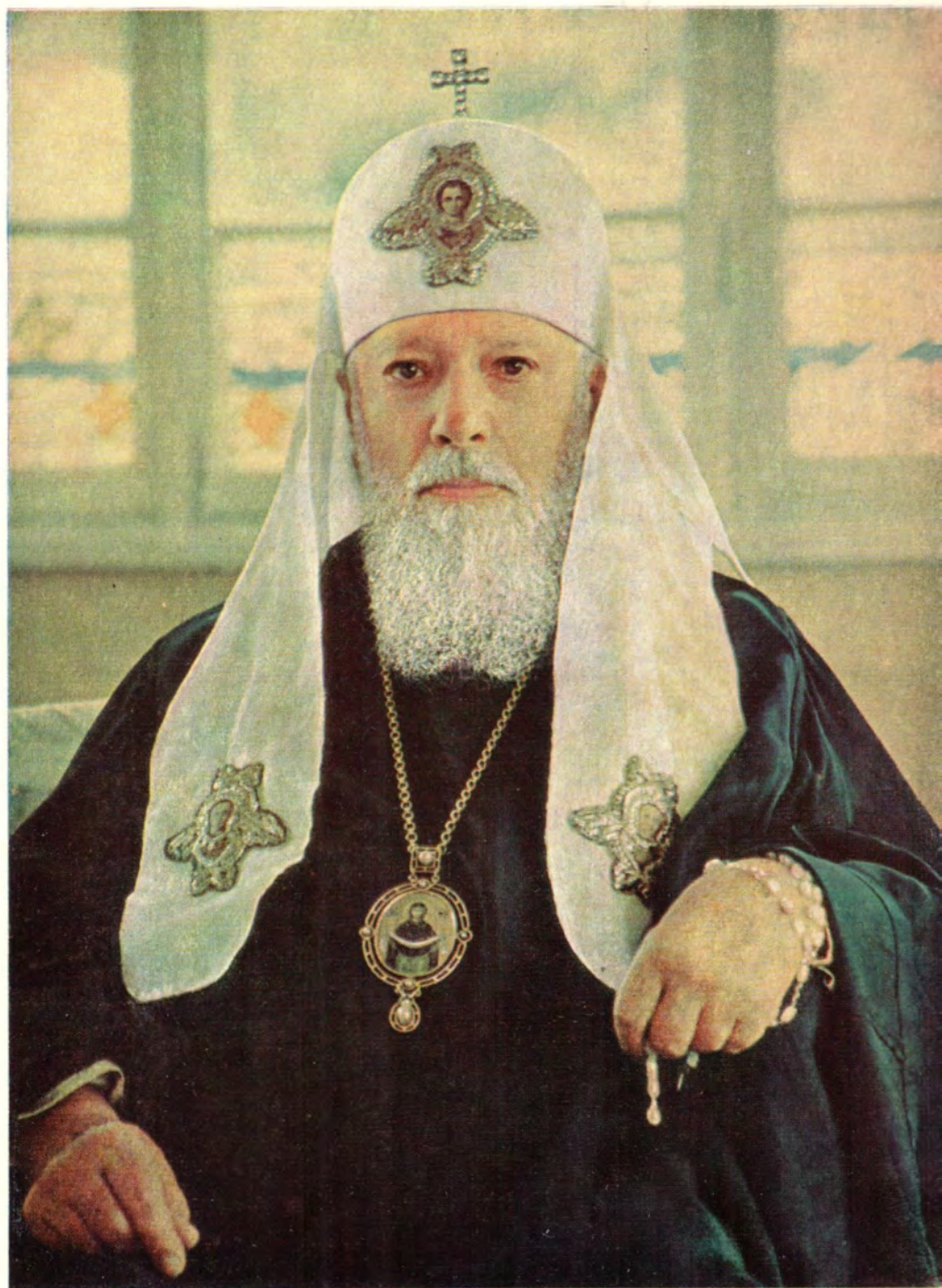
АЛЕКСИЙ Святейший Патриарх Московский и всея Руси