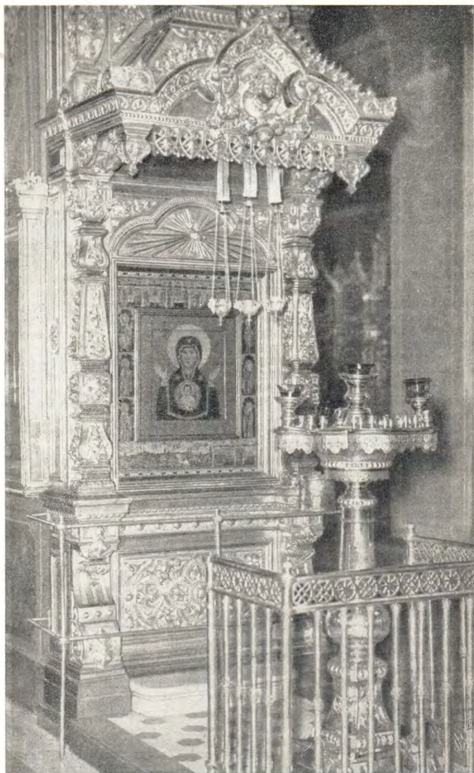
ИКОНА ЗНАМЕНΙΑ БОЖИЕЙ МАТЕРИ ЗНАМЕНСКОГО ХРАМА В МОСКВЕ