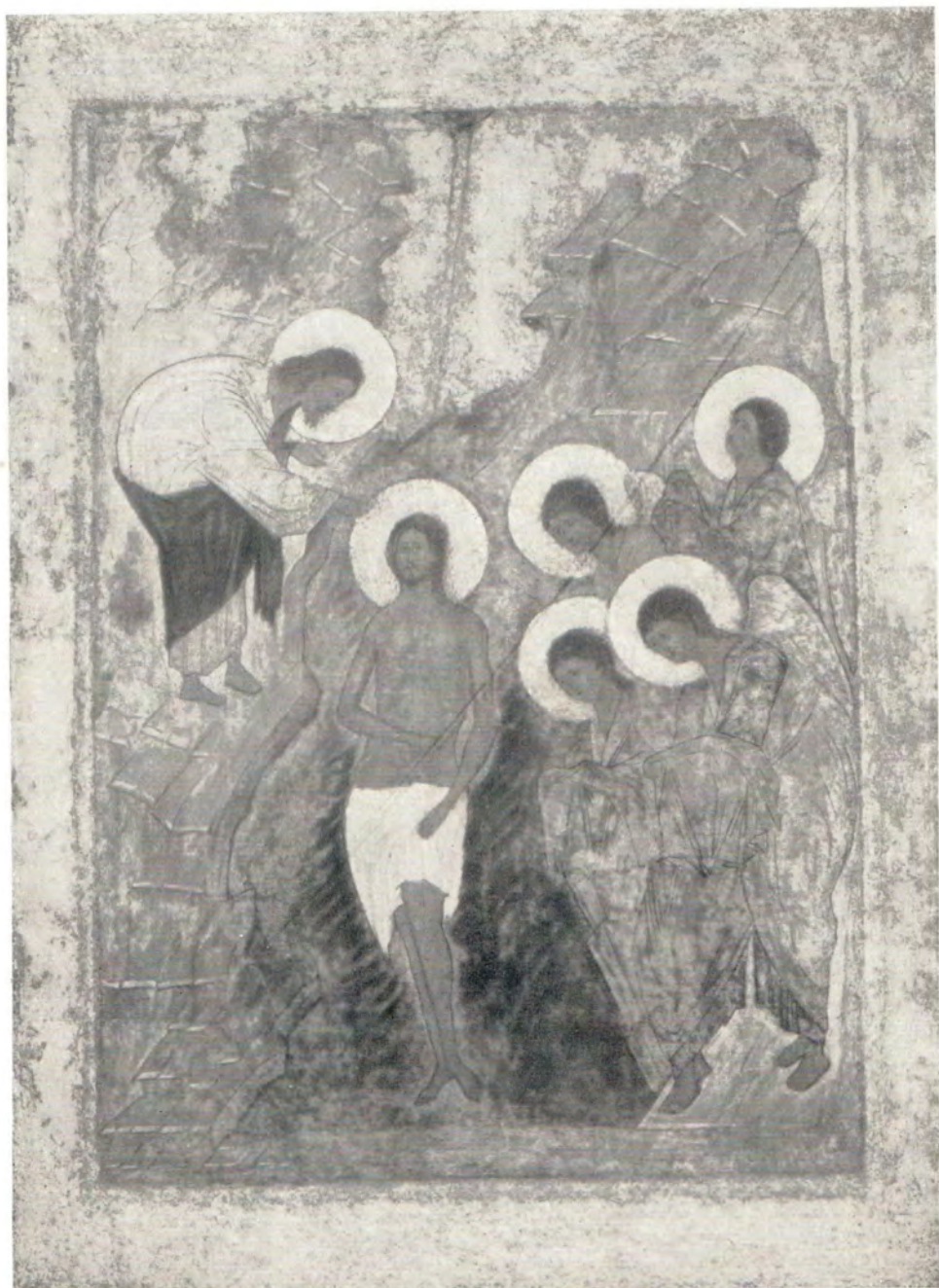
КРЕЩЕНИЕ ГОСПОДНЕ (Икона Троицкого собора Троице-Сергиевой Лавры)