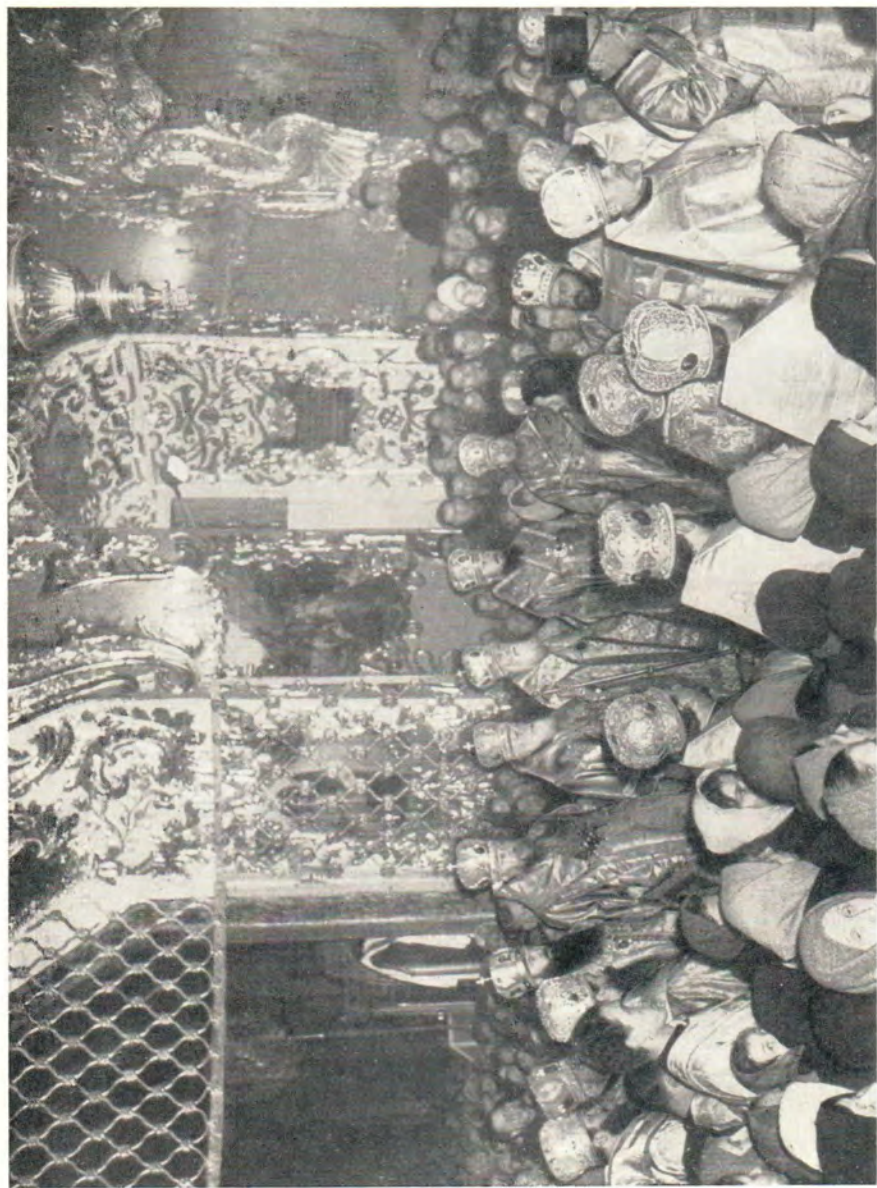
НА ХИРОТОНИИ АРХИМАНДРИТА ИОНАФАНА (КОПОЛОВИЧА) ВО ЕПИСКОПА ТЕГЕЛЬСКОГО в Трапезном храме Троице-Сергиевой Лавры 28 ноября 1965 г.