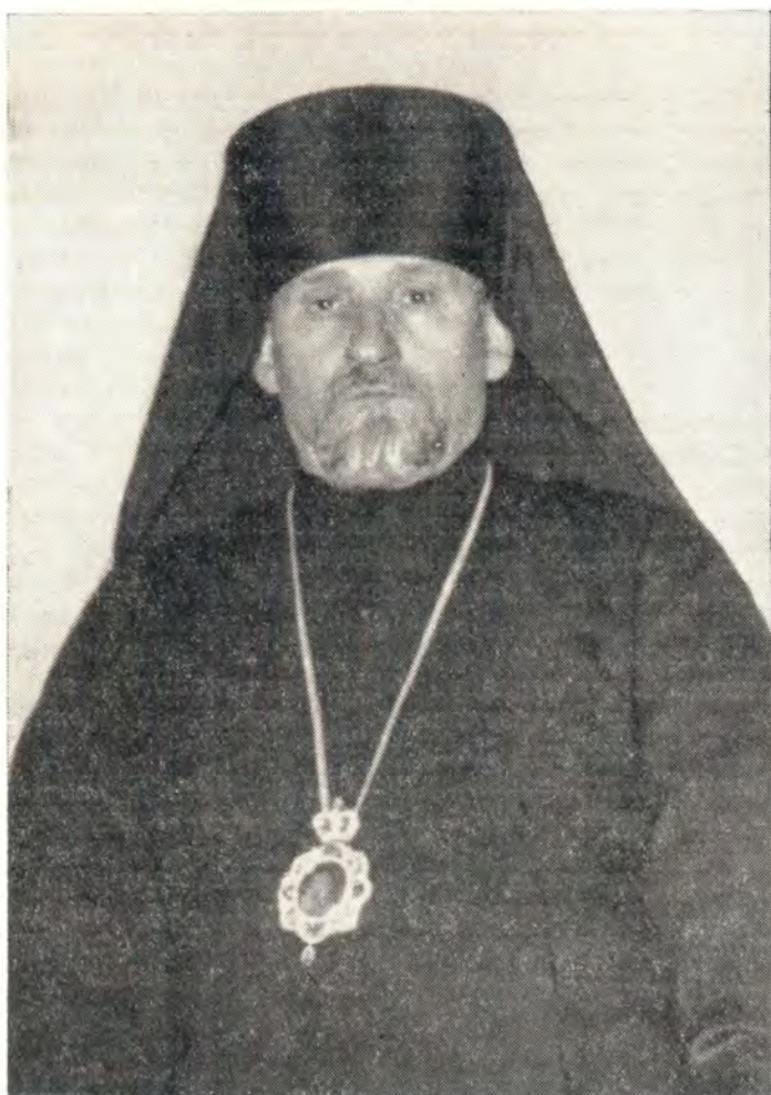
ИОНАФАН, ЕПИСКОП ТЕГЕЛЬСКИЙ, ВИКАРИЙ БЕРЛИНСКОЙ ЕПАРХИИ СРЕДНЕЕВРОПЕЙСКОГО ЭКЗАРХАТА

После окончания начальной четырехклассной школы он с 1923 по 1927 г. учился в реальной гимназии в Ужгороде.