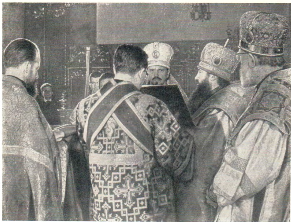
БОГОСЛУЖЕНИЕ В ПРАВОСЛАВНОМ УСПЕНСКОМ ХРАМЕ БУДАПЕШТА 17 октября 1965 г.