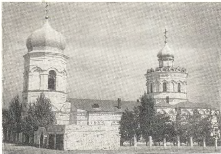
СОБОР В ЧЕСТЬ КАЗАНСКОЙ ИКОНЫ БОЖИЕЙ МАТЕРИ В ВОЛГОГРАДЕ

ство которых, восхищаясь героическим Волгоградом, оставляют в книге почетных посетителей записи о своих впечатлениях от посещения города и Казанского собора.