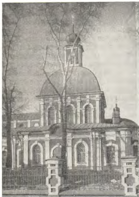
Храм Знамени Божией Матери

10 декабря (27 ноября ст. ст.) 1965 г. в храме в честь иконы Божией Матери «Знамение», что во 2-м Крестовском пер. в Москве, молитвенно отмечалось двухсотлетие его построения.