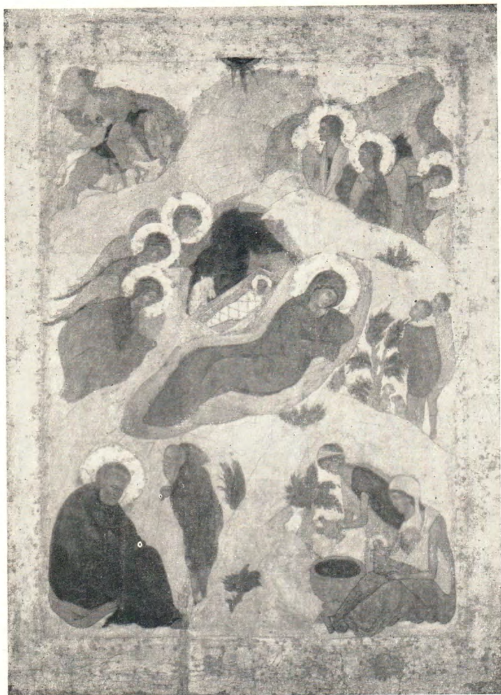
РОЖДЕСТВО ХРИСТОВО (Икона XV века)