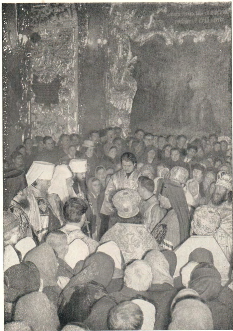
СВЯТЕЙШИЙ ПАТРИАРХ АЛЕКСИЙ ВРУЧАЕТ ЖЕЗЛ НОВОПОСТАВЛЕННОМУ ЕПИСКОПУ ЛЬВОВСКОМУ И ТЕРНОПОЛЬСКОМУ НИКОЛАЮ В СЕРГИЕВСКОМ ТРАПЕЗНОМ ХРАМЕ ТРОИЦЕ-СЕРГИЕВОЙ ЛАВРЫ 31 октября 1965 года