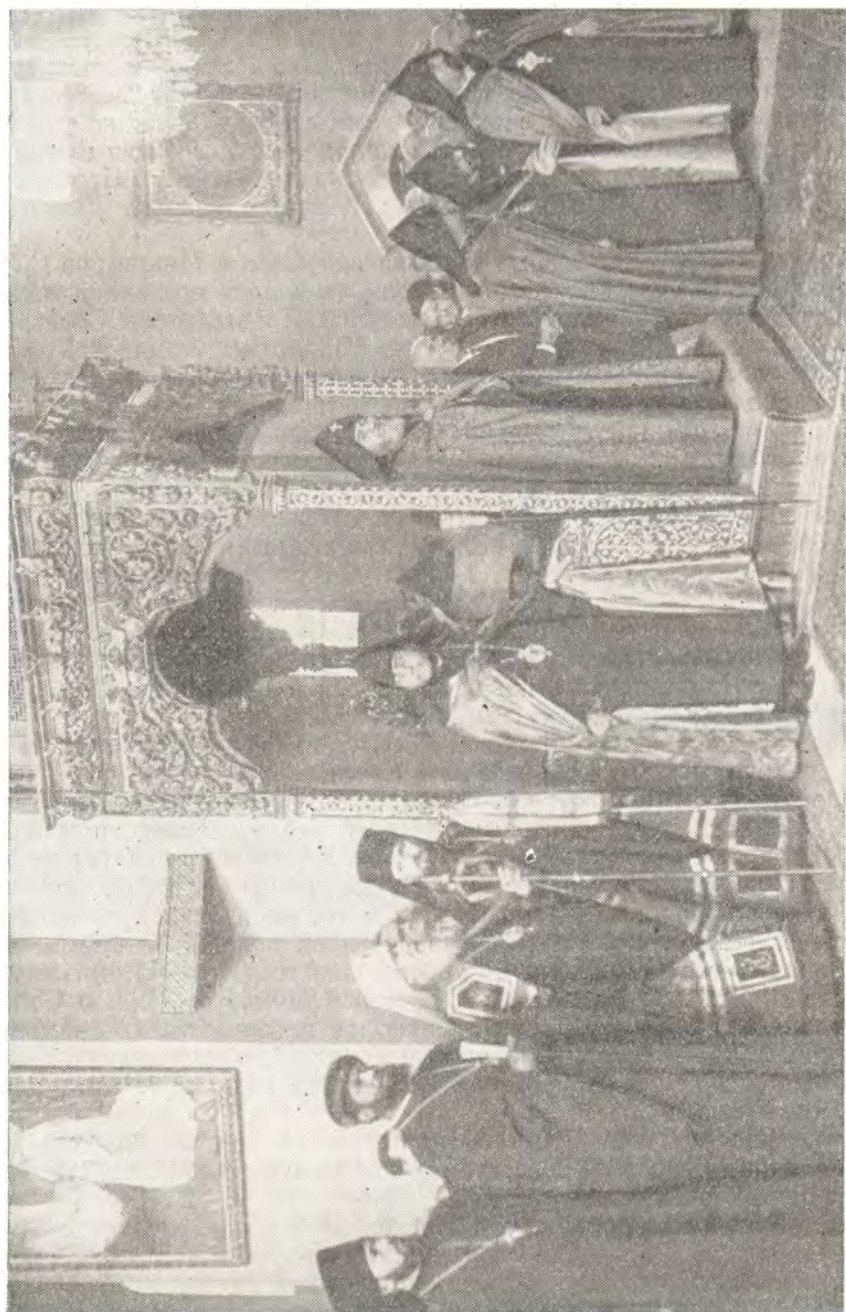
ТОРЖЕСТВЕННОЕ БОГОСЛУЖЕНИЕ В ЭЧМИАДЗИНСКОМ СОБОРЕ 31 октября 1965 г. Справа от Патриарха Католикоса Ваггена I — среди почетных гостей — митрополит Киевский и Галицкий Иоасаф и епископ Дмитровский Филарет.