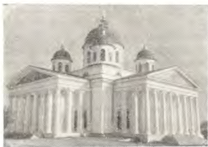
ВОСКРЕСЕНСКИЙ СОБОР В АРЗАМАСЕ

На центральной площади Арзамаса возвышается величественное здание Воскресенского собора. Этот храм-памятник воздвигнут на средства горожан по проекту архитектора М. П. Коринфского в память избавления России от нашествия французов в 1812 г.