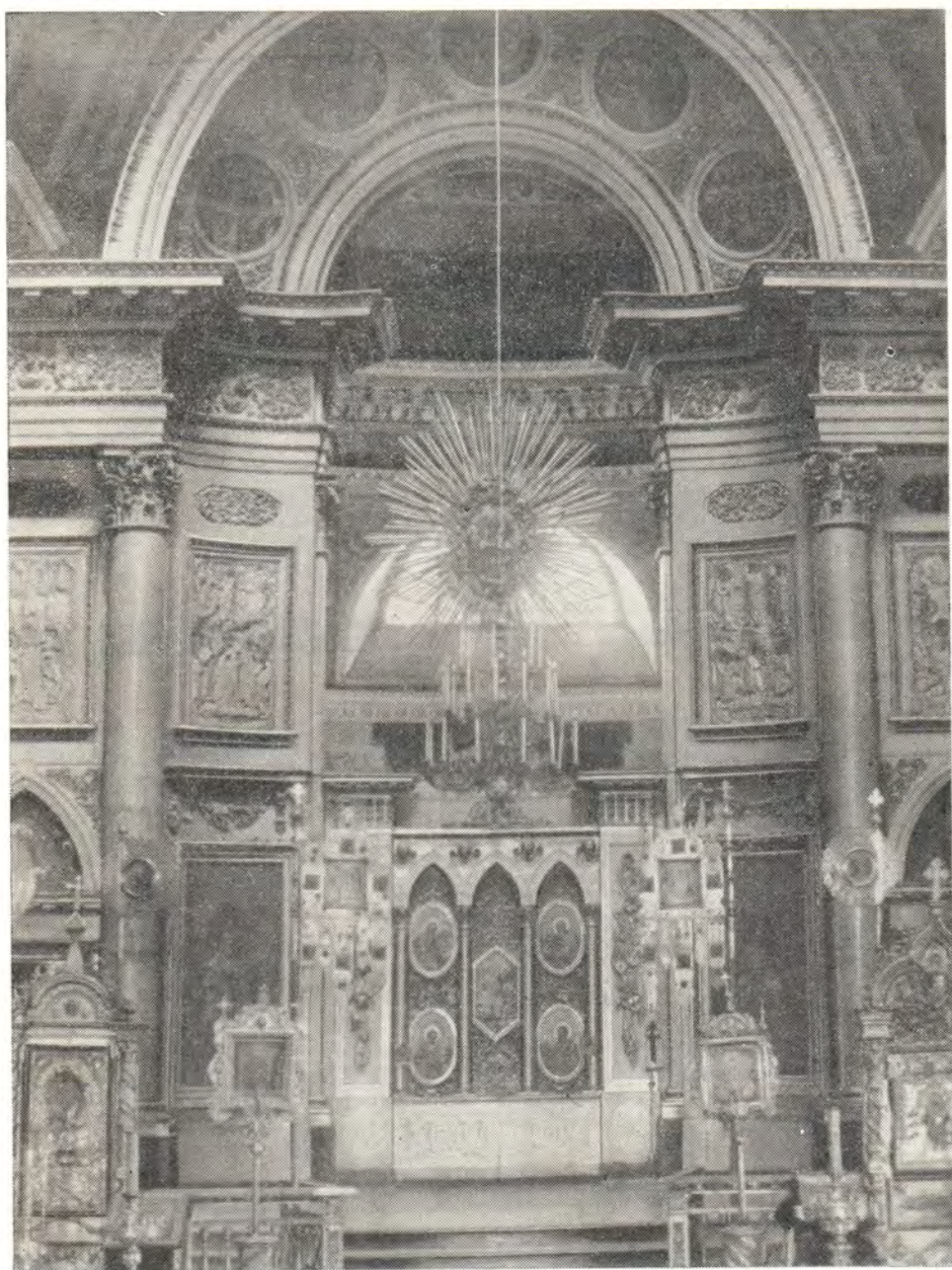
ГЛАВНЫЙ АЛТАРЬ — В ЧЕСТЬ ВОСКРЕСЕНИЯ ХРИСТОВА — В ВОСКРЕСЕНСКОМ СОБОРЕ г. АРЗАМАСА