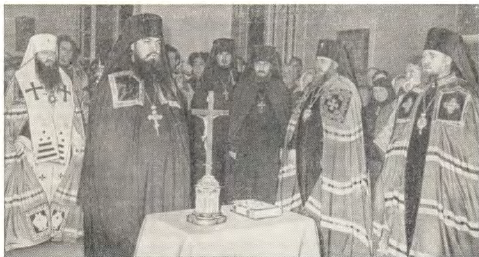
НАРЕЧЕНИЕ АРХИМАНДРИТА ФИЛАРЕТА ВО ЕПИСКОПА ТИХВИНСКОГО В ХРАМЕ ЛЕНИНГРАДСКОЙ ДУХОВНОЙ АКАДЕМИИ 23 октября 1965 г.

«Ваше Высокопреосвященство! Богомудрые архиереи и отцы! Бог наш великий и дивный, «неисповедимою благостию и богатым Промыслом управляя всяческая» (6-я свечильничная молитва вечерни), привел ныне мою жизненную стезю к великому и священному