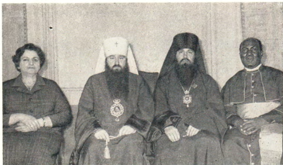
НА ПРИЕМЕ У ПРЕДСЕДАТЕЛЯ ОТДЕЛА ВНЕШНИХ ЦЕРКОВНЫХ СНОШЕНИИ МОСКОВСКОЙ ПАТРИАРХИИ МИТРОПОЛИТА ЛЕНИНГРАДСКОГО И ЛАДОЖ- СКОГО НИКОДИМА 24 октября 1965 г. Слева направо: г-жа Мэри Дауд, митропо- лит Никодим, епископ Тихвинский Филарет и пастор Аруна К. Нельсон, настоя- тель англиканского собора в Аккре (Гана)