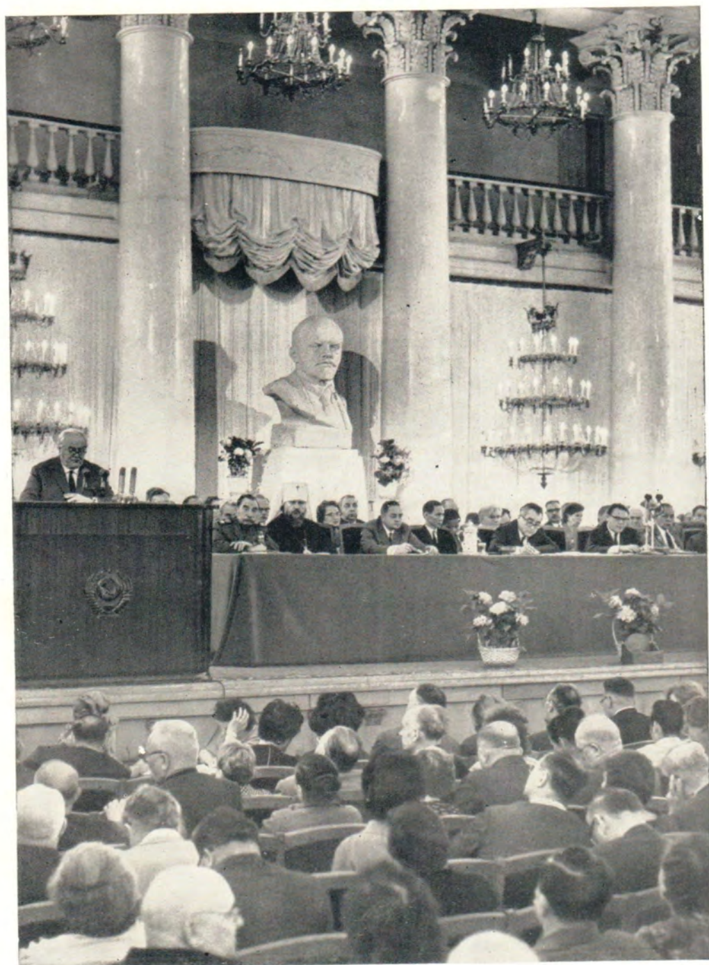
УЧАСТНИКИ ВСЕСОЮЗНОЙ КОНФЕРЕНЦИИ ПРЕДСТАВИТЕЛЕЙ СОВЕТСКОЙ ОБЩЕСТВЕННОСТИ ЗА МИР, НАЦИОНАЛЬНУЮ НЕЗАВИСИМОСТЬ И РАЗОРУЖЕНИЕ В КОЛОННОМ ЗАЛЕ ДОМА СОЮЗОВ 17 июня 1965 года