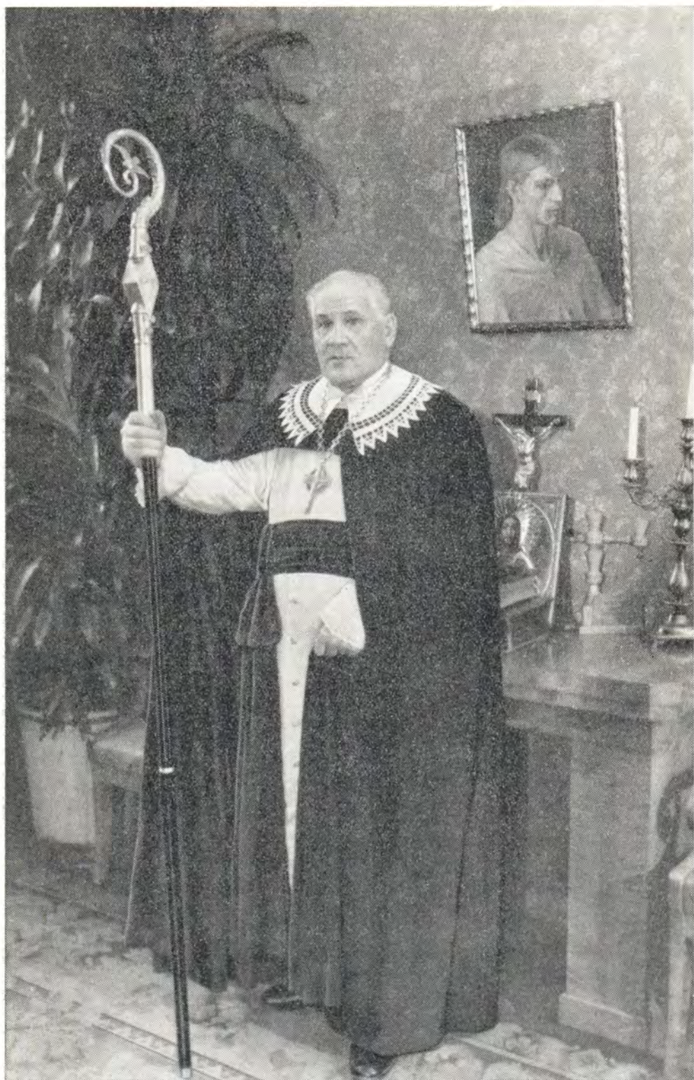
АРХИЕПИСКОП ГУСТАВ ТУРС, ГЛАВА ЕВАНГЕЛИЧЕСКО-ЛЮТЕРАНСКОЙ ЦЕРКВИ В ЛАТВИИ