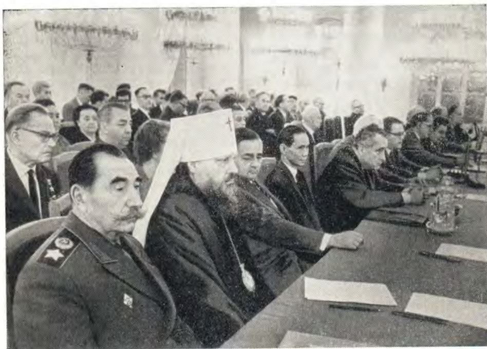
ЗА СТОЛОМ ПРЕЗИДИУМА ВСЕСОЮЗНОЙ КОНФЕРЕНЦИИ ПРЕДСТАВИТЕЛЕЙ СОВЕТСКОЙ ОБЩЕСТВЕННОСТИ ЗА МИР, НАЦИОНАЛЬНУЮ НЕЗАВИСИМОСТЬ И РАЗОРУЖЕНИЕ

Один за другим на трибуну поднимались представители советской общественности. Они рассказывали о том, что делается в советских