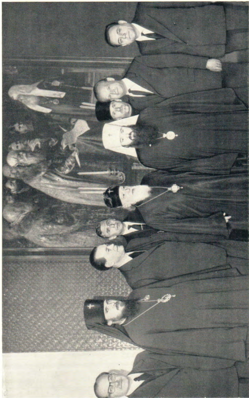
ДЕЛЕГАЦИЯ ЭКУМЕНИЧЕСКОГО СОВЕТА ЦЕРКВЕЙ ВЕНГРИИ НА ПРИЕМЕ У СВЯТЕЙШЕГО ПАТРИАРХА АЛЕКСИЯ, 10 июня 1965 года