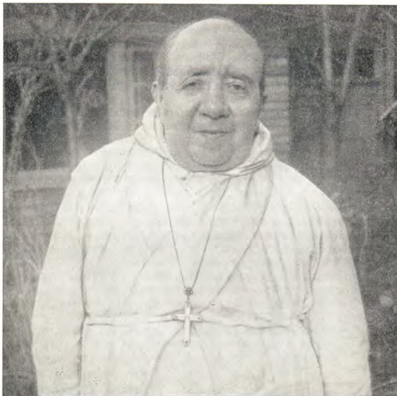
АРХИМАНДРИТ ДИОНИСИИ (ШАМБО)

Эти слова робкой надежды вызвали у нас чувство невыразимой грусти. Милый наш друг! Он так хотел еще пожить на земле, послужить Богу и людям! Но болезнь все более углублялась, не позволив ему служить ни на Страстной, ни на Пасхе. Сильно страдая, он, как писали