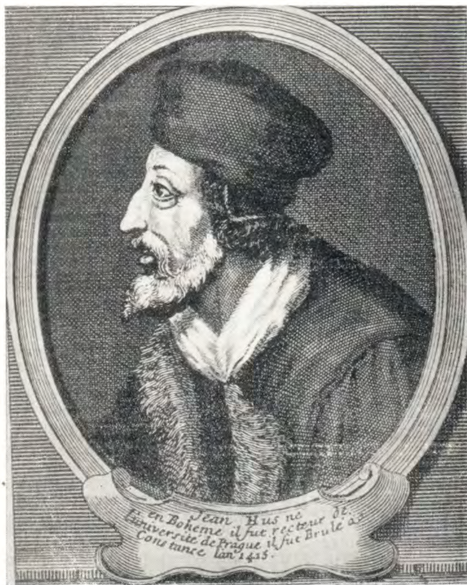
ЯН ГУС (со старинной гравюры)

ным с его планом действий или с его пониманием действительности, и потому отмечает в своем рвении не только отжившее и не соответствующее его идеалам или назначению, но и непреходящее, жизненное, подлинно ценное, иногда притом невозместимое. Гус сочувственно относился к взглядам английского реформатора Джона Виклифа (1320—1384) на папство и к его критике злоупотреблений и нравственной испорченности католического клира того времени. Однако он не разделял заблуждений Виклифа относительно догматов веры. В сочинениях Виклифа он находил только «источник вдохновения для стремлений к свободе национально-религиозного духа от ига папской тирании» («Православная богословская энциклопедия», т. 4, стр. 836). «Гус не создавал и не хотел создавать какой-либо новой христианской самостоятельной общины или Церкви: он стремился только возвратить Римско-Католическую Церковь к идеалу первобытной апостольской Церкви»