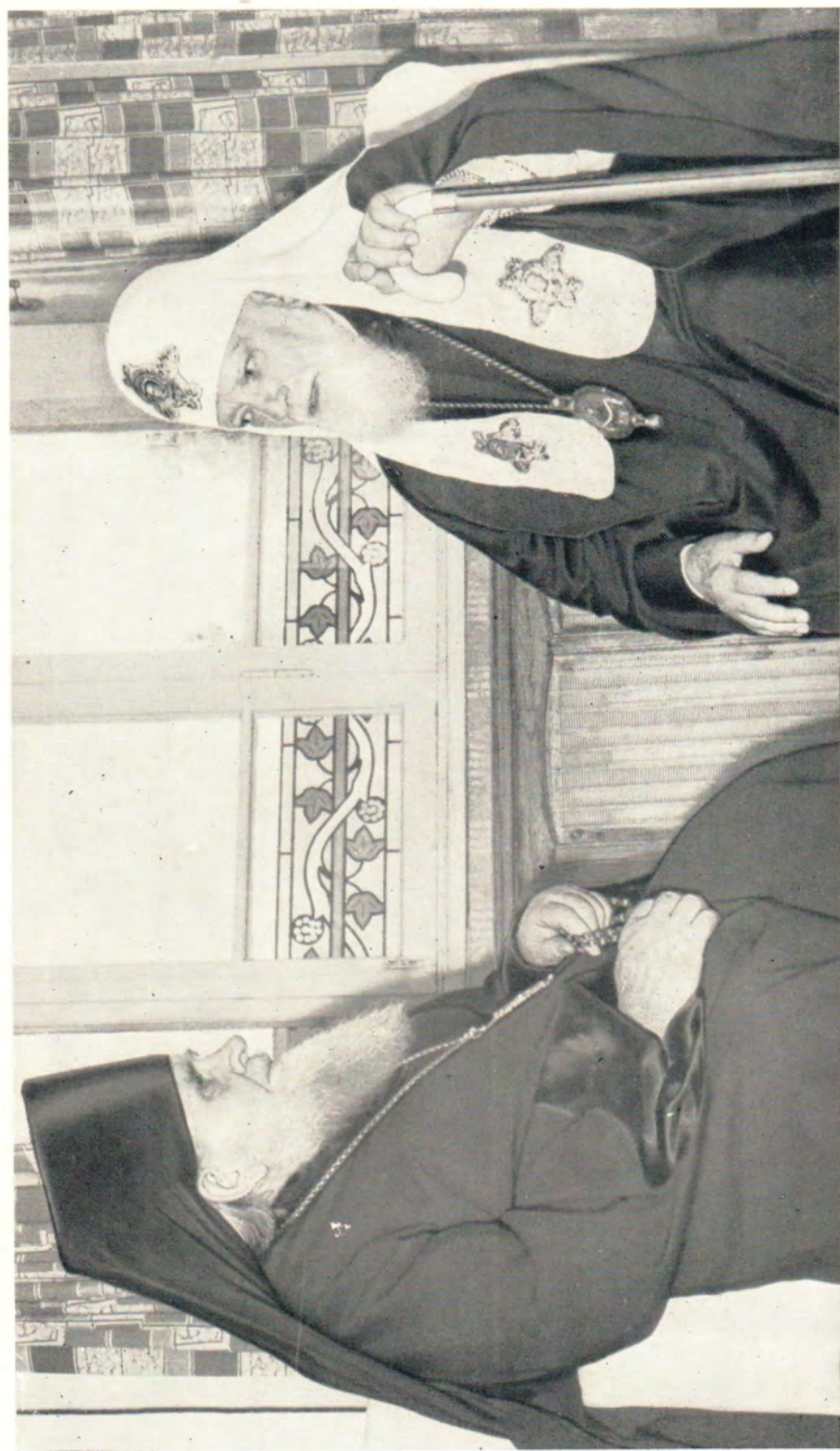
СВЯТЕЙШИЙ ПАТРИАРХ АЛЕКСИЙ БЕСЕДУЕТ С ГЛАВОЙ ПОЛЬСКОЙ ПРАВОСЛАВНОЙ ЦЕРКВИ МИТРОПОЛИТОМ ВАРШАВСКИМ И ВСЕЯ ПОЛЬШИ СТЕФАНОМ, Июль 1965 г.