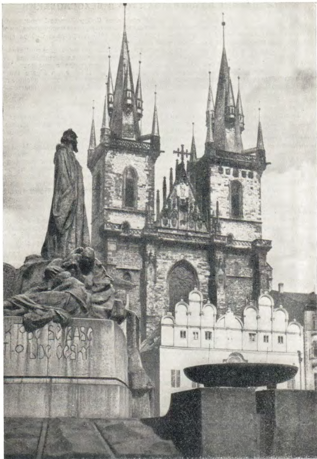
ПАМЯТНИК ЯНУ ГУСУ НА СТАРОМЕСТСКОЙ ПЛОЩАДИ В ПРАГЕ