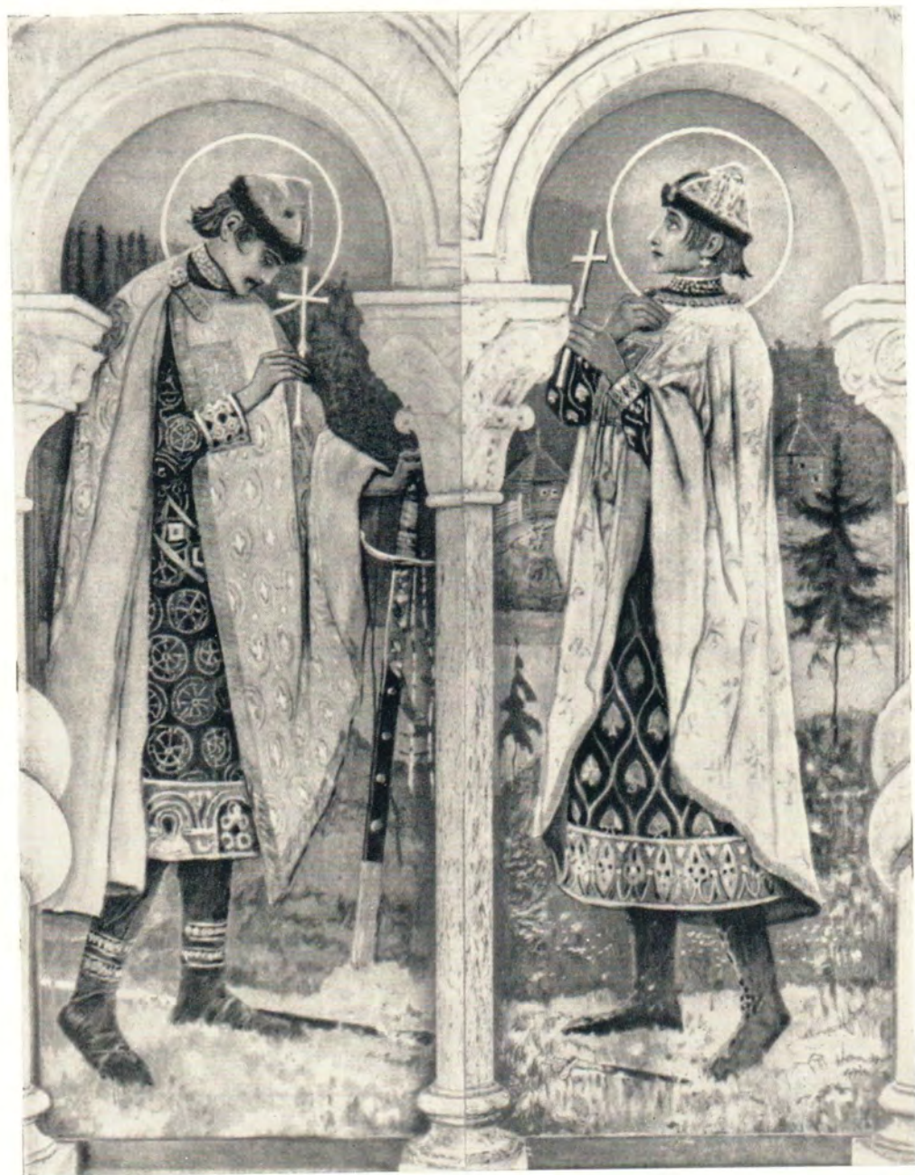
СВВ. БОРИС И ГЛЕБ (из иконостаса Борисоглебского придела Владимирского собора в Киеве; художник М. В. Нестеров)