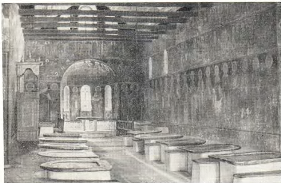
ТРАПЕЗНАЯ ВЕЛИКОЙ ЛАВРЫ СВ. АФАНАСИЯ НА АФОНЕ

братская беседа между Патриархами и главами делегаций. Свои мысли высказывали прежде всего Святейшие Патриархи. Образно и красноречиво говорил Предстоятель Болгарской Церкви Святейший Патриарх Кирилл. «Ваше Святейшество,— обратился он к Святейшему Патриарху Афинагору,— Господь взыщет с Вас, а история Вас осудит, если в Ваше Патриаршество угаснут славянские лампы на Святой Горе». Мне выпала исключительная честь быть переводчиком Владыки Никодима, говорившего здесь от имени Московского Патриархата о русских и других славянских обителях на Святой Горе, о запусчении их, о желательности получить разрешение на приезд новых иноков из славянских стран, хотящих проходить свой монашеский подвиг в земном жребии Богоматери, и о необходимости создания всеправославной координационной