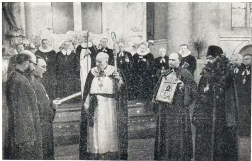
В ДЕНЬ 75-летия АРХИЕПИСКОПА ГУСТАВА ТУРСА ПРОТ. Н. ТРУБЕЦКОЙ ЗАЧИТЫВАЕТ ПРИВЕТСТВЕННЫЙ АДРЕС ОТ РУССКОЙ ПРАВОСЛАВНОЙ ЦЕРКВИ ЮБИЛЯРУ

24 мая 1965 года Архиепископ Евангелическо-Лютеранской Церкви в Латвии д-р богословия Густав Турс отмечал 75-летие со дня своего рождения. В юбилейном торжестве приняли участие Преосвященный Никон, епископ Рижский и Латвийский (Русская Православная Церковь), епископ Римско-Католической Церкви в Латвии Ю. Вайвод, Архиепископ Евангелическо-Лютеранской Церкви в Эстонии д-р Ян