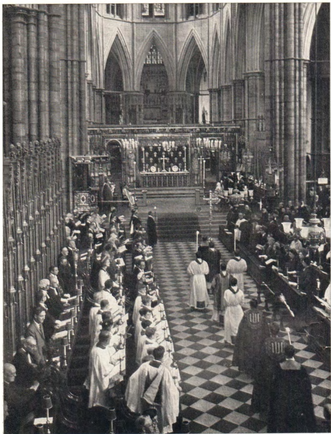
ТОРЖЕСТВЕННОЕ БОГОСЛУЖЕНИЕ ПО СЛУЧАЮ ПОСЕЩЕНИЯ СВЯТЕЙШИМ ПАТРИАРХОМ АЛЕКСИЕМ ВЕСТМИНСТЕРСКОГО АББАТСТВА В ЛОНДОНЕ 27 сентября 1964 года