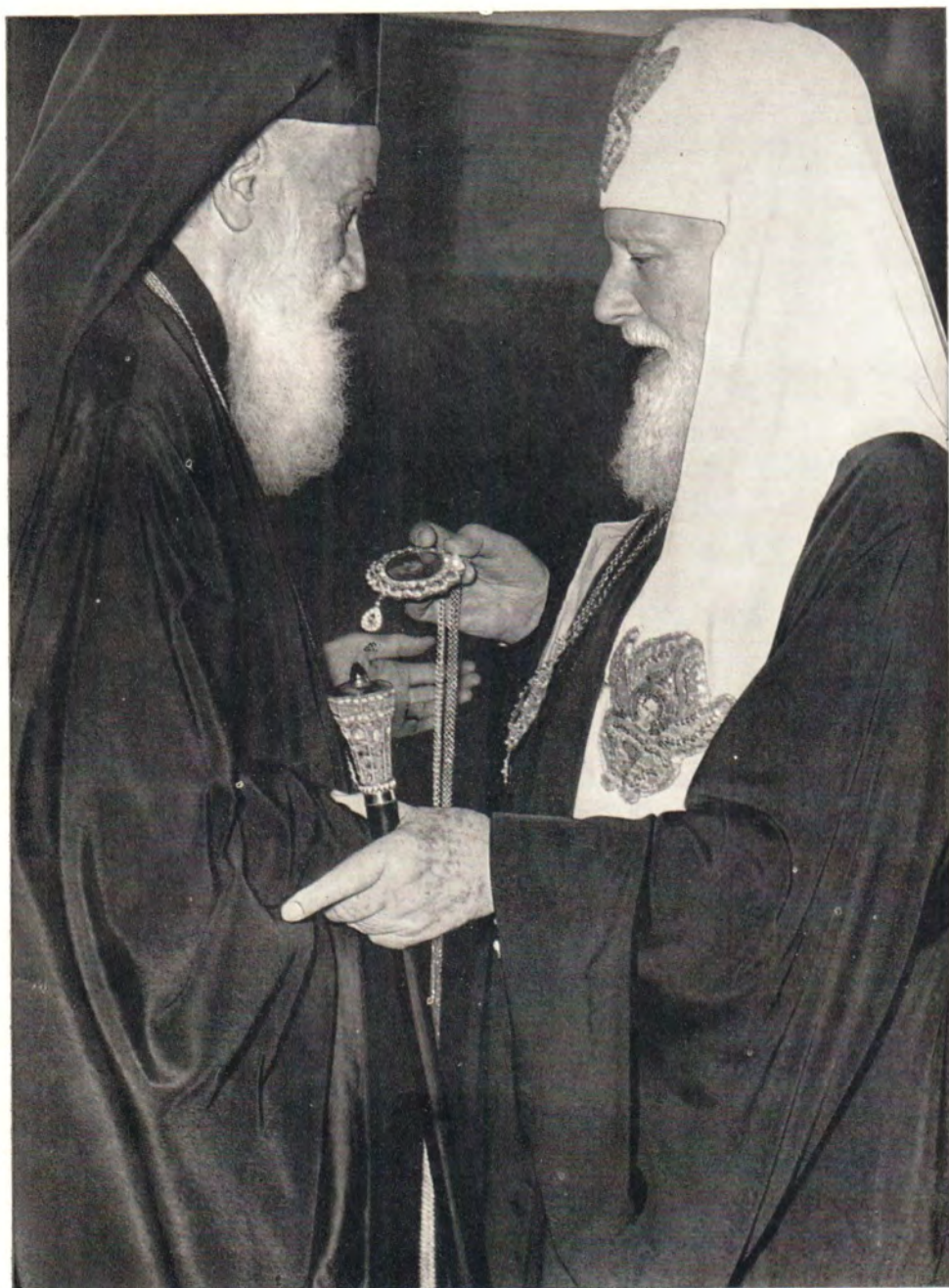
СВЯТЕЙШИЙ ПАТРИАРХ АЛЕКСИЙ ПРЕПОДНОСИТ БЛАЖЕННЕЙШЕМУ АРХИЕПИСКОПУ АФИНСКОМУ ХРИЗОСТУ ДРАГОЦЕННУЮ ПАНАГИЮ В ПАМЯТЬ О ПОСЕЩЕНИИ АФИН 23 сентября 1964 года