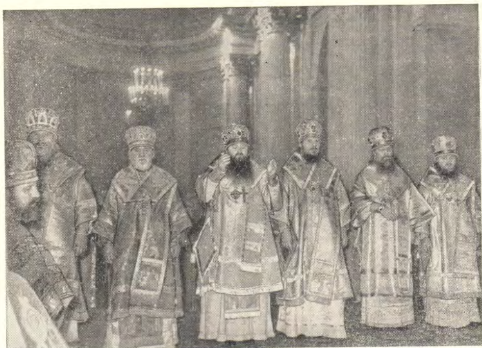
ЗА БОЖЕСТВЕННОЙ ЛИТУРГИЕЙ В ТРОИЦКОМ СОБОРЕ Б. АЛЕКСАНДРО-НЕВСКОЙ ЛАВРЫ