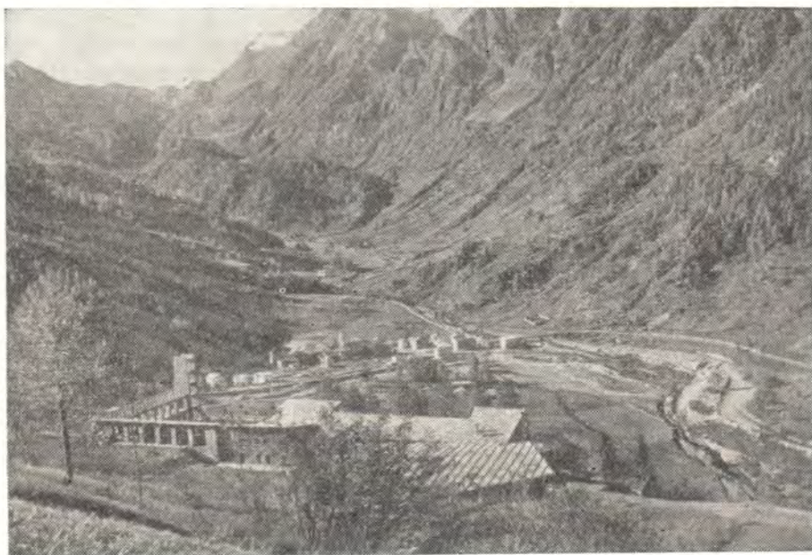
ИТАЛИЯ, ПРАТИ. НА ПЕРЕДНЕМ ПЛАНЕ — ЗДАНИЯ ОБЩИНЫ «АГАПЭ»