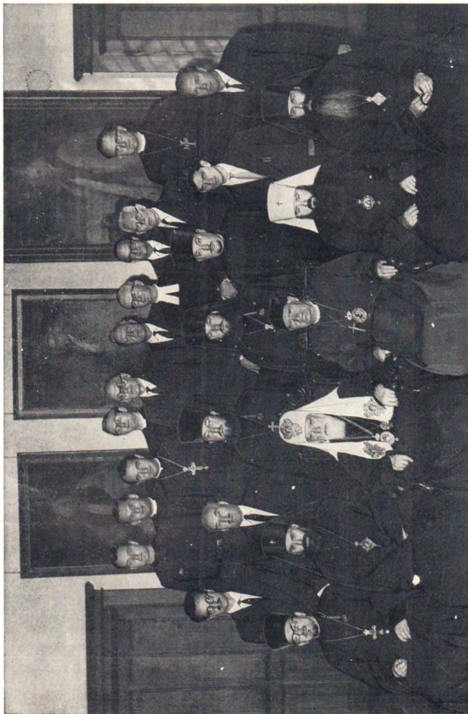
СВЯТЕЙШИЙ ПАТРИАРХ АЛЕКСИЙ И АРХИЕПИСКОП КЕНТЕРБЕРИЙСКИЙ МИХАИЛ РАМСЕЙ С ИХ СВИТОЙ В ЛАМБЕТСКОМ ДВОРЦЕ 28 сентября 1964 года