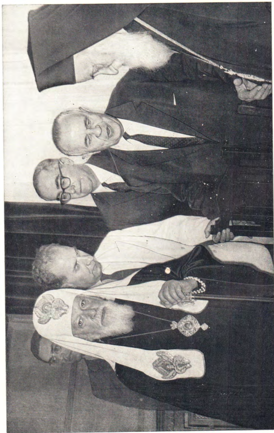
НА ПРИЕМЕ В АФИНСКОЙ АРХИЕПИСКОПИИ 23 сентября 1964 года