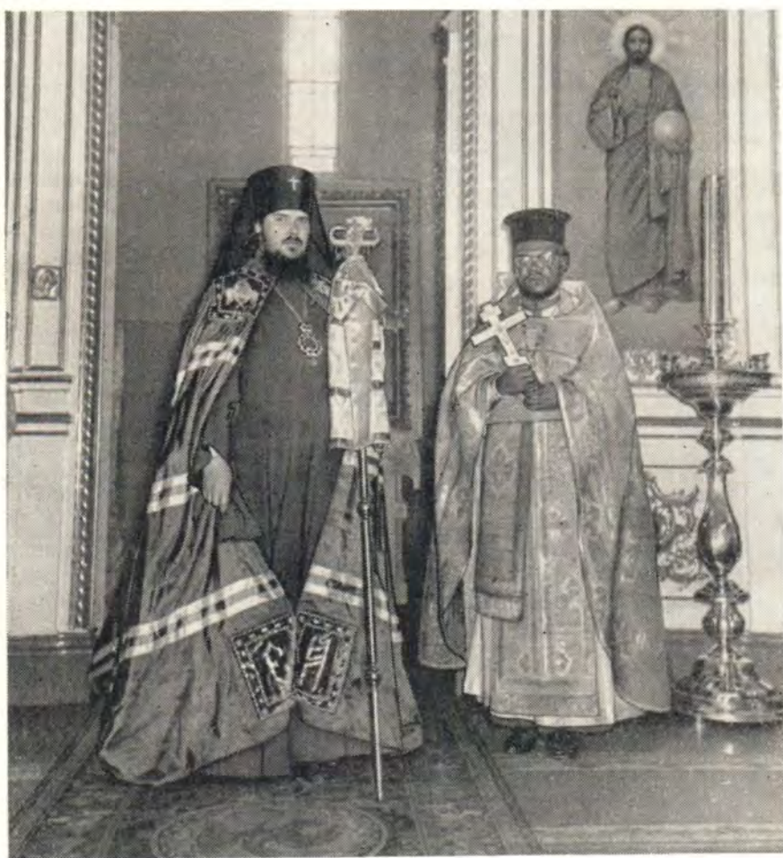
УСПЕНСКИЙ СОБОР ПЮХТИЦКОГО МОНАСТЫРЯ. ПОСЛЕ ЛИТУРГИИ