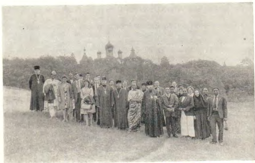
В ОКРЕСТНОСТЯХ ПЮХТИЦКОГО МОНАСТЫРЯ