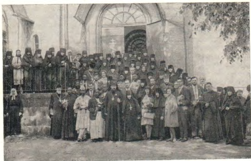
ВОЗЛЕ УСПЕНСКОГО СОБОРА В ПЮХТИЦКОМ МОНАСТЫРЕ