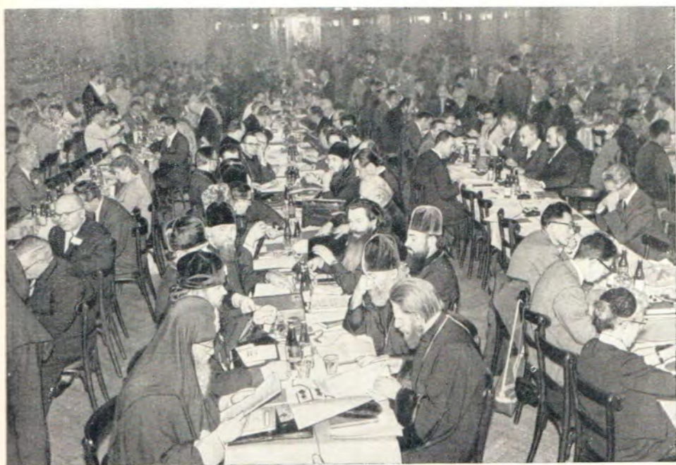
ДЕЛЕГАЦИИ ГРУЗИНСКОЙ И РУССКОЙ ПРАВОСЛАВНЫХ ЦЕРКВЕЙ В ЗАЛЕ ЗАСЕДАНИЙ КОНГРЕССА