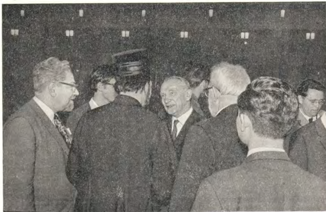
ПРЕЗИДЕНТ ХМК ПРОФ. И. ГРОМАДКА БЕСЕДУЕТ С ДЕЛЕГАТАМИ КОНГРЕССА

пятствий, лежащих на пути к истинному миру и международному сосуществованию... Приступая к своей работе, участники II ВМК должны оглянуться на I ВМК, состоявшийся три года тому назад. Мы собрались тогда,— говорил д-р Громадка,— как последователи Евангелия и в свете проповеди о Распятом и Воскресшем Иисусе Христе посмотрели на самих себя, на наши Церкви и на мир с его смятением и беспокойством, с его стремлением к миру и освобождению от страха и тревоги. Через всю нашу работу проходило сознание, что наша борьба за мир на земле должна вестись с глубокой верой, евангельской любовью и с надеждой на будущее... Теперь мы сошлись снова в многочисленном собрании и хотим продолжить то, что мы говорили и к чему обязались в прошлые годы и что должно оставаться нашей целью и задачей в будущем... Чем дольше мы работали, тем больше убеждались в том, что мы должны прежде всего работать сами над собой в свете и в силе Евангелия, чтобы достигнуть той подлинности и правдивости, без которых невозможно вступление людей в действительное сообщество сердец и труда».