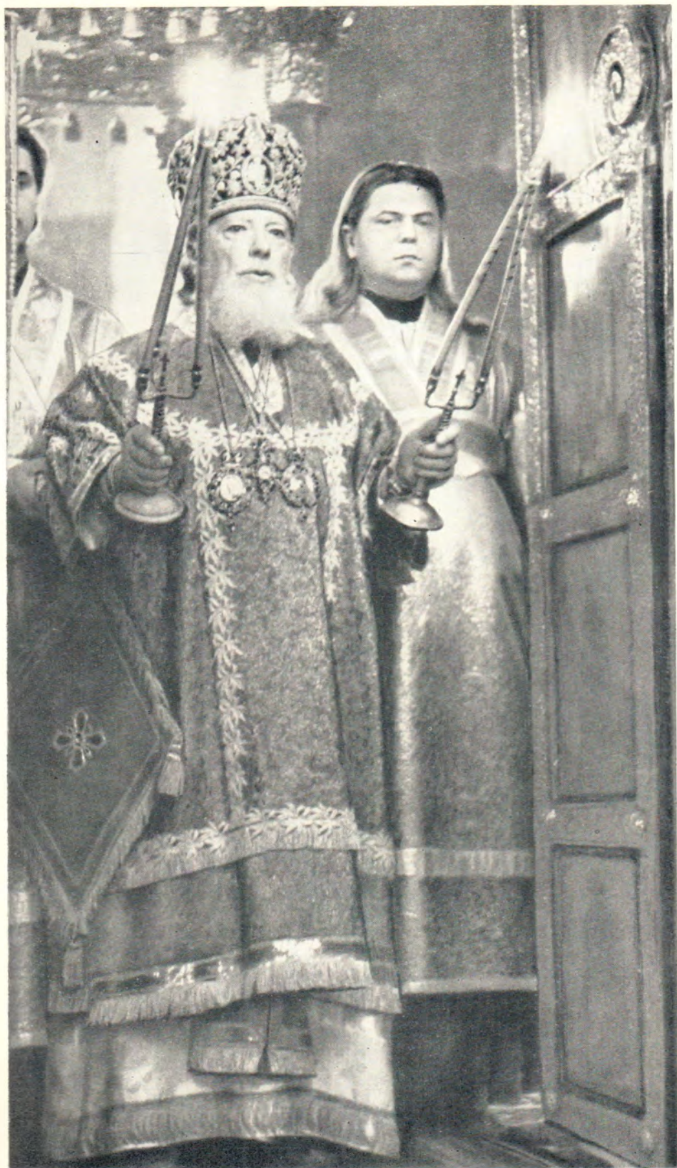
СВЯТЕЙШИЙ ПАТРИАРХ АЛЕКСИЙ ЗА БОЖЕСТВЕННОЙ ЛИТУРГИЕЙ В ТРОИЦКОМ СОБОРЕ ТРОИЦЕ-СЕРГИЕВОЙ ЛАВРЫ 18 июля 1964 года