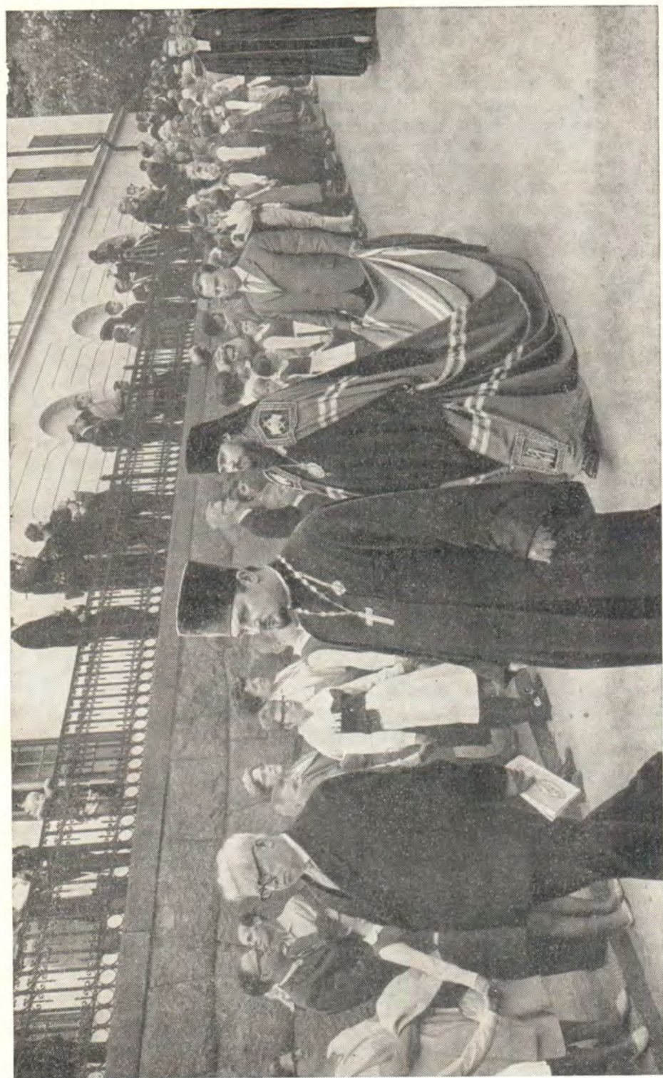
ЧЛЕНЫ ДЕЛЕГАЦИИ РУССКОЙ ПРАВОСЛАВНОЙ ЦЕРКВИ ВО ВРЕМЯ ЦЕРЕМОНИАЛЬНОГО ШЕСТВИЯ ИЗ УНИВЕРСИТЕТА В КАФЕДРАЛЬНЫЙ СОБОР 13 ИЮНЯ 1964 Г.