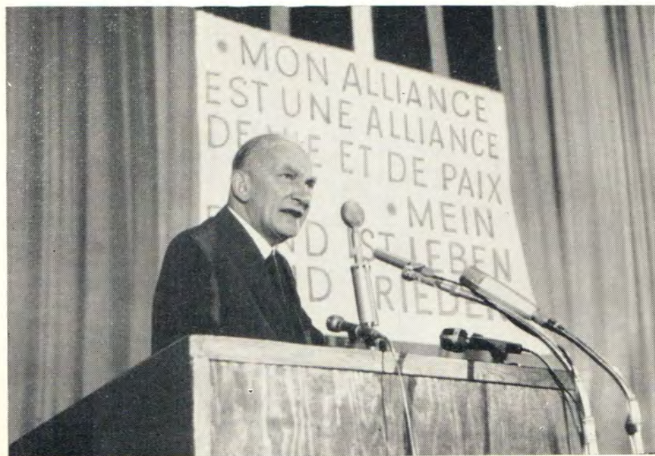
ПРЕЗИДЕНТ ХРИСТИАНСКОЙ МИРНОЙ КОНФЕРЕНЦИИ ПРОФ. И. ГРОМАДКА ВЫСТУПАЕТ НА ПЛЕНАРНОМ ЗАСЕДАНИИ КОНГРЕССА