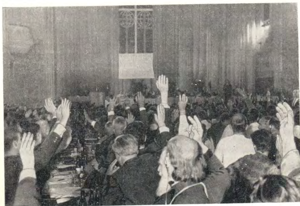
ПЛЕНАРНОЕ ЗАСЕДАНИЕ КОНГРЕССА. МОМЕНТ ГОЛОСОВАНИЯ