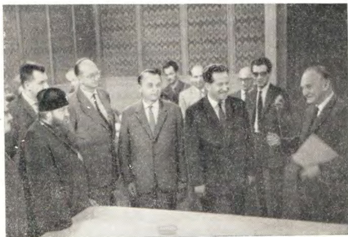
СОВЕТНИК ПОСОЛЬСТВА СССР В ПРАГЕ А. Е. МАЛЫШЕВ ВРУЧИЛ ПОСЛАНИЕ Н. С. ХРУЩЕВА КОНГРЕССУ НА ПРИЕМЕ В ПОСОЛЬСТВЕ ПРЕЗИДИУМУ КОНГРЕССА 2 июля 1964 г.