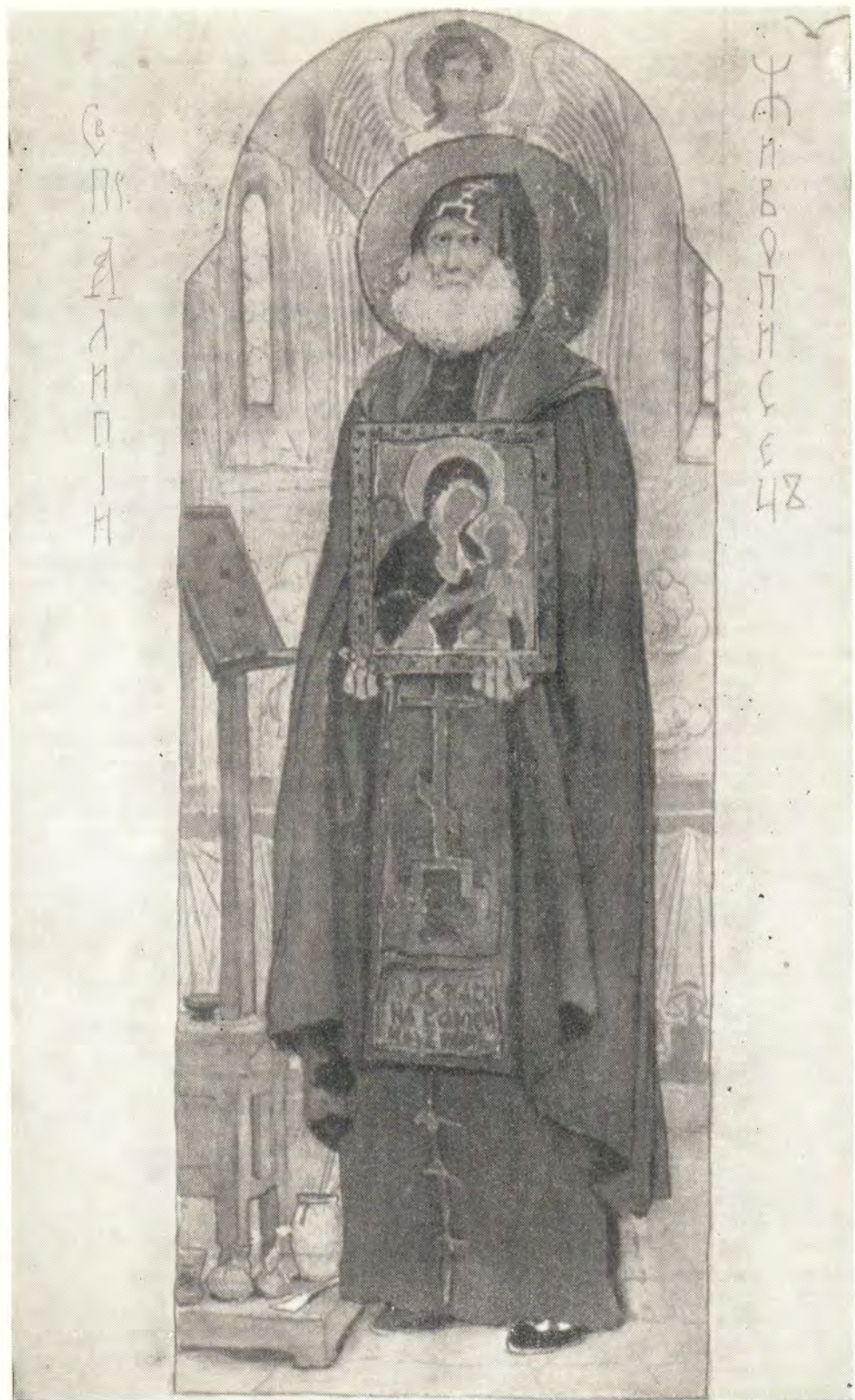
ПРЕП. АЛИПИИ, ИКОНОПИСЕЦ ПЕЧЕРСКИЙ (эскиз В. М. Васнецова, Гос. Третьяковская галерея)