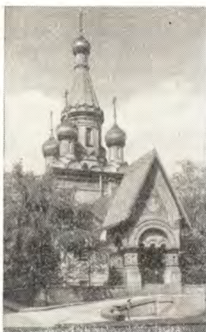
РУССКИЙ ХРАМ СЯТИТЕЛЯ НИКОЛАЯ В СОФИИ

В начале светлого и нарядного Русского бульвара, переходящего за городом в Царьградское шоссе, возвышается, сияя золотом своих луковичных главок, одно из прекраснейших зданий болгарской столицы — храм Святителя Николая Чудотворца, более известный под именем Русской церкви. Этот замечательный образец русского зодчества не поражает своими размерами, занимает небольшой участок на взгорье, но, возвышаясь среди окружающих его белых берез и кустов сирени и жасмина, он пленяет соразмерностью и стройностью своих форм и живостью красок. Этот, как бы волшебством перенесенный с далекого севера, кусочек Руси занимает видное место в архитектурном ансамбле города и составляет одно из лучших его украшений.