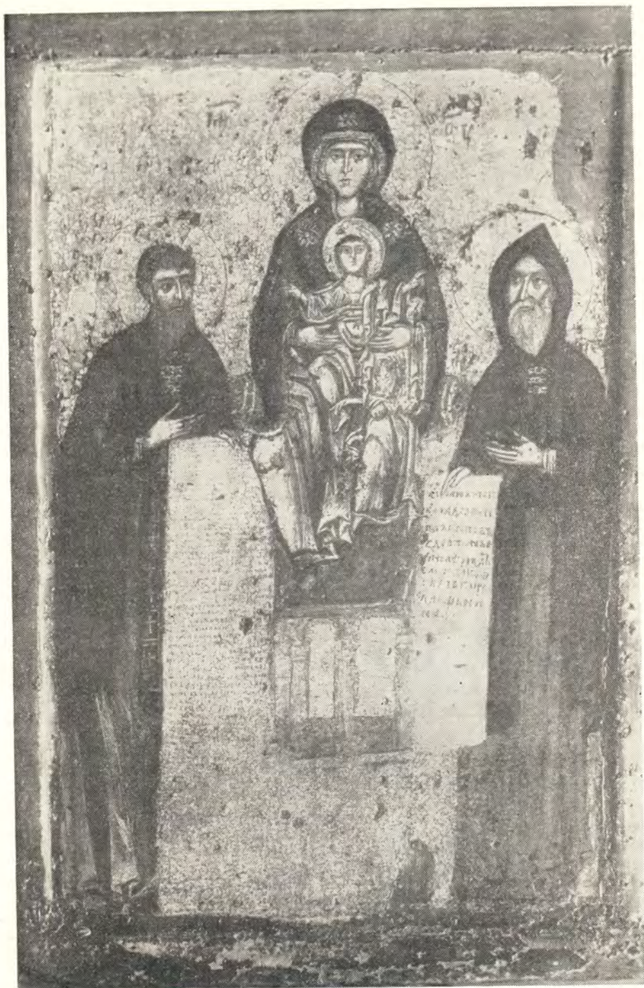
«СВЕНСКАЯ» ИКОНА БОЖИЕЙ МАТЕРИ С АНТОНИЕМ И ФЕОДОСИЕМ ПЕЧЕРСКИМИ