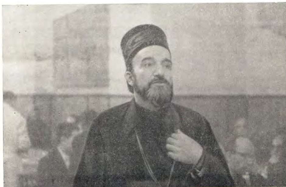
ВЫСТУПАЕТ ЕПИСКОП БАНЯЛУКСКИЙ АНДРЕЙ, НАБЛЮДАТЕЛЬ ОТ СЕРБСКОЙ ЦЕРКВИ