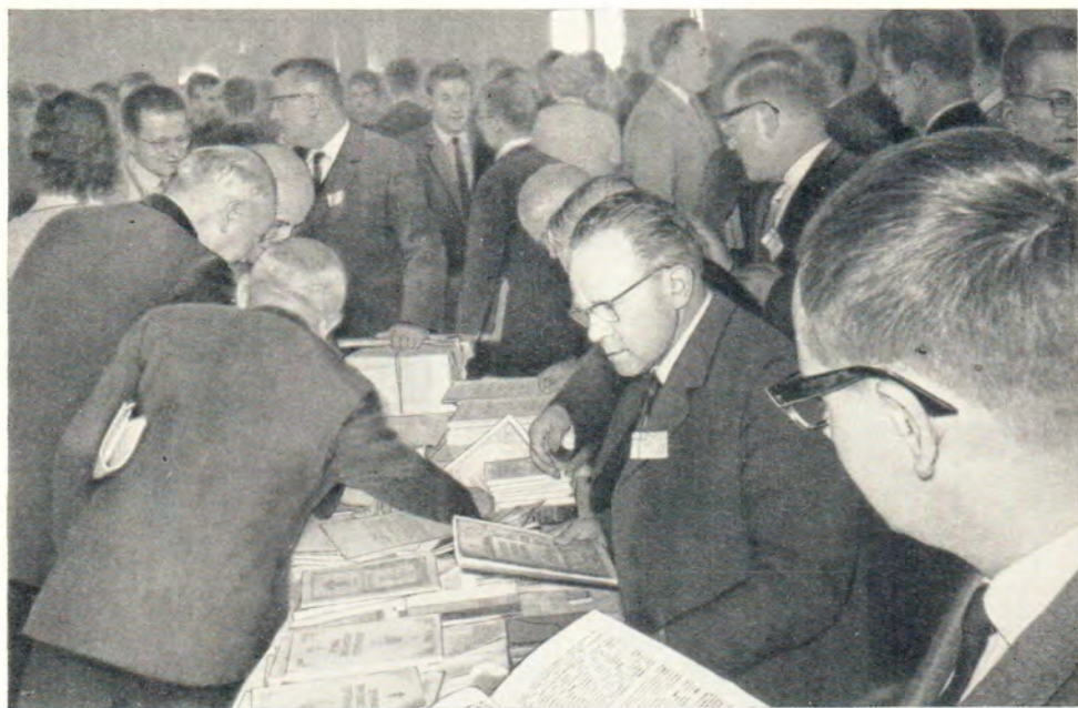
ЕПИСКОП ВОЛОКОЛАМСКИЙ ПИТИРИМ И ДЕЛЕГАТЫ КОНГРЕССА У СТЕНДА С ИЗДАНИЯМИ МОСКОВСКОЙ ПАТРИАРХИИ