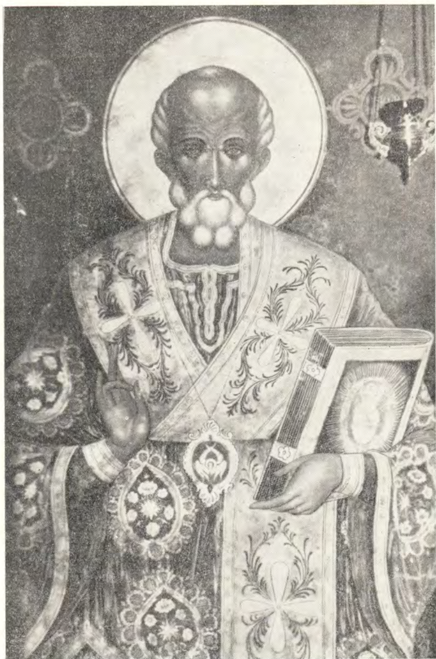
СВЯТ. НИКОЛАЙ ЧУДОТВОРЕЦ (Образ из храма свят. Николая в Софии)