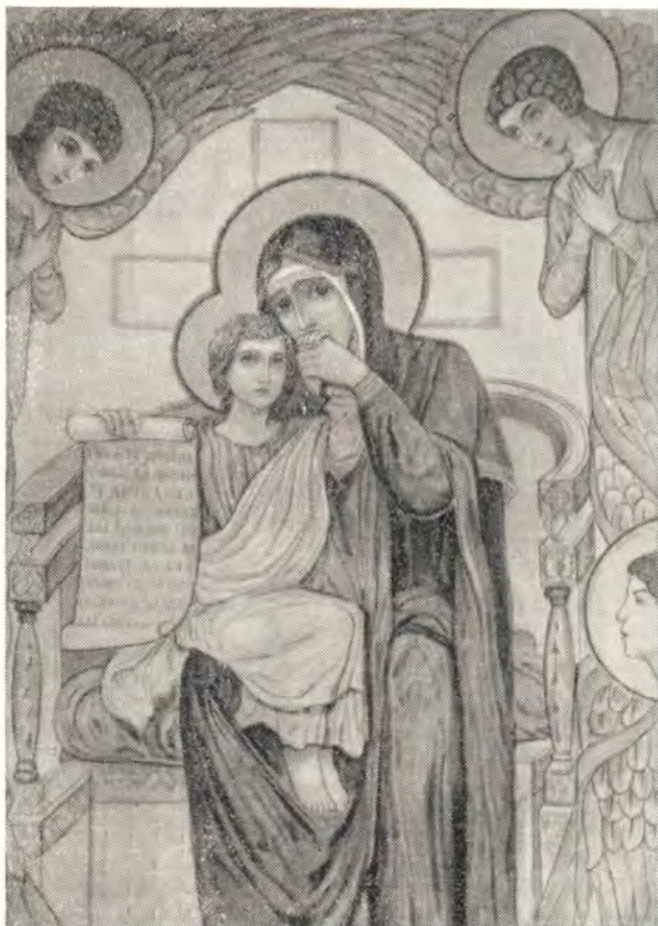
Запрестольный образ из алтаря храма Св. Николая в Софии

В алтаре, над горним местом, выделяется большой образ Богоматери, целующей руку Божественного Младенца, в окружении Сил Небесных. Над Нею, на полусферическом своде, изображен Бог Отец с исходящим от Него Святым Духом «в виде голубине». На южной стене видна большая многофигурная композиция Распятия Господа Иисуса Христа с предстоящими у Креста. Под нею тянется широкая золотая полоса, на которой киноварной славянской вязью написан текст песнопения «Да молчит всякая плоть человека...»