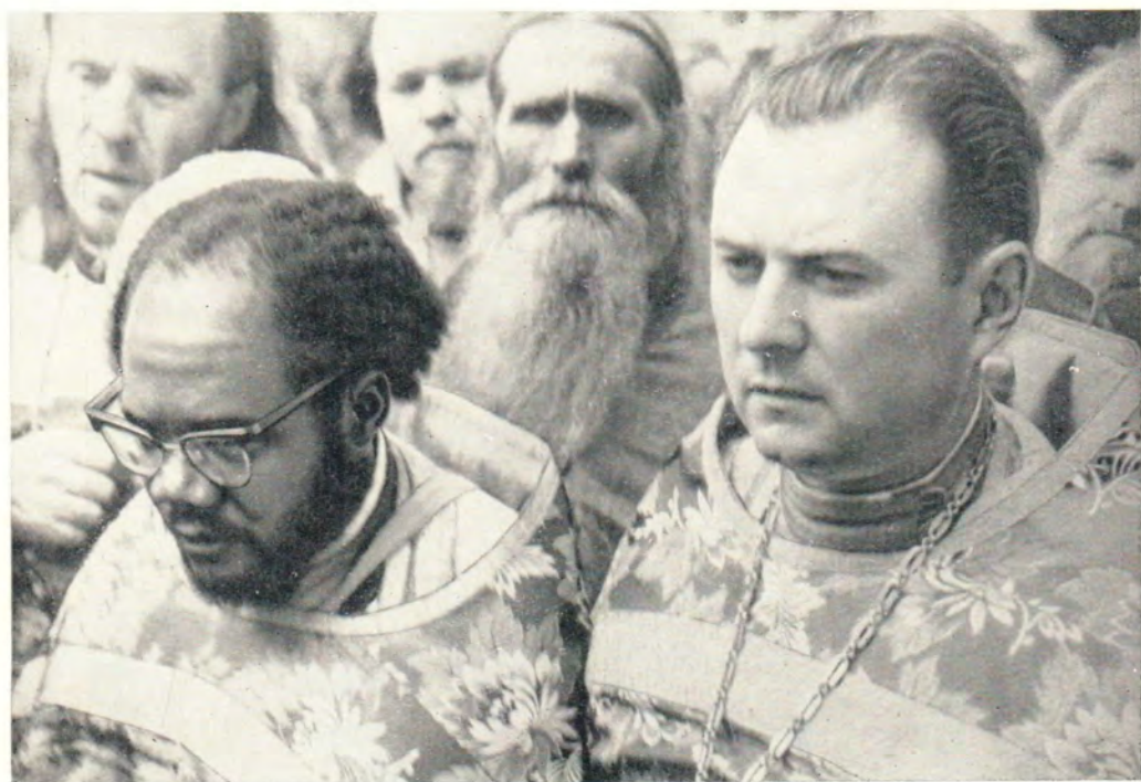
МОЛЕБЕН У НАДКЛАДЕЗНОЙ ЧАСОВНИ В ТРОИЦЕ-СЕРГИЕВОЙ ЛАВРЕ 18 июля 1964 года