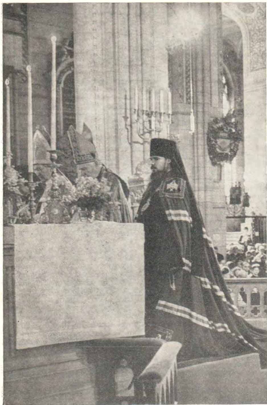
ЧТЕНИЕ ЭКУМЕНИЧЕСКИХ МОЛИТВ НА БОГОСЛУЖЕНИИ В УПСАЛЬСКОМ СОБОРЕ 13 июня 1964 г. Слева направо: Архиепископ Гуннар Хултгрэн, Архиепископ Михаил Рамзей, епископ Алексей