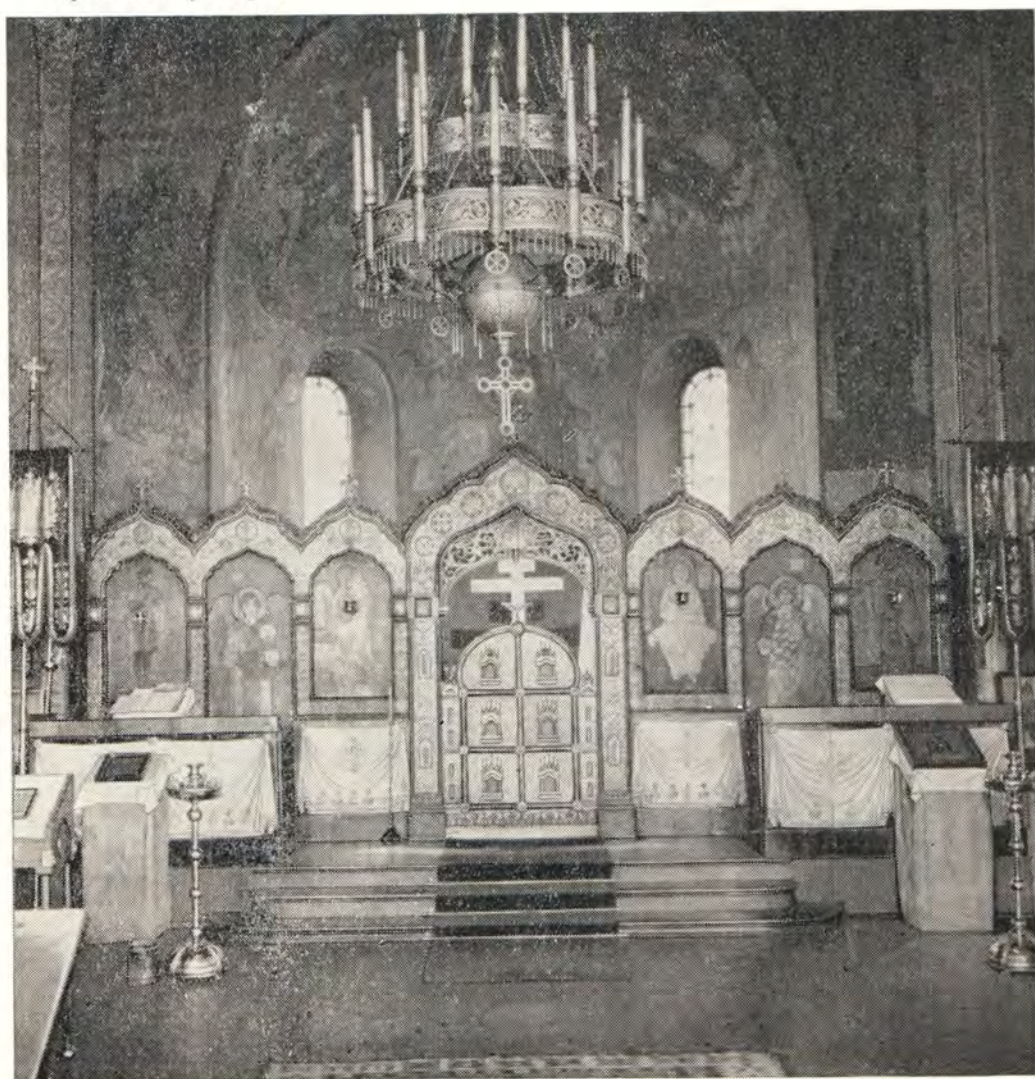
МАЙОЛИКОВЫЙ ИКОНОСТАС ХРАМА СВЯТ. НИКОЛАЯ В СОФИИ

Особое внимание привлекает богатый одноярусный майоликовый иконостас с красочным орнаментом по золотому фону и накладными украшениями в виде пятиглавых храмов на деревянных резных Царских вратах. Расположенные на нем иконы Спасителя, Богоматери и св. Александра Невского представляют собой прекрасные копии с икон кисти В. М. Васнецова во Владимирском соборе в Киеве, а храмовой образ Свят. Николая Чудотворца — список с находящейся в том же соборе иконы работы М. В. Нестерова. На северных и южных дверях написаны архангелы Гавриил и Михаил. Справа от иконостаса, на аналое, — старинная икона Свят. Николая Чудотворца в драгоценном окладе — дар Святейшего Патриарха Московского и всея Руси Алексия. Им же подарены храму Св. Плащаница и некоторые предметы церковной утвари.