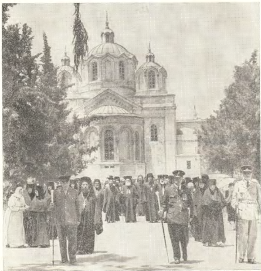
В РУССКОЙ ДУХОВНОЙ МИССИИ В ИЕРУСАЛИМЕ. ТОРЖЕСТВЕННОЕ ШЕСТВИЕ ПО ОКОНЧАНИИ ЛИТУРГИИ

В 10 часов началась праздничная литургия, которую возглавляли архиепископ Филадельфийский Епифаний, митрополит Назаретский Исидор и архиепископ Иорданский Василий. Иерархам сослужили заместитель начальника Русской Духовной Миссии в Иерусалиме игумен Гермоген, настоятель монастыря св. Симеона Богоприимца в Катамоне архимандрит Игнатий, представитель Румынской Православной Церкви в Святой Земле архимандрит Лучиан, настоятель храма Божией Матери в Гефсимании (в Старом городе) архимандрит Александр, настоятель Яффского греческого монастыря архимандрит Григорий и множество греческого и арабского духовенства.