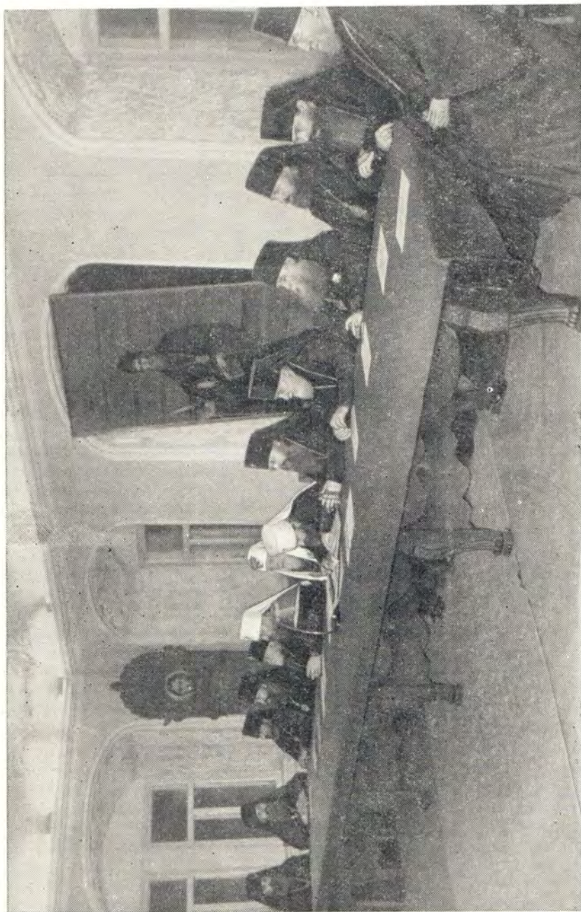
ФИЛАРЕТОВСКИЙ ВЕЧЕР В МОСКОВСКОЙ ДУХОВНОЙ АКАДЕМИИ. ЗА СТОЛОМ ПРЕЗИДИУМА