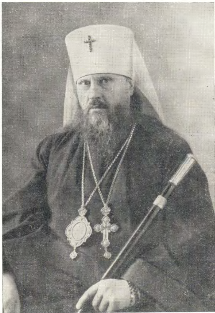
МИТРОПОЛИТ КРУТИЦКИЙ И КОЛОМЕНСКИЙ ПИМЕН