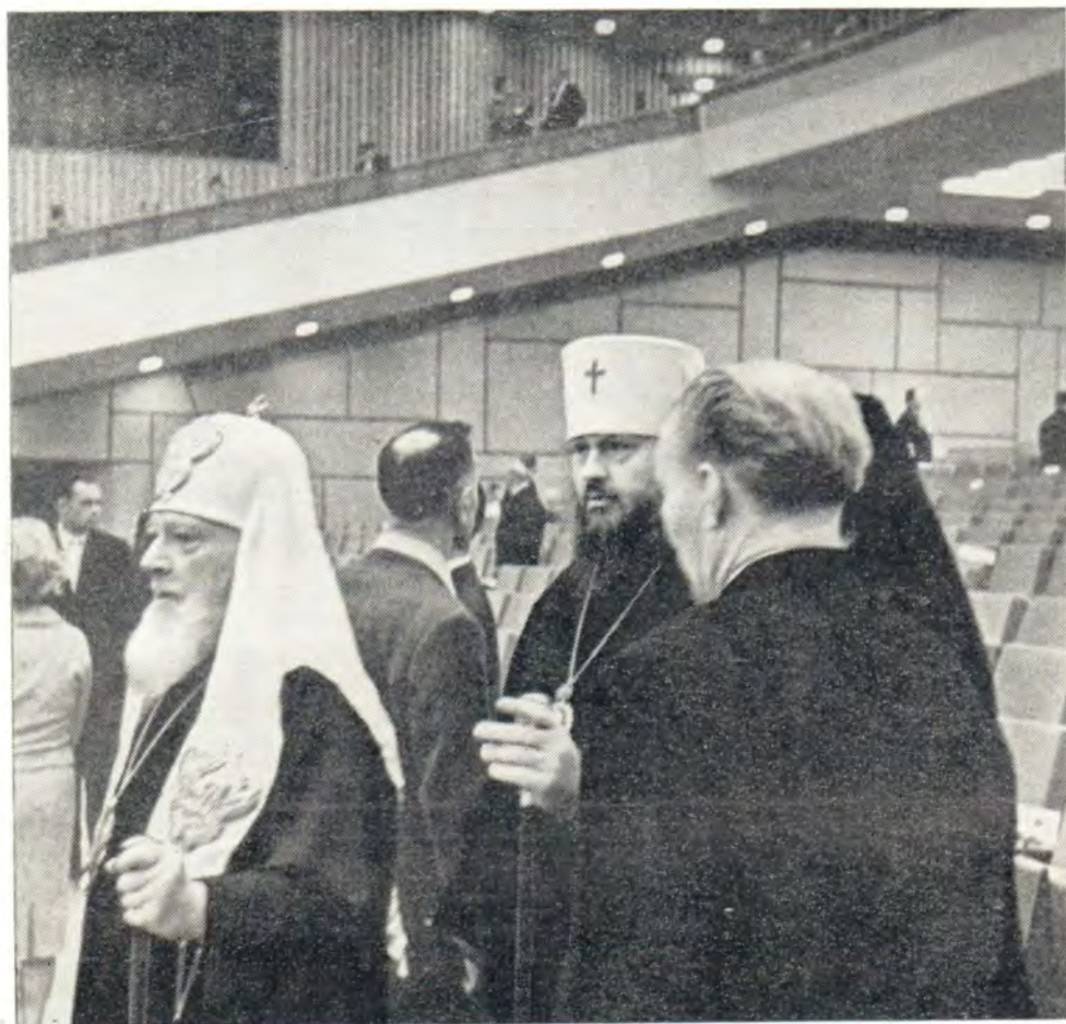
СВЯТЕЙШИЙ ПАТРИАРХ АЛЕКСИЙ И МИТРОПОЛИТ ПИМЕН В ЗАЛЕ ЗАСЕДАНИЙ КРЕМЛЕВСКОГО ДВОРЦА СЪЕЗДОВ НА ВСЕМИРНОМ КОНГРЕССЕ ЗА ВСЕОБЩЕЕ РАЗОРУЖЕНИЕ И МИР (июль 1962 года)

ской Мирной Конференции д-ру Иосифу Громадке и всем членам Советательного комитета с посланием, в котором, сердечно приветствуя всех участников сессии, со своей стороны призывал не ослаблять усилий в деле служения примирению. «Уповая на неослабную помощь Божию миротворческим трудам,— писал Святейший Патриарх,— мы должны неустанно продолжать борьбу за достижение народами прочного и справедливого мира и на путях к нему добиваться прекращения ядерными державами испытаний атомного и водородного оружия, скорейшего заключения государствами соглашения о всеобщем и полном разоружении под строгим международным контролем... Да поможет всем нам Господь Миротворец,— писал в заключение Святейший Патриарх.— Да подаст Он крепость людям Своим и да благословит их миром!»