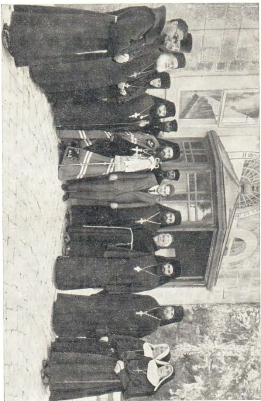
ПОЧЕТНЫЕ ГОСТИ ГОРНЕНСКОГО ОБИТЕЛИ В ДЕНЬ ПРЕСТОЛЬНОГО ПРАЗДНИКА (4 ноября) ВО ГЛАВЕ С МИТРОПОЛИТОМ НАЗАРЕТСКИМ ИСИДОРОВ