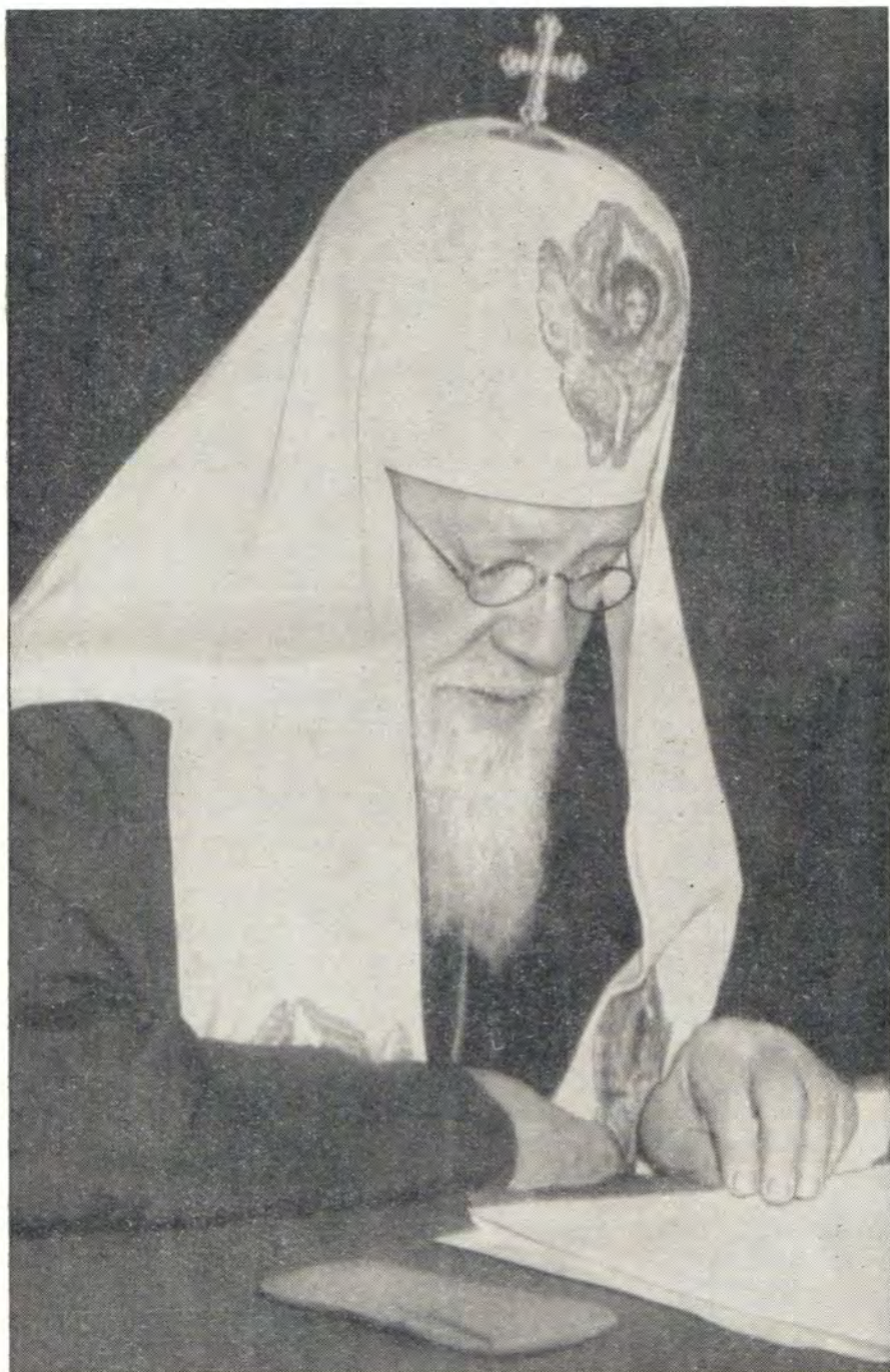
СВЯТЕЙШИЙ ПАТРИАРХ АЛЕКСИЙ ЧИТАЕТ СВОЮ РЕЧЬ В МОСКОВСКОЙ ДУХОВНОЙ АКАДЕМИИ 13 декабря 1963 года