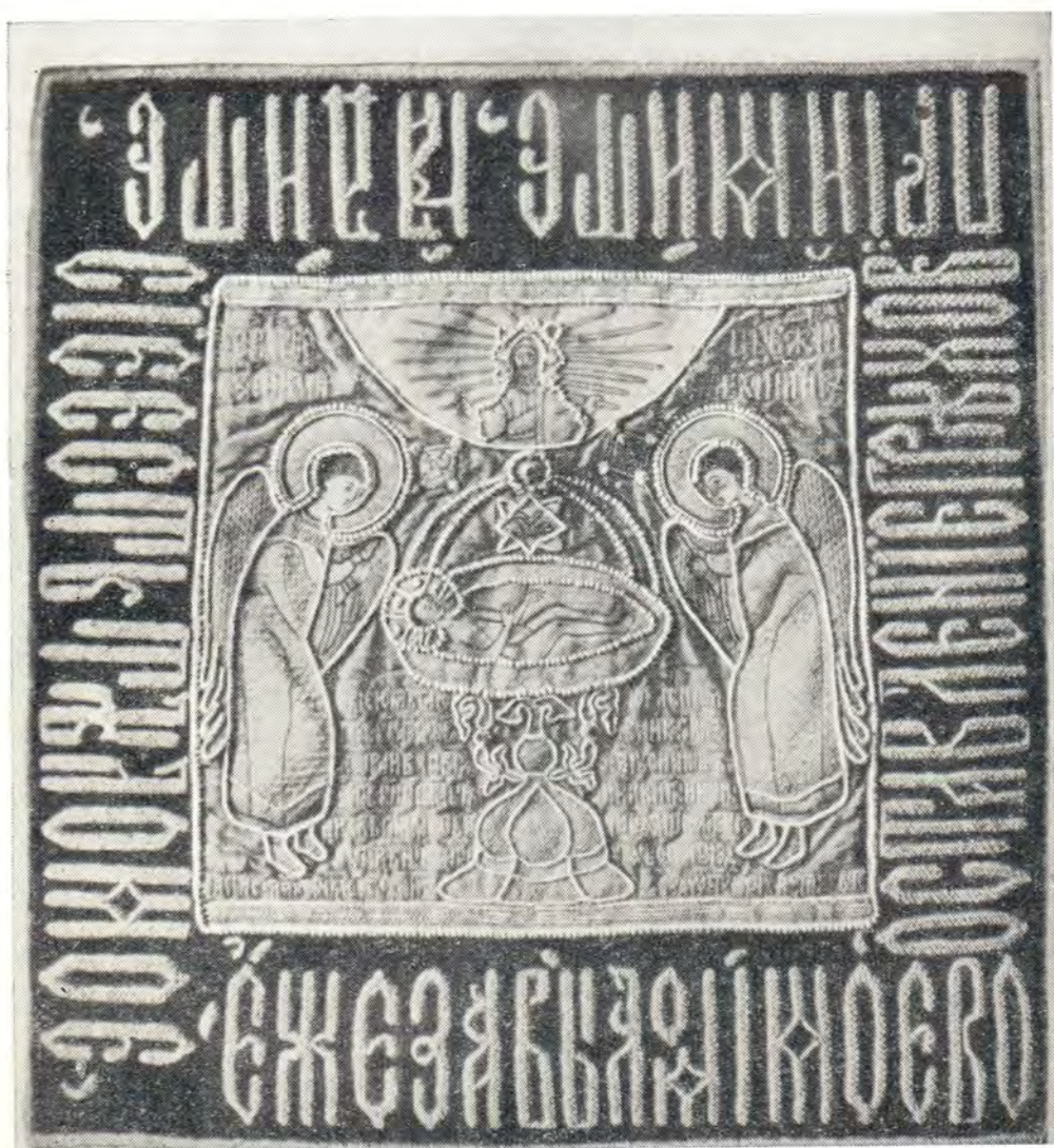
Рис. 1. ПОКРОВ НА СВ. ДАРЫ ЦАРИЦЫ ИРИНЫ ГОДУНОВОЙ, 1594 г.

Гравирование на меди появилось в России в первой половине XVII века. При этом надо заметить, что если гравюра на дереве развивалась с чисто русской самобытностью и поэтому произведения русских граверов всегда можно отличить от работ граверов Запада, то гравюра на меди имела в то время подражательный характер и первые наши московские граверы — Трухменский, Бунин Л., Тарасевич, Галаховский — вначале делали только копии с западных гравюр.