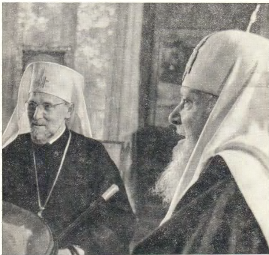
СВЯТЕЙШИЙ ПАТРИАРХ АЛЕКСИЙ И ПРЕДСТОЯТЕЛЬ ФИНЛЯНДСКОЙ АВТОНОМНОЙ ПРАВОСЛАВНОЙ ЦЕРКВИ АРХИЕПИСКОП ПАВЕЛ В МОСКОВСКОЙ ПАТРИАРХИИ В ДНИ ЮБИЛЕЙНЫХ ТОРЖЕСТВ в июле 1963 года

Торжества в честь Первосвященителя Русской Православной Церкви не могли не послужить вместе с тем и делу укрепления мира во всем мире. Русская Православная Церковь, верная заветам Христа Спасителя, уже много лет участвует в общехристианском движении за мир, совершая свое служение примирению человечества. Представители церквей и религиозных объединений — участники торжеств единодушно заявили о христианском долге миротворчества и усердно молились о мире во всем мире.