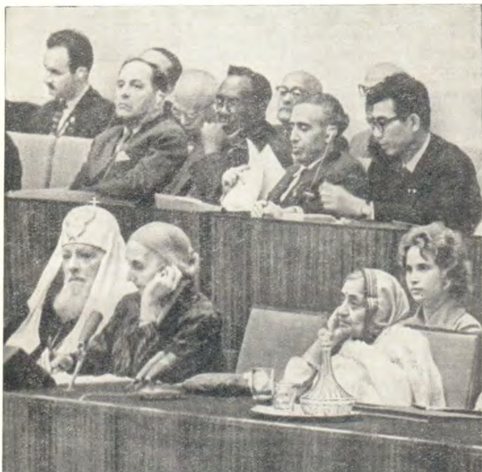
СВЯТЕЙШИЙ ПАТРИАРХ АЛЕКСИЙ В ПРЕЗИДИУМЕ ВСЕМИРНОГО КОНГРЕССА ЗА ВСЕОБЩЕЕ РАЗОРУЖЕНИЕ И МИР (Москва, июль 1962 года)

рархи Русской Православной Церкви, члены корпорации профессоров и преподавателей Московской духовной академии и ответственные сотрудники Московской Патриархии. Святейший Патриарх Алексий прислал свое приветствие всем участникам работы комиссии, призывая Божие благословение на их труды. Представители Русской Православной Церкви также активно участвовали в работе всех остальных комиссий ХМК.