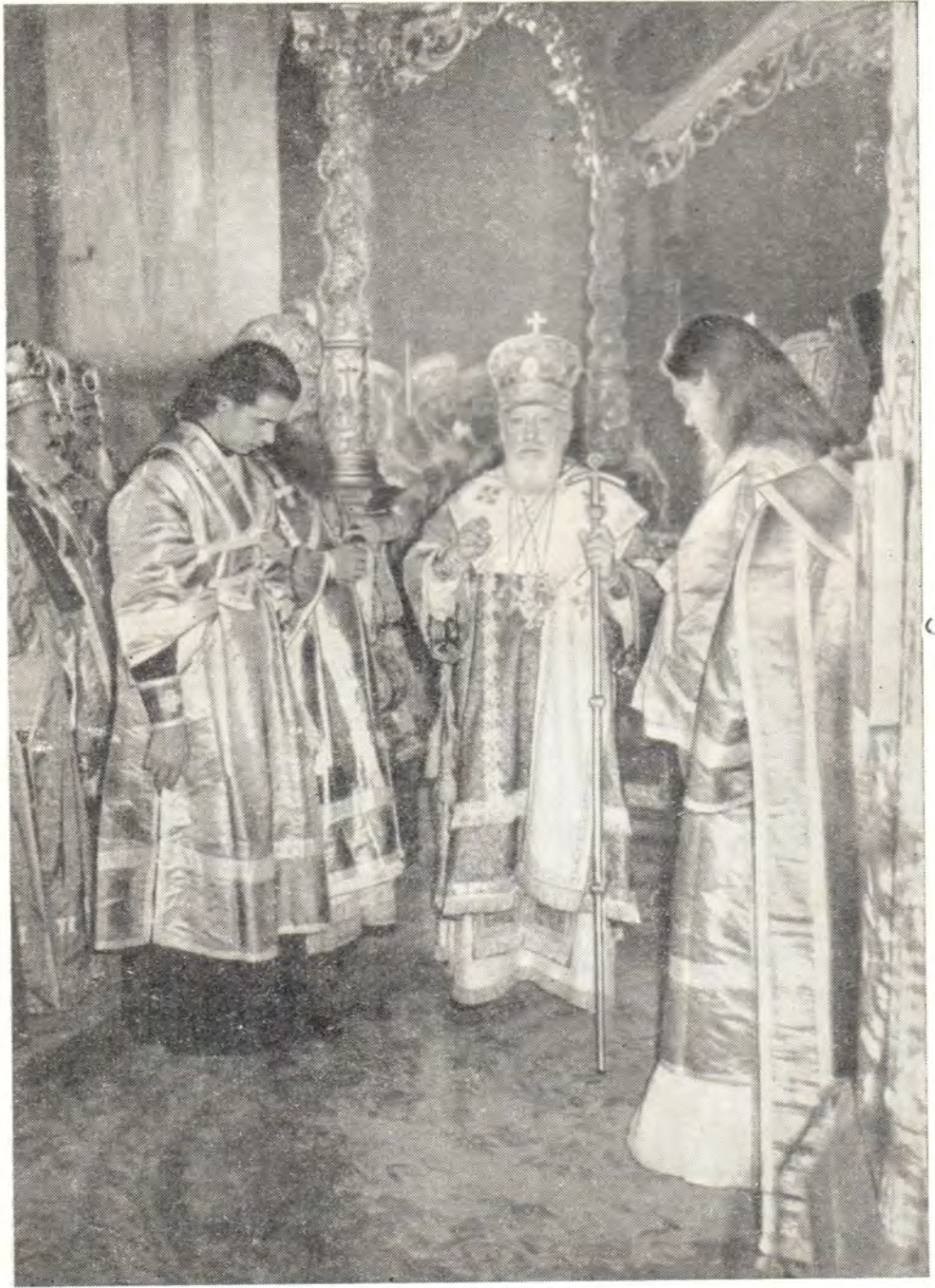
СВЯТЕЙШИЙ ПАТРИАРХ АЛЕКСИЙ БЛАГОСЛОВЛЯЕТ ВЕРУЮЩИХ ВО ВРЕМЯ БОЖЕСТВЕННОЙ ЛИТУРГИИ В УСПЕНСКОМ СОБОРЕ ТРОИЦЕ-СЕРГИЕВОЙ ЛАВРЫ 18 июля 1963 года