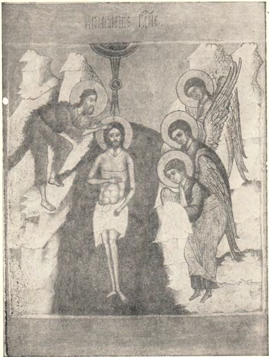
ИКОНА «БОГОЯВЛЕНИЕ ГОСПОДНЕ» (XVIII век) (из собрания Церковно-археологического кабинета при МДА)