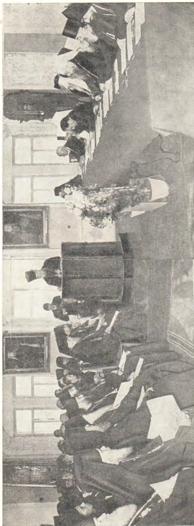
В КОНФЕРЕНЦІ-ЗАЛЕ МОСКОВСКОЙ ДУХОВНОЙ АКАДЕМИИ ВО ВРЕМЯ ТОРЖЕСТВЕННОГО ЗАСЕДАНИЯ, ПОСВЯЩЕННОГО 85-ЛЕТИЮ СВЯТЕЙШЕГО ПАТРИАРХА АЛЕКСИЯ