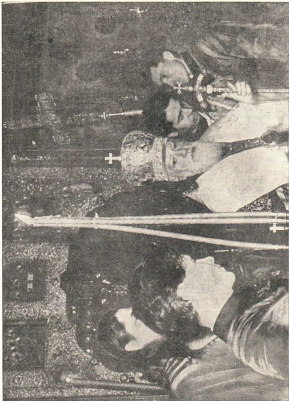
СВЯТЕЙШИЙ ПАТРИАРХ АЛЕКСИЙ ЗА БОГОСЛУЖЕНИЕМ В ТРОИЦКОМ СОБОРЕ ТРОИЦЕ-СЕРГИЕВОЙ ЛАВРЫ