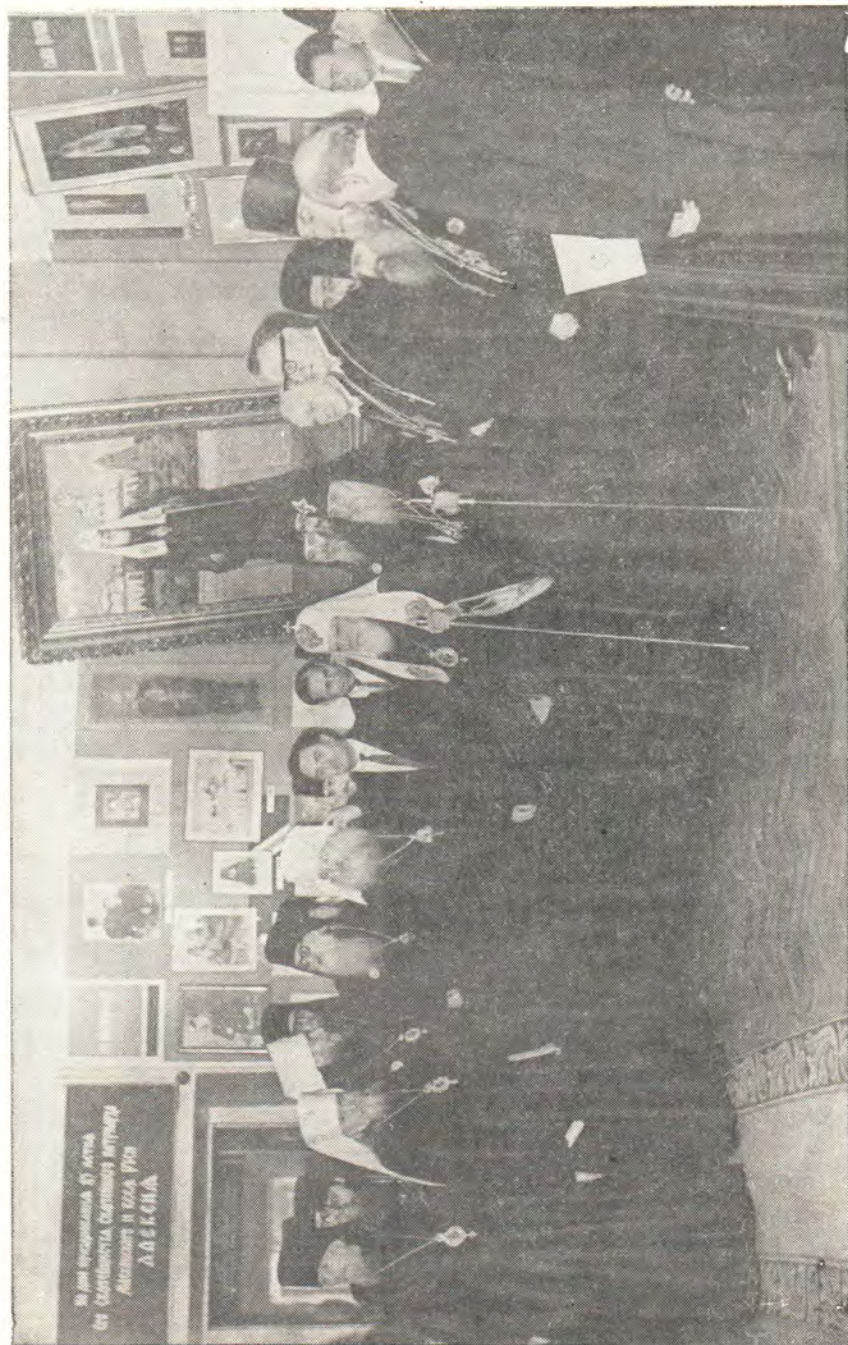
ЛИЦА, ПРИНИМАВШИЕ УЧАСТИЕ В ЧЕСТВОВАНИИ СВЯТЕЙШЕГО ПАТРИАРХА АЛЕКСИЯ ПО СЛУЧАЮ ЕГО 85-ЛЕТИЯ, ОЗНАКОМИЛИСЬ С ВЫСТАВКОЙ ПОСВЯЩЕННОЙ ЮБИЛЕЮ