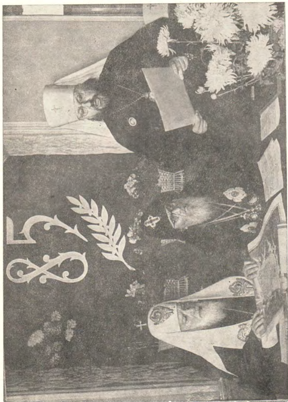
МИТРОПОЛИТ ЛЕНИНГРАДСКИЙ И ЛАДОЖСКИЙ ПИМЕН ЗАЧИТЫВАЕТ ТЕКСТ ПРИВЕТСТВЕННОГО АДРЕСА ОТ СВЯЩЕННОГО СИНОДА