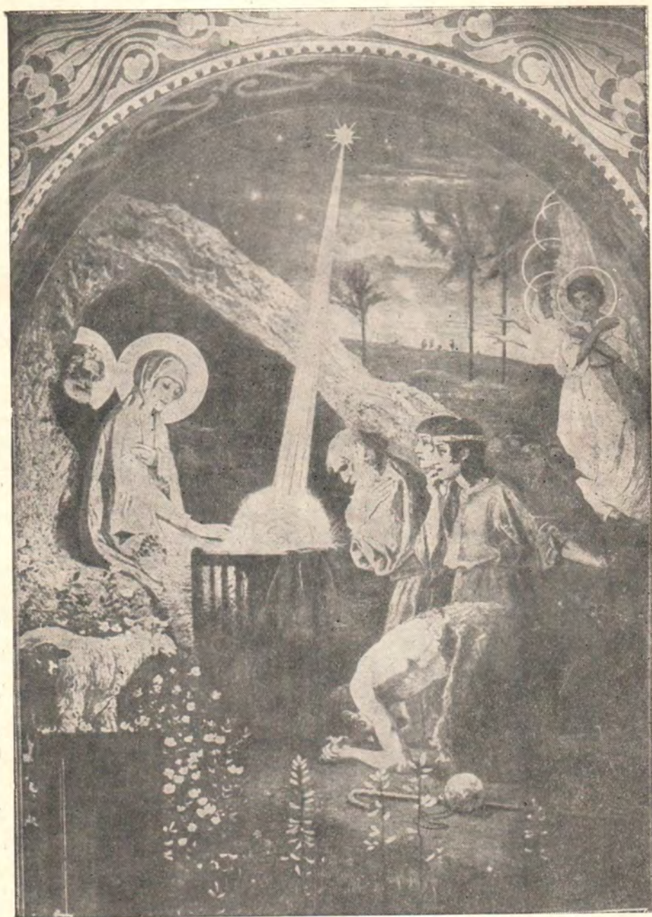
ИКОНА «РОЖДЕСТВО ХРИСТОВО» (Из росписи собора св. кн. Владимира в Киеве)