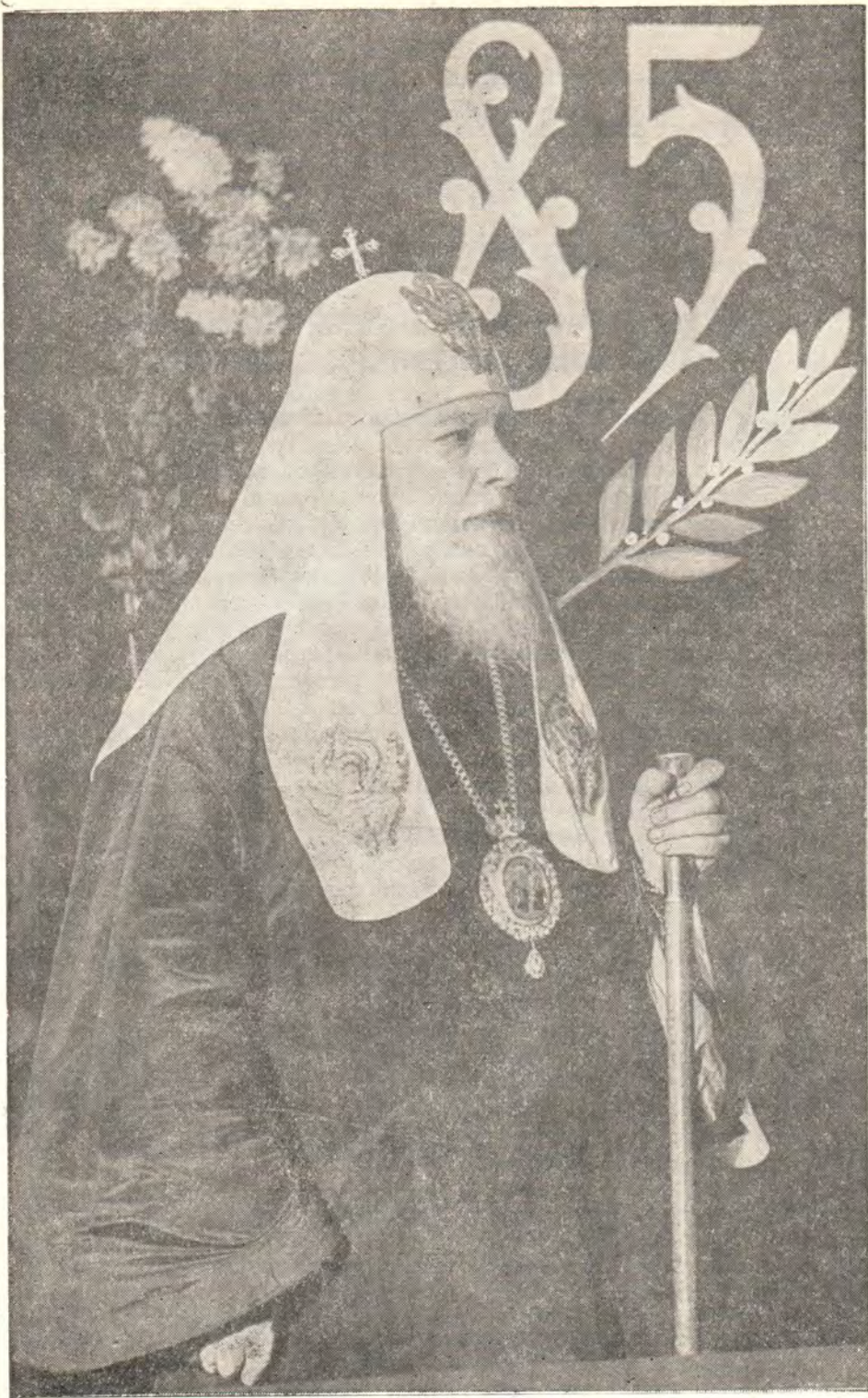
ЕГО СВЯТЕЙШЕСТВО, СВЯТЕЙШИИ ПАТРИАРХ АЛЕКСИИ в Московской духовной академии 30 ноября 1962 года