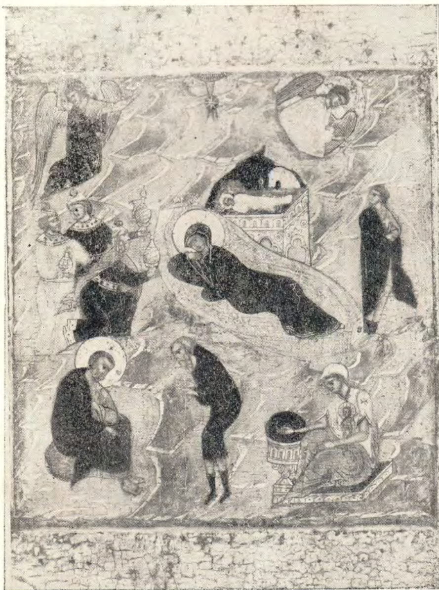
ИКОНА «РОЖДЕСТВО ХРИСТОВО» (XVII век) (из собрания Церковно-археологического кабинета при МДА)